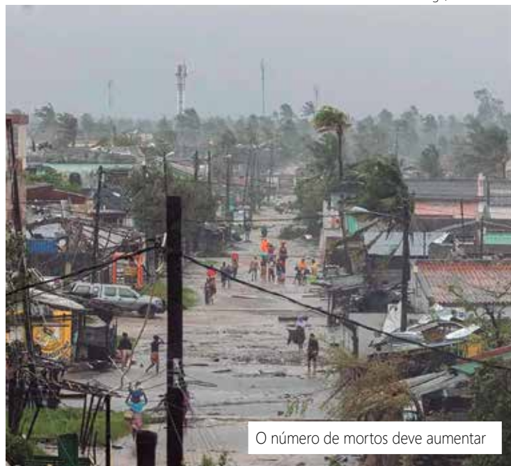
O número de mortos deve aumentar

Cerca de 100 pessoas foram levadas a óbito em Malauí e Moçambique, durante a segunda-feira (13). A tragédia ocorreu no Sul da África, que