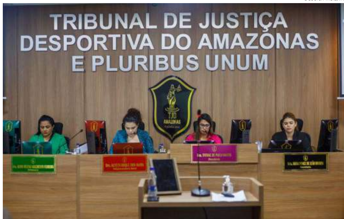
Julgamento durou seis horas e trinta minutos