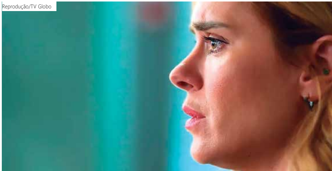
Luminar (carolina dieckmann), em Vai na Fé

Confira abaixo o resumo das novelas da TV Globo para quarta-feira (15).