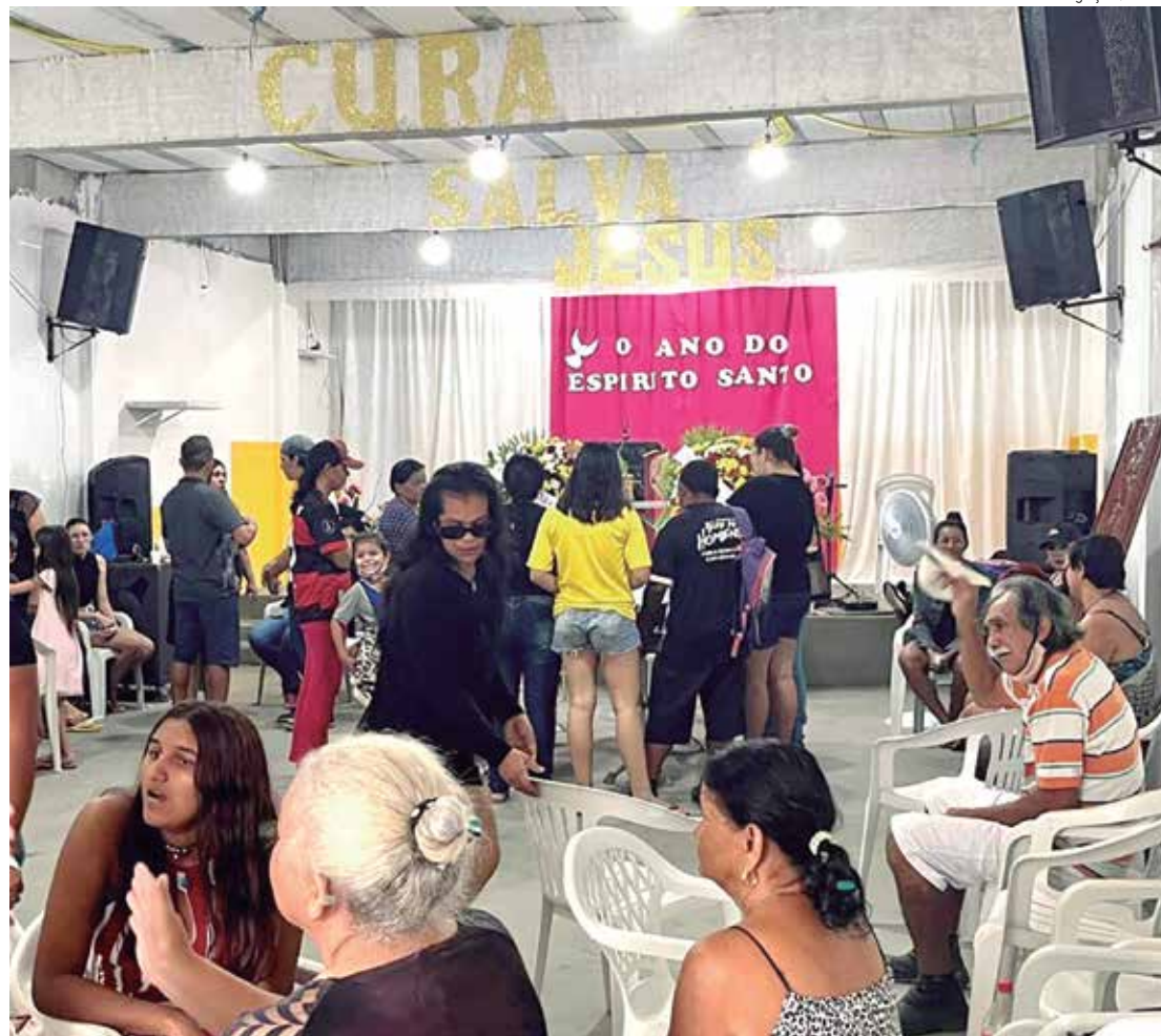
Velório de mãe e filha aconteceu em igreja no Jorge Teixeira