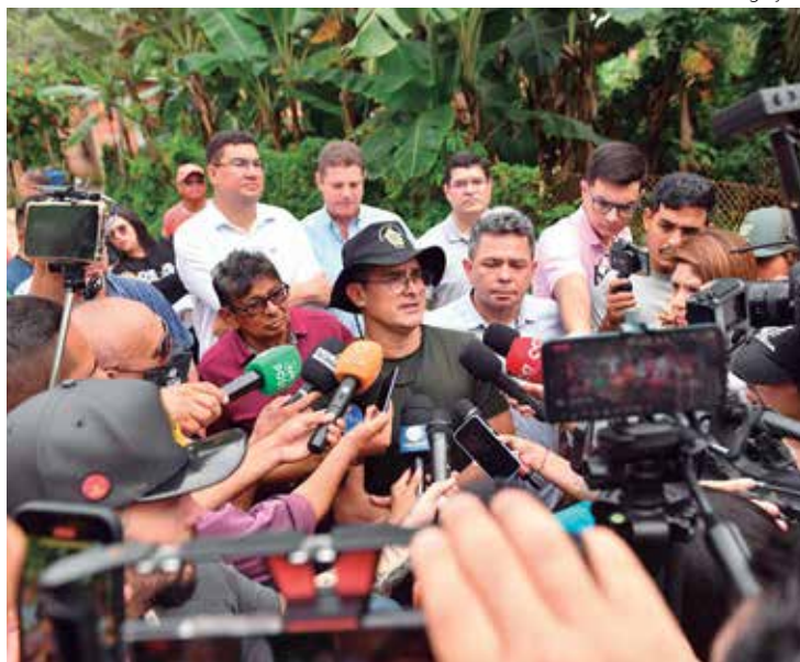
David Almeida anunciou ações no Jorge Teixeira logo após o deslizamento

O decreto que coloca Manaus em Situação de Emergência em decorrência das fortes chuvas do último domingo (12), que resultaram