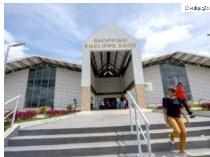
Sine Manaus dispõe de unidade no shopping Philippe Daou

Disponível até 15/3/2023 ou encerramento da vaga.