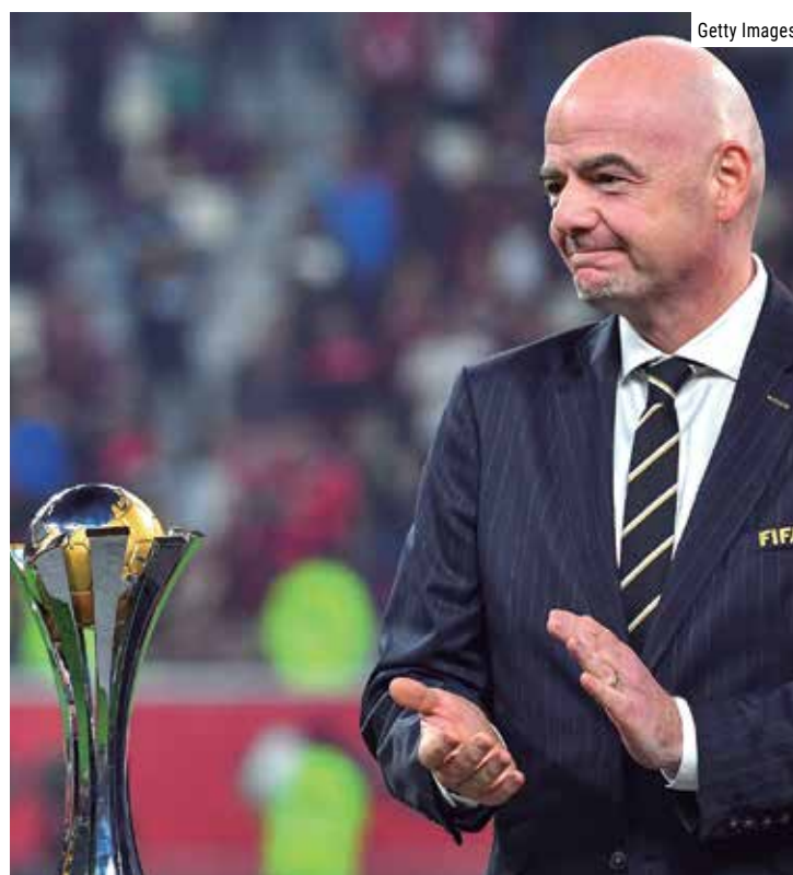
Gianni Infantino com a taça do Mundial de Clubes

Para confederações com direito até quatro vagas, elas serão distribuídas para os campeões das quatro edições anteriores da principal competição de clubes da entidade. Para as federações com direito a apenas uma vaga o acesso ao torneio será concedido à equipe mais bem classificada entre os campeões da principal competição de clubes no quadriênio.