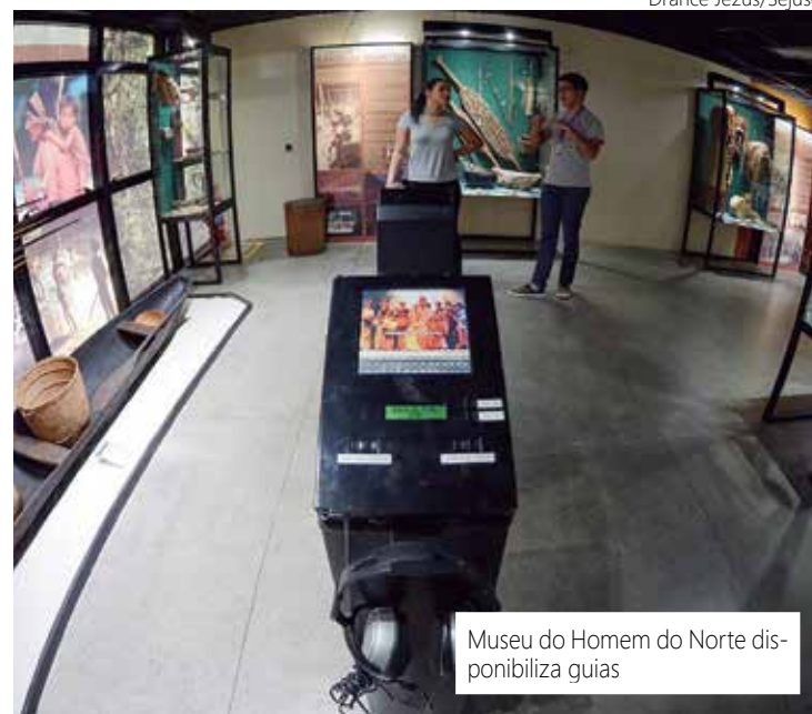
Museu do Homem do Norte disponibiliza guias

O Museu pretende dar uma visão da amplitude cultural regional, mostrando as técnicas de trabalho do dia a dia das populações amazônicas, os meios de transporte, as habitações, a alimentação, as festas, o artesanato, a religiosidade, os mitos e ritos, além de importante acervo arqueológico.