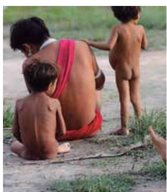
A operação deve durar 30 dias

setembro, com cooperação da Funai, foi possível avançar com o uso de aeronaves de pequeno porte em locais que dependiam de "transporte aéreo em asas fixas". "Hoje estamos com 50% das aldeias coletadas em toda a Terra Indígena Yanomami, das 549 aldeias, a gente já completou o recenseamento em 150 aldeias do AM e 211 aldeias de Roraima, com 16 aldeias em andamento do recenseamento em Roraima".