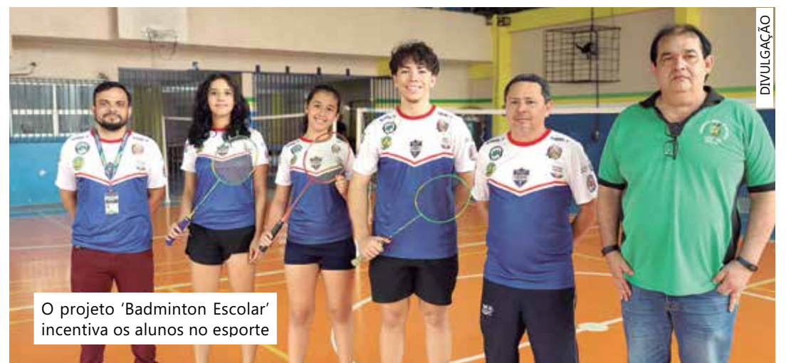
O projeto 'Badminton Escolar' incentiva os alunos no esporte