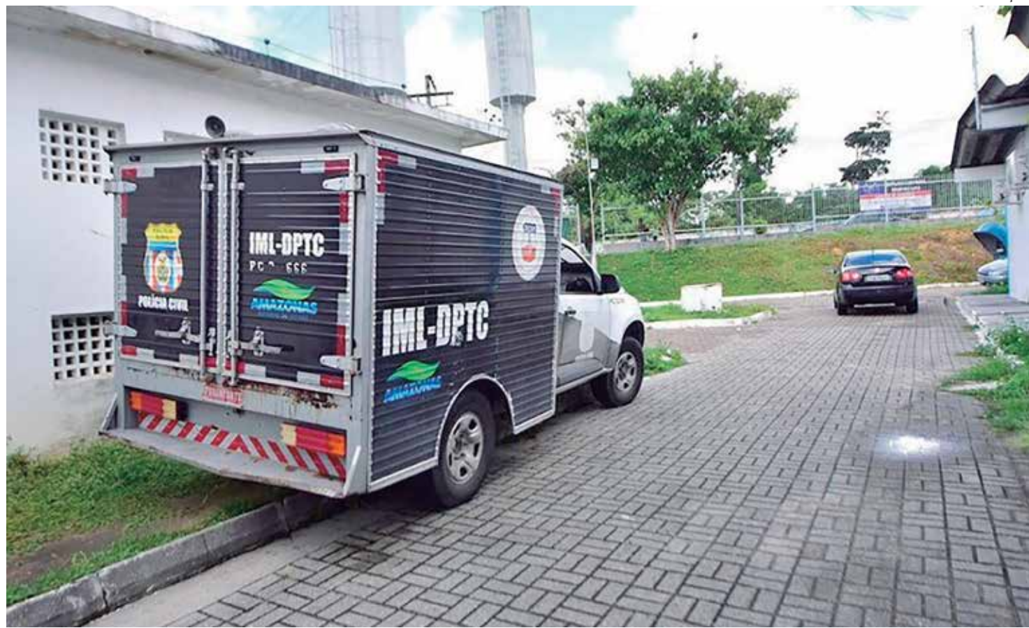
Moradores relataram que a área está se tornando cada vez mais perigosa

que vai investigar autorias e motivações da morte.