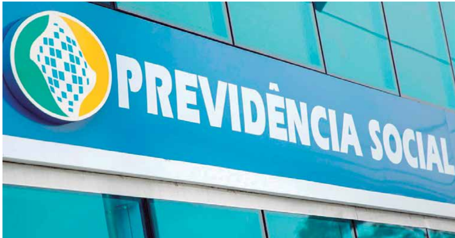
É importante que o contribuinte reúna toda a documentação, antes da entrada do requerimento

A regra de transição estabeleceu o acréscimo de seis meses a cada ano para as mulheres, até chegar à idade mínima final este ano. Na promulgação da reforma, a idade mínima estava em 60 anos, passando para 60 anos e meio em janeiro de 2020, 61 anos em 2021, 61 anos e meio em 2022 e, agora, chegou ao valor estabelecido pela reforma. Para homens, a idade mínima está fixada em 65 anos desde 2019. Para ambos os sexos, o tempo mínimo de contribuição exigido é de 15 anos.