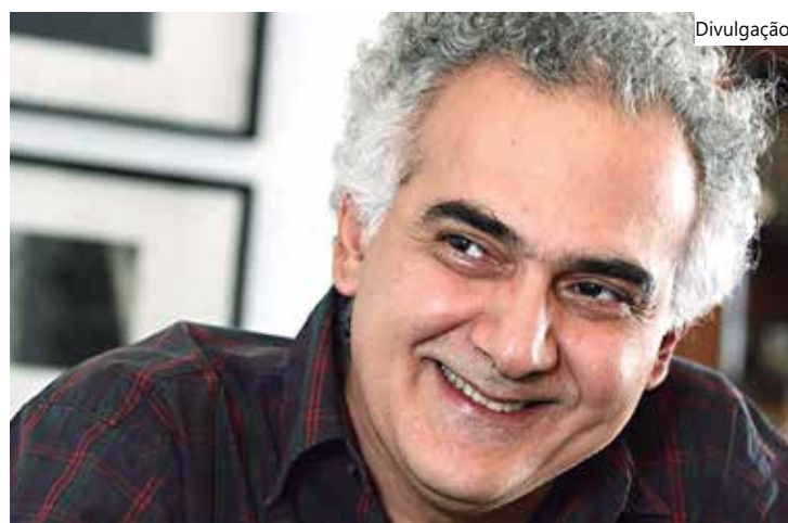
Milton Hatoum é escritor amazonense

Assim como Sérgio Machado, Marcelo é um cineasta premiado nacional e internacionalmente.