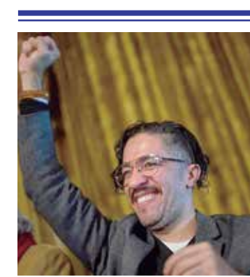
A republicação do vídeo gerou uma série de ataques a Wyllys

O magistrado ainda afastou a imunidade parlamentar dos filhos do ex-presidente por entender que no momento do compartilhamento do conteúdo falso, eles não estavam no exercício de suas funções. A divulgação do conteúdo falso também gerou condenações para outros influenciadores bolsonaristas, como o autoproclamado filósofo Olavo de Carvalho.