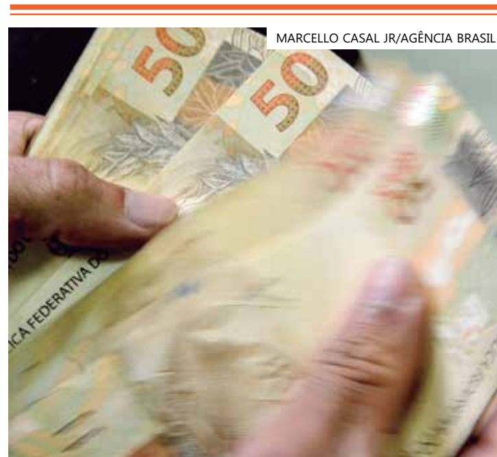
MARCELLO CASAL JR/AGÊNCIA BRASIL

Segundo o ministro, o Desenrola será instituído por meio de