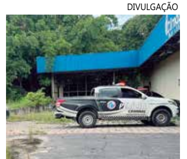
Até o momento o caso é um mistério,

O corpo do homem foi removido e encaminhado para o Instituto Médico Legal (IML). De acordo com a entidade, nesta segunda-feira (6), a causa da morte tenha sido uma overdose. Mas, é necessário aguardar o resultado da análise para se ter certeza.