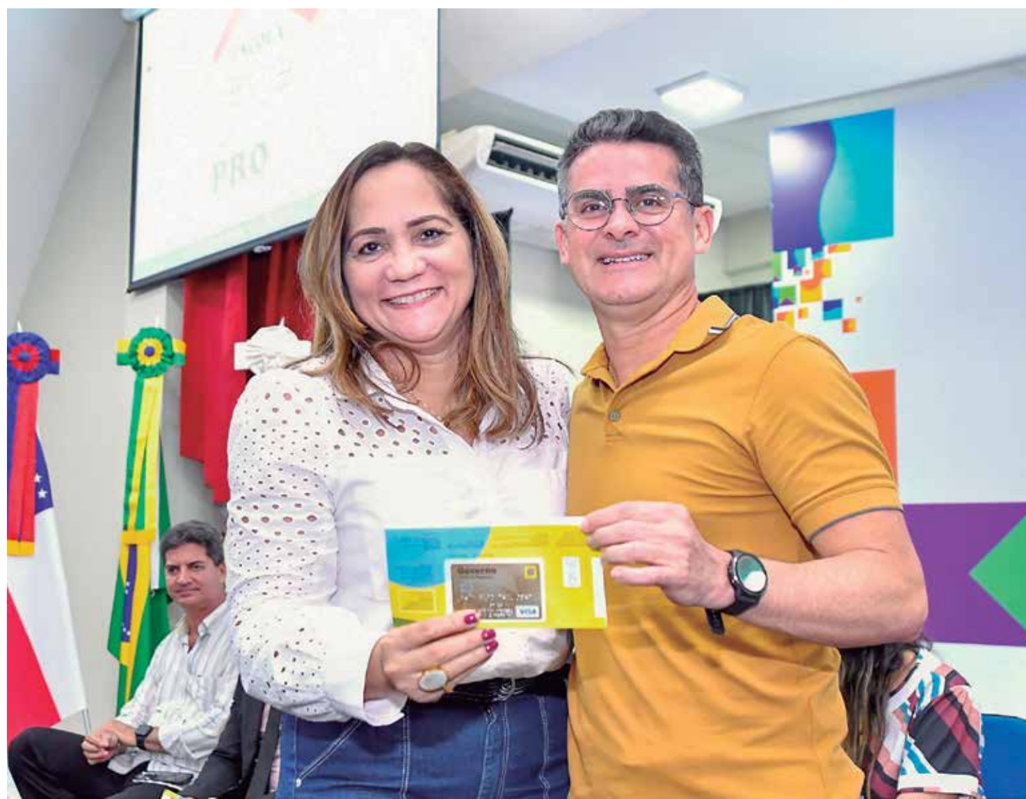
A primeira parcela da ação já será disponibilizada nesta terça-feira (7), no valor de R$ 7,5 milhões

O aumento no investimento financeiro para as unidades de ensino será de 50%, saindo de R$ 10,2 milhões, valor de 2022, para R$ 15 milhões.