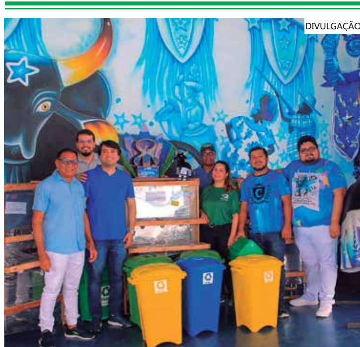
Agremiação azul teve melhor desempenho em processos de reciclagem

A premiação é resultado de uma disputa entre as galeras dos dois bumbás. Durante os três dias de Festival, as torcidas foram desafiadas a destinar corretamente a maior quantidade possível de recicláveis, em ecopontos instalados nas saídas do bumbódromo.