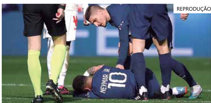
O craque se lesionou na partida contra o Lille em 19 de fevereiro

"Espera-se um período de 3 a 4 meses antes de seu retorno aos treinos coletivos", completou o clube. Com isso, ele só estará a disposição do PSG na temporada 2023/2024.