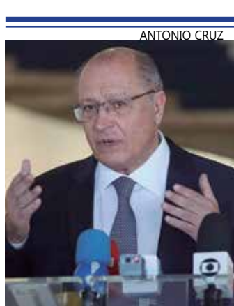
Um dos pontos levantados por Alckmin é a variação de impostos

"Nós estamos tendo uma desindustrialização precoce. Nós não somos um país rico, somos um país em desenvolvimento. Nós precisamos de uma agenda de competitividade", finalizou Geraldo.