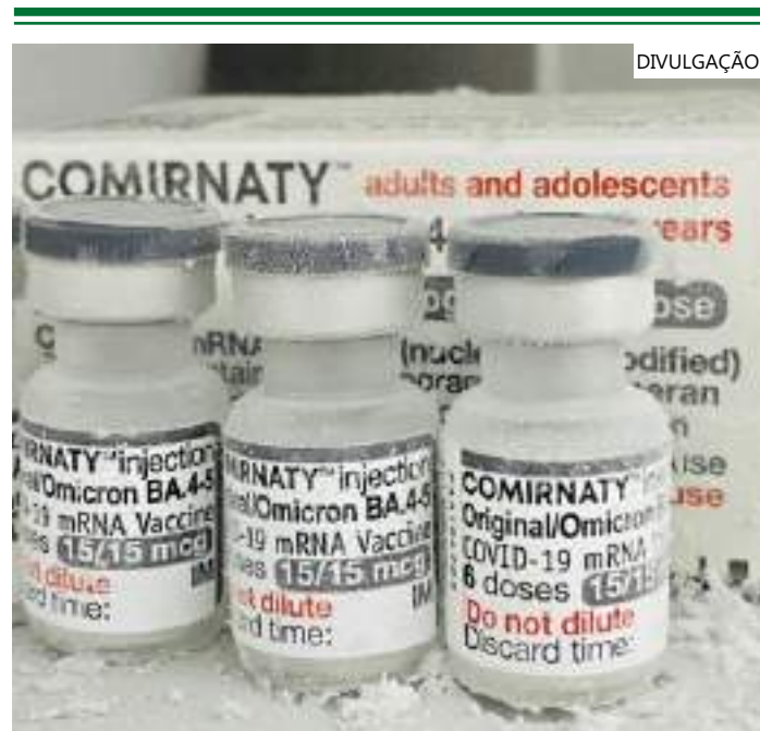
Os grupos prioritários são pessoas a partir de 60 anos

O rótulo do imunizante bivalente contra a Covid-19 da Pfizer se diferencia das demais do mesmo laboratório pela tampa de cor cinza. As doses do imunizante foram armazenadas no Centro de Imunobiológicos do Amazonas, integrante da FVS-