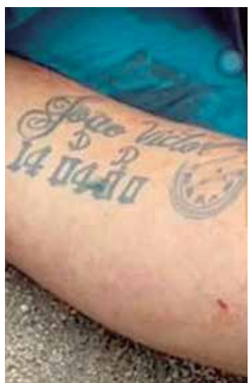
As tatuagens podem ajudar na identificação da vítima

A perícia criminal foi até à cena de crime, onde realizou um trabalho em conjunto com a Delegacia Especializada em Homicídios e Sequestros (DEHS),