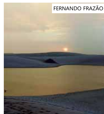
Comissão da Unesco virá avaliar

O Parque Nacional dos Lençóis fica a cerca de 250 quilômetros (km) da capital São Luís e foi criado há mais de 40 anos. Ele é o maior campo de dunas da América do Sul, com uma área de 155 mil hectares. Ou seja, maior que a cidade de São Paulo, sendo famoso pelas lagoas cristalinas que se formam entre as dunas brancas, no período de chuvas. Atualmente, a gestão é feita pelo Instituto Chico Mendes de Conservação da Biodiversidade (ICMBio).