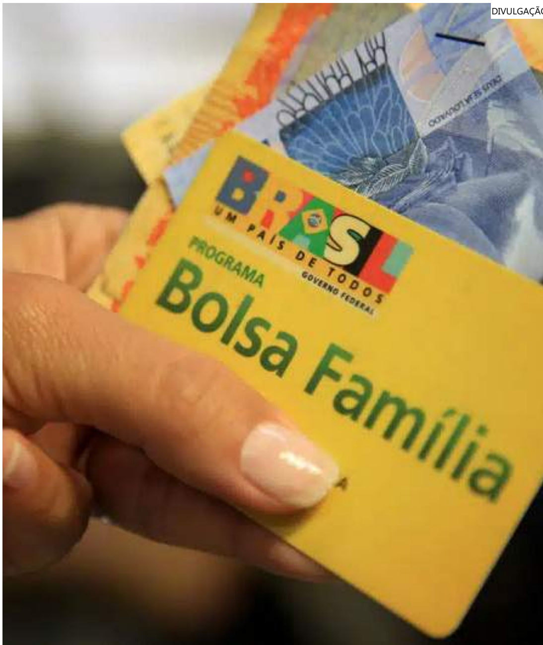
Será feita uma convocação das plataformas

"O nosso sonho é poder morar em um local melhor, que a gente consiga dormir