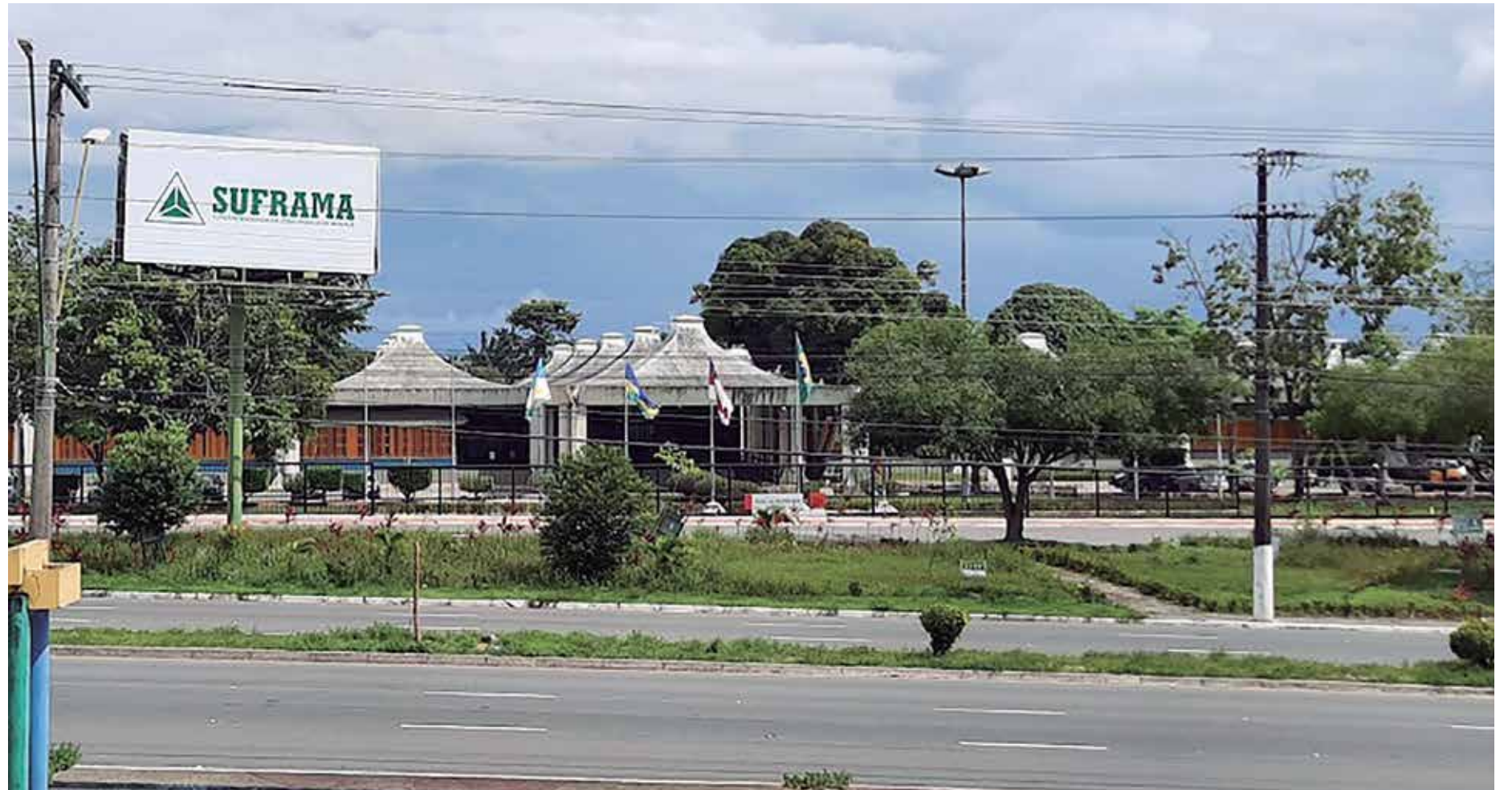
Apesar da indicação, o nome de Bosco ainda não recebeu o aval de Lula e o órgão segue sem um titular definido

Apesar da indicação, o nome de Bosco ainda não recebeu o aval de Lula e o órgão segue sem um titular definido, embora o último superintendente tenha deixado o cargo no dia 28 de dezembro do ano passado. O especialista político Carlos Santiago disse à reportagem que a escolha de um nome deveria seguir a critérios técnicos. Para ele deveria ser alguém que conheça a indústria, o comércio e que entenda de relações internacionais