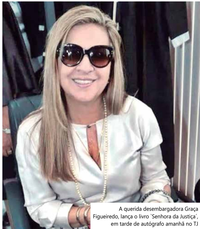
A querida desembargadora Graça Figueiredo, lança o livro 'Senhora da Justiça', em tarde de autógrafa amanhã no TJ