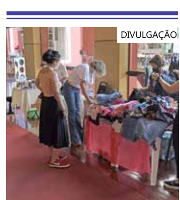
A realização da Feira objetiva venda de produtos

Em continuidade à celebração da luta feminina, de 9 a 11 de março, das 9h às 16h, acontece mais uma edição da Expomulher, no corredor térreo do Palacete Provincial.