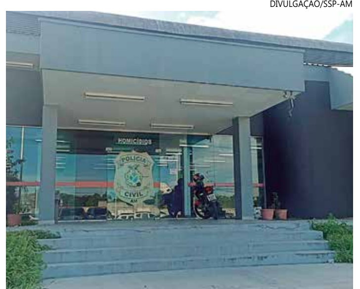
As filhas da vítima acusam o padrastrado pela morte da mãe

O corpo foi recolhido e encaminhado ao Instituto Médico Legal (IML).