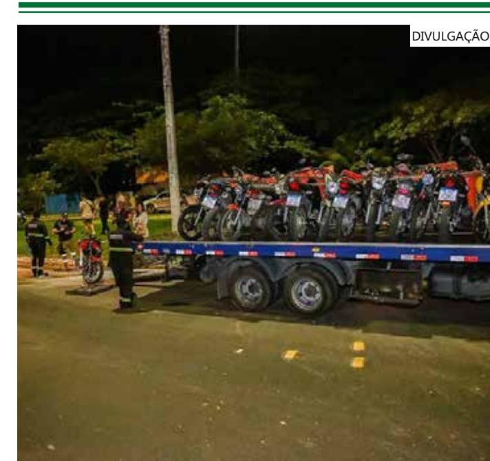
Além da parte punitiva, o órgão também ensina a educação no trânsito

Denúncias podem ser feitas pelo 181, o disk-denúncia da Secretaria de Segurança Pública (SSP-AM), e também pelo e-mail da Ouvidoria da instituição (ouvidoria@detran.am.gov.br) ou pelo número (92) 3643-0022.