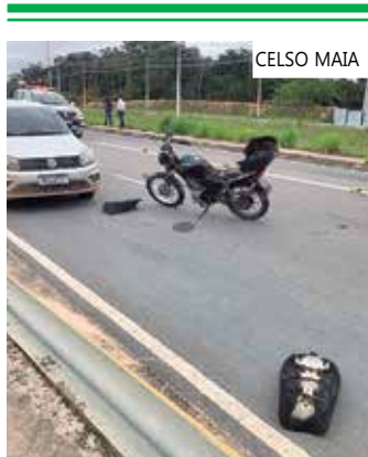
A família da vítima exigiu que as autoridades tomem providências