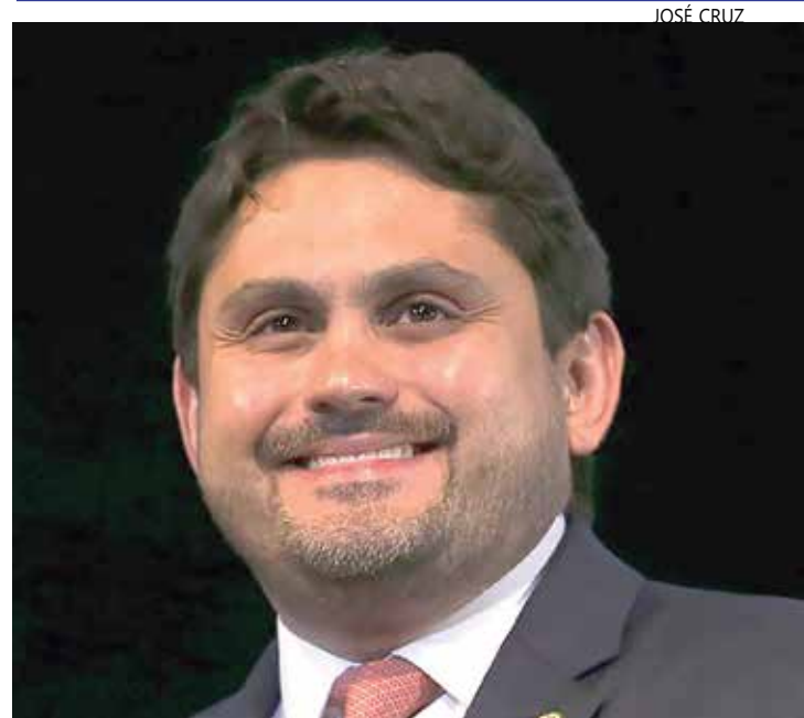
O ministro, está sendo acusado de usar recursos de emendas parlamentares

Até o momento, dos 1,4 mil presos após os ataques, cerca de 800 continuam detidos. Acusados de financiar os atos, 54 pessoas físicas, três empresas, uma associação e um sindicato já tiveram bens bloqueados a pedido da Advocacia-Geral da União (AGU).