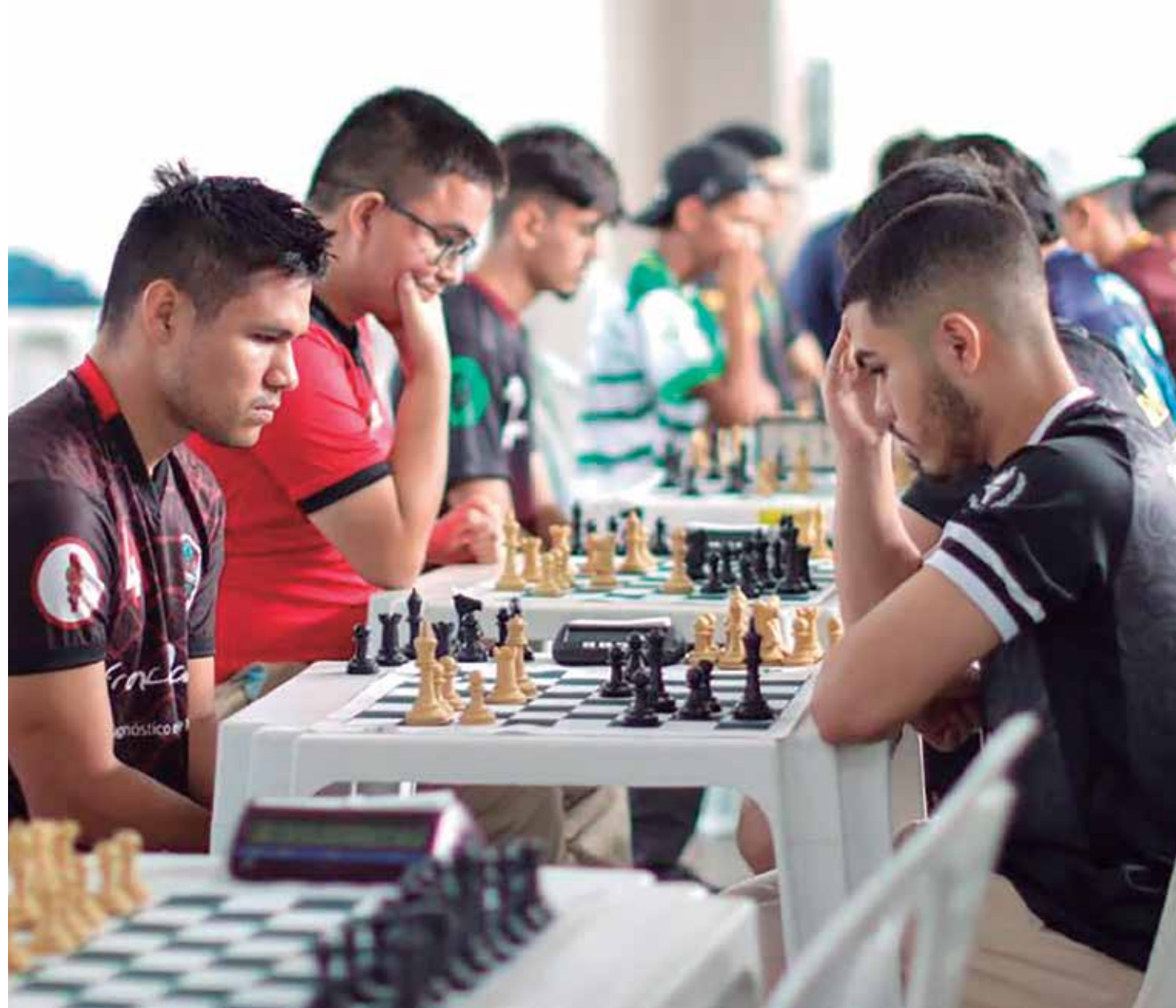
A competição conta com mais de 1200 estudantes da capital e interior

"Vim de Itacoatiara representar minha cidade nas modalidades de vôlei e handebol. Estamos aqui para mostrar que o esporte é importante em qualquer idade.", ressaltou a estu-