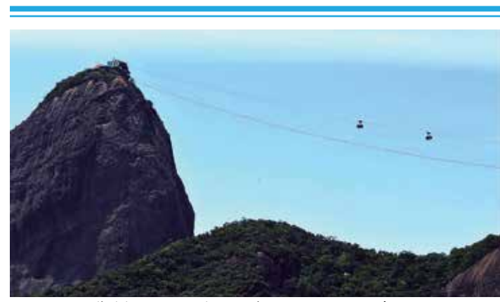
Foram 100 mil visitantes a mais em relação ao mesmo mês em 2019 e 2020

Os principais destinos são Rio de Janeiro, São Paulo, Florianópolis, Salvador, Porto Alegre, Belo Horizonte, Recife, Curitiba e Brasília.