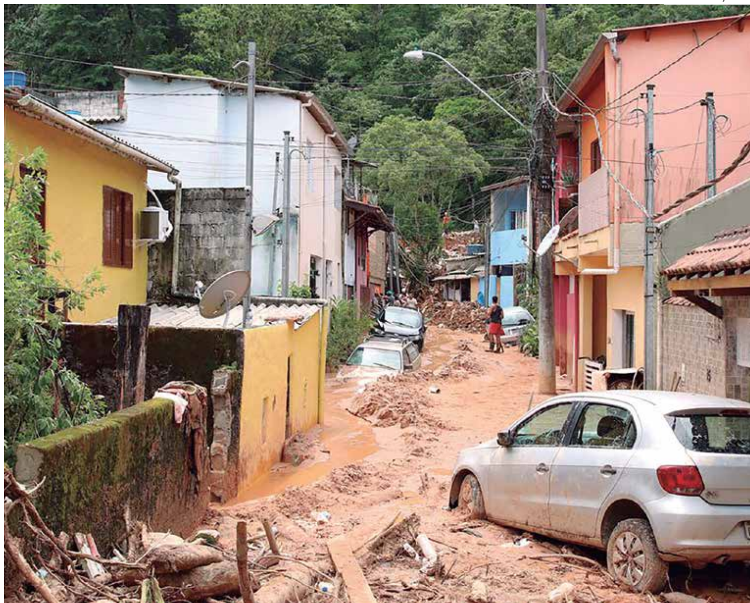
Até o momento, foram confirmados 64 mortos em São Sebastião e um em Ubatuba

O empreendimento, segundo o governo do estado, contou com investimentos de R$ 35,7 milhões, sendo R$ 10,8 milhões do governo de São Paulo e R$ 24,9 milhões do governo federal. As moradias são de propriedade da organização e foram viabilizadas por meio do