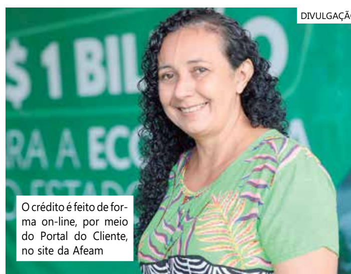
O crédito é feito de forma on-line, por meio do Portal do Cliente, no site da Afeam

Este ano o destaque foi o lançamento de dois novos programas de crédito: o +Crédito Energia Sustentável, para o financiamento de energia solar, que estimulem a produção e/ou uso de fontes de energias renováveis; e o +Crédito Inovação, incentivando o desenvolvimento de startups e empresas inovadoras em fase de operação.