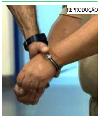
O homem abusava do adolescente desde os 9 anos