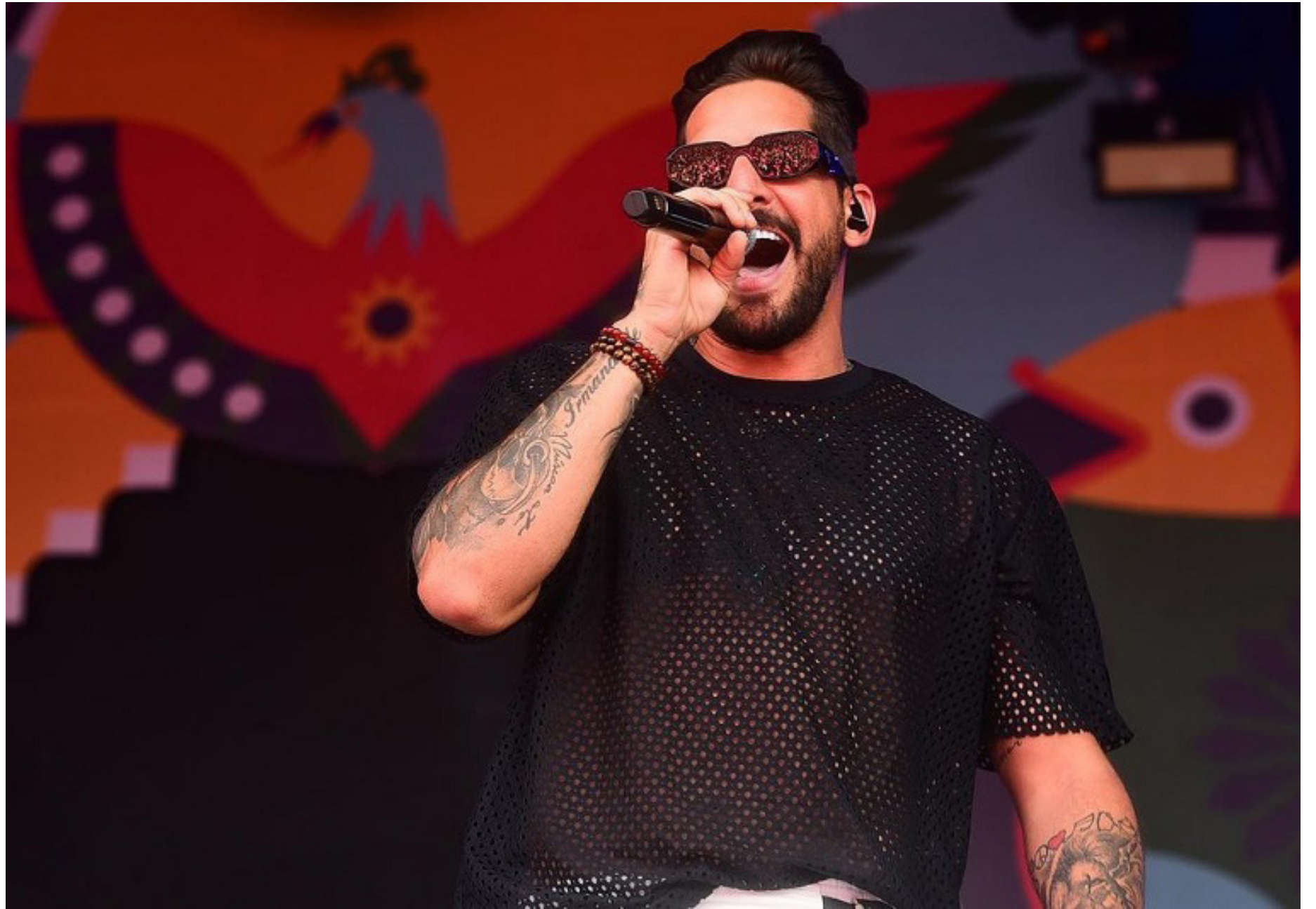
Uma das novidades deste ano, será o palco 360 graus proporcionando uma melhor visão das atrações dos mais diversos pontos do Kwati Club

"Estamos muito animados e temos a certeza de que 2023 ficará na memória de todos aqueles que forem até o Kwati",