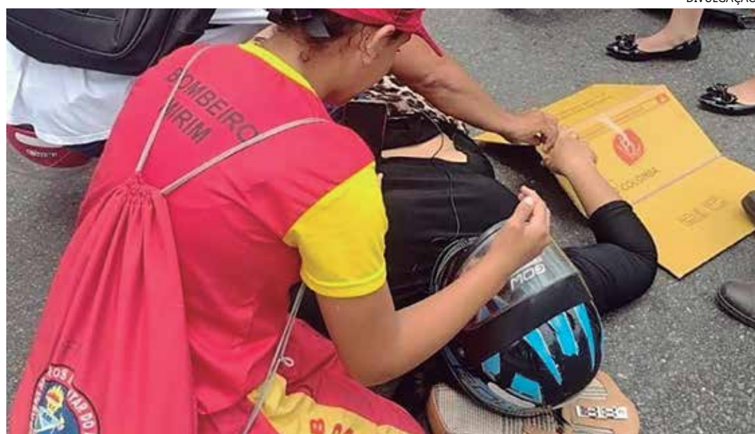
A Bombeira mirim viu a colisão entre as motocicletas e logo socorreu uma das vítimas