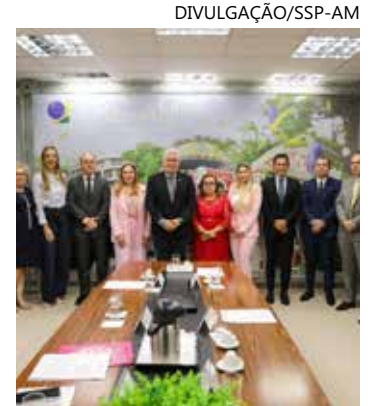
OAB-AM foi incluída no termo

O ato contou com a presença de representantes do TRE-AM, Polícia Federal do Amazonas (PF-AM), da OAB-AM, do Ministério da Justiça e Segurança Pública (MJSP), Secretaria de Estado de Justiça, Cidadania e Direitos Humanos (Sejusc) e Defensoria Pública do Amazonas (DPE-AM).