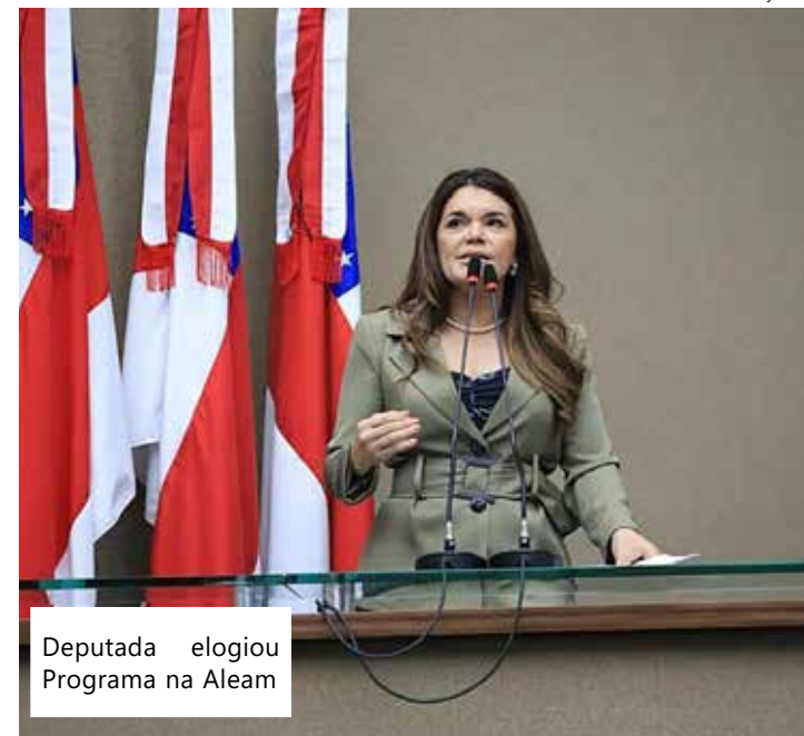
Deputada elogiou Programa na Aleam