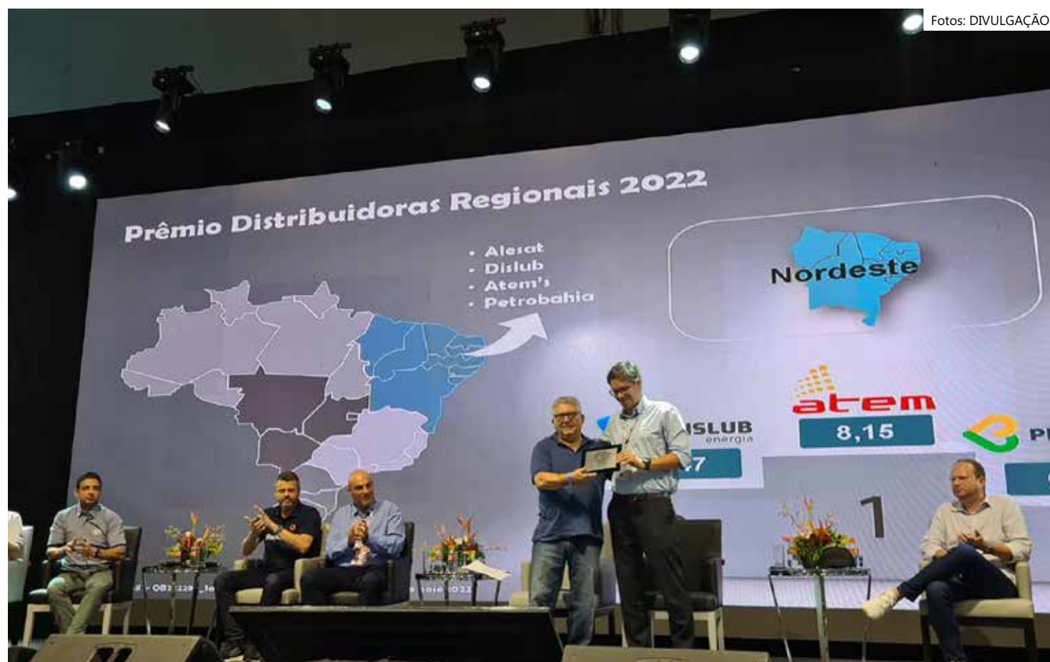
Time da Atem na Expo TRR na Convenção Nacional do SindTRR, em Alagoas

Este ano, a Atem participa da Convenção Nacional com um estande na 19ª Expo TRR e também como convidada para compartilhar experiências nas rodas de conversas entre