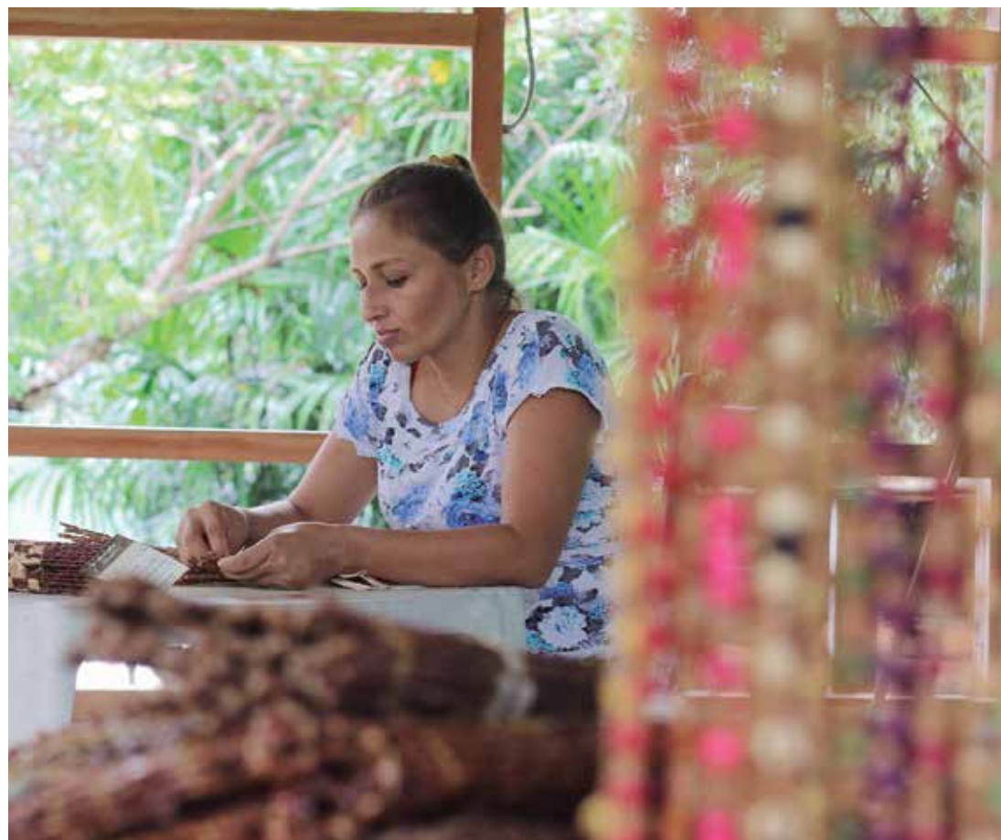
Trabalhos sustentáveis serão beneficiados

Além do Amazonas, o estado do Pará também obteve aprovação para