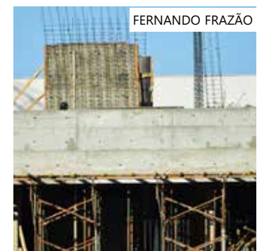
Plataforma atuará pelo fim das obras paradas no Brasil

O deputado federal também integra as Comissões de Relações Exteriores e de Defesa Nacional, e de Minas e Energia, como suplente.