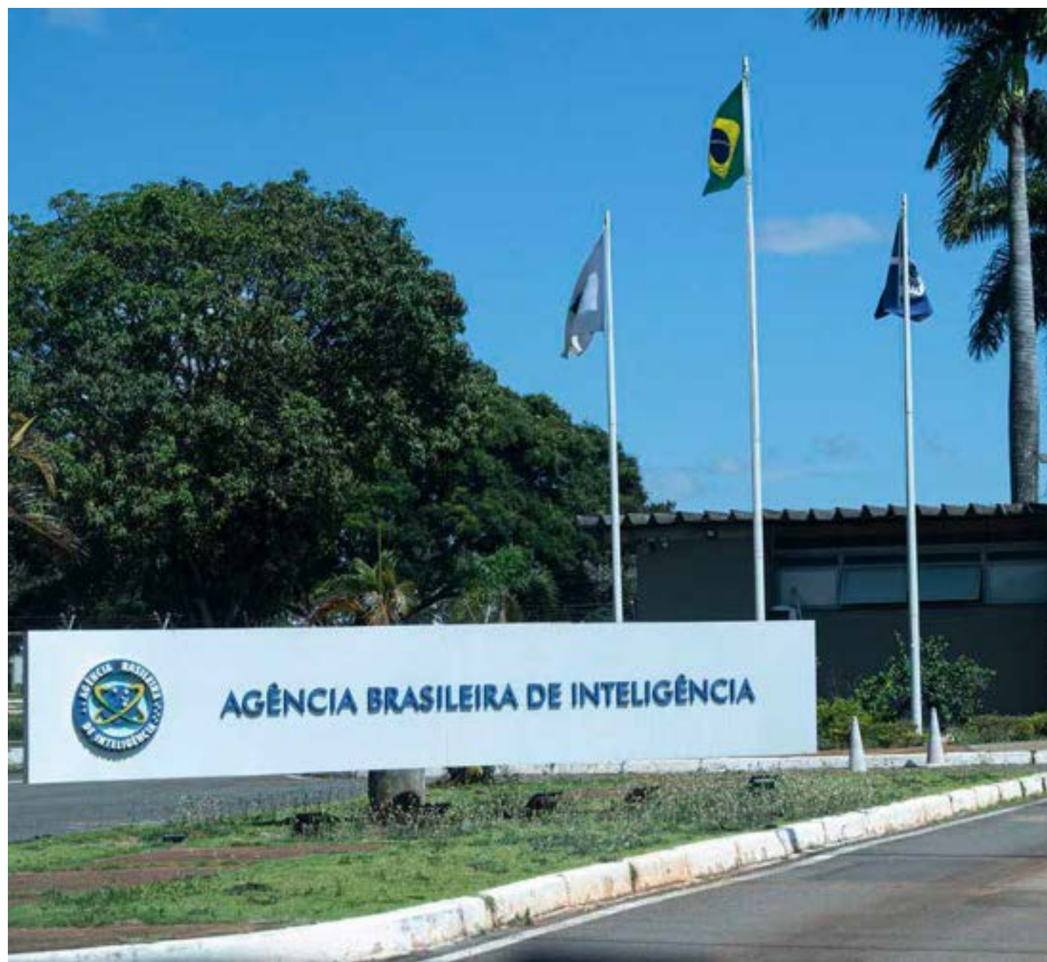
Trabalhos serão conduzidos pela Diretoria de Inteligência Policial

"A solução tecnológica em questão não está mais em uso na Abin desde então [8 de maio de 2021]. Atualmente, a Agência está em processo de aperfeiçoamento e revisão de seus normativos internos, em consonância com o interesse público e o compromisso com o Estado Democrático de Direito", informou a Abin, em nota. A investigação da PF será conduzida pela Diretoria de Inteligência Policial.