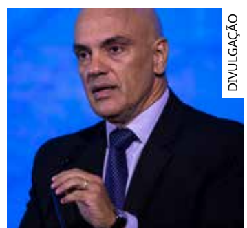
Moraes aperta o cerco no DF

Os acusados respondem pelas condutas de incitação ao crime, incitação de animosidade das Forças Armadas, associação criminosa, dano qualificado, abolição do Estado Democrático de Direito e golpe de estado.