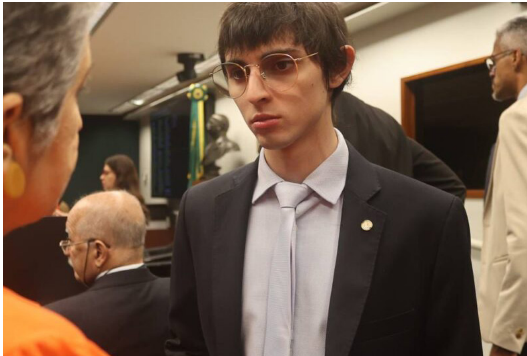
Deputado marcou como vereador justamente na fiscalização do uso do dinheiro público, e agora repete êxito no Congresso

Estados e municípios agora poderão indicar ao governo federal as obras paradas que precisam ser retomadas com prioridade.