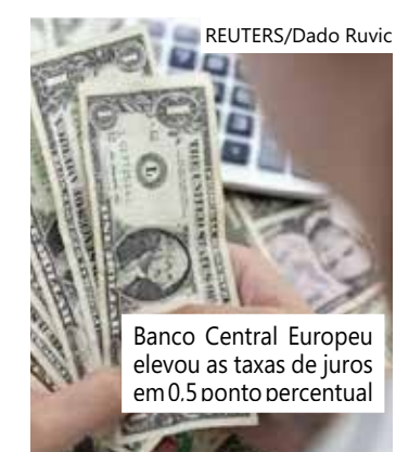
Banco Central Europeu elevou as taxas de juros em 0,5 ponto percentual

A queda ocorreu um mês após uma perda histórica para o banco e se espalhou para outras ações de bancos europeus, com credores franceses e alemães como BNP Paribas, Société Générale, Commerzbank e Deutsche Bank caindo na quarta-feira. Bancos italianos, britânicos e americanos também caíram.