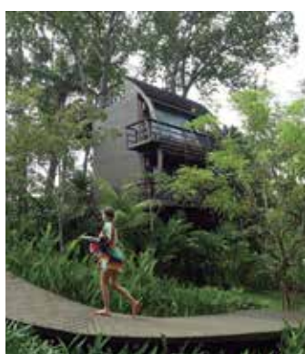
O turismo resultou no saldo positivo de empregos

contratação de profissionais. "Isso se deve a um trabalho de regularização que estamos fazendo de maneira muito forte, a retomada de voos importantes, turistas nacionais e internacionais. Tudo isso fez com que a economia aquecesse e o segmento do turismo também, como consequência, mais contratações, mais emprego, mais renda aqui no estado do Amazonas", afirmou o presidente.