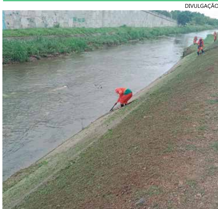
Prefeitura retira constantemente dos igarapés lixo jogado pelos moradores