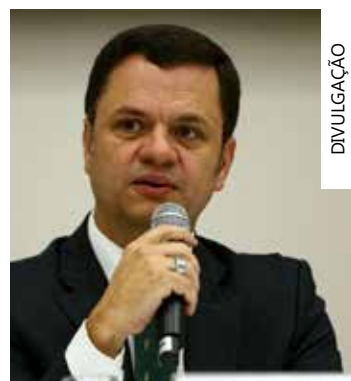
Torres colaborou com a Justiça

obtidas pela Agência Brasil, Torres colaborou com o depoimento, respondendo às perguntas por cerca de uma hora e meia. A oitiva foi convocada por Gonçalves para esclarecer a chamada minuta do golpe, documento encontrado na casa do ex-secretário e cujo texto previa uma intervenção na Justiça Eleitoral, com o objetivo de impedir a apuração das eleições.