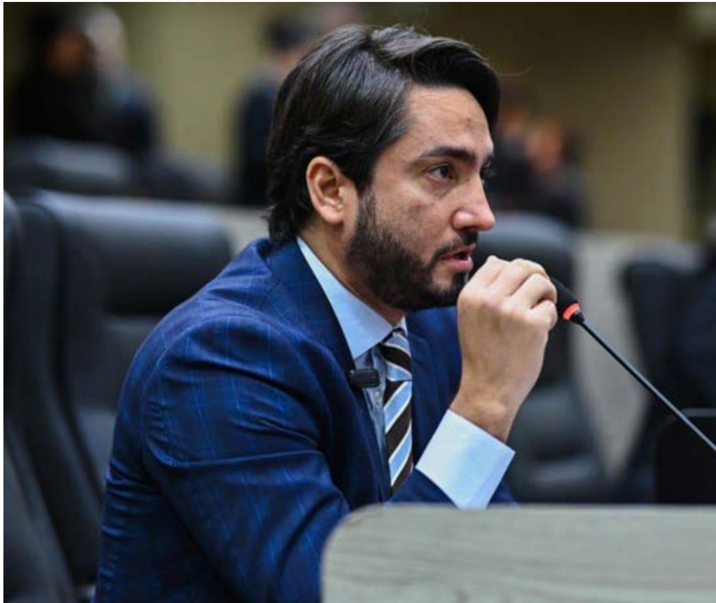
Segundo o presidente da CPI das Águas, o vice-presidente e relator serão escolhidos na segunda