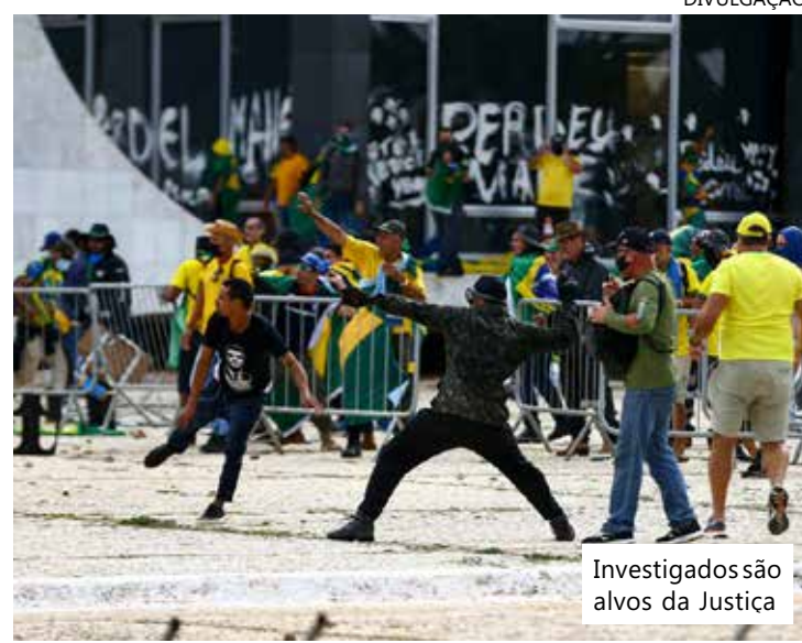
Investigados são alvos da Justiça

"Nesses casos, a jurisprudência admite que as petições apresentem uma narrativa genérica da participação de cada investigado", disse a PGR em nota.