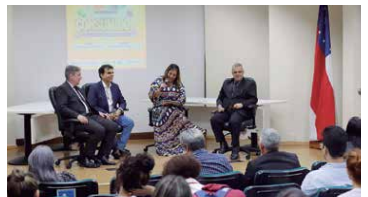
Evento foi feito em parceria da Sefaz com CRC-AM