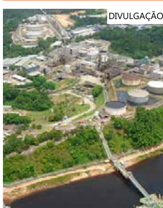
É a oitava redução nos preços

inicia no setor de refino de petróleo, operando a Refinaria da Amazônia. Tem como missão promover o desenvolvimento da região gerando emprego e renda de forma sustentável, fornecendo além de abastecimento com produtos de qualidade, o bem estar das pessoas, por meio de processos definidos e pautados na segurança de suas operações, preservação do meio ambiente, protegendo o indivíduo e a sociedade.