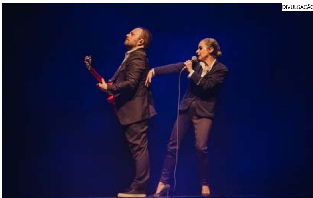
O ingressos estão sendo vendidos a R$ 140,00 (inteira) e R$ 70,00 (meia-entrada)