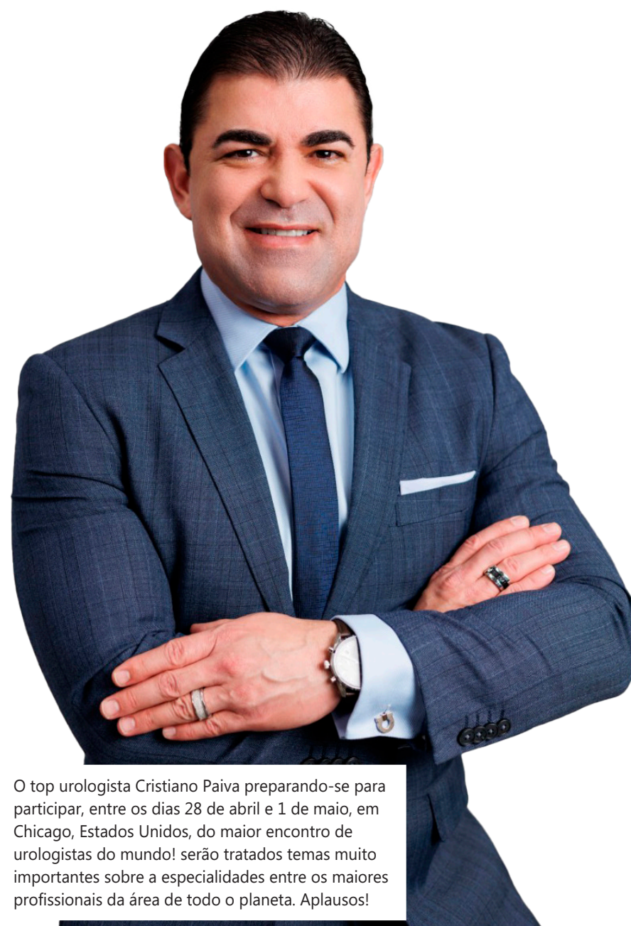
O top urologista Cristiano Paiva preparando-se para participar, entre os dias 28 de abril e 1 de maio, em Chicago, Estados Unidos, do maior encontro de urologistas do mundo! serão tratados temas muito importantes sobre as especialidades entre os maiores profissionais da área de todo o planeta. Aplausos!