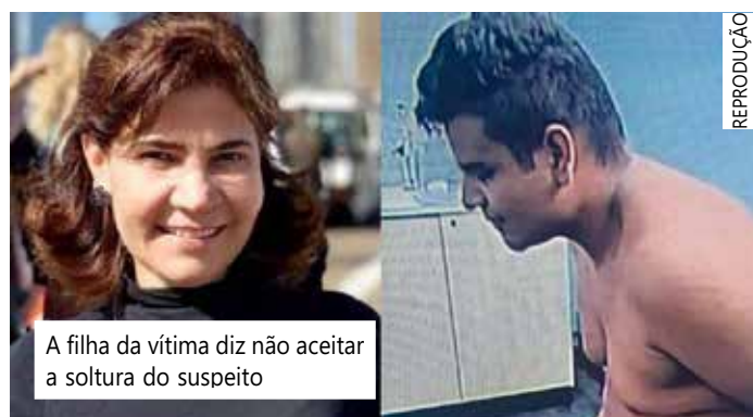
A filha da vítima diz não aceitar a soltura do suspeito

Em outro momento, a filha questionou se a justiça está realmente sendo feita. "Não consigo aceitar" finalizou.