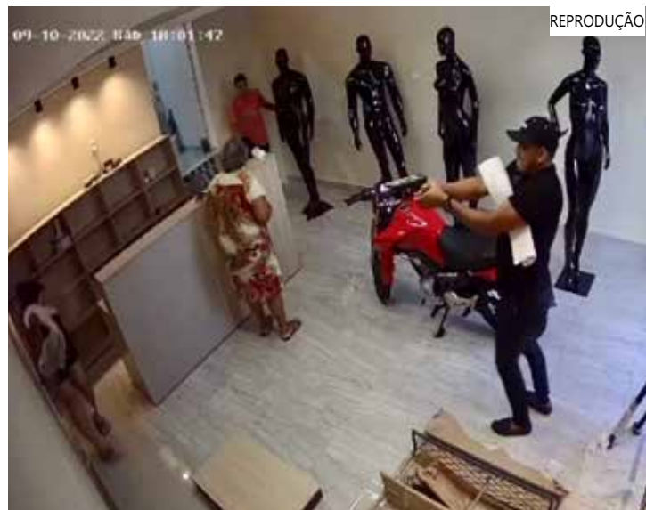
Crime ocorreu dentro de uma loja no bairro Compensa, zona Oeste

O indivíduo foi indiciado por estupro de vulnerável, e ficará custodiado na carceragem da unidade policial, à disposição da Justiça.