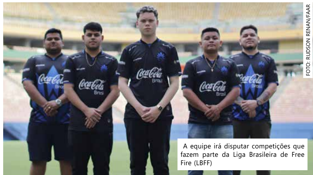
A equipe irá disputar competições que fazem parte da Liga Brasileira de Free Fire (LBFF)