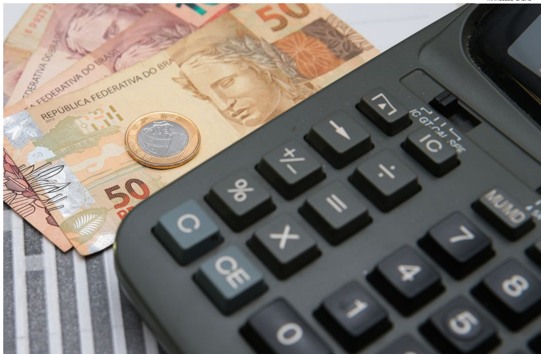
O desequilíbrio fiscal permanece elevado e estima-se que os níveis de dívida atinjam 64,7%

Segundo o relatório, para impulsionar o crescimento,