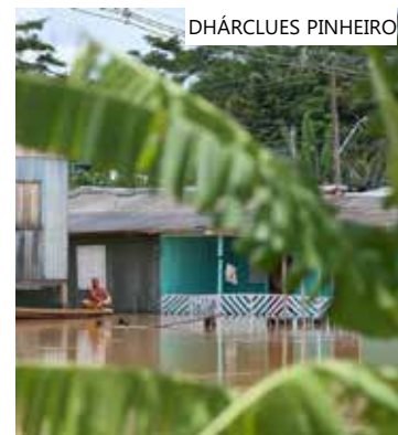
Comunidades rurais ficam ilhadas

"Até o dia 31 de março de 2023, 455 pessoas foram atingidas em decorrência do mencionado evento natural, sendo que 160 pessoas estão desalojadas e até o presente 111 imóveis residências foram afetados", diz o decreto de Capixaba.