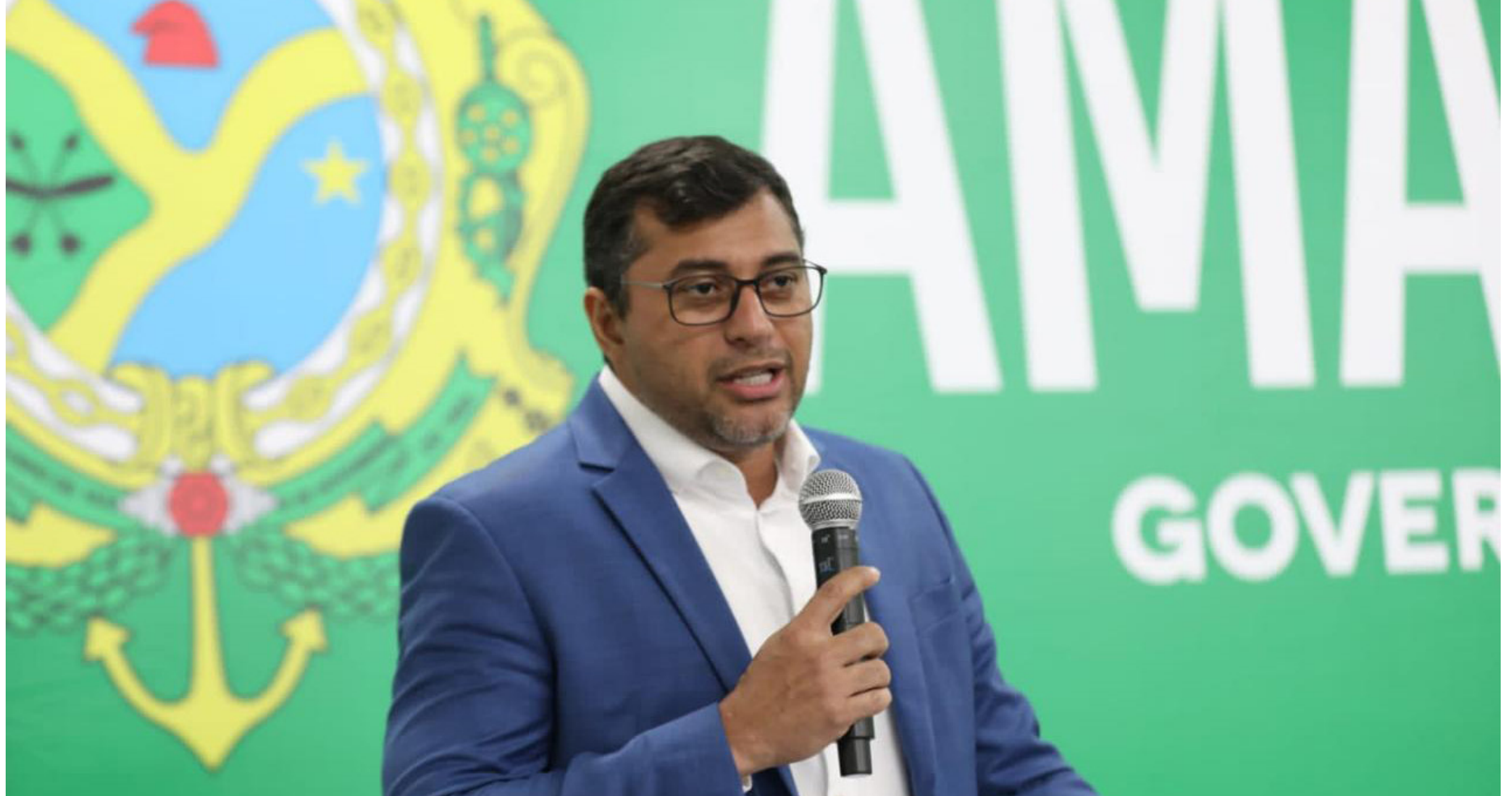
O edital selecionou propostas com serviços socioassistenciais e socioeducativos