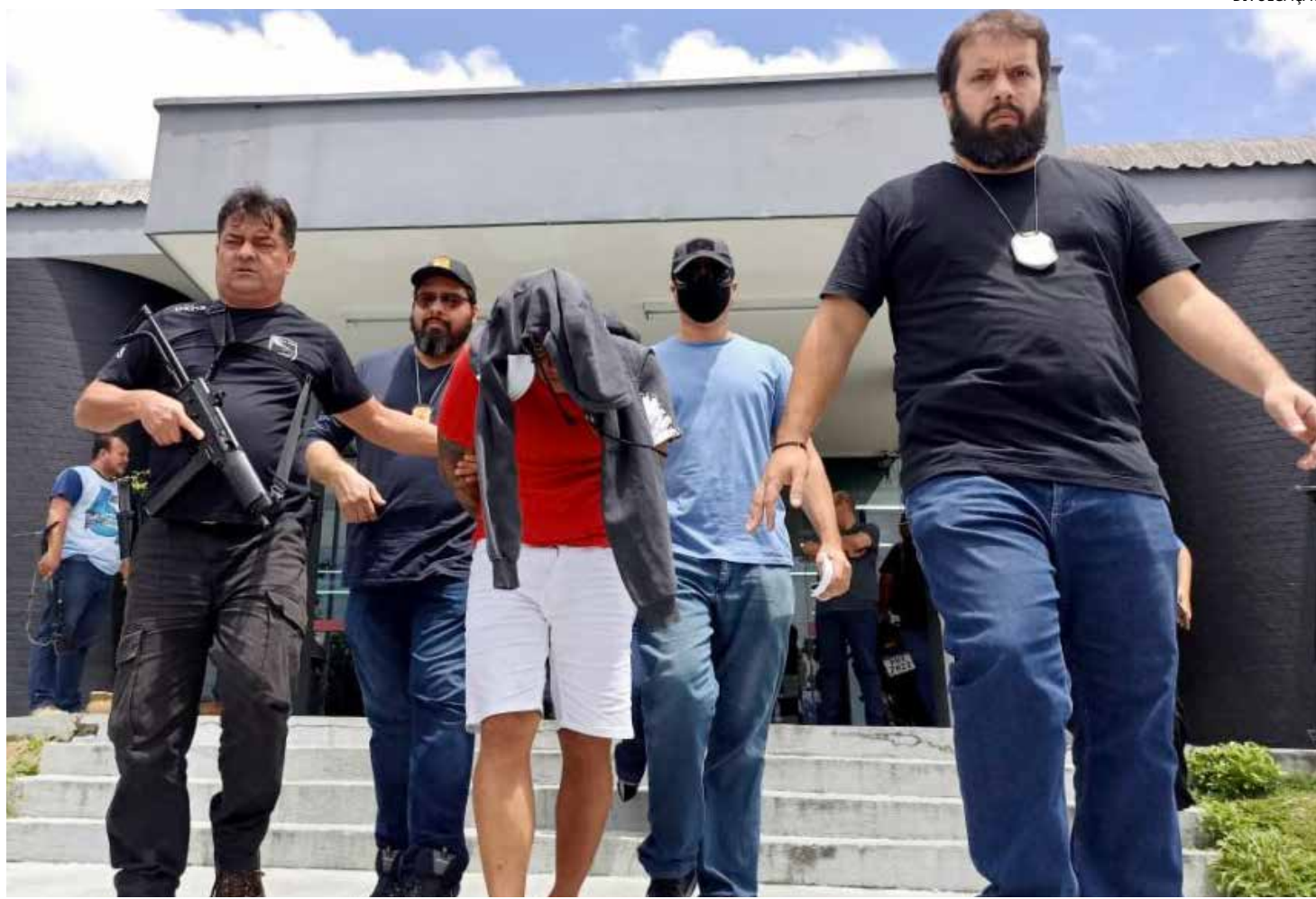
O suspeito foi preso em um shopping da capital

Conforme o delegado Ricardo Cunha, titular da unidade especializada, 'Boneca' foi um dos responsáveis