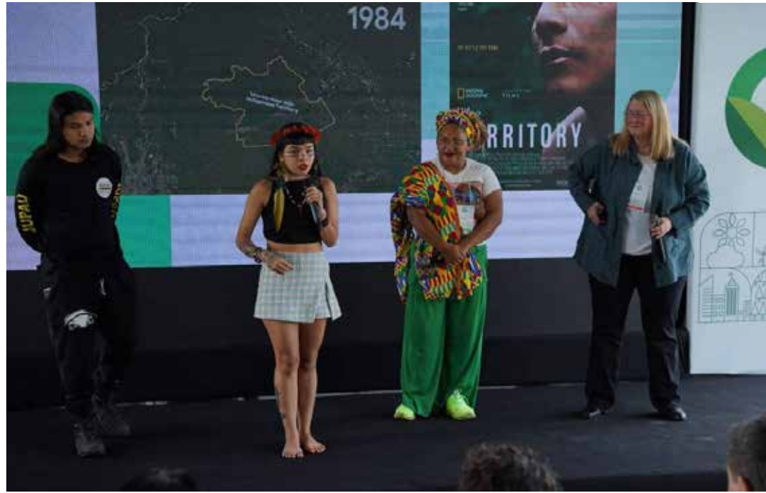
Ativista Txai Suruí discursa durante o evento Sustentabilidade com Google-Amazônia que ocorreu em Belém, no Pará

O histórico de buscas no site mostra o aumento pelo interesse em temas de meio ambiente. Nos últimos dez anos, as buscas no Google