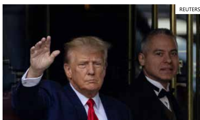
Trump foi indiciado por subornar uma atriz pornô em meio às eleições

Donald Trump é o primeiro ex-presidente dos EUA a receber acusações criminais. Ele comandou os Estados Unidos de 2017 a 2021 e anunciou em novembro que tentará reconquistar a presidência em 2024. Trump é o candidato favorito para a indicação republicana.