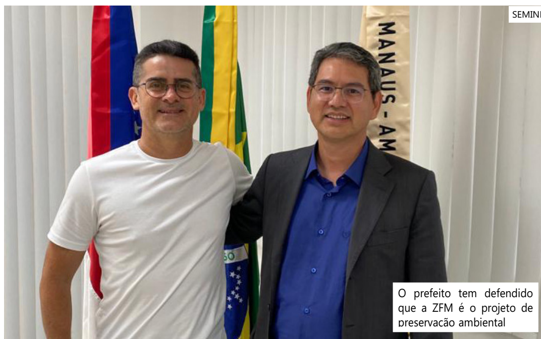
O prefeito tem defendido que a ZFM é o projeto de preservação ambiental

Segundo a Abraciclo, a produção de motocicletas do Polo Industrial da ZFM chegou a 1.413.222 unidades em 2022, resultado 18,2% superior ao registrado no ano anterior de 1.195.149 motocicletas.