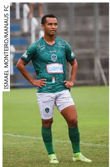
O evento também serviu para a assinatura com um novo patrocinador