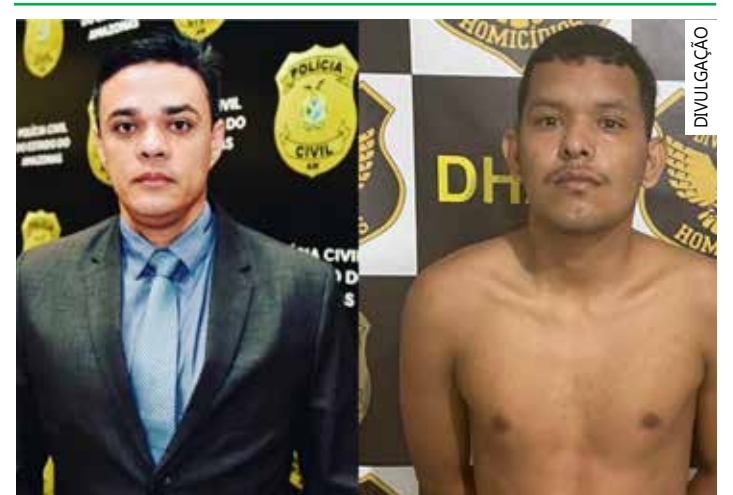
Aldeney reagiu ao assalto e foi morto com vários tiros

Com a prisão de 'Pipoca', o crime que vitimou o delegado torna-se elucidado e com todos os envolvidos à disposição da justiça.