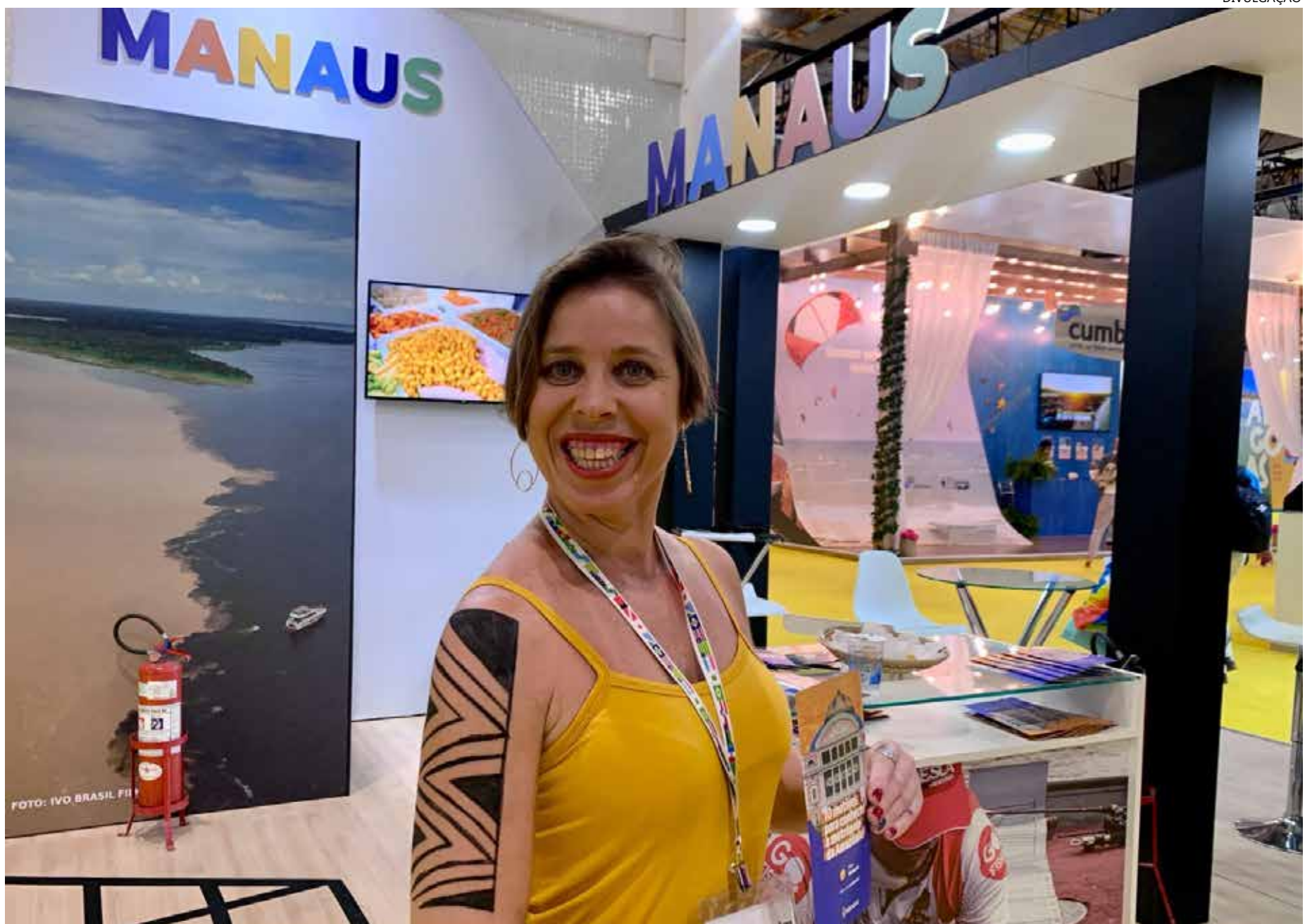
A Prefeitura de Manaus ocupou um estande próprio de promoção turística da cidade

"No estande de Manaus, as pessoas poderão receber o material promocional ilustrativo com dicas e roteiros turísticos da nossa capital. Além disso, estamos inovando nas feiras nacionais, divulgando mais sobre a pintura corporal com grafismos indígenas, realizados