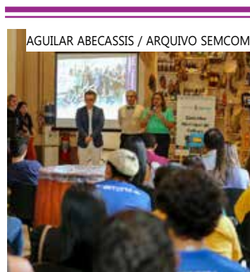
As inscrições são gratuitas

Podem participar Pessoas Físicas (CPF) e Pessoas Jurídicas (CNPJ), desde que maiores de 18 anos, domiciliadas em Manaus e com ao menos dois anos de experiência em áreas culturais