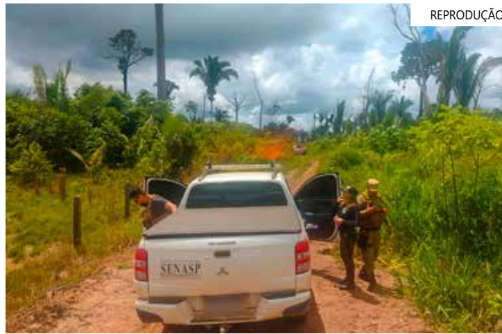
Ferramenta será capaz de monitorar operações na região

A iniciativa é chefiada pela organização The Nature Conservancy, em parceria com a USP, o Imaflores e a empresa Trase, além do Google.