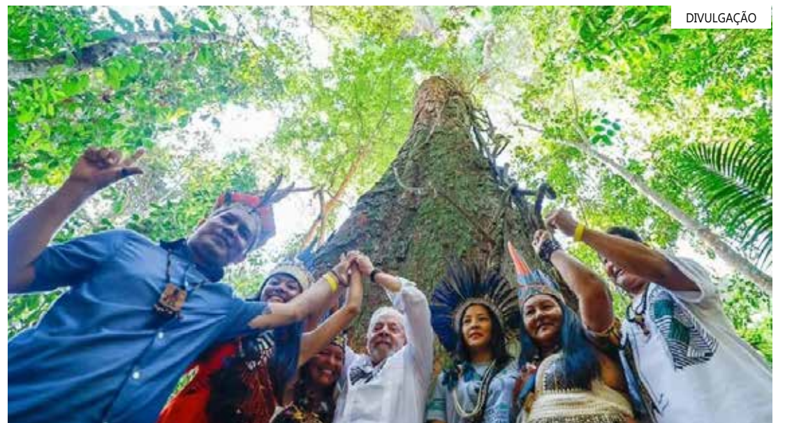
Durante a campanha eleitoral Lula se comprometeu com a preservação da Amazônia

Macron sinalizou ao presidente Lula em janeiro disposição em vir para o Brasil ainda em 2023.