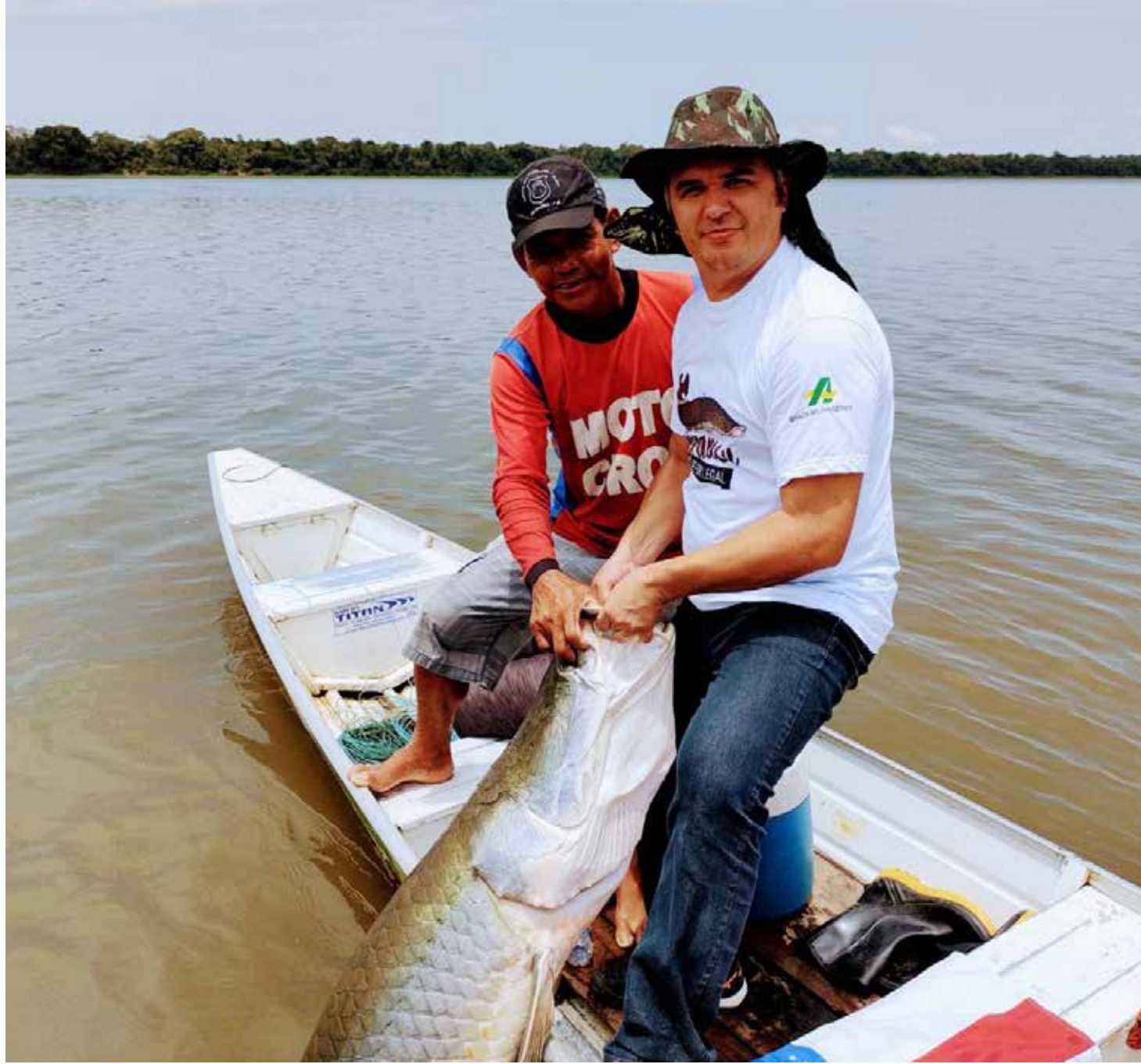
O feirão será realizado em diversos pontos da cidade

Segundo Aprígio, todos os peixes têm características di-