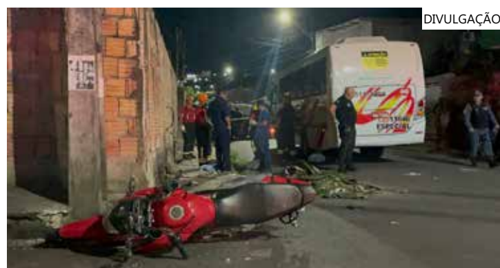
O motorista do ônibus foi encaminhado para o 1º DIP

de Urgência (Samu) foram acionados, mas nada puderam fazer pela vítima fatal. Porém, o condutor foi socorrido. O rapaz também caiu e ficou lesionado. Ele foi socorrido e encaminhado para um hospital público de Manaus, onde recebeu atendimento médico. A perícia foi ao local do fato, porém, o caso deve ser apurado pela Delegacia Especializada em Acidentes de Trânsito (DEAT).