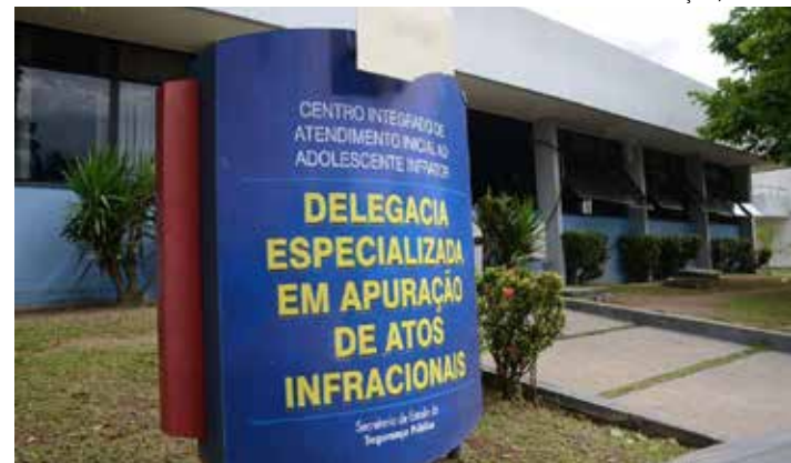
A ação ocorreu após uma denúncia anônima