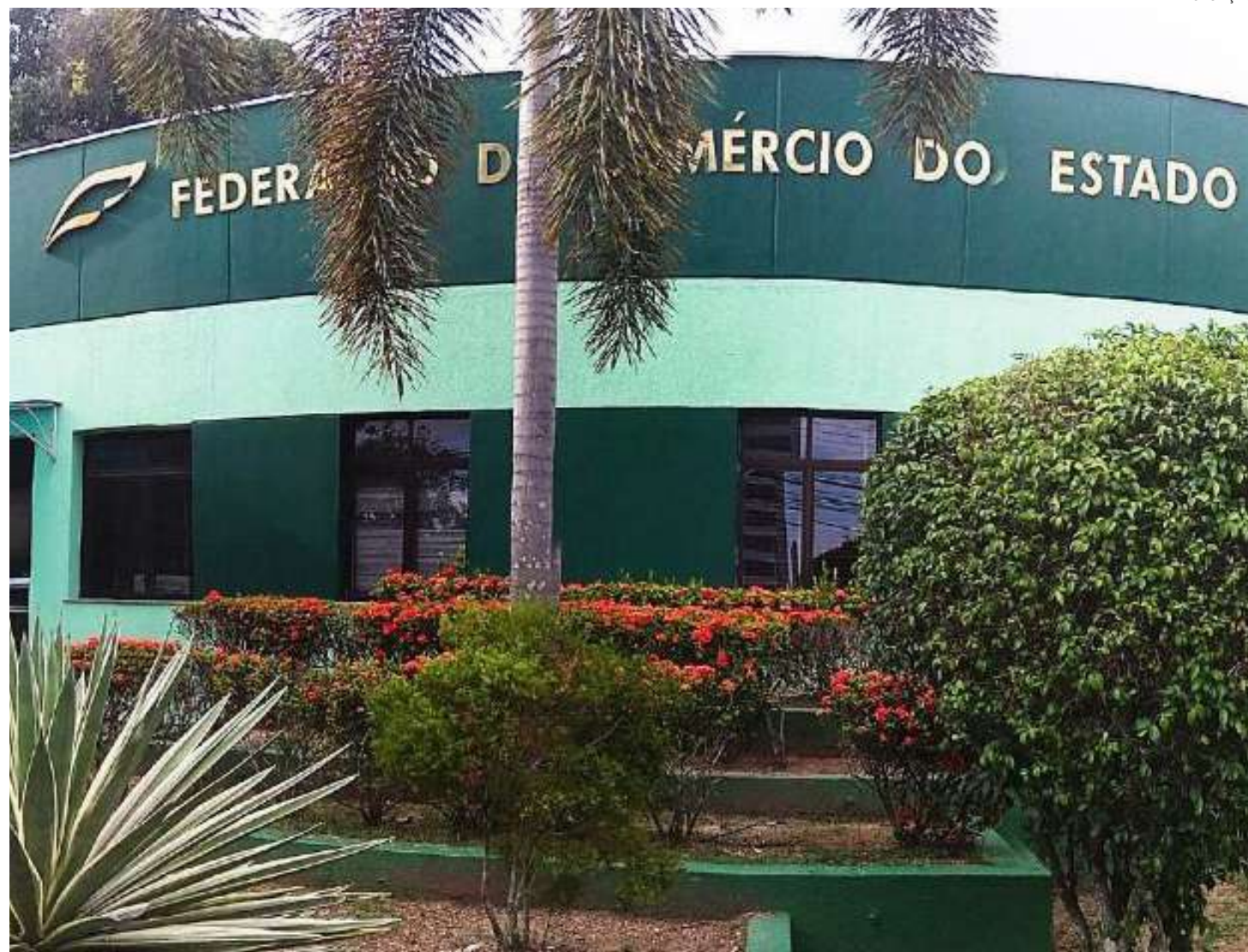
Pesquisa foi encomendada pela Fecomércio do Amazonas

Apesquisa mostra que quase 80% dos que pretendem