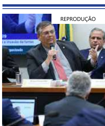
Dino não conseguiu explicar

No início da audiência, Flávio Dino informou ações realizadas pelo governo no combate ao tráfico de drogas, apreensão de armas ilegais e violência nas escolas, mas não foi além disso.