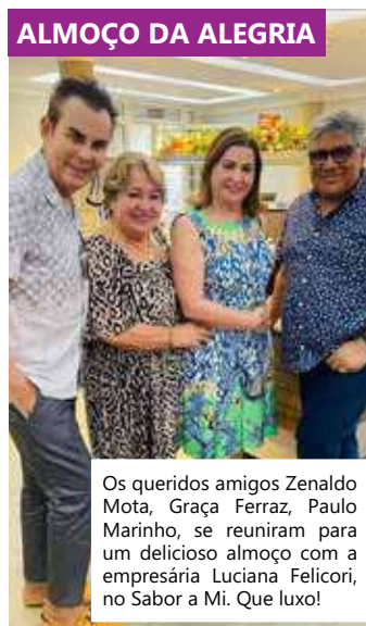
ALMOÇO DA ALEGRIA