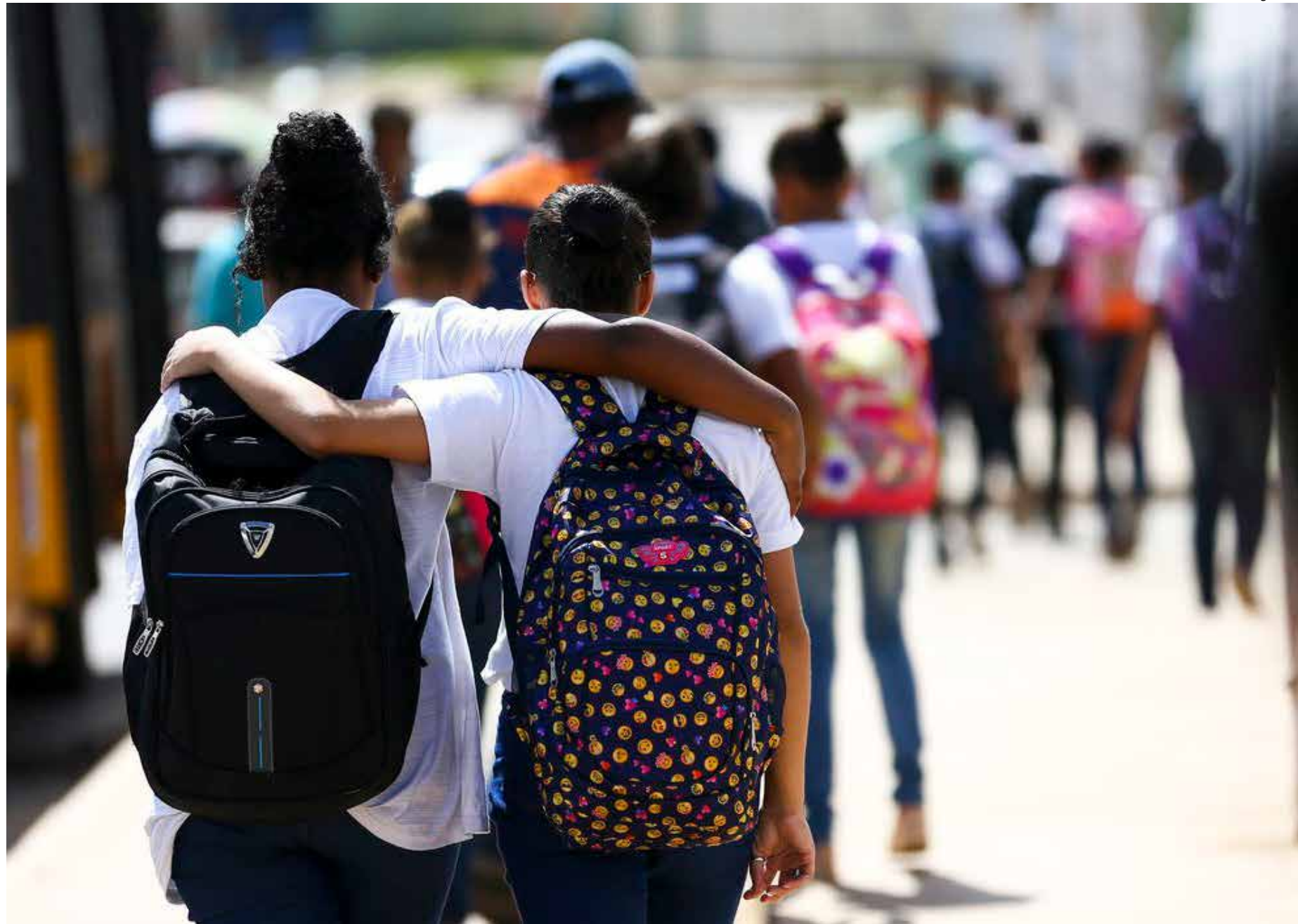
Entrevistadas relataram preocupação de alunos em todo o país diante dos recentes ataques registrados em escolas

A professora recomenda que é possível explicar que o medo é um sentimento e que as famílias e as pessoas na escola estão trabalhando para cuidar da segurança dela.