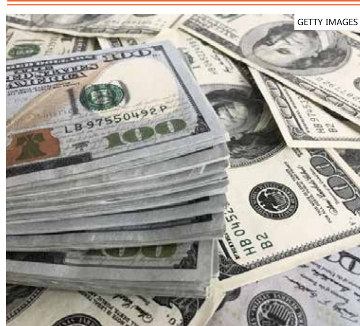
Dólar vem sofrendo recuo há alguns dias

Às 10h10, a moeda norte-americana caía 0,62%, cotada a R$ 4,9756. Na mínima