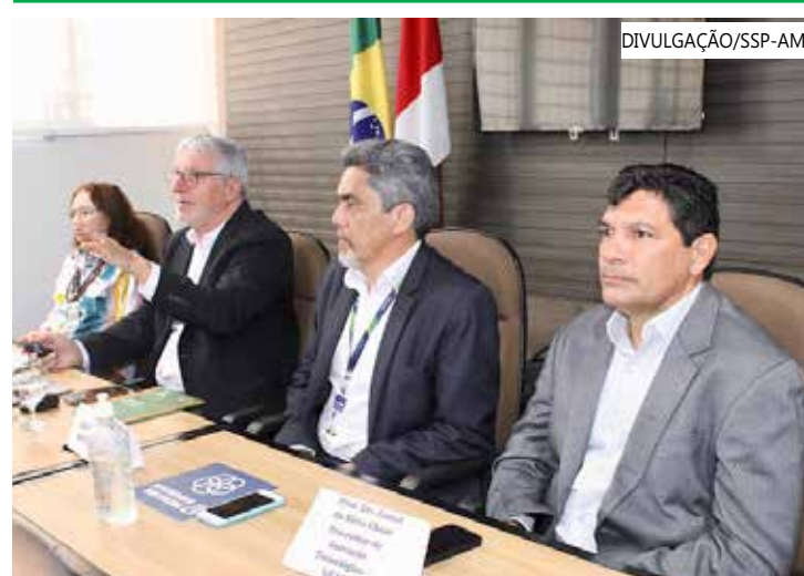
Reunião ocorreu na sede da Sedecti em Manaus

Também participaram da reunião a Superintendência da Zona Franca de Manaus (Sufzama), Universidade Federal do Amazonas (Ufam), Fundação de Amparo à Pesquisa do Estado do Amazonas (Fapeam), Instituto Nacional de Pesquisas da Amazônia (Inpa), e Rede de Recursos Humanos e Inteligência para Sustentabilidade na Amazônia (Rhisa).