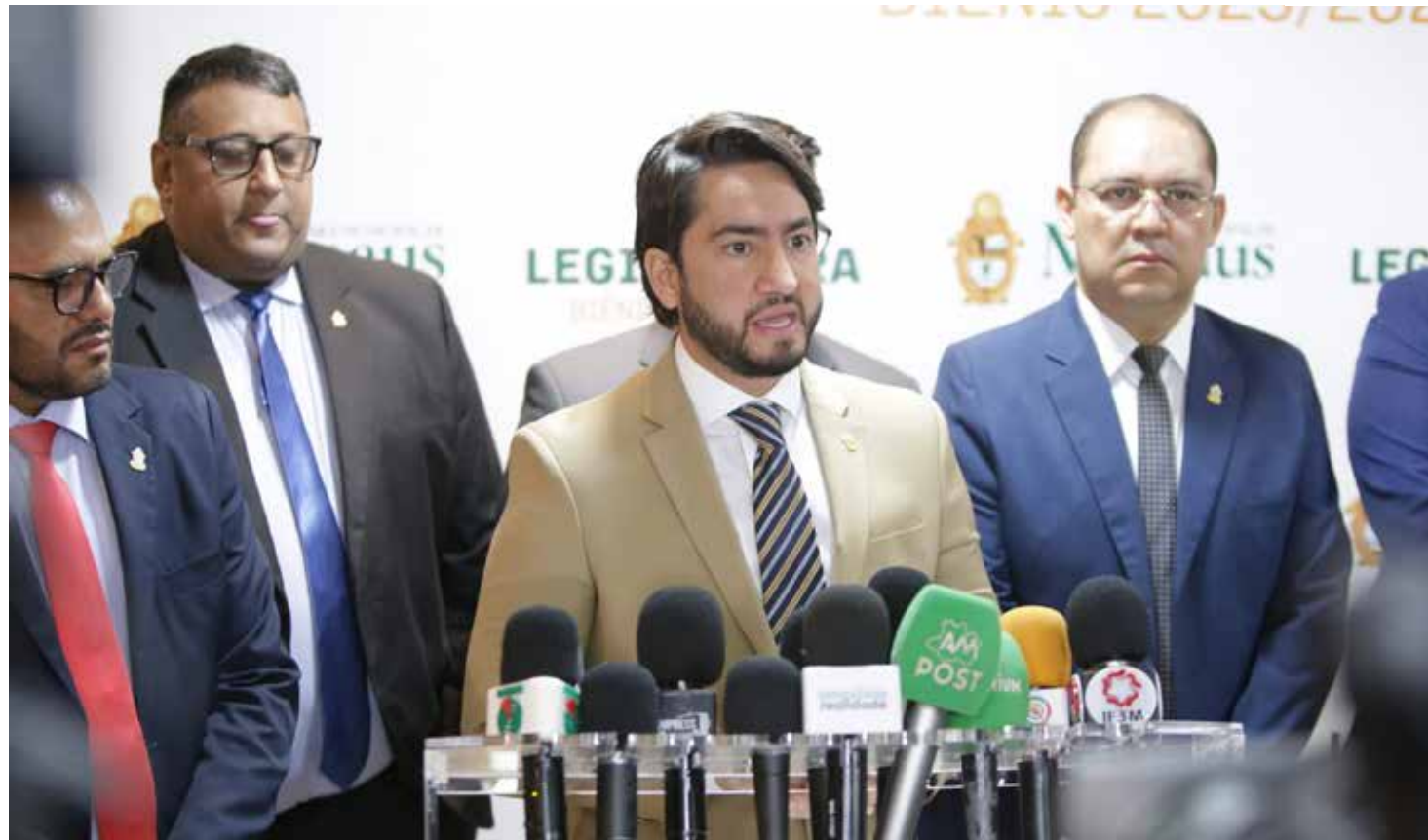
A empresa apresentou a proposta à CPI nesta terça-feira (11)

No entanto, conforme o membro da comissão, a concessionária do serviço público propõe reduzir em até 80% a taxa para os clientes atuais. E isso por apenas quatro anos, a contar deste mês de junho. Depois disso, volta aos 100%. Hoje