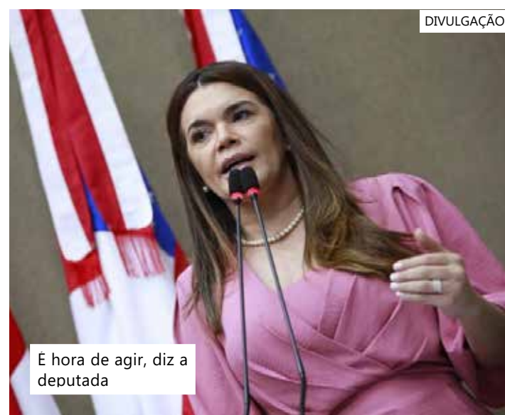
E hora de agir, diz a deputada