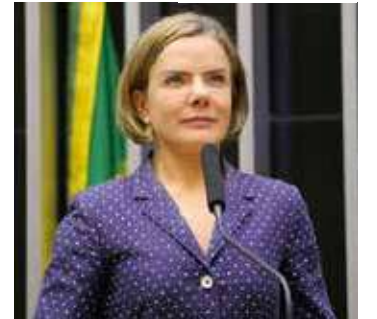
Gleisi está a caminho do Amazonas