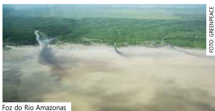
Foz do Rio Amazonas

tencial de desencadear um efeito cascata, com a exploração em dezenas de outros blocos de petróleo atualmente ofertados na bacia. A nota afirma que o plano de perfurar novos poços em busca de petróleo e gás na bacia sedimentar da Foz do Amazonas “causa um alerta gravíssimo”. Diz ainda que o licenciamento ambiental do bloco 59, da Petrobras, tem “lacunas e fragilidades que comprometem uma análise robusta do Ibama” sobre a viabilidade da atividade na região.