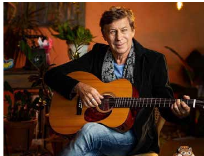
FLÁVIO VENTURINI

O show traz grandes sucessos da carreira iniciada em 1974