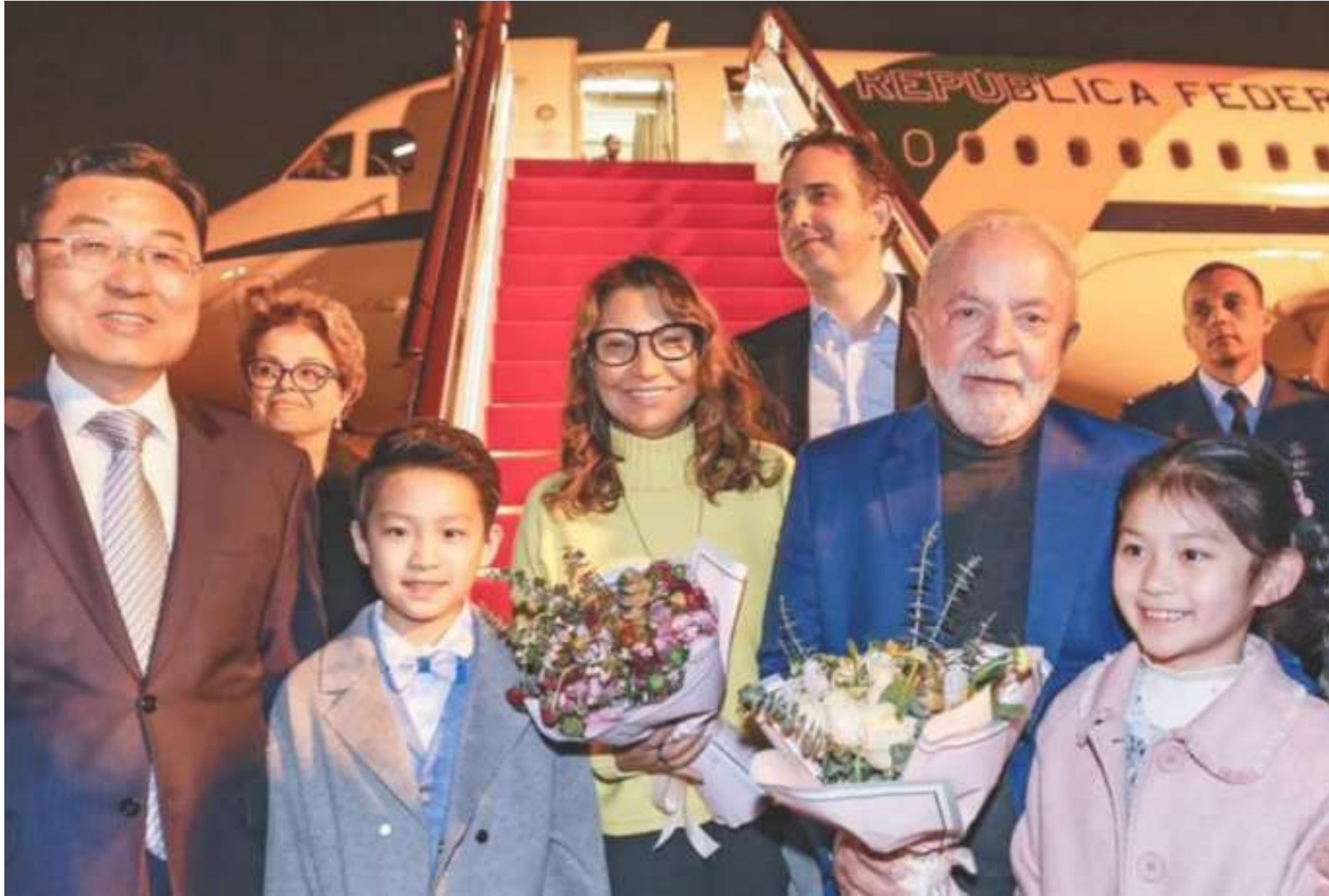
Recebido por Dilma, Lula levou comitiva de aliados e espera voltar com bons acordos

Brasil tem vários interesses econômicos com o gigante