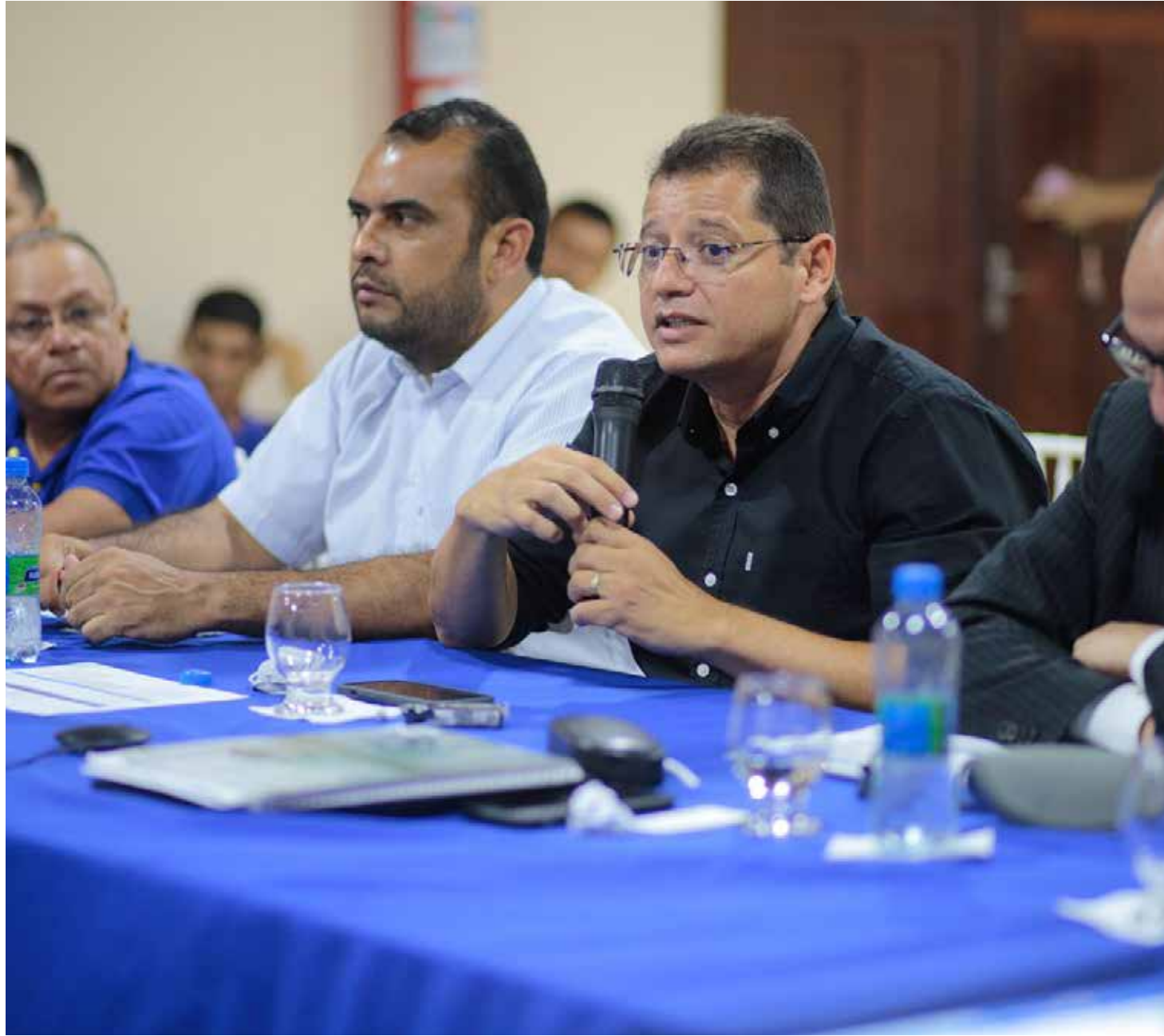
Técnicos estiveram em Parintins na tarde da quarta-feira