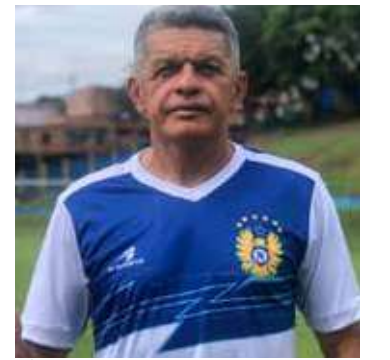
“É um prazer estar voltando à equipe do Nacional”, revelou.