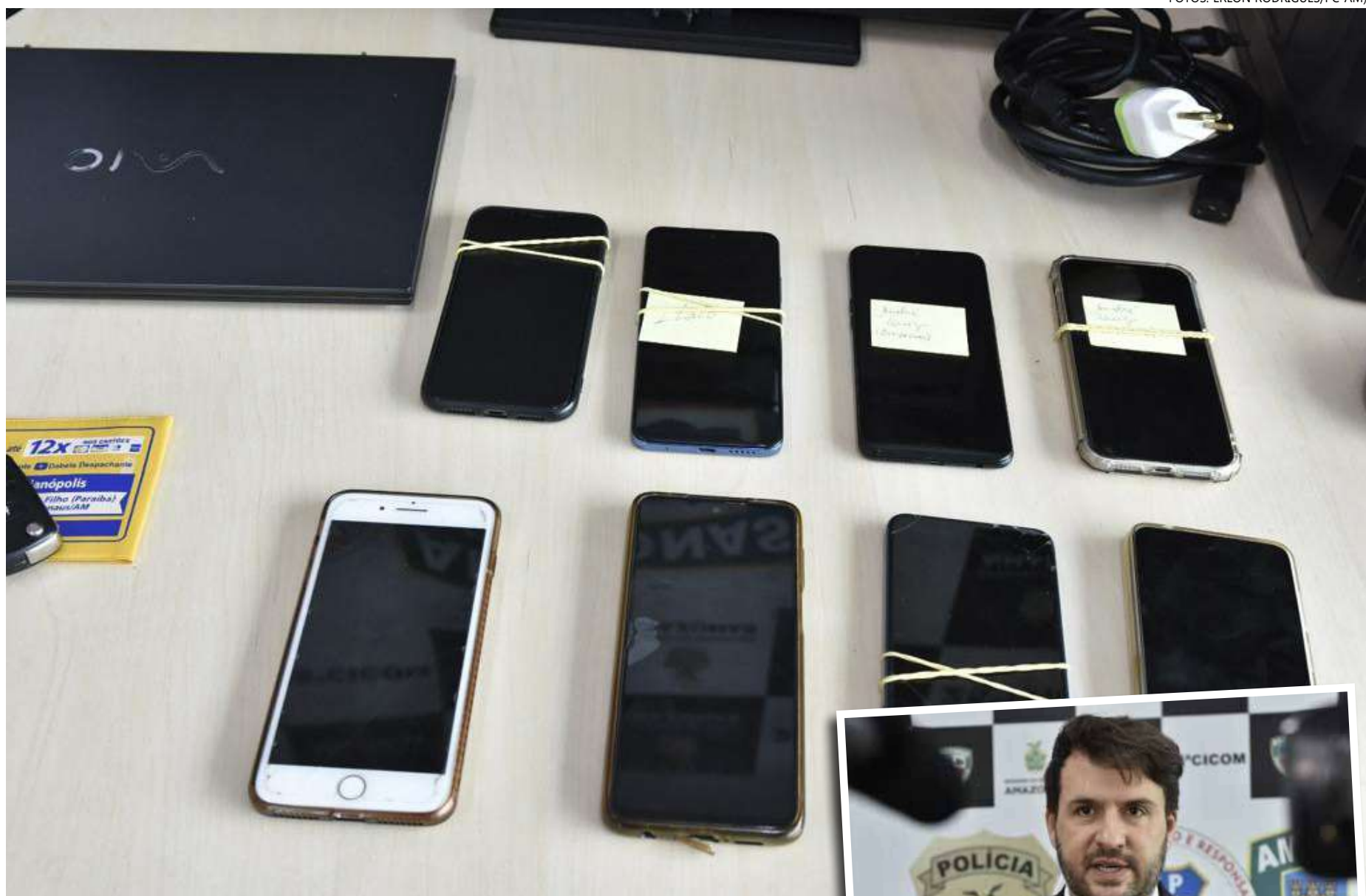
Seis pessoas faziam parte da organização criminosa

O grupo responderá por furto qualificado mediante fraude e abuso de confiança (71 vezes)