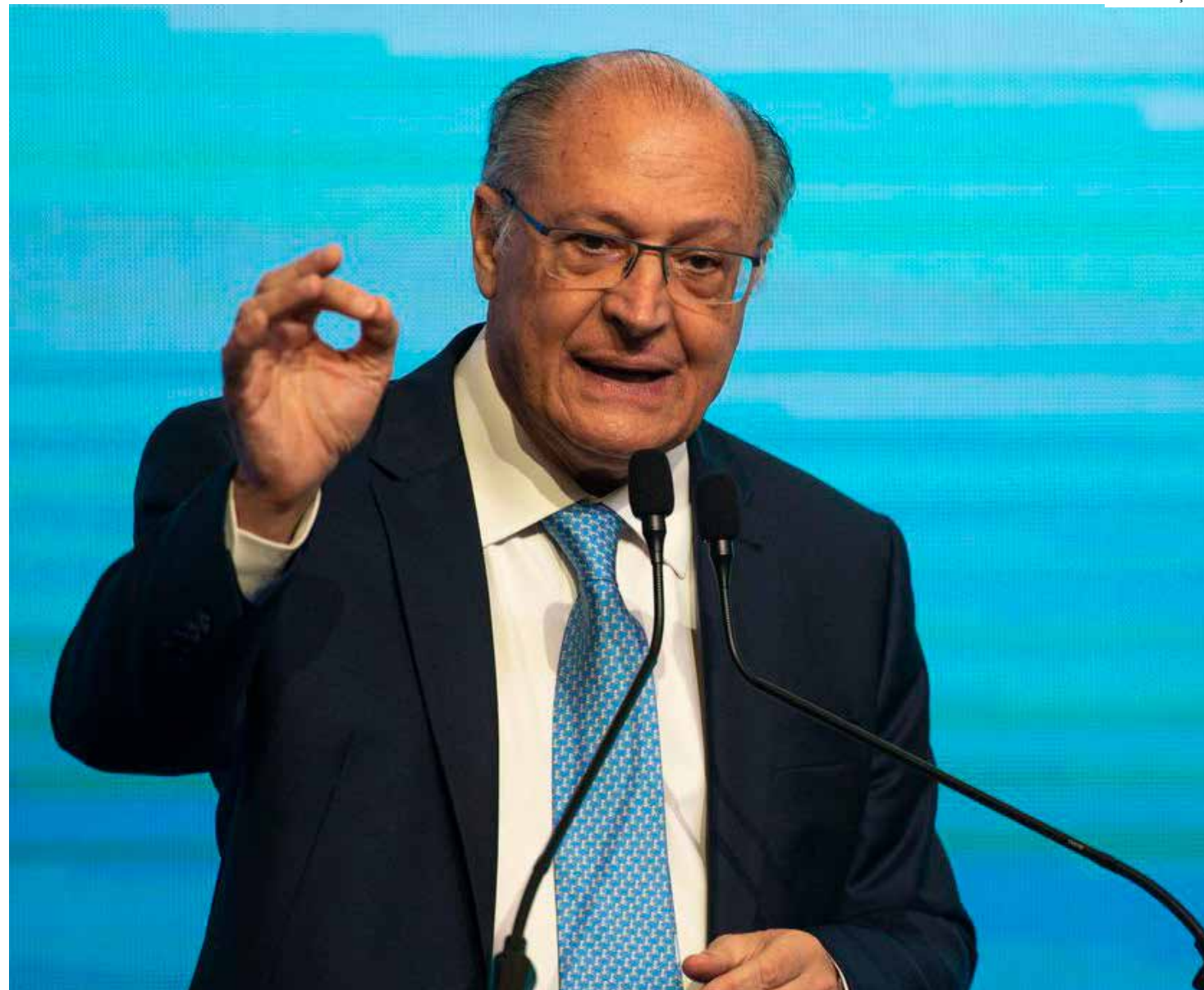
Alckmin em discurso defendeu a relação comercial com os demais países latino americanos

Segundo Alckmin, o governo está otimista com a aprovação do arcabouço fiscal e, posteriormente, da reforma tributária para alavancar os investimentos no país. Para o vice-presidente, que também é o ministro do Desenvolvimento, Indústria, Comércio e Serviços, o Brasil teve uma desindustrialização precoce e preocupante mas, com as medidas, pode recuperar a competitividade.