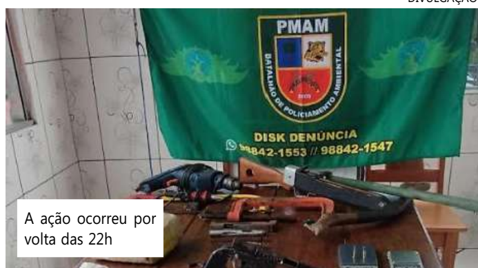
A ação ocorreu por volta das 22h