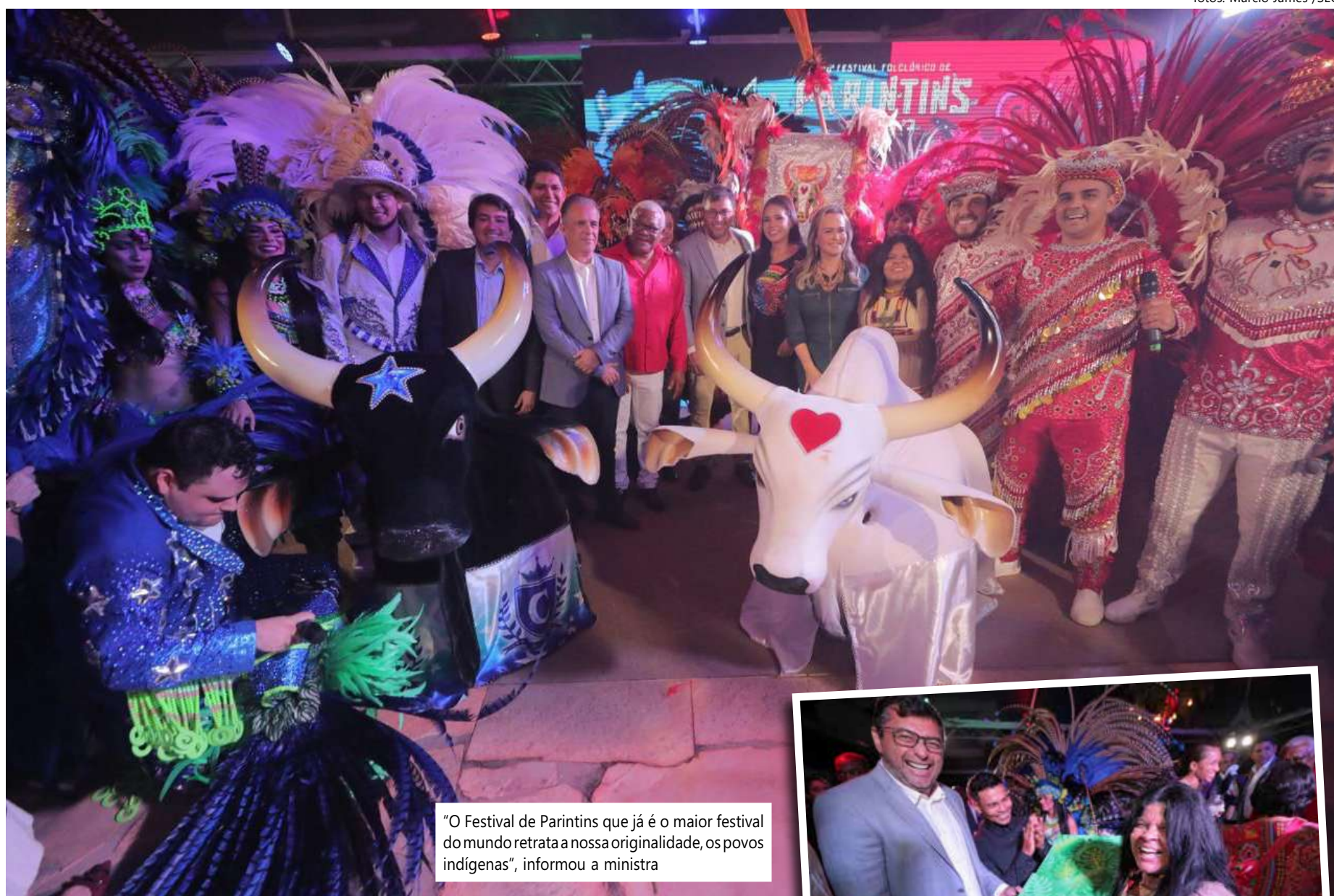
"O Festival de Parintins que já é o maior festival do mundo retrata a nossa originalidade, os povos indígenas", informou a ministra

"O Festival de Parintins que já é o maior festival do mundo retrata a nossa originalidade, os povos indígenas. E o que acho muito legal é que, tanto um boi quanto o outro trazem a visi-