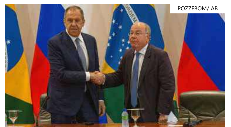
Ministros do Brasil e da Rússia se encontraram em Brasília