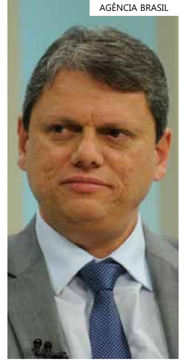
Tarcísio de Freitas, Governador de SP