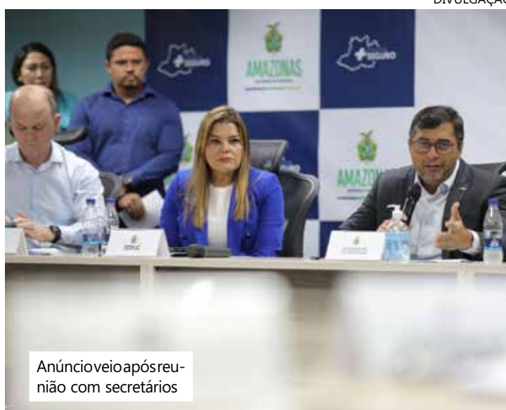
Anúncio de reunião após reunião com secretários

inteligência que ajudem no trabalho de investigação; reforço nos quadros temporários de profissionais da área psicossocial para execução do projeto “Acolher”, além da proposta da realização de uma campanha de comunicação nacional, a exemplo de como já acontece nas campanhas de vacinação.