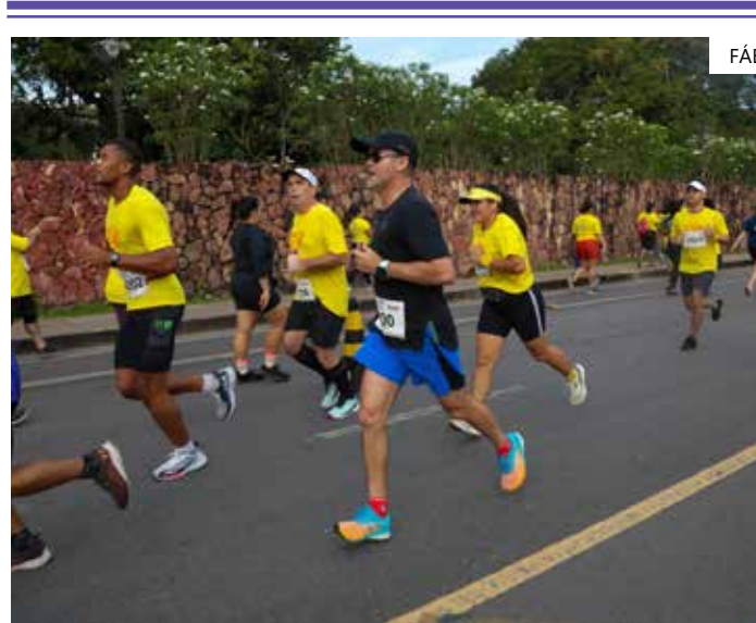
A corrida já está presente no calendário oficial do município

a prevenção e o esporte auxilia nisso, tirar as pessoas do sedentarismo, evitar a diabetes e a pressão arterial. Essas corridas e outras ações que a prefeitura tem feito no esporte, trabalhando a transversalidade, tem ajudado. Você deixa de frequentar UBS