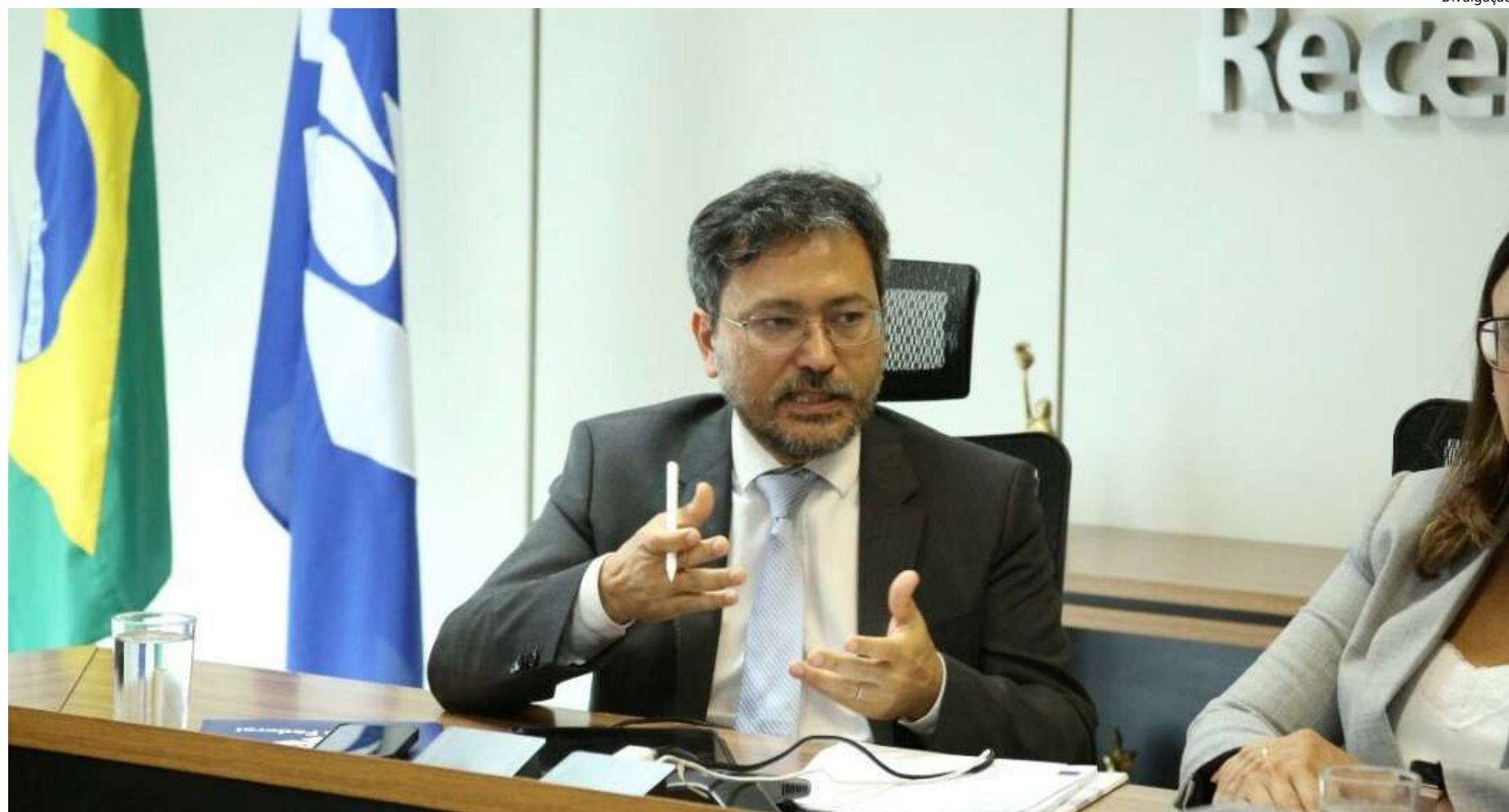
Segundo Barreirinhas, não haverá meio-termo para pessoa física

O secretário deu a declaração ao responder a uma pergunta sobre se o governo pretendia chegar a um meio-termo na taxa de encomendas vindas do exterior. Na semana passada, o Ministério da Fazenda e a Receita anunciaram a intenção de reforçar a fiscalização de encomendas, por meio do preenchimento de uma declaração antecipada da empresa vendedora