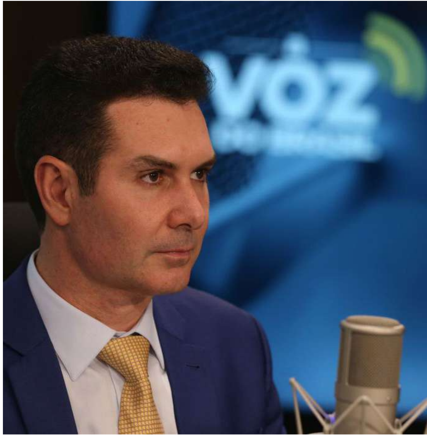
Jader Filho é ministro das Cidades no governo Lula

O governo ampliou os limites de subsídio para moradias do programa, sendo R$ 170 mil para unidades habitacionais em cidades, operadas com fundos de Arredamento Social e Desenvolvimento Social; R$ 75 mil em áreas rurais, operada com recursos da União; e R$ 40 mil para melhorias em unidades localizadas na área rural, com recursos