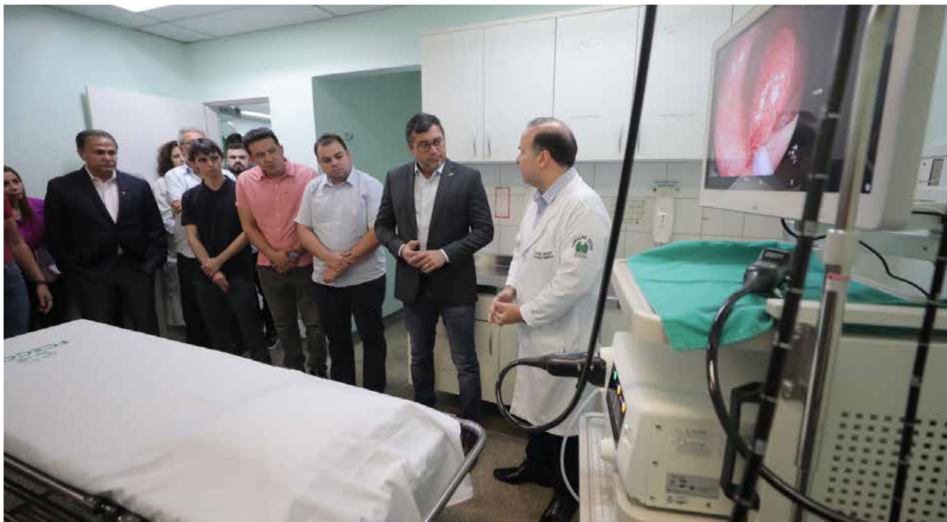
Wilson Lima em visita às dependências da Fcecon que recebeu um novo equipamento de endoscopia