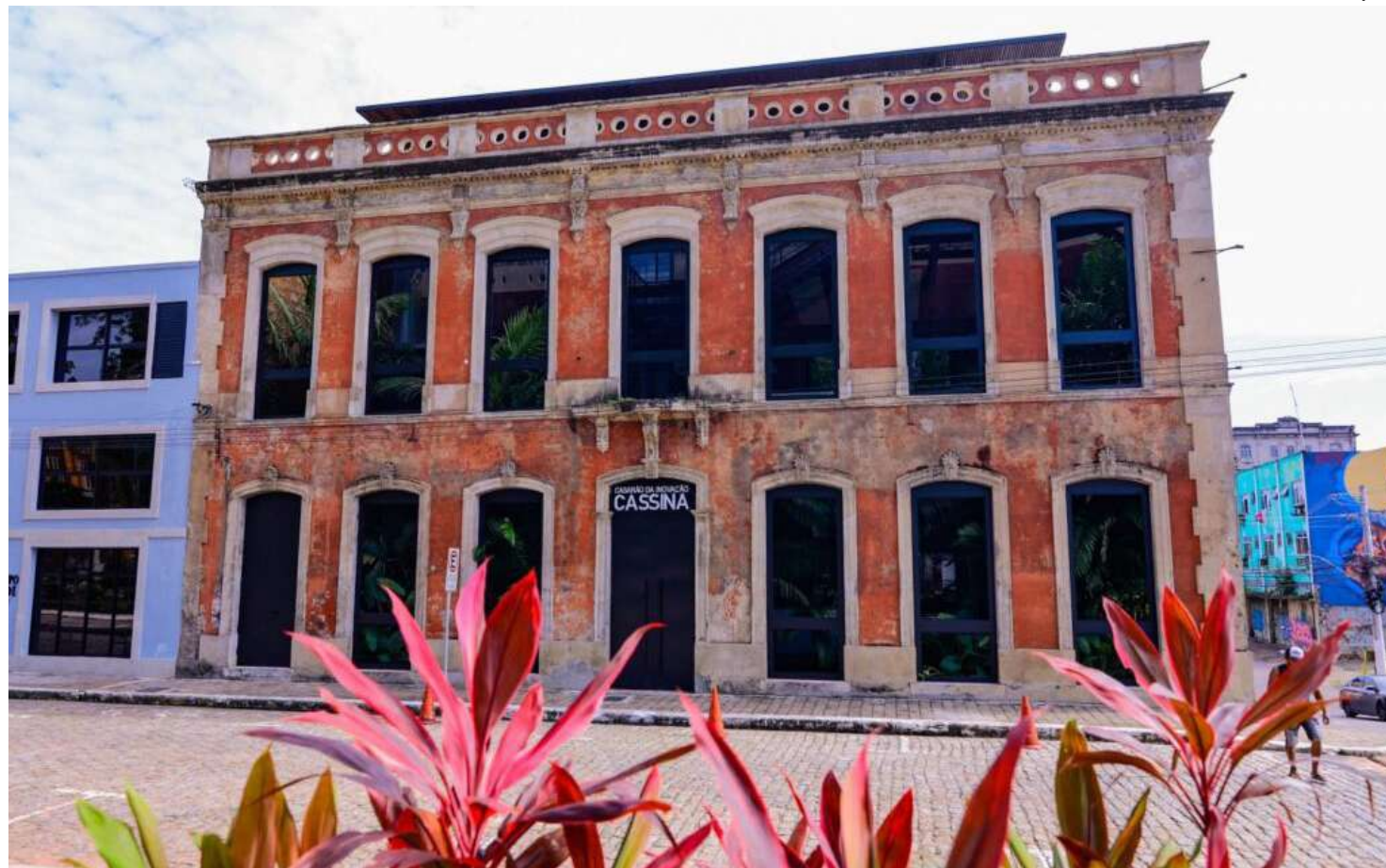
A cidade representa o segundo ciclo na sua morfologia

Com o ‘Nosso Centro’, a gestão municipal tem realizado investimentos no território, tendo iniciado obras com o complexo de São Vicente - mirante Lúcia Almeida, casarão Thiago de Mello e o próprio largo de São Vicente. Também há o projeto aprovado e pronto para licitar o casarão de São Vicente. A interven-