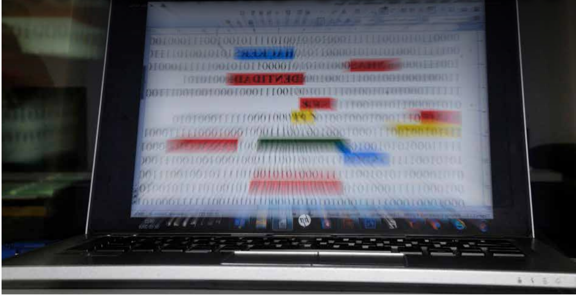
A Convenção busca, entre outras frentes, coibir o acesso doloso e não autorizado à totalidade de um sistema de computador ou à parte dele mediante a violação de medidas de segurança