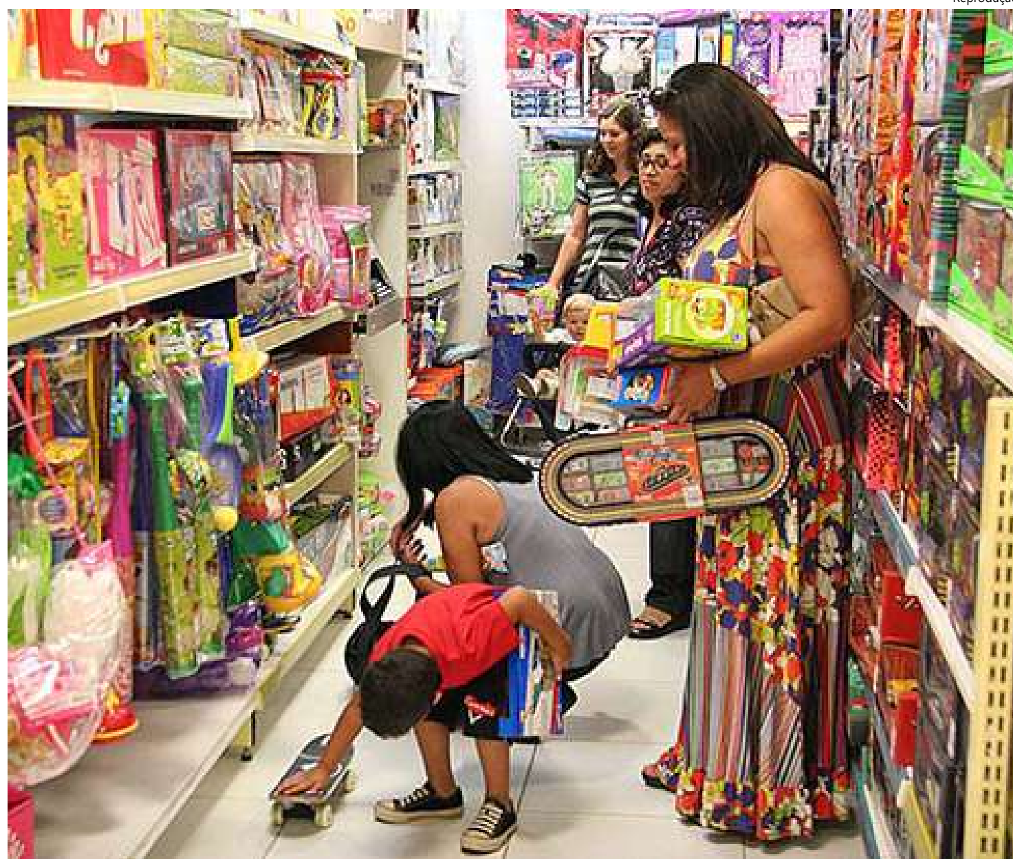
Pesquisa do Procon/AM apontou que crianças influenciam famílias financeiramente no Amazonas

Segundo o diretor-presidente do Procon/AM, com um cenário de acesso vasto à internet, as crianças têm consumido publicidade cada vez mais cedo, mesmo que ela seja proibida para esse público. "De acordo com o Código de Defesa do Consumidor (CDC) a publicidade dirigida a crianças se aproveita da deficiência de julgamento e experiência desse público e, portanto, é abu-