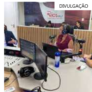
Deputado em entrevista