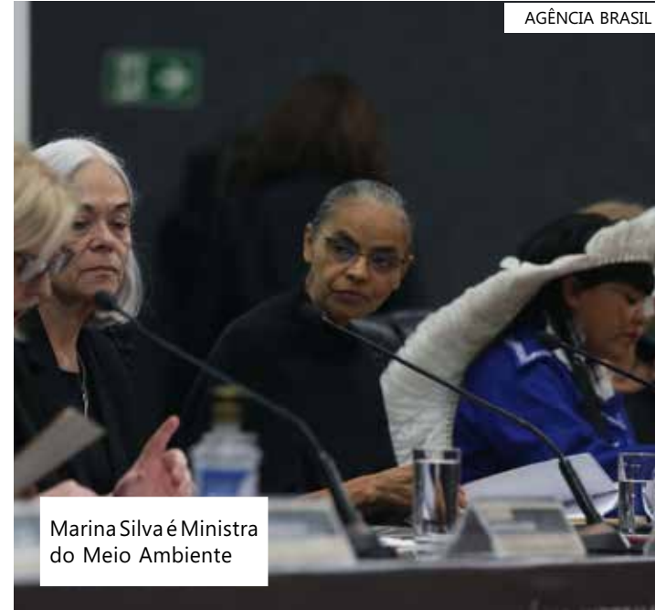
Marina Silva é Ministra do Meio Ambiente