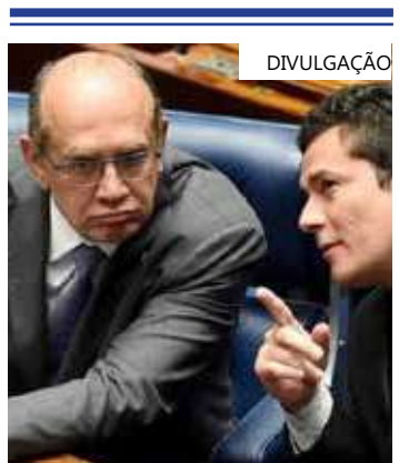
Moro e Mendes no Senado

Em nota, a assessoria de Moro disse que o vídeo foi editado e não revela qualquer acusação contra Gilmar Mendes.