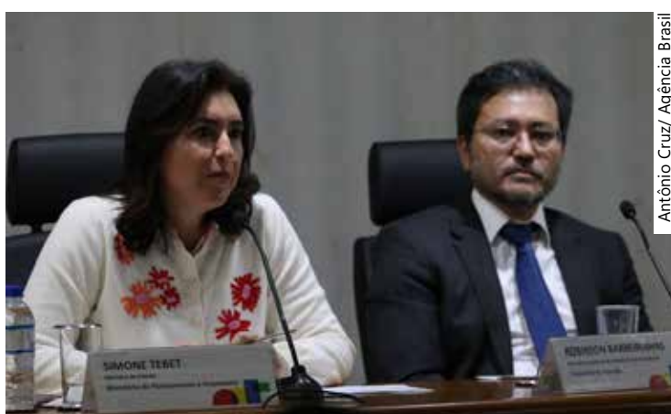
Tebet e Barreirinhas em reunião com a imprensa

Linha de crédito pré-aprovada no cartão, o rotativo incide quando o cliente parcela a fatura ou faz saques na função crédito. Em fevereiro, segundo os dados mais recentes do Banco Central (BC), a taxa dos rotativos subiu 6 pontos percentuais, para 417,4% ao ano.