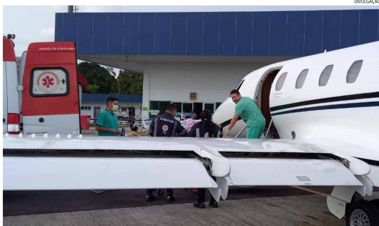
O homem teve de ser transferido para Manaus em uma UTI Móvel

Na ocasião do crime, o homem estava no trabalho após ter almoçado com a companheira. Neste momento, ele recebeu o suco, enviado pela esposa, através de uma mototaxista. Após ingerir a bebida, ele começou a passar mal e sentir fortes dores, tendo um mal súbito.