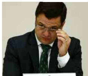
Torres está preso há três meses