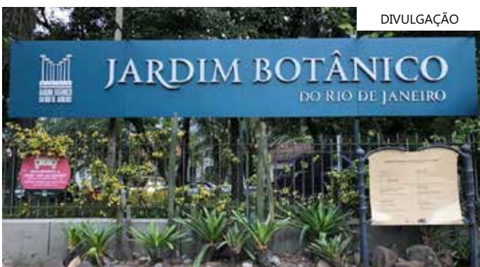
Fachada do Jardim Botânico na capital do Rio de Janeiro

o presidente Luiz Inácio Lula da Silva. Desde o início do governo, Lula tem defendido a criação de um grupo de países neutros para negociar uma saída pacífica entre Rússia e Ucrânia. A guerra já dura mais de um ano, desde que as forças russas invadiram o território ucraniano, em meio a conflitos regionais e à atuação da Organização do Tratado do Atlântico Norte (Otan) em países próximos à fronteira com a Rússia.