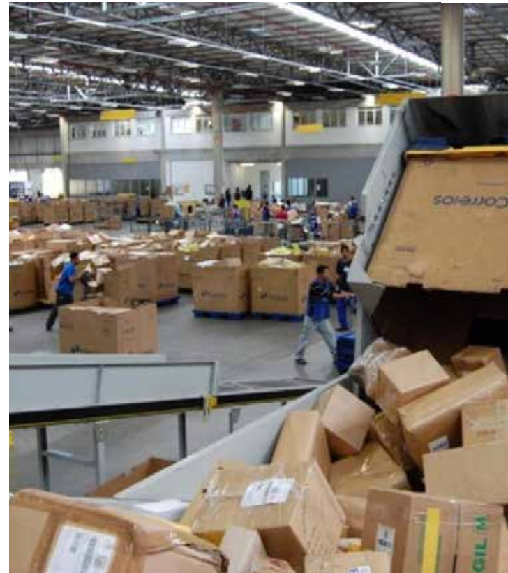
Compras feitas por empresas estrangeiras preocupa consumidores

Barreirinhas reiterou que o novo arcabouço fiscal, que deverá ser enviado ao Congresso nesta terça-feira (18), não prevê aumento de impostos, mas o fechamento de algumas brechas para o não pagamento de tributos. O secretário afirmou que algumas medidas para aumento de arrecadação já foram anunciadas e outras serão divulgadas no segundo semestre.