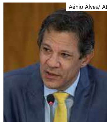
Haddad, Ministro da Fazenda