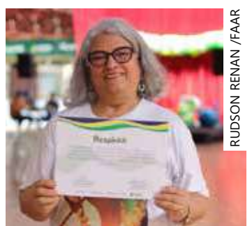
No encerramento das atividades os pacientes receberam certificados