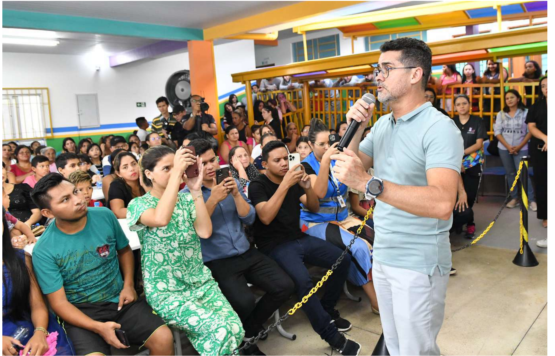
Prefeito David Almeida disse que a meta da prefeitura é que Manaus tenha melhor educação básica do País

dos reparos nas oito salas de aula, troca do telhado, substituição total da parte elétrica e hidráulica, pintura, ampliação da cozinha, biblioteca, sala de informática e depósito de alimentos. Além disso, foi construída uma rampa de acessibilidade coberta e uma praça para entretenimento dos alunos.