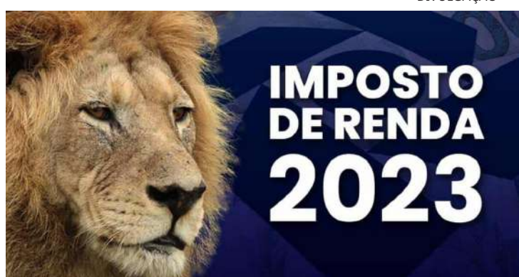
IRPF tem prazos que devem ser observados

to de todos os processos sobre o assunto está suspenso em todo o país por decisão do ministro Luís Roberto Barroso, relator do assunto no Supremo. Ele tomou a decisão depois que o Superior Tribunal de Justiça (STJ) decidiu, em 2018, depois de receber milhares de recursos, unificar o entendimento e manter a TR como índice de correção do FGTS, em decisão desfavorável aos trabalhadores.