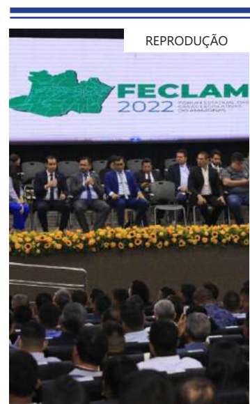
Feclam é realizado na ALEAM