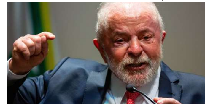
Presidente diz que Brasil não tem espaço para nazistas e fascistas