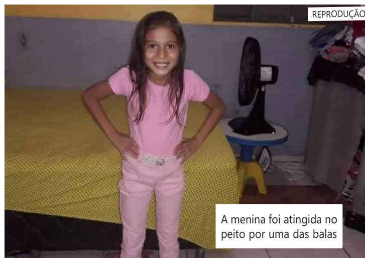
A menina foi atingida no peito por uma das balas