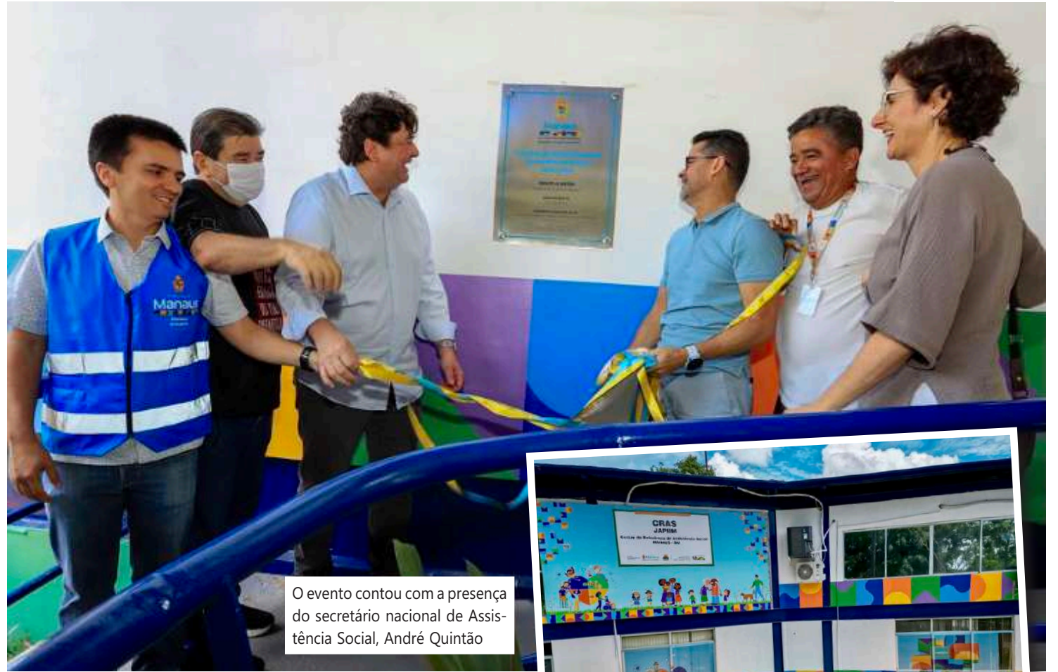
O evento contou com a presença do secretário nacional de Assistência Social, André Quintão

O prefeito solicitou o aporte de recursos do Ministério, buscando ampliar ainda mais os indicadores.