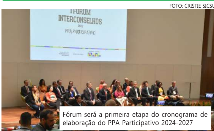
Fórum será a primeira etapa do cronograma de elaboração do PPA Participativo 2024-2027

A meta é realizar encontros com representações nas 27 unidades federativas no primeiro semestre do ano. A proposta vem sendo elaborada de forma conjunta entre o Ministério do Planejamento, Casa Civil, e Secretaria-Geral da Presidência da República, além da contribuição de outros ministérios.