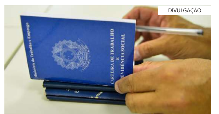
Ação incide sobre fundo reservado para trabalhadores