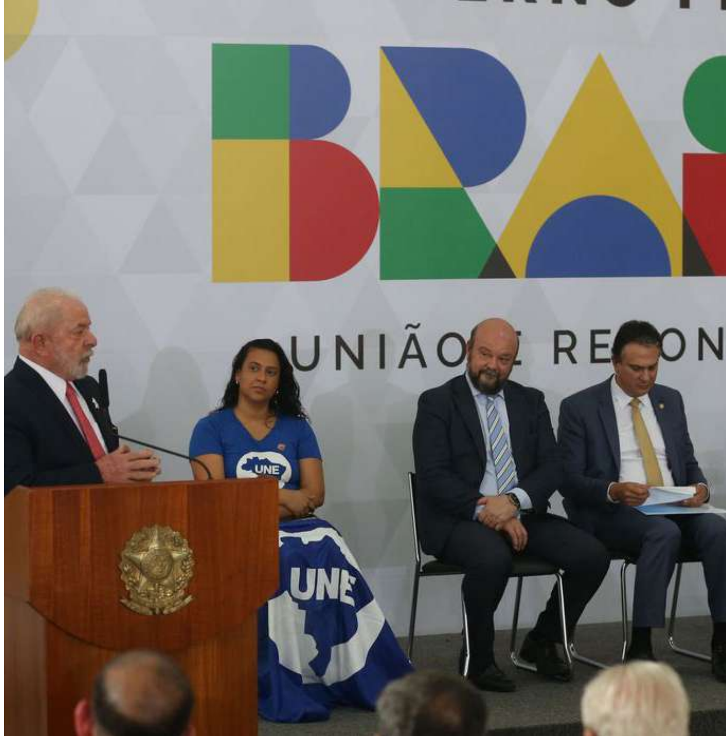
Verba foi viabilizada por emenda do gabinete de transição de Lula