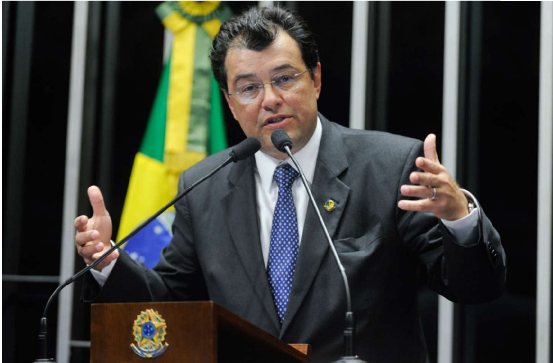
Projeto de Lei do Senador Eduardo Braga inclui novos critérios no cálculo e na distribuição do repasse federal para a merenda escolar

Atualmente, a distribuição é feita com base no Censo Escolar realizado no ano anterior ao do atendimento