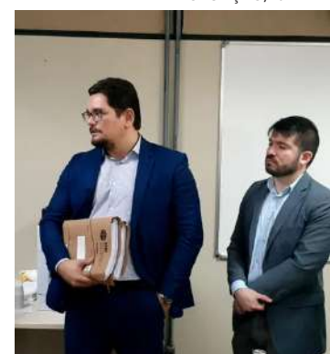
"Vamos atuar dentro de nossas esferas", ressaltou promotor.