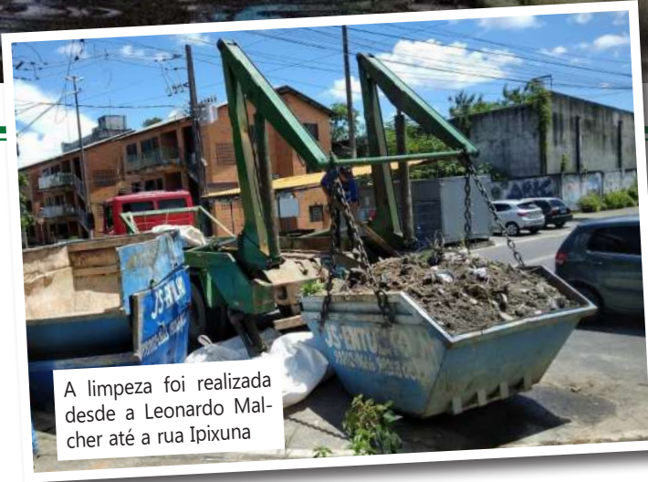
A limpeza foi realizada desde a Leonardo Malcher até a rua Ipixuna