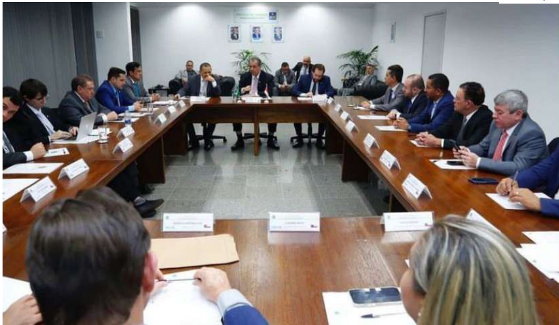
Situação de pecuaristas do Sul do estado preocupa parlamentares

Políticos do Amazonas, incluindo prefeitos da região sul do estado, deputados e senadores, se reuniram nessa terça-feira (18), em Brasília, para discutir uma solução sobre o gado apreendido pelo Instituto Brasileiro do Meio Ambiente e dos Recursos Naturais Renováveis (Ibama) em terras consideradas ilegais pelo órgão, no Sul do Estado.