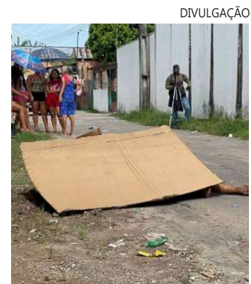
Populares ouviram tiros e foram ver do que se tratava

O corpo do homem será encaminhado para o Instituto Médico Legal (IML) para o exame de autópsia.