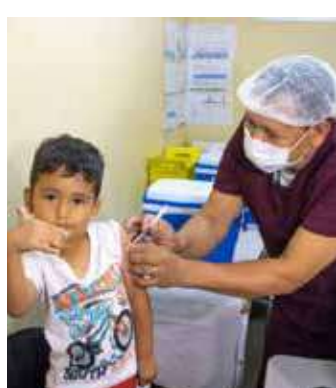
O esquema vacinal é de apenas uma dose

O esquema vacinal é de apenas uma dose, podendo ser feito até os 59 anos de idade. Porém, a recomendação é que as crianças sejam vacinadas, preferencialmente, aos 9 meses de vida, podendo receber uma dose