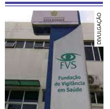
Boletim é feito pela FVS-AM

nal de Imunização (PNI), 9.189.580 doses foram aplicadas em todo o estado até esta quarta-feira (31/05), sendo 3.435.848 de primeira dose, 2.907.124 de segunda dose, 77.479 com dose única, 1.820.952 de 1ª dose de reforço, 739.846 de 2ª dose de reforço, 9.408 de dose adicional para os imunossuprimidos e 198.923 doses de vacina bivalente.