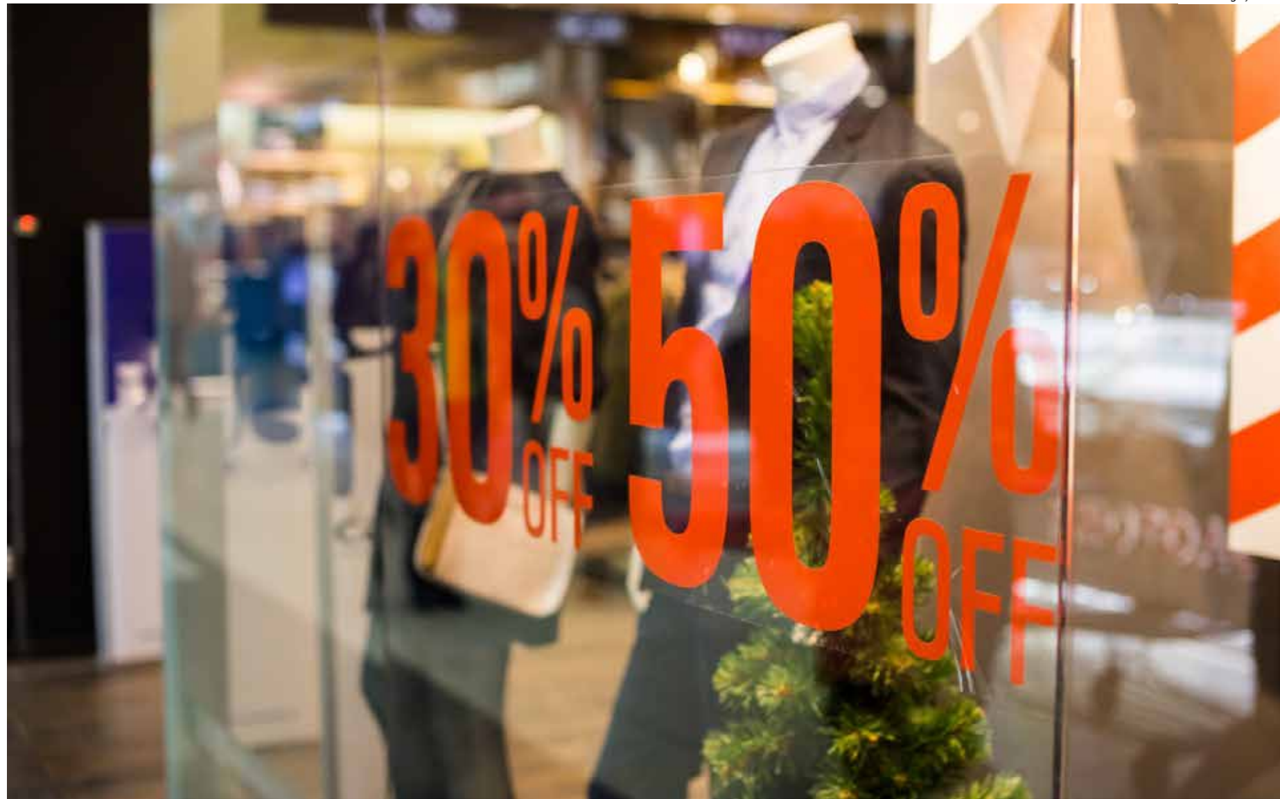
A sondagem foi realizada com gerentes, proprietários e líderes de setores de venda das empresas varejistas

Das formas de pagamento, confirmando as preferências apontadas pelo Ifpeam na Pesquisa de Intenção de Compras para o Dia das Mães, o cartão de crédito parcelado foi o meio mais utilizado pelos clientes, com 48% das respos-