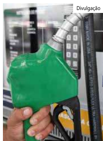
Cobrança inicia nesta quinta-feira

alíquota média de ICMS que os estados praticam hoje. Tive acesso a cálculos de especialistas do setor que variam de R$ 0,16 a R$ 0,20 o aumento para o consumidor na bomba", diz Pedro Faria, economista e pesquisador do Centro de Desenvolvimento e Planejamento Regional da Universidade Federal de Minas Gerais (Cedeplar-UFMG). Ele avalia que a mudança gera simplificação tributária e reduz o espaço para a guerra fiscal entre os estados.