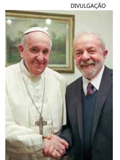
Conversa foi pelo telefone

Segundo o Planalto, Lula deve visitar o Vaticano para uma reunião com o Papa em junho ou julho deste ano.