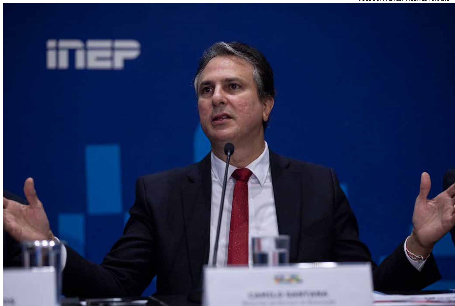
O ministro da Educação, Camilo Santana (foto), comentou o baixo desempenho

A pesquisa Alfabetiza Brasil foi realizada pelo Insti-