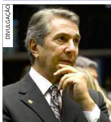
Collor está sem mandato

O Supremo Tribunal Federal (STF) condenou o ex-senador e ex-presidente Fernando Collor a 8 anos e 10 meses de prisão por corrupção passiva e lavagem de dinheiro em um dos processos da Operação Lava Jato. Apesar de decisão, Collor pode recorrer em liberdade.