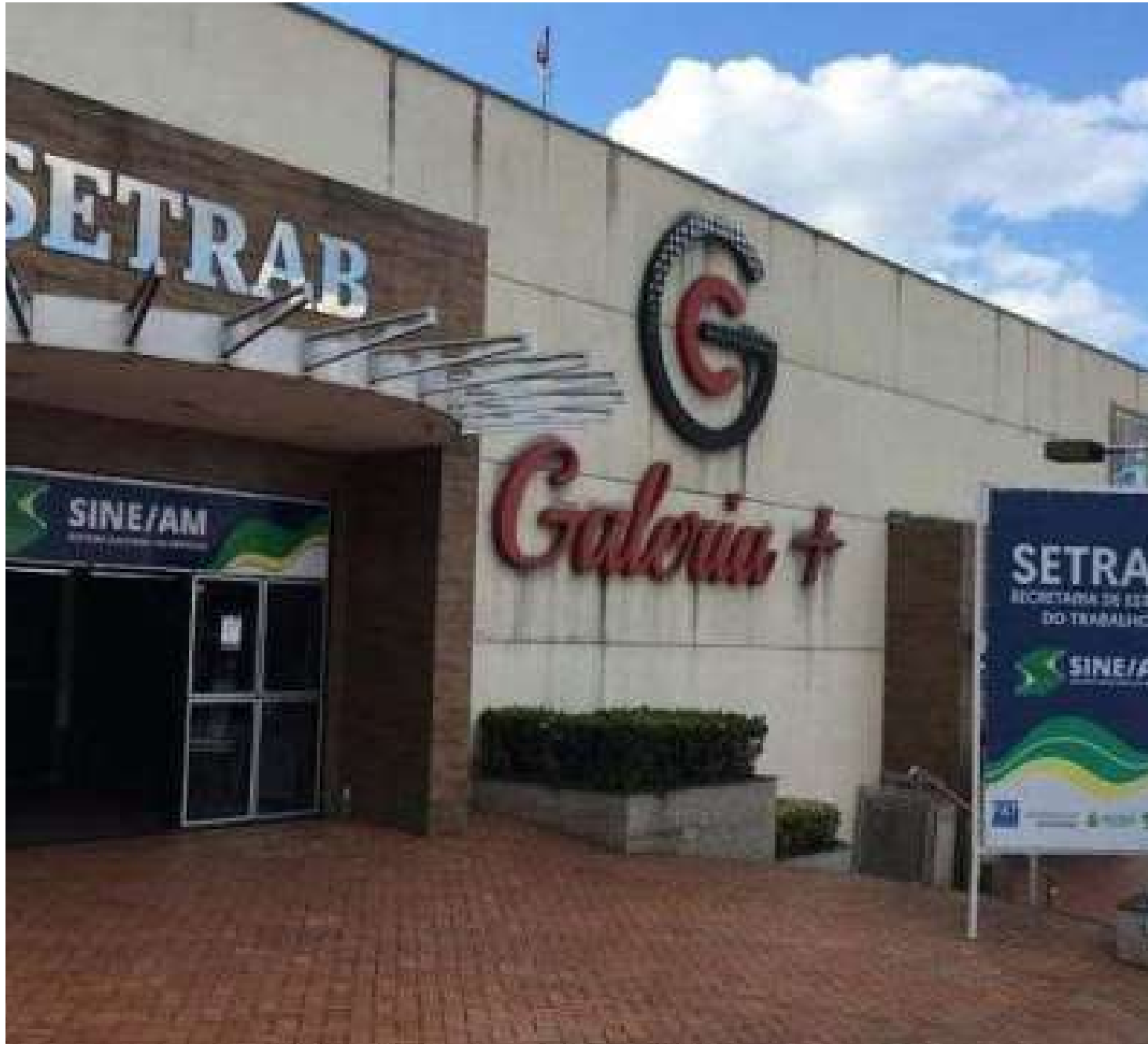
Sine Amazonas funciona na Galeria+, no bairro São Geraldo, zona Oeste de Manaus

O candidato também poderá concorrer às vagas acessando o Portal do Trabalhador ( www.portaldotrabalhador.am.gov.br ), no qual irá anexar o currículo na vaga pretendida. Caso esteja dentro do perfil, a equipe de