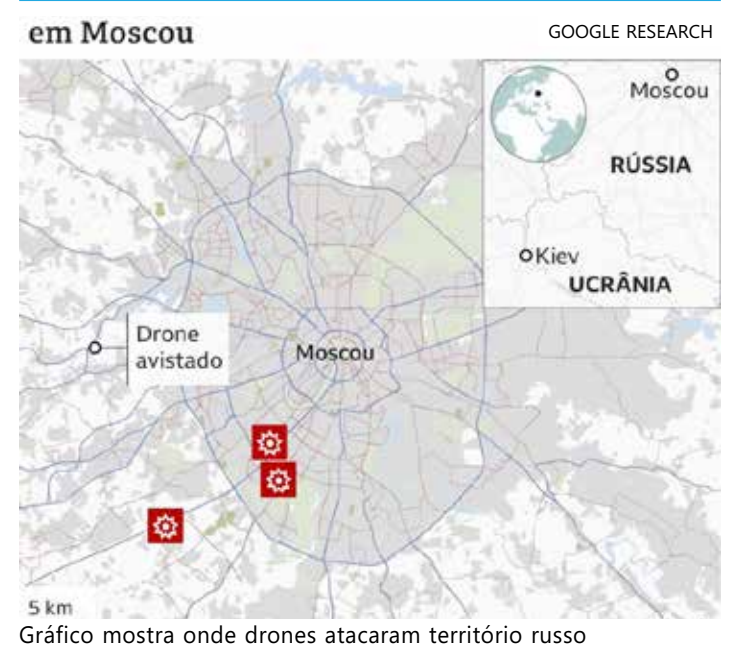
Gráfico mostra onde drones atacaram território russo

"Três deles foram suprimidos por interferência eletrônica, perderam o controle e foram desviados dos alvos previstos. Outros cinco drones foram abatidos pelo sistema de mísseis terra-ar Pantsir-S na região de Moscou", informou o ministério em comunicado.