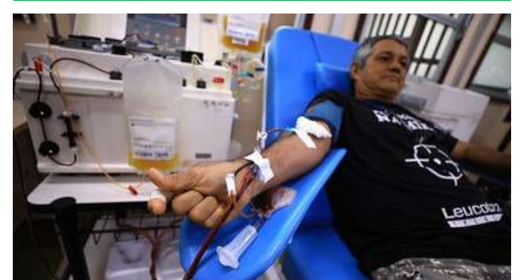
O hemoam oferece serviços para os doadores durante o mês de junho

As doações podem ser realizadas de segunda a sábado, das 7h às 18h, na sede do Hemoam, na avenida Constantino Nery, número 4.397, bairro Chapada.