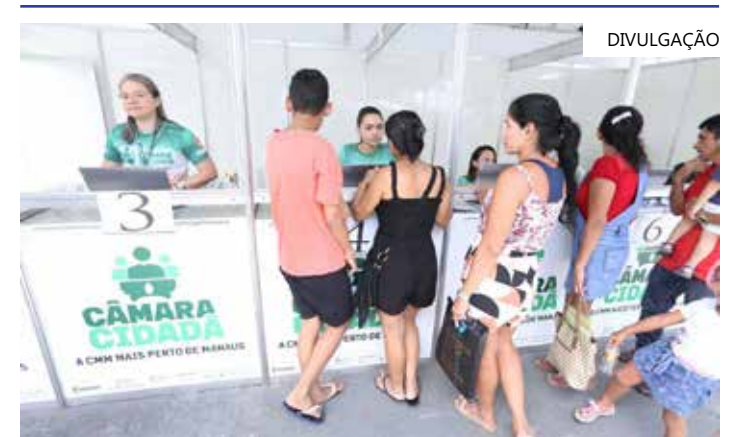
Câmara Cidadã começou na quarta-feira (31)