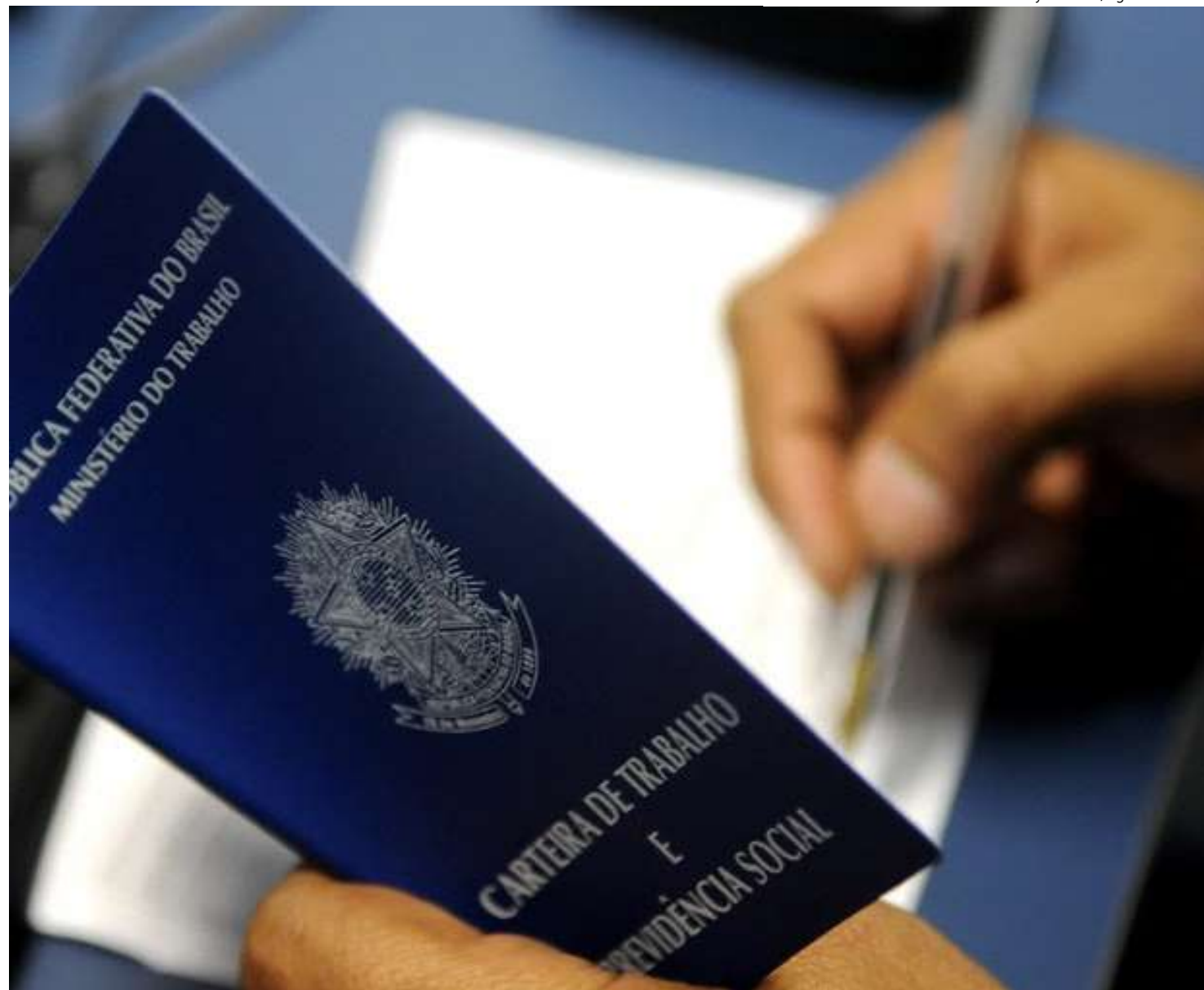
Redução do número de desocupados é de 19% na comparação com o mesmo período do ano passado.