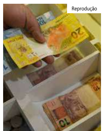
O Pix foi responsável por 12% das transações.

Segundo o estudo, em relação ao valor médio das operações "há uso preponderante do Pix e dos cartões (especialmente o pré-pago) nas transações de valor mais baixo, indicando seu papel importante na inclusão financeira, deixando as transferências tradicionais como principais opções para transações corporativas, de valores substancialmente mais altos".