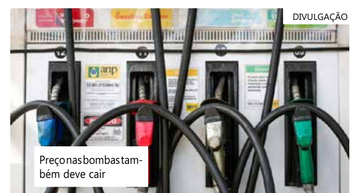
Preço nas bombas também deve cair

Os preços da Ream seguem critérios objetivos e transparentes de paridade internacional e são ajustados e divulgados aos distribuidores semanalmente, conforme variações dos preços do petróleo e seus derivados no mercado internacional, além de alterações do câmbio e dos custos de frete do petróleo e insumos para a região.