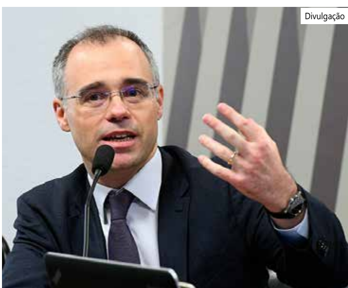
Ministro André Mendonça

Na decisão em que derribou sua própria liminar, Mendonça escreveu ainda que, com o julgamento por unanimidade no STJ, "a plausibilidade do argumento da União pela equidade da interpretação efetuada pelos contribuintes ganhou força", motivo pelo qual não se justificaria a medida cautelar.