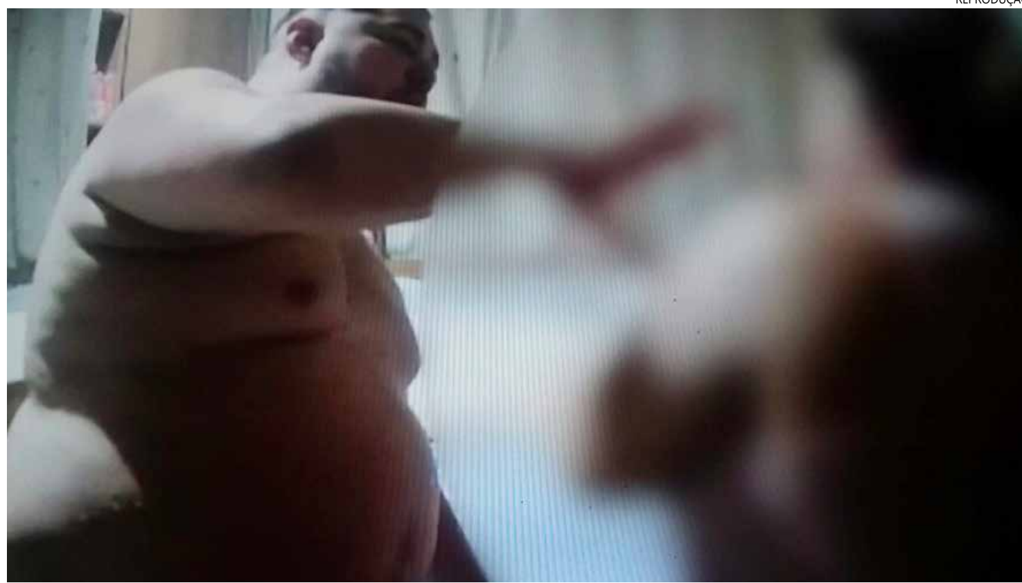
O homem ainda intimidou a vítima a não realizar a denúncia formalmente na frente dos policiais

A mulher recebeu medida protetiva da justiça, isso significa que o agressor deve ficar afastado do lar ou local de convivência com a vítima. Ela foi retirada da casa onde morava, no residencial Viver Melhor 3, e está em um local seguro.