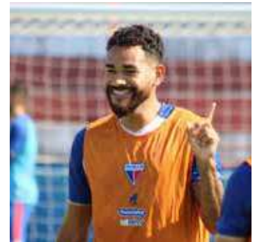
Último clube do jogador foi o Sabah FA, da Malásia