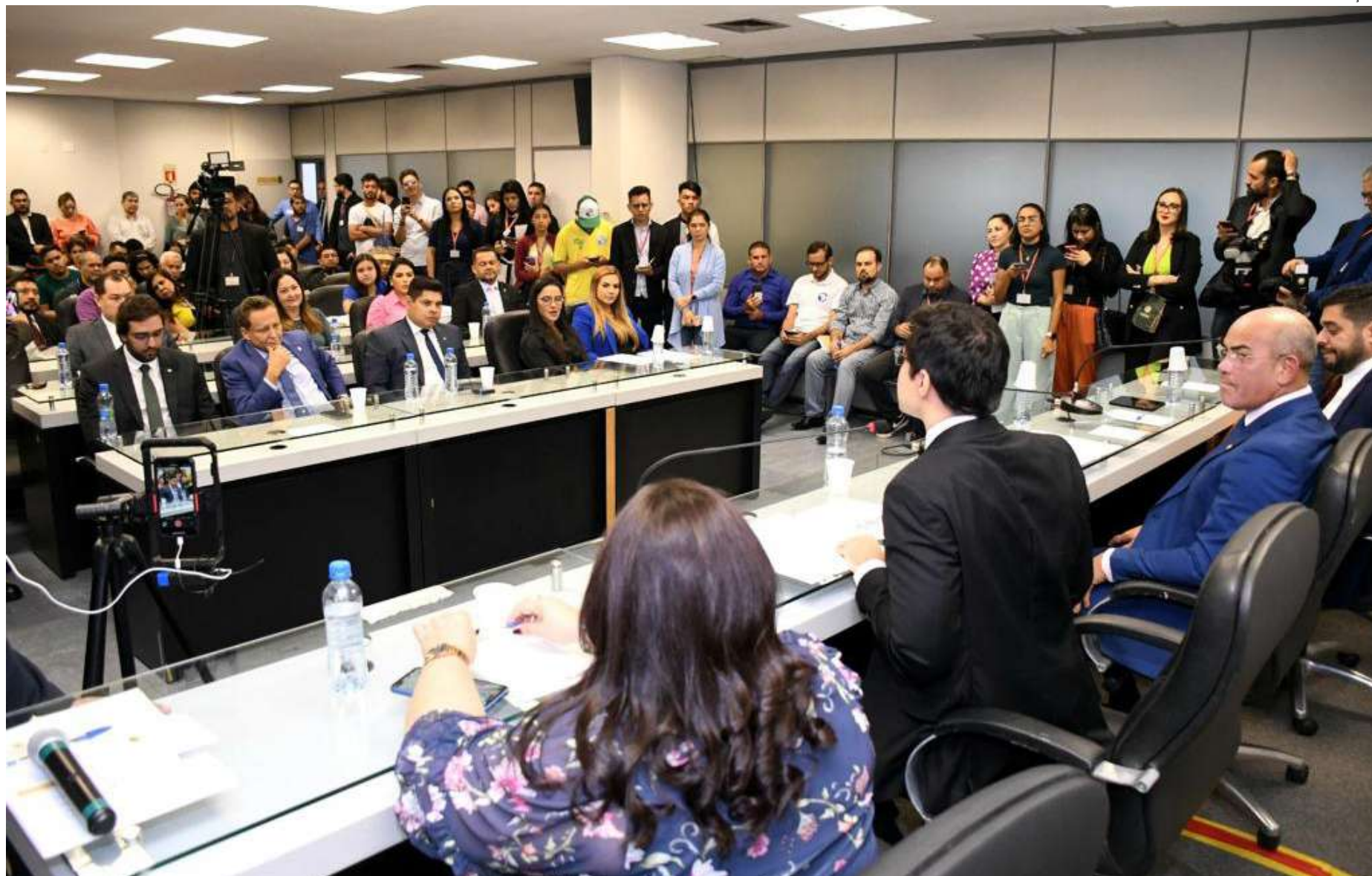
O Tema sobre o sistema de cotas da Universidade do Estado do Amazonas foi debatido na Assembleia Legislativa do Amazonas