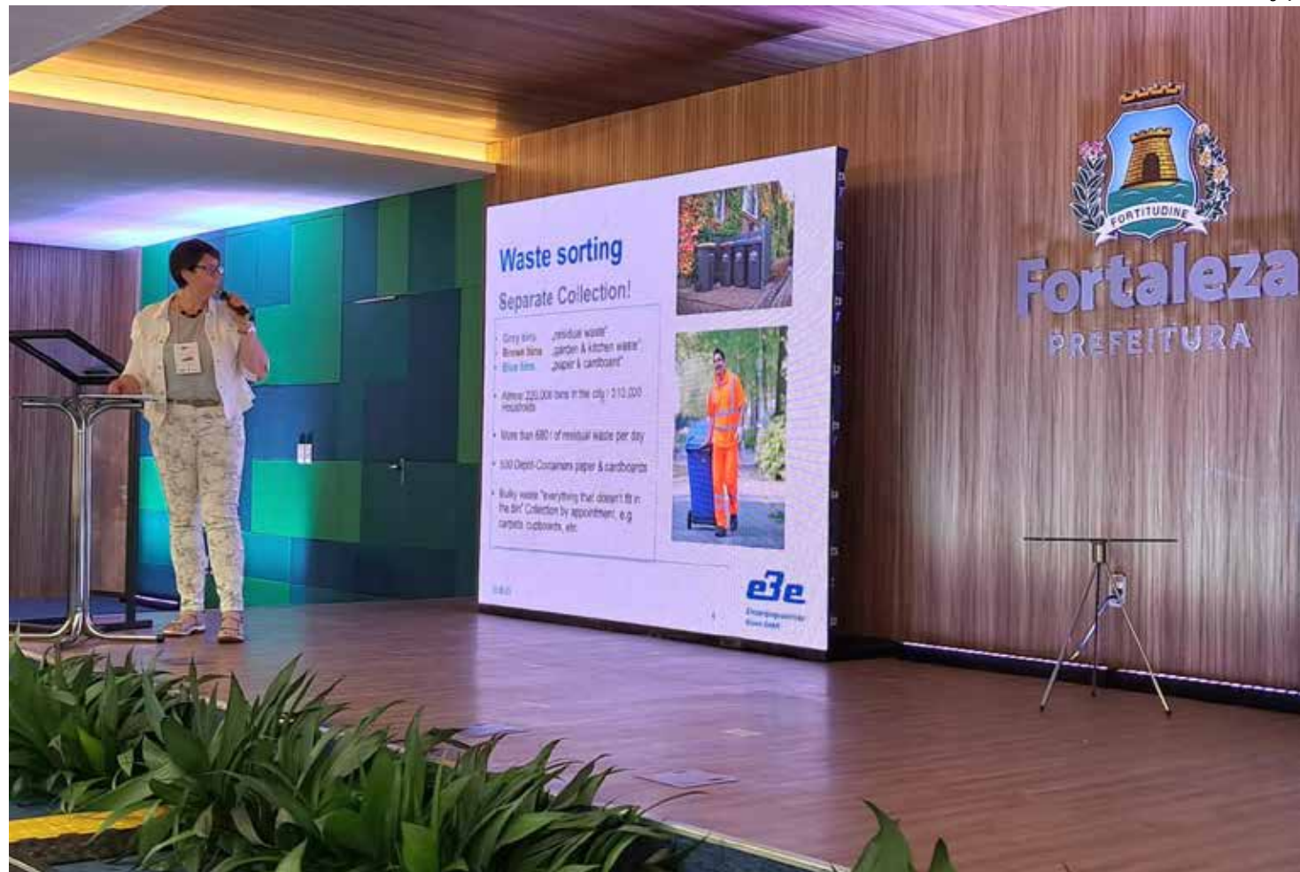
Evento acontece em Fortaleza, capital do Ceará

Manaus e Fortaleza fazem parte do Iurc América Latina desde 2021, quando foram cidades selecionadas pela União Europeia para compartilhar experiências e