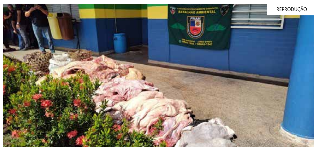
Dois homens foram presos e autuados pelos órgãos ambientais

nes de paca, queixada, anta, veado e mutum. Todo o produto, que totalizou 781 quilos, foi apreendido. Os responsáveis pela comercialização, dois homens de 63 e 52 anos, foram presos e encaminhados à delegacia da Polícia Civil, onde foram apresentados pela prática de crimes ambientais, além de terem sido autuados pelos órgãos ambientais.