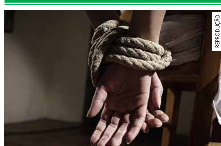
Ela desconfiou que o namorado estava furtando seu dinheiro