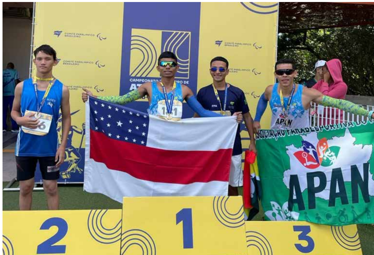
O velocista contou com apoio do Governo do Amazonas em passagens aéreas para participar da competição