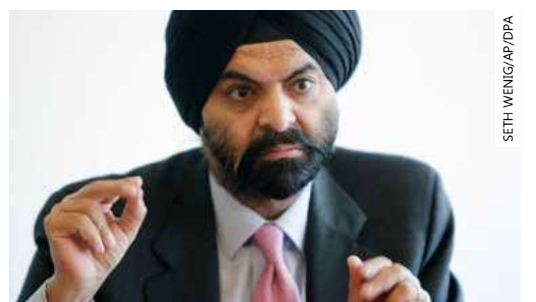
Ajay Banga tem 63 anos e já foi presidente da Mastercard

Seus apoiadores consideraram que o fato de ter crescido na Índia deu ao empresário uma perspectiva única sobre as formas como o Banco Mundial poderá cumprir os objetivos de reduzir a pobreza no mundo.