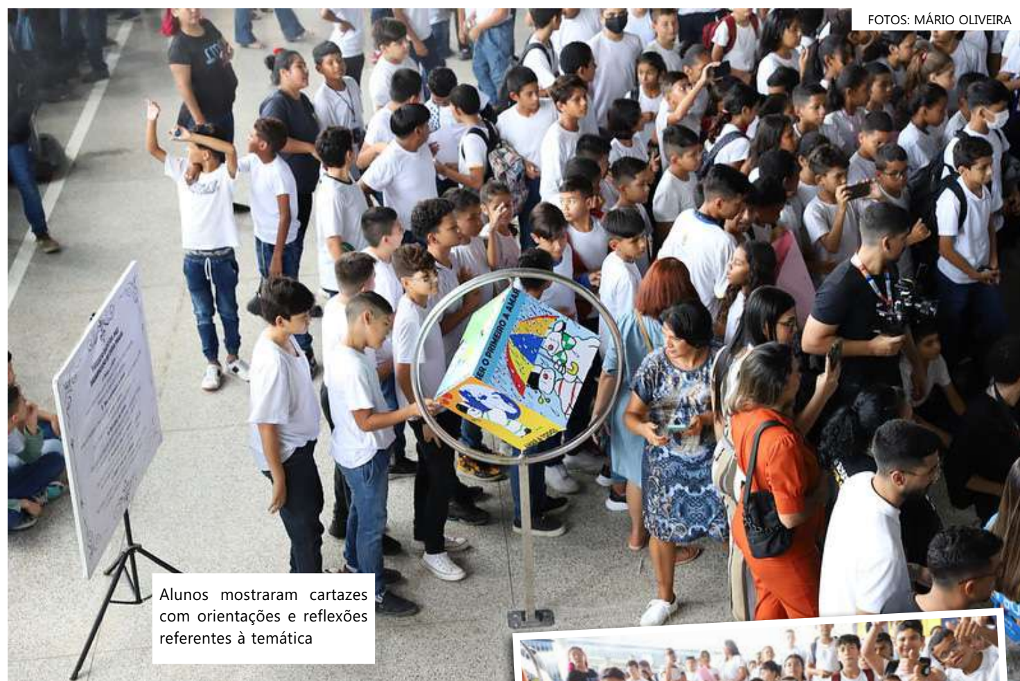
Alunos mostraram cartazes com orientações e reflexões referentes à temática

"Esse momento é muito importante em se falando de paz, sendo muito essencial, porque o nosso mundo precisa de muita paz. O nosso Salvador Jesus Cristo já disse: 'Eu te dou a minha paz'. Nós podemos ter paz com os colegas, na escola, em casa, respeitando e não ultrapassando os limites, não fazendo gracinha com o colega que não gosta. Viver em paz é muito bom. Que