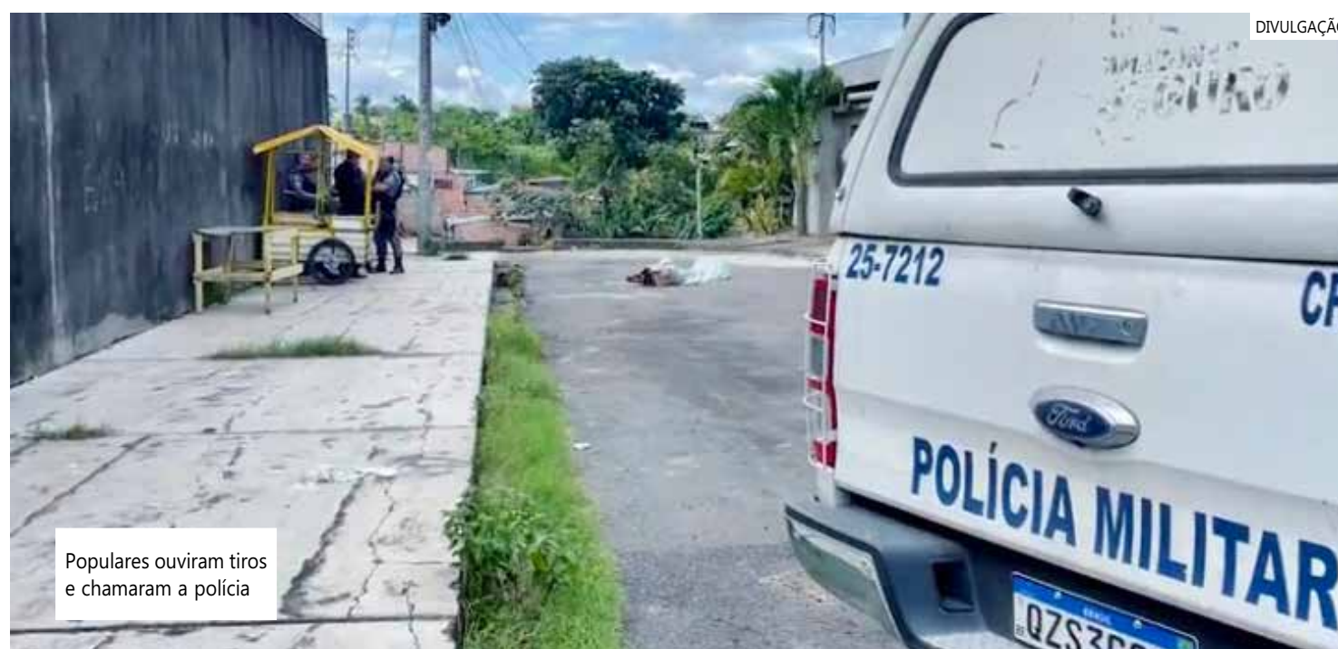
Populares ouviram tiros e chamaram a polícia

O Departamento de Polícia Técnico-Científico (DPTC) foi acionado para realizar a perícia criminal em torno do homicídio. O caso deve ser investigado pela Delegacia Especializada em Homicídios e Sequestros (DEHS).