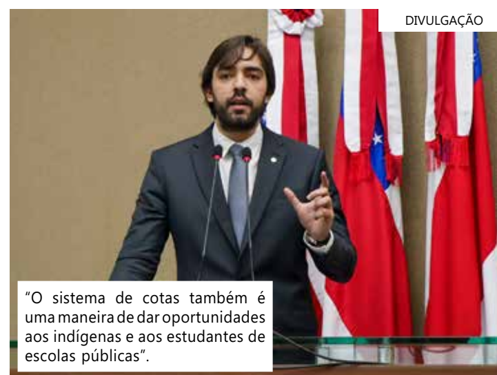
"O sistema de cotas também é uma maneira de dar oportunidades aos indígenas e aos estudantes de escolas públicas".

dos pela UEA permanecem no estado e isso gera desenvolvimento e renda. "Quando a UEA forma os alunos, são eles quem ficam aqui. São eles quem nos dão essa condição. Hoje, o interior do estado vive uma dificuldade muito grande por conta da ausência de médicos. Os poucos médicos do que atendem no interior vêm da UEA", disse.