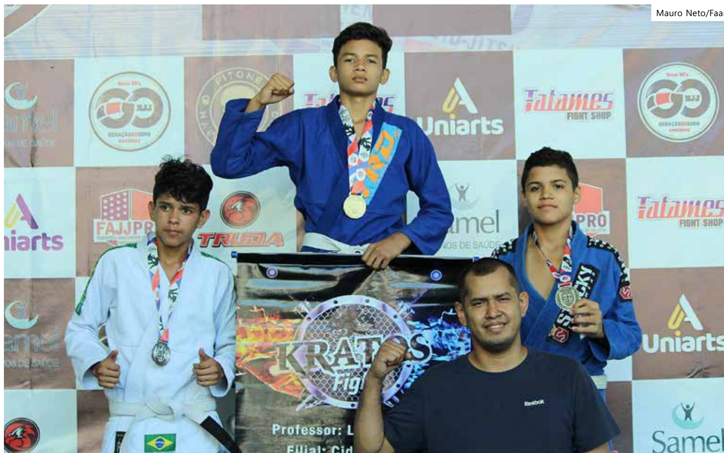
O evento acontece no dia 17 de junho, a partir das 9h, no ginásio Bergão

Inscrições - As inscrições, alterações e pagamentos