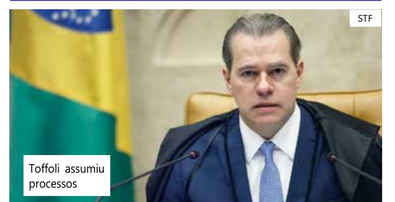
Toffoli assumiu processos

Toffoli também determinou que cópias de todos procedimentos que estiverem na vara e tenham relação com o caso sejam enviados ao STF.