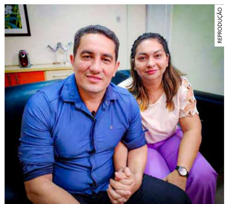
Primeira dama também foi presa