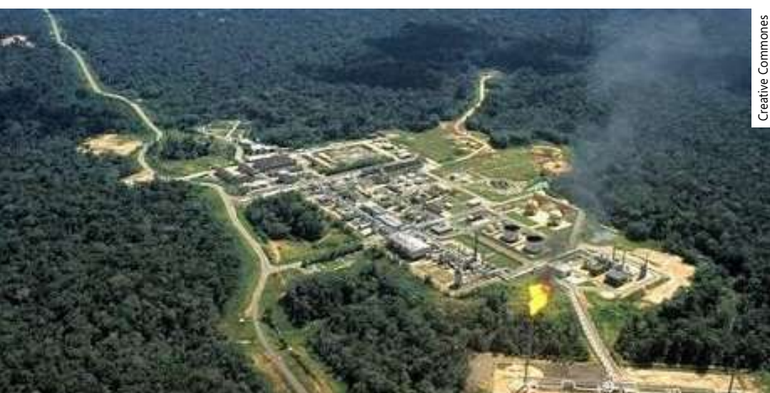
Cade é um órgão federal

privada de gás natural do Brasil e uma empresa integrada de energia, que atua desde a exploração e produção (E&P) do gás natural até o fornecimento de soluções de energia. A companhia possui ativos de E&P nos estados do Amazonas e Maranhão, além de blocos exploratórios na Bacia do Paraná. Atualmente, opera 11 campos de gás natural nas Bacias do Parnaíba (MA) e Amazonas (AM). Adicionalmente, possui nestas regiões uma área total sob concessão superior a 60 mil km 2 .