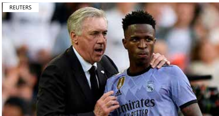
Ancelotti espera que Vini Jr siga no clube, apesar dos insultos

"Acho que está obsoleto [o protocolo]. Porque tinha que ser aplicado na hora em que se chega de ônibus. É ali que começam os xingamentos e caem os argumentos de que Vinícius é provocador. Não são casos isolados, como já dissemos há muito tempo. Não são 46 mil, mas também não são um ou dois. Duas horas antes já estavam insultando", afirmou o técnico.