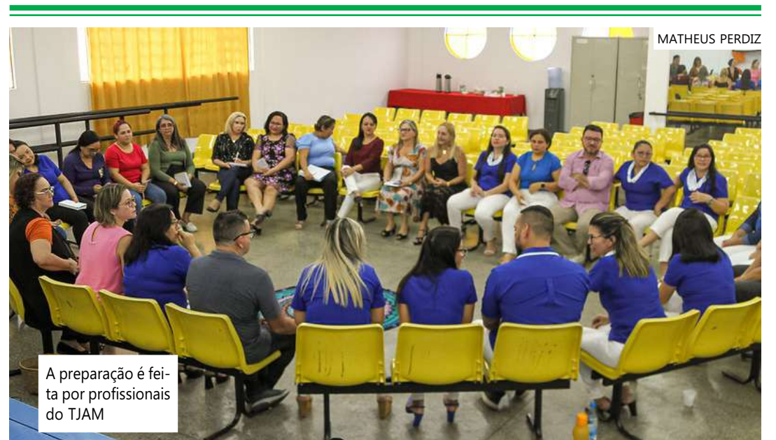
A preparação é feita por profissionais do TJAM

“Nós conhecemos essa prática, ela é de suma importância, pois difunde dentro do ambiente escolar a cultura de paz, o diálogo como ferramenta de solução de possíveis conflitos. Essa é a ideia, levar essa prática para os nossos alunos e profissionais da educação”, comentou a assessora pedagógica do Nú-