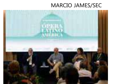
A programação aconteceu no Centro Cultural Palácio da Justiça

A reunião de artistas, produtores de ópera e gestores de espaços culturais da cena lírica de várias partes do mundo, na capital amazonense, reflete a importância do Festival Amazonas de Ópera e a relevância creditada à produção lírica amazonense. Produzir de maneira colaborativa entre os países da América Latina foi um dos principais objetivos dos diálogos do evento, o que é indispensável para o caráter de coletividade das movimentações artísticas, na opinião da maioria dos participantes da OLA.