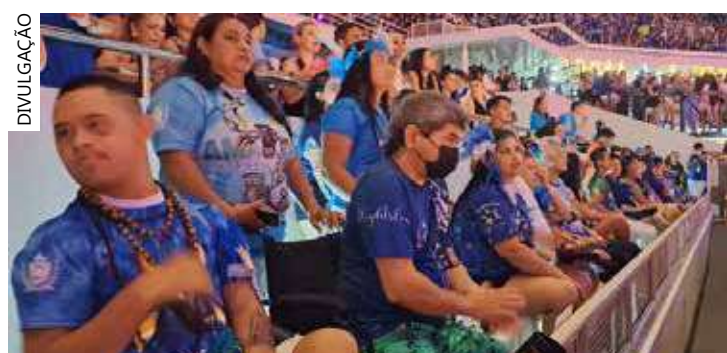
Benefício também dará direito a um acompanhante por pessoa

Serão disponibilizados 60 lugares para 30 PcDs, cada um com direito a um acompanhante, sendo 15 vagas para residentes de Parintins e 15 para residentes dos demais municípios do Amazonas.