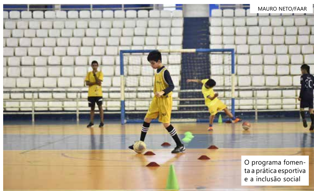
O programa fomenta a prática esportiva e a inclusão social