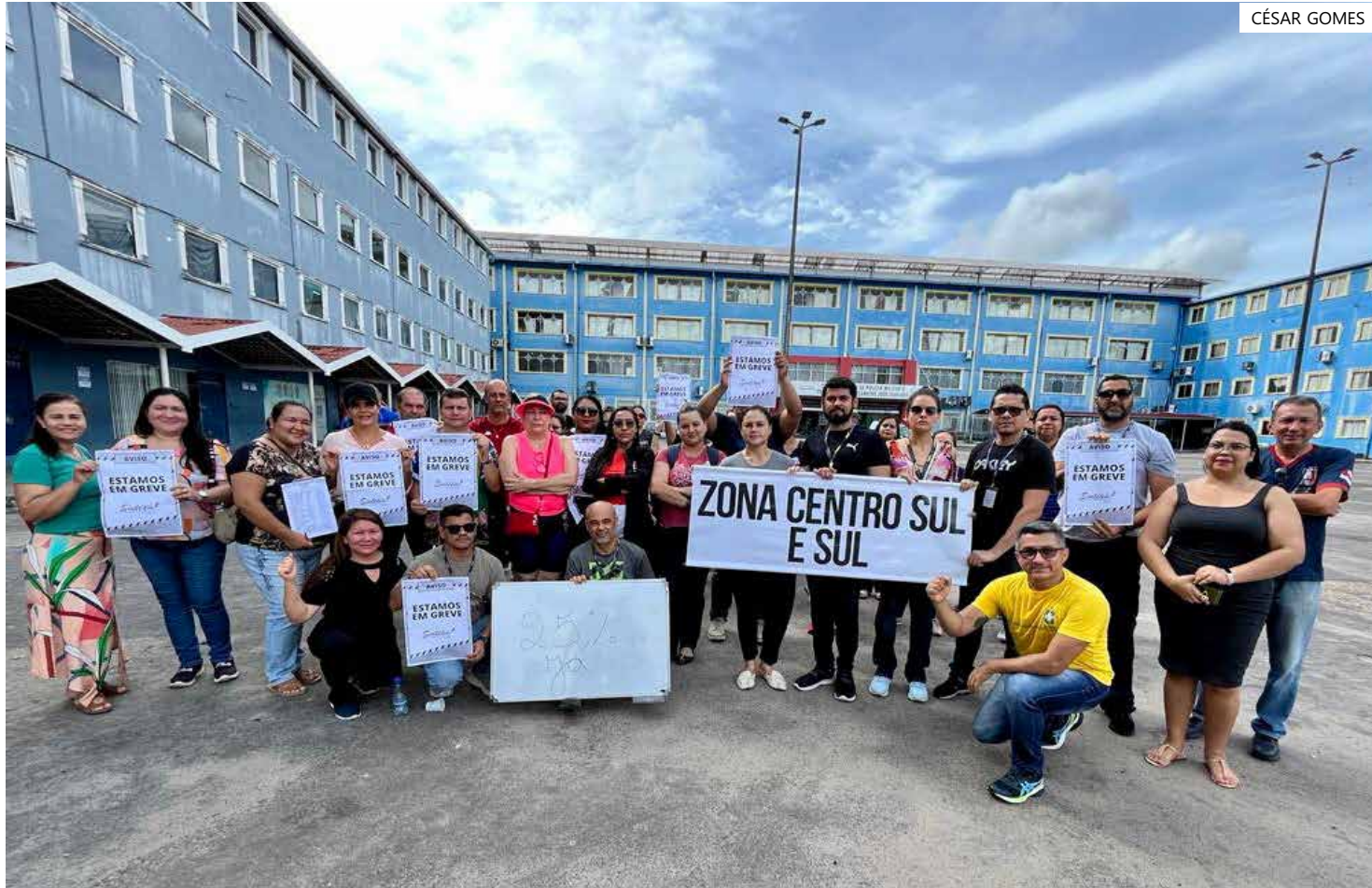
Educadores se reuniram na frente do Colégio da Polícia Militar, no bairro Flores e em várias zonas da cidade

Na região Centro-Sul da capital, os educadores se reuniram na frente do Colégio Militar da Polícia Militar (CMPM V), situado nas dependências da universidade Nilton Lins, no bairro Flores. No local, os profissionais pediam atenção do governador do Amazonas,