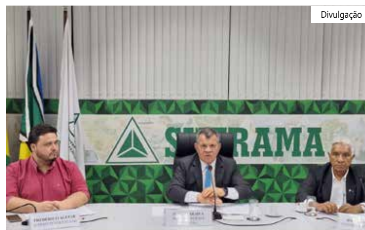
Conselho de administração aprova projetos para Zona Franca de Manaus