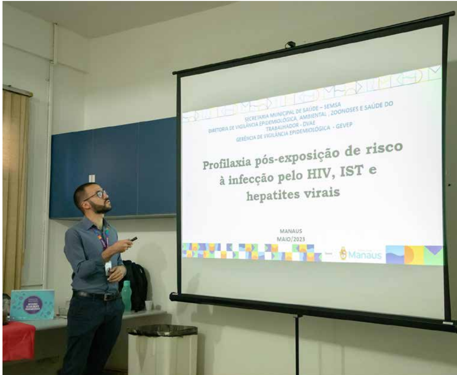
Capacitação acontece em Manaus

"A implantação da PEP é uma forma de ampliar as ações de controle e prevenção ao HIV que a Prefeitura de Manaus já oferece para a população. As quatro unidades de saúde possuem uma estrutura específica de atendimento e a capacitação vai ajudar na construção de um fluxo interno para o atendi-