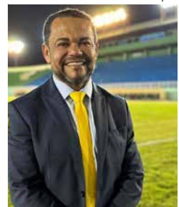
Para Rozenha, o racismo no esporte pode destruir sonhos e talentos