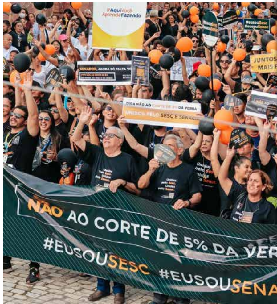
Mobilização dos trabalhadores do Sesc senac em Manaus