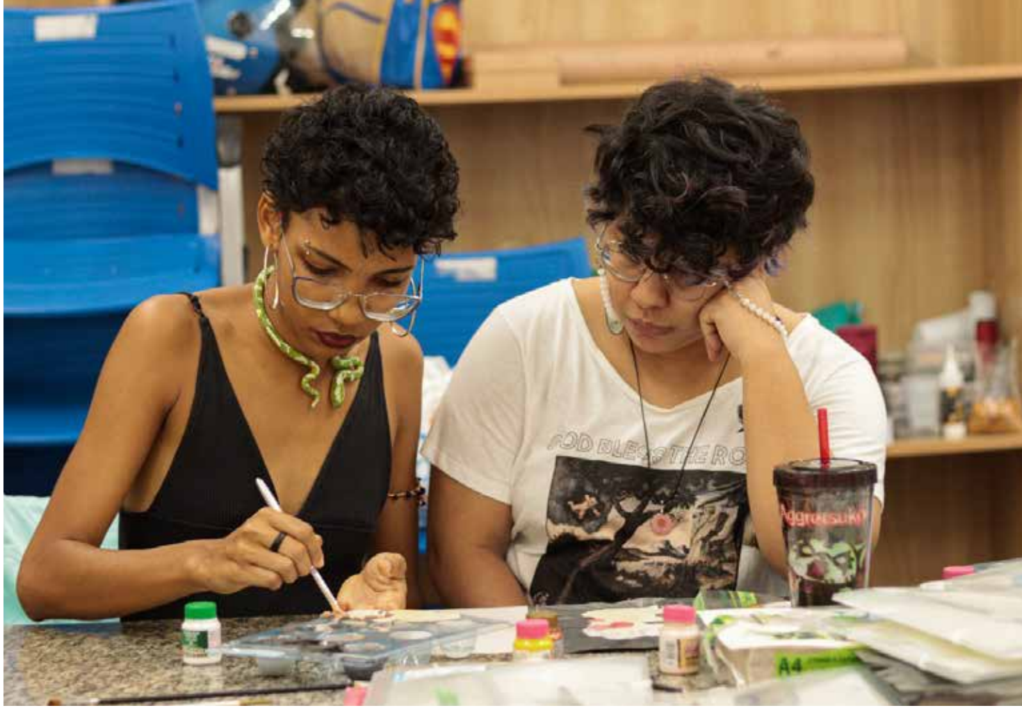
O evento acontece no Centro de Convivência da Família (CDC) Padre Vignolia, na Cidade Nova

No evento serão entregues ainda os certificados dos desenhistas, assim como um 'pack' de adesivos de obras expostas.