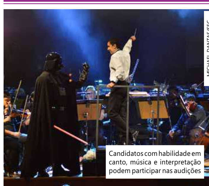
Candidatos com habilidade em canto, música e interpretação podem participar nas audições

O elenco selecionado irá compor o espetáculo "Divaland", que integra a programação da Série Encontro das Águas, projeto que une o erudito ao pop, protagonizado pelos Corpos Artísticos da Secretaria de Cultura e Economia Criativa. O projeto acontece