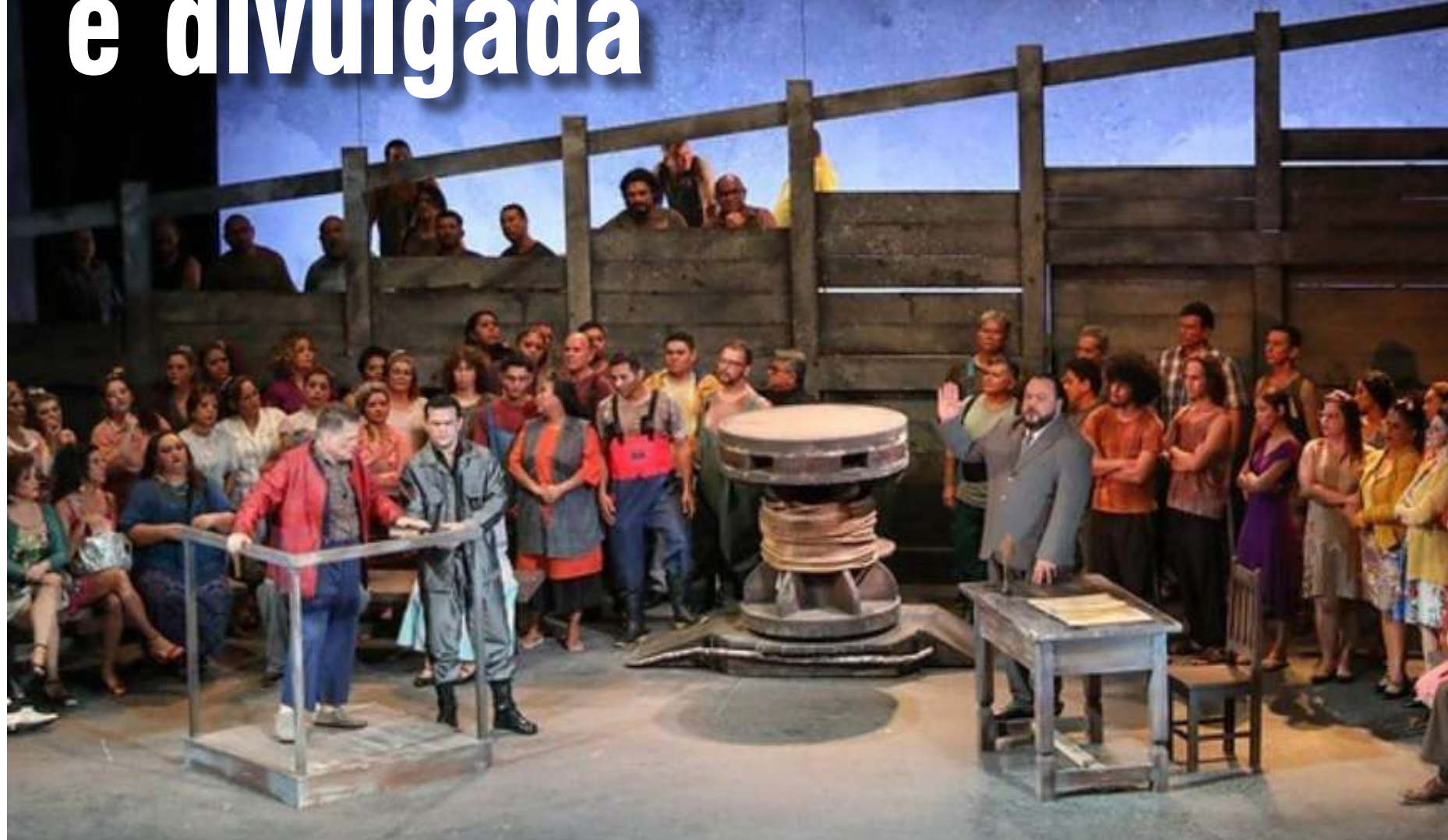
O anúncio foi dado durante o encerramento da 25ª edição do festival, no último domingo (28), no Teatro Amazonas