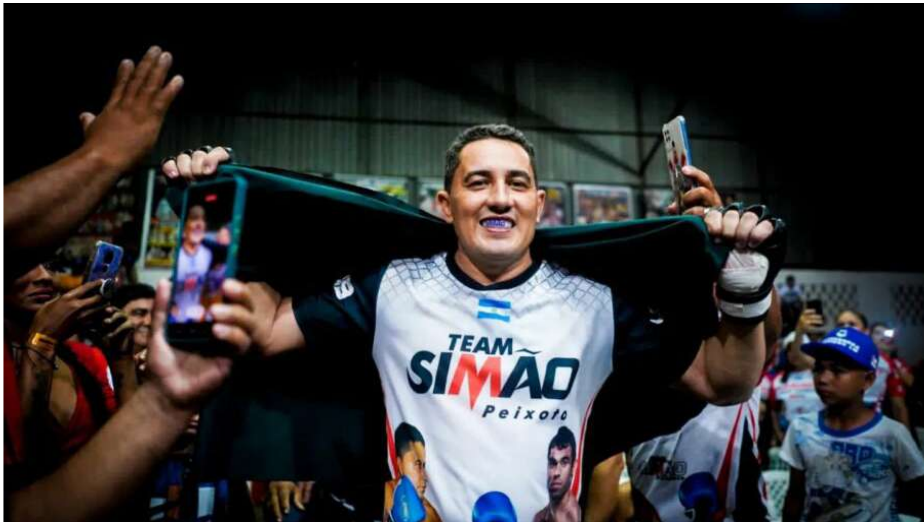
Simão Peixoto já havia protagonizado diversos escândalos, entre estes um evento de MMA conta um desafio político

O Supremo Tribunal Federal (STF) decidiu anular a condenação do ex-deputado federal Eduardo Cunha a 15 anos e 11 meses por corrupção e lavagem de dinheiro em um dos processos da Operação Lava Jato.