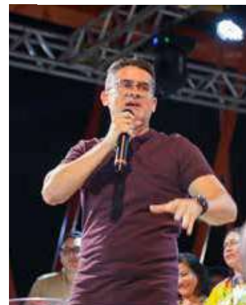
O festival ocorre nos dias 5, 6 e 7 de setembro, no Centro Histórico de Manaus. A entrada é gratuita

A programação contempla cinco grandes óperas que entram em cartaz no teatro