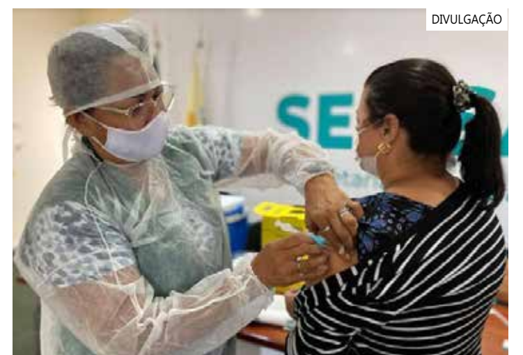
A lista com os endereços e horários das 171 salas de vacina está no site da Sema

O número de doses aplicadas na população indígena (18,73%), aldeada e não aldeada, é atribuído a não identificação do usuário como tal na unidade de saúde, apesar de ser declarado indígena. Por outro lado, a imunização dos trabalhadores da saúde chega a 82,43%, dos professores, 97,49%, e das puérperas, 100%. A campanha nacional de vacinação contra influenza será encerrada na próxima quarta-feira (31).