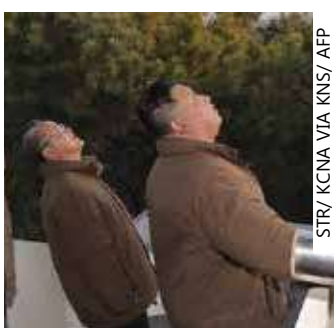
Kim Jong-un acompanhando lançamento de mísseis balísticos

"Pedimos veementemente que a Coreia do Norte se abstenha de o lançar", disse o gabinete do primeiro-ministro no Twitter, acrescentando que irá apelar à vigilância e à cooperação com os aliados do Japão, "como os EUA e a Coreia do Sul".