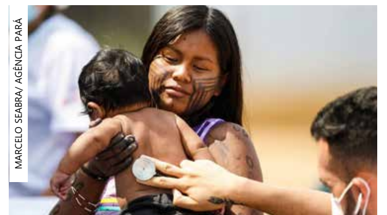
Proposta foi feita pelo Brasil e assinada por treze países

de Indígena (Sesai) destacou a importância da decisão. "É simbólico para a OMS, em seus 75 anos de história, aprovar uma resolução que determina a elaboração de um Plano Global da OMS, encoraja os demais países a desenvolverem planos nacionais e a buscarem estratégias que possam assegurar o acesso à saúde dos povos indígenas, respeitando o direito à consulta e fortalecendo a participação social na construção de ações, programas e políticas voltadas a essas populações", explicou.