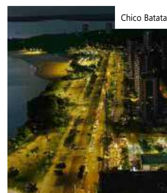
Manaus vista noturna

A agenda institucional do governador com o ministro, tratou ainda de parcerias e projetos do Amazonas com mecanismos internacionais, que têm como foco o desenvolvimento sustentável e que contribuem com a política ambiental do país, além da relação do Amazonas com países vizinhos que fazem fronteira com o estado.