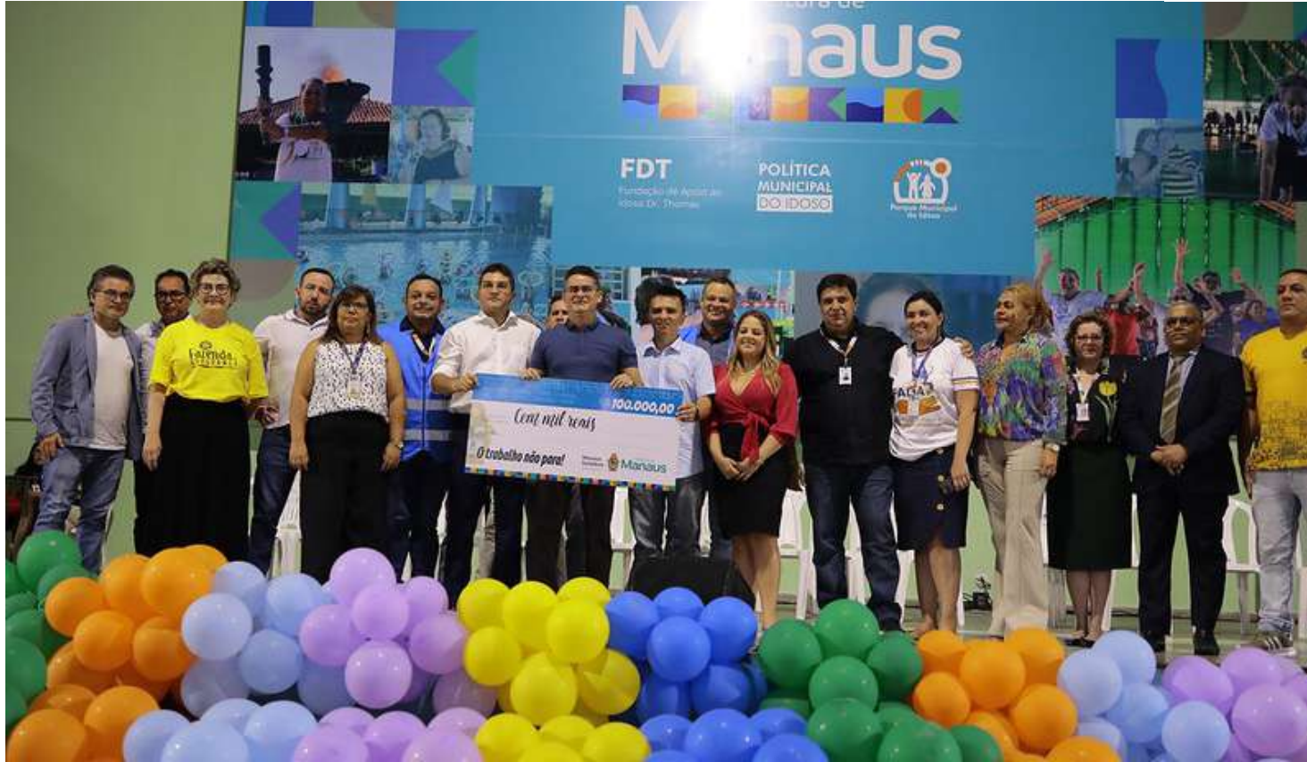
A lista completa das organizações contempladas foi publicada na edição do último dia 13, do DOM

O prefeito de Manaus, David Almeida, assinou, na tarde desta segunda-feira (29), o termo de fomento que oficializa a realização da 2ª edição do Edital do Fundo Manaus Solidária (FMS), que contempla 69 Organizações da Sociedade Civil (OSCs) com o valor de até R$ 100 mil. No total, serão R$ 6,8 milhões de investimentos em projetos autossustentáveis, geradores de trabalho, renda e inclusão social. O evento aconteceu no Parque Municipal do Idoso (PMI), no bairro Nossa Senhora das Graças, zona Centro-Sul. Diante dos presentes no parque do Idoso, David Almeida fez questão de destacar a importância do trabalho realizado pelas organizações, afirmando que, muitas vezes, são eles que realizam o primeiro atendimento a população que mais precisa.