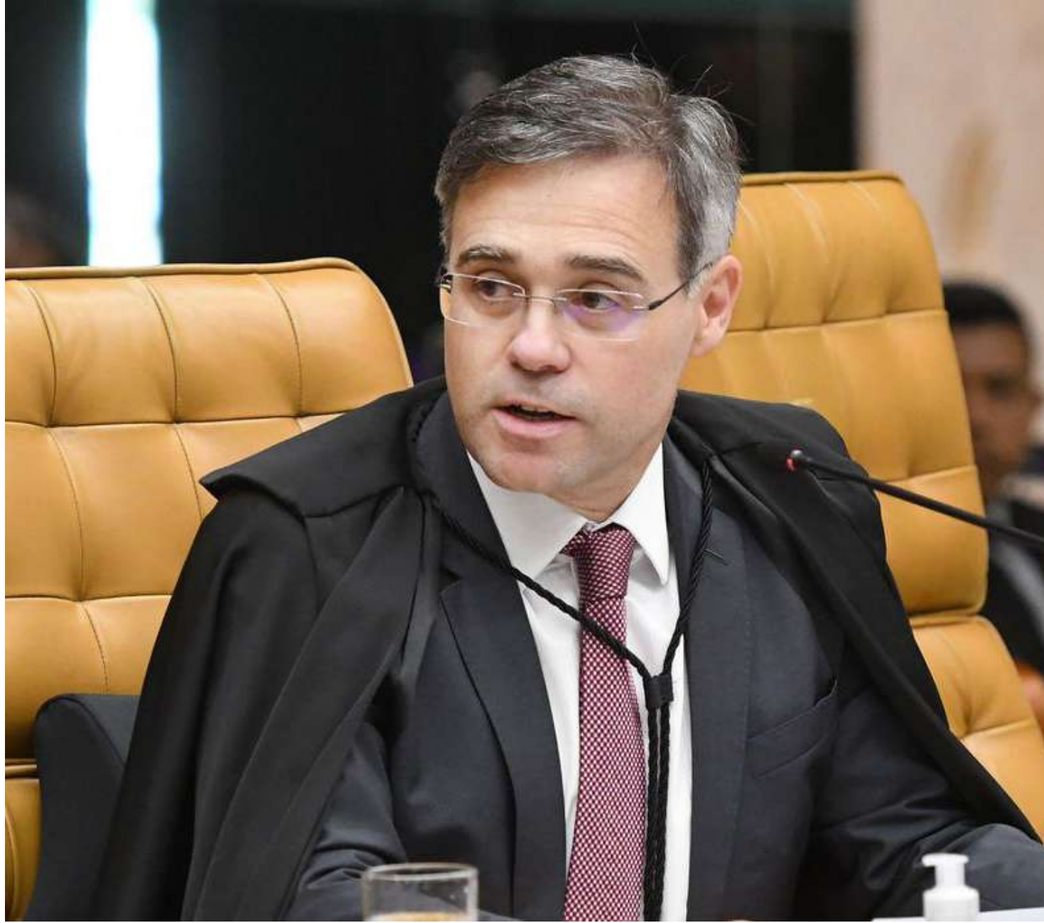
André Mendonça é o relator do pedido no STF

"Eventual controle judicial deve, em respeito ao princípio da separação dos poderes, revestir-se do mais alto grau de excepcionalidade e cautela. Disso resulta a adoção, no presente caso, da prudência judicial, no sentido de ouvir, previamente, as au-