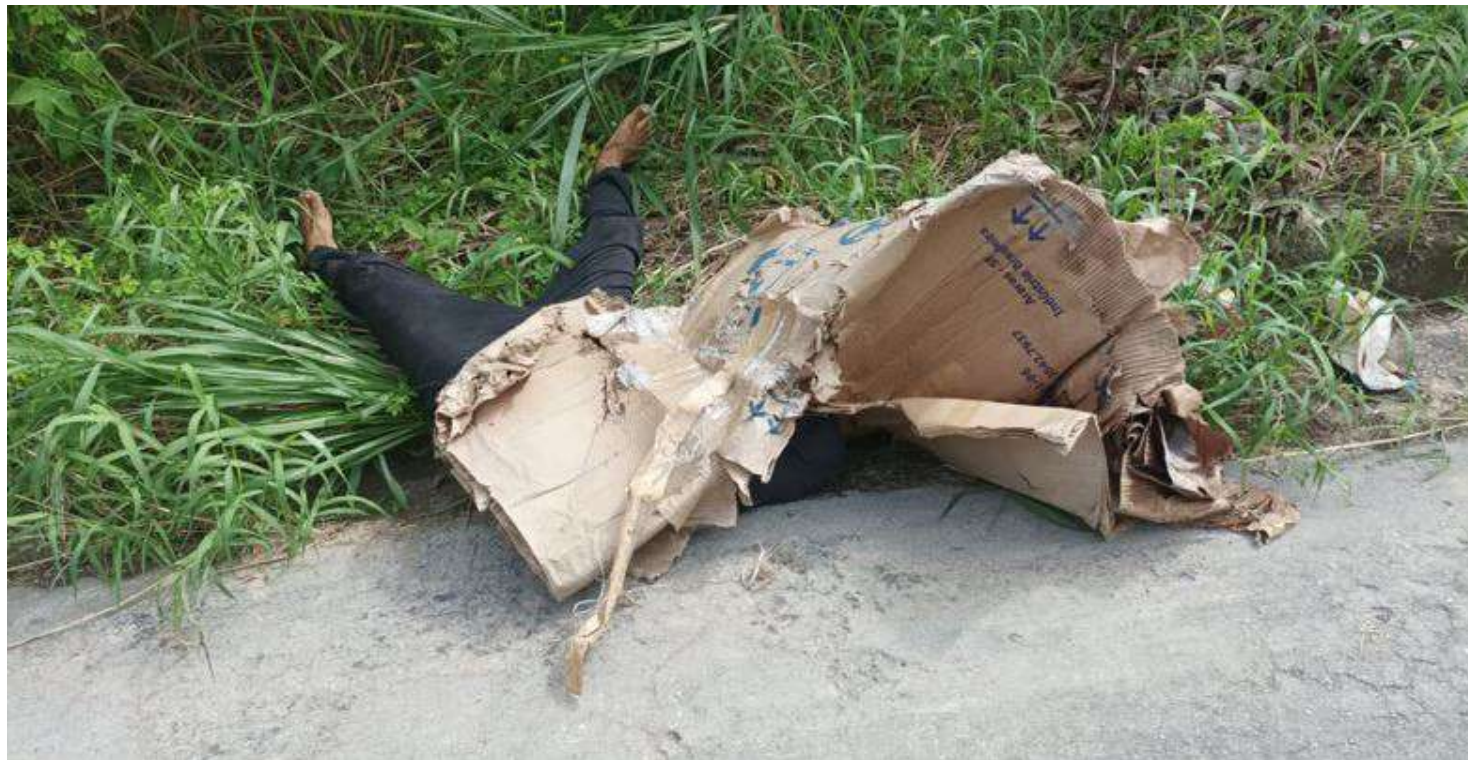
Pelas características de execução, grande parte dos crimes podem estar relacionados ao tráfico de drogas

A maior parte dos crimes aconteceram na Zona Norte de Manaus. O medo tem tomado conta da população que todos os dias se depara com cenas de brutalidade, que não tem mais horário e nem local para acontecer. Dos 11 registros de homicídios durante o fim de semana, 10 aconteceram na capital e um no município de Itacoatiara. De acordo com