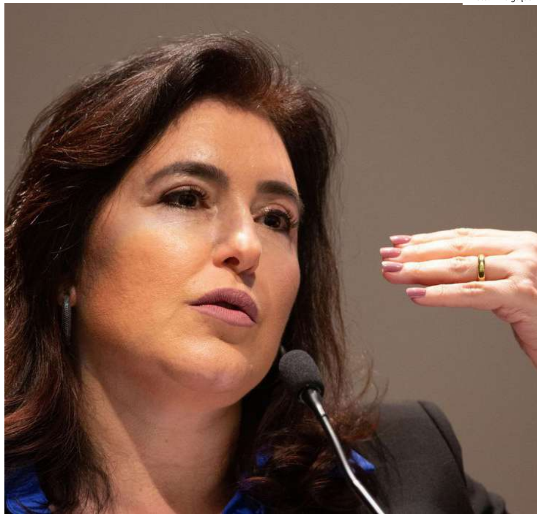
Ministra Simone Tebet detalhou medidas que serão adotadas após revisão das despesas

A JEO é composta pelos ministérios da Fazenda, Casa Civil, do Planejamento e da Gestão. A chefe do Ministério