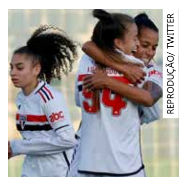
Meninas do São Paulo venceram o Grêmio de Porto Alegre e avançam

O último rebaixado, também definido hoje, foi o Bahia, goleado pelo Corinthians (5 a 1), em Salvador. A equipe encerrou sua participação em 13º lugar, com 13 pontos.