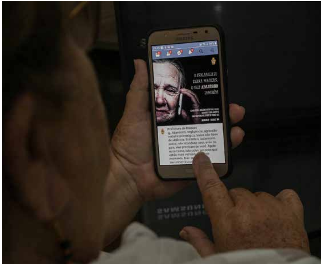
Campanha deste ano traz o tema "Educar para respeitar, amar para proteger"

normalização da violência ao idoso, o movimento mundial incentiva à apresentação, ao debate e ao fortalecimento das mais diversas formas de prevenção.