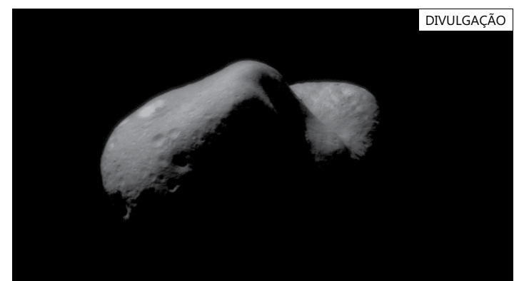
O tamanho do 1994 XD é incerto