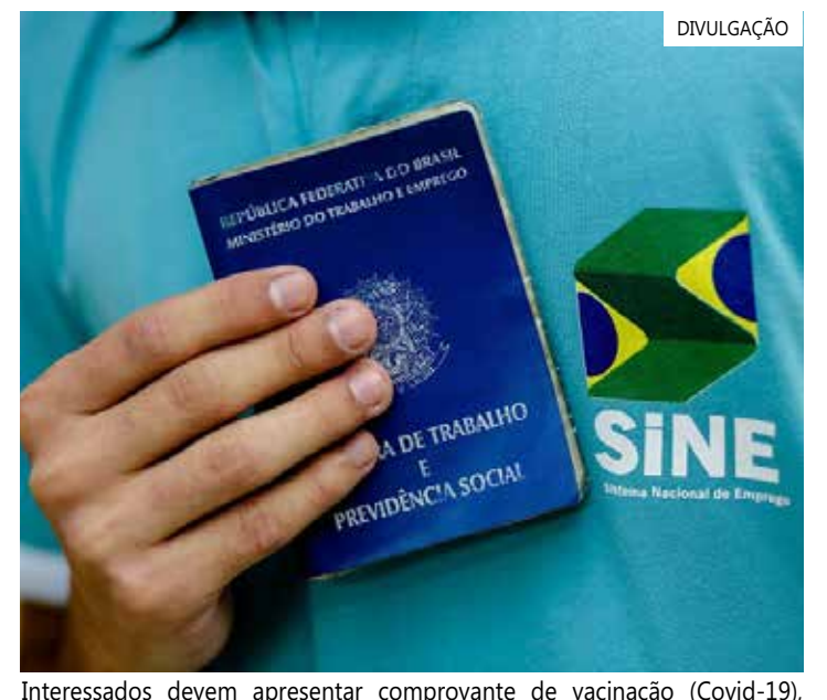
Interessados devem apresentar comprovante de vacinação (Covid-19), currículo e documentos pessoais