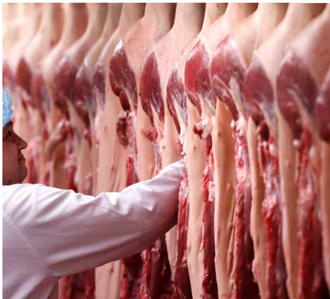
Carnes e Frigoríficos

Projeções do Ministério da Agricultura indicam que, mantido o ritmo atual, o país deve terminar o ano com o recorde histórico de exportações de carnes.