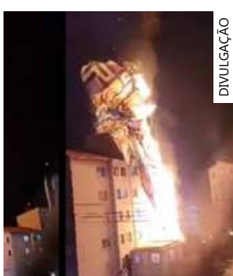
Balão em chamas

Incidente aconteceu no mês passado e não provocou danos; foi o segundo fim de semana seguido que aeroporto registra queda de balão.