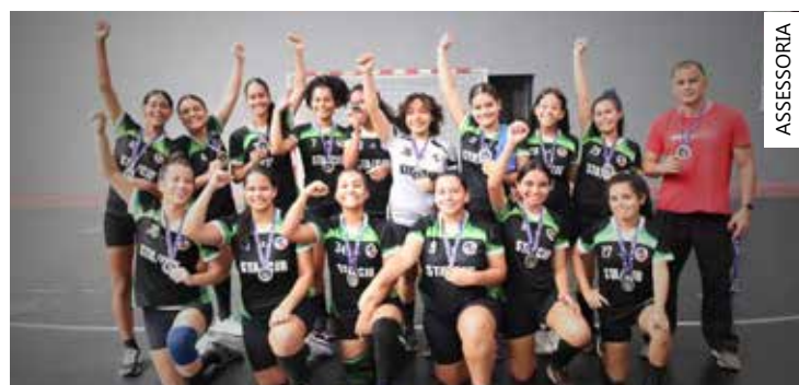
Finais aconteceram no ginásio do Atlético Rio Negro Clube

“Eu só tenho a agradecer pela nossa participação nesse campeonato, que é meu último ano nessa categoria. Agradeço muito as meninas e a todos que estão aqui. É uma experiência incrível estar aqui, aliás, o handebol me proporcionou coisas incríveis, como viagens e muitas amigas”, disse a camisa 4.