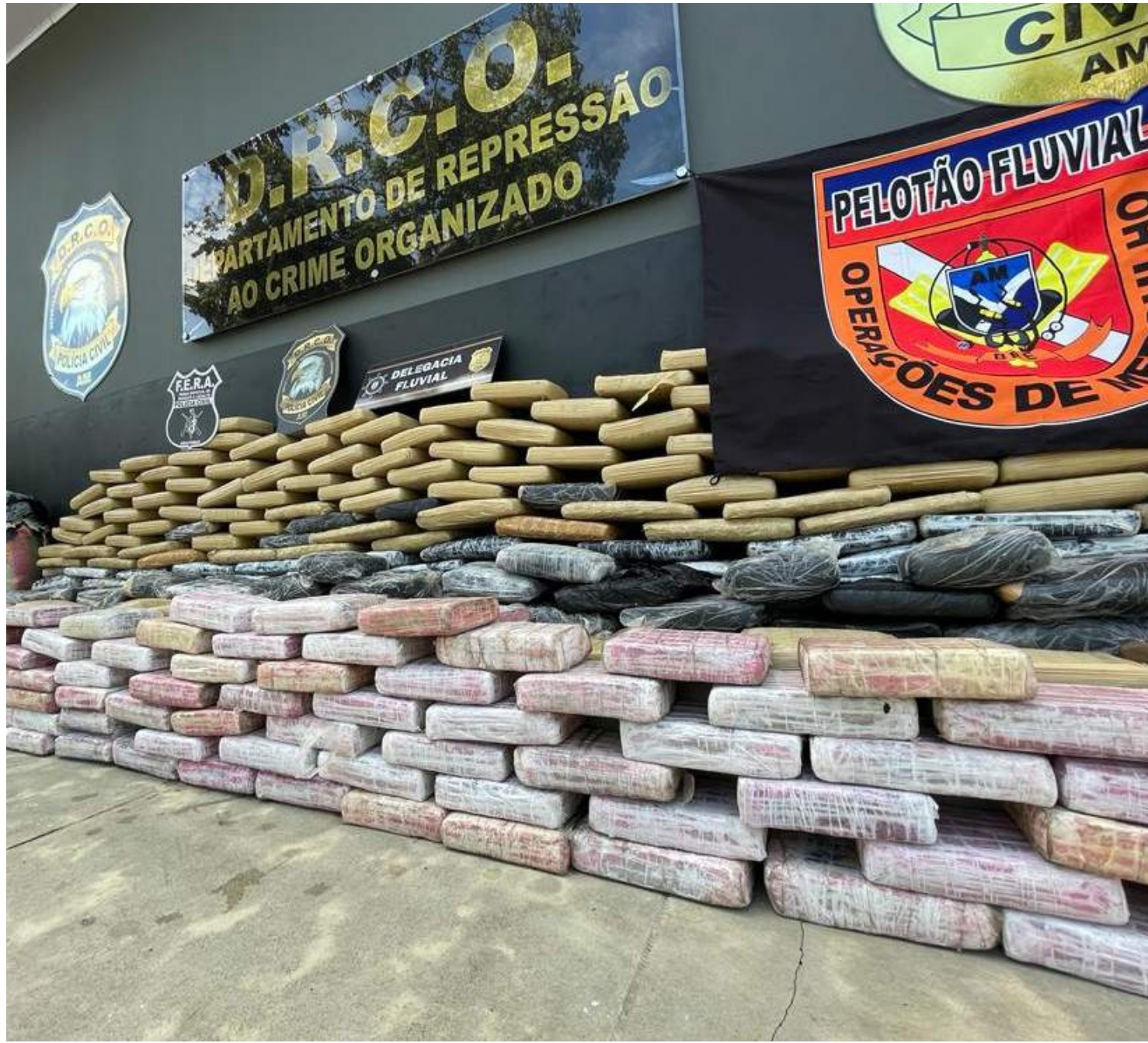
Prejuízo ao crime organizado está avaliado em mais de R$ 24 milhões, afirma Departamento de Repressão ao Crime Organizado (DRCO)

nizações criminosas voltadas para o tráfico de drogas, já apreendemos, nesses primeiros seis meses de 2023, mais de três toneladas de drogas, além de seis veículos, uma embarcação e diversas pessoas. Destaco que esse trabalho irá continuar e outras ações serão deflagradas para apresentar mais resultados positivos à população”, afirmou Teles.