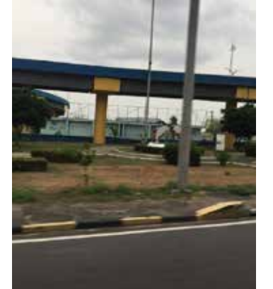
Região onde ocorreu o acidente