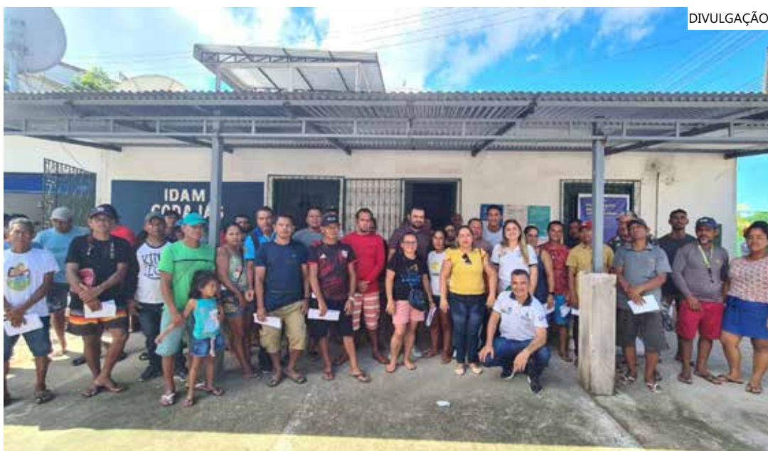
Ao todo, 43 pescadores foram beneficiados com financiamento e implementos