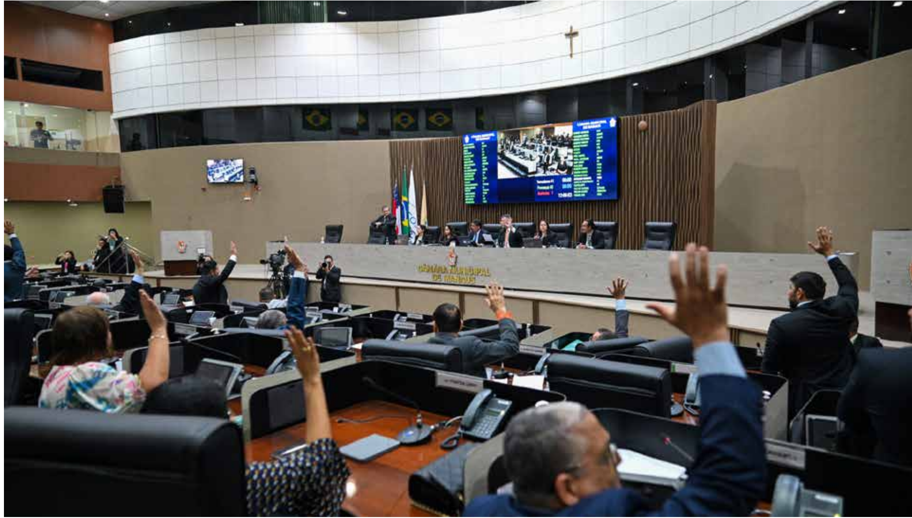
Manhã de segunda-feira (12) foi produtiva na Câmara Municipal