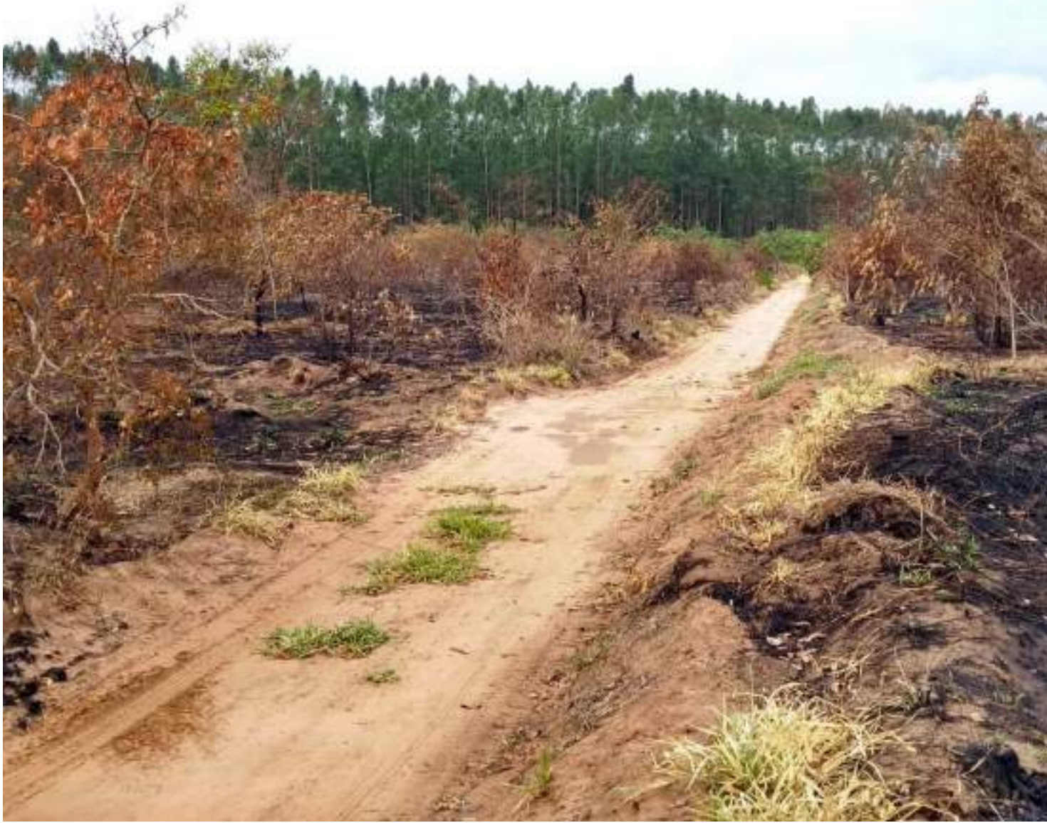
Desmatamento no Cerrado

O levantamento também mostra que é na região do Matopiba - composta por áreas dos Estados do Maranhão, Tocantins, Piauí e Bahia - que se concentra a maior parte do desmatamento no Cerrado, cerca de 77,7%. Foram mais de 512 mil hectares