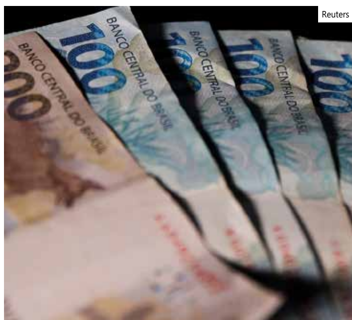
Dinheiro Real Moeda Brasileira

Para alcançar a meta de inflação, o Banco Central usa como principal instrumento a taxa básica de juros, a Selic, definida em 13,75% ao ano pelo Comitê de Política Monetária (Copom). A taxa está nesse nível desde agosto do ano passado e é a maior desde janeiro de 2017, quando também estava nesse patamar. Para o mercado financeiro, a expectativa é de que a Selic encerre em 12,5% ao ano. Para o fim de 2024, a estimativa é de que a taxa básica caia para 10% ao ano.