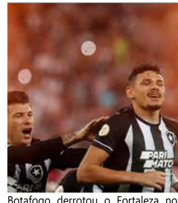
Botafogo derrotou o Fortaleza no sábado (10)