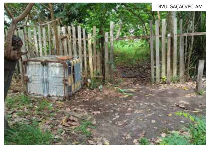
Corpo da vítima foi localizado em uma região conhecida como ‘Furo do Davi’