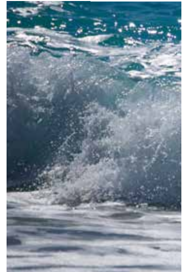
Água da praia de Sylvania Avenue