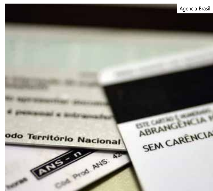
Cartões de Planos de Saúde

Esse público é a minoria do mercado. Representa aproximadamente 16% dos 50,6 milhões de consumidores de planos de assistência médica no Brasil. A maior fatia é a dos planos coletivos.