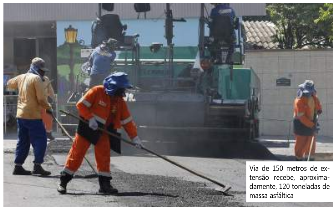
Via de 150 metros de extensão recebe, aproximadamente, 120 toneladas de massa asfáltica

Dando continuidade às obras de recapeamento do programa "Asfalta Manaus", a Prefeitura de Manaus, por meio da Secretaria Municipal de Infraestrutura (Seminf), vem intensificando uma nova frente de trabalho na rua Professor João Ricardo Lima, localizada no bairro Parque 10, zona centro-sul, na terça-feira (13).