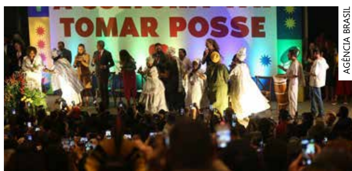
Lei Paulo Gustavo viabiliza mais de R$ 3 bi para projetos culturais

Para agendar, o usuário deve acessar a plataforma de agendamento virtual clicando aqui. Será necessário preencher alguns campos básicos no formulário para receber o link de acesso ao Google Meet, plataforma escolhida para a realização dos atendimentos.