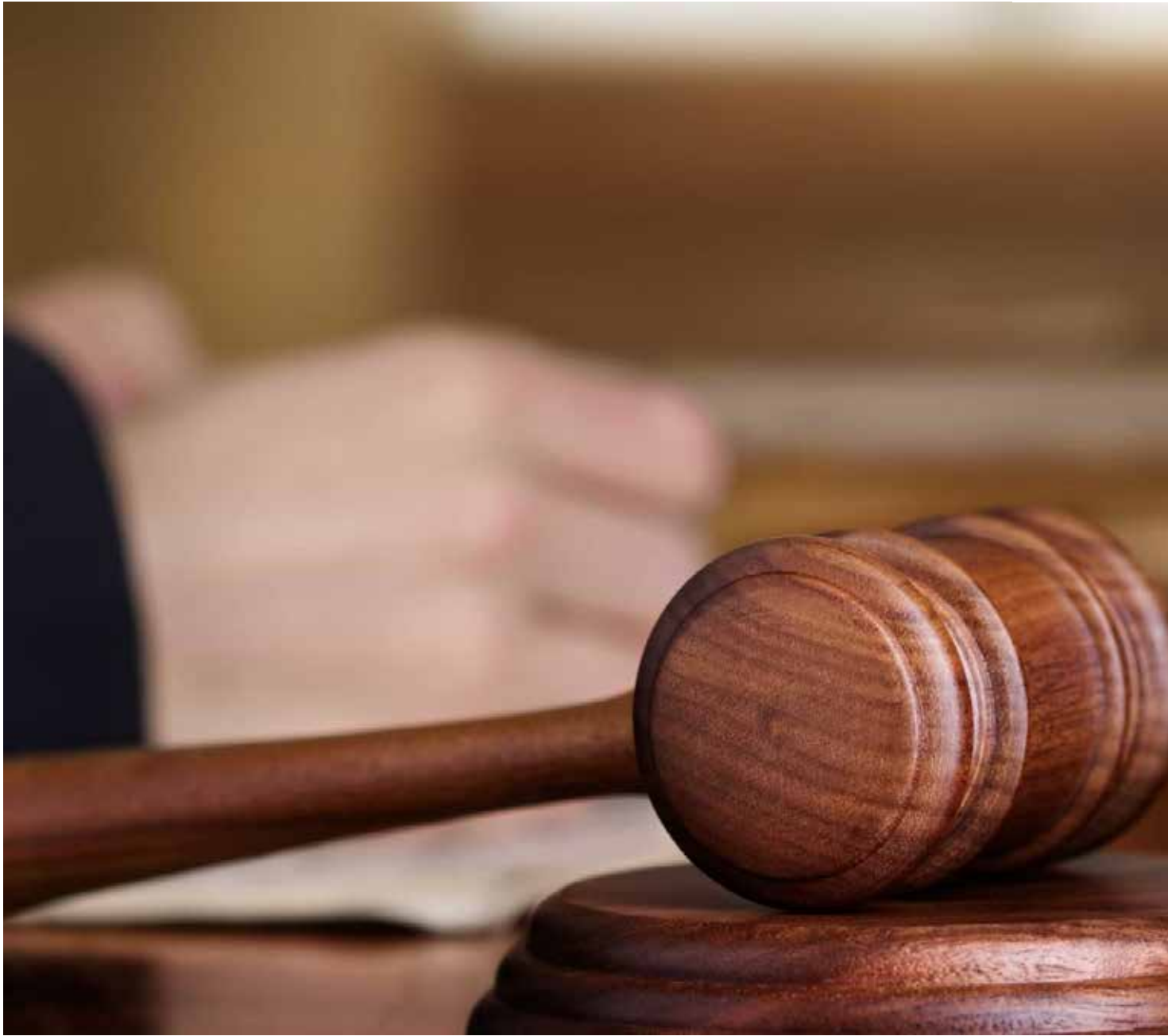
Tribunal do Júri Campo Grande

Ao Estadão, o criminalista afirma que ofereceu água porque a mulher estava visivelmente emocionada. "Foi um ato de civilidade, de humanidade, que o próprio juiz não teve", lembra. O advogado, experiente nos Tribunais do Júri, diz que nunca passou por uma situação tão extrema: "Não vejo nada além do ego e