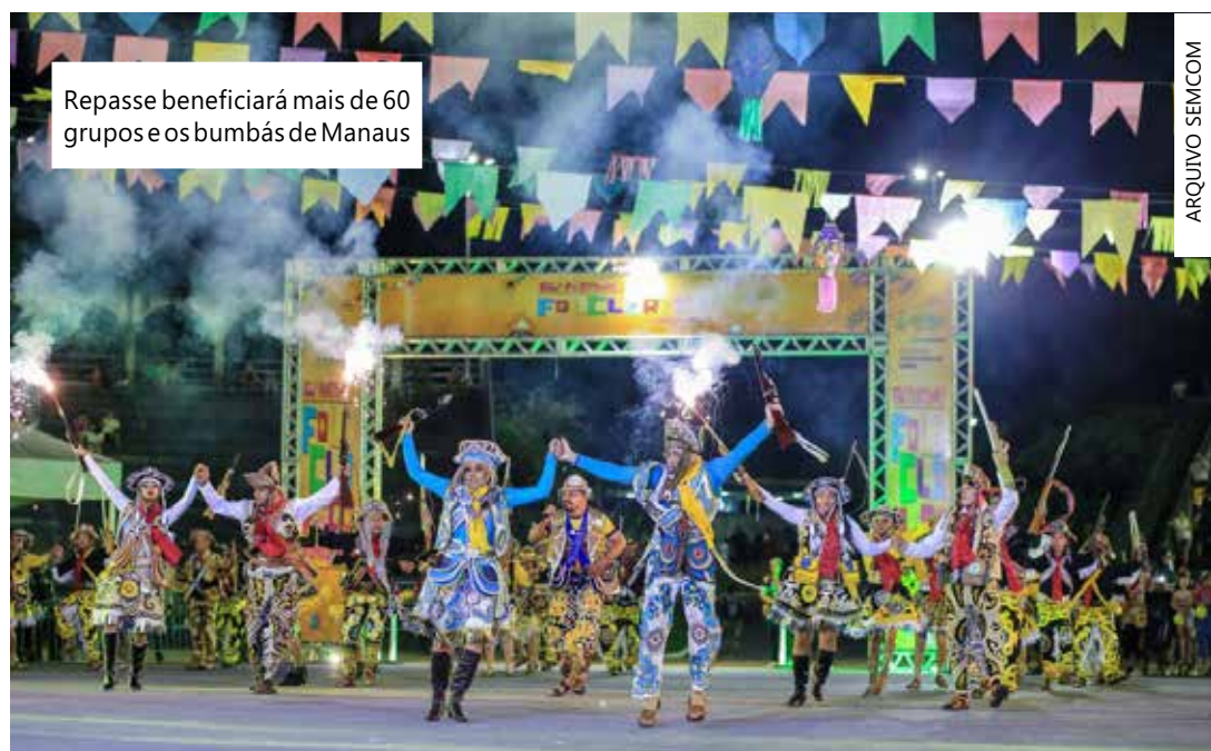
Repasse beneficiará mais de 60 grupos e os bumbás de Manaus

"Essa parceria se realiza neste ano com expectativa de retorno do público no Centro Cultural Povos da Amazônia, os ensaios de-