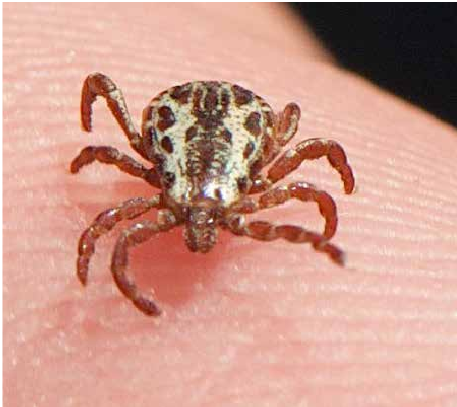
Doença é transmitida pelo carrapato por meio de picada do inseto

da que, imediatamente após ser notificado dos casos, o Departamento de Vigilância em Saúde (Devisa) do município desencadeou uma série de ações de prevenção, informação e mobilização contra a febre maculosa na Fazenda Santa Margarida.