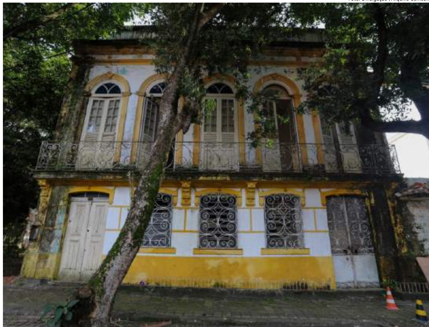
Passeios visitarão casario do centro antigo de Manaus

Estes encontros visam a realização do projeto de educação urbana patrimonial para grupos da sociedade civil e acadêmicos, com no máximo 25 pessoas e uma atividade com duração