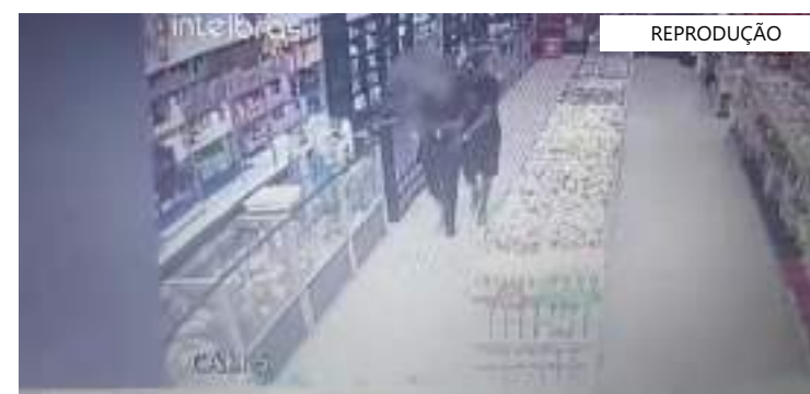
A polícia está investigando o caso para identificar e localizar o criminoso

A polícia está investigando o caso para identificar e localizar o paradeiro do criminoso. Também está sendo apurado se o suspeito teve a ajuda de algum comparsa para praticar o roubo.