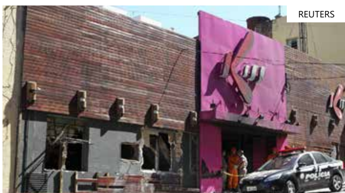
Imagem Boate Kiss

As causas do acidente agora serão investigadas pelas autoridades do Reino Unido. Testemunhas relataram ter ouvido o motor do avião falhando antes de vê-lo cair perto de algumas rochas. Imagens registradas no local mostram o avião vermelho e branco em águas rasas.