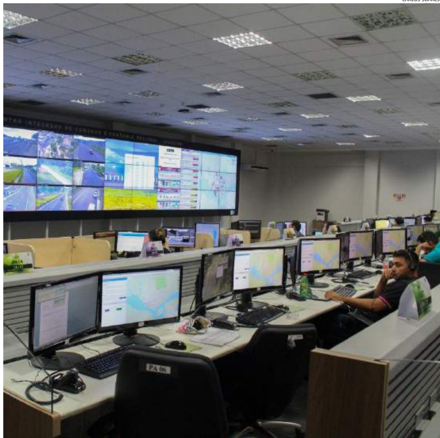
Ciops terá acesso aos detalhes da viagem em que o botão for acionado