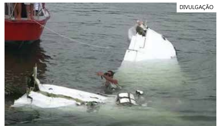
Avião de pequeno porte