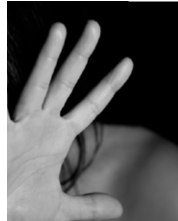
Suspeito vai responder por descumprimento de medida protetiva