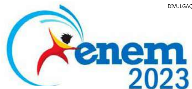
Inscrições encerram nesta semana