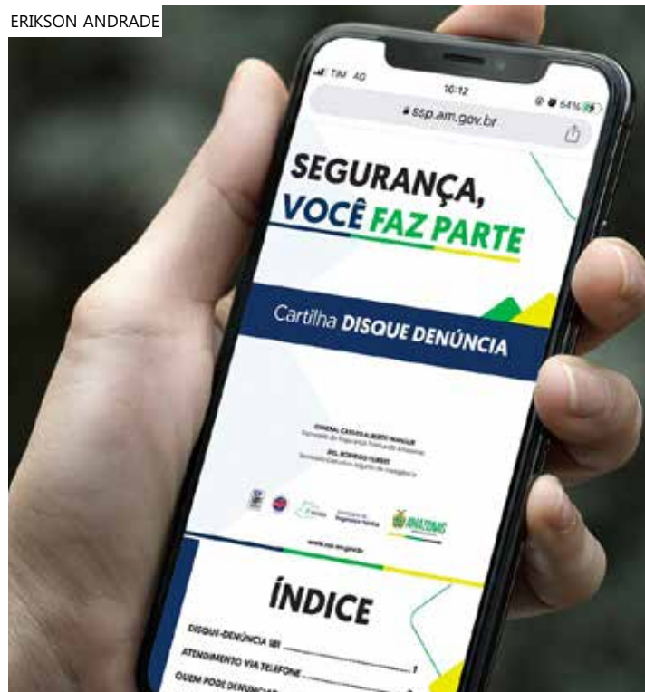
Cartilha está disponível no site da SSP-AM para acesso da população

Para realizar a denúncia basta ter em mãos um telefone e discar o número 181. A ligação é gratuita e o sistema funciona 24 horas por dia, sete dias por semana.