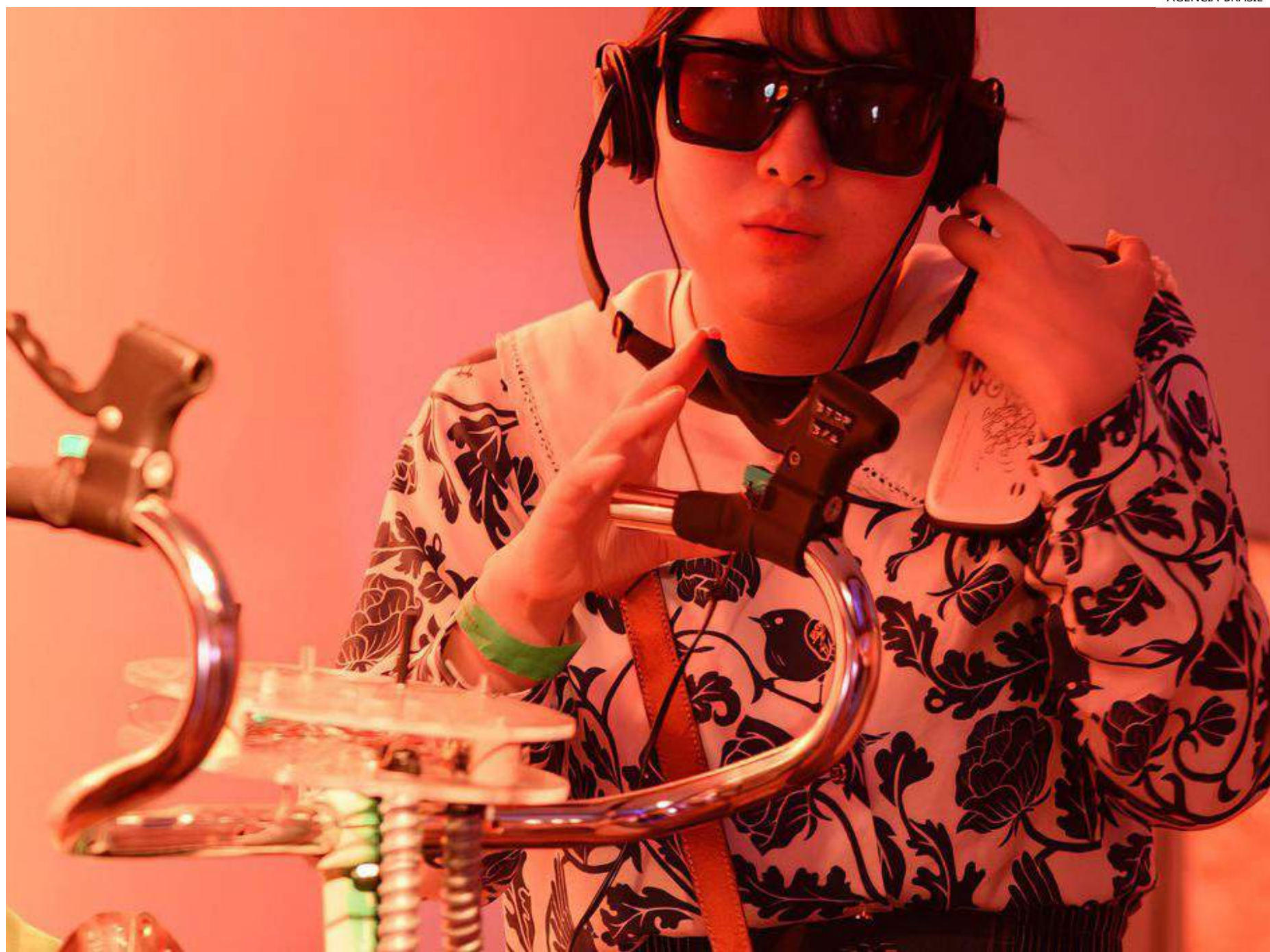
O prêmio foi para a exposição Encruzilhadas

Moreira destacou ainda que o prêmio por equipe