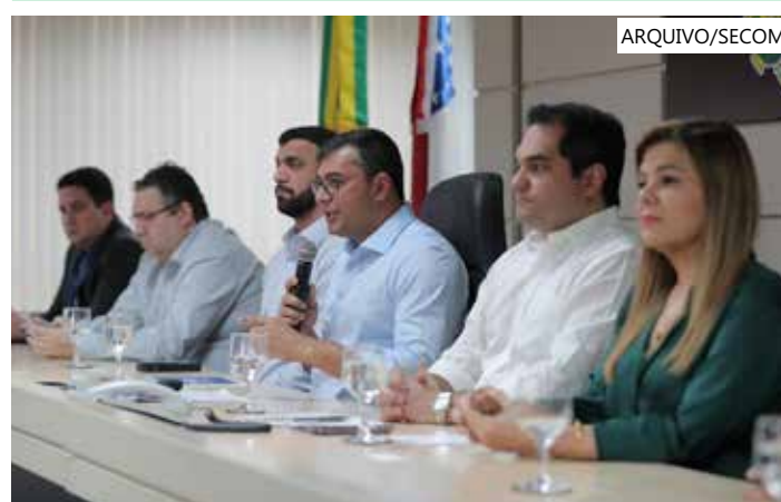
Chefe do Executivo estadual, Wilson Lima anunciou reajuste de 8%

Na última quarta-feira (7), o Governo do Amazonas enviou à Assembleia Legislativa do Amazonas (Aleam) a mensagem governamental com o reajuste de 8% no salário da categoria e garantindo a concessão de Regime Complementar para secretários escolares e coordenadores distritais