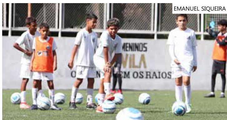
Prorrogação garante que mais clubes participem do campeonato

Os interessados tem até às 17h para enviar ofício solicitando inscrição para o email: competicoes.faf.am@gmail.com, acompanhado do comprovante de pagamento da taxa. Na quinta-feira (22), a FAF realiza reunião de Conselho Técnico com as equipes que confirmarem suas participações.