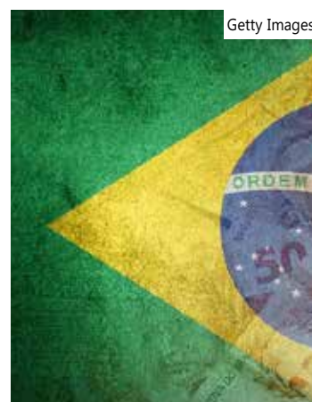
Governo quer evitar o que aconteceu no último ano

O problema para a equipe econômica de Lula é o ponto de partida do espaço para despesas em 2024, primeiro ano de vigência da nova regra fiscal.