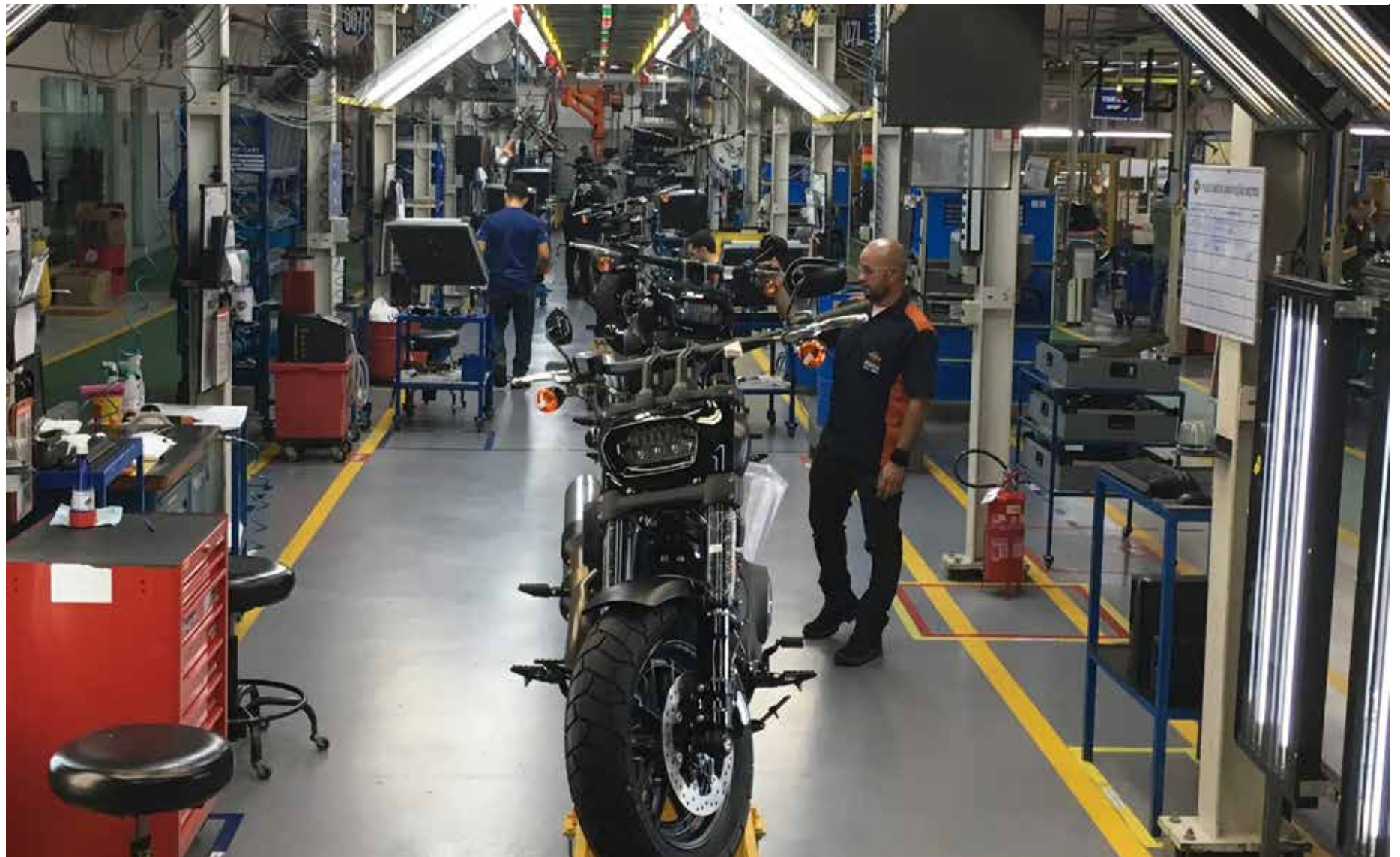
A indústria de motocicletas atingiu em maio o melhor resultado do ano.

Bento ressalta que o segmento de motocicletas deve seguir a tendência de alta. "A motocicleta é uma opção ágil e econômica de