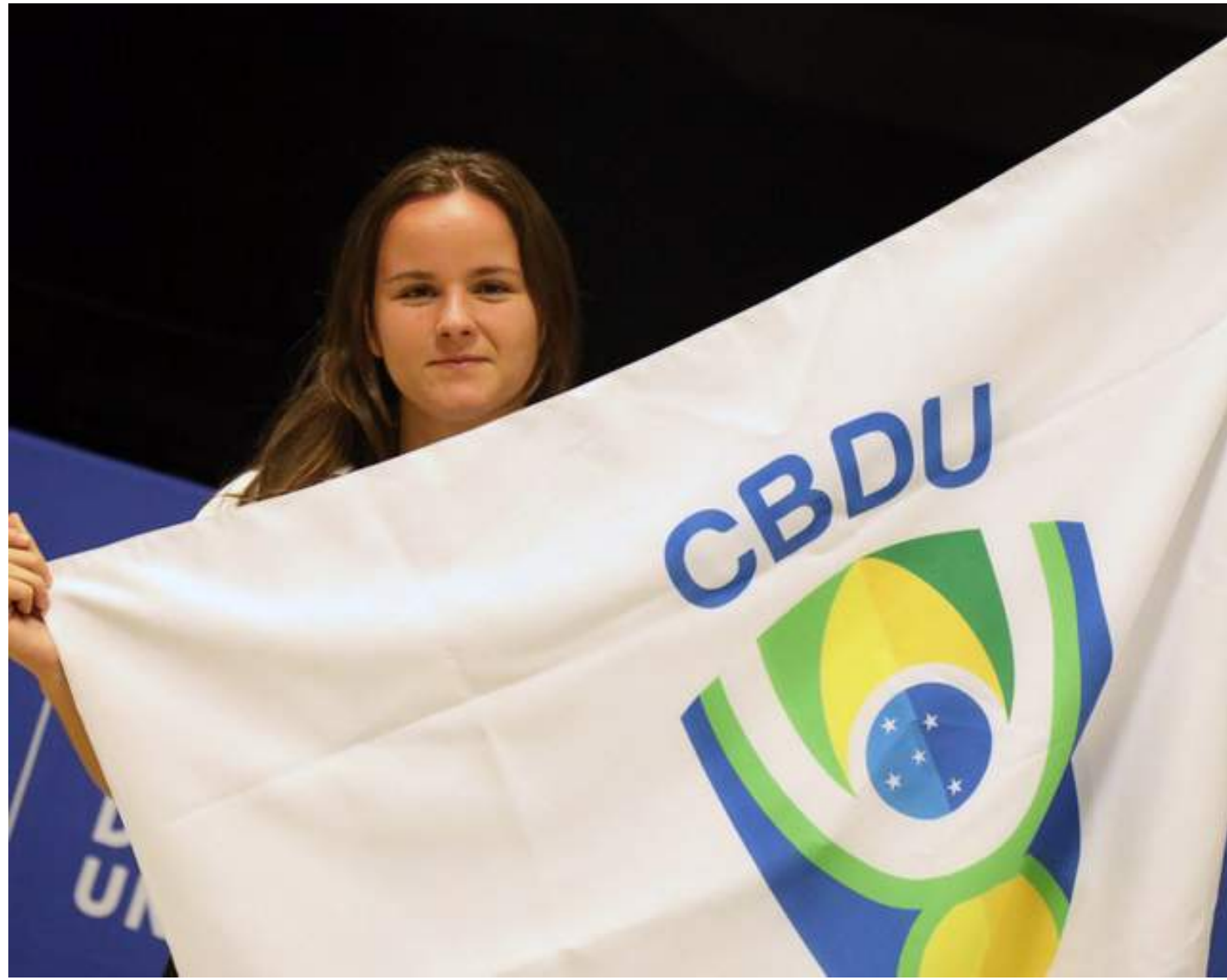
Evento tem organização da Confederação Brasileira de Desporto Escolar (CBDU)

O dirigente também agradeceu o apoio do Ministério do Esporte e da Secretaria de Esporte do Distrito Federal para via-