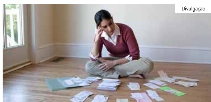
A reserva de emergência deve ser encarada com seriedade

O levantamento também apontou que apenas 21,9% das pessoas se sentem preparadas para lidar com uma despesa inesperada.