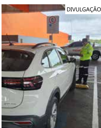
Operação foi realizada por agentes de trânsito do IMMU

O IMMU reforça para que os motoristas, ao frequentarem os centros comerciais ou supermercados, não utilizem as vagas destinadas às pessoas especiais.