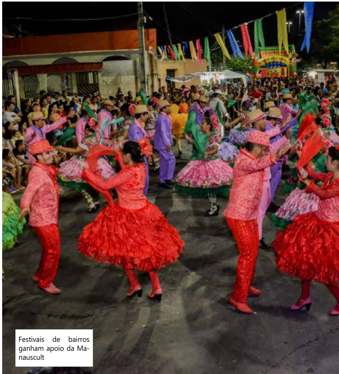
Festivais de bairros ganham apoio da Manauscult

O retorno do Festival Folclórico dos Bairros ao calendário de eventos foi possível após arranjos entre secretarias ligadas à cultura e finanças municipais