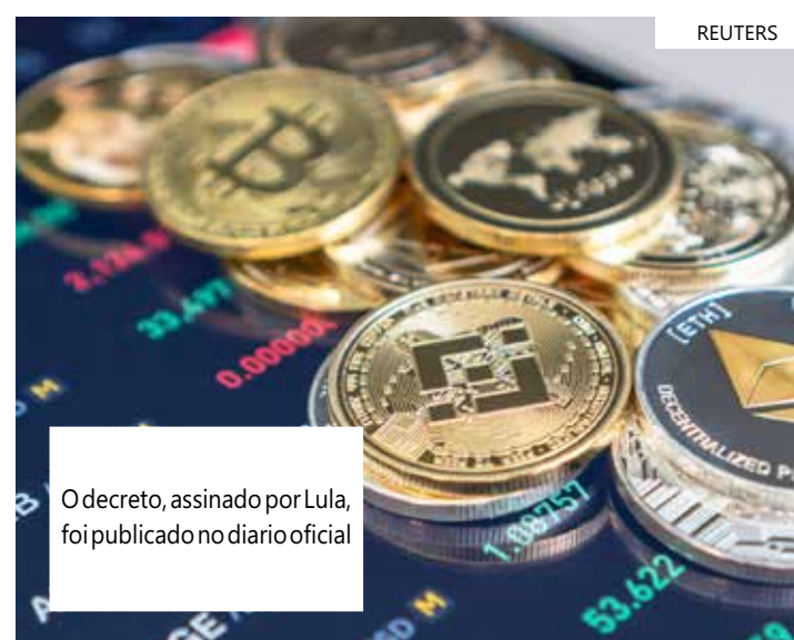
O decreto, assinado por Lula, foi publicado no diário oficial

lamentares dispõe sobre diretrizes a serem observadas nas atividades e na regulamentação das prestadoras de serviços de ativos virtuais. Esses ativos, por sua vez, foram definidos pela legislação como uma representação digital de valor que pode ser negociada ou transferida e utilizada para fins de pagamento ou investimento. A lei traz uma definição bastante genérica e, para evitar ruídos, explicita algumas exceções. Não entram nessa definição programas de fidelidade e de milhagem, além de moedas fiduciárias. Isso significa que o real digital - que está em estudo pelo Banco Central - não será regido por essa legislação. No caso de ativos representativos de valores mobiliários - títulos ou contratos de investimento coletivo ofertados publicamente -, continuam valendo as regras da CVM (Comissão de Valores Mobiliários).