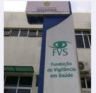
Boletim é feito pela FVS-AM