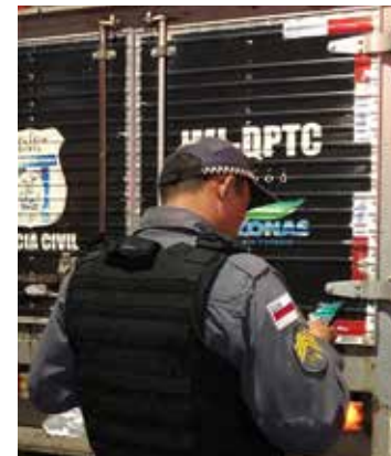
O IML foi acionado até o local, onde fez a remoção do corpo