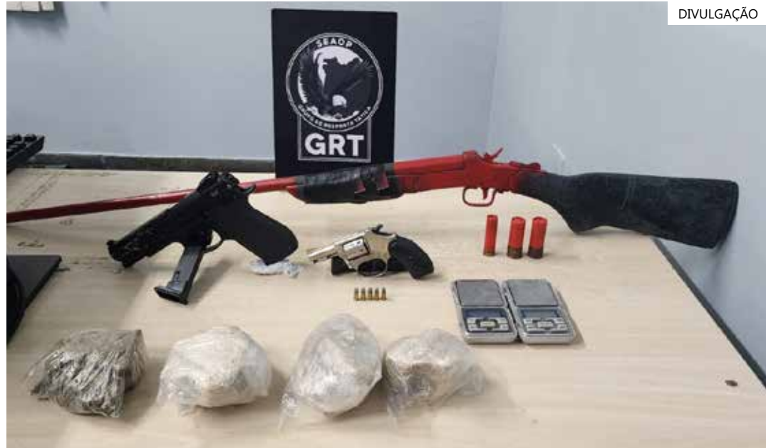
Materiais apreendidos foram levados ao 6º DIP

Os materiais apreendidos foram levados ao 6º Distrito Integrado de Polícia (DIP), onde será instaurado inquérito policial para investigar e punir os envolvidos.