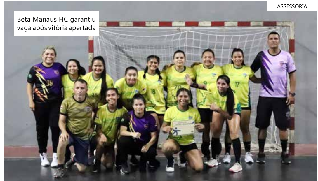
Beta Manaus HC garantiu vaga após vitória apertada

final prosseguem no dia 16, sexta-feira, às 19h30, com Rio Negro x Alpha HC. A fase termina no sábado, dia 17, com o duelo entre Fênix HC e Isaías Vasconcelos de Iranduba, a partir das 15h. O ginásio do Rio Negro é o palco das batalhas que vão apontar os semifinalistas.