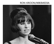
Música Garota de Ipanema ganhou fama na voz da artista