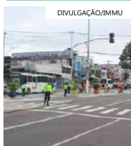
A "Missa de Corpus Christi" acontecerá na quinta-feira (8), às 16h

Não haverá necessidade de interromper o fluxo de veículos antes da procissão. As interdições ocorrem somente durante a passagem do público, deixando o trânsito liberado em seguida.