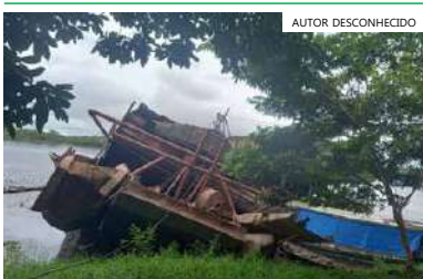
Balsa já estava incinerada antes da explosão

A Superintendência Regional da Polícia Federal no Amazonas informou, por meio de nota, que tomou conhecimento da explosão de dragas em Maraã, no interior do Amazonas. No comunicado, o órgão disse que vai prestar o apoio necessário para descobrir o que causou esse fato. A Corporação ainda esclarece que, no momento do ocorrido, não realizava nenhuma ação na região e que, portanto, a explosão não aconteceu em ação de repressão.