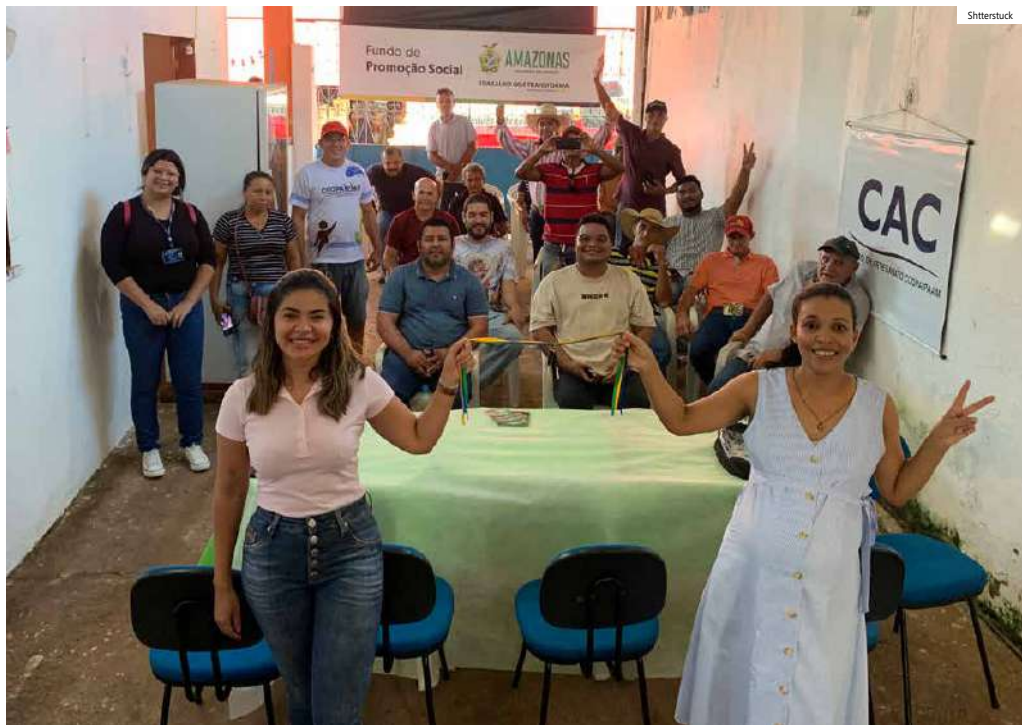
Cooperativa de fomento setor primário

Para a Cooperativa Agroindustrial de Produtores do Projeto Uatumã (CPU UATUMÃ), localizada no km 5 do ramal do Paulista, a aquisição de um caminhão baú chega em boa hora. No valor de mais de 195