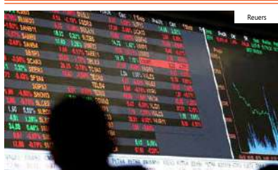
Dólar cai para R$ 4,91, em dia positivo para países emergentes

No exterior, o dólar caiu num dia favorável aos países emergentes. O aumento das chances de que o Federal Reserve (Fed, Banco Central norte-americano) não mexa nos juros na próxima reunião reduziu as pressões sobre a moeda norte-americana em todo o planeta, principalmente os países em desenvolvimento. O real foi uma das moedas que mais se valorizou nesta terça-feira, beneficiado pela entrada de investimentos estrangeiros no Brasil.