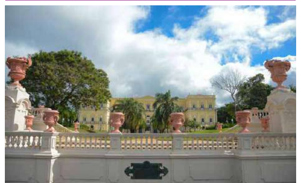
Neste dia 6 de junho, o Museu Nacional completou 205 anos de existência

205 anos de criação do Museu Nacional começaram no último domingo (4) com eventos culturais e recreativos gratuitos na Quinta da Boa Vista, no bairro de São Cristóvão.