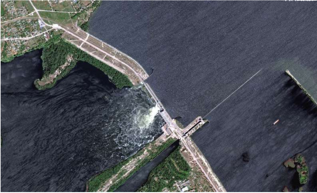
Imagem aérea feita por meio de satélite mostra rompimento de barragem

Europa vive momento de tensão após rompimento da barragem