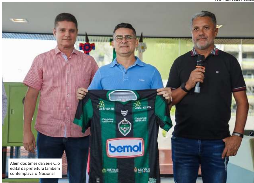
Além dos times da Série C, o edital da prefeitura também contemplava o Nacional

"Muito se falava da herança da Copa do Mundo do Brasil. O Amazonas já investiu muito. Temos uma das mais bonitas arenas do país, que custou mais de R$ 800 milhões e que, raramente, é utilizada. Quando recebe partidas, sempre temos baixos públicos. Por isso, estamos aqui repetindo esse apoio que totaliza R$ 2 milhões, sendo R$ 1 milhão para cada time. Temos uma cidade que respira esportes e que já mostrou a sua força em outras