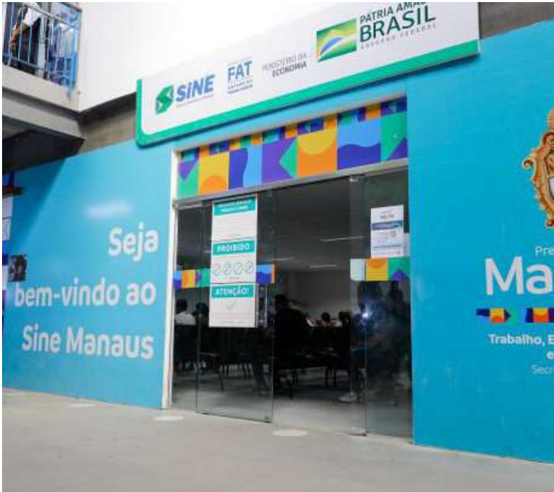
Sine Manaus dispõe de pontos físicos para atendimento do público

Os interessados devem estar munidos do comprovante de vacinação (Covid-19), currículo e documentos pessoais (RG, CPF, PIS, CTPS, comprovante de escolaridade e residência). Não é necessário apresentar cópias, somente os documentos originais.