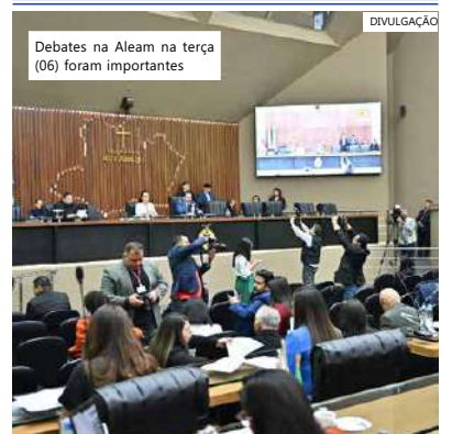
Debates na Aleam na terça (06) foram importantes

ros demandam mais atenção. Por isso, a gente está protocolando este Projeto de Lei para que licença das mães de bebês prematuros passem a contar a partir da alta do bebê, aumentando o vínculo entre mãe e bebê", explicou.