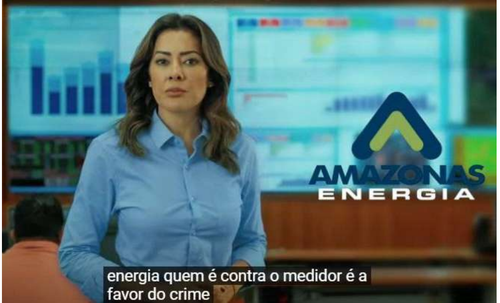
A campanha publicitária da concessionária recebeu a notificação para que a veiculação seja retirada em até 24 horas