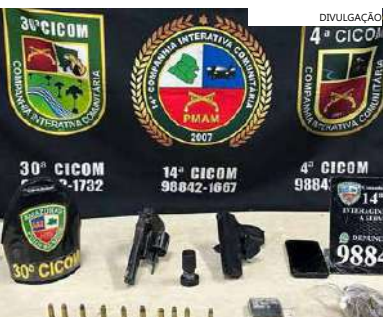
Material apreendido em posse do suspeito no momento da prisão

Em posse do suspeito foram apreendidos um revólver de calibre 38 com numeração raspada, dez munições intactas e quatro deflagradas, além de um simulacro de arma de fogo, uma porção de droga e balança de precisão.