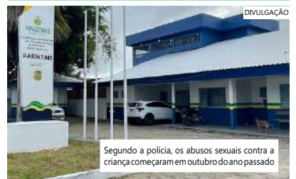
Segundo a polícia, os abusos sexuais contra a criança começaram em outubro do ano passado

Os dois foram presos preventivamente e iniciados por estupro de vulnerável, encaminhados a delegacia para medidas judiciais cabíveis e ficarão à disposição da justiça.