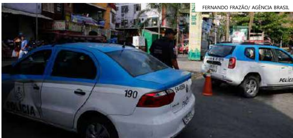
Dos tiroteios perto de escolas, 226 deles foram decorrentes de ações policiais.

A cidade do Rio foi quem mais sofreu com as trocas de tiros perto de unidades escolares. Foram 330 das 460 ocorrências. Em Duque de Caxias, houve 37 casos. Entre os bairros, os mais impactados foram Praça Seca (27), Vila Kennedy (23), Cidade de Deus (19), Bangu (14) e Brás