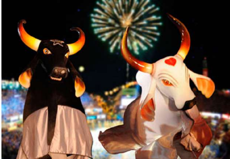
Um mapeamento foi realizado para identificar pontos que seriam importantes para trazer o Boi-Bumbá para este novo momento

"O Boi é um ritmo que está consolidado na Amazônia e agora está prontíssimo para conquistar o país e também ser reconhecido internacionalmente. Imagino que daqui a cinco anos a gente tenha grupos organizados de bandas musicais de Boi-Bumbá profissionalizadas tocando em todo Brasil", diz. Para a representante co-