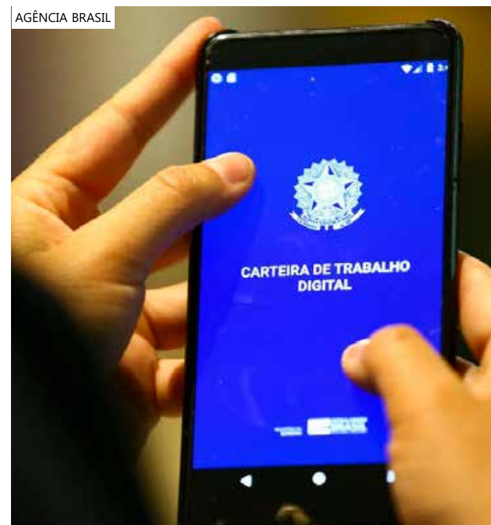
No acumulado dos cinco primeiros meses país tem 856 mil novos postos

o Caged do mês de maio revela que foram gerados 65 mil postos de trabalho para mulheres e quase 90 mil para homens.