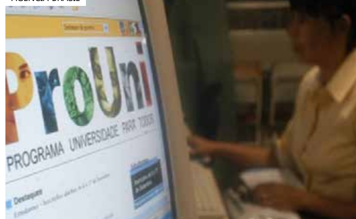
O Prouni é uma oportunidade importante para estudantes

ter participado da edição de 2021 ou 2022 do Exame Nacional do Ensino Médio (Enem) e ter obtido pontuação igual ou superior a 450 pontos na média das notas. Além disso, o candidato não pode ter zerado a nota da redação e não pode ter realizado o Enem na condição de