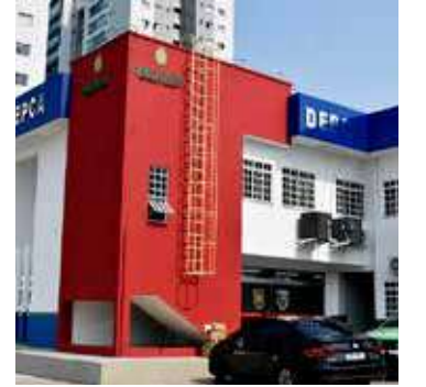
Suspeito responderá por estupro