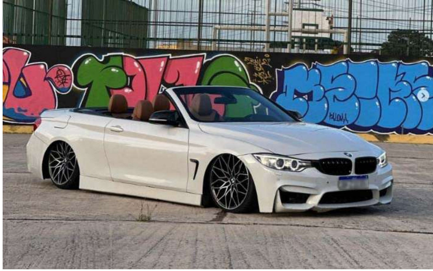
Durante as buscas foram apreendidos veículos de luxo, adquiridos com base em atividades criminosas

"Durante as buscas foram apreendidos veículos de luxo, adquiridos com base em atividades criminosas. Além disso,