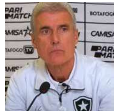
Luis Castro aceitou proposta para ser o técnico do Al Nassr