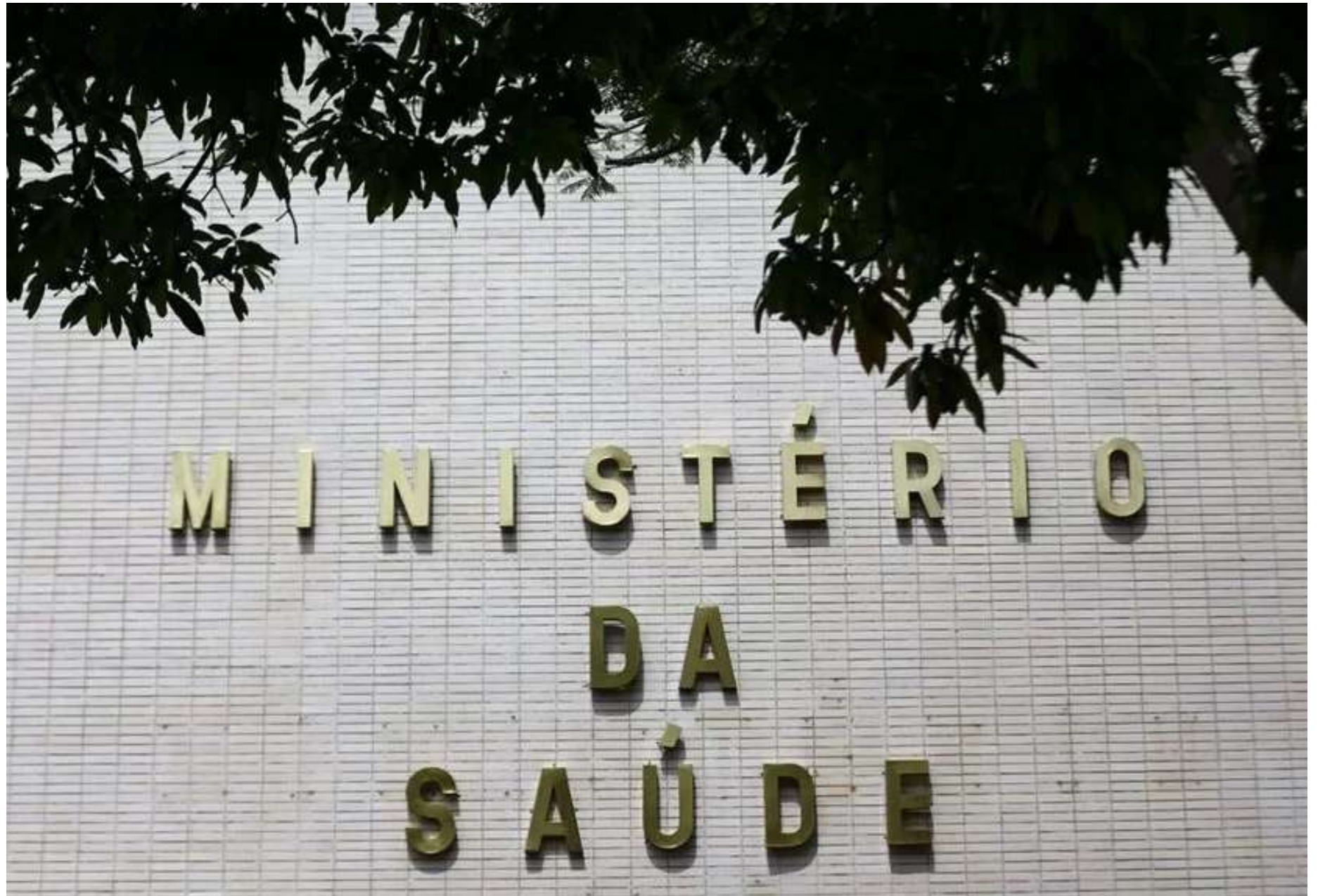
O anúncio foi feito durante o lançamento do Inquérito Telefônico de Fatores de Risco para Doenças Crônicas

sília, todas as vigilâncias estaduais de doenças crônicas não transmissíveis, acidentes e violência para discutirmos um plano de ação ao longo dos próximos dois anos", destacou a secretária, ao se referir aos temas como invisibilizados. "É fundamental que possamos nos apropriar desses resultados e traçar estratégias juntos", completou.