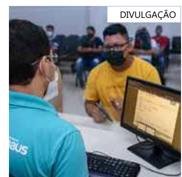
Interessados devem apresentar comprovante de vacinação e documentos

Os interessados devem estar munidos do comprovante de vacinação (Covid-19), currículo e documentos pessoais (RG, CPF, PIS, CTPS, comprovante de escolaridade e residência). Não é necessário apresentar cópias, somente os documentos originais.