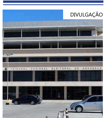
Tre julga contas do PT-AM