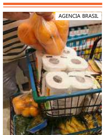
De janeiro a maio, aumento foi de 2,33%

café moído, carne, farinha de mandioca, farinha de trigo, feijão, leite longa vida, margarina, massa/macarrão, óleo de soja e queijo) fechou em R$ 322 em maio, 0,14% a menos do que em abril. A perspectiva da associação, quanto ao cenário que se tem pela frente, é positiva.