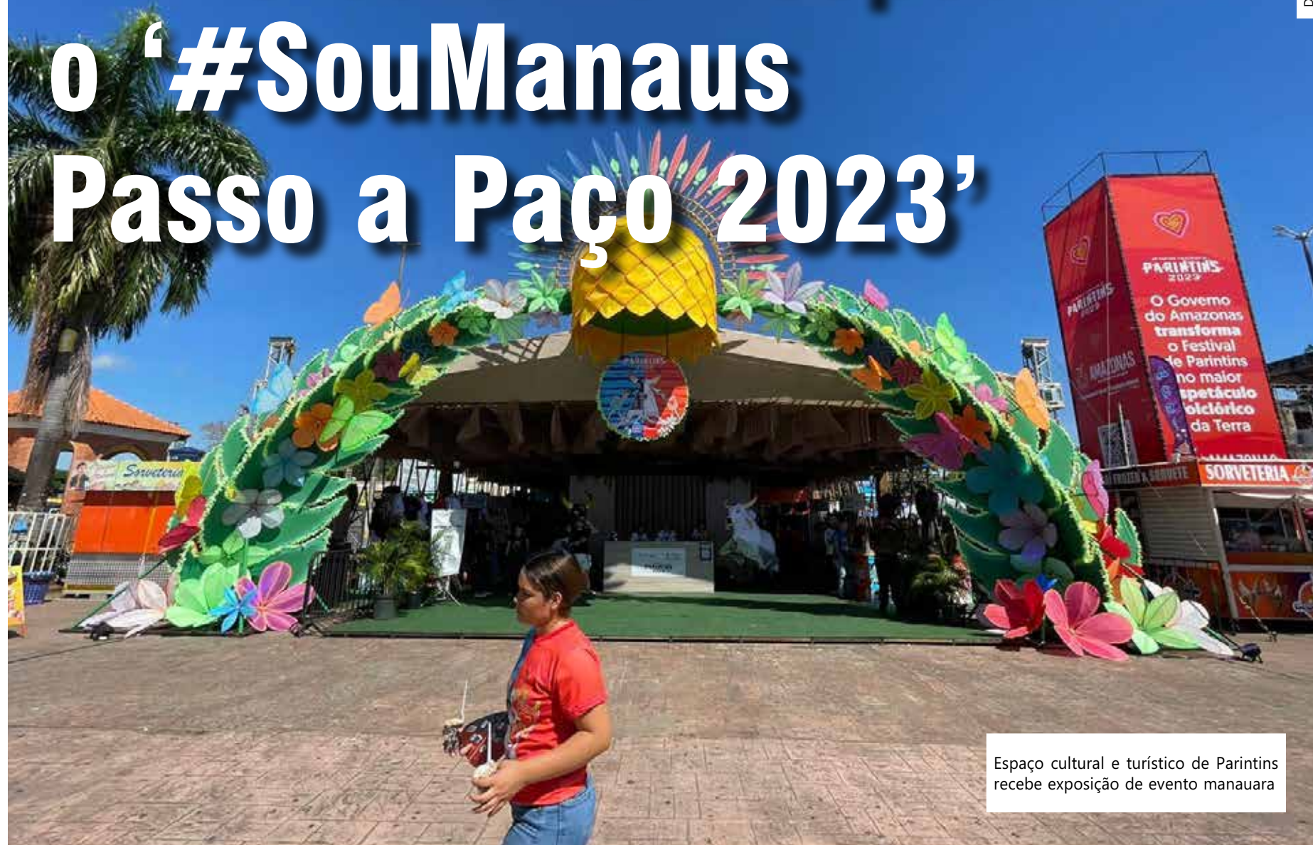
Espaço cultural e turístico de Parintins recebe exposição de evento manauara