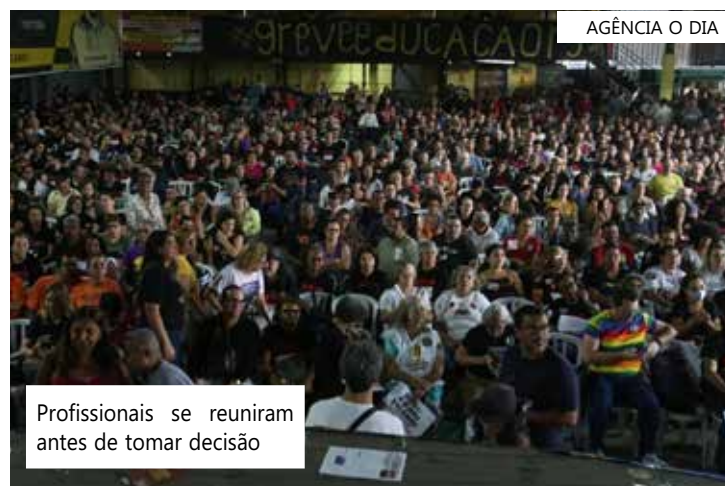
Profissionais se reuniram antes de tomar decisão

5. Migração: o Estado comprometeu-se, no prazo de 100 dias, a encaminhar ao Conselho do Regime de Recuperação Fiscal uma proposta de migração com aumento da carga horária de 18 horas para 30 horas/aula semanais, após análise de impacto orçamentário.