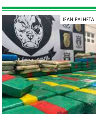
Drogas estavam em uma embarcação oriunda do município de Tabatinga

A autoridade policial destaca, ainda, que as investigações diante do caso continuarão, a fim de identificar os responsáveis. Um Inquérito Policial (IP) foi instaurado e, após liberação do Poder Judiciário, as drogas serão incineradas. E ressalta que a colaboração do setor privado foi essencial para o êxito da operação.