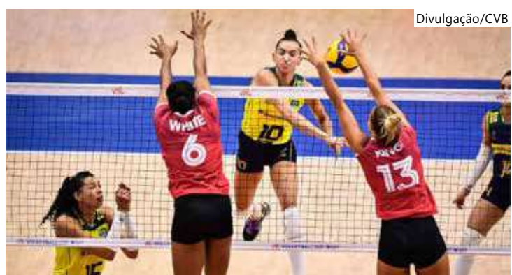
Partida terminou em 3 sets a 2 para o Canadá

Os jogos da Liga das Nações valem pontos para o ranking mundial da Federação Internacional de Voleibol (FIVB, na sigla em inglês), um dos parâmetros na corrida por vaga olímpica aos Jogos de Paris 2024.