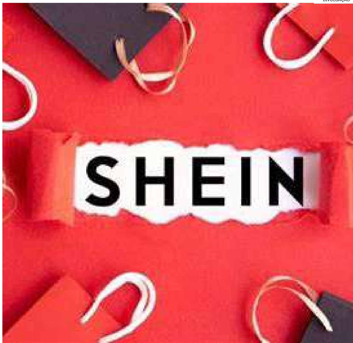
Empresa chinesa tem muitos clientes no Brasil

Chefe da Shein para a América Latina, Claure afirmou que a produção no Rio Grande do Norte faz parte do "compromisso" assumido com o ministro da