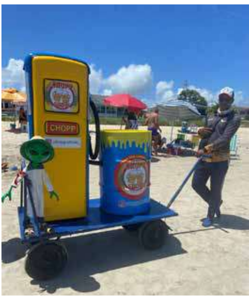
Nordestino é criativo, espirituoso e trabalhador