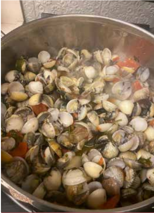
Os saborosos vongôles