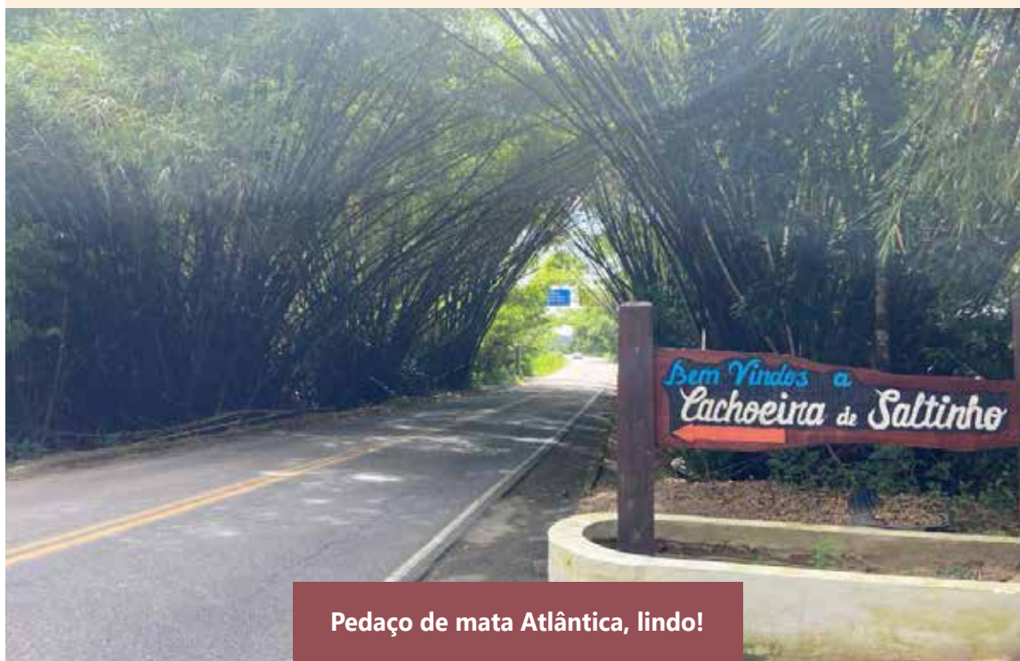
Pedaço de mata Atlântica, lindo!