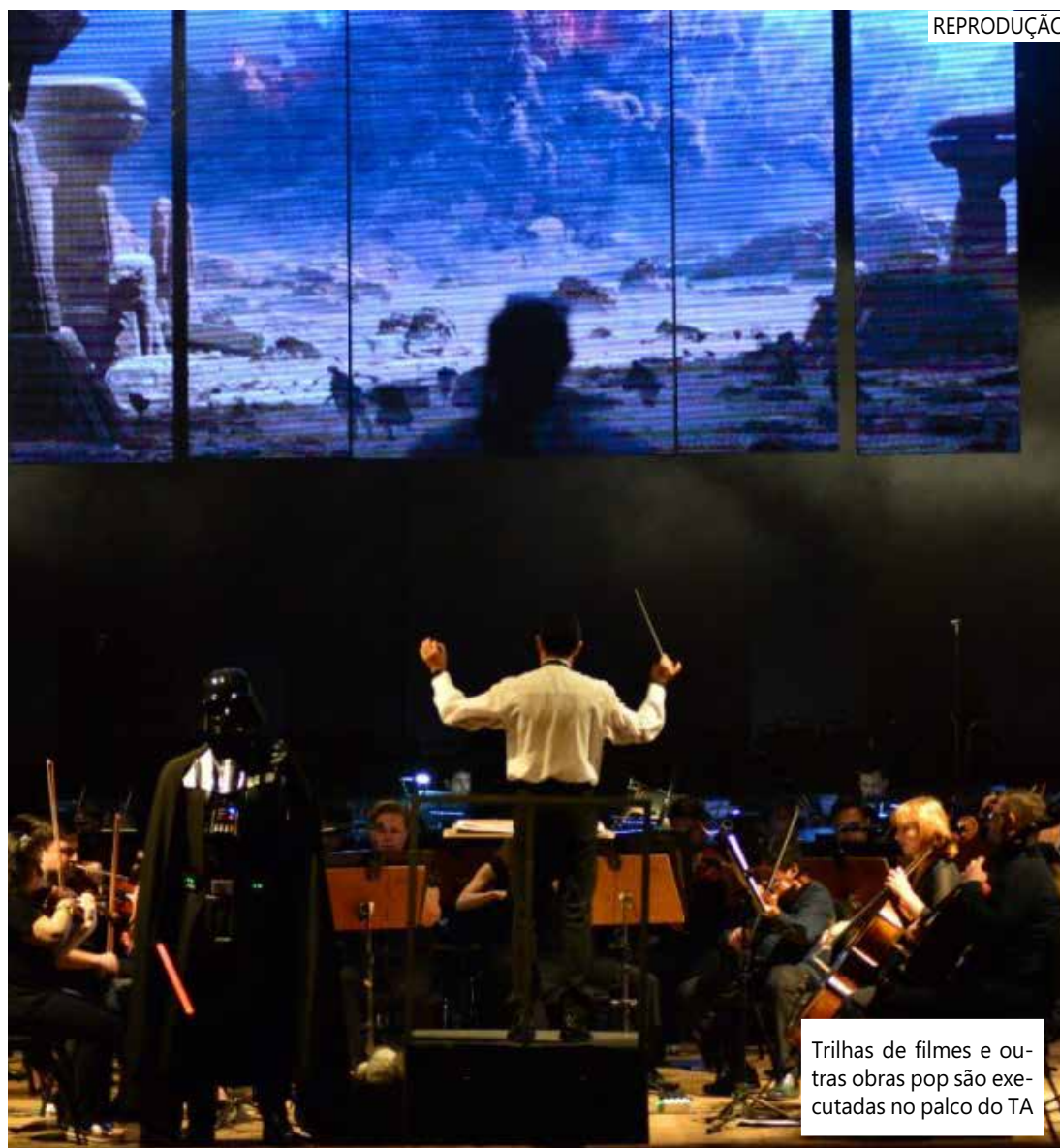
Trilhas de filmes e outras obras pop são executadas no palco do TA

o nome da palavra japonesa cujas traduções mais aproximadas para a língua portuguesa são "saudade" ou "nostalgia", o que segundo a Série Encontro das Águas, pode refletir perfeitamente a sensação que o espetáculo busca causar.