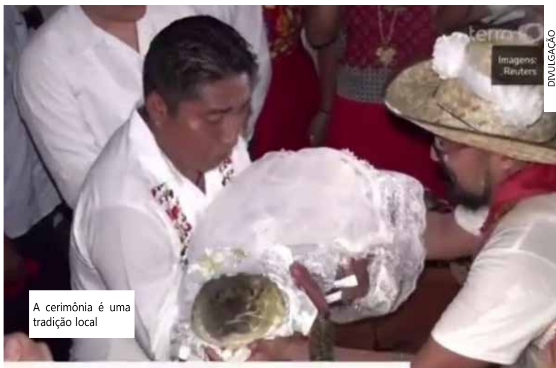
A cerimônia é uma tradição local

Oaxaca, no sul do México, é a região mais rica em cultura indígena. O local é lar de muitos grupos que mantiveram suas línguas e tradições.