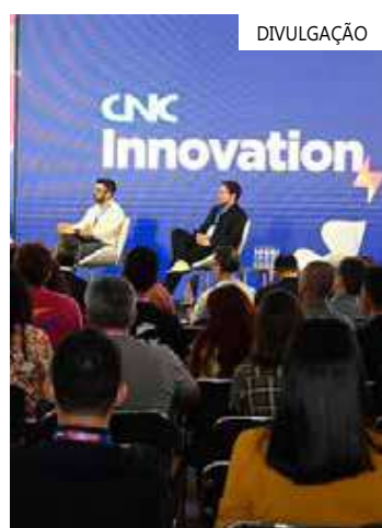
CNC Innovation Day

O CNC Innovation Day em Manaus tem como meta atingir um público de aproximadamente 300 participantes. Dessa forma, os empresários dos segmentos de comércio de bens, serviços e turismo e membros dos sindicatos relacionados à Fecomércio AM.