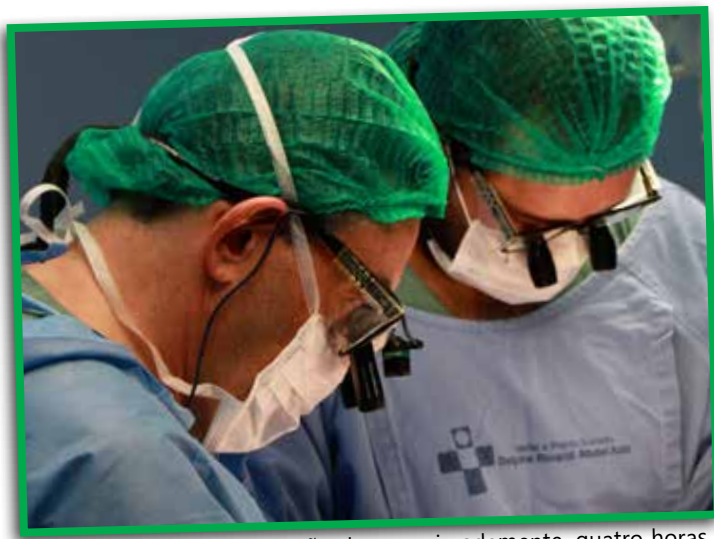
O procedimento teve duração de, aproximadamente, quatro horas

O transplante renal é um tratamento para pacientes com diagnóstico de insuficiência renal crônica, estando o doente em diálise ou mesmo em fase pré-dialítica. As consultas com os pacientes