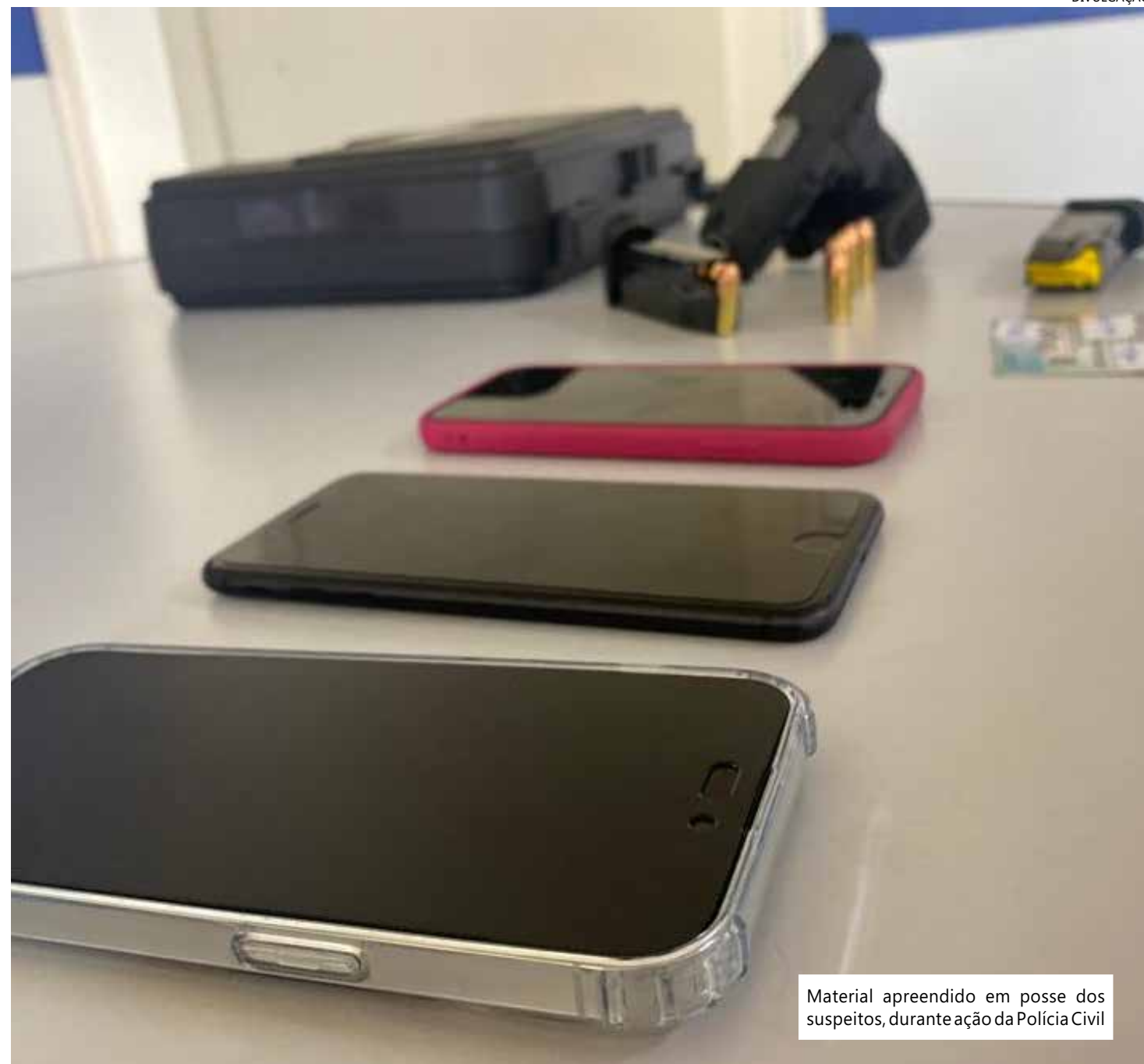
Material apreendido em posse dos suspeitos, durante ação da Polícia Civil

"Durante a ação, conseguimos prender a influenciadora digital conhecida como Isabelly Aurora, que já possui um extenso histó-