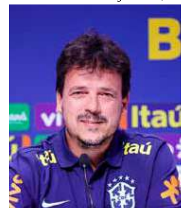
Diniz segue no Fluminense enquanto assume a Seleção