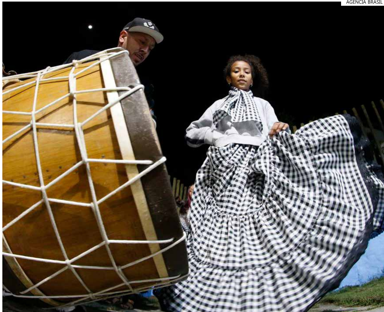
Registro de Samba de Bumbo Paulista como bem cultural - Casa de Samba

Santana de Parnaíba foi o destino de uma parcela significativa de negros