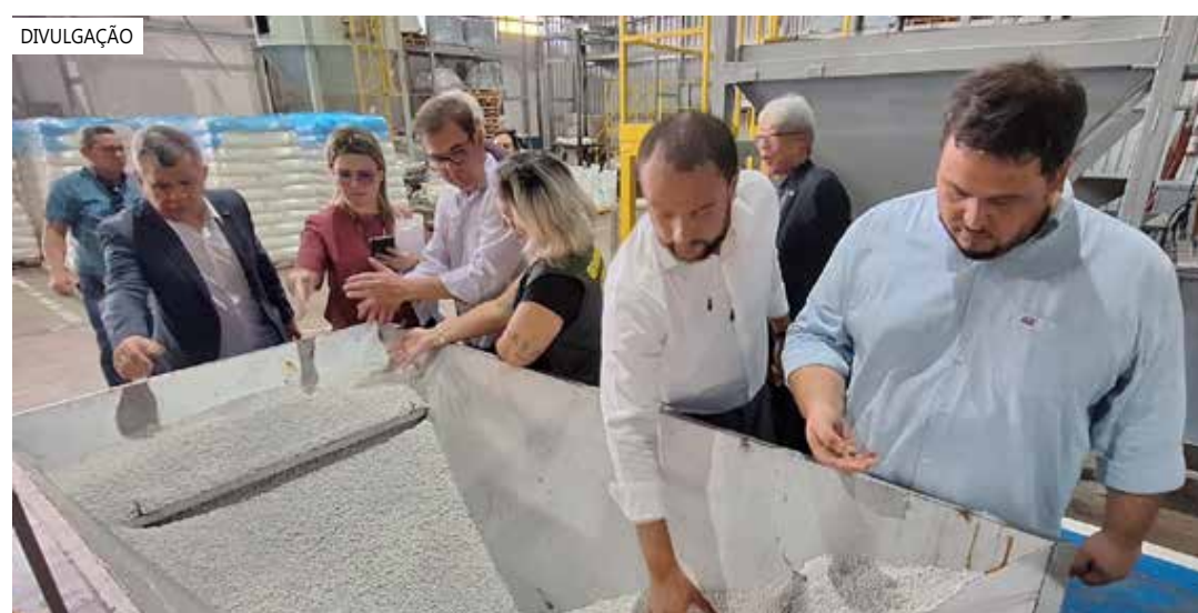
Rubberon Indústria, Comércio e Exportação S.A.

Além do grupo Rubberon, a Suframa já visitou este ano as duas unidades produtivas da Semp TCL no (PIM), e a Multilaser. Segundo a Autarquia, o mesmo procedimento ainda será feito junto a empresas dos ramos de informática, químico, duas rodas, entre outros.