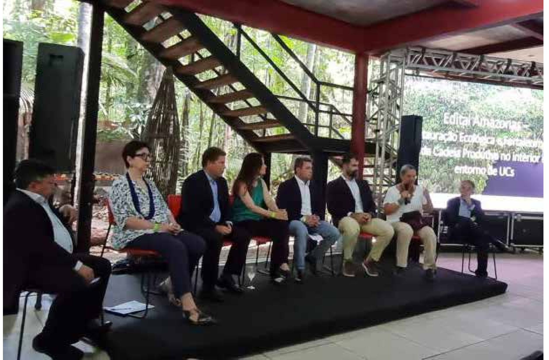
A iniciativa por meio do BNDES e entidades parceiras investe na conservação da biodiversidade

O recorte inclui quatro áreas de Proteção Ambiental (APAs), uma Floresta, dois Parques Estaduais e três Reservas de Desenvolvimento Sustentável, áreas altamente prioritárias para a recuperação florestal da Amazônia. Todas as unidades de conservação contempladas no edital são geridas pela Secretaria de Estado do Meio Ambiente do Amazonas (Sema) que