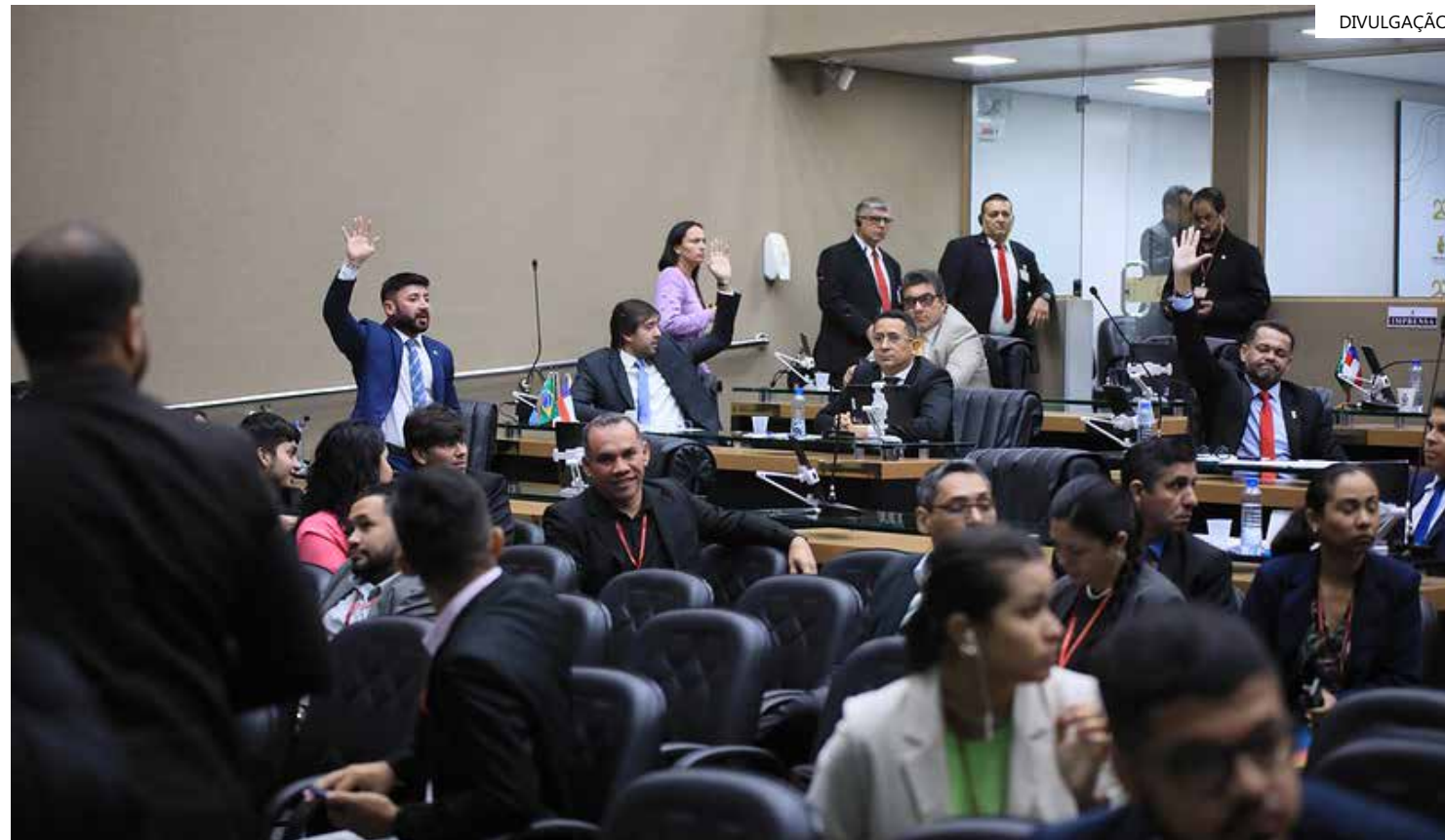
Deputados zeraram a pauta já nesta quarta-feira