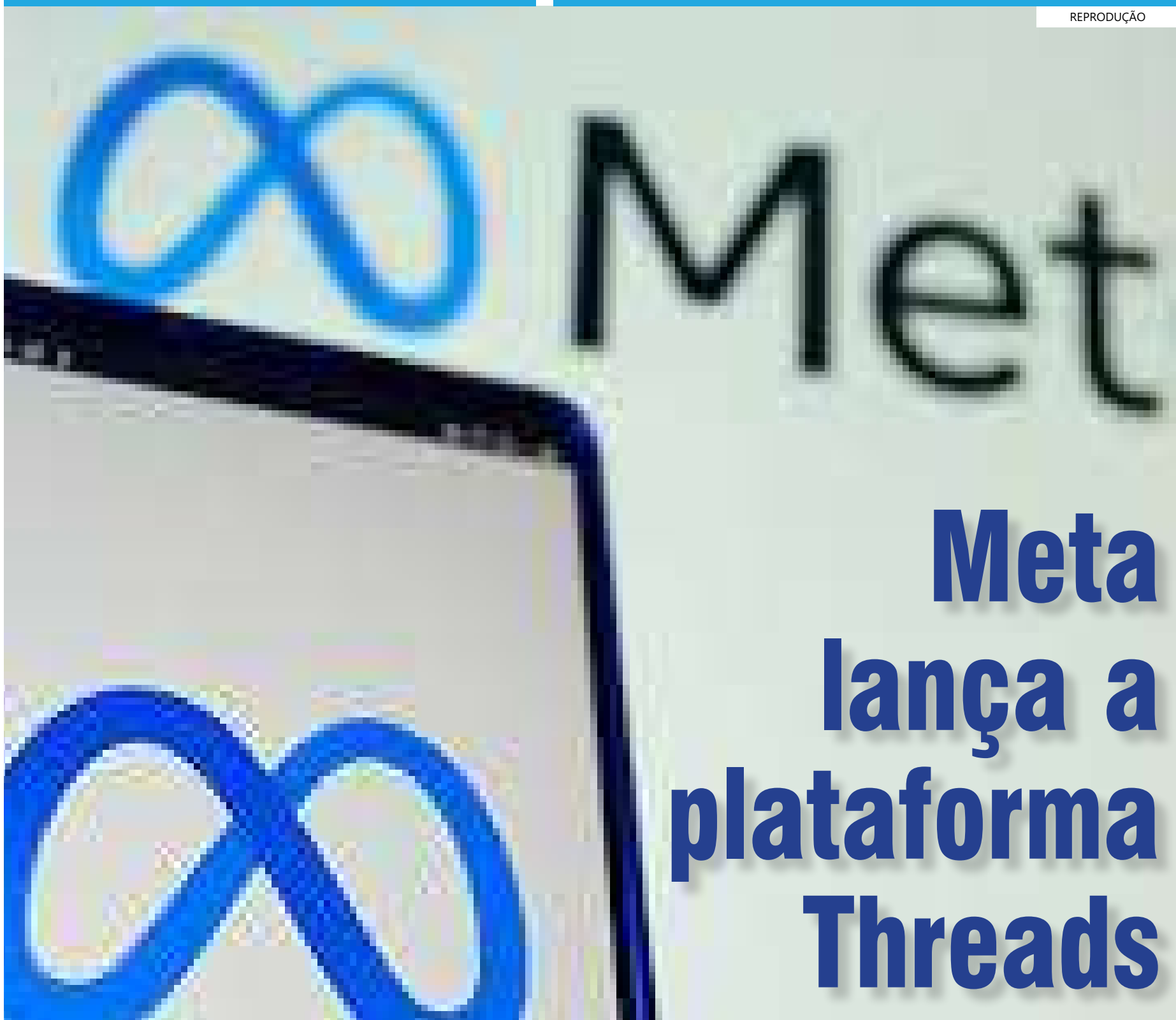
Nova plataforma já está disponível para usuários do Instagram