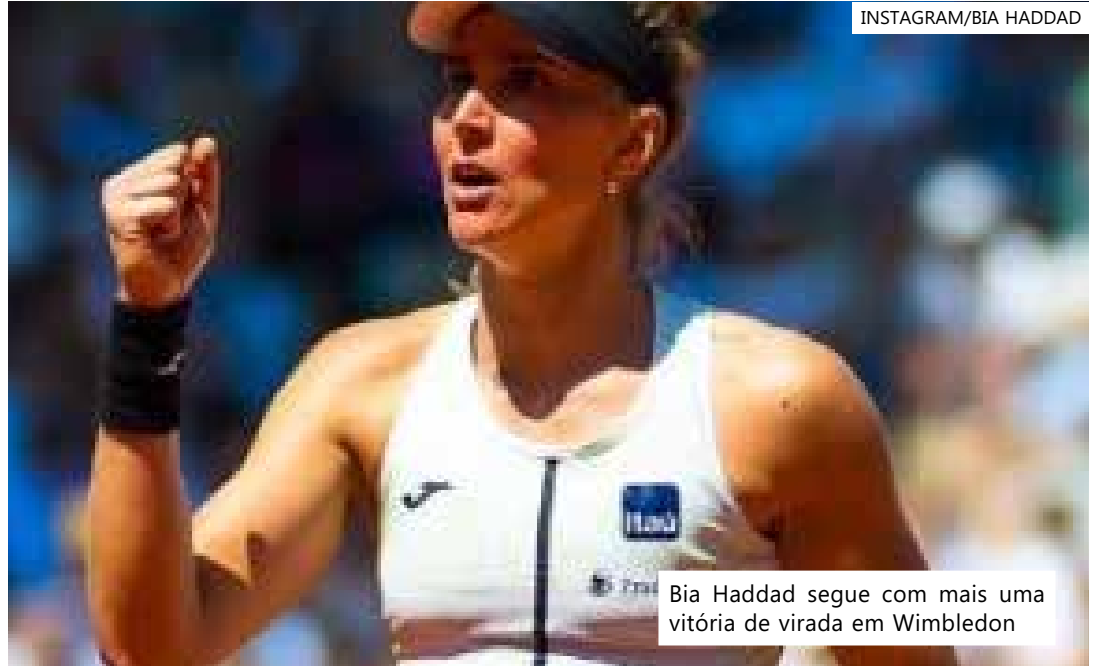
Bia Haddad segue com mais uma vitória de virada em Wimbledon