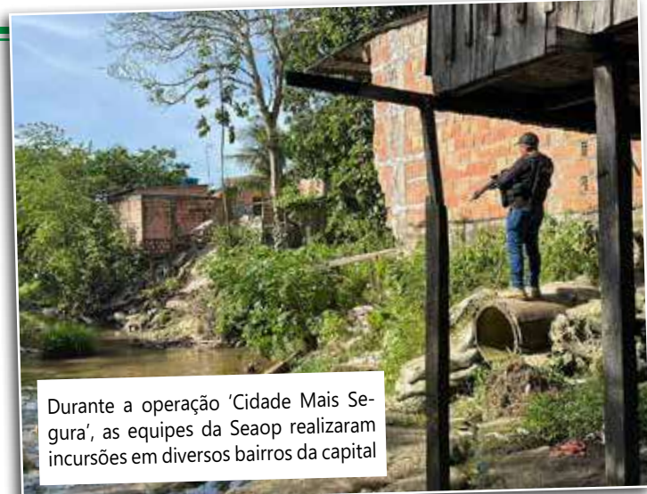
Durante a operação 'Cidade Mais Segura', as equipes da Seaop realizaram incursões em diversos bairros da capital

Incursoes Durante esse período, em cumprimento da operação Cidade Mais Segura, desencadeada pela SSP-AM, as equipes da Seaop realizaram incursões em bairros