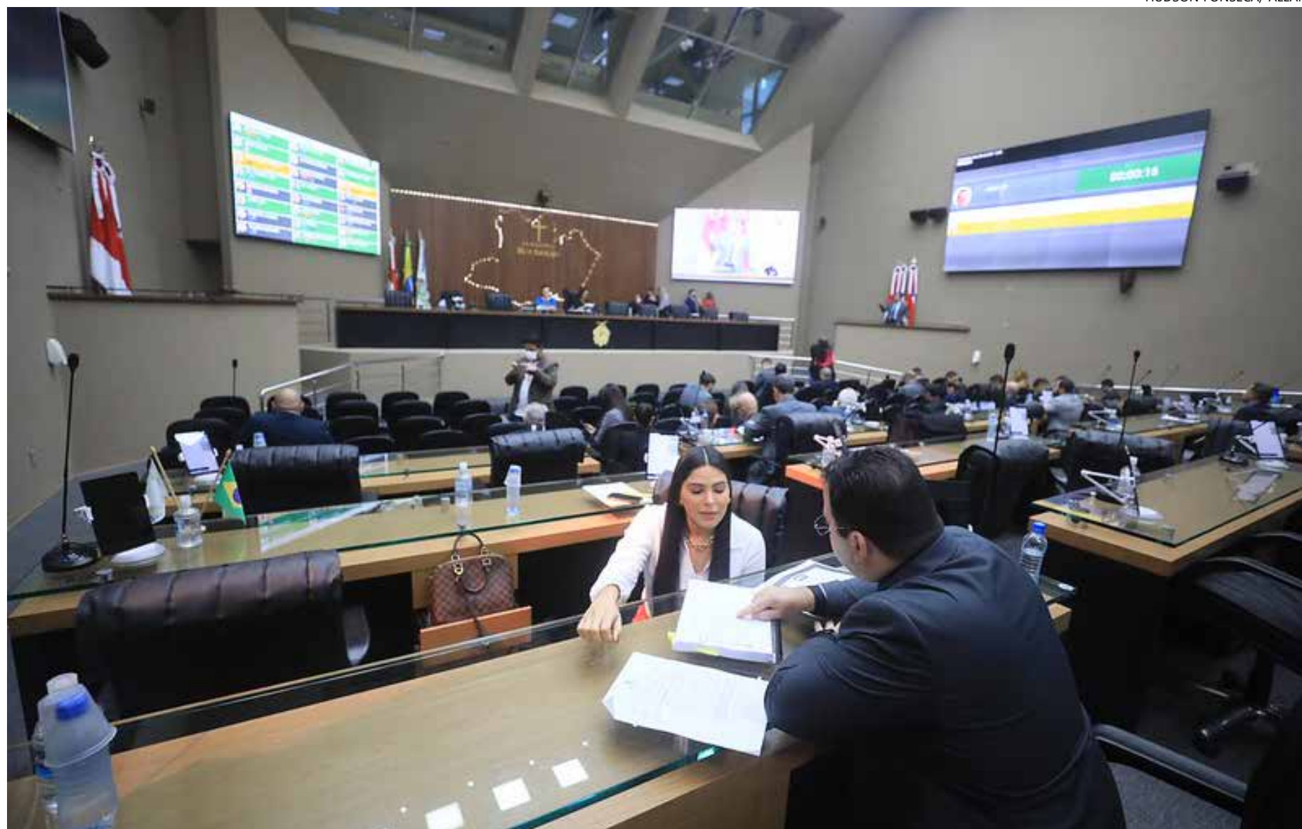
Durante sessão ordinária deputados estaduais falaram sobre a Reforma Tributária que acontece em Brasília

O plenário da Câmara dos Deputados discute, desde o fim da manhã da quinta-feira (5), a Proposta de Emenda à Constituição da reforma tributária (PEC 45/19). O relatório foi lido na noite de quarta-feira (5) e a previsão era de votação da proposta a partir das 18h, em primeiro turno.