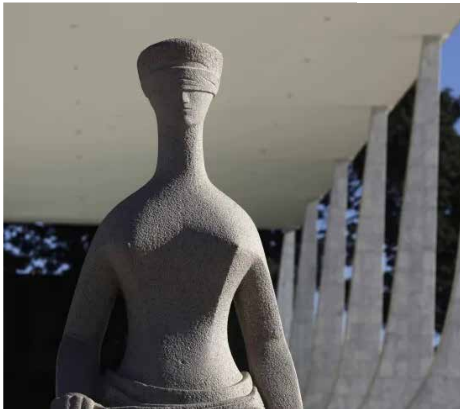
O relator, Nunes Marques, havia decidido em outubro manter a validade da norma que ampliou a margem consignável

O relator, Nunes Marques, havia decidido em outubro manter a validade de uma norma que ampliou a mar-