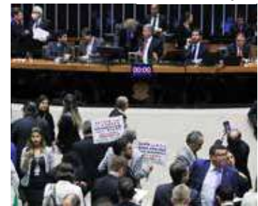
Deputados protestaram sobre o texto