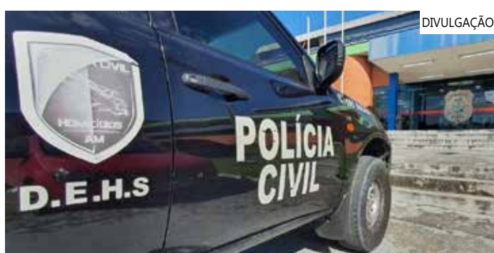
A DEHS instaurou inquérito para investigar o crime