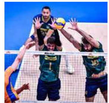
Brasileiros bloqueiam seleção holandesa