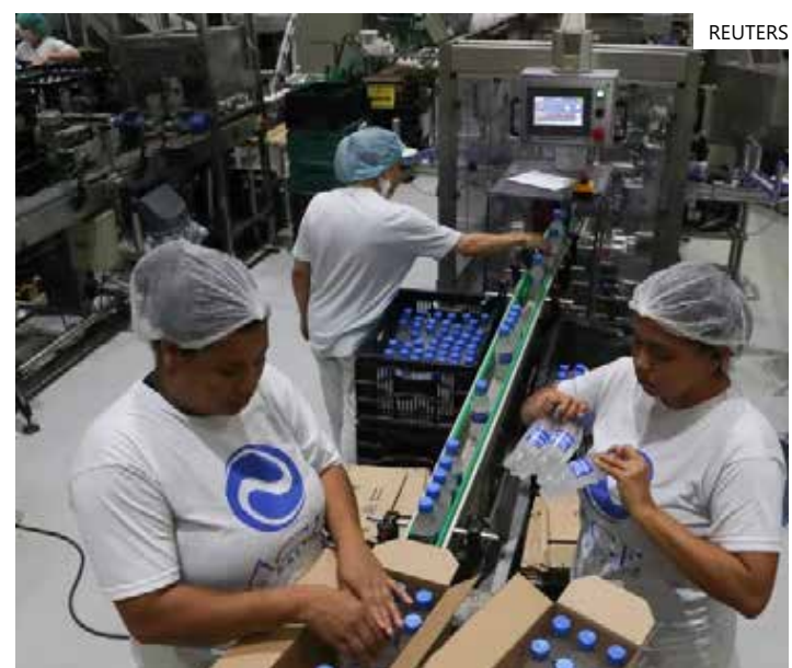
Setores de cadeia produtiva longa serão mais beneficiados

entes federativos e, principalmente, estados e municípios que são afetados de formas diferentes, dependendo da região. Acho que o consenso é possível, parece estar próximo e vai oportunizar que o Brasil esteja num estágio avançado de crescimento econômico", concluiu.