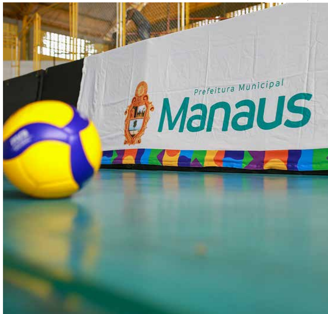
Manaus vai concorrer com cidades do mundo todo pelo título