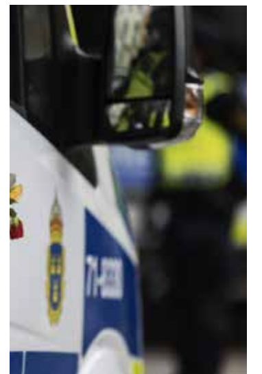
O homem foi detido e levado à delegacia

As ações da Meta fecharam em alta de 3% na quarta-feira, antes do lançamento