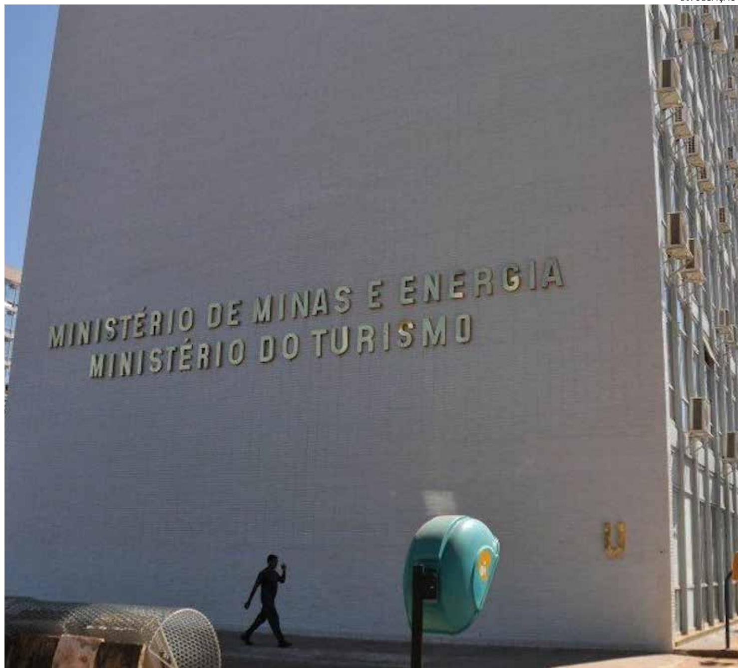
Ministério do Turismo está na mão do União Brasil que pressionava Lula pela troca

O novo ministro do Turismo será o deputado federal Celso Sabino (União Brasil-PA), indicação do partido, que vinha reivindicando a pasta após divergências in-