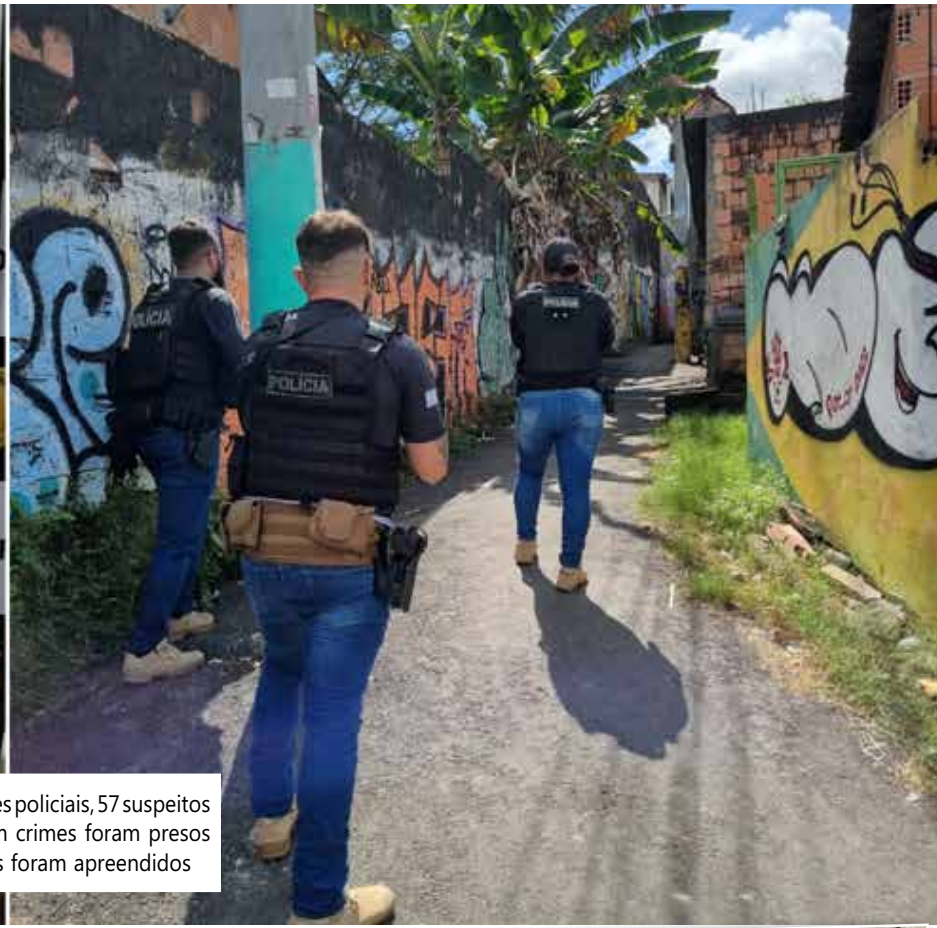
No decorrer das ações policiais, 57 suspeitos de envolvimento em crimes foram presos e nove adolescentes foram apreendidos

As ações ocorreram por meio da Seaop e resultaram em 66 prisões e mais de 750 quilos de drogas apreendidos