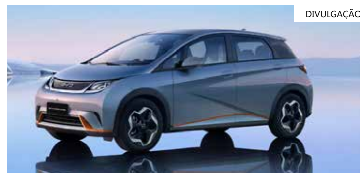
Modelo que vendeu quase mil unidades

A montadora chinesa BYD anunciou nesta quinta-feira (6) que o novo BYD Dolphin alcançou 1.254 unidades vendidas em apenas sete dias após lançamento no Brasil.