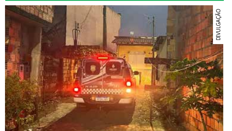
Ação resultou em seis prisões e na apreensão de drogas, arma e veículos

Procedimentos Os presos responderão por tráfico de drogas, associação para o tráfico, receptação e posse ilegal de arma de fogo e ficarão à disposição da Justiça.