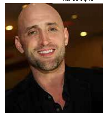
Ator que batiza a lei faleceu em 2021 vítima da Covid-19