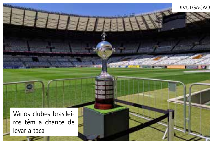
Vários clubes brasileiros têm a chance de levar a taça