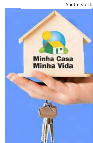
O MCMV foi relançado este ano pelo governo Lula