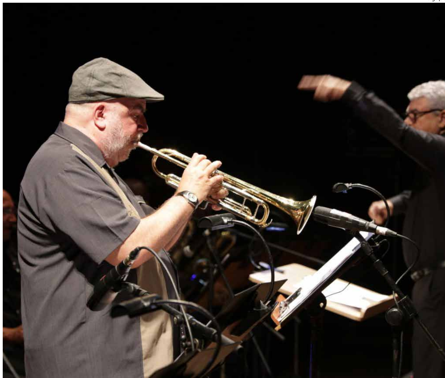
Randy Brecker é considerado um dos maiores trompetistas de todos os tempos

A obra é composta pelas músicas "Some Skunk Funk",