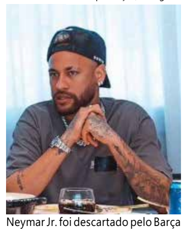
Neymar Jr. foi descartado pelo Barça