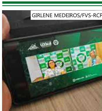
Oficina é voltada para 20 municípios do interior do Estado

Nesta terceira etapa, os municípios participantes são: Amaturá, Anamá, Apuí, Barcelos, Barreirinha, Benjamin Constant, Boa Vista do Ramos, Caapiranga, Coari,