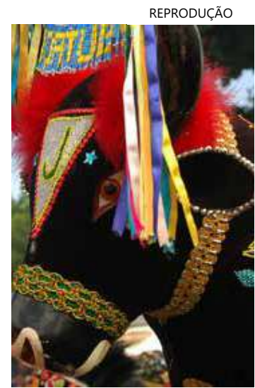
Folclore é alvo de programa de bolsas do Iphan

O objetivo do programa é formar, treinar e capacitar profissionais e pesquisadores para atuar de forma técnica e científica no campo cultural, em especial das culturas populares e do patrimônio cultural.