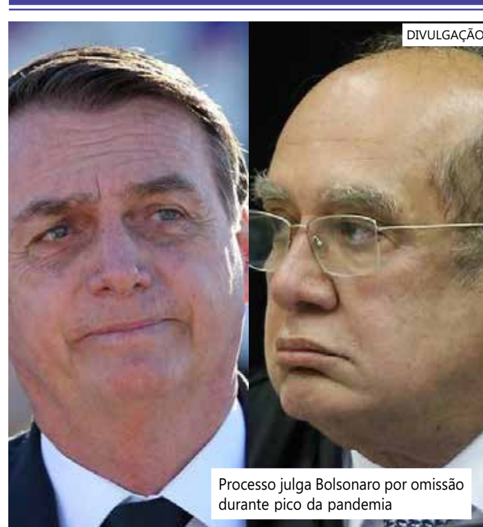
Processo julga Bolsonaro por omissão durante pico da pandemia

A reportagem tentou entrar em contato com a defesa de Bolsonaro mas até o fechamento da matéria não obteve respostas.