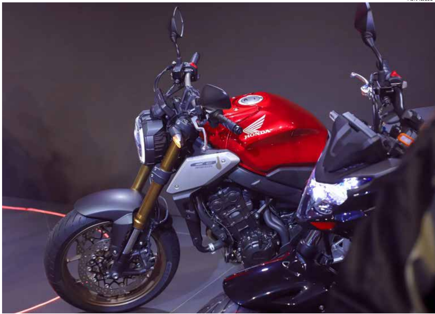
Em junho foram fabricadas 95.274 motocicletas

Em junho foram fabricadas 95.274 motocicletas, volume 6,3% inferior na comparação com o mesmo mês do ano passado. A média diária de vendas em junho, que teve 21 dias úteis, foi de 6.685 motocicletas.