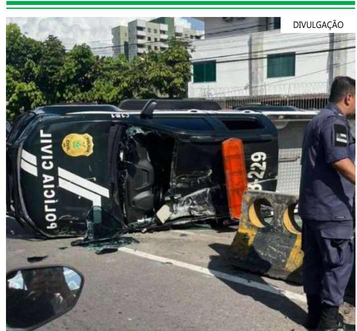
Após o acidente, todos os envolvidos foram socorridos e levados para o HPS 28 de Agosto

zona sul de Manaus. Todos foram socorridos e encontram-se bem. Uma perícia será realizada pelo Instituto de Criminalística (IC) para averiguar as causas do fato."