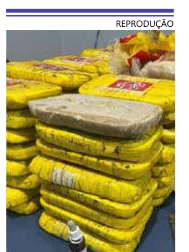
Segundo a Polícia Civil o vereador estava em um sítio com o material