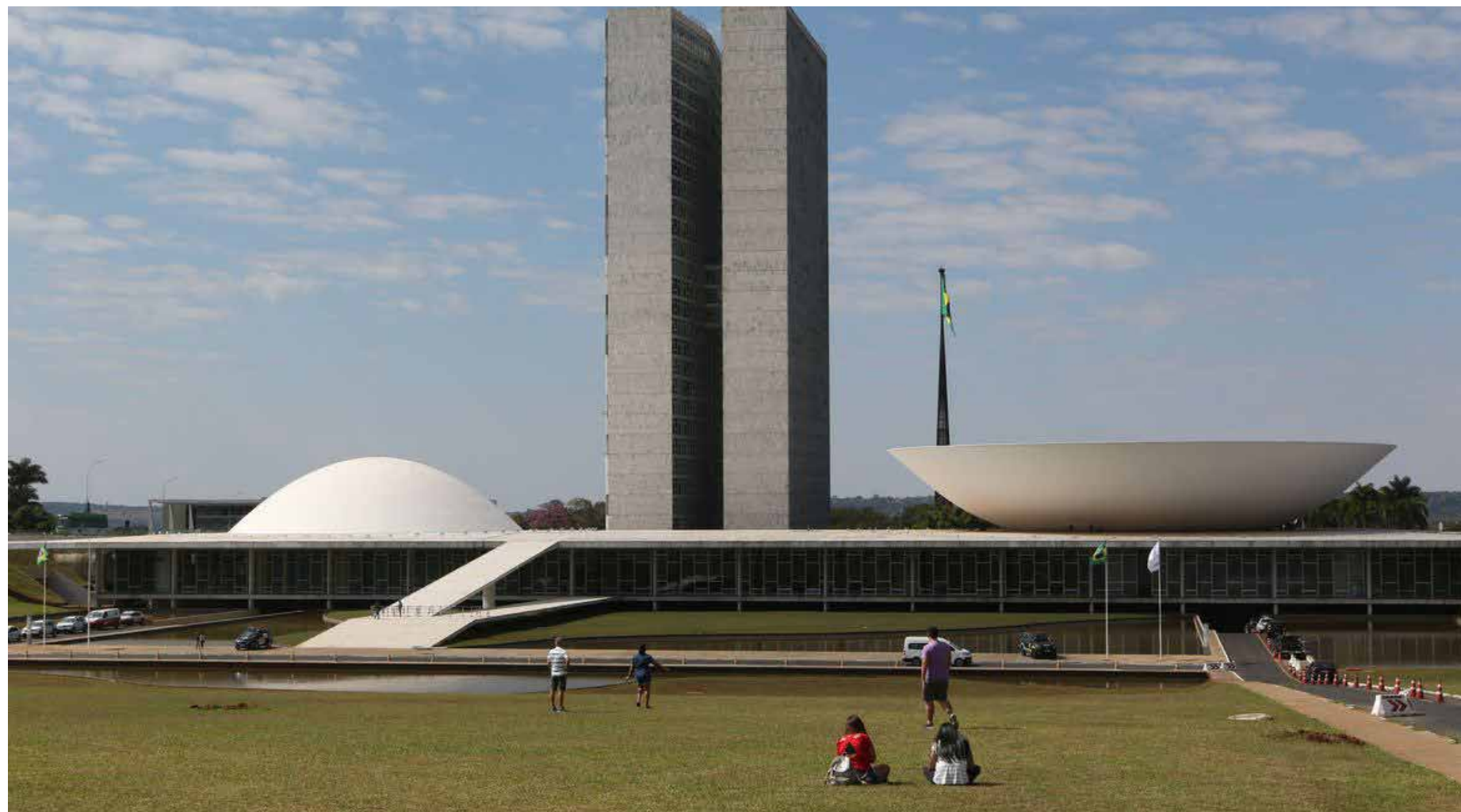
Tanto a Câmara dos Deputados quanto o Senado se concentra esta semana nessas atividades

CPMI do golpe de 8 de janeiro é uma das atividades