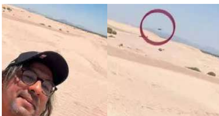
Turista em dunas de Bilbao

onde moro, também vimos [um]", denunciou outro seguidor. "Conheço pessoas que já viram isso na represa várias vezes", relatou uma terceira. "Era eu em um Tesla", debochou outro. Esta não seria a primeira vez que a suposta presença alienígena teria sido flagrada no país. Recentemente, um ser não identificado foi encontrado em um armazém abandonado no México, durante obras na cidade de Santa Mar a Regla. A suposta espécie seria um feto, e acredita-se que seria de uma criatura folclórica mexicana. O prefeito da cidade, Francisco Mayoral Flores, disse que seriam restos mumificados de um "goblin ou nual". No folclore local, o nual é um feiticeiro capaz de assumir a forma de animais. O achado foi levado para o Museo de los Dientes, em Huasca de Ocampo.