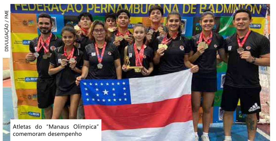
Atletas do "Manaus Olímpica" comemoram desempenho

Com os resultados, o trio está classificado para disputar o Top-16, competição nacional prevista para acontecer em setembro.