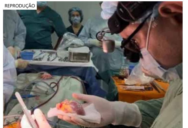
Coração transplantado para a paciente foi doado por um menino de 4 anos