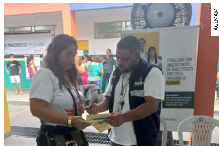
As equipes da Agemam também promoveram a distribuição de folders informativos

"Manaus Mais Cidadã" reuniu, dentro das instalações da escola municipal São Benedito, localizada no bairro Cidade de Deus, no total, mais de 20 mil atendimentos foram realizados durante a programação de sábado, que atende a uma determinação do prefeito David Almeida, de ofertar serviços públicos para comunidades de difícil acesso e mais necessitadas.