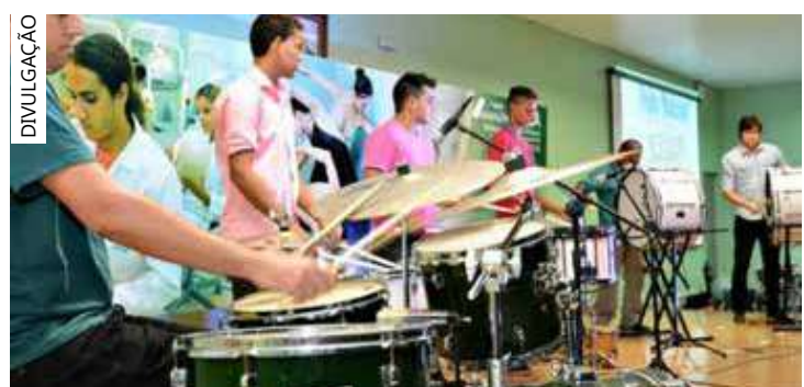
Workshop promete amplo espaço de reflexão a músicos e regentes

O workshop tem a proposta de proporcionar aos músicos e regentes de bandas de música um amplo espaço para a reflexão e prática da proposta do ensino-aula como ferramenta pedagógica de regência. Inscrições em uea.edu.br