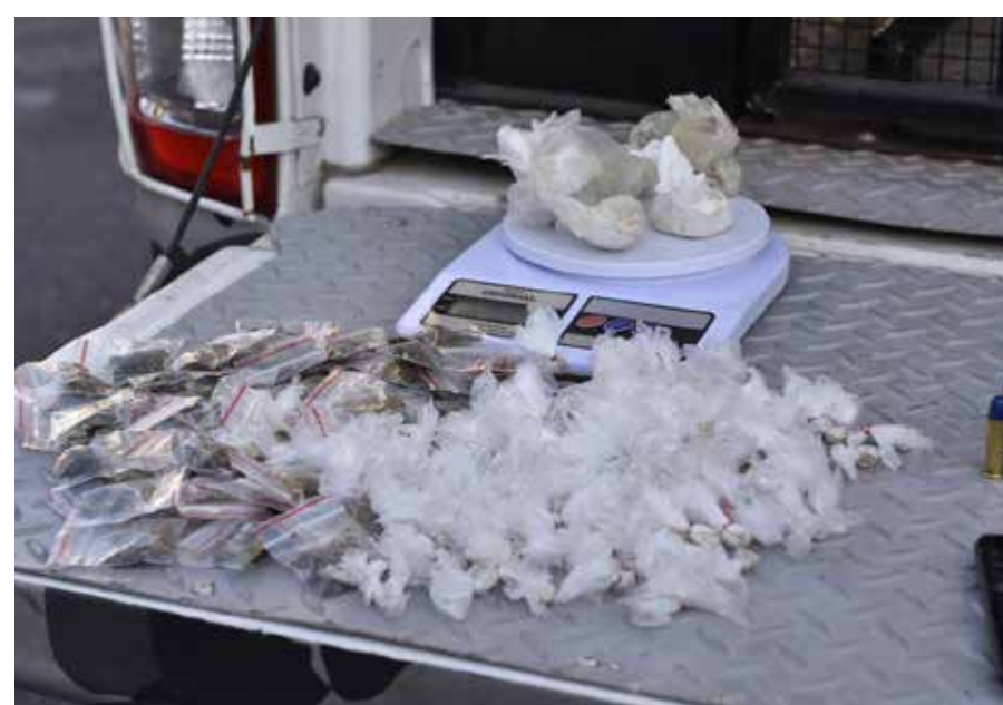
As investigações continuam, por tempo indeterminado, com intuito de coibir o tráfico de drogas na área

Deflagrada pela Polícia Civil e Polícia Militar do Amazonas, a Operação Ocupação contou com a atuação de 230 agentes