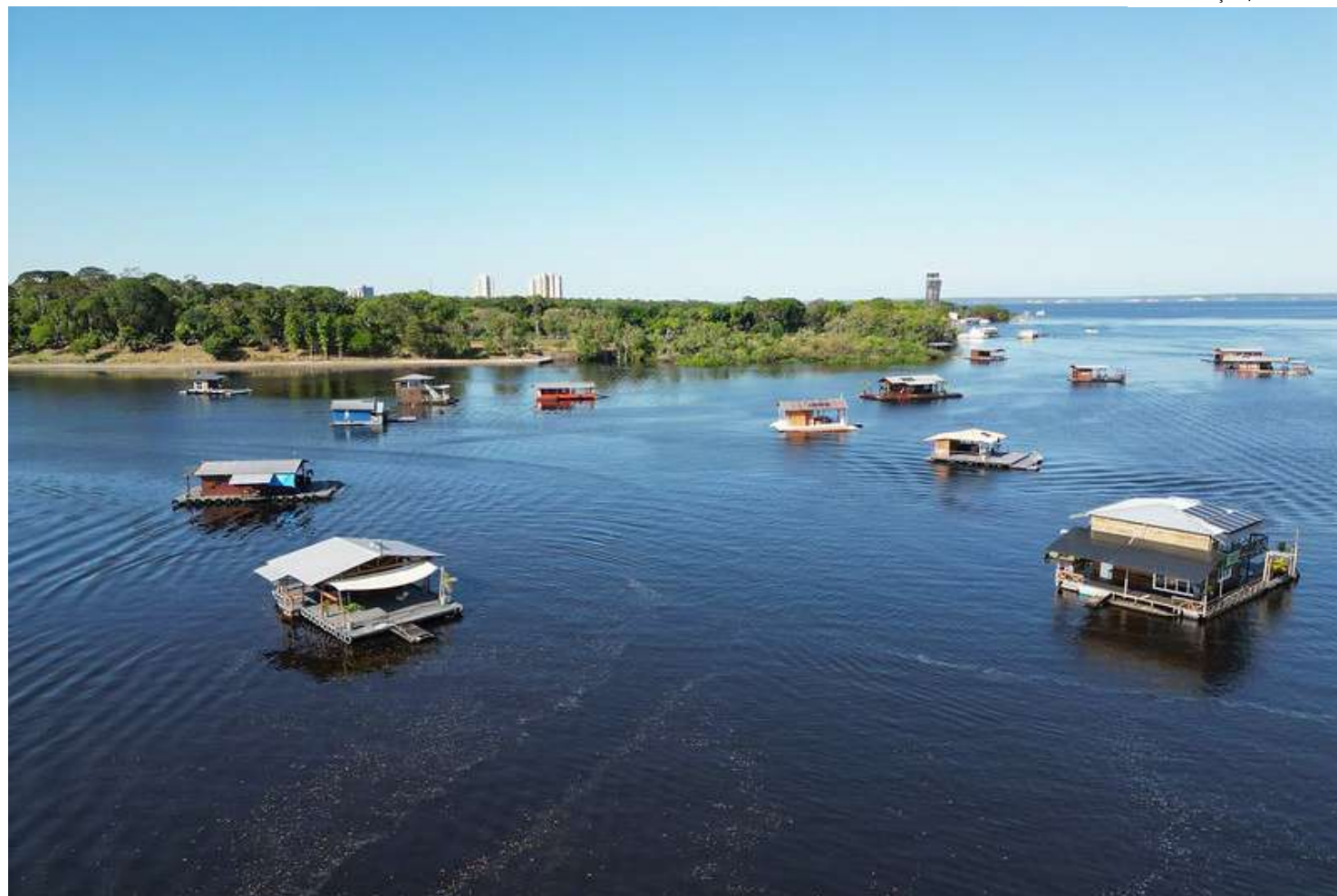
Proprietários de flutuantes têm se organizado para ter o direito de se regularizar por meio do licenciamento ambiental

morador e representante de um flutuante da área, é necessário um estudo de ordenamento, assim como os requisitos para compreender a grande variedade de tipologias de flutuantes na bacia do Taramã-Açu.