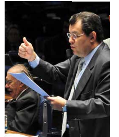
Eduardo Braga é senador pelo AM