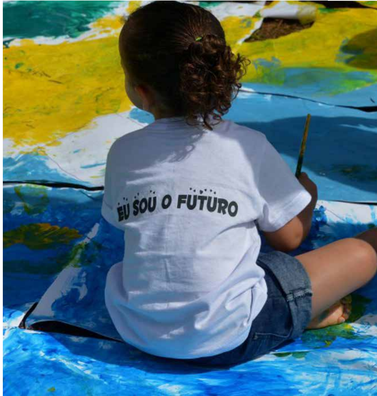
Em 2021, o Brasil registrou cerca de 2,6 milhões de nascimentos, segundo o IBGE

No ano 2000, o economista James Heckman recebeu o Prêmio Nobel de Economia pelo estudo, que realiza