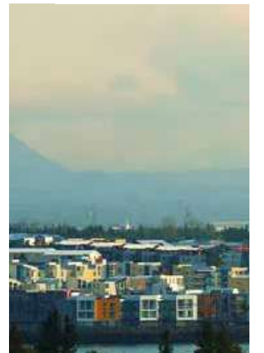
Vista de Reykjavik na Islândia