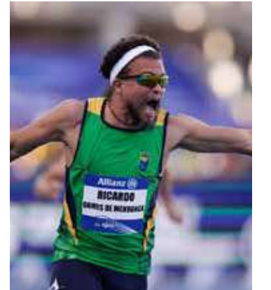
Ricardo Mendonça levou ouro no Paralímpico de Paris