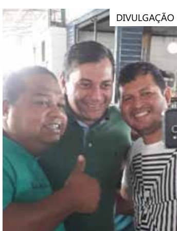
Popularidade cresceu no interior

Aprovações acima de 50% foram observadas em sete municípios pesquisados: Manacapuru, Itacoatiara, Coari, Tefé, Tabatinga, I