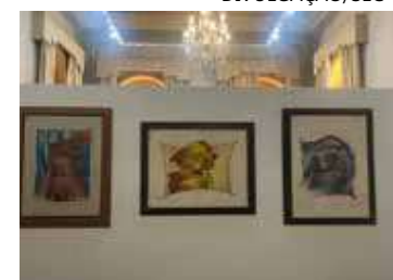
Exposições contam com desenhos e pinturas de Otoni Mesquita