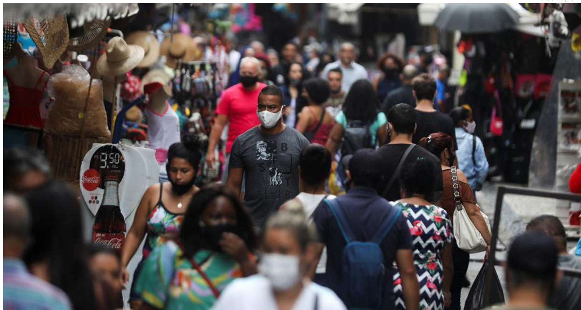
A proporção de consumidores com dívidas atrasadas voltou a crescer após seis meses

mesmo com o aumento do endividamento em junho, um mês antes do que a CNC estimava, a parcela média da renda comprometida com dívidas registrou o menor percentual desde setembro de 2020, ao atingir 29,6%.