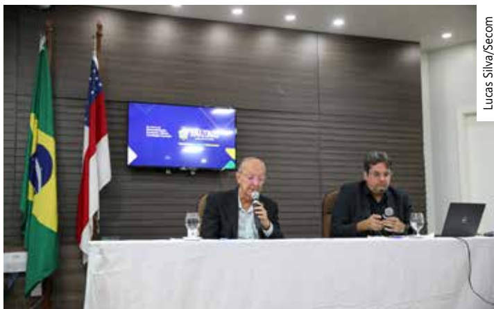
A estimativa é que esses investimentos abram 1.245 postos de trabalho

Entre os destaques na proposta de diversificação, está a empresa Cal-Comp, com previsão de R$ 333 milhões em investimentos, representando 43% da pauta, para produtos como câmera de vídeo para sistema de segurança, e rede "switch" roteador digital.