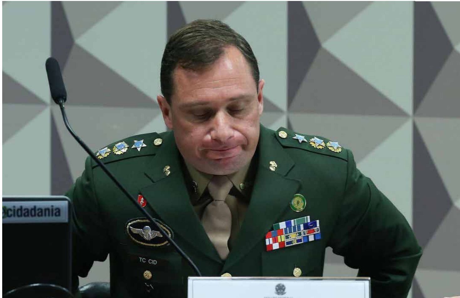
Tenente coronel prestou depoimento na terça (11)

Após garantir que, em 2019, assumiu a chefia da Ajudância de Ordem da Presidência da República por indicação do Comando do Exército e que sua nomeação não teve nenhuma ingerência política, o tenente-coronel destacou o fato de, ao longo de 27