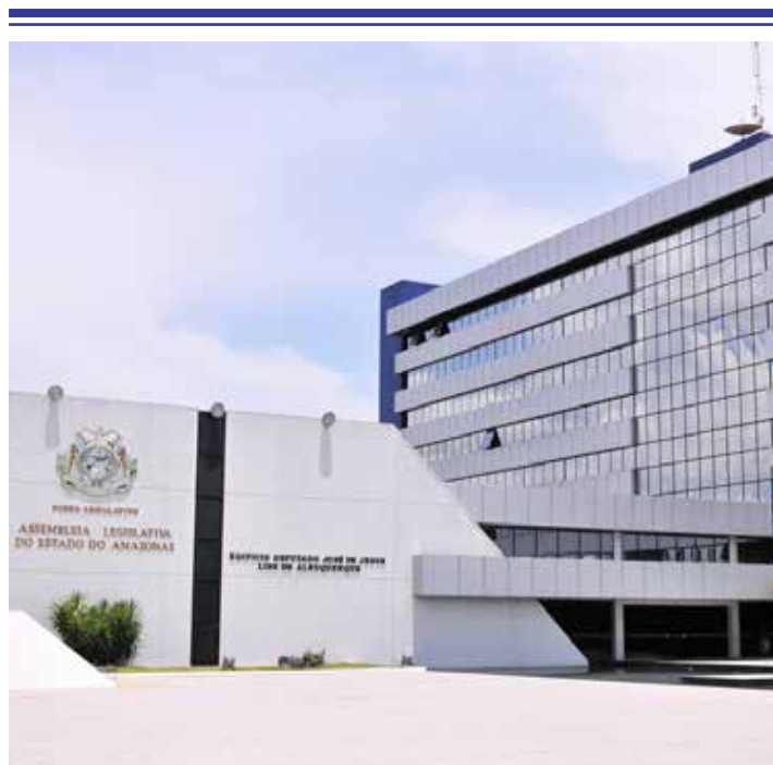
Votação aconteceu em sessão ordinária na quarta-feira (12)

A LDO 2024 aguarda agora a sanção do governador Wilson Lima. A partir de 1º de agosto, os deputados receberão do governo estadual o projeto da Lei Orçamentária Anual (LOA) para 2024, com um orçamento estimado em R$ 29,3 bilhões, que deverá ser votado até o final do ano.