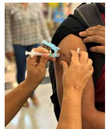
FVS divulga também a vacinação

aplicadas em todo o estado até esta quarta-feira (12/07), sendo 3.466.423 de primeira dose, 2.925.688 de segunda dose, 77.842 com dose única, 1.832.478 de 1ª dose de reforço, 742.286 de 2ª dose de reforço e 11.157 de dose adicional para os imunossuprimidos e 273.250 doses de vacina bivalente.