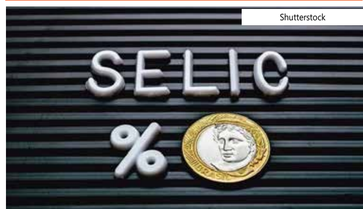
Qual é o significado de Selic?

Além de ser um dos principais instrumentos do governo para controlar a economia, também é um índice que influencia diretamente no bolso das pessoas.