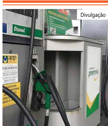
Segundo a empresa, foram produzidos 2,01 bilhões de litros de gasolina

Na avaliação da Petrobras, os resultados revelam o aumento das vendas no mercado interno e a estratégia adotada pela Petrobras de investir em refino, "visando garantir o atendimento de seus compromissos comerciais com confiabilidade, disponibilidade operacional e rentabilidade das suas unidades", diz em nota.