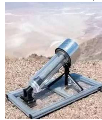
Coletor de água atmosférico usa estrutura ultraporosa