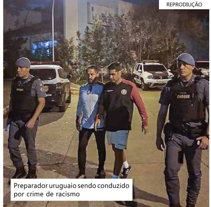
Preparador uruguaio sendo conduzido por crime de racismo