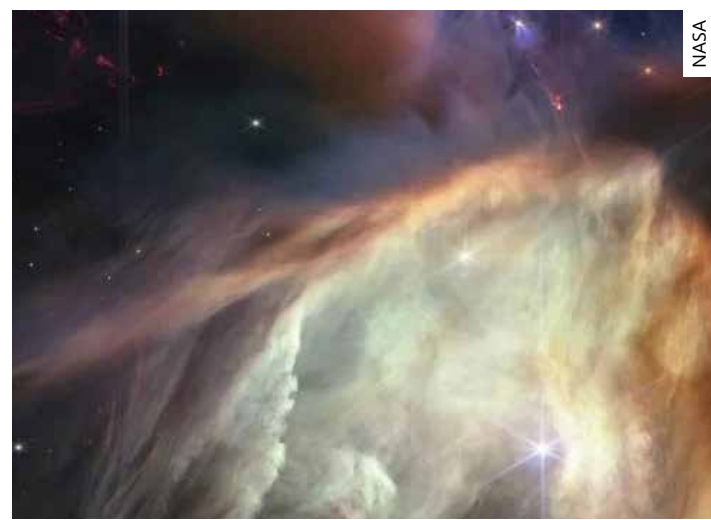
A divulgação ocorre em comemoração ao aniversário de um ano das operações do telescópio

agora nós temos a tecnologia para ver o começo da história de outra estrela", disse Klaus Pontoppidan, um dos cientistas envolvidos no projeto. O telescópio entrou em funcionamento em 12 de julho de 2022, depois de um ano viajando pelo espaço.