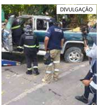
Ação visa combater a permanência de veículos abandonados nas ruas

Todos os veículos removidos são levados ao parqueamento terceirizado da Prefeitura de Manaus, local onde os proprietários poderão dirigir-se para verificar as pendências necessárias para reaver o veículo.