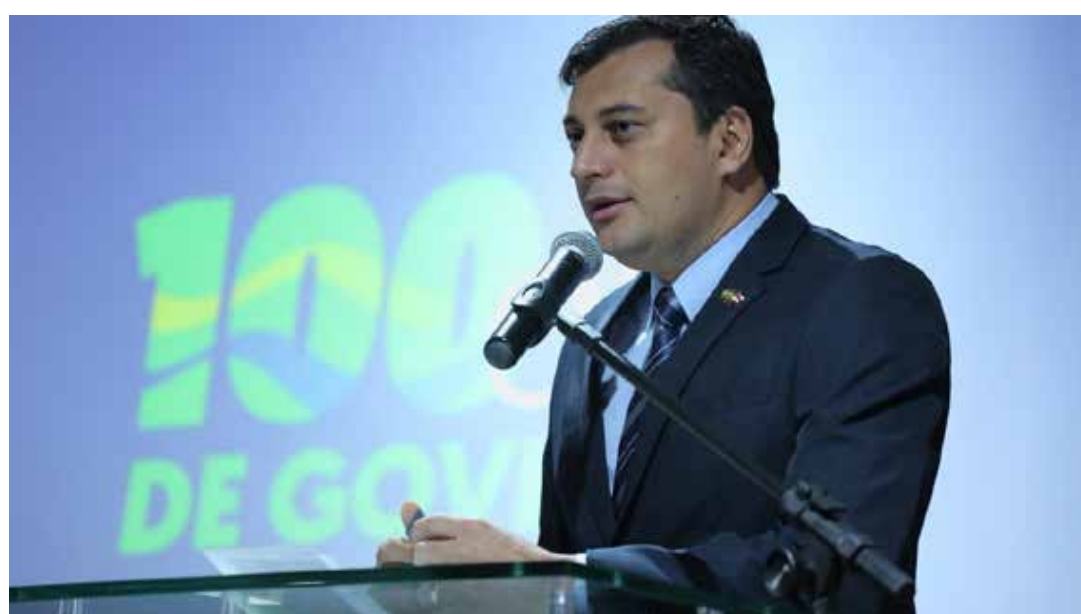
Projeto do orçamento foi aprovado nesta quarta-feira (12)

as diretrizes de política fiscal e as metas, em consonância com a trajetória sustentável da dívida pública. Além disso, a LDO orienta a elaboração da lei orçamentária anual, dispõe sobre as alterações na legislação tributária e estabelece a política de aplicação das agências financeiras oficiais de fomento.