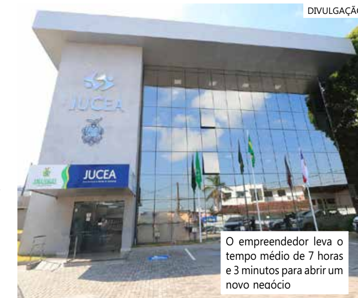
O empreendedor leva o tempo médio de 7 horas e 3 minutos para abrir um novo negócio

As solicitações de alvarás e licenças de empresas e as inscrições de Microempreendedor Individual (MEI) também não são computadas. Ressalte-se que são dispensadas de alvarás e licenças as empresas que exercem atividades consideradas como baixo risco.