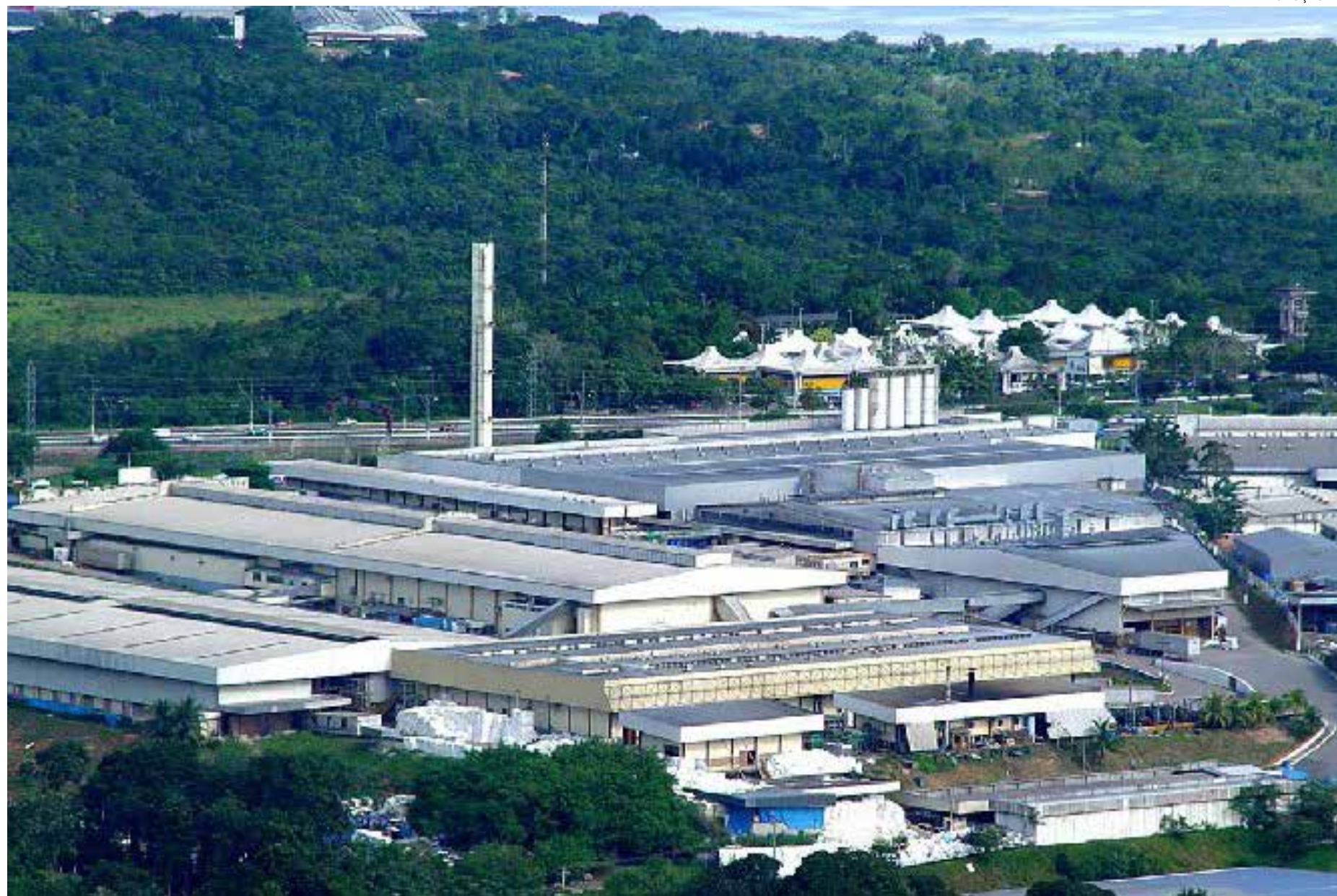
Geraldo Alckmin, anuncia investimentos no programa Bom Dia, Ministro, da EBC

“Assinaremos em Manaus o primeiro contrato de gestão com uma Organização Social [Fundação Universitárias de Estudos Amazônicos], com a intervenção do Instituto de Pesquisas Tecnológicas de São Paulo. Nosso objetivo é fazer com que a biodiversidade