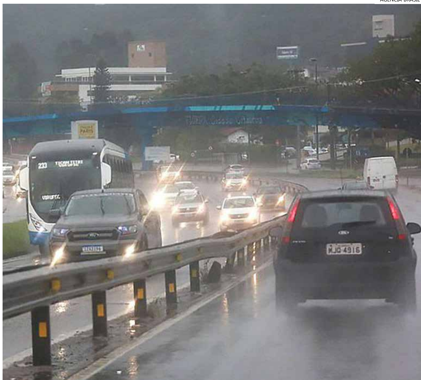
Rodovias estão sendo interditadas em Santa Catarina

As coordenadorias municipais de Proteção e Defesa