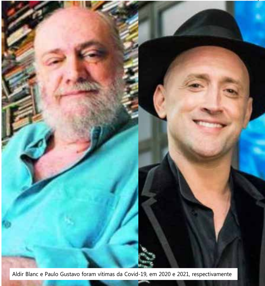
Aldir Blanc e Paulo Gustavo foram vítimas da Covid-19, em 2020 e 2021, respectivamente

A partir de agora, em todo 4 de maio, devem ser realizadas ações culturais que promovam a conscientização sobre a importância do setor para o desenvolvimento social, econômico e para o exercício da cidadania, além preservar a me-