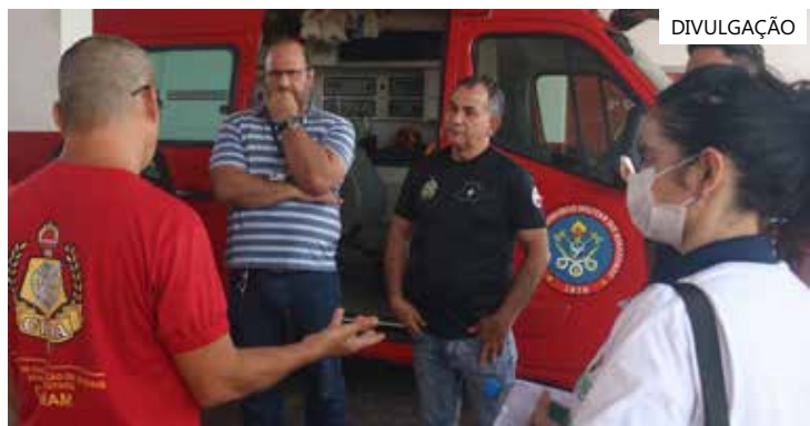
Projeto também foi apresentado em Iranduba, Tefé e Autazes

As equipes coordenadas pelo Centro Integrado de Acompanhamento de Projetos e Elaboração de Políticas de Segurança Pública (Ciaesp) apresentaram, então, as medidas prioritárias, que devem ser adotadas para resolver os problemas identificados e fortalecer a segurança pública no município.