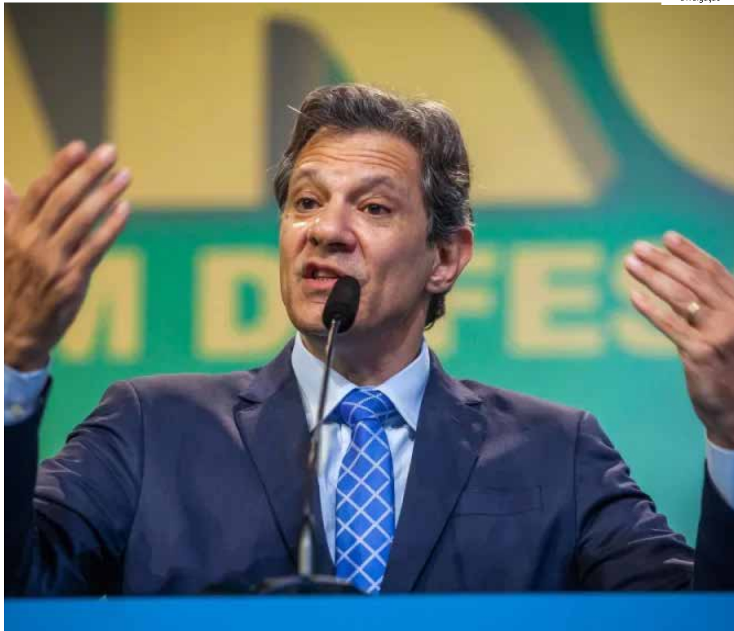
A Quaest realizou 94 entrevistas com gestores, economistas

O percentual de pessoas que acreditam que a economia vai ficar do mesmo jeito no mesmo período permaneceu em 26% em relação a maio, que estava