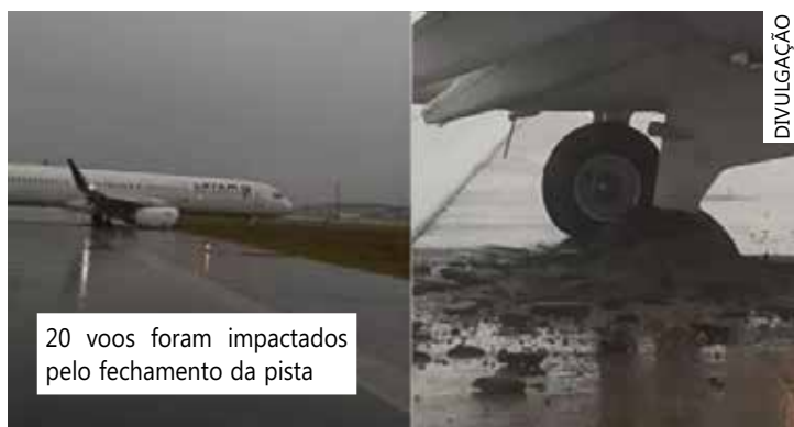
20 voos foram impactados pelo fechamento da pista

os voos programados até as 16h40 estavam cancelados, de acordo com o site do aeroporto. A Latam informou que clientes afetados por essas alterações já foram informados pela companhia e que podem realizar a mudança dos voos sem custos ou solicitar o reembolso integral da passagem aérea. O atendimento pode ser pelo site ou pelo aplicativo da companhia. Há também a central de atendimento telefônica 11 4002-5700.