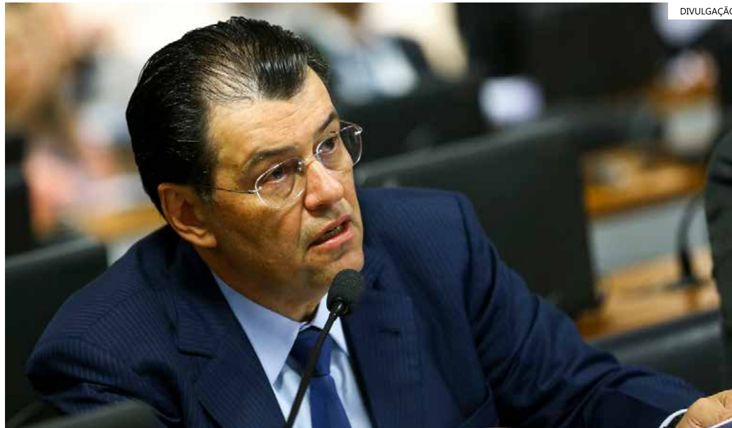
O senador Eduardo Braga (MDB-AM) é o relator do texto no Senado Federal

Braga confirmou a informação do presidente do Senado, Rodrigo Pacheco (PSD-MG), de que a reforma tributária não deverá ter partes votadas separadamente. Pacheco concedeu entrevista coletiva na residência oficial da Presidência do Senado, acompanhado dos ministros da Fazenda, Fernando Haddad, e do Pla-