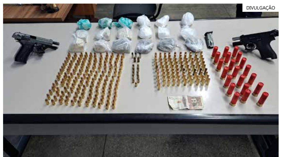
As equipes realizaram a apreensão a partir de uma denúncia anônima

“As equipes estão realizando incursões em conjunto com policiais do 8º Batalhão da Polícia Militar para fortalecer a sensação de segurança na cidade”, destaca a SSP.