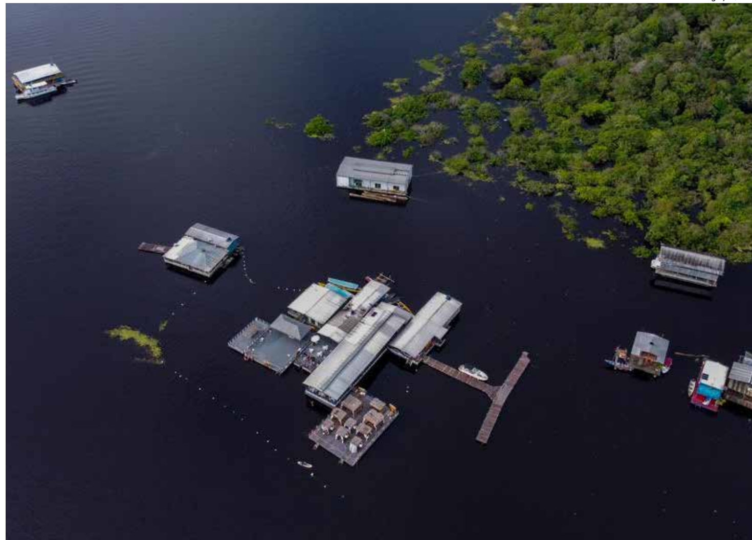
Jazz no Flutuante acontece em três edições

Em 2017, eles lançaram o disco de estreia "Das Margens Urbanas". Já em 2021, apresentaram o documentário "Orquestra de Beiradão do Amazonas - A Música de Beiradão" e o "Diálogo de Gerações", com composições próprias, além de releituras de músicas de ícones do gênero, como o cantor e saxofonista Teixeira de Manaus. Para a primeira edição do Jazz no Flutuante deste ano, a or-