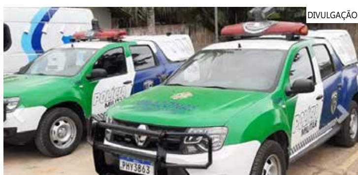
Policiais militares da 28ª Cicom foram acionados para atender a ocorrência

O Serviço de Atendimento Móvel de Urgência (SAMU), foi acionado até o local para prestar os primeiros socorros à vítima. Até o fechamento desta matéria, não há informações para qual hospital ele foi encaminhado e nem sobre seu estado de saúde.