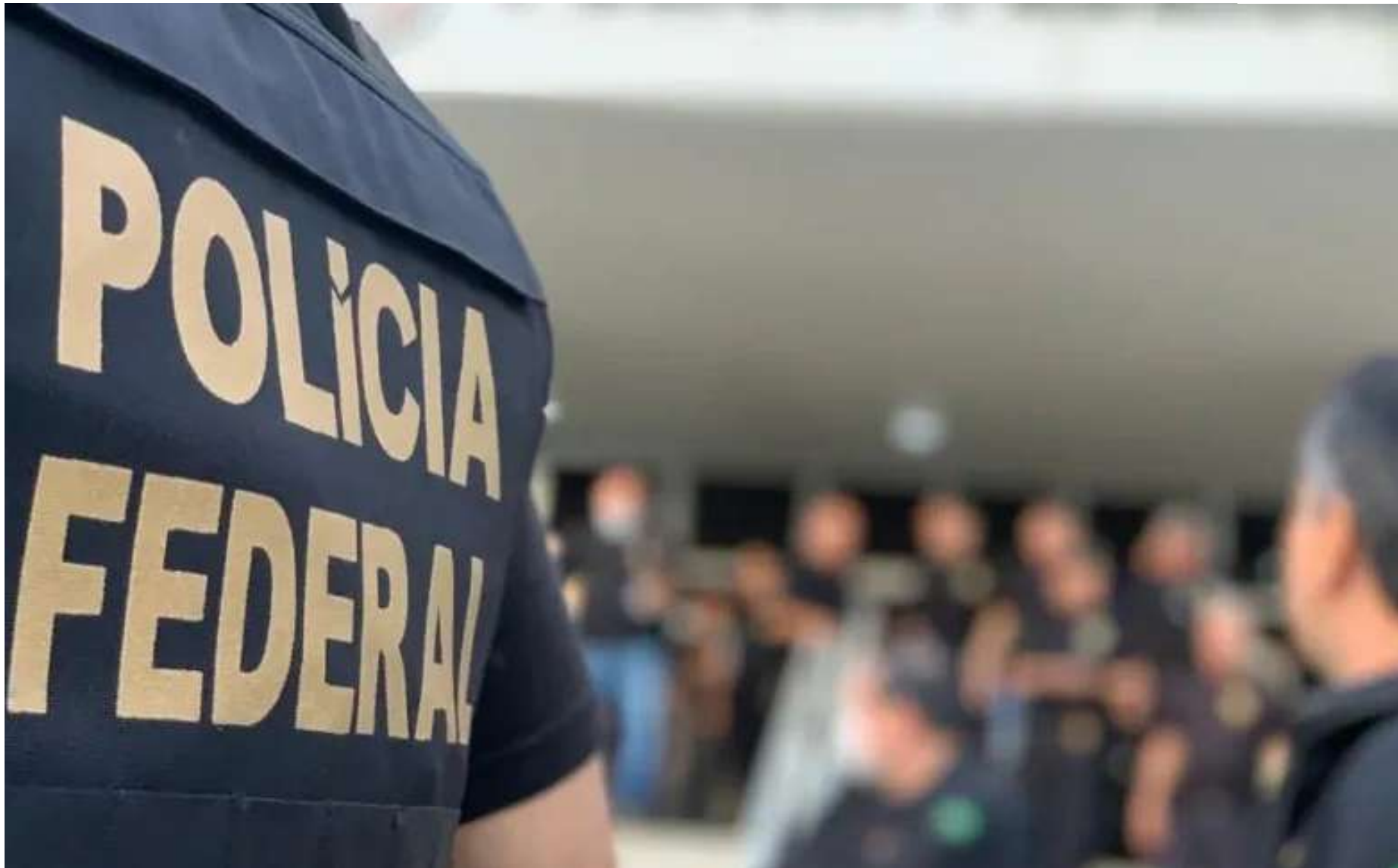
Agente da Polícia Federal

O esquema é comandado por um suspeito brasileiro que mora na Itália.