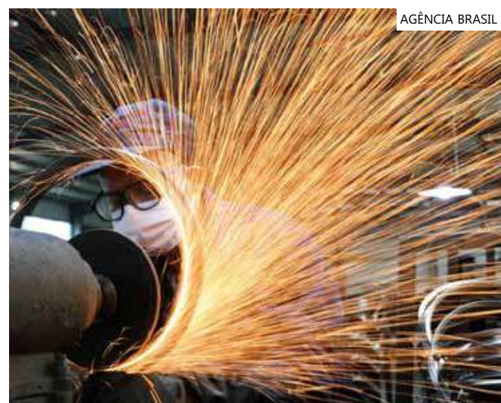
CNI projeta que o IPCA encerrará o ano em 4,9%

a Selic encerrará 2023 em 11,75% ao ano, devendo cair dois pontos percentuais em relação aos 13,75% atuais. Em relação ao câmbio, a entidade prevê que o dólar comercial chegará ao fim do ano em R$ 4,90, contra previsão anterior de R$ 5,35.