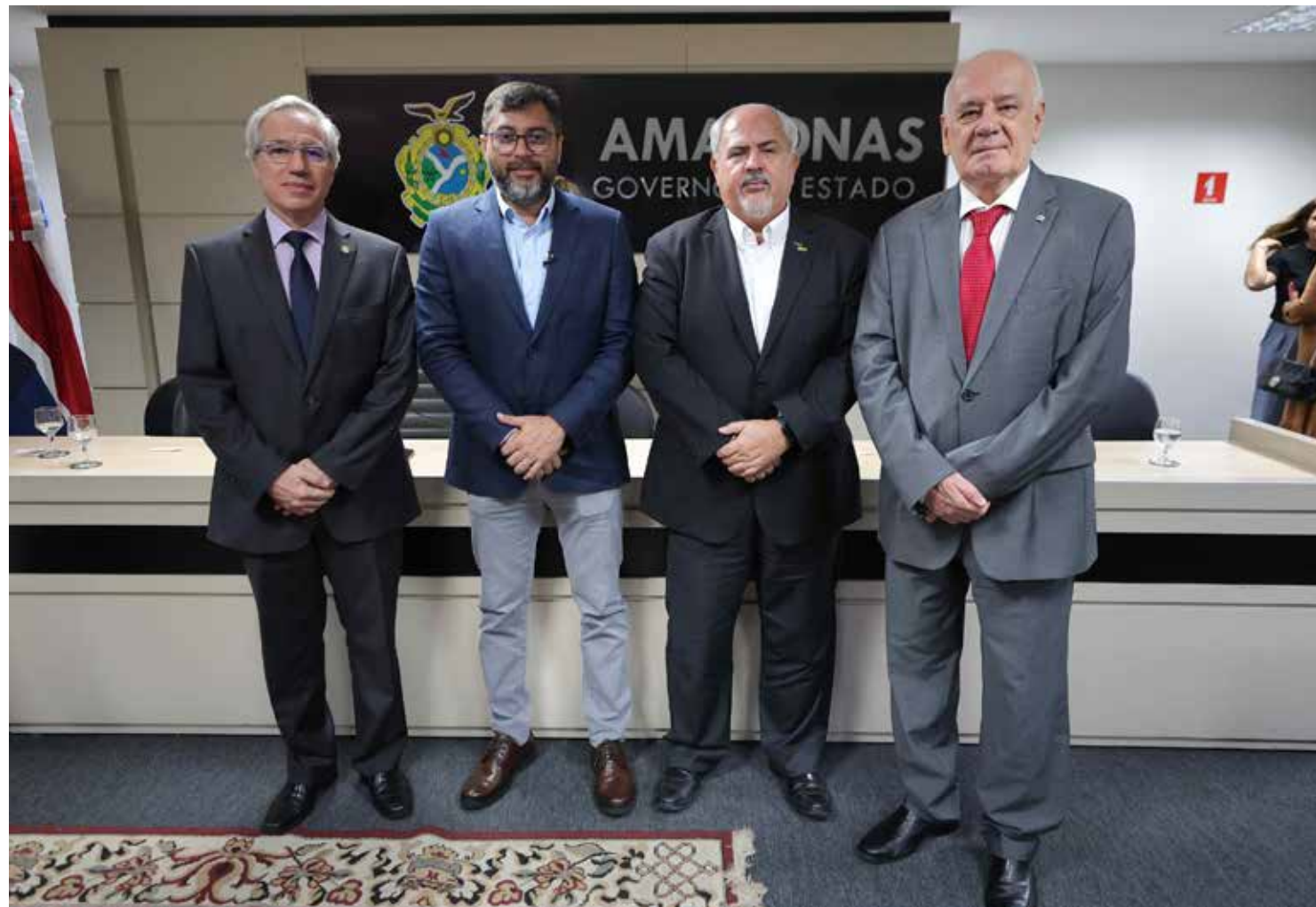
A lei proposta pelo Estado e aprovada pela Assembleia Legislativa do Estado do Amazonas

Por parte do Estado, estiveram presentes na solenidade de sanção da lei ocorrida na sede do Governo, o subprocurador-geral adjunto I