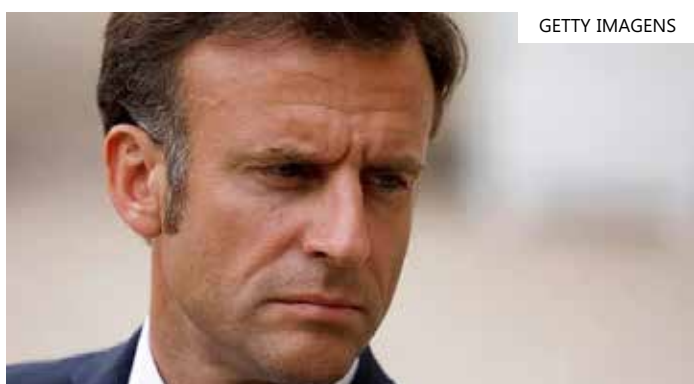
Presidente Emmanuel Macron

funcionários que trabalham para Emmanuel Macron abriram o pacote e, ao verem o pedaço de dedo, denunciaram o caso à polícia. A promotora francesa já começou uma investigação para apurar o acontecimento. Todos os e-mails e cartas enviadas diariamente para Macron (cerca de 1 mil a 1,5 mil) são monitorados por uma equipe de 70 pessoas. A Presidência da França não se manifestou sobre o caso.