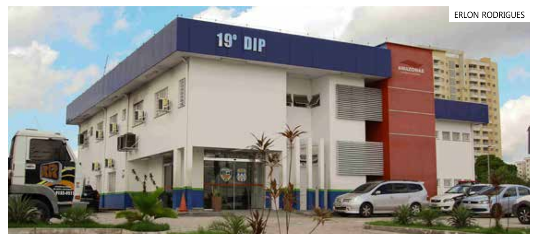
Dupla foi presa no bairro Tancredo Neves, zona leste da capital