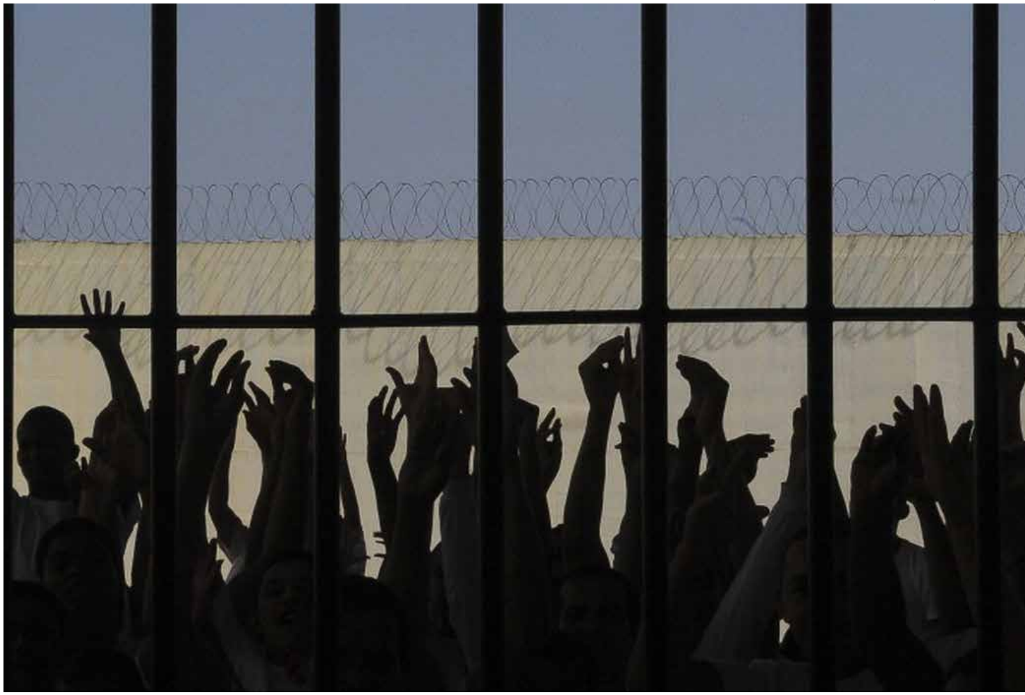
Em seis meses, mais de 3,2 mil pessoas foram presas na capital amazonense

“Esse trabalho conjunto resultou em um aumento significativo no número de prisões realizadas no primeiro semestre de 2023 em Manaus. Diversos criminosos foram capturados e encaminhados ao sistema prisional, contribuindo para a redução dos índices de criminalidade e para o aumento da sensação de segurança da população amazônica”, destaca Mansur.