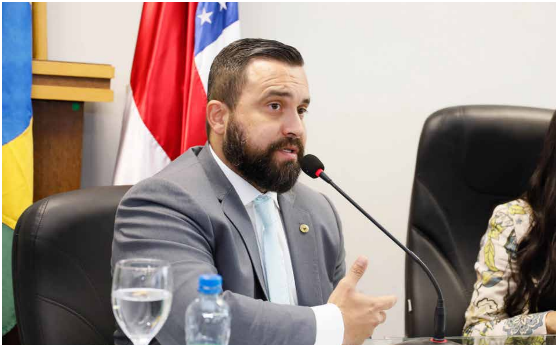
Dr. George Lins é deputado estadual filiado ao União Brasil e está no seu primeiro mandato

A Sessão Ordinária da quarta-feira (12) marcou o encerramento das atividades em plenário deste primeiro semestre de 2023 e os deputados fizeram um balanço de suas atuações nestes primeiros meses da 20ª Legislatura da Assembleia Legislativa do Amazonas (Aleam). O recesso parlamentar vai até o dia 31 de julho, e dia 1º de agosto retornam as reuniões ordinárias.