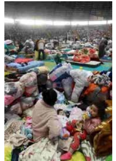
Famílias desabrigadas no RS