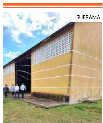
Fábrica erguida numa área de 20 mil metros quadrados em Iranduba

Ida à futura fábrica - erguida numa área de 20 mil metros quadrados - foi um desdobramento da visita realizada pela Suframa, no início deste mês, a duas fábricas do grupo Rubberon, localizadas no Polo Industrial de Manaus (PIM), e foi conduzida pelo superintendente da Autarquia, Bosco Saraiva.