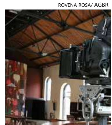
Evento faz parte da "Mostra de Cineastas Amazonenses"

A Mostra de Cineastas Amazonenses do Cineclube de Arte é uma realização do Governo do Amazonas por meio da Secretaria de Cultura e Economia Criativa.