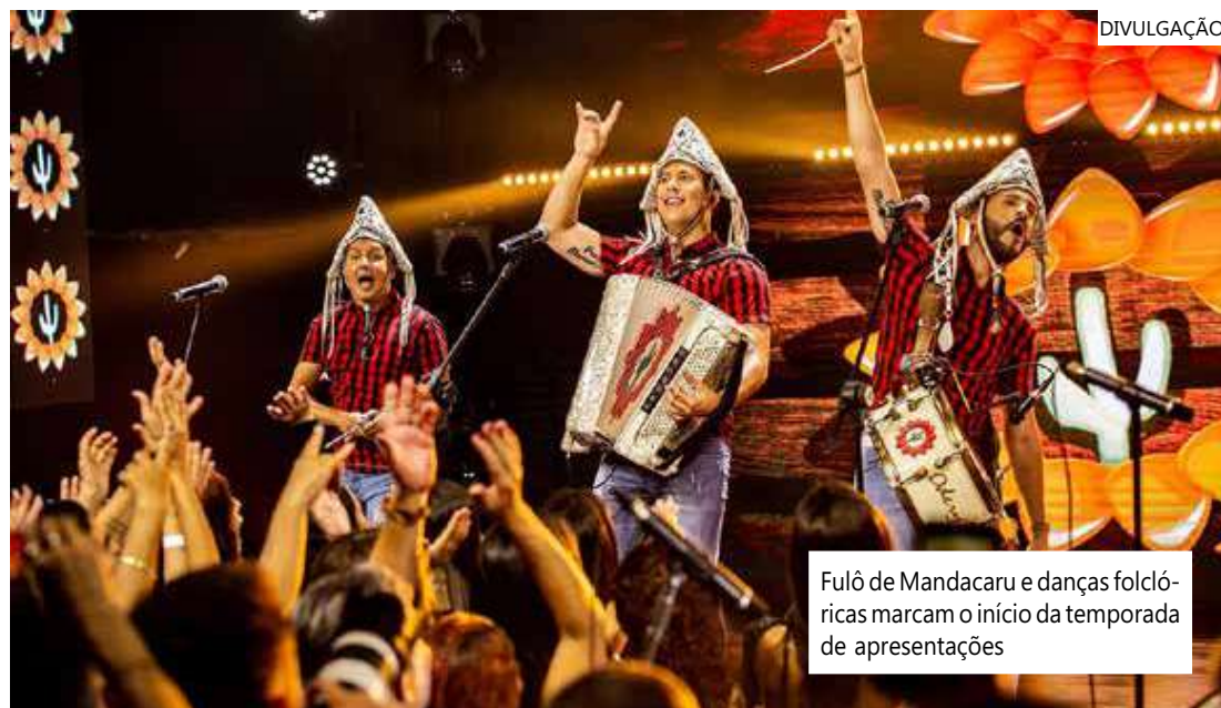
Fulô de Mandacaru e danças folclóricas marcam o início da temporada de apresentações

Consolidado como uma das maiores manifestações da cultura popular do estado, o Festival Folclórico do Amazonas Categoria Ouro, chega a sua 65ª edição com abertura nesta sexta-feira (14/07), às 20h, no Centro Cultural Povos da Amazônia, na Bola da Suframa, na avenida Silves, Distrito