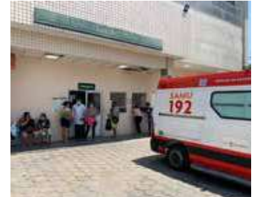
Vítima foi socorrida e levada ao HPS João Lúcio, na zona leste da cidade