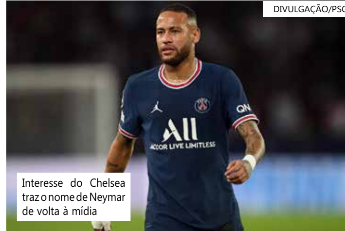
Interesse do Chelsea traz o nome de Neymar de volta à mídia

A valorização vem em um momento difícil para o jogador e o PSG. Mesmo com toda a especulação sobre a venda de Neymar nas últimas semanas, nenhuma negociação foi em frente. O “não” mais recente veio do Barcelona que considerou a compra de Neymar economicamente inviável no momento. Para o clube catalão também pesou os litígios judiciais travados com o brasileiro que jogou no Barça entre 2013 e 2017.