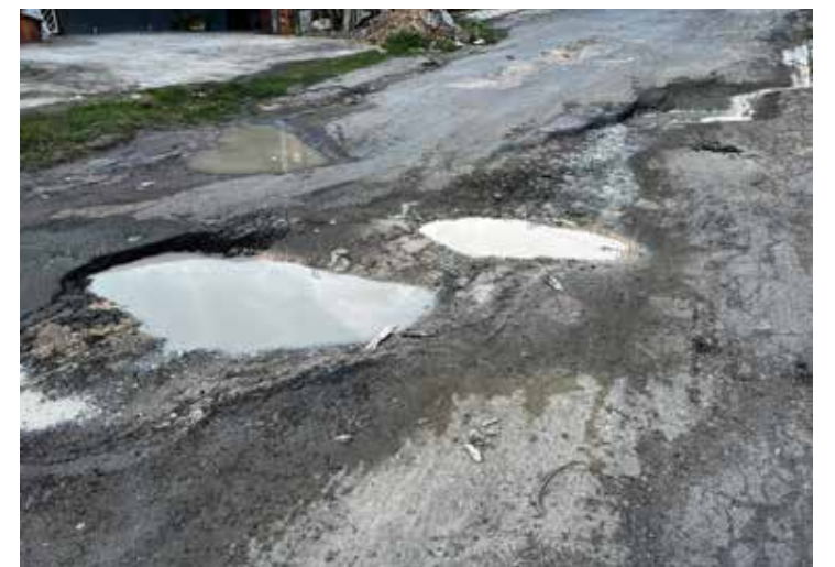
Buracos da rua Conde de Itaguá, no bairro Flores, zona centro-sul de Manaus

Durante a visita da equipe de reportagem ao bairro, no último dia 13 de julho, mora-