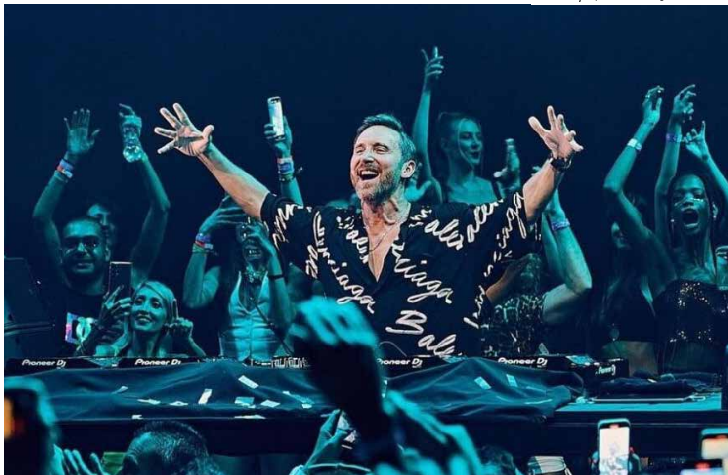
DJ e produtor musical francês voltará ao Brasil para o Passo a Paço, diz jornalista

A primeira delas foi "que a atração internacional chegou como um titânio para