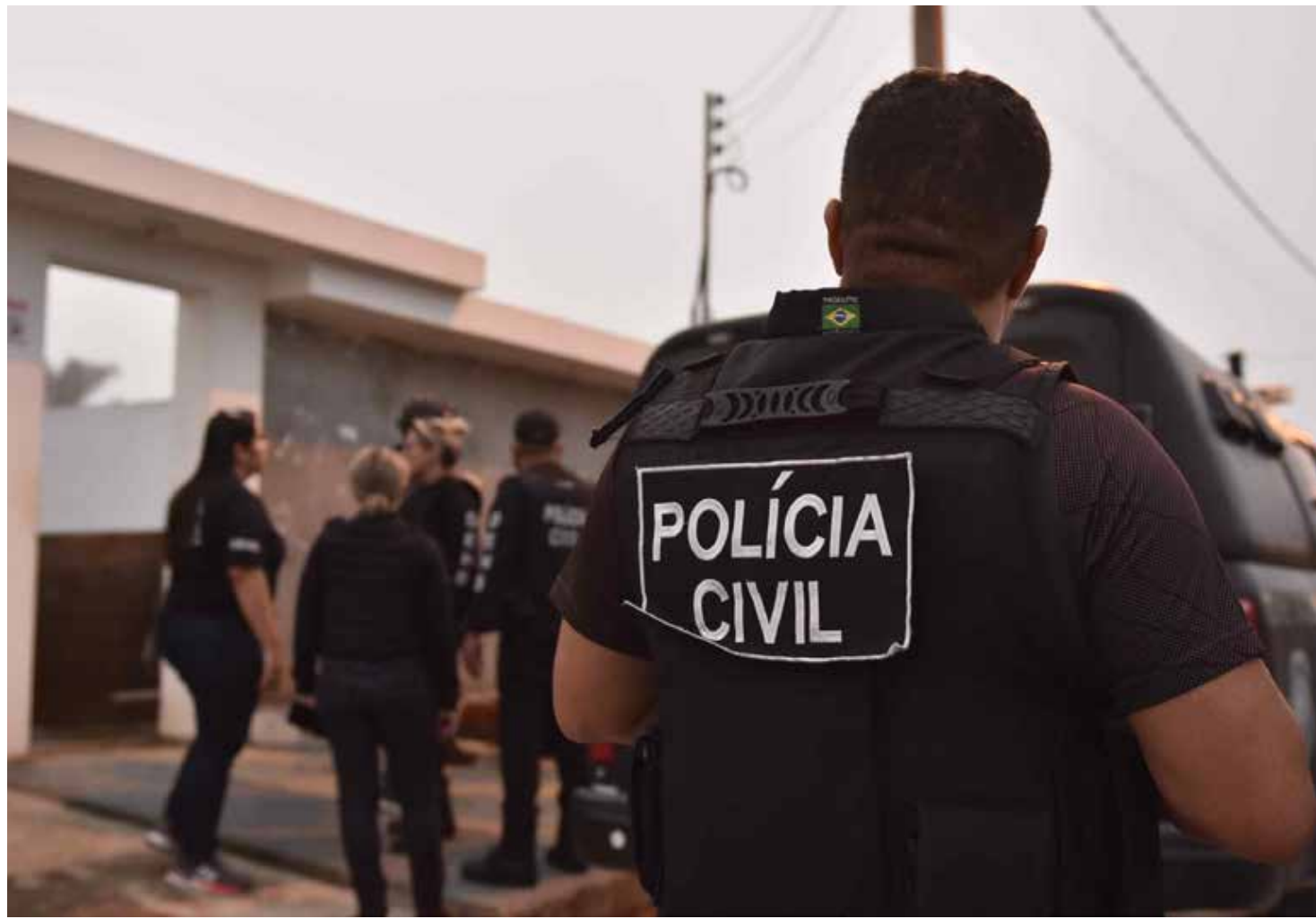
Balanço considera prisões por mandado e em flagrante, afirma Polícia Civil do Amazonas (PC-AM)

A autoridade policial ainda ressaltou o apoio da popula-