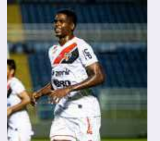
Ferroviário (CE) é líder do Grupo A2 com 30 pontos