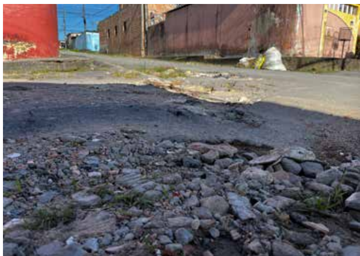
Rua Frankfurt, situada no bairro Nova Cidade, zona norte da cidade

Além dos bairros Compensa e Flores, a equipe de reportagem do VDN também esteve nas ruas San Julian (antiga 155) e rua Frankfurt (antiga 153), situadas no bairro Nova Cidade, zona norte da capital, a fim de constatar a