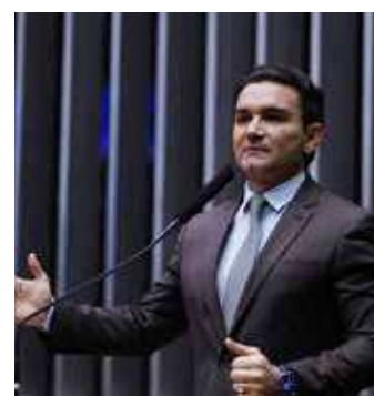
Deputado Federal pelo Pará

A mudança na pasta vinha sendo especulada desde o mês passado e já havia sido selada, na