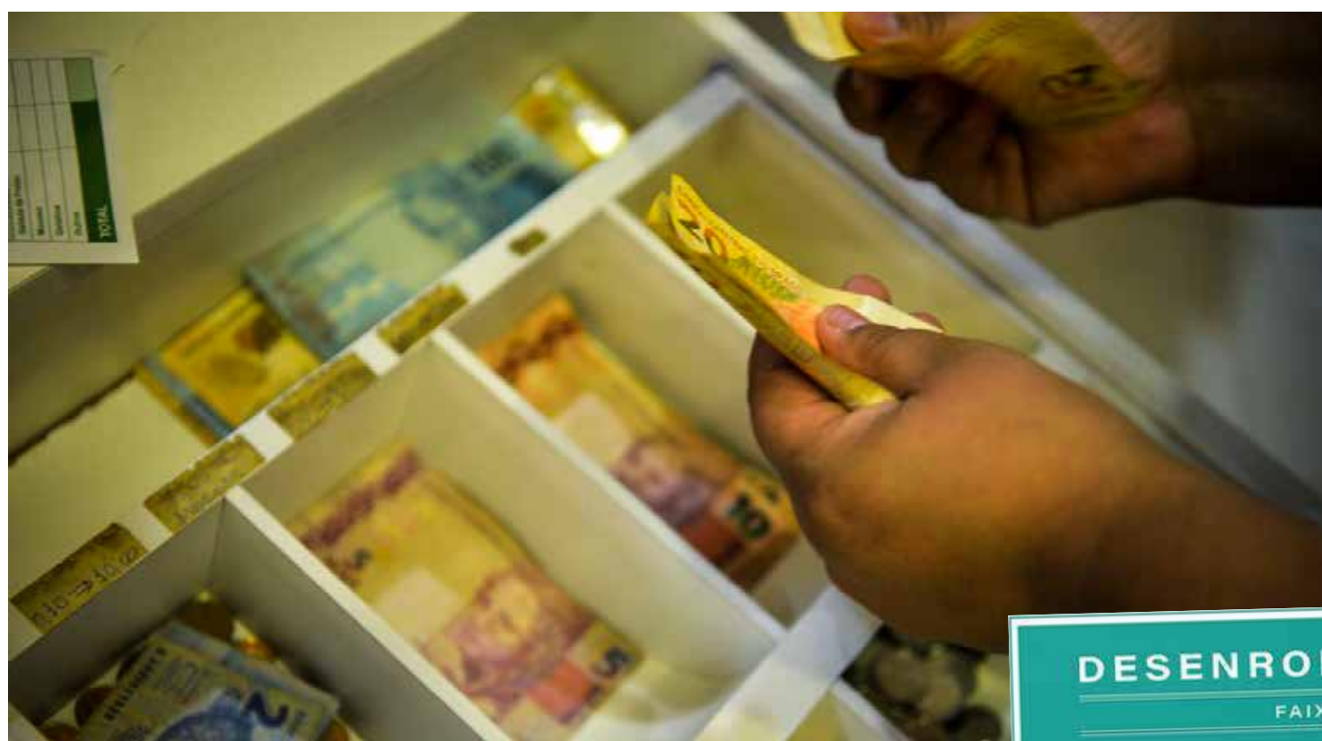
As dívidas poderão ser quitadas nos canais indicados pelos agentes financeiros

Nesta etapa do programa, também serão perdoadas as