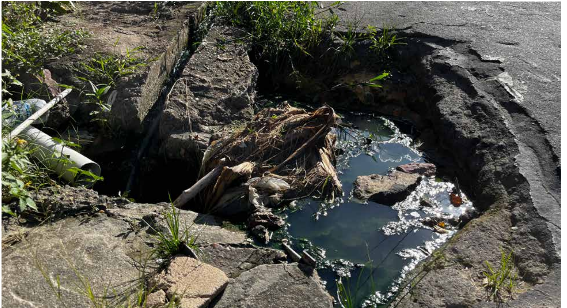
Realidade da rua Conde de Sergimirim, bairro Flores, zona centro da capital

O autônomo Valcir, que já reside no bairro há mais de 40 anos, relata os transtornos vividos por moradores do