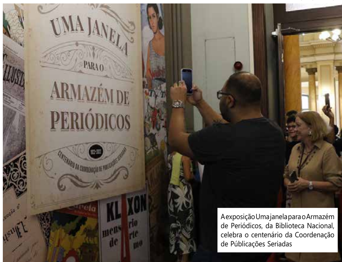
A exposição Uma janela para o Armazém de Periódicos, da Biblioteca Nacional, celebra o centenário da Coordenação de Publicações Seriadas

No que trata dos veículos de comunicação impressos, surpreende, por exemplo, a diferença de tamanho entre o jornal Vossa Senhora e o Jornal do Commercio. O