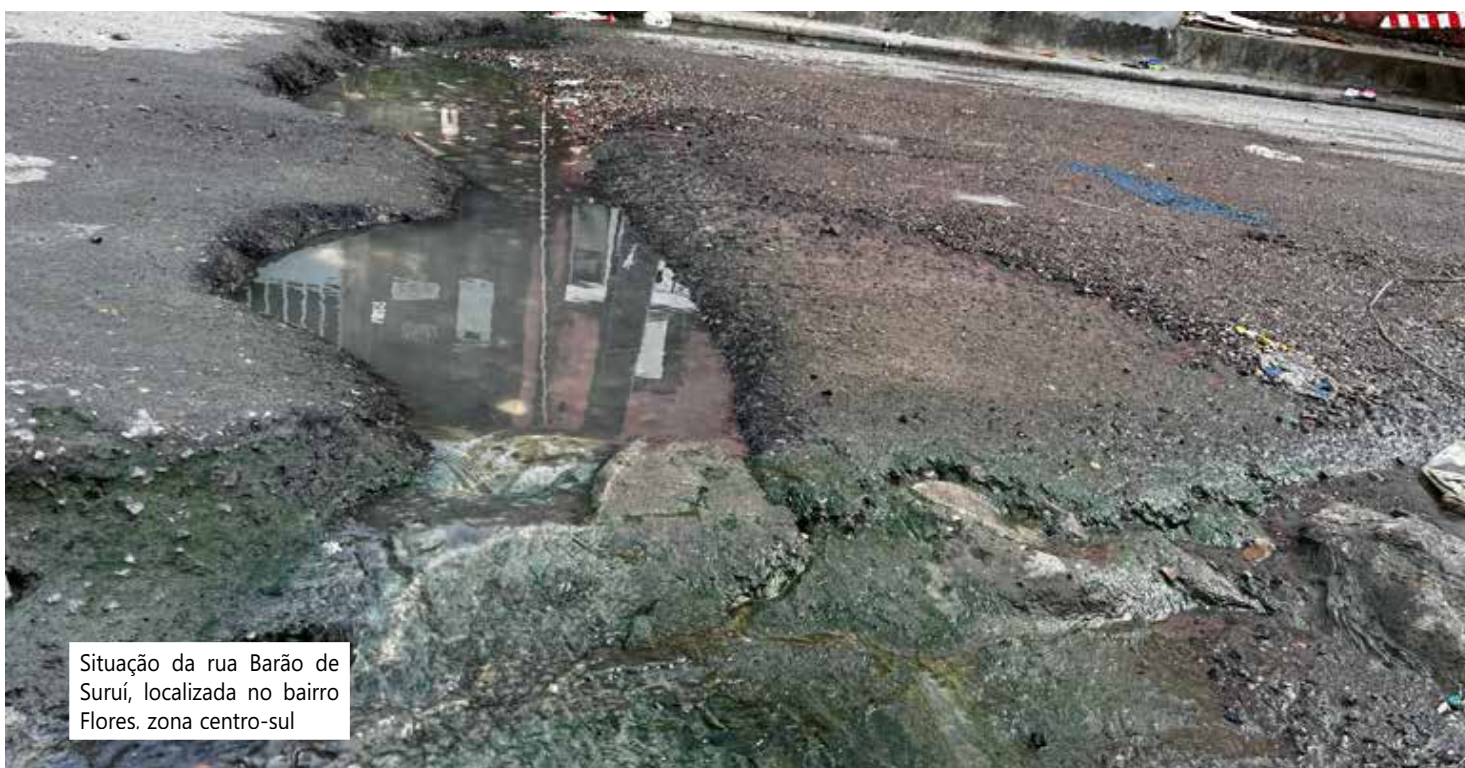
Situação da rua Barão de Suruí, localizada no bairro Flores, zona centro-sul

A equipe de reportagem do Vanguarda do Norte tentou contato, via e-mail e telefone, com a Secretaria Municipal de Infraestrutura de Manaus (Seminf), a fim de esclarecer se há alguma previsão de reparos nas ruas visitadas, porém, até o fechamento desta matéria, não obtivemos retorno.