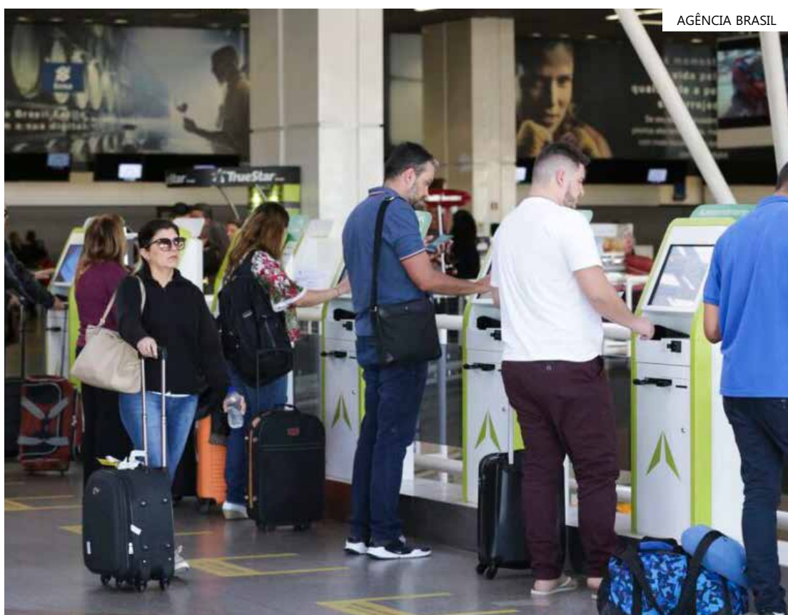
Ministro diz que projeto de passagens a R$ 200 começa em agosto

De acordo com o ministro, a intenção é vender esses bilhetes mais baratos fora da alta temporada, em dois períodos, de fevereiro a junho e de agosto a novembro, quando tradicionalmente ocorre uma ociosidade média de 21% nos voos domésticos.