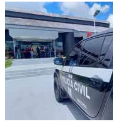
Delegacia Especializada em Homicídios e Sequestros (DEHS)

Outras duas tipificações criminais com um número elevado de prisões são roubo e receptação. Juntos, somaram 711 prisões, cerca de 21%. Para completar a lista dos crimes mais comuns, estão lesão corporal e ameaça, com 438 pessoas presas (13% do total de prisões); porte ilegal de armas, com 277 presos; e furto com 262 e homicídio, com 5,1% do total de presos (206 prisões).