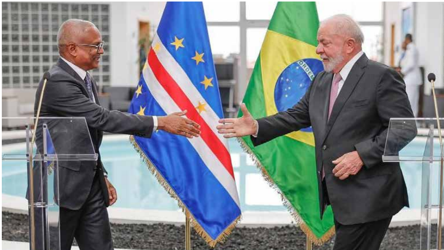
Em ato histórico Lula discursou com presidente cabo-verdiano, José Maria Neves,

"Quero recuperar a relação com o continente africano porque nós brasileiros somos formados pelo povo africano. Nossa cultura, cor e tamanho é resultado da miscigenação entre índios, negros e europeus. Temos profunda gratidão ao continente africano por tudo que foi produzido durante 350 anos de escravidão em nosso país", disse Lula ao ressaltar que o Brasil pretende compensar o continente que é berço da humanidade.