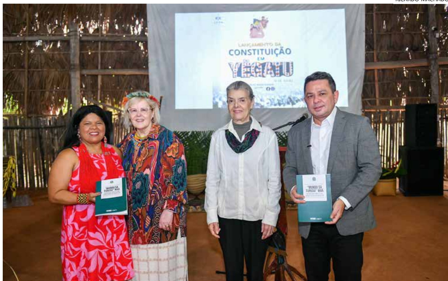
Evento contou com a ministra dos Povos Indígenas, Sonia Guajajara, e as ministras do STF, Rosa Weber e Carmen Lúcia

"O Amazonas, a partir de hoje, tem 17 línguas oficiais. O português é só uma delas. Imaginem