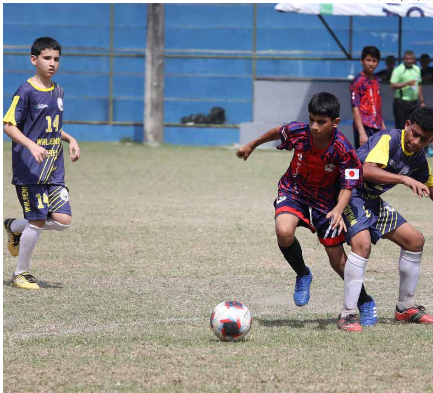
Semifinais reúnem 27 equipes inscritas nas categorias infantil e juvenil