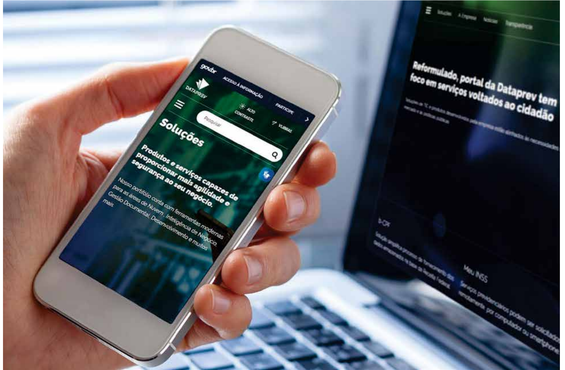
As informações são relativas aos 38,2 milhões de beneficiários do INSS

Ainda segundo Assumpção, a substituição dos an-