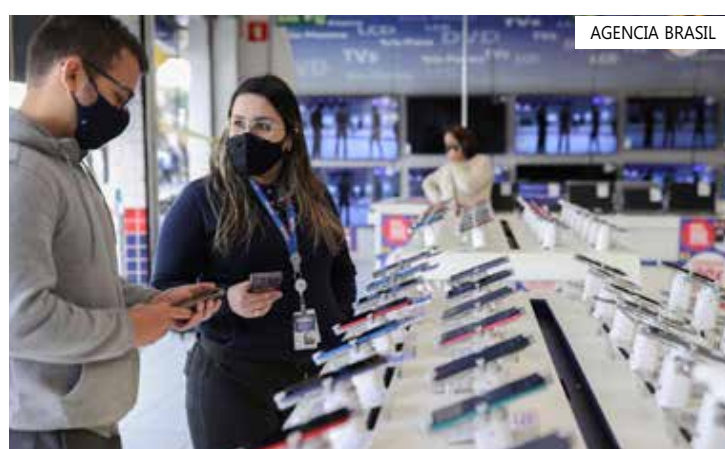
A economia cresceu 1,8%

Na comparação com maio do ano passado, no entanto, a economia cresceu 1,8%. Também houve alta de 3,5% na comparação do trimestre encerrado em maio deste ano com o mesmo período de 2022.