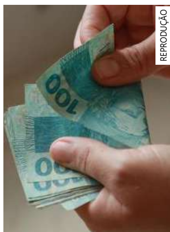
Retração é explicada pelo elevado patamar da taxa básica de juros

A taxa de juros está no maior nível desde janeiro de 2017, quando também estava nesse patamar. A próxima reunião do Comitê de Política Monetária (COPOM) está marcada para o início do mês de agosto. Para o mercado financeiro, a expectativa é que haja uma diminuição na taxa.