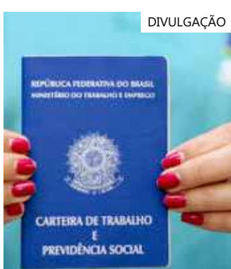
Atendimento ocorre de 8h às 16h, na capital amazonense

Os interessados devem estar munidos do comprovante de vacinação (Covid-19), currículo e documentos pessoais (RG, CPF, PIS, CTPS, comprovante de escolaridade e residência). Não é necessário apresentar cópias, somente os documentos originais.