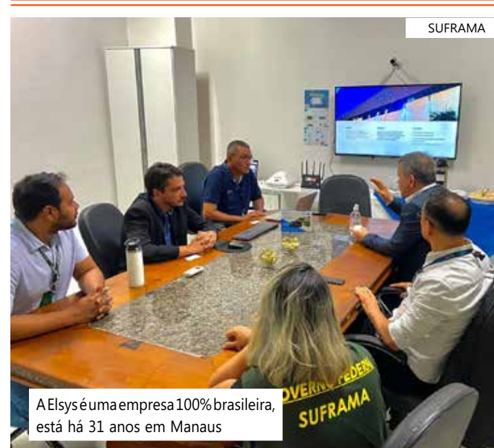
A Elsys é uma empresa 100% brasileira, está há 31 anos em Manaus