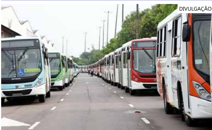
Prefeitura anunciou que após as 22h ônibus podem parar em outros pontos

de instrumento que permita imediato acionamento de polícias foi entendida. Agora eu acredito na sensibilidade da gestão municipal para que o Botão do Pânico seja sancionado e implementado nas linhas de ônibus de Manaus. Que entendamos que quanto mais instrumentos para combater a atuação criminosa no transporte coletivo de Manaus, melhor para a nossa população", concluiu.