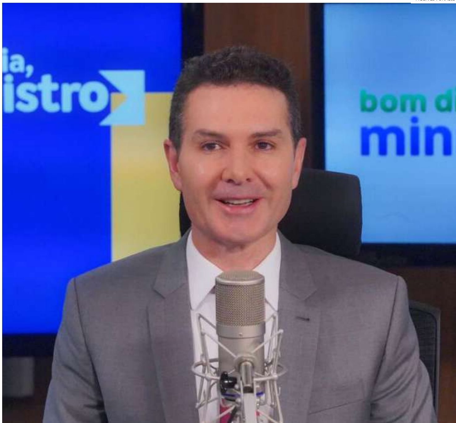
O ministro das Cidades, Jader Filho, durante entrevista no programa Bom Dia, Ministro, nos estúdios da EBC

"A equipe da Secretaria Nacional de Habitação, através do secretário Ailton Madureira, tem feito esse estudo junto à Caixa Econômica Federal para que nós possamos apresentar uma proposta à Casa Civil, ao presidente Lula, para atender esse público. São essas pessoas que têm renda, mas não conseguem fazer a comprovação dessa renda. É o motorista de Uber, é o catador de material reciclável, [são] os autônomos todos que acabam não tendo carteira as-