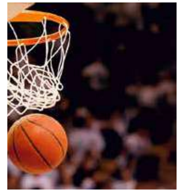
Pré-olímpicos acontecem em fevereiro de 2024