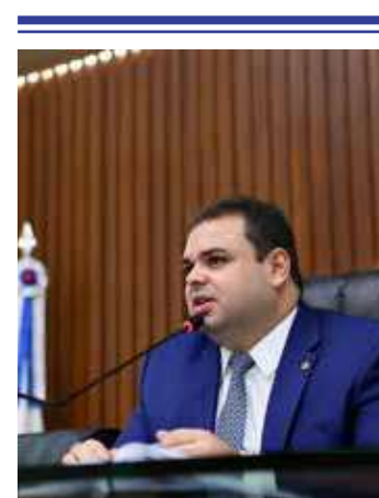
Cidade é presidente da Aleam

rara, e que afeta uma em cada 10 mil pessoas nascidas, o Amazonas tem registrado alguns casos nos últimos anos. "É uma doença rara e, por isso, é pouco conhecida da maioria das pessoas. Mas não é porque é rara que não devemos dar importância. Tenho visto recentemente várias ações nas redes sociais de crianças amazonenses diagnosticadas com a AME. A AME não tem cura, porém quando o diagnóstico é feito precocemente, acompanha-