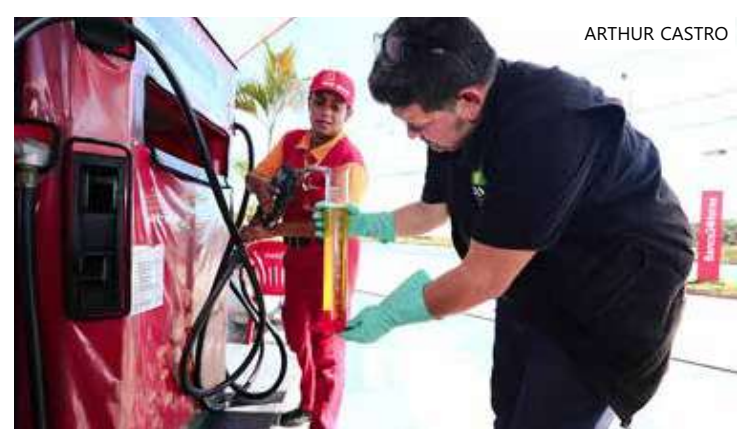
A ação, coordenada pela PF, contou com a participação do Procon-AM

Em caso de denúncias, o consumidor pode entrar em contato com o Procon-AM por meio das redes sociais ou pelos números de telefone: 0800 092 1512 ou o 3215-4009. Além disso, a sede do órgão está aberta de segunda a sexta-feira, das 8h às 14h, na avenida André Araújo, nº 1500, bairro Aleixo, zona centro-sul.