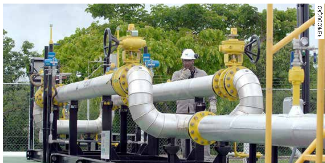
Novos valores passam a vigorar em 1º de agosto

pelas agências reguladoras estaduais, conforme legislação e regulação específicas. A companhia ressalta que a atualização anunciada para 01/08/23 não se refere ao preço do GLP [gás de cozinha], envasado em botijões ou vendido a granel", informa a estatal.