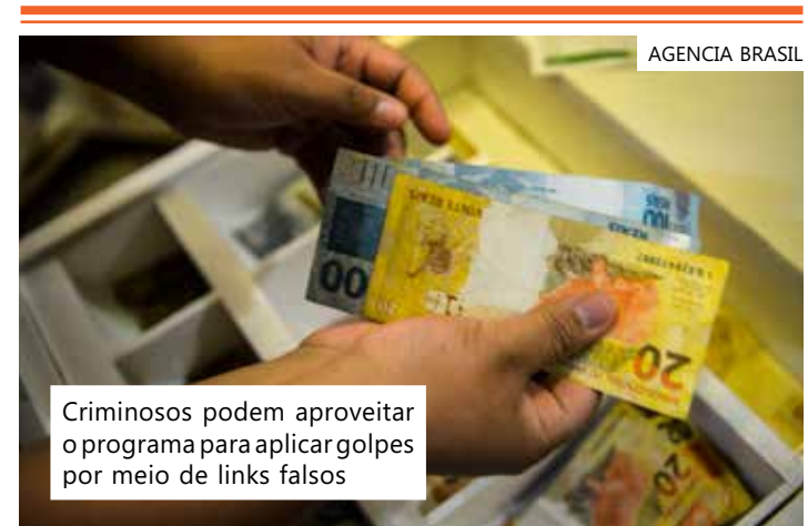
Criminosos podem aproveitar o programa para aplicar golpes por meio de links falsos

A Febraban orienta que as pessoas interessadas em renegociar as dívidas dentro do Desenrola Brasil busquem informações apenas dentro dos canais oficiais dos bancos que aderiram ao programa, como nas agências, no internet banking ou em seus aplicativos bancários. Visto que se for negociar no internet banking, a entidade orienta que, para o acesso, o próprio usuário digite o endereço da instituição financeira. Se o cliente desconfiar de alguma proposta ou do valor, ele deve em contato com o banco nos seus canais oficiais. Além disso, somente após a formalização de um contrato de renegociação é que o usuário pode ter os valores debitados da conta, nas datas acordadas.