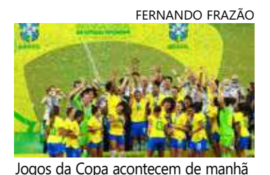
Jogos da Copa acontecem de manhã

O Executivo Estadual também determinou ainda que a Secretaria de Educação (Seduc) promova a compensação das horas normais de ensino.