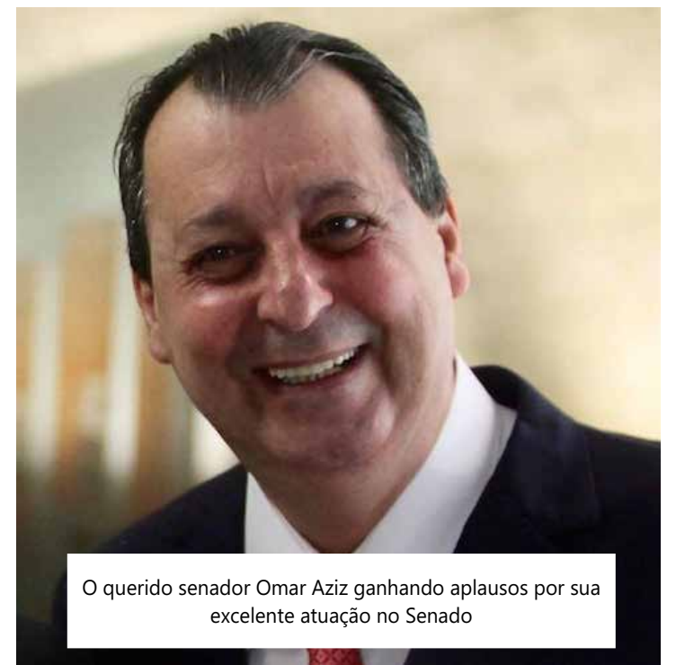
O querido senador Omar Aziz ganhando aplausos por sua excelente atuação no Senado

. Essa quantia, que corresponde a incríveis R$ 240 milhões de acordo com a cotação atual, representa o maior valor já recebido por um ator em um único projeto na história de Hollywood. Superando os atores, Robert Downey Jr. por "Capitão América: Guerra Civil" e Will Smith pelo trabalho que lhe rendeu um Oscar em "King Richard: Criando Campeões". Ambos estavam empatados com o ganho de US$ 40 milhões (R$ 192 mi). Isso significa que nenhum outro ator embolsou mais sem depender de participações nos lucros, partes da bilheteria ou outros bônus de pagamento.