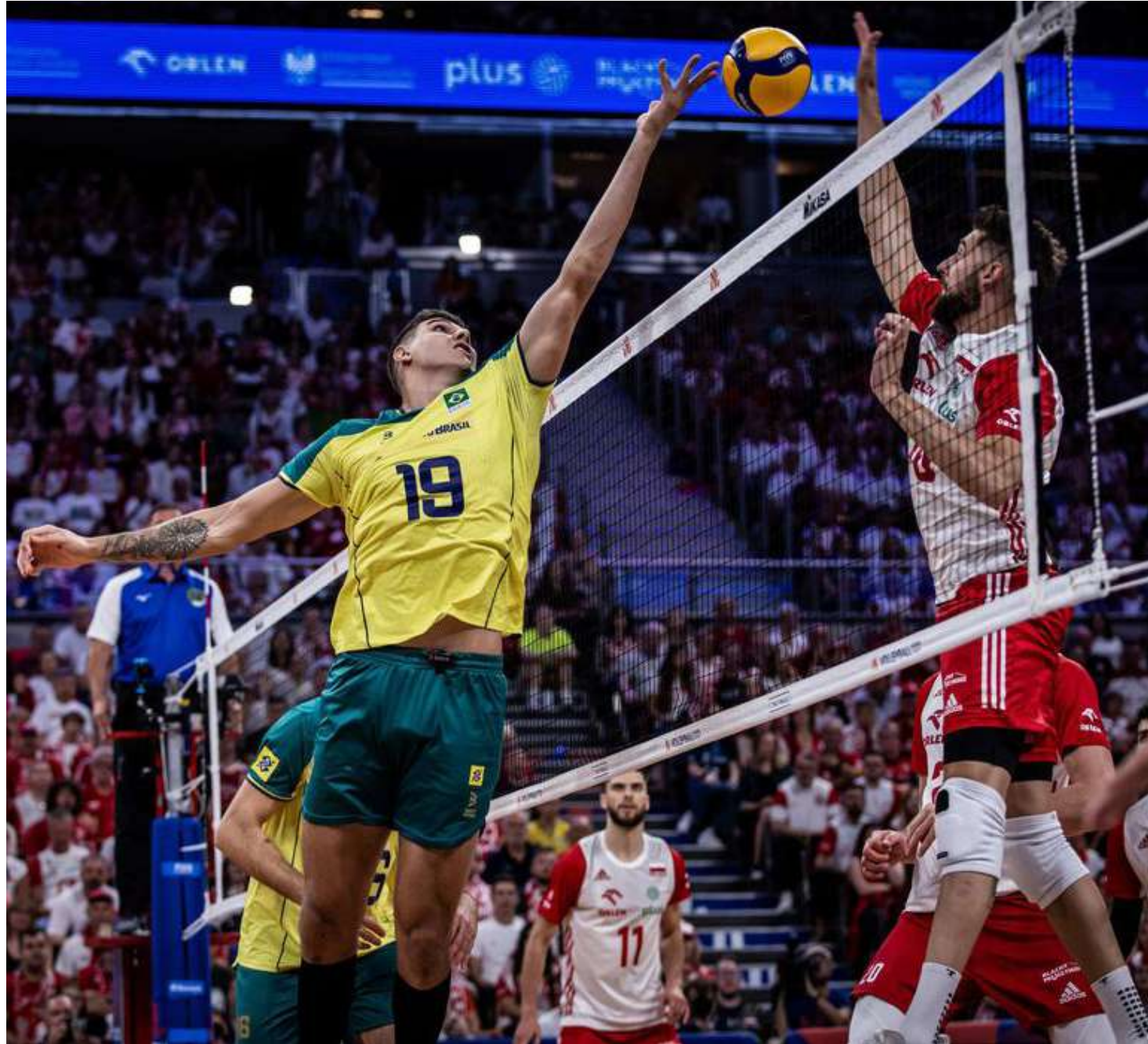
Seleção brasileira perdeu os três sets para a Polônia nas quartas de final