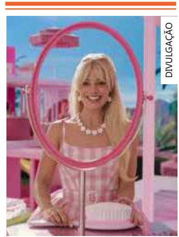
Margot Robbie em "Barbie"

'Barbie' levantou também a força da estratégia do filme para suas outras linhas de produtos, como os da 'Hot Wheels', ao colocar a boneca em um Corvette rosa", analisa. Medeiros também avalia o anúncio feito pela fabricante de brinquedos em 2022, no qual já apontava o filme "Barbie" como um dos principais destaques para os acionistas em 2023.