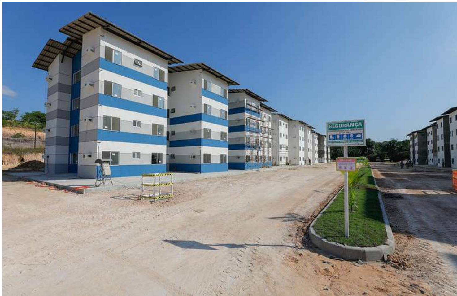
De acordo com o Governo do Amazonas, meta é alcançar mais de 22,1 mil soluções de moradias definitivas

"Aqui são 192 unidades habitacionais, cujas obras estavam paralisadas desde 2014,