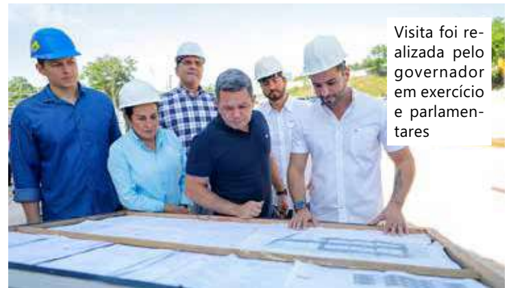
Visita foi realizada pelo governador em exercício e parlamentares

O titular da Suhab fez um balanço das ações de moradia em desenvolvimento atualmente no Amazonas. "Estamos fazendo diversos reassentamentos de famílias na comunidade da Sharp, na comunidade Manaus 2000, e estamos prestes a entregar neste segundo semestre as unidades habitacionais do Ozias Monteiro II. E estamos nos comunicando com o Governo Federal para o Minha Casa, Minha Vida na capital e no interior", detalha.