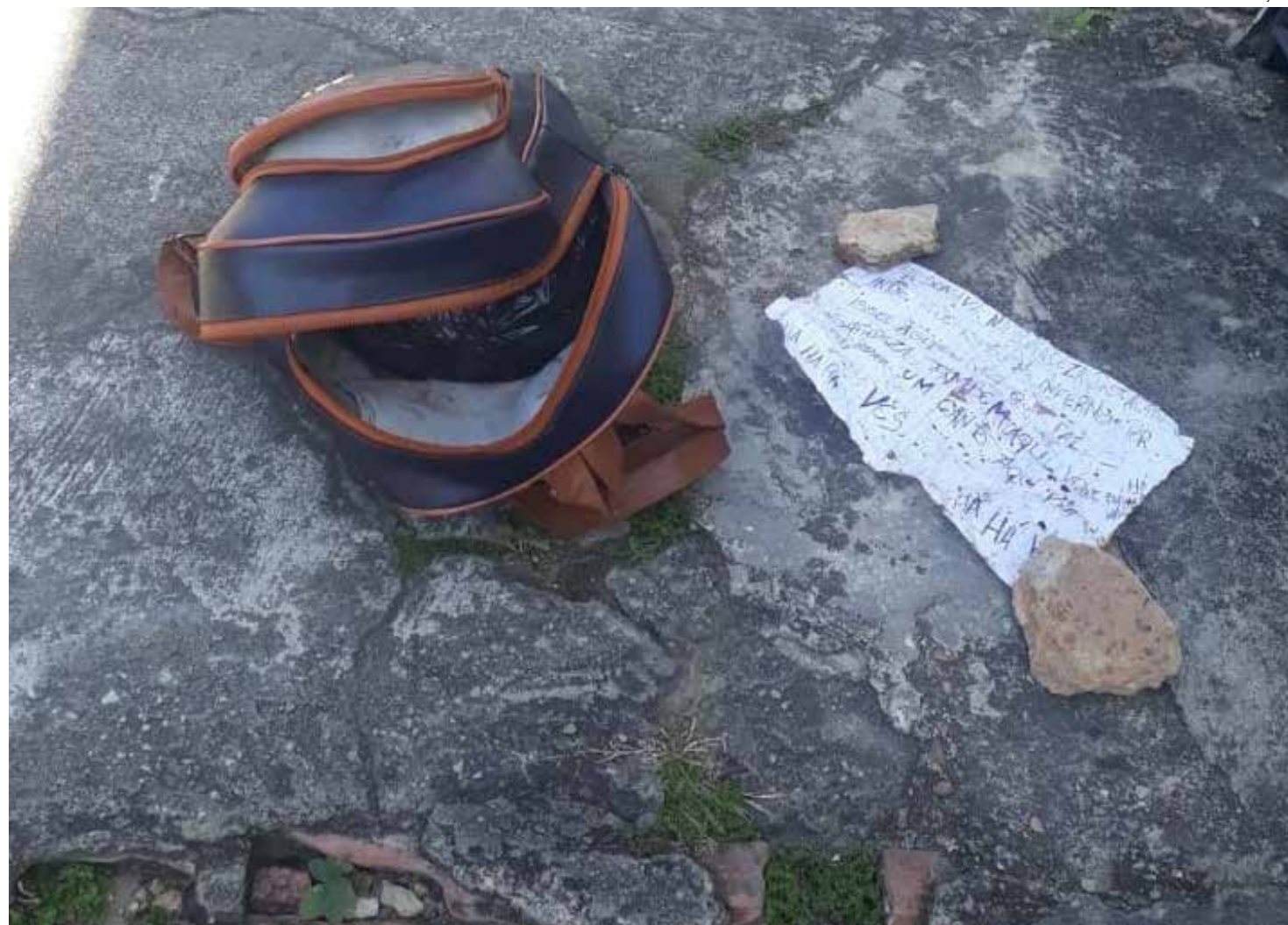
Restos do corpo de um homem podem ter sido espalhados pela cidade, afirma polícia

Segundo a 12ª Companhia Interativa Comunitária (Cicom), as partes desmembradas do corpo de um