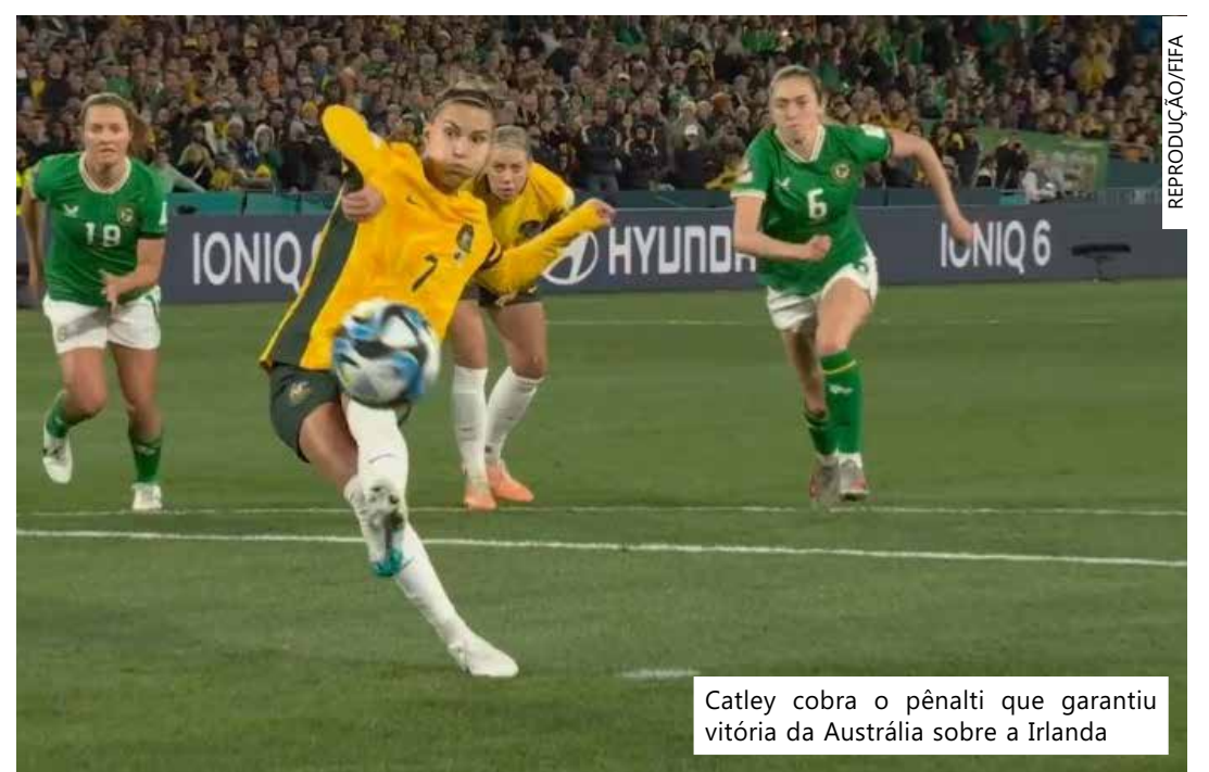
Catley cobra o pênalti que garantiu vitória da Austrália sobre a Irlanda

O gol deu uma nova dinâmica à partida, com as Matildas chegando com muito perigo com Fowler e Foord, enquanto McCabe quase marcou um gol olímpico para a Irlanda