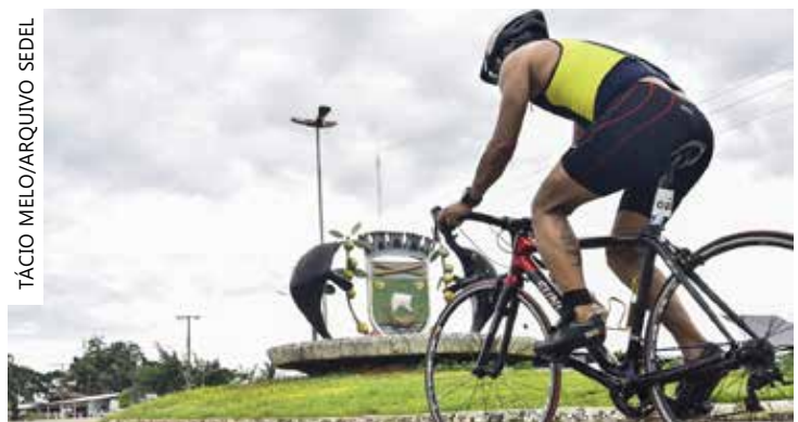
AirãoMan acontece nos dias 5 e 6 de agosto em Novo Airão

As inscrições podem ser feitas no site http://www.ticketsports.com.br/e/airaoman23 até 28 de julho.