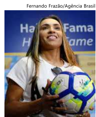
Marta jogou sua última Copa aos 37 anos

Além disso, possui um extenso currículo de títulos, incluindo a medalha de ouro nos Jogos Pan-Americanos de 2003 e 2007, e a conquista da Copa América em 2003, 2010 e 2018. Ela também foi vice-campeã da Copa em 2007 e conquistou medalhas de prata nas Olimpíadas de 2004 e 2008, segundo a Confederação Brasileira de Futebol (CBF).