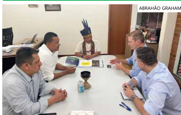
Embaixador debateu sustentabilidade, o turismo e a valorização cultural

Além de discutir a valorização cultural das 66 etnias indígenas presentes no Amazonas, o embaixador da Nova Zelândia conheceu exposição de artesanatos e assistiu apresentação do grupo cultural mulheres indígenas Caxiri na Cuia.