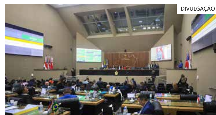
Debate sobre o aumento de vagas prevaleceu durante sessão ordinária

"Em 2013, o Tribunal Superior Eleitoral (TSE) entendeu que era necessário haver comprovação do aumento da população, o que ocorreu com o Censo 2022. É preciso iniciar um movimento novamente em busca dessa reparação", conclamou.