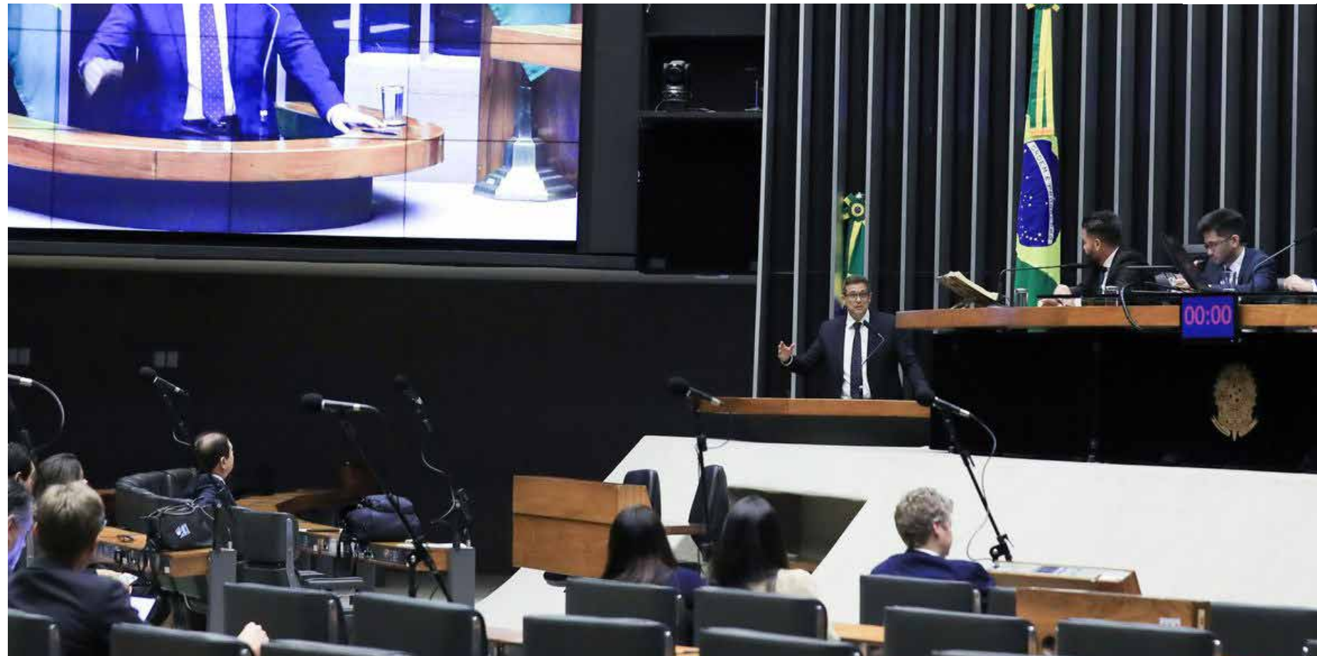
Presidente do Banco Central esteve na Câmara em uma homenagem ao pai dele

"A autonomia financeira se dá quando a autarquia tem total recolhimento de recursos