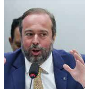
Ministro Alexandre Silveira