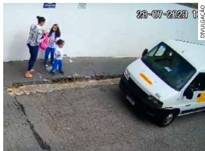
Câmera de segurança registra momento em que criança é colocada na van no início da tarde