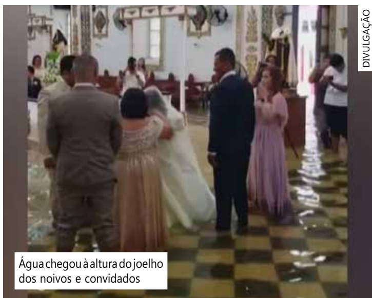
Água chegou à altura do joelho dos noivos e convidados

A tempestade trouxe inundações para cinco regiões e provocou mais de uma dúzia de deslizamentos de terra induzidos pela chuva, acrescentou a agência.