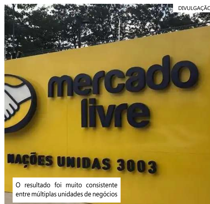
O resultado foi muito consistente entre múltiplas unidades de negócios

A receita líquida total no trimestre foi a 3,4 bilhões de dólares, avanço de 57,3% em moeda constante, impactada pelo maior número de usuários ativos, que aumentou 29% ano a ano, para 108,6 milhões, disse a empresa.