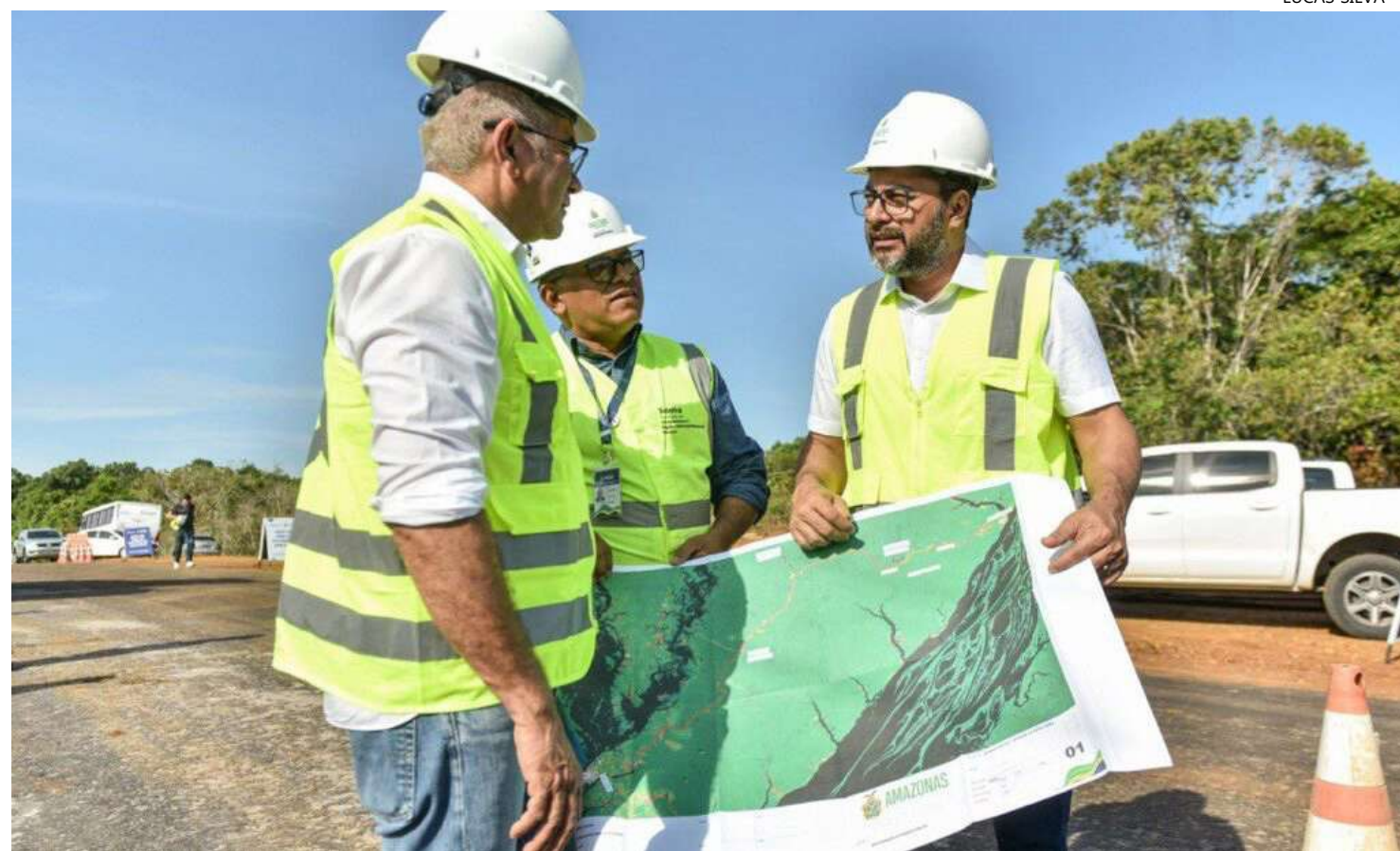
Rodovia AM-352 foi construída durante os anos de 1970 e 1980

"A nossa meta para este ano é deixar a rodovia em condições de trafegabilidade. Esse tem sido nosso principal objetivo, porque municípios como Novo Airão têm uma