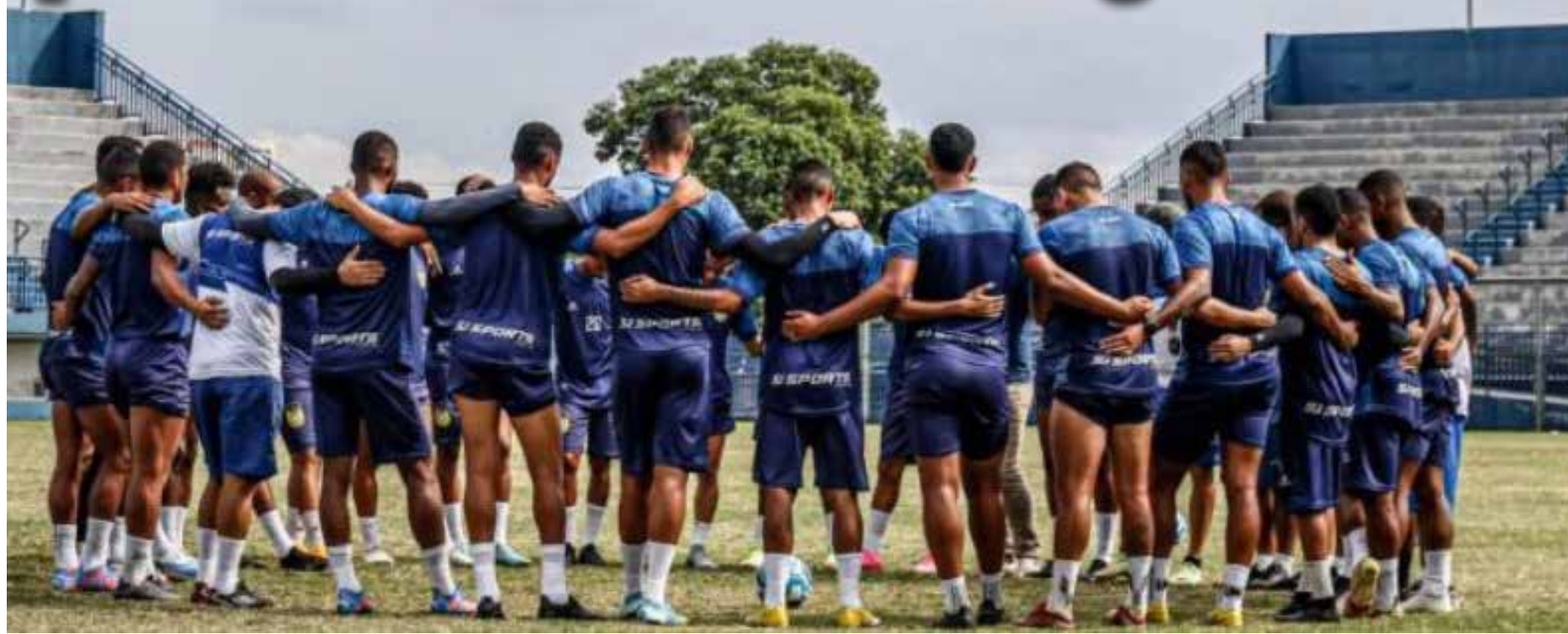
Equipe do Nacional treina para enfrentar o Parnahyba-PI no domingo (6)

Tradicional clube de Manaus promove campanha para aumentar apoio da torcida