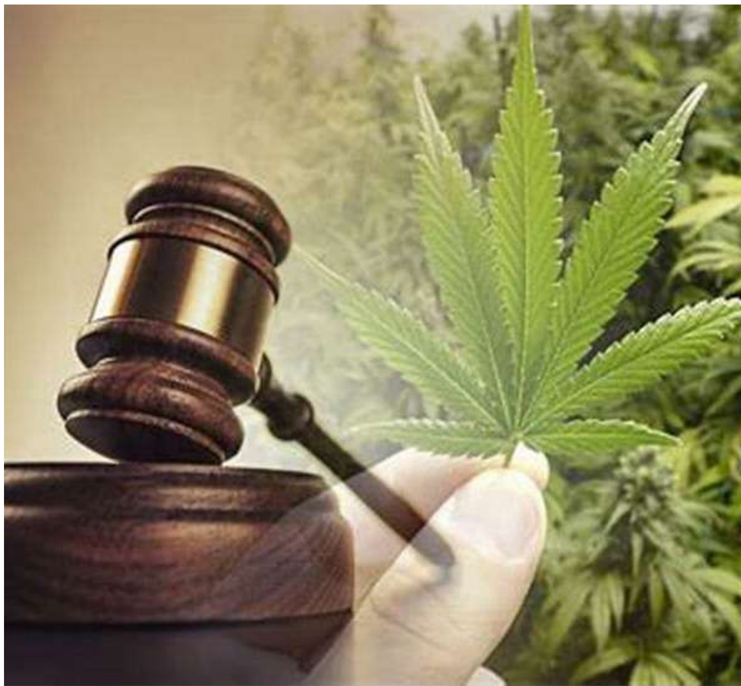
Discussão no STF sobre o assunto é antiga e vem de antes de André Mendonça assumir uma das cadeiras

Segundo Moraes, a falta de parâmetros previamente estabelecidos para definir usuários e traficantes leva a um uso de poder exagerado por parte das autoridades policiais: "Triplicou-se em 6 anos o número de presos por tráfico de drogas, mas não triplicamos o número de presos brancos, com mais de 30 anos e ensino superior, e sim o de pretos e pardos sem instrução e jovens".