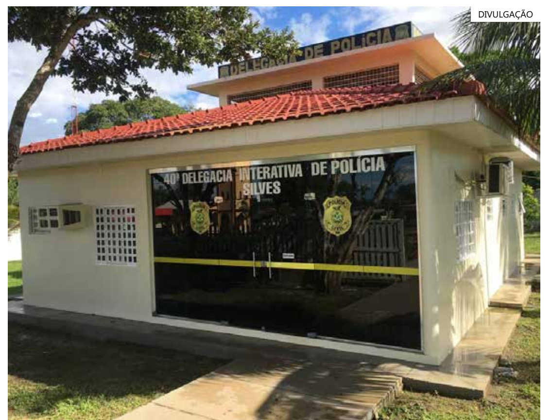
Prisão do suspeito ocorreu durante Operação Pravo, deflagrada na quarta-feira (2)