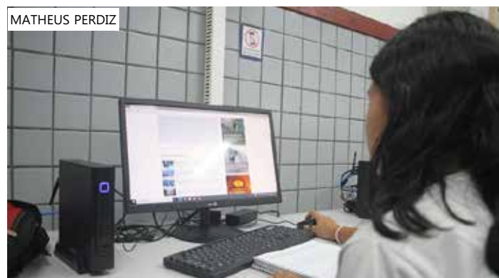
Internet está em processo de implantação há um mês

O equipamento de internet é caracterizado por ser fixado em lugares estratégicos, visando a melhor conexão via satélite, com antena independente. No caso de falta de energia, há aproximadamente 40 minutos de funcionamento automático e fornecimento de 200 mega de internet.