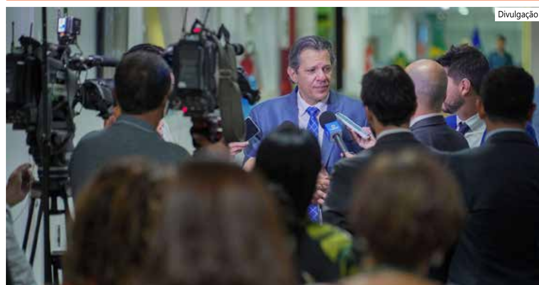
Queda será gradual na avaliação do ministro

em dívidas renegociadas até agora. O montante, segundo ele, pode chegar a R$ 50 bilhões até o fim do ano. Em setembro, o programa entra na fase de renegociação de dívidas de serviços, lojas e contas básicas, como água e luz.