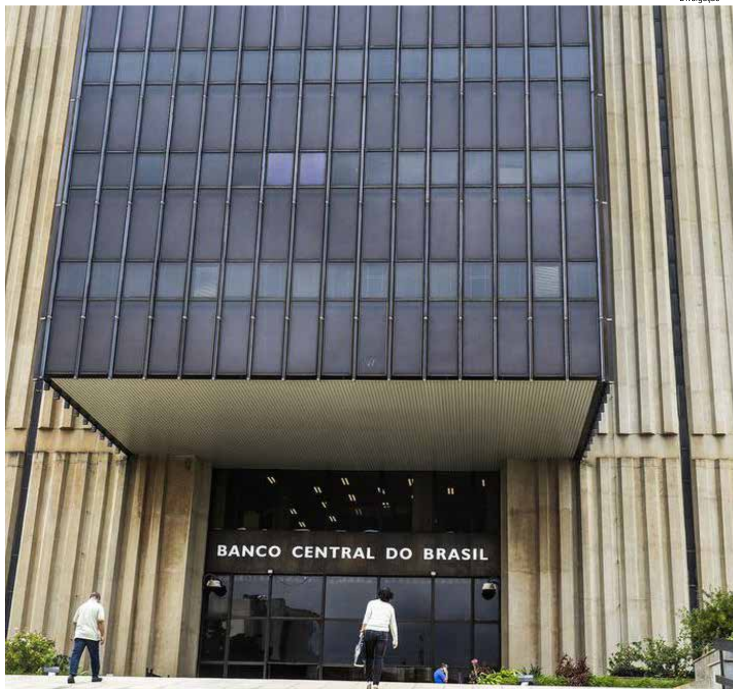
O Comitê de Política Monetária (Copom) reduziu a taxa Selic, juros básicos da economia, em 0,5 ponto percentual

O voto de desempate, portanto, coube a Campos Neto. Em comunicado, o Copom informou que a queda da inflação possibilitou a redução nos juros. "O comitê avalia que a melhora do quadro inflacionário, refletindo em parte os impactos defasados da política monetária, aliada à queda das expectativas de inflação para prazos mais longos, após decisão