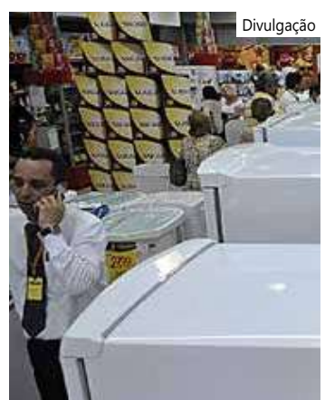
A Anefac também fez uma simulação sobre o impacto da nova taxa Selic

A Anefac também produziu uma simulação sobre o impacto da nova taxa Selic sobre os rendimentos da poupança. Com a taxa de 13,25% ao ano, a caderneta só rende mais que os fundos de investimento quando o prazo da aplicação é curto e a taxa de administração cobrada pelos fundos é alta.