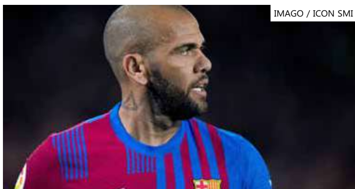
Daniel Alves segue preso em Barcelona

O pagamento porém não significa que o lateral poderá deixar a prisão.