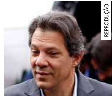
O ministro da economia Fernando Haddad