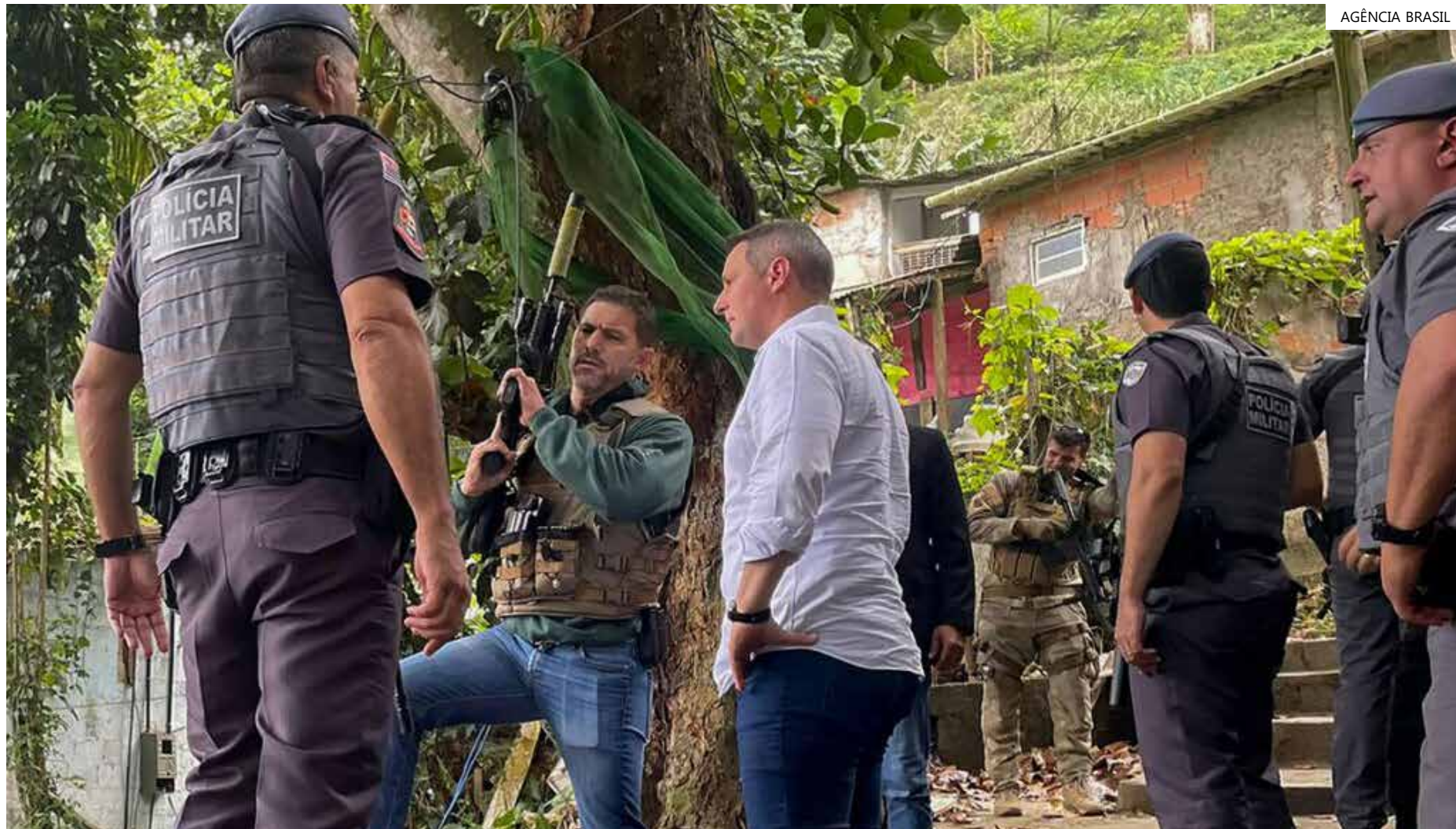
Além dos irmãos, a polícia prendeu um homem na sexta-feira (28) por participação no crime