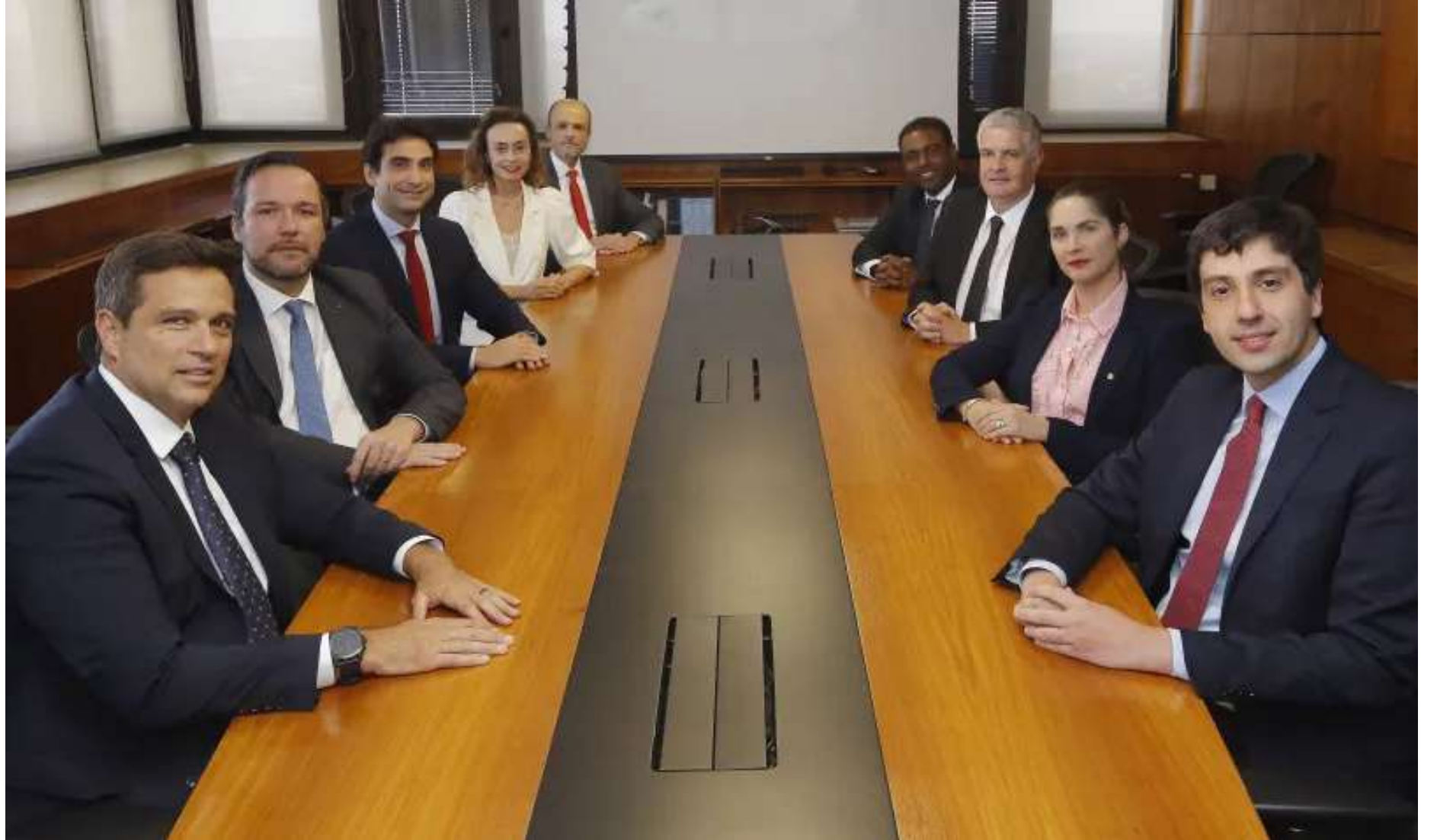
Membros do Copom, em reunião que decidiu a redução dos juros