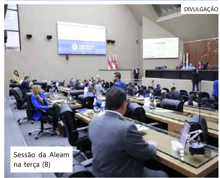
Sessão da Aleam na terça (8)

No Amazonas, foram 1.052 casos em 2019, 644 em 2020 e 688 em 2021. De acordo com o Mapa, houve uma redução de 36,5% no número de desaparecidos entre 2019 e 2021.