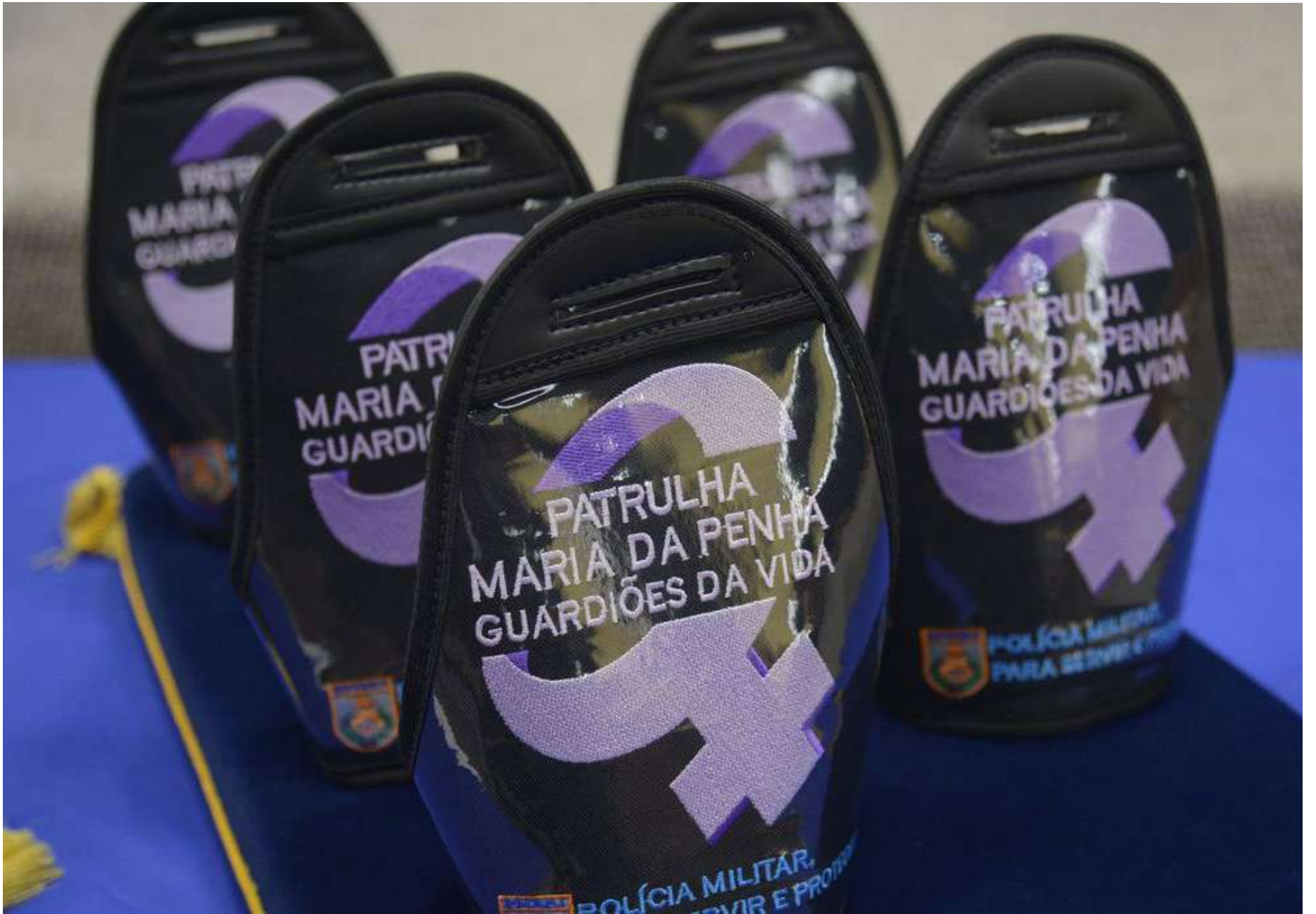
As denúncias de violência doméstica foram os casos mais atendidos pelo serviço 190

Um almoço no quartel-general da corporação contou com a presença do governador Cláudio Castro, que na saudação às homenageadas disse que "proteger as mulheres é um compromisso" do seu governo. "Por isso, investimos em equipes especializadas em tecnologia e em programas de proteção que acolham cada mulher do nosso estado. A Patrulha Maria da Penha já realizou mais de 190 mil atendimentos a mulheres. Nossa polícia vem trabalhando para combater qualquer tipo de violência", afirmou Castro.