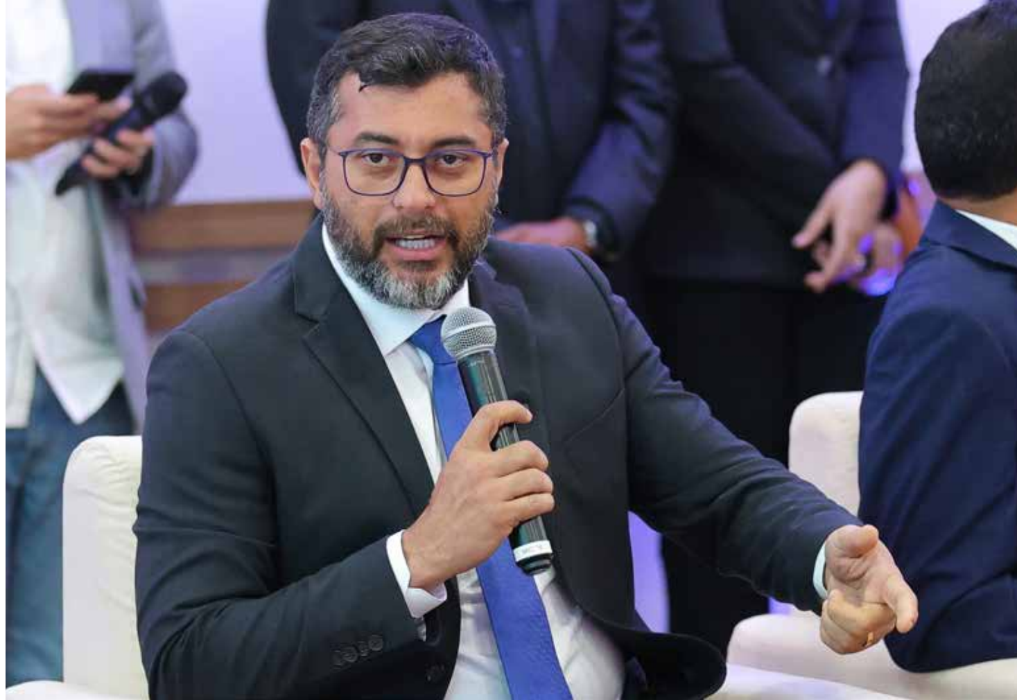
Segundo o governador, além de incentivar a agricultura local, programa promove a organização produtiva e econômica no meio rural

Ao destinar esses alimentos aos beneficiários consumi-