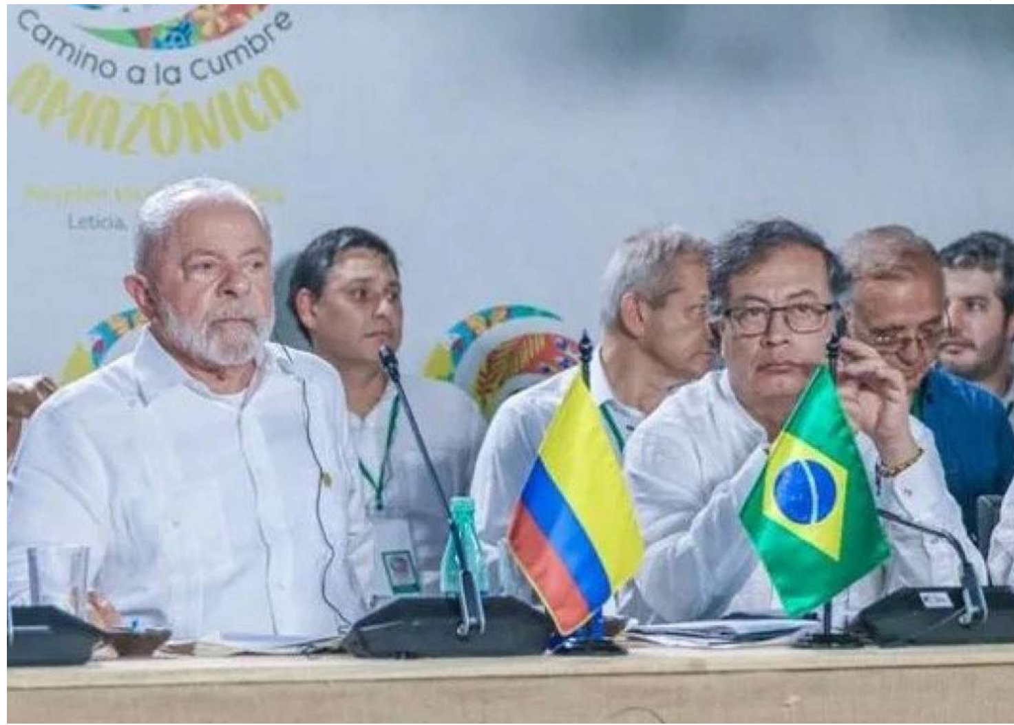
Presidentes do Brasil e da Colômbia assinaram a declaração

Por outro lado, os países concordaram em cobrar que os países desenvolvidos cumpram seus compromissos de fornecer recursos financeiros para que os países em desenvolvimento enfrentem os efeitos