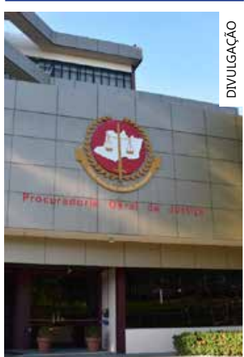
Ministério Público do Amazonas

A equipe de reportagem do Portal Vanguarda do Norte entrou em contato com a Prefeitura de Itapiranga para solicitar mais informações, mas não obtivemos resposta.