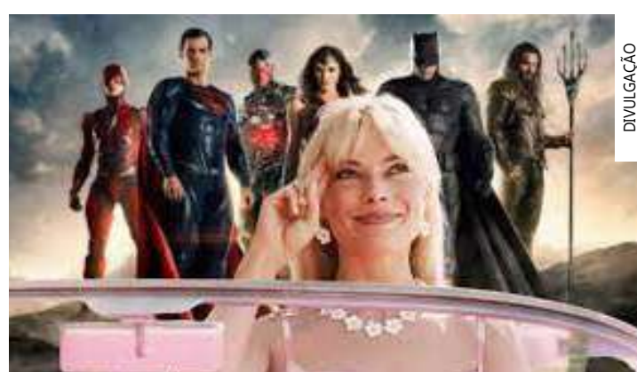
Barbie arrecadou 1,03 bilhão de dólares globalmente em 17 dias

zido por Robbie, Aves de Rapina: Arlequina e Sua Emancipação Fantabulosa (2020) faturou 205,3 milhões de dólares globalmente, o filme foi lançado alguns dias antes da Pandemia da Covid-19. Mulher-Maravilha 1984 (2020) arrecadou 169,6 milhões de dólares globalmente, a sequência de Mulher-Maravilha foi lançada durante a Pandemia da Covid-19. O Esquadrão Suicida (2021) marcou a estreia de James Gunn na DC Studios, o filme faturou 168,7 milhões de dólares globalmente. Protagonizado por Dwayne Johnson, Adão Negro (2022) ficou em desenvolvimento por oito anos e, quando estreou nos cinemas, faturou 393,2 milhões de dólares. Shazam! Fúria dos Deuses (2023) arrecadou 133,8 milhões de dólares globalmente e, finalizando o Universo Estendido DC, The Flash arrecadou 268,3 milhões de dólares globalmente.