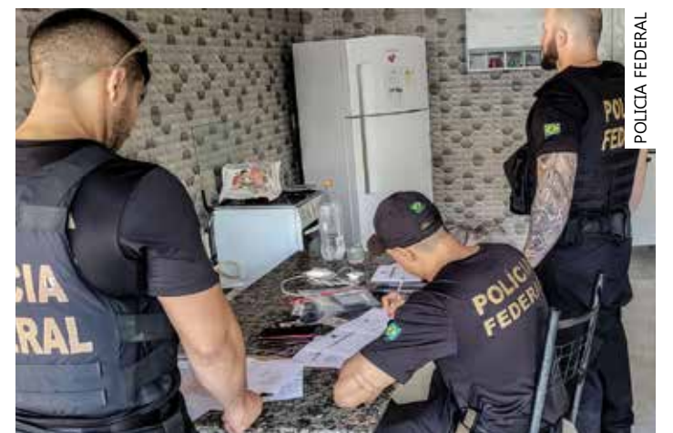
Produto injetável para estética deve ser regularizado