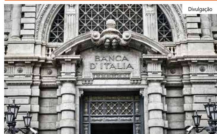
A taxa visa receitas de juros mais altas

uma reunião de gabinete de governo. Analistas do Citi estimam que isso eliminará 19% dos lucros do setor. A taxa visa receitas de juros mais altas após aumentos de juros pelo Banco Central Europeu (BCE). O governo ainda não divulgou detalhes ou o texto do decreto que pode custar aos bancos cerca de € 2 bilhões (US$ 2,2 bilhões), de acordo com uma estimativa inicial de analistas.