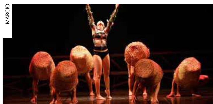
Espectáculo é baseado em pesquisas de Mário Ypiranga Monteiro

quisa histórica de obras do escritor amazonense Mário Ypiranga, que descreveu, na década de 30 do século passado, os costumes e tradições da etnia Arara, localizada no Estado do Pará. A montagem apresenta desde a criação do mundo através da cosmologia indígena até os rituais dos povos originários, como o trabalho feminino, o ritual de iniciação de homens e mulheres, a luta dos guerreiros, finalizando com a Dança do Sol.