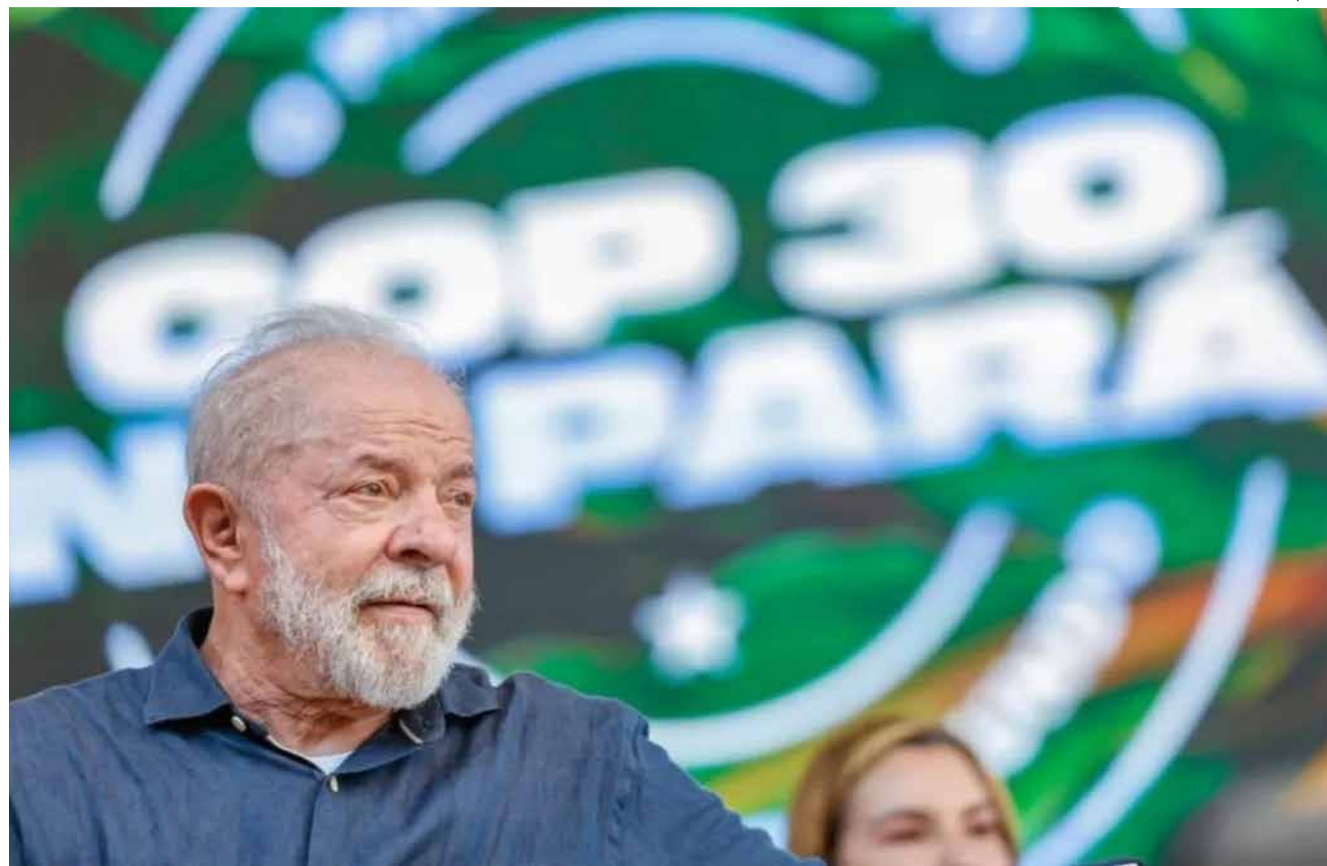
Lula discursou na abertura do evento em Belém

"Precisaremos conciliar a proteção ambiental com a inclusão social, o fomento à ciência tecnológica e a inovação, o estímulo à economia local, o combate ao crime internacional e a valorização