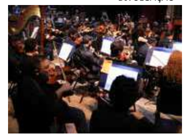
Amazonas Filarmônica executa a obra de Verdi "Réquiem"