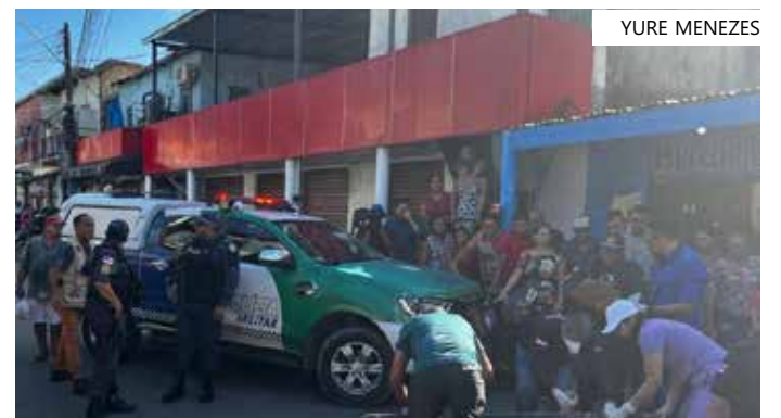
Vítima trabalhava em barbearia situada no bairro onde foi executada

Até o fechamento desta matéria, a motivação do crime é desconhecida. O caso será investigado pela Delegacia Especializada em Homicídios e Sequestros (DEHS).