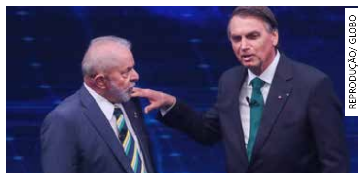
Deputados foram questionados sobre os dois líderes políticos

A pesquisa com os deputados federais foi feita entre os dias 13 de junho a 6 de agosto. Foram realizadas 185 entrevistas, o que é equivalente a 36% do total de parlamentares na Câmara. A margem de erro é de 4,8 pontos percentuais para mais ou para menos.