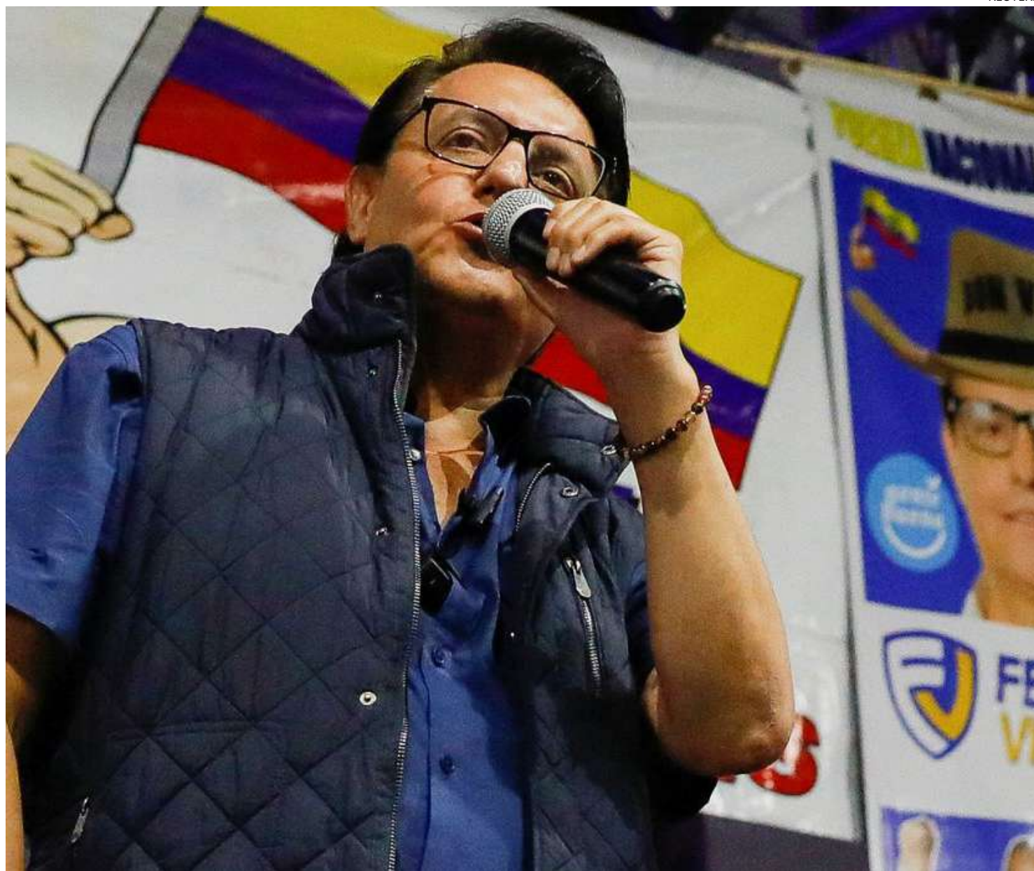
Villavicencio era candidato à presidência do Equador quando foi morto

tos de acusação enviados para o site do sistema de Justiça, todos os seis também foram acusados de tráfico ilícito de substâncias.