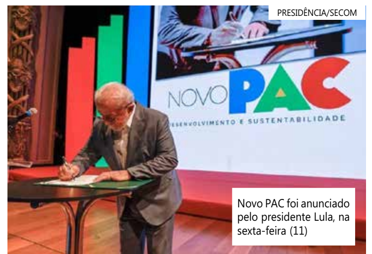
Novo PAC foi anunciado pelo presidente Lula, na sexta-feira (11)

Já para atender ao desafio da transição e segurança energética, o investimento no Amazonas será de R$ 4,5 bilhões, como acesso à energia em comunidades isoladas, por meio do Luz para Todos. Por fim, outros R$ 4,5 bilhões também serão destinados para o Amazonas em Inovação para a Indústria da Defesa, o que permitirá equipar com tecnologias de ponta e aumento da capacidade de defesa.