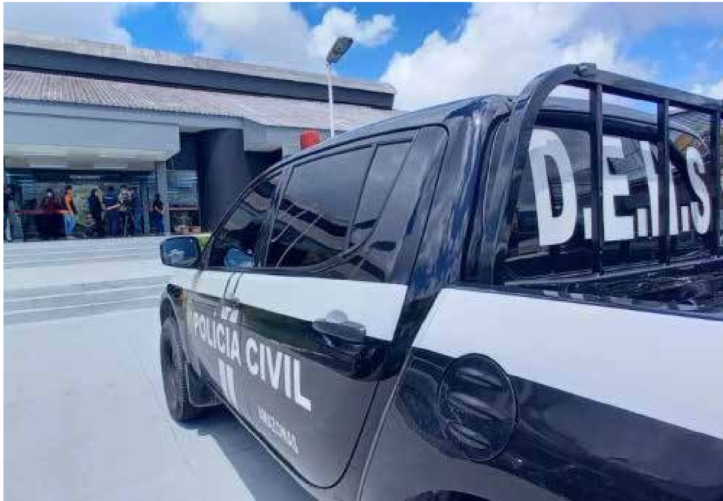
Suspeitos foram apresentados na sede da Delegacia Especializada em Homicídios e Sequestros (DEHS), localizada na zona leste da cidade