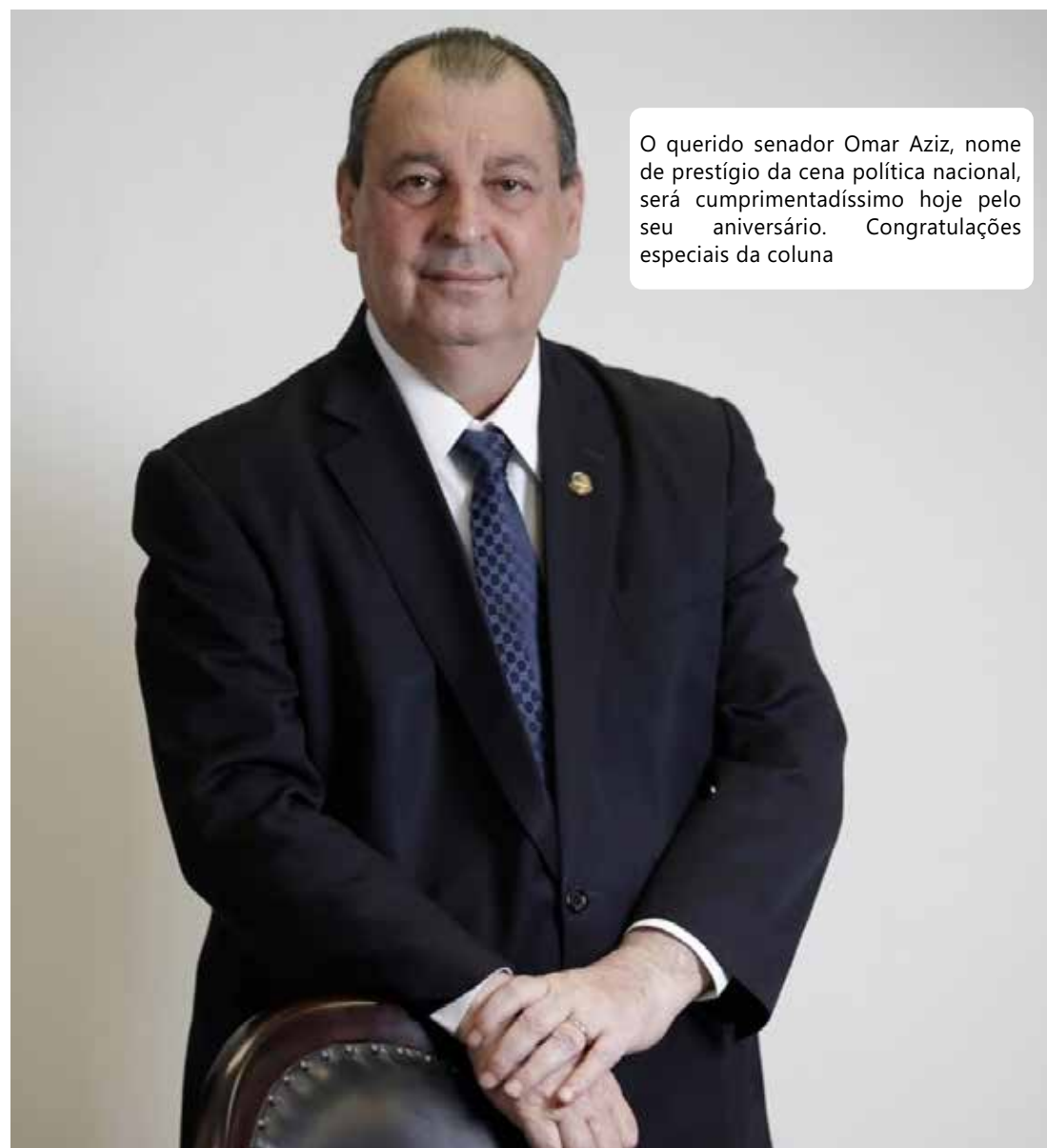
O querido senador Omar Aziz, nome de prestígio da cena política nacional, será cumprimentadíssimo hoje pelo seu aniversário. Congratulações especiais da coluna

. A sessão solene acontecerá, conforme propositura do vereador Jander de Melo Lobato, às 9h30min, no plenário Adriano Jorge.