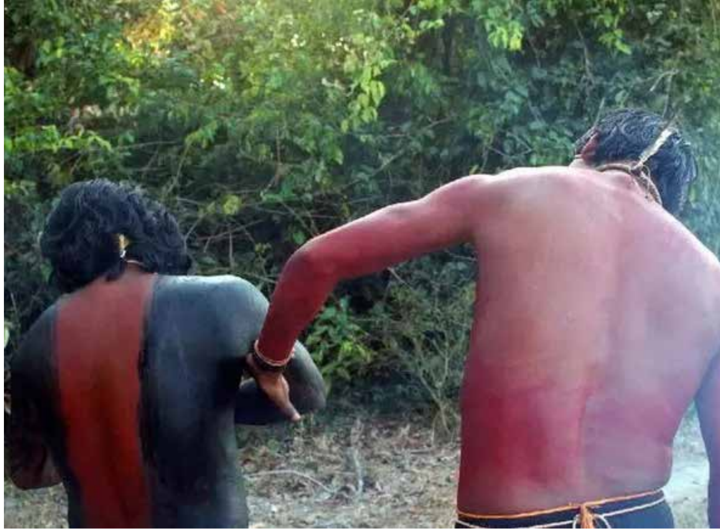
No mês de junho deste ano, os pesquisadores fizeram entrevistas com líderes e anciões da etnia xavante de Marãiwatsédé

No mês de junho deste ano, os pesquisadores fizeram entrevistas com líderes e anciões da etnia xavante de Marãiwatsédé, além de deslocamentos por estradas vicinais de livre acesso. Com isso, foi identificada a localização de antigas aldeias que atualmente se encontram dentro de terrenos particulares. De acordo com o documento, a aldeia mais antiga dentre as identificadas pelos pesquisadores - chamada Bö'u -