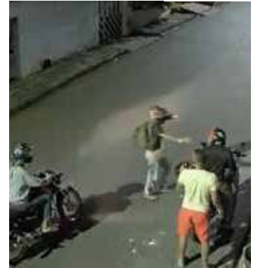
Motociclista foi assaltado na zona leste da capital