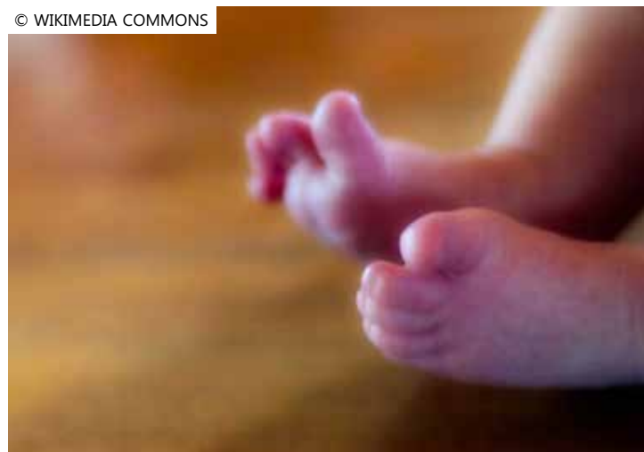
A mãe abriu ação na justiça contra a médica e uma equipe do hospital