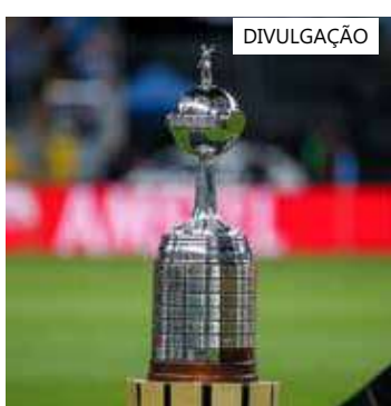
Campeão das Libertadores leva 18 milhões de dólares

A classificação para as quartas de final vale 1,7 milhão de dólares (cerca de R$ 8 milhões) para os times que chegaram até essa fase. Já na Semifinal, esse valor é de US$ 2,3 milhões. O Vice-campeão leva US$ 7 milhões e o Campeão: US$ 18 milhões.