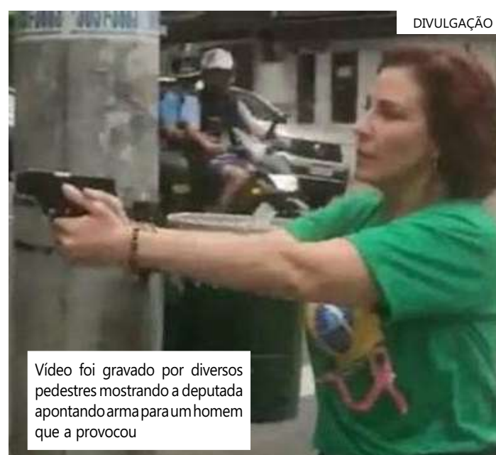
Vídeo foi gravado por diversos pedestres mostrando a deputada apontando arma para um homem que a provocou

Na tarde de 29 de outubro, véspera do segun-