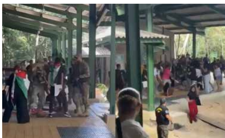
Confusão na UFAM ocorreu na última quinta-feira (10)