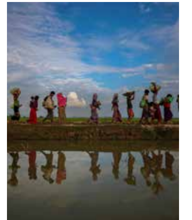
Há ainda 30 pessoas desaparecidas, tendo 8 sobrevivido ao incidente