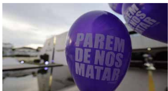
Além das luzes, balões com mensagens foram colocados do lado externo