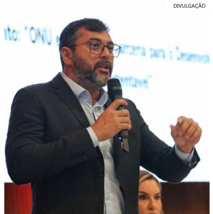
Segundo Wilson Lima, serão contemplados ribeirinhos das Unidades de Conservação e pequenos agricultores