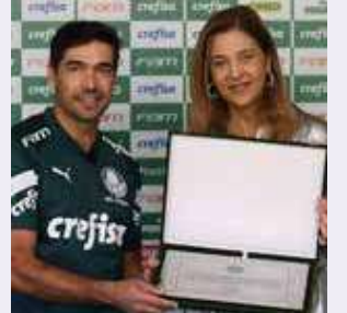
Abel Ferreira recebe placa da presidente do Palmeiras