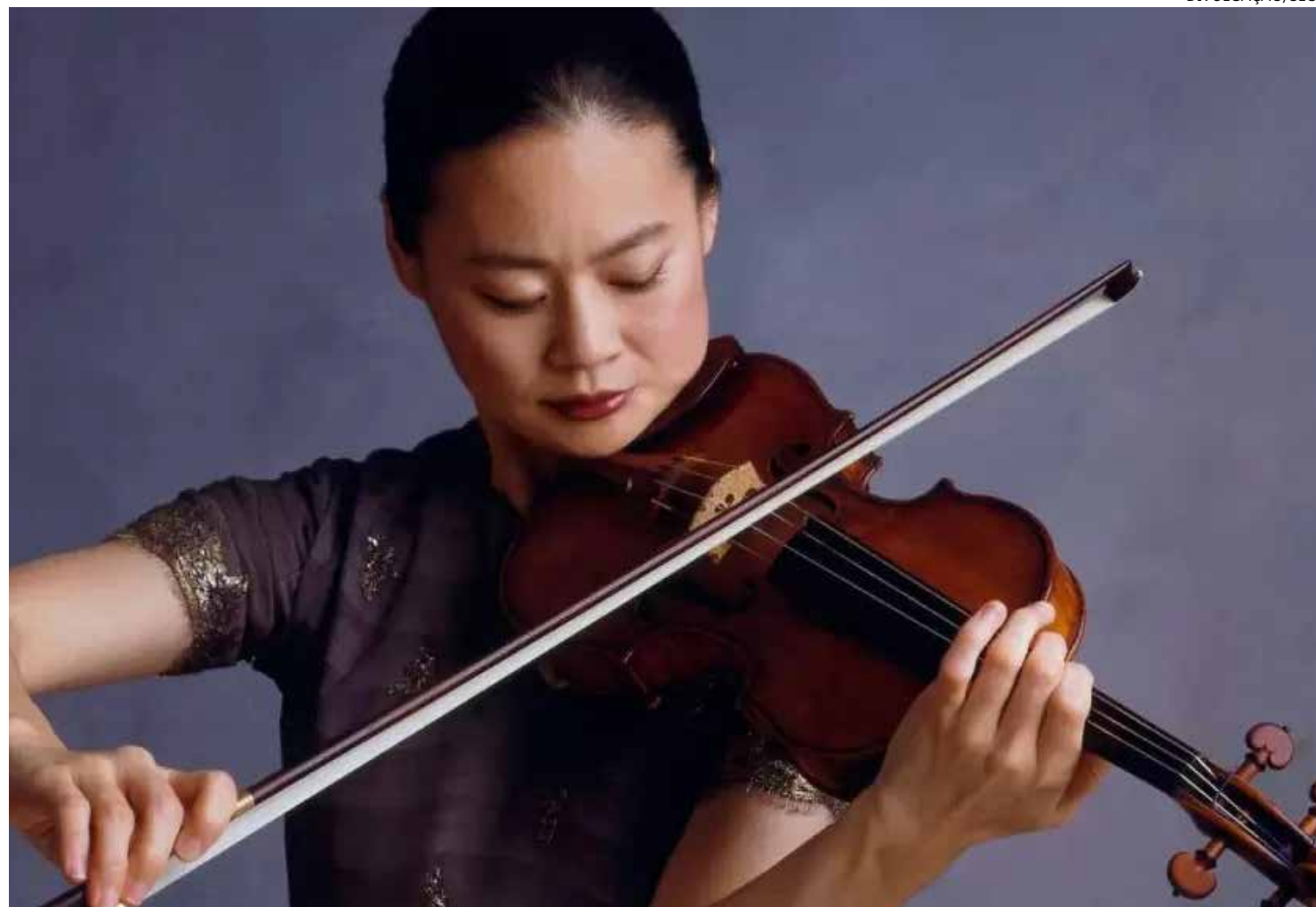
Programação do mês no Teatro Amazonas envolve cinema, teatro e música