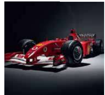
Ferrari usada em três provas de 2002 pode chegar a R$ 50 milhões