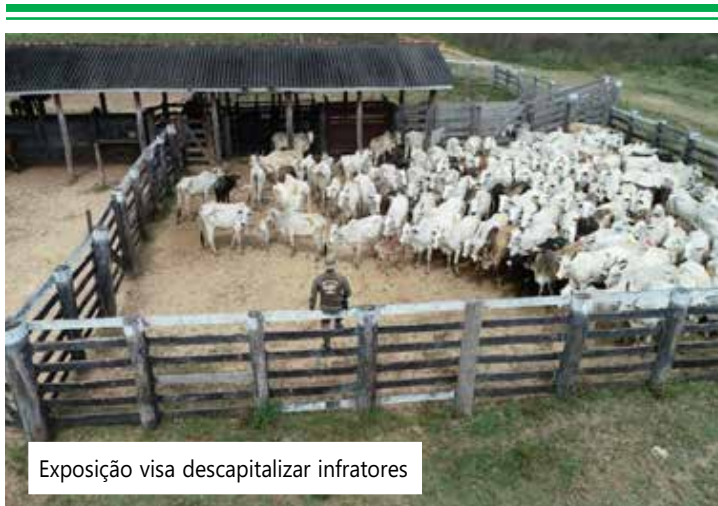
Exposição visa descapitalizar infratores