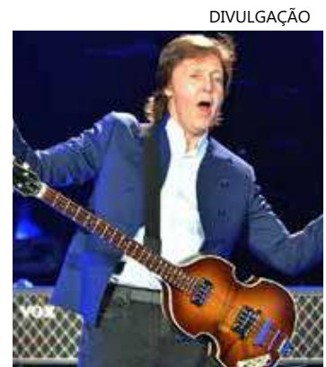
Tour "Got Back" no Brasil ganha mais uma data em São Paulo

O Maracanã, no Rio de Janeiro, recebe a tour no dia 16 de dezembro (a partir de R$ 150).