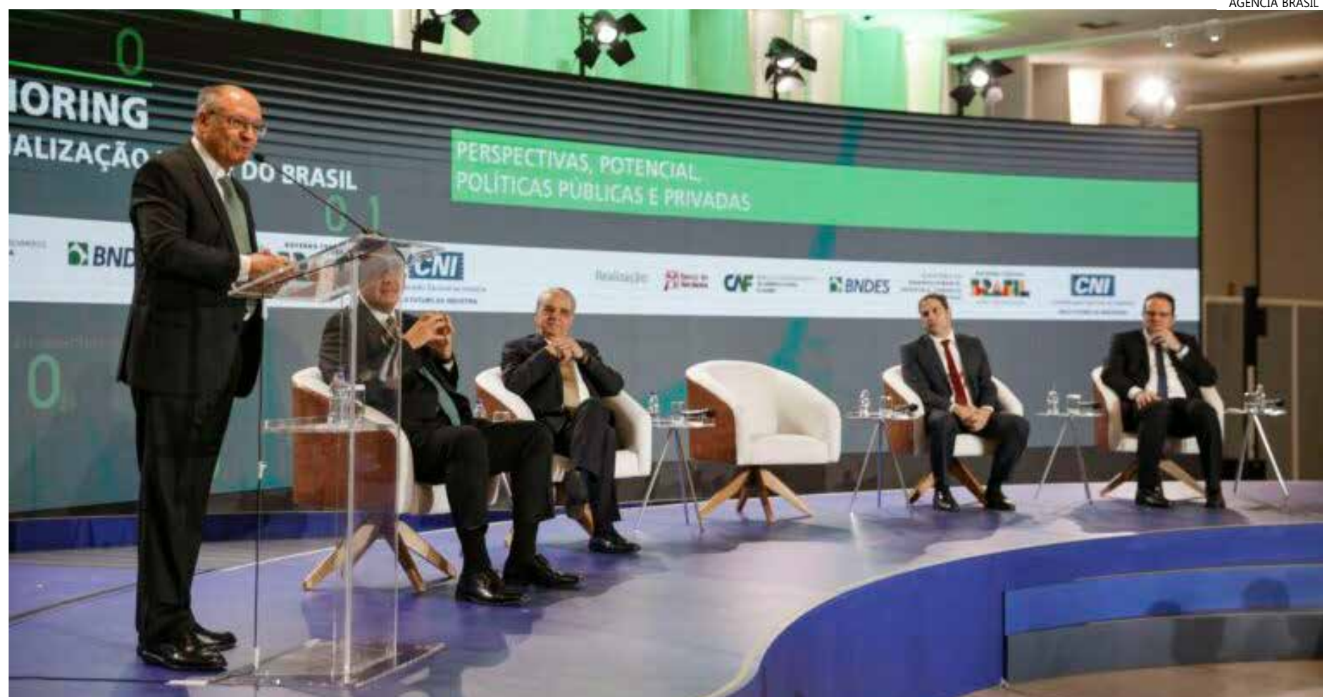
O presidente da República em exercício, Geraldo Alckmin, discursou durante abertura de conferência

"A pergunta sempre foi onde é que eu fabrico bem e barato? Agora é onde é que eu fabrico bem, ba-