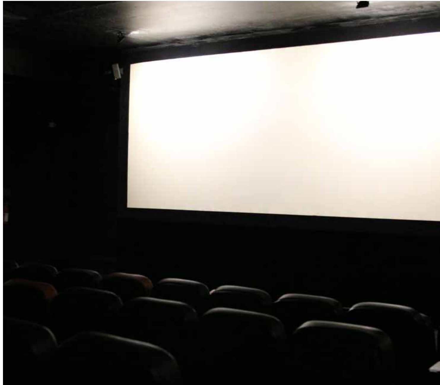
Lei prevê o repasse de R$ 3,862 bilhões