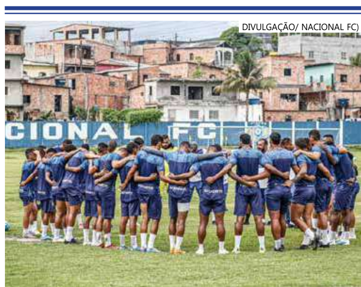
Movimentação nos bastidores cria clima de tensão

Apesar das críticas, torcedores do Leão da Vila Municipal usaram as redes sociais para compartilhar uma publicação do clube, datada de 10 de março deste ano, onde a prática se repete e indica, conforme defendido pela diretoria do Nacional, uma prática corriqueira.