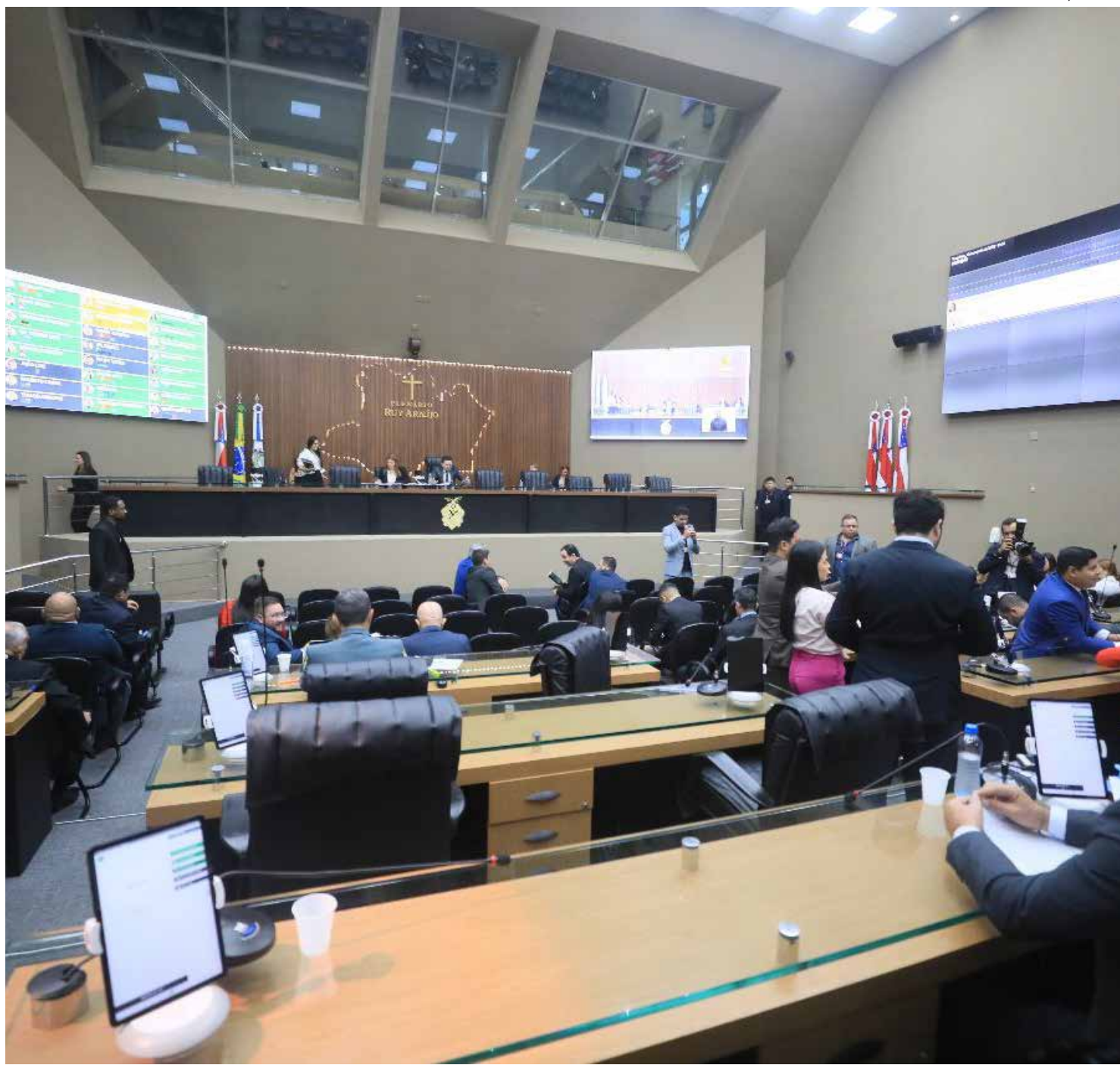
Sessão ordinária acontece no plenário Ruy Araújo