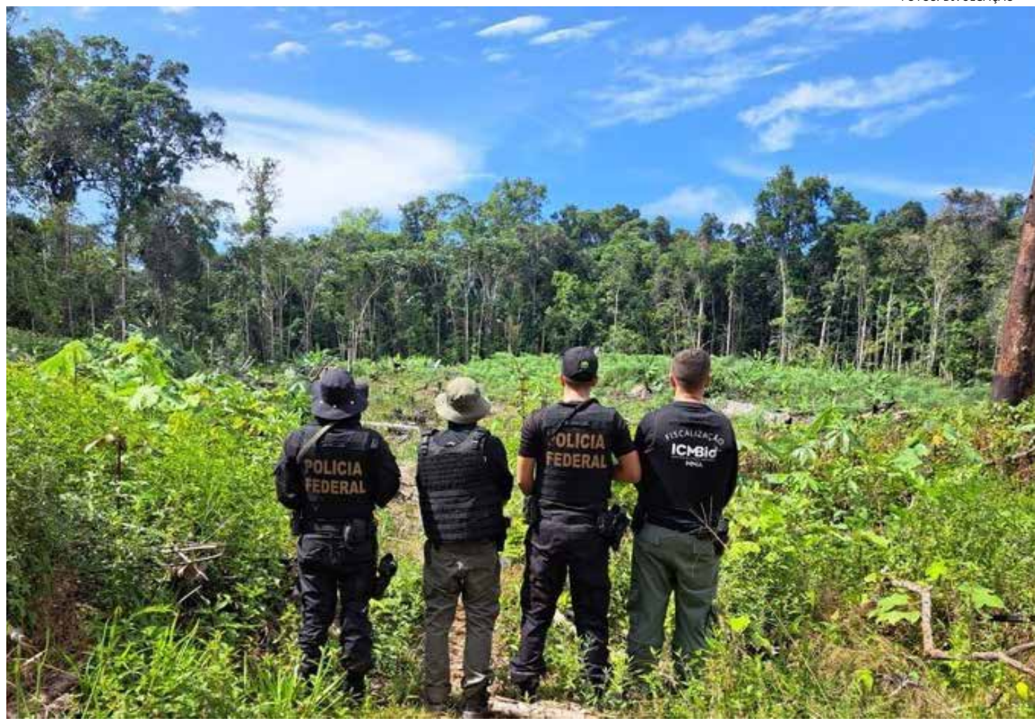
Operação teve uma semana de duração no interior do estado

"Ao longo dessa iniciativa, a Polícia Federal tem oferecido apoio coordenado aos órgãos mencionados, com o intuito de assegurar a segurança da região e colher informações de relevância. A PF também tem conduzido verificações detalhadas e análises de denúncias, com o propósito de reprimir atividades ilegais de caça, que são prejudiciais à fauna local", declara a Polícia Federal.