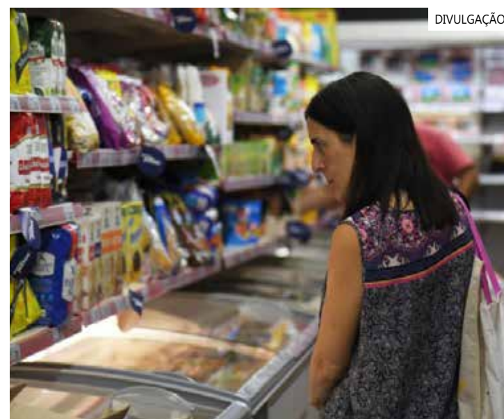
Na comparação anual, a inflação ao consumidor saltou 113,4% em julho

Neste caso, houve desaceleração, após o avanço de 115,6% no mês anterior. Nos sete primeiros meses do ano, o CPI argentino acumula alta de 60,2%.