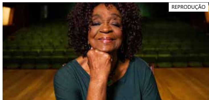
Léa Garcia, 90, faleceu em Gramado, onde estava para ser premiada

Léa ficou conhecida como a vilã Rosa de "A Escrava Iaura" de 1976, novela que rodou o mundo e foi dublada em diversos idiomas.