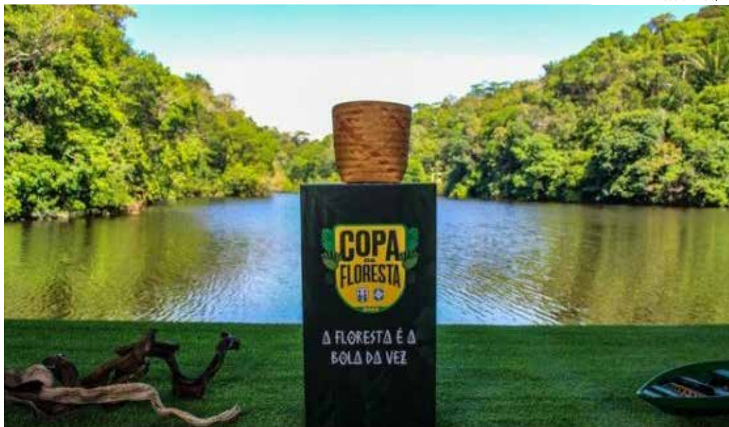
Copa é o maior evento esportivo para os povos tradicionais do interior do Amazonas

A Liga Desportiva de Presidente Figueiredo é uma das mais atuantes do esta-