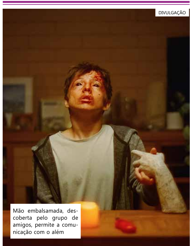
Mão embalsamada, descoberta pelo grupo de amigos, permite a comunicação com o além

Segundo a sinopse do filme fala de "um grupo de amigos que descobre uma mão embalsamada - que lhes permite conjurar espíritos. Viciado na emoção, um deles vai longe demais e abre a porta para o mundo espiritual."