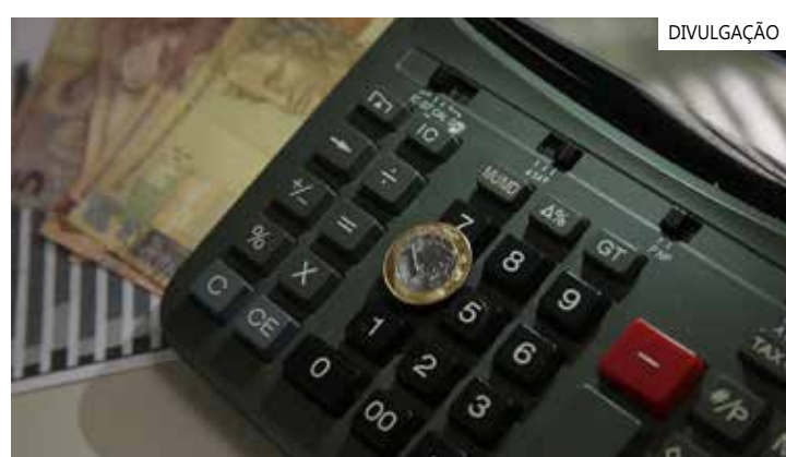
Ao detalhar o resultado, a FGV identifica uma alta de 2,3%

Os números oficiais do PIB são divulgados trimestralmente pelo Instituto Brasileiro de Geografia e Estatística (IBGE). Os dados do segundo trimestre serão conhecidos no dia 1º de setembro. Em junho, o IBGE anunciou que o PIB do primeiro trimestre cresceu 1,9% na comparação com os últimos três meses de 2022.