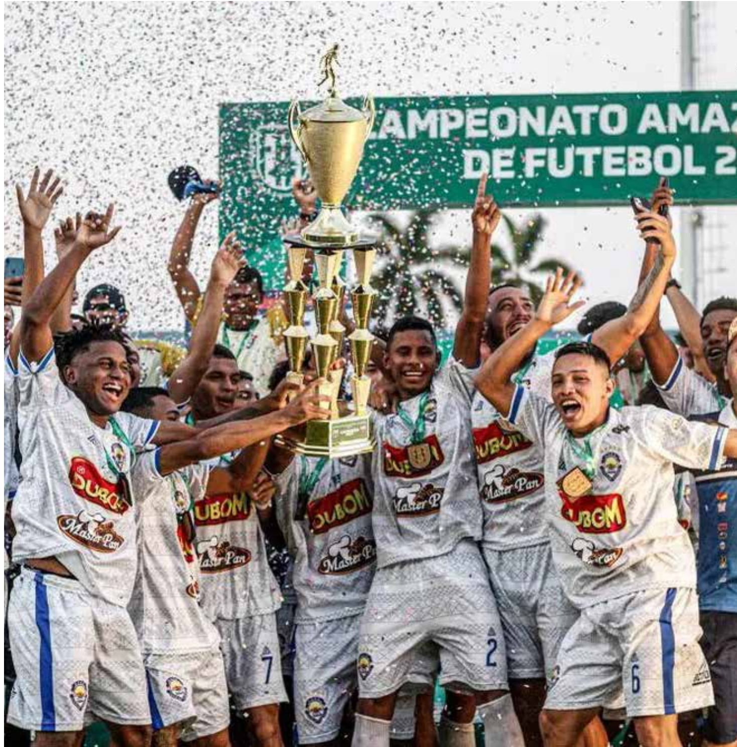
Clube que tem origem no futebol amador no bairro Alvorada se torna campeão e chega à divisão de elite

O jogo começou com o São Raimundo melhor na partida, criando as melhores jogadas de ataque. Tanto que logo aos dois