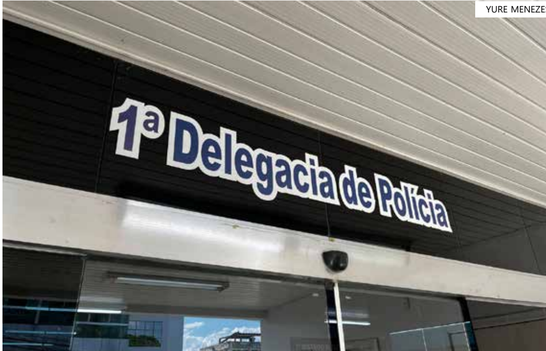
Ação foi resultado de investigação do 1º Distrito Integrado de Polícia (DIP)