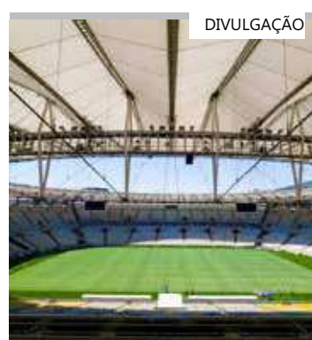
Maracanã será palco de Vasco x Atlético-MG