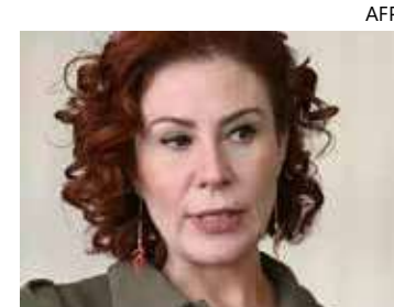
Carla Zambelli é filiada ao PL de Bolsonaro

A maioria segue voto proferido por Gilmar Mendes. O relator entendeu haver indícios suficientes para a abertura da ação penal.