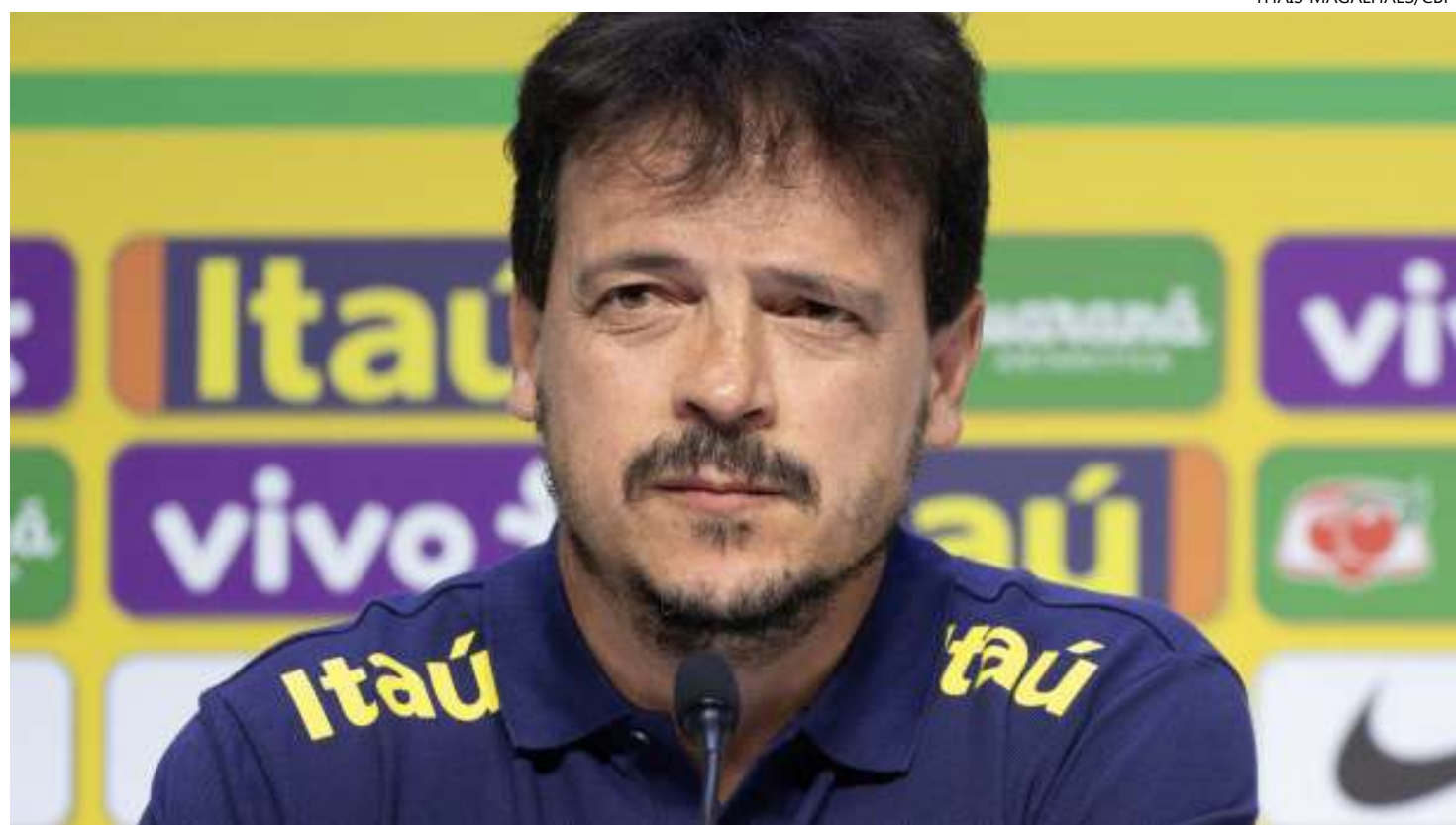
Fernando Diniz convoca Seleção Brasileira para Eliminatórias em setembro

"O objetivo é, claramente, ser uma equipe competitiva, com as características que eu considero mais importantes. Criatividade, competitividade e