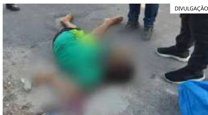
Vítima estava alcoolizada no momento do crime

O incidente será alvo de investigação por parte da Delegacia Especializada em Homicídios e Sequestros (DEHS). O corpo foi recolhido pelo Instituto Médico Legal (IML).