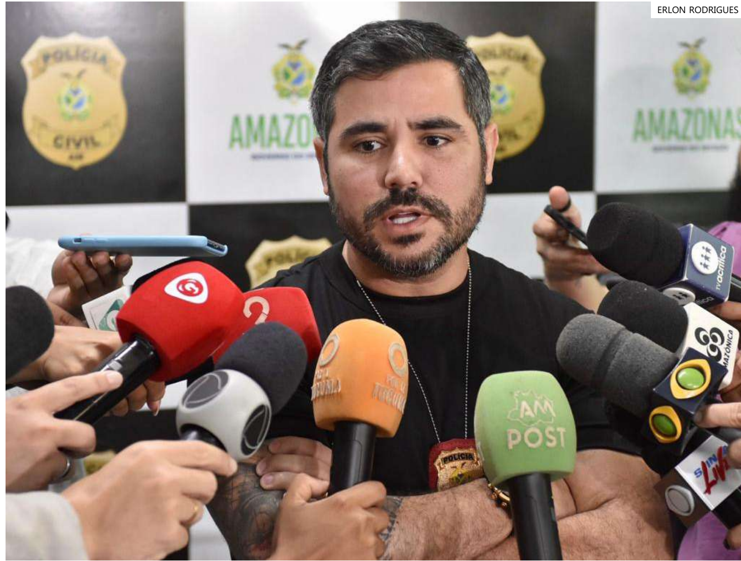
Delegado Cícero Túlio, titular do 1º Distrito Integrado de Polícia (DIP)

A Polícia também constatou que o crime foi premeditado e motivado pelo fato de eles terem dívidas com um agiota. "Por isso, eles arquitetaram o roubo a