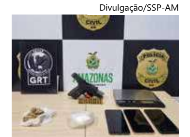
Operação contou com agentes da Seaop e do 6º Dip

A Secretaria de Segurança Pública, no entanto, não divulgou informações sobre as investigações acerca do paradeiro do suspeito. O material apreendido foi apresentado, junto da ocorrência, no 6º DIP para as devidas providências.