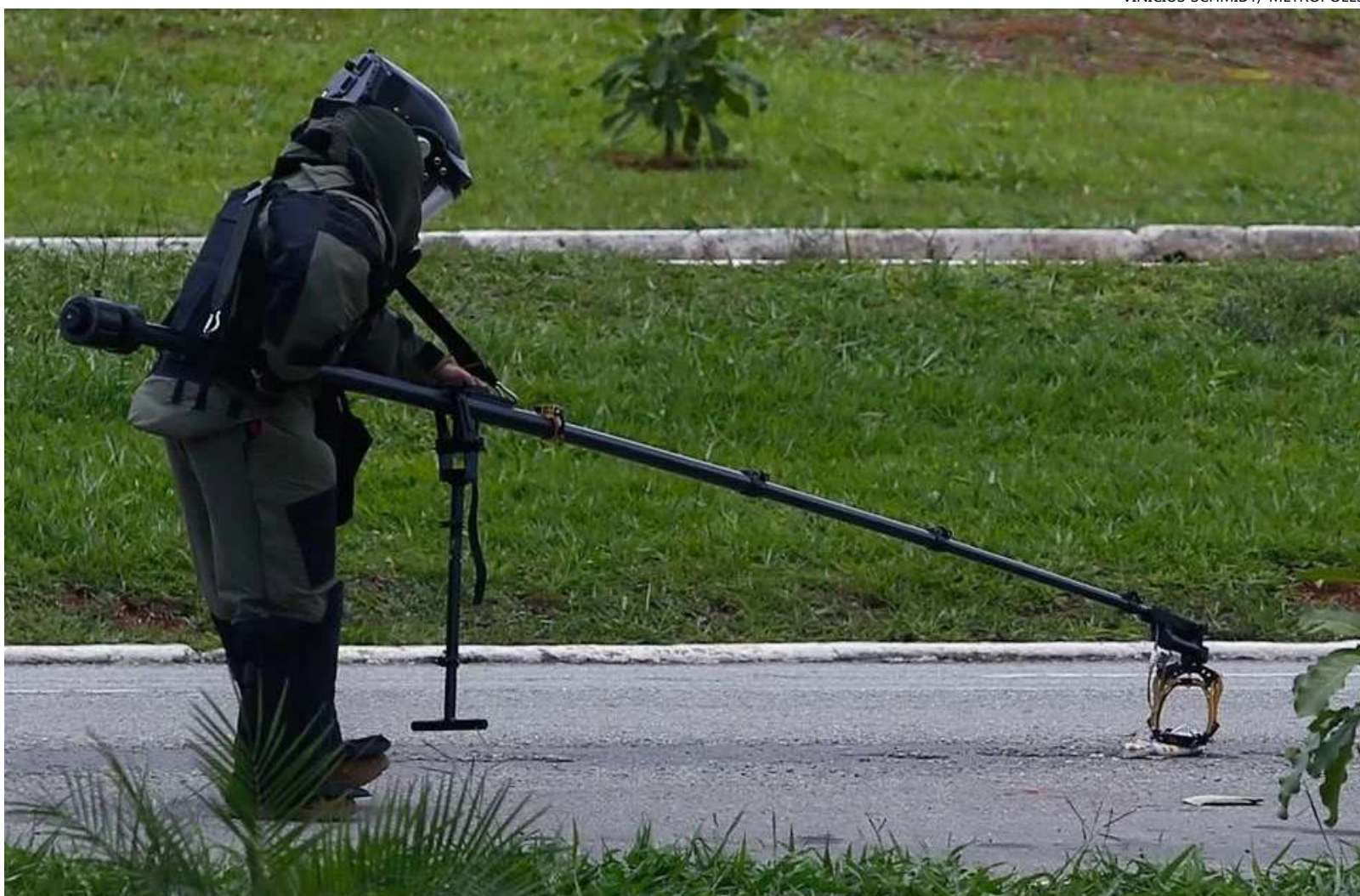
Bomba estava em aeroporto de Brasília e foi desativada no local

De acordo com o juiz do caso, antes da tentativa de explosão, os dois acusados se conheceram no acampamento montado por apoiadores do ex-presidente Jair Bolsonaro em frente ao quartel do Exército em Brasília.