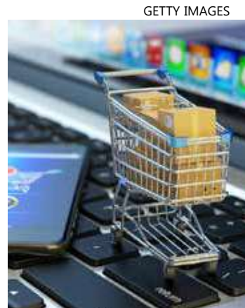
Operação da AliExpress no Brasil é uma das principais no mundo

Com 164 unidades já em operação, a expectativa da Shein é chegar à marca de 2000 unidades fabris no país nos próximos anos.