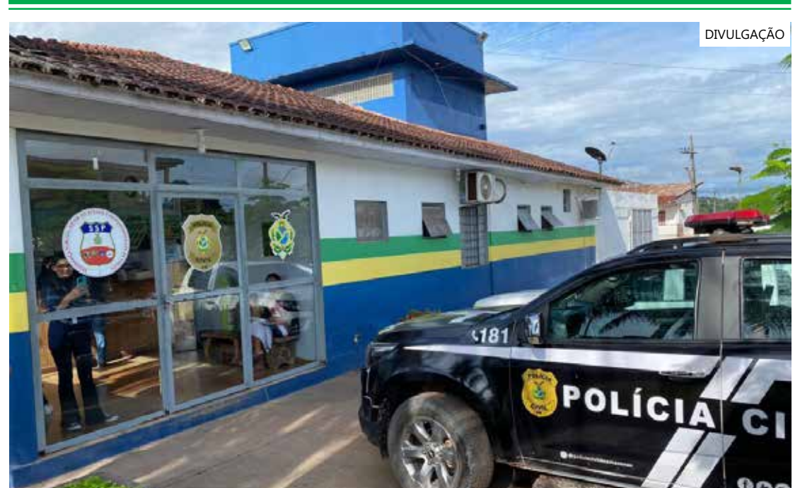
Dupla foi presa em flagrante

Os indivíduos responderão por tráfico de drogas e associação para o tráfico e estão à disposição da Justiça.