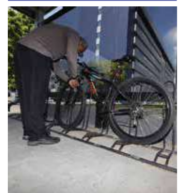
Aleam já contra com 'bicicletário'

Outro ponto relevante, de acordo com a justificativa do PL, é o desenvolvimento de rotas ciclistas seguras e bem sinalizadas, que atravessam as paisagens deslumbrantes da região, conectando áreas de interesse turístico, culturais e ecológicas. "O ciclo-turismo, ao ser incentivado, promove uma interação mais próxima dos visitantes com a natureza e as comunidades locais, contribuindo para a geração de empregos e renda nessas áreas", diz o autor do Projeto de Lei.