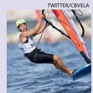
Velejador brasileiro classificado para Paris 2024