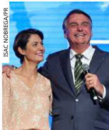
A ex primeira dama Michelle Bolsonaro e Jair Bolsonaro

A Polícia Federal investiga a venda de 2 relógios de luxo, um da marca Rolex e outro da marca Patek Philippe. As duas peças teriam sido vendidas em uma loja no Estado norte-americano da Pensilvânia por US$ 68.000.