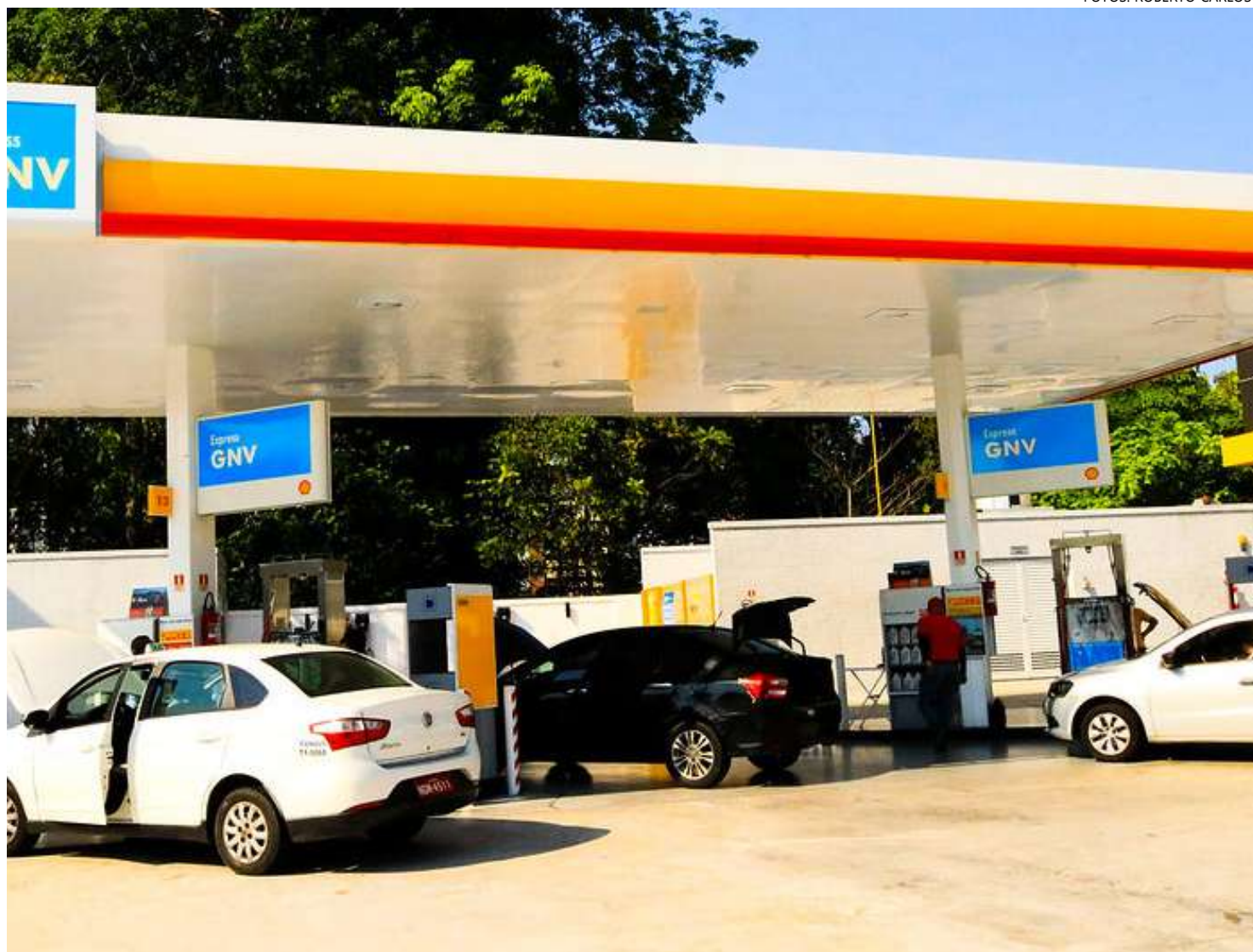
Dois novos postos vão garantir oferta em todas as zonas da cidade