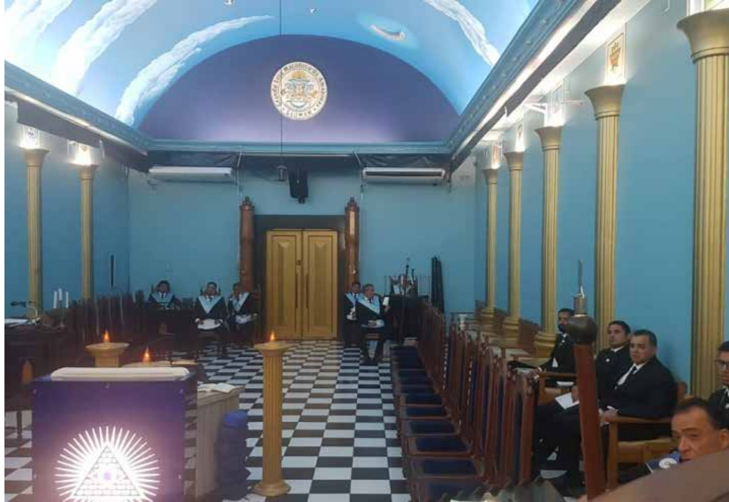
Irmãos amazonenses reunidos em Loja Maçônica de Manaus

De acordo com pesquisas, a origem da Maçonaria data de 1175, quando pedreiros ingleses se organizaram em uma sociedade no intuito de