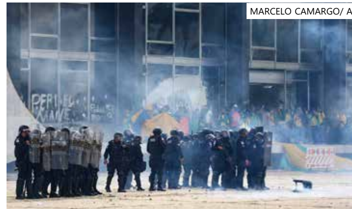
Ações policiais durante protesto no dia 8 de janeiro contra resultado das eleições

"Os mandados foram determinados pelo relator do Inquérito 4.923 no Supremo Tribunal Federal, ministro Alexandre de Moraes, e cumpridos de forma conjunta pela Procuradoria-Geral da República e Polícia Federal", concluiu a PGR.