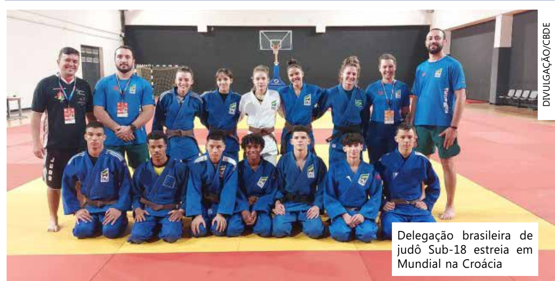
Delegação brasileira de judô Sub-18 estreia no Mundial na Croácia

As finais serão a partir das 11h (horário de Brasília). Todas as lutas serão transmitidas pelo judotv.com.