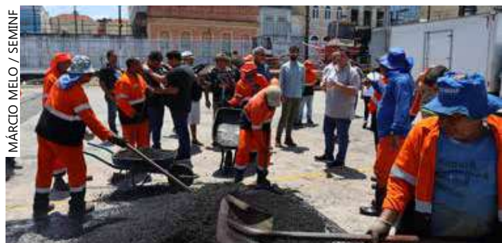
Área do Passo a Paço recebe requalificação viária