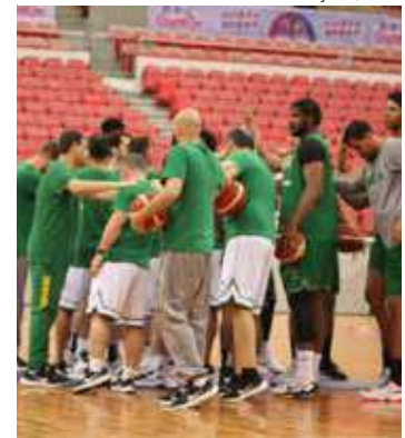
Seleção vem de sequência de vitórias