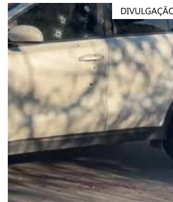
Veículo foi alvejado com, pelo menos, sete tiros na porta do motorista

Ainda conforme a polícia, a equipe do Departamento de Polícia Técnico Científica (DPTC) realizou os trabalhos de perícia técnica no local do ocorrido. Também não há informações sobre os suspeitos e a motivação do crime.