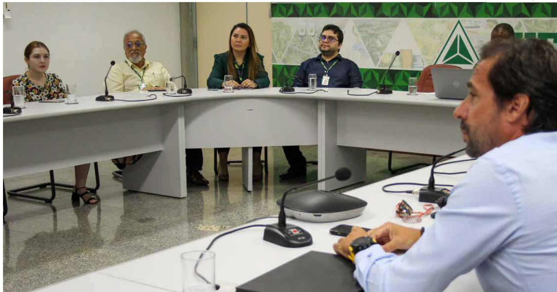
A Zona Franca angolana tem expectativas da criação de 21 mil postos de trabalho