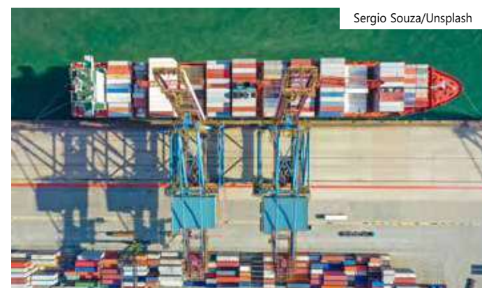
No mês, o superávit acumulado é de US$ 6,589 bi

rávit acumulado é de US$ 6,589 bilhões e no ano, de US$ 60,144 bilhões. Até a terceira semana do mês, a média diária das exportações registrou aumento de 5,9% na comparação com igual período de 2022, com alta de US$ 43,95 milhões (15,2%) em Agropecuária; crescimento de US$ 39,93 milhões (13,1%) em Indústria Extrativa; e queda de US$ 9,73 milhões (-1,3%) em produtos da Indústria de Transformação.