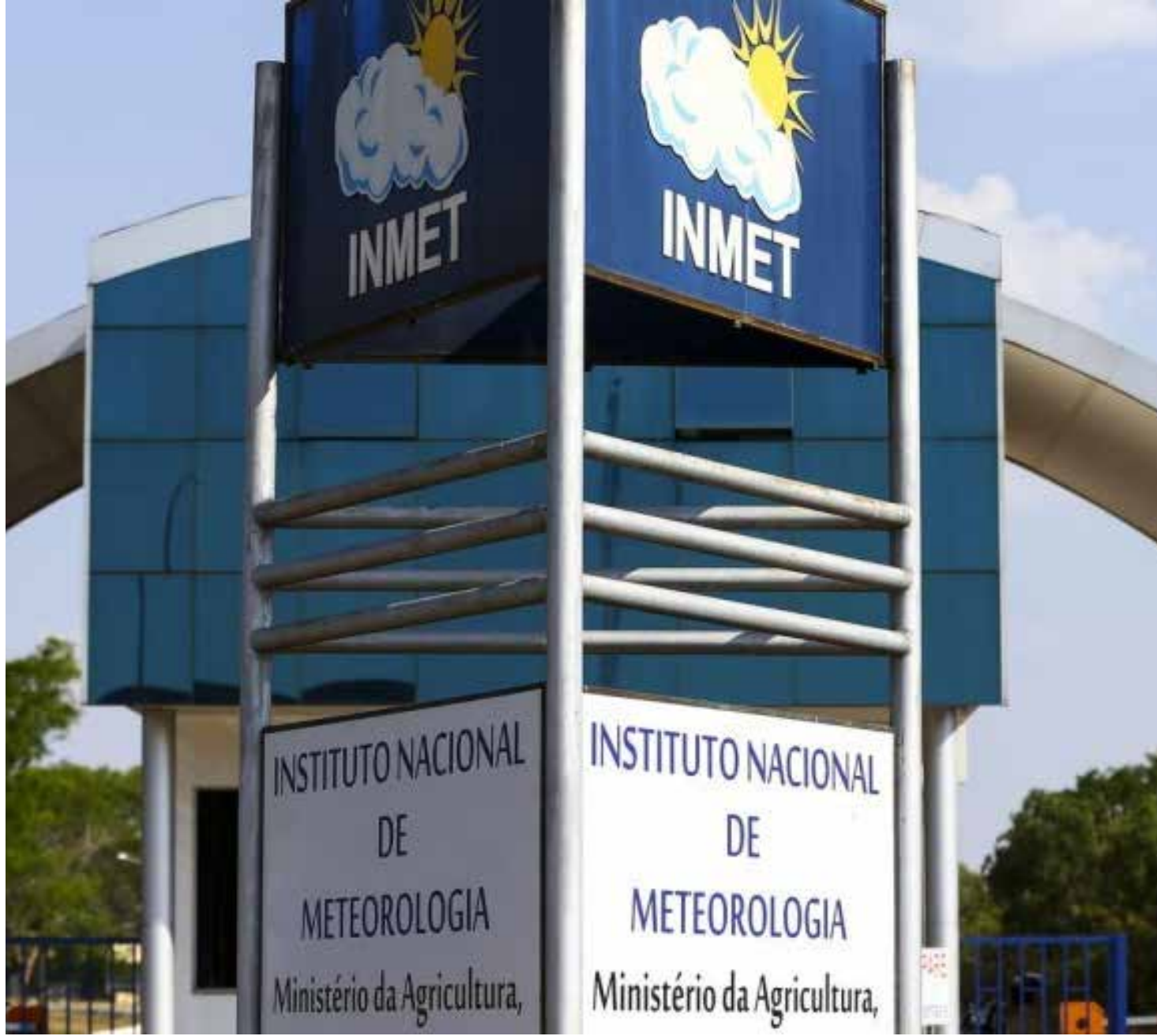
A previsão do tempo do Inmet aponta também que os maiores acumulados de chuvas cairão no noroeste do país

A Região Sudeste também terá tempo seco e sem chuvas, principalmente, em áreas do oeste de São Paulo, Triângulo Mi-