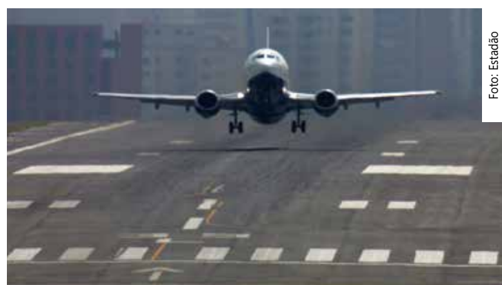
Programa deve beneficiar inicialmente aposentados e pensionistas

De acordo com a 123 Milhas, os valores já pagos pelos clientes serão devolvidos em vouchers para compra na plataforma. A Secretaria Nacional de Defesa do Consumidor (Senacon) notificou a empresa para que ela preste esclarecimentos. Segundo a secretária, a empresa deve garantir reembolso que não cause prejuízo aos consumidores e a opção por voucher não deve ser impositiva.