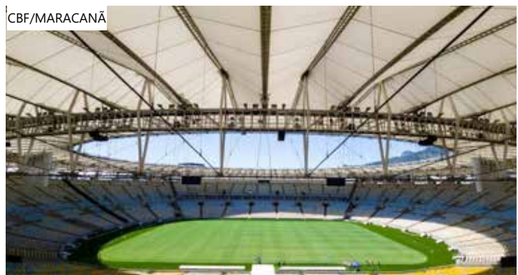
Administração alega que gramado precisa de recuperação

"Diante disso, tendo em vista que os danos causados não podem ser recuperados sem uma paralisação, após o dia 26/08/2023 promovemos a interrupção das atividades do estádio para viabilizar a plena recuperação do gramado", disse a nota da administração do estádio.