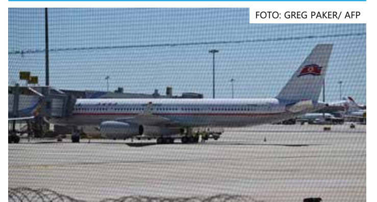
Avião da Coreia do Norte em Pequim

russo voaram para Pyongyang. Na semana passada, ônibus transportando atletas norte-coreanos para um torneio de taekwondo no Cazaquistão cruzaram a fronteira com a China. Imagens da agência de notícias sul-coreana Yonhap mostram pessoas em fila realizando o check-in para o voo de retorno de Pequim a Pyongyang, com grandes montes de caixas empacotadas e bagagens.