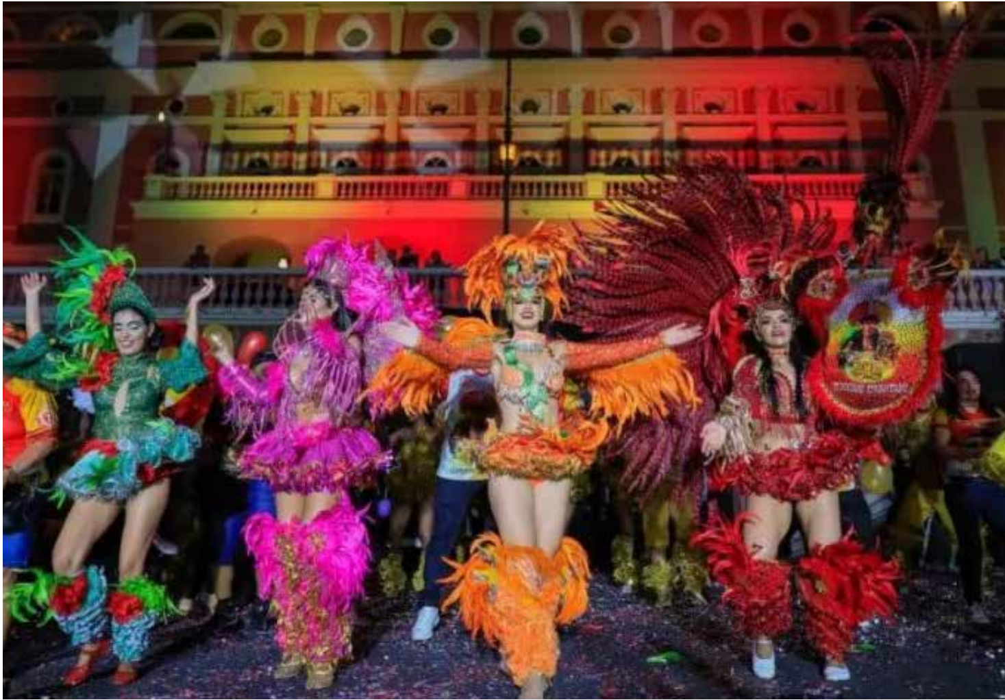
Cirandas de Manacapuru se apresentam em Manaus em prévia do Festival

Para assegurar o sucesso da 25ª edição, o secretário pon-