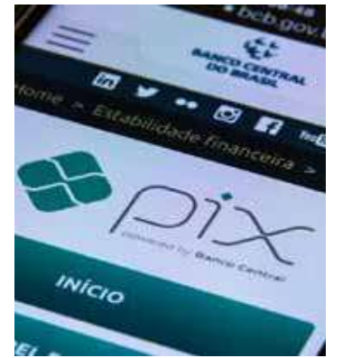
Vazamentos ocorreu no Pix