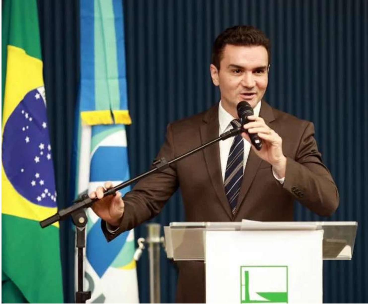
O Ministro do Turismo Celso Sabino

"Se o modelo de negócio é seguro, possui eficiência, eficácia e é um modelo que vai ajudar a desenvolver o turismo no Brasil, ótimo. Nesse caso específico, dessa companhia, vamos identificar quem são os culpados e não penalizaremos os consumidores. Ou, a segunda conclusão poderá ser: 'esse modelo de negócio