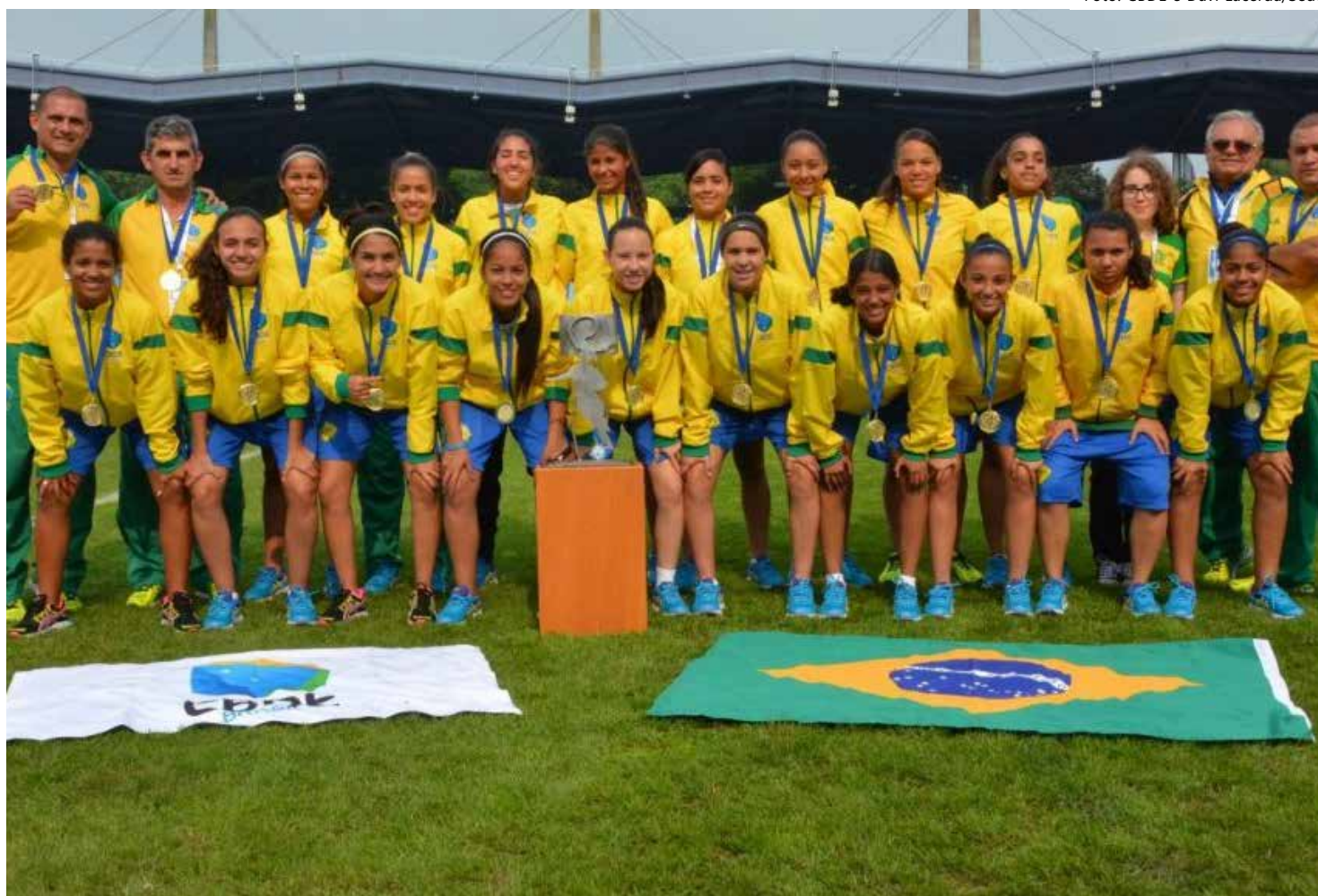
Na edição 2023 da Gymnasiade, delegação brasileira é recordista em número de participantes

No Wrestling Estilo Livre Feminino os amazonenses selecionados são Jennifer