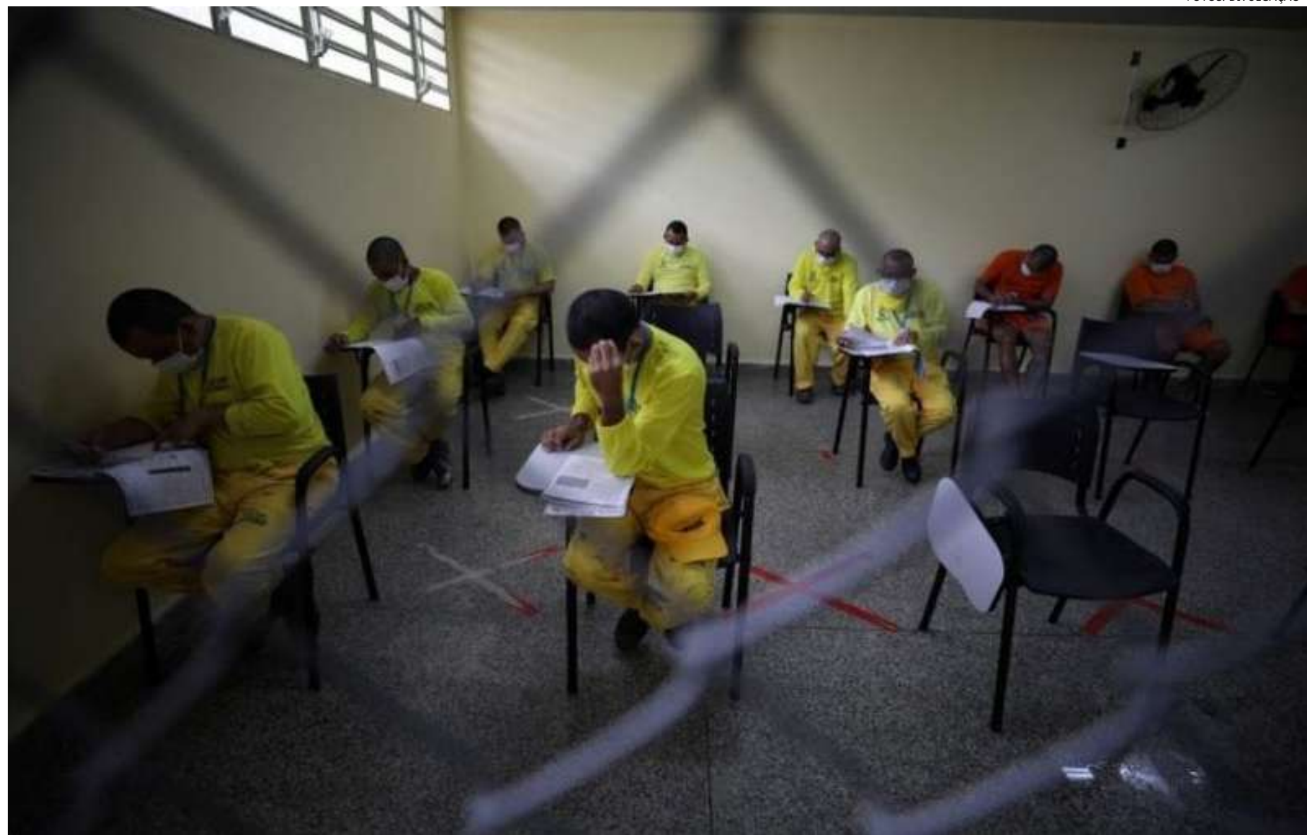
Exame também atende as Pessoas Privadas de Liberdade (PPL's), contribuindo para a reintegração pós-cárcere

“O acesso à educação é um direito de todos, inclusive aqueles que, no