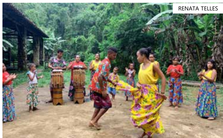
Em todo o Brasil há várias comunidades quilombolas reconhecidas

Até esta terça-feira, em todo o país, já foram emitidas 2.951 certidões para 3.619 comunidades. Segundo os dados revelados pelo Censo 2022, 1.327.802 pessoas se reconhecem quilombolas, o que representa 0,65% da população brasileira, presente em 1.696 municípios.