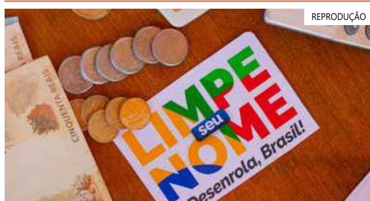
O prazo para os credores se inscreverem começou na segunda-feira (28)

Nesta etapa do Desenrola, o rol de credores é mais amplo, incluindo varejistas e companhias de serviços públicos, além dos bancos que já estão participando da fase 2, em que mais de R$ 10 bilhões em dívidas já foram renegociadas. As operações na Fase 3 serão garantidas com o montante de R$ 8 bilhões do Fundo Garantidor de Operações (FGO).