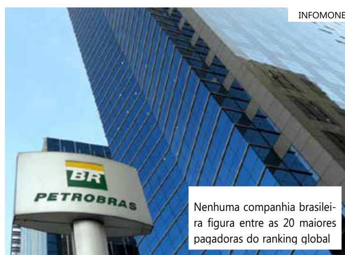
NENHUMA COMPANHIA BRASILEIRA FIGURA ENTRE AS 20 MAIORES PAGADORAS DO RANKING GLOBAL

Os dividendos brasileiros foram novamente na contramão do mundo. A Janus Henderson destaca que os proventos globais cresceram 4,9%, alcançando um novo recorde de US$ 568,1 bilhões, impulsionados por bancos e fabricantes de veículos. A nível subjacente, a alta foi de 6,3%.