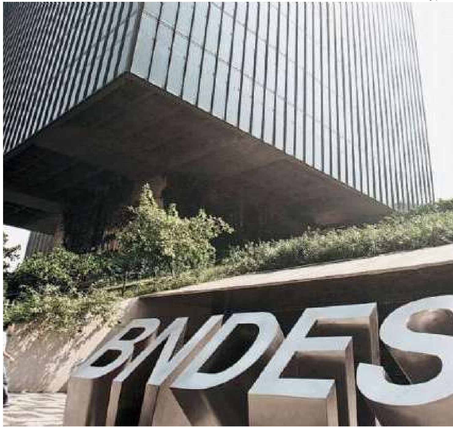
Mercadante citou a necessidade de ajuda para produtoras de filmes e salas de distribuição

cessidade de ajuda para produtoras de filmes e salas de distribuição que fizeram empréstimos com o BNDES e enfrentaram dificuldades durante a pandemia de covid-19. "Temos um passivo financeiro para negociar.