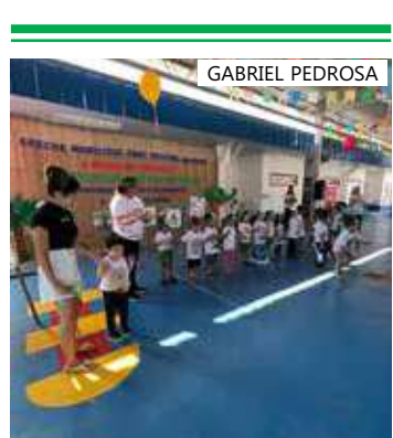
Evento ocorreu na quarta-feira (30), reunindo pais e familiares de alunos

“Este ano usamos histórias relacionadas ao meio ambiente, como ‘A Cigarra e a Formiga’ e a ‘A Metamorfose do Sapo e da Borboleta’, além dos trabalhos feitos com sucata. Semanas antes da feira acontecer, as professoras explicam [os temas] para os alunos, e eles então passeiam pela creche, procurando material para fazer o seu estudo. [É importante] que os pais também trabalhem isso junto com eles. Por isso, pra gente, é importante que essa convivência entre famílias