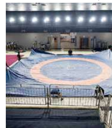
Arenas para Jogos da Juventude estão sendo montadas