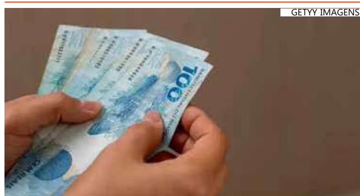
MAIORIA DOS BENEFICIADOS NÃO INTEGRAM NENHUM GRUPO DE PRIORIDADE

O pagamento da restituição é feito diretamente na conta bancária informada pelo contribuinte na declaração, de forma direta ou por indicação de chave Pix CPF. Se o crédito não for realizado, os valores ficarão disponíveis para resgate por até um ano no Banco do Brasil.