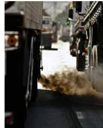
Economia limpa em pauta no DF