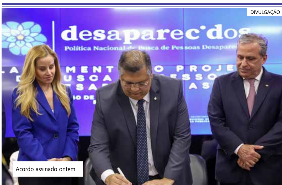
Acordo assinado ontem

feira, em Brasília, pelo Ministério da Justiça e Segurança Pública e marca o Dia Internacional das Pessoas Desaparecidas, 30 de agosto.