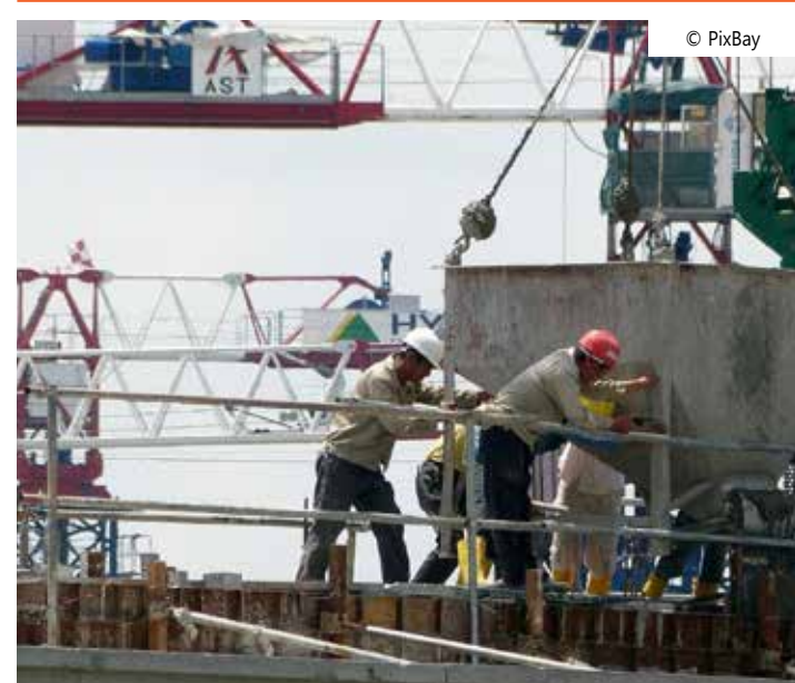
O montante diz respeito a todos os tipos de instrumentos de crédito

CRIs) - cresceram nos últimos anos como boas opções de investimento na carteira dos brasileiros. Com isso, eles já superaram em termos nominais e relativos a poupança, que é historicamente a principal origem dos empréstimos para a compra e a construção de imóveis no Brasil.