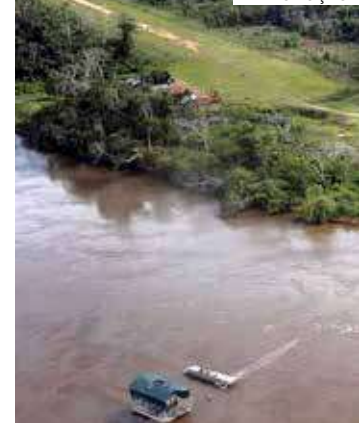
Dinheiro na conta do Brasil