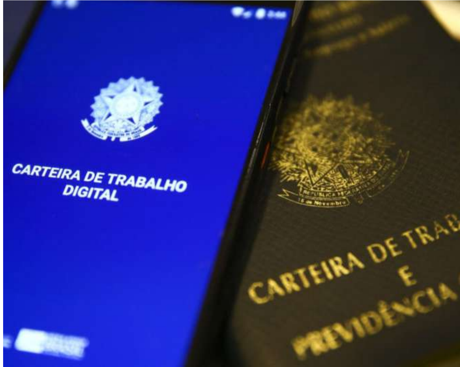
A desaceleração é nítida, de acordo com os dados oficiais do Ministério do Trabalho

A análise da XP Investimentos, em suma, é que a tendência de desaceleração gradual do emprego formal brasileiro continua. "O balanço acumulado de 12 meses mostrou saldo de 1,567 milhão de ocupações em julho, ante 1,649 milhão em junho. Continuamos a antecipar uma criação líquida total de 1,350 milhão de