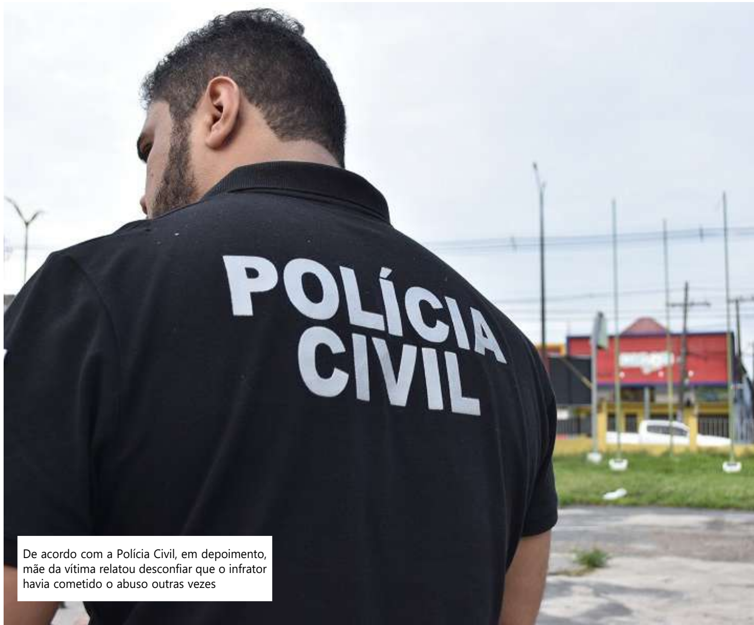
De acordo com a Polícia Civil, em depoimento, mãe da vítima relatou desconfiar que o infrator havia cometido o abuso outras vezes