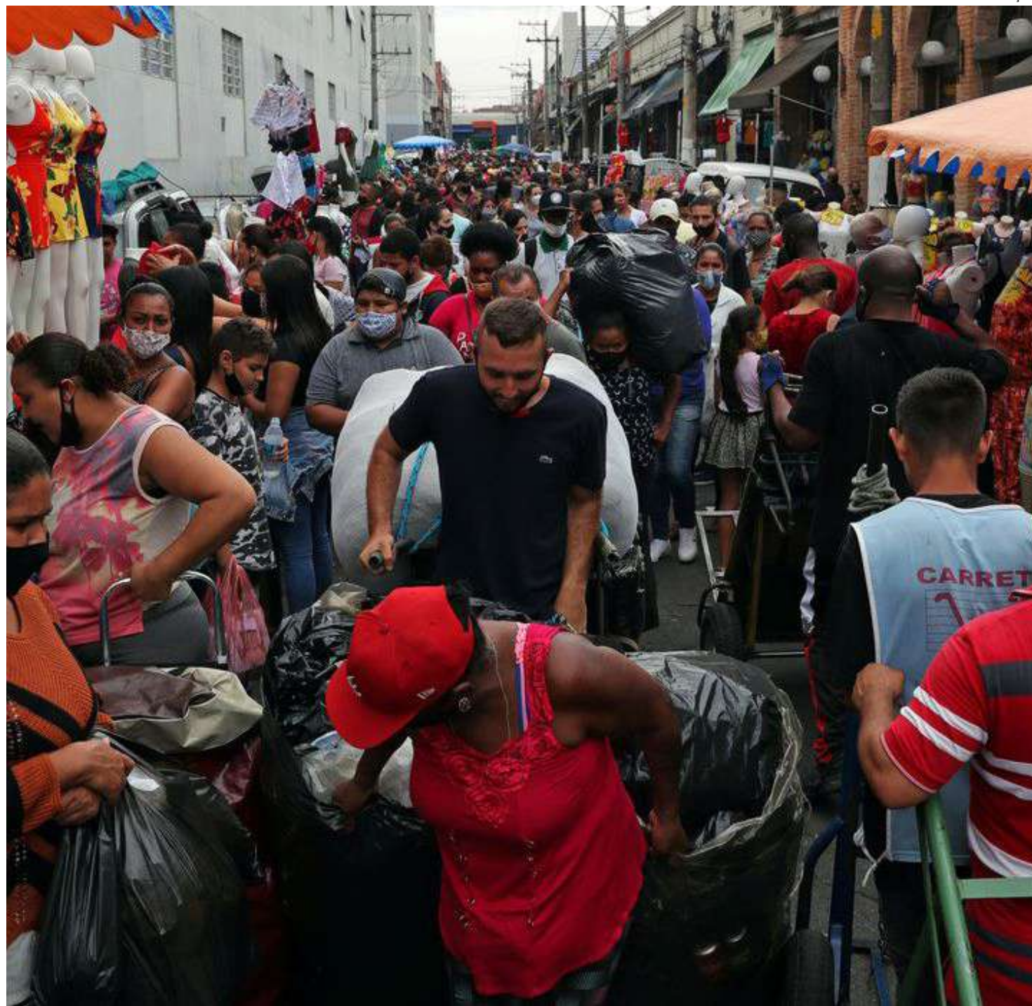
O dinheiro acaba e o mês continua, essa tem sido a realidade de muitos brasileiros

Quando questionadas sobre terem sofrido assédio, 40% das mulheres responderam positivamente e que ocorreu em ruas e espaços públicos, transporte público, ambiente de trabalho, bares e casas noturnas, transporte particular e ambiente fami-