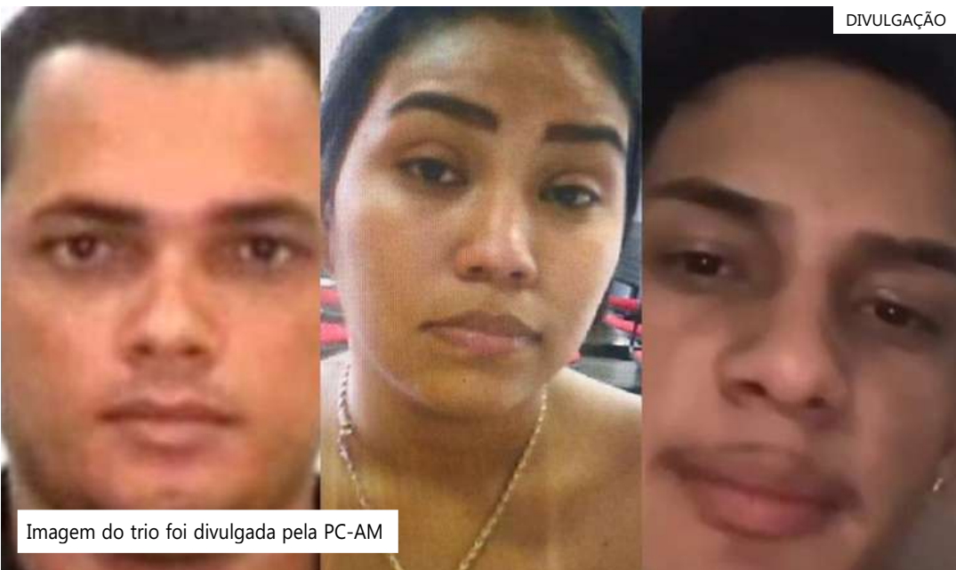
Imagem do trio foi divulgada pela PC-AM

98503-8913, disque-denúncia do 1º DIP, ou pelo 181, da Secretaria de Estado de Segurança Pública (SSP-AM). "A identidade do informante será mantida em sigilo", garantiu Cícero.