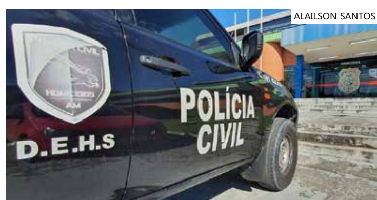
Polícia Civil investiga a motivação do crime

A Delegacia Especializada em Homicídios e Sequestros (DEHS) investiga a motivação do crime, que permanece desconhecida, assim como o paradeiro dos criminosos.