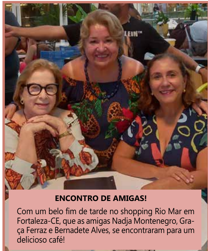
ENCONTRO DE AMIGAS!