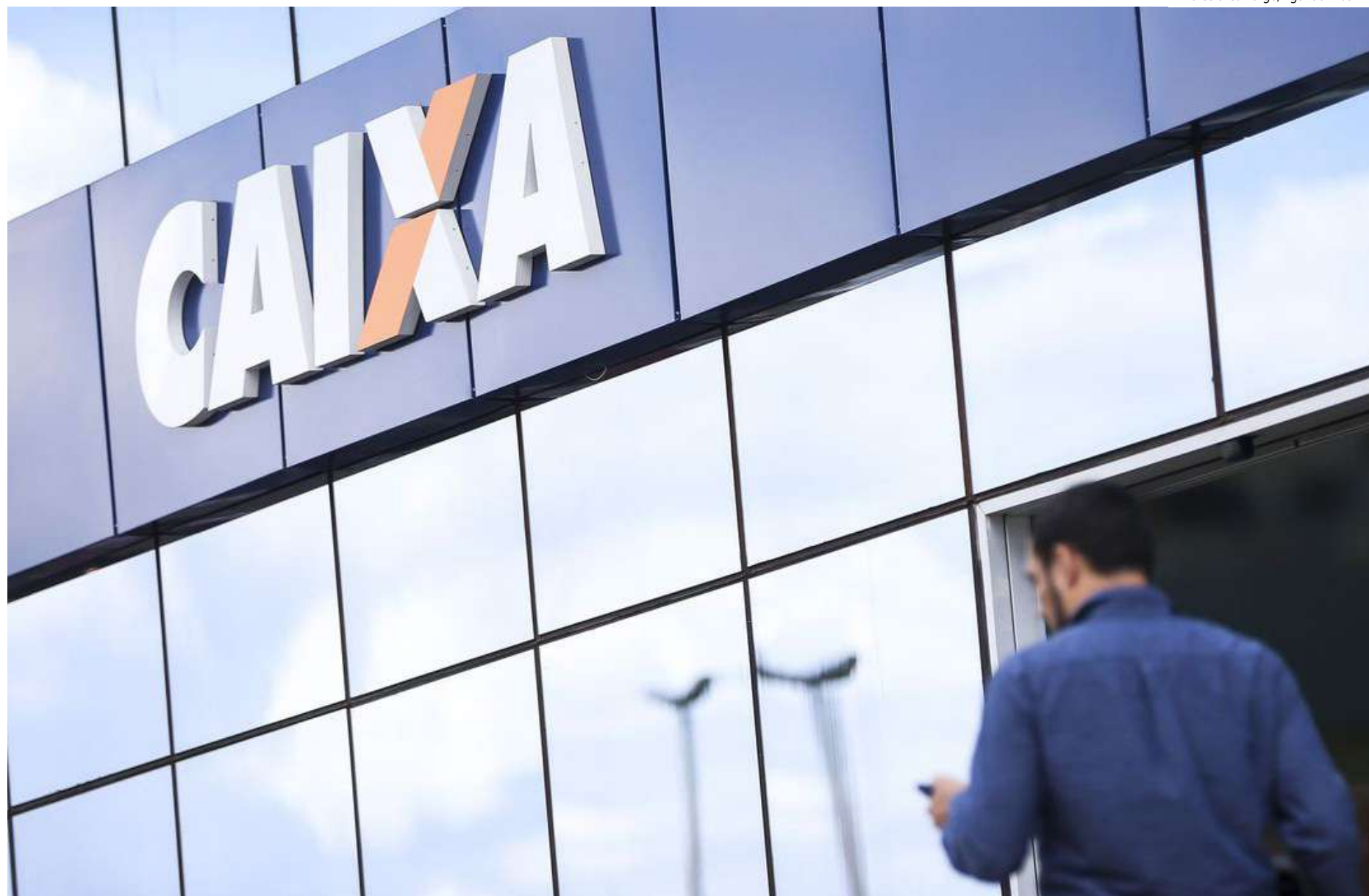
Com valor mínimo de R$ 100 mil, os empréstimos terão juros a partir de 0,69% ao mês

Alinha de crédito reaberta terá condições diferentes do SIM Digital, programa de microcrédito criado em março de 2022 que emprestava de R$ 300 a R$ 1 mil com juros baixos, inclusive