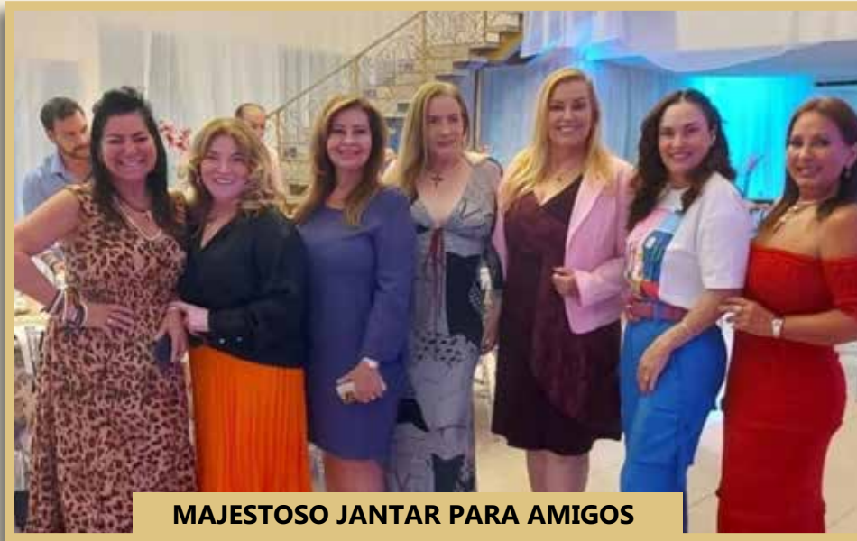
MAJESTOSO JANTAR PARA AMIGOS