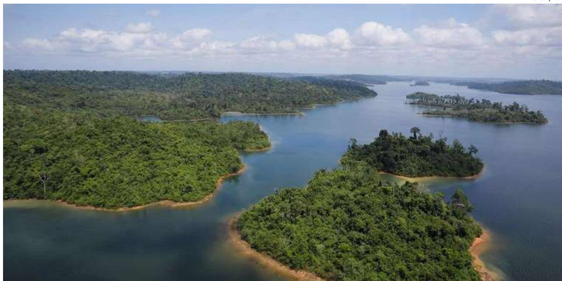
Mais de 36% dos ativistas assassinados no mundo, em 2022, eram de origem indígena

A Amazônia tem quase 6,9 milhões de quilômetros quadrados e abrange oito países da América do Sul. Segundo Bianchini, ao atuarem contra a pressão agropecuária, desmata-