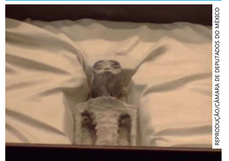
Supostos corpos de extraterrestres foram exibidos no Congresso do México

algo em torno de mil anos de idade. O ufólogo afirma que os cadáveres não foram encontrados em naves, mas sim sepultados. Segundo ele, o local do sepultamento foi fundamental para a preservação dos corpos, que permaneceram íntegros e dissecados.