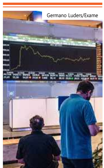
O Ibovespa fechou em alta de 0,18%

ceiros ao redor do mundo", completa, mencionando também o Coppom (Comitê de Política Monetária), que também se dá na próxima quarta. No entanto, a percepção do mercado foi que o aumento dos preços foi puxado majoritariamente pelos combustíveis e não deve mudar os planos do Federal Reserve.