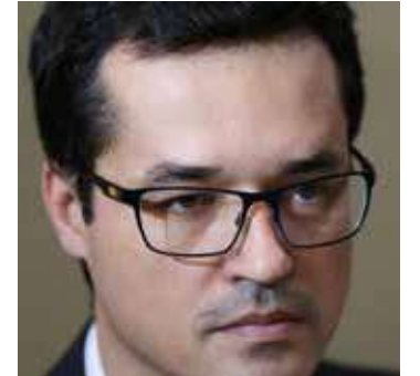
Deltan tentou reaver seu mandato através de recurso que foi negado