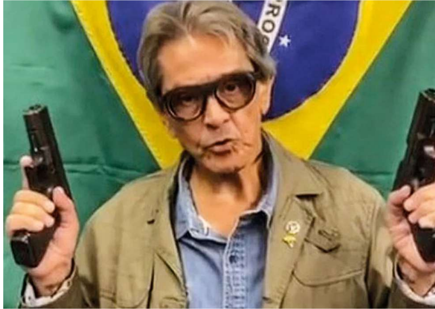
O ex-deputado federal Roberto Jefferson apresentou resistência antes de ser preso e quase matou quatro agentes da PF

"Por sua vez, indicativos suficientes de autoria emergem da situação de flagrância, confirmada pelos depoimentos dos policiais federais em juízo, além da