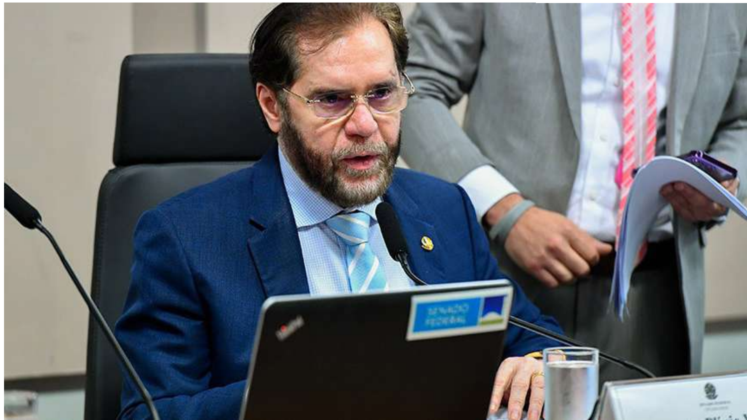
O senador pelo Amazonas Plínio Valério é presidente da CPI das ONGs