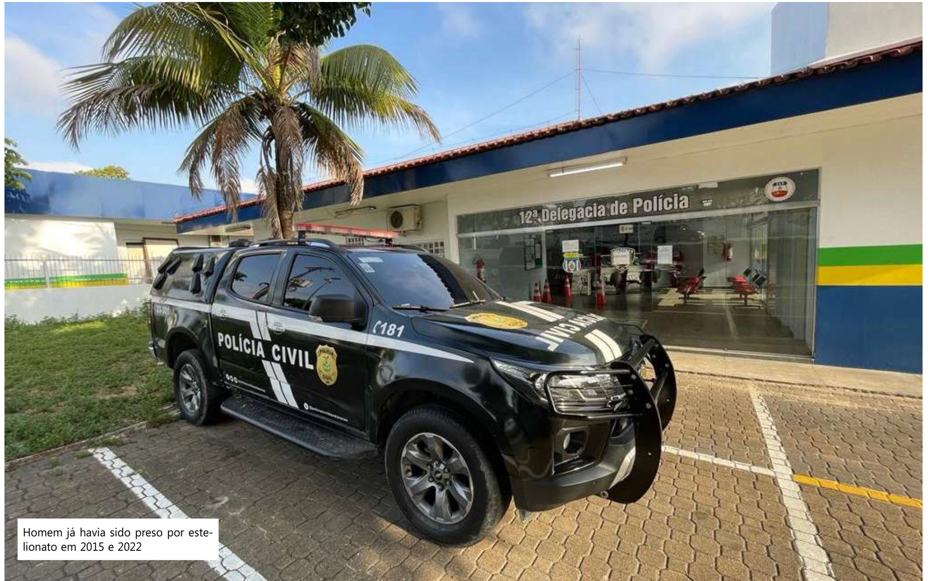
Homem já havia sido preso por estelionato em 2015 e 2022

“Em outras situações, o indivíduo chegou a prestar o serviço oferecido, mas não o divulgava na radiodifusão. Além disso, após ganhar a confiança dos