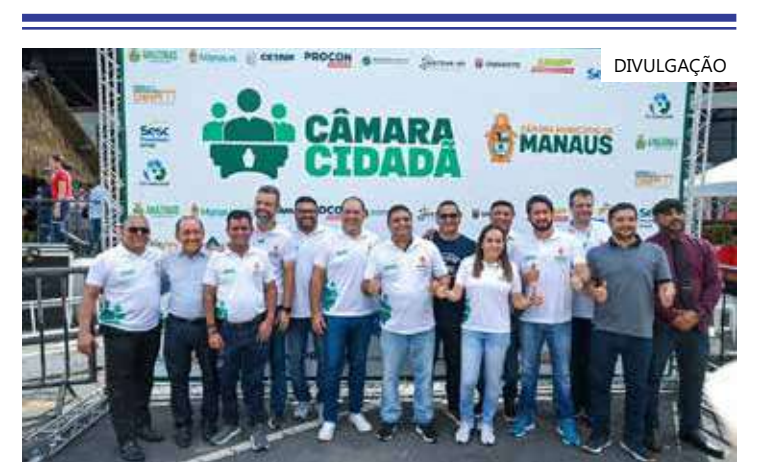
Vereadores da 18ª legislatura visitaram o local onde serviços serão prestados

Em parceria com a Câmara Municipal, a Prefeitura de Manaus levará para a Câmara Cidadã atividades da Secretaria Municipal de Meio Ambiente e Sustentabilidade (Semmas), Secretaria Municipal de Saúde (Sema), Secretaria Municipal da Mulher, Assistência Social e da Cidadania (Semasc), Secretaria Municipal do Trabalho, Empreendedorismo e Inovação (Semtepi), Sindicato das Empresas de Transportes de Passageiros (Sinetrans) e do Conselho Tutelar.