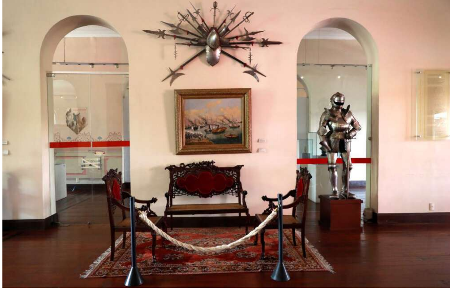
Museus de Manaus terão extensa programação

Nesta edição, a programação virá com a temática