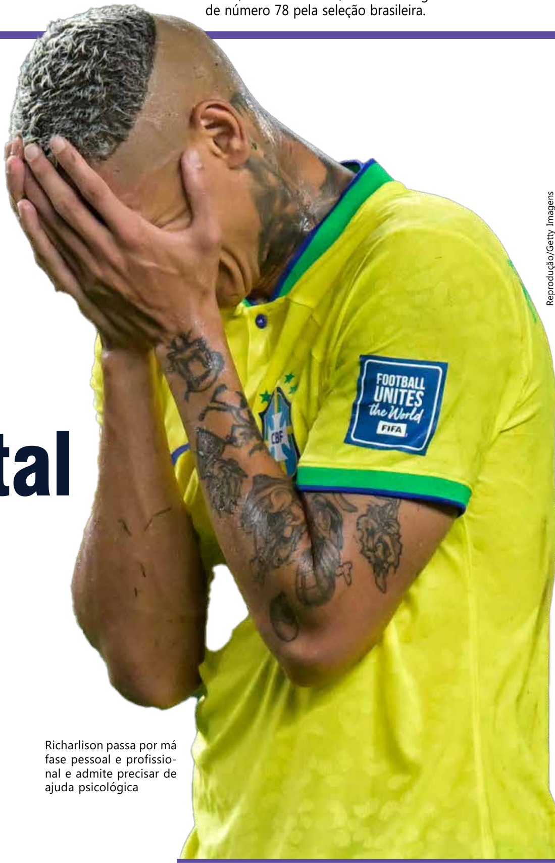
Richarlison passa por má fase pessoal e profissional e admite precisar de ajuda psicológica

"Vou voltar para a Inglaterra, buscar ajuda psicológica para trabalhar a mente. É isso, voltar mais forte. É pegar uma sequência boa no Tottenham, essa semana vou sentar e