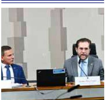
O presidente da CPI Plínio Valério (PSDB) e o relator Márcio Bittar (UB)

Por iniciativa do relator da CPI, senador Márcio Bittar (União-AC), o colegiado poderá aprovar na terça-feira a solicitação de informações sobre as relações do governo do Acre com a ONG SOS Amazônia. Bittar pede que o governador do Acre, Gladson Camelli, envie toda a documentação disponível sobre repasses de recursos do governo estadual à SOS Amazônia entre 2002 e 2022. Também pede cópias de todas as prestações de contas apresentadas pela SOS Ama-