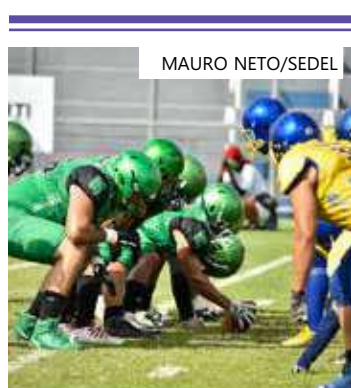
Manaus FA (de verde) encara o Remo Lions no domingo