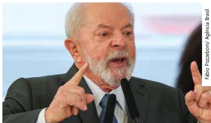
Este é o 8º compromisso internacional de Lula nesse mandato

lançamento de uma iniciativa global para promoção do trabalho decente, juntamente com o presidente dos Estados Unidos, Joe Biden. Ainda estão previstas outras reuniões bilaterais, multilaterais e ministeriais entre os países participantes e diversos organismos internacionais à margem da assembleia. O presidente viajará aos Estados Unidos acompanhado de ministros, que deverão participar de diversas reuniões temáticas nas áreas de direitos humanos, saúde e desarmamento.