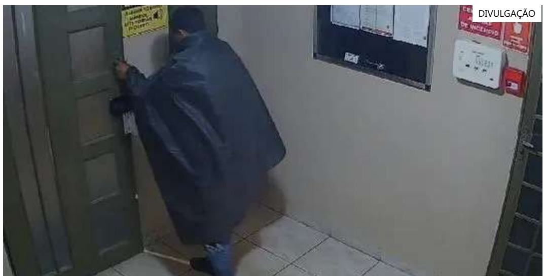
Homem tentou se disfarçar de saco de lixo para invadir condomínio

Em nota, a Polícia Civil de Minas Gerais (PCMG) informou que está ciente dos furtos recorrentes em Uberlândia na última quinzena dentro de condomínios da região.