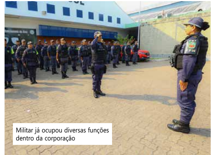
Militar já ocupou diversas funções dentro da corporação