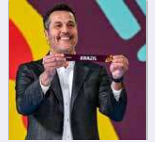
Ex-goleiro Júlio César participando do sorteio