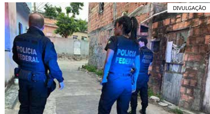
Criminoso se passava por criança para gravar conteúdos sexuais

Segundo a PF, a operação "Cutia" também relaciona-se a conduta criminosa "Sextortion", ou abuso por meio de extorsão sexual. O crime é relacionado a alguns tipos de extorsões, "praticadas com o uso de conteúdos de teor sexual, como fotos ou vídeos íntimos. Nesses casos, os criminosos chantageiam as vítimas afirmando ter algum material comprometedor sobre ela, ameaçando expô-las caso as suas exigências não sejam cumpridas", explica a polícia.