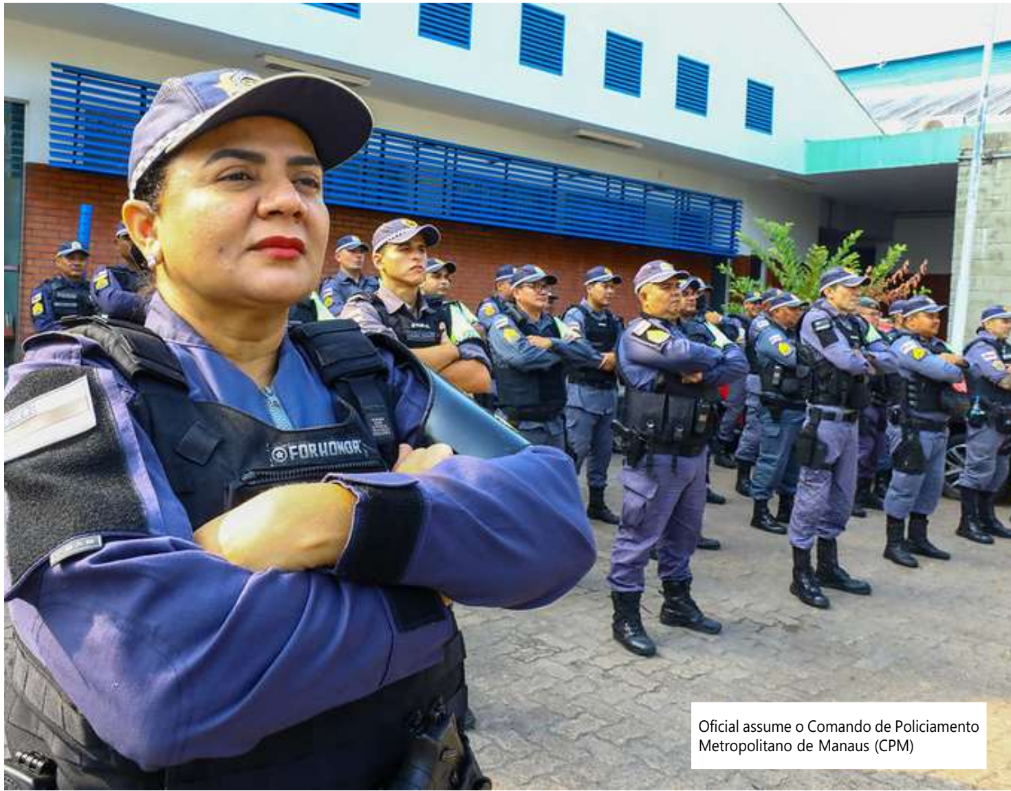
Oficial assume o Comando de Policiamento Metropolitano de Manaus (CPM)