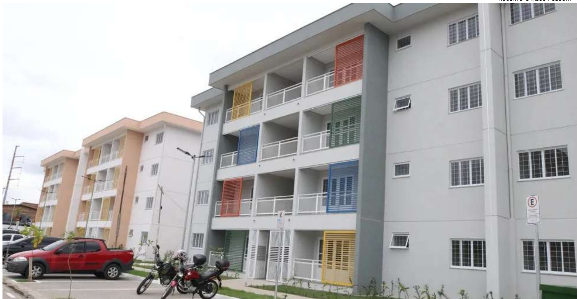
Apartamentos do Prosamim Manaus