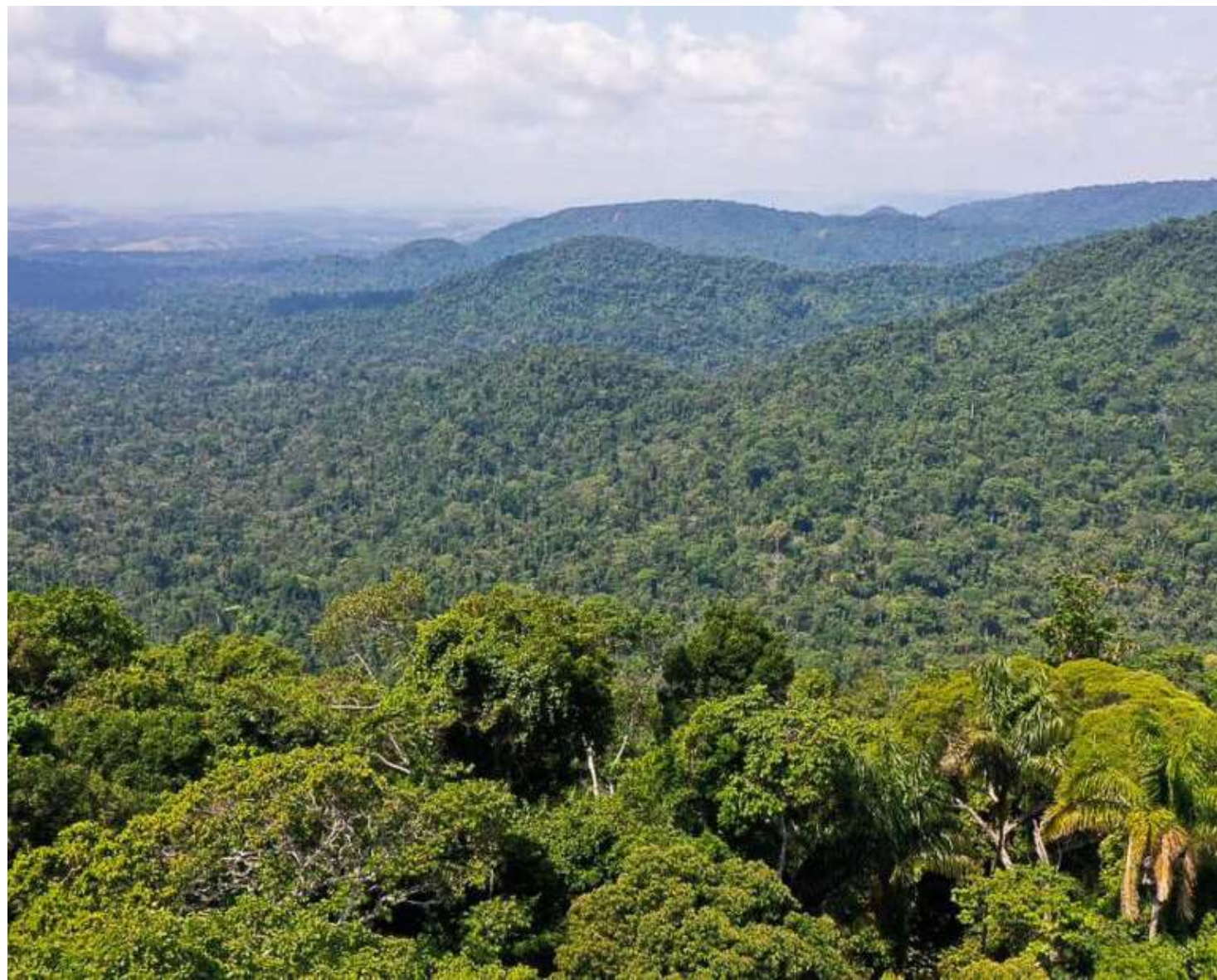
Floresta Nacional de Carajás e visita à mineradora Vale

No entanto, 79,72% não analisaram os impactos da cadeia de fornecimento em relação ao envolvimento com o desmatamento na Amazônia. A pesquisa mostra ainda que 64,63% das companhias não incluem nos contratos com fornecedores cláusulas