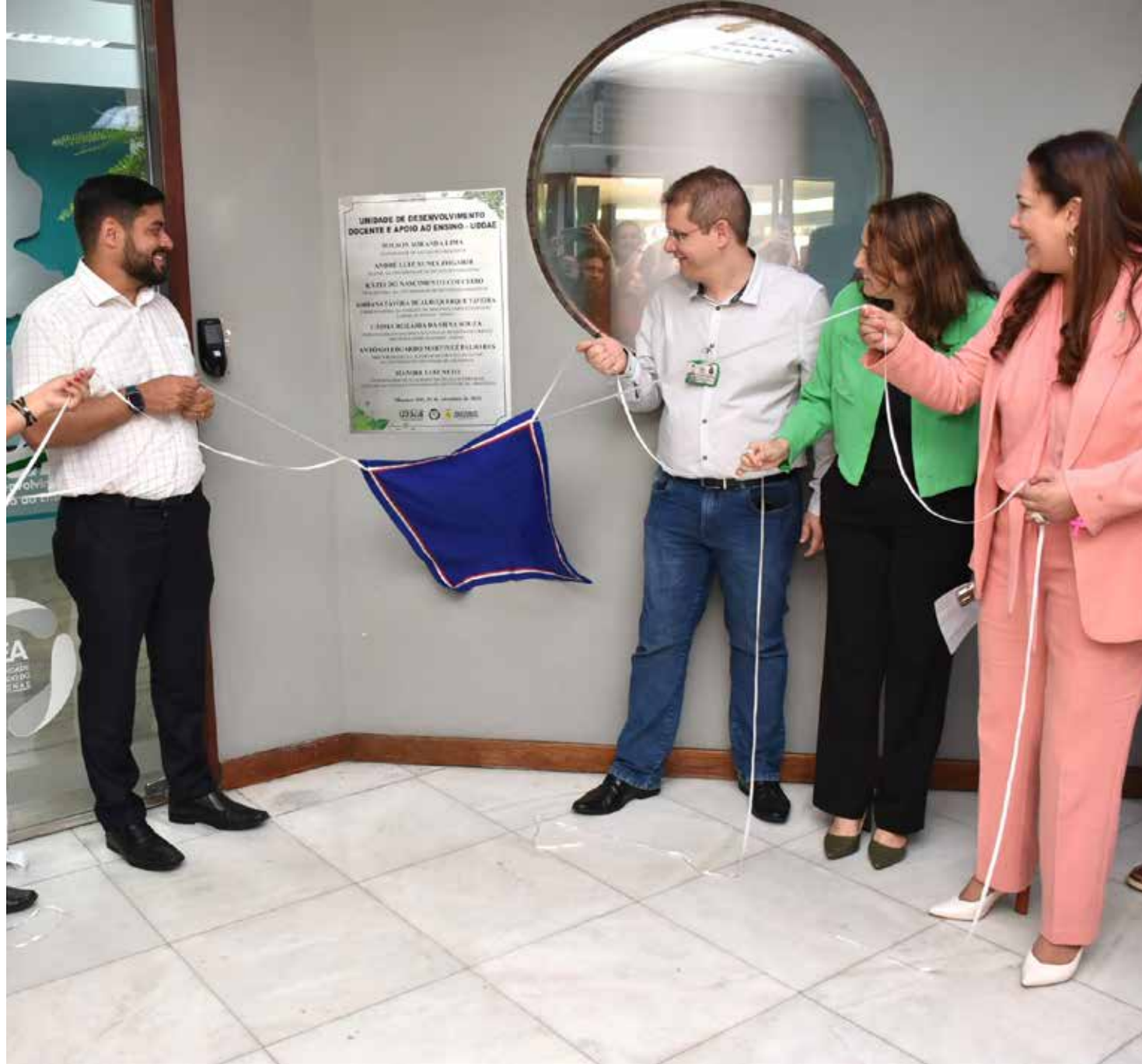
O espaço foi inaugurado no fim da tarde de sexta-feira (15)

Segundo o reitor da UEA, André Zogahib, a unidade recém-inaugurada cumprirá um papel importante no incentivo à pesquisa, realização de trabalhos coletivos e a implementação de políticas de saúde. "É com muita satisfação que a UEA inaugura esse espaço de usufruto de toda a Escola de Saúde. Mas também é um projeto piloto que queremos implantar nas outras