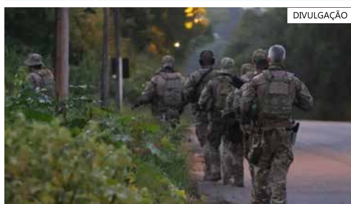
Na operação, um agente da PF e outro da Polícia Civil ficaram feridos

pital Geral do Estado, após ser atingido no rosto por estilhaços de um disparo. Ele será submetido a uma cirurgia em um dos olhos. A PF também se manifestou sobre a morte do agente. Em nota, a Direção-Geral da PF lamentou com "profundo pesar" o falecimento de Lucas Caribé Monteiro, que ingressou na força policial em 2013. O diretor-geral substituto da Polícia Federal, Gustavo Paulo Leite de Souza, decretou luto oficial de três dias.