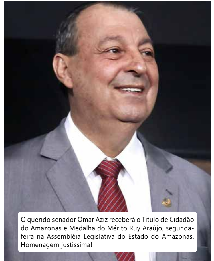
O querido senador Omar Aziz receberá o Título de Cidadão do Amazonas e Medalha do Mérito Ruy Araújo, segunda-feira na Assembléia Legislativa do Estado do Amazonas. Homenagem justíssima!