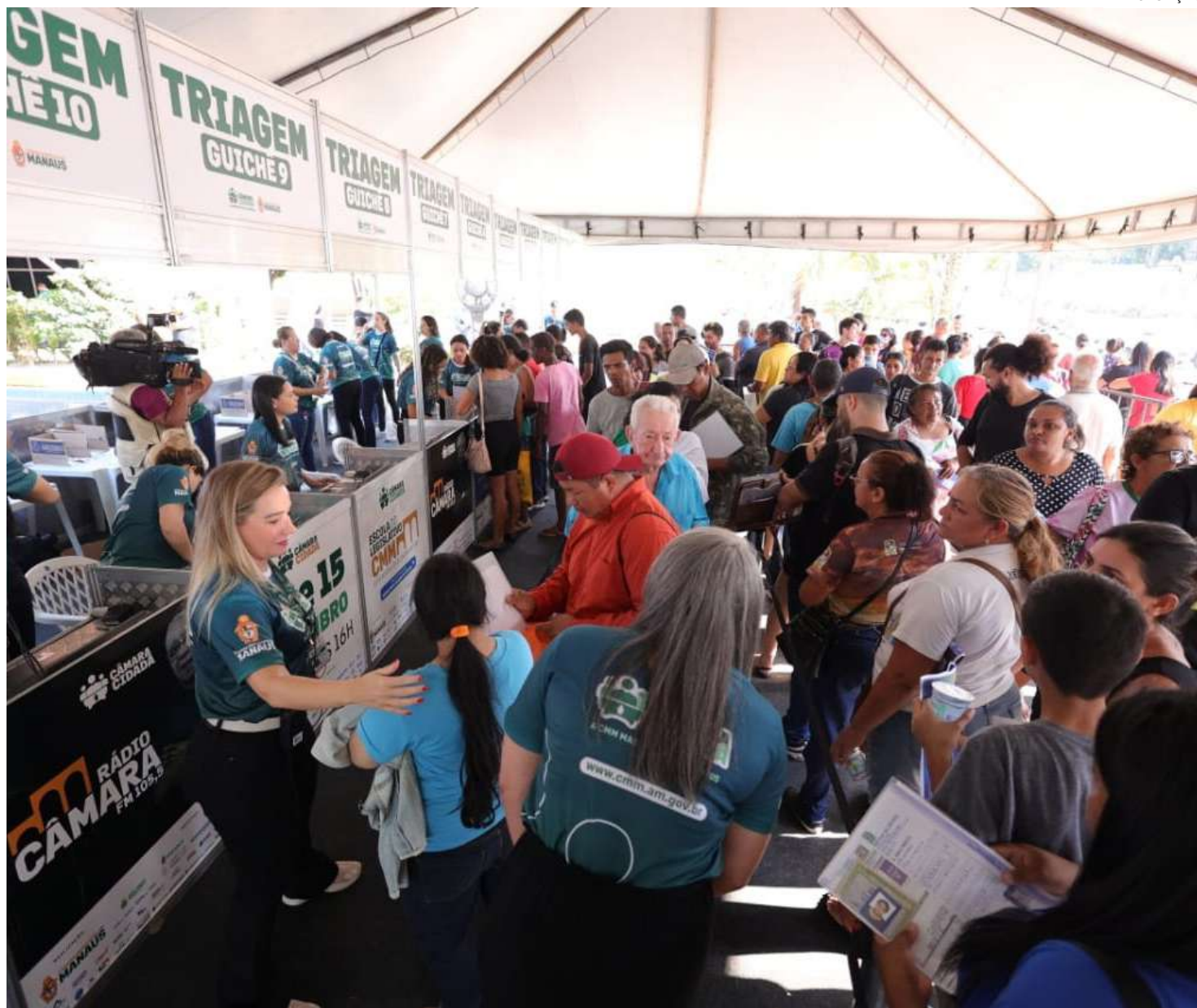
Evento aconteceu durante dois dias no Centro de Convivência da Família Padre Pedro Vignola

Nesta edição, mais de 140 serviços gratuitos foram disponibilizados na quinta e sexta-feira (14 e 15/09). Novidade na programação, atividades esportivas e de lazer como, aulas de dança e treinamento funcional também foram realizadas ao longo dos dois dias de atendimentos. As ações foram feitas em parceria com o projeto "Mais Vida", do Governo do Estado.