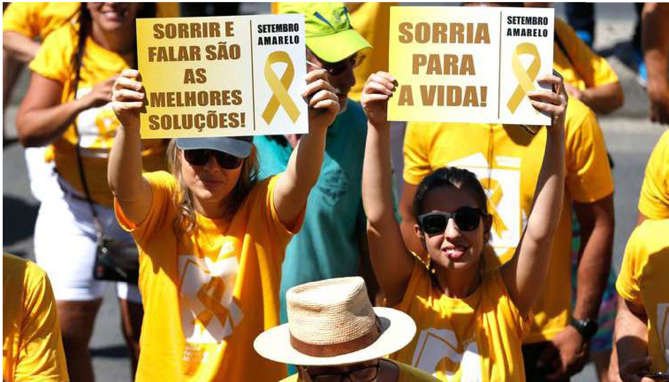
Simpósio promove discussão formativa e informativa sobre o tema

Encontro promove palestras e mesa redonda para debater prevenção ao suicídio com a comunidade acadêmica