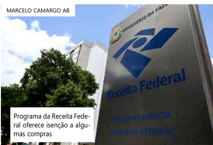
MARCELO CAMARGO AB

O Remessa Conforme permite que a Receita Federal tenha à disposição, de forma antecipada, as informações necessárias para a aplicação do gerenciamento de risco das remessas internacionais, tendo mais tempo para definir as mercadorias escolhidas para fiscalização. As remessas são entregues mais rapidamente, com queda dos custos das atividades de deslocamento e armazenamento, o que traz ganhos aos operadores logísticos.