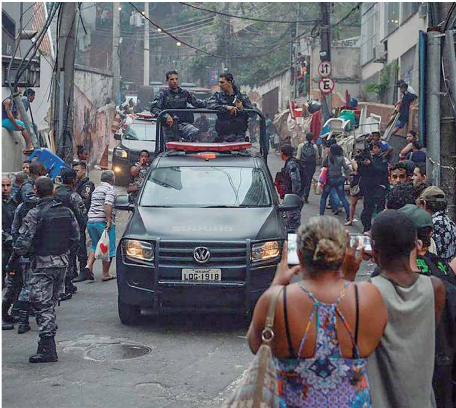
Ações policiais nas favelas do Rio de Janeiro

As ações policiais nas favelas do Rio de Janeiro causam um prejuízo de pelo menos R$ 14 milhões por ano aos moradores dessas comunidades. Eles relatam que, com as ações, ficam muitas vezes impedidos de ir ao trabalho ou precisam fechar os comércios locais, além de terem os estabelecimentos e produtos danificados em trocas de tiros e interrupções de fornecimento de serviços essenciais como eletricidade e água. As informações são da pesquisa, inédita, Favelas na Mira do Tiro: Impacto da Guerra às Drogas na Economia dos Territórios, lançada nesta segunda-feira (18) pelo Centro de Estudos de Segurança e Cidadania (CESeC). "É muito dinheiro e é um dinheiro que faz falta. É o custo que essas pessoas estão pagando por uma guerra que elas não pediram para estar. É o custo causado por ações violentas e desordenadas do próprio Estado", disse a socióloga Rachel Machado, coordenadora de pesquisa do CESeC. A pesquisa foi feita com 400 moradores do Complexo da Penha e com 400 do Complexo de Manguinhos, ambos na zona norte da cidade. Os dois territórios foram os com maior incidência de tiroteios decorrentes de ações policiais entre junho de 2021 e maio de 2022, de acordo com dados do Instituto Fogo Cruzado, que reúne informações sobre violência