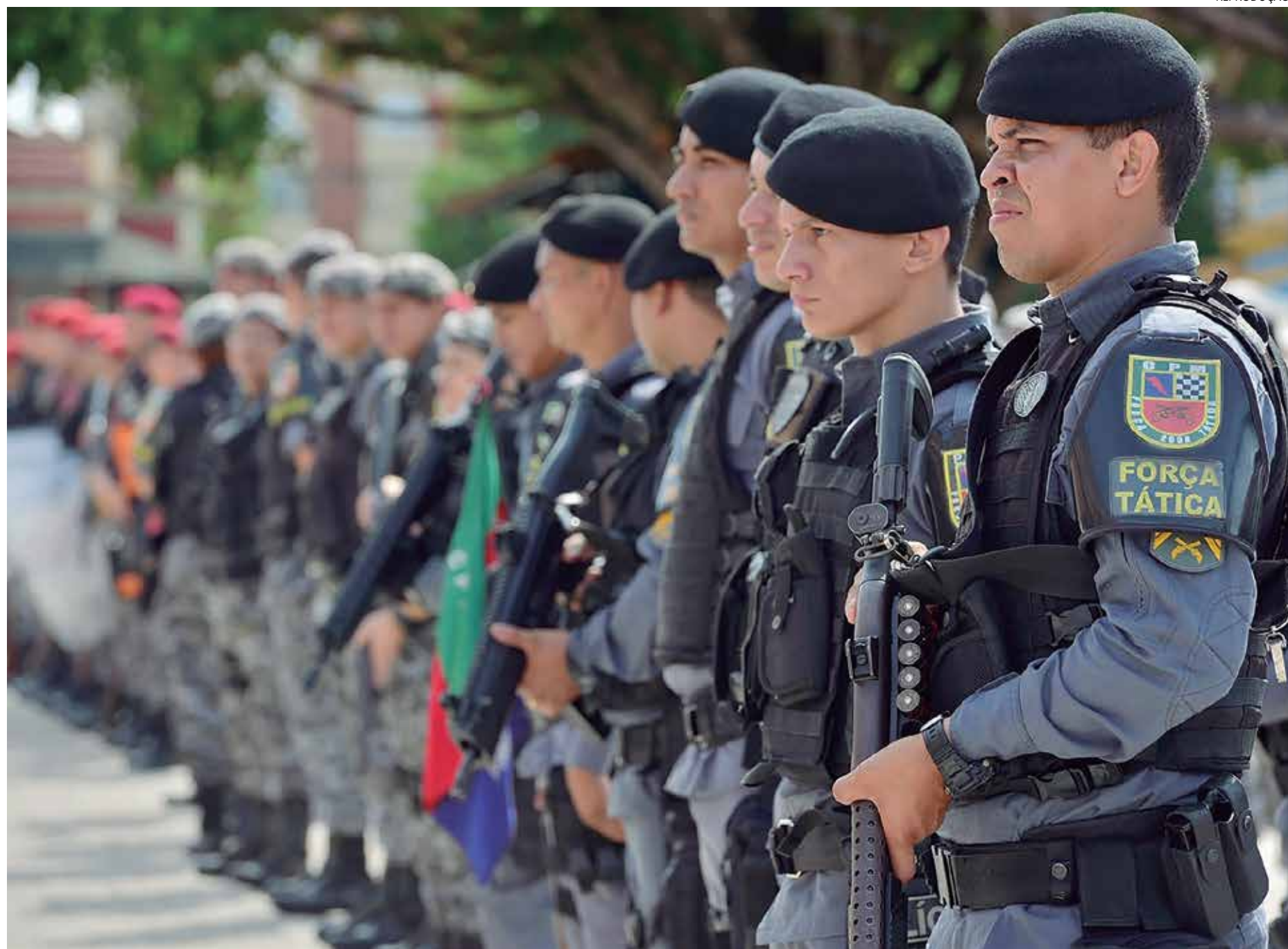
Ações policiais foram realizadas em Manaus e Iranduba

No bairro Cachoeirinha, situado na zona sul da cidade, policiais militares da 1ª Cicom prenderam um idoso, de 67 anos, após receberem a denúncia de que ele estaria "passando" a mão nas partes íntimas de uma criança de 11 anos de idade.