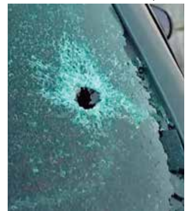
Menina de 3 anos foi baleada dentro de um carro em uma ação da PRF