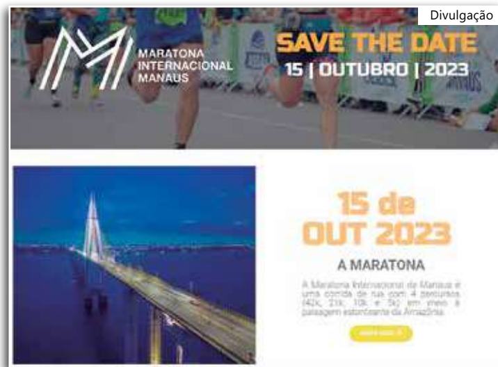
As inscrições estão abertas no site: maratonademanau.com.br

"A cada edição, mais corredores são atraídos para enfrentar esse desafio e se superar" - Aurilex Moreira, vice-presidente da FME