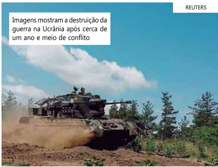
Imagens mostram a destruição da guerra na Ucrânia após cerca de um ano e meio de conflito

O governo ucraniano decidiu demitir seis vice-ministros da Defesa nesta segunda-feira (18), após a nomeação de um novo ministro da Defesa no início deste mês. O governo não deu nenhuma razão para as demissões. Entre os demitidos está Hanna Maliar, que frequentemente divulgava atualizações públicas sobre a guerra da Rússia contra a Ucrânia. Rustem Umerov foi nomeado ministro da Defesa há menos de duas semanas para substituir Oleksii Reznikov. O ministério foi alvo de alegações de corrupção na mídia enquanto Reznikov estava no cargo, embora ele próprio não tenha enfrentado nenhuma alegação de corrupção. "Reinicialização. Nós (já) começamos. Continuamos. O ministério continua trabalhando como de costume", disse Umerov