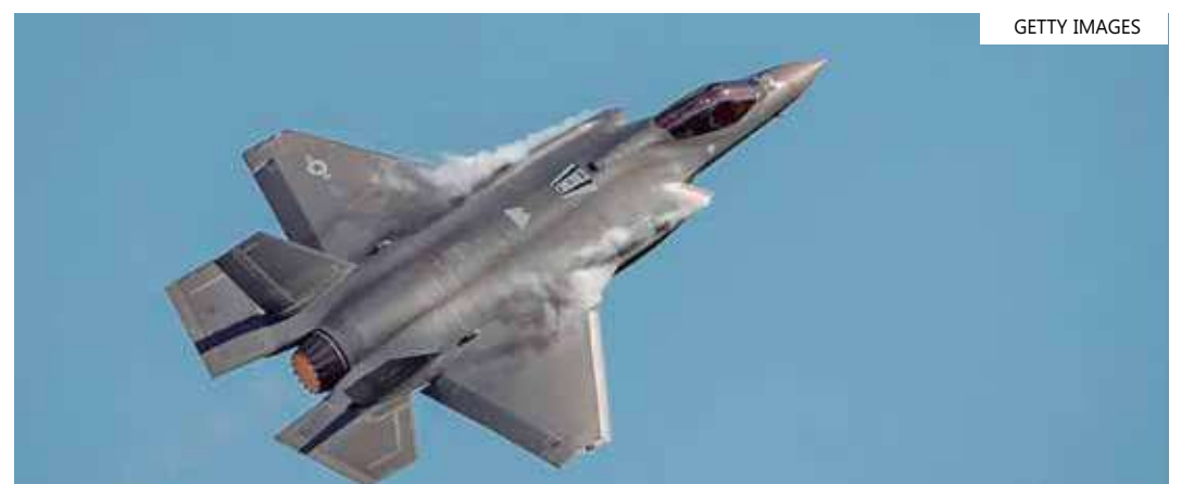
Jato desapareceu perto dos lagos Moultrie e Marion

O jato pertence ao Marine Fighter Attack Training Squadron 501, unidade focada no treinamento de pilotos para atender aos requisitos anuais de treinamento, segundo o site da unidade.