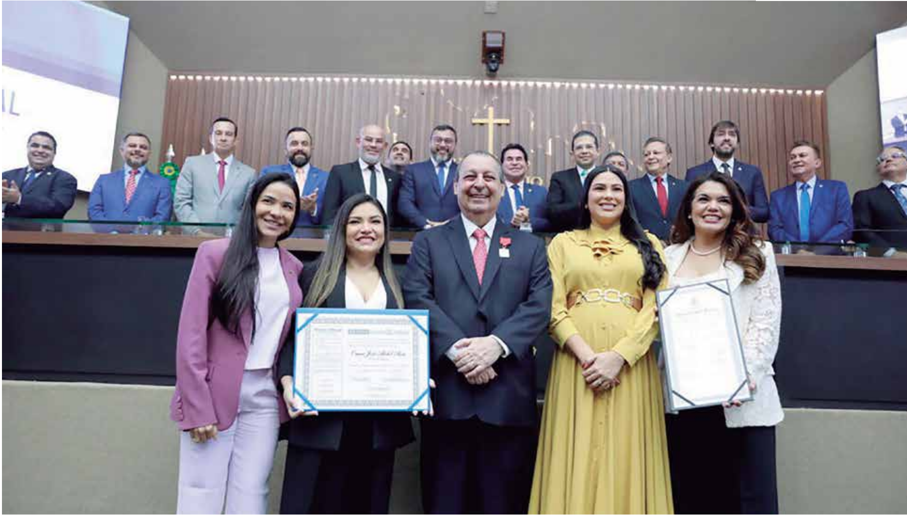
Omar Aziz ganhou oficialmente o título de Cidadão do Amazonas, na segunda-feira (18)