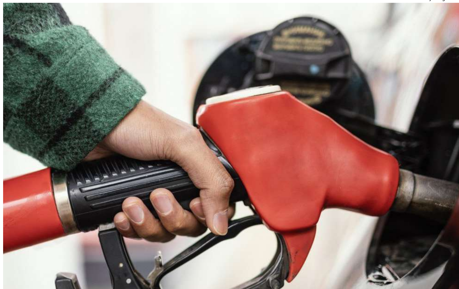
Indicador tinha mostrado deflação de 0,13% em agosto

IPA O Índice de Preços ao Produtor Amplo (IPA) variou 0,23% em setembro, ante