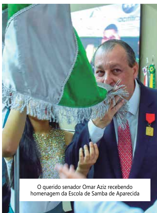
O querido senador Omar Aziz recebendo homenagem da Escola de Samba de Aparecida