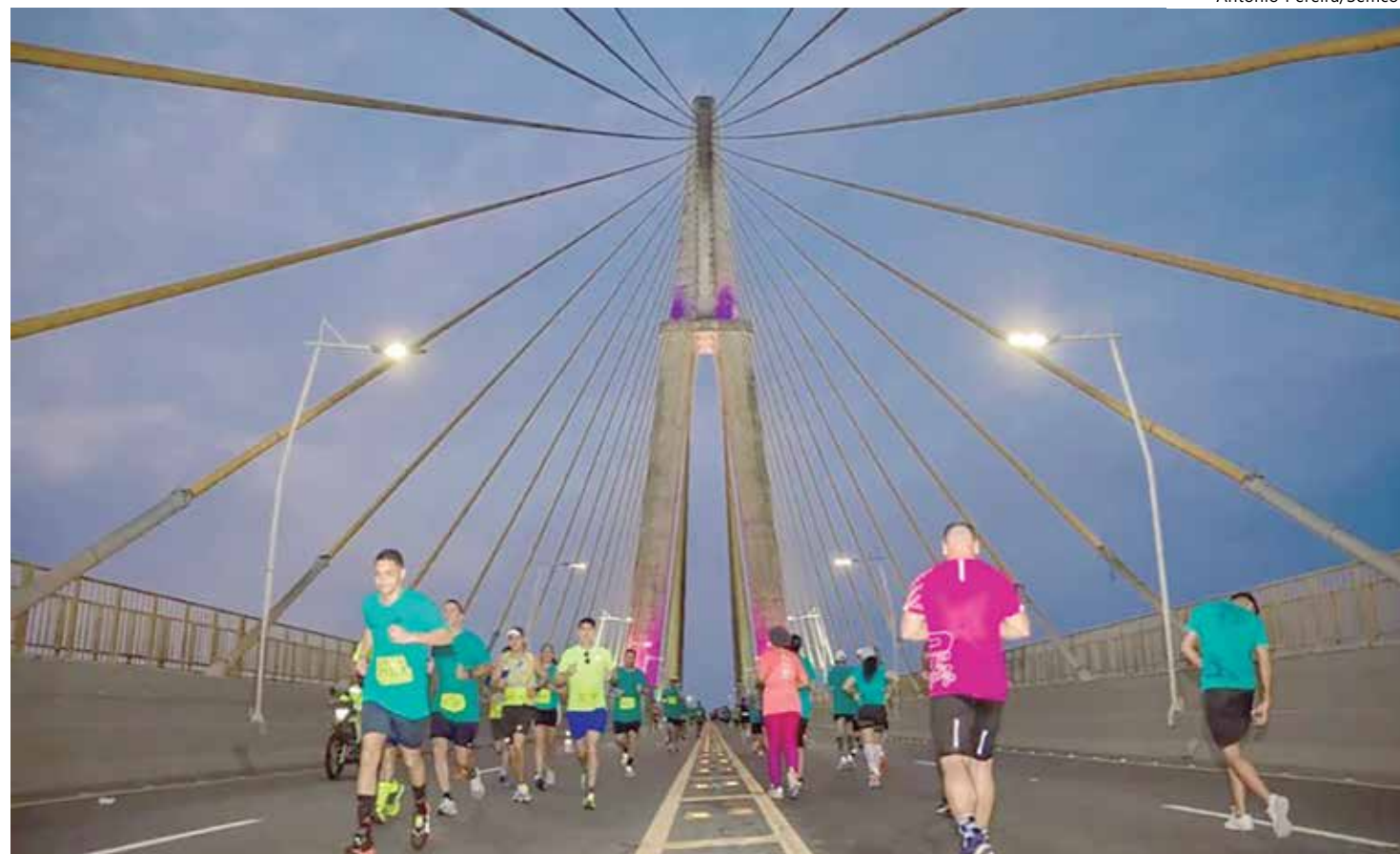
Maratona Internacional de Manaus em 2022 passou pela ponte Jornalista Philippe Daou e outros pontos turísticos