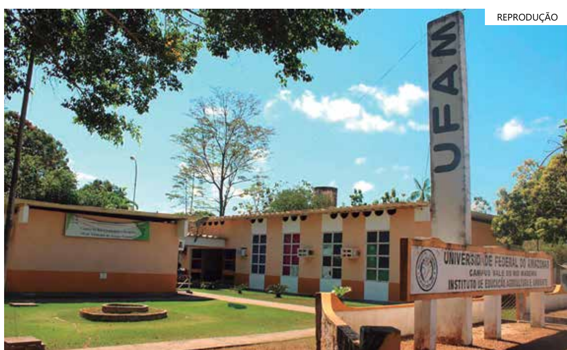
Ufam campus Humaitá promove a "II Semana de Letras IEAA"

Acontece de 27 a 29 de setembro, no Instituto de Educação, Agricultura e Ambiente (IEAA/Ufam) de Humaitá (distante 590 quilômetros da capital), a "II Semana de Letras IEAA - Diálogos contemporâneos e feministas no ensino de literaturas e línguas".