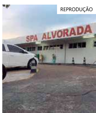
Vítima foi levada ao SPA da Alvorada, onde veio a óbito