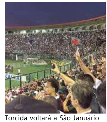
Torcida voltará a São Januário