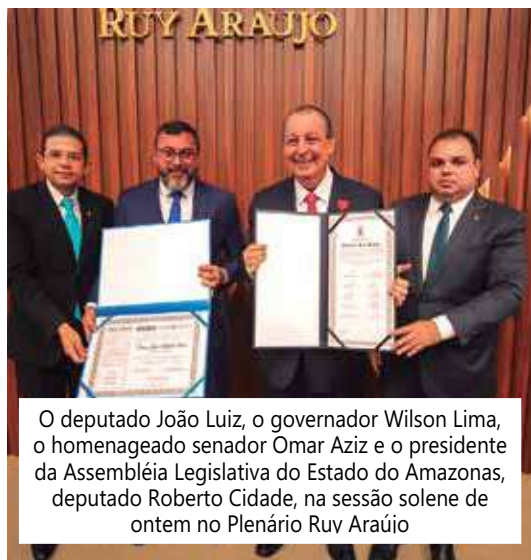
O deputado João Luiz, o governador Wilson Lima, o homenageado senador Omar Aziz e o presidente da Assembléia Legislativa do Estado do Amazonas, deputado Roberto Cidade, na sessão solene de ontem no Plenário Ruy Araújo

. O querido senador Omar Aziz foi homenageado com o Título de Cidadão do Amazonas e Medalha do Mérito Ruy Araújo, durante solenidade prestigiadíssima na manhã de ontem na Assembléia Legislativa do Estado do Amazonas, movimentando a Casa.