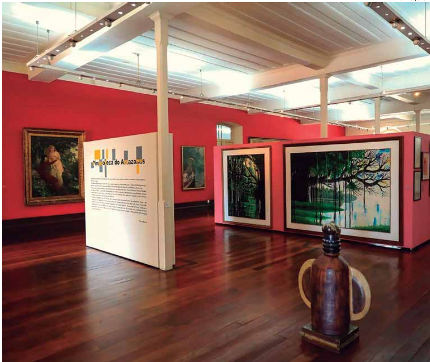
Pinacoteca do Estado tem programação extensa na Primavera dos Museus

A Primavera dos Museus é uma ação anual, com duração de uma semana, que visa a mobilizar museus brasileiros para a elaboração de programações especiais voltadas para um mesmo tema, escolhido pelo próprio Ibram.