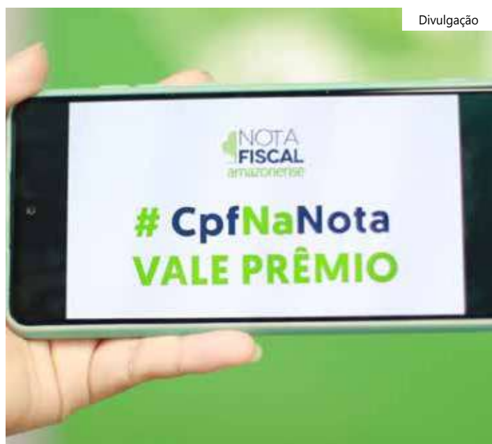
Expectativa em todo o Amazonas para conhecer os vencedores

O nome dos ganhadores é divulgado no site da Campanha e também nas redes sociais da Sefaz.