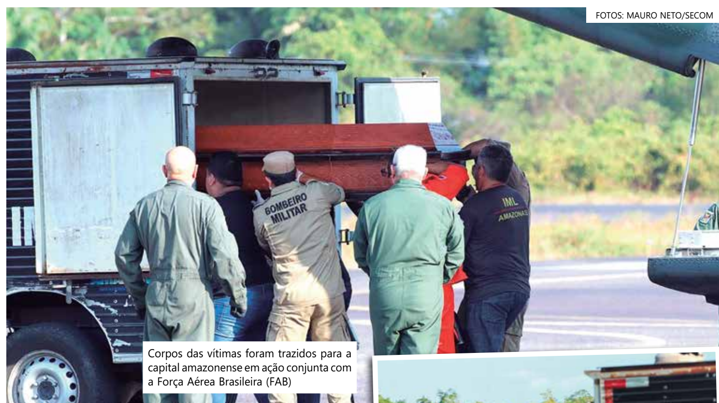
Corpos das vítimas foram trazidos para a capital amazonense em ação conjunta com a Força Aérea Brasileira (FAB)