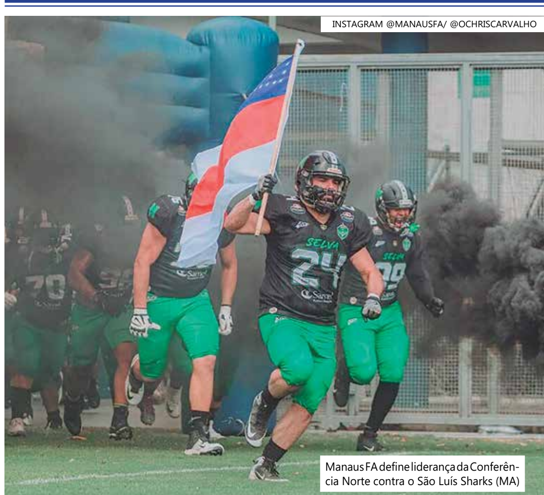
Manaus FA define liderança da Conferência Norte contra o São Luís Sharks (MA)

Após a vitória na estreia do principal torneio nacional, na reedição da última final de Conferência Norte contra o Vingadores (PA), o Manaus FA mantém a liderança do grupo ao lado do São Luís Sharks (MA), que também tem 100% de aproveitamento.