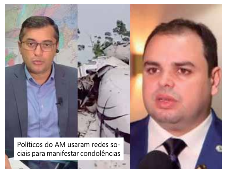
Políticos do AM usaram redes sociais para manifestar condolências

sábado (16) em Barcelos, a 400 quilômetros de Manaus, no Alto Rio Negro, ao tentar pousar durante uma tempestade. Morreram o piloto e o copiloto e mais 12 turistas, que estariam na região para a prática da pesca esportiva. Barcelos é um importante destino turístico do Amazonas para a pesca recreativa e esportiva.