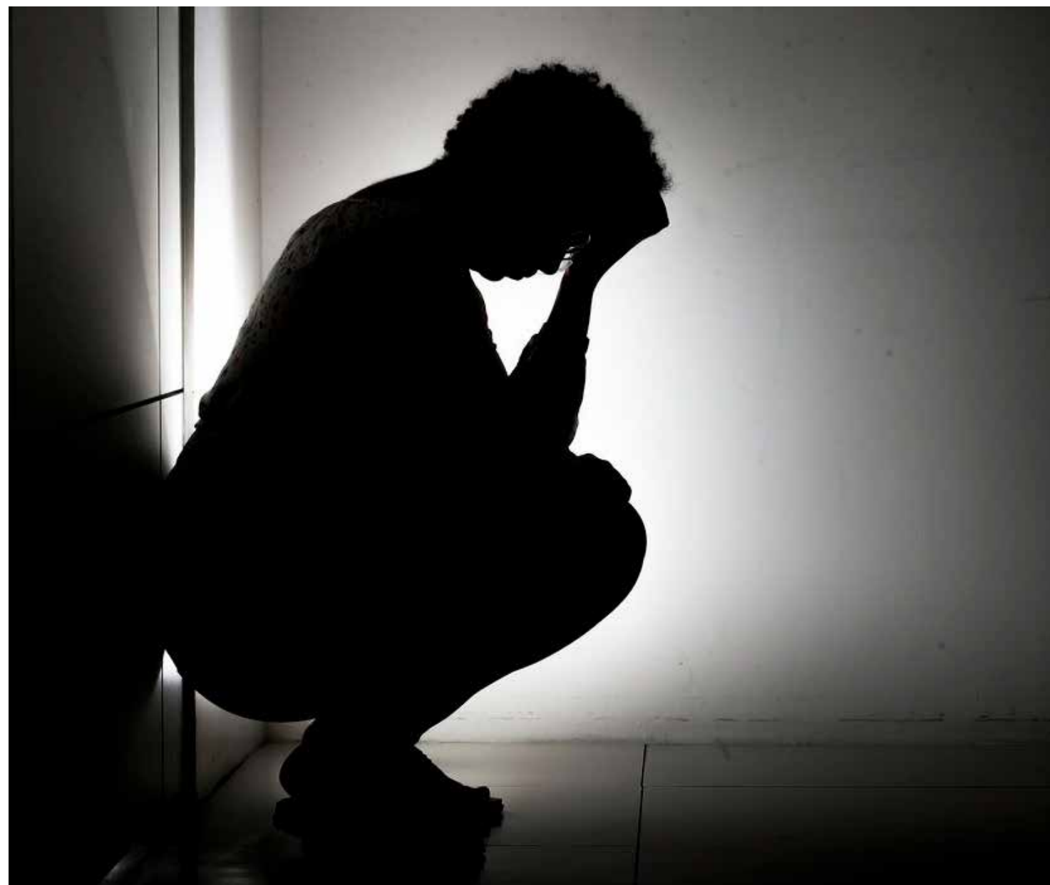
A maioria dos casos está consolidada entre os adolescentes

apurados pela SBP, a maior prevalência de suicídio ocorre entre os jovens do sexo masculino. Ao longo da série histórica, de 2012 a 2021, os rapazes representam mais que o dobro de casos sendo homens 6.801 episódios (68,32%) e mulheres 3.153 (31,68%). Já pela distribuição geográfica, os estados que apresentam as maiores taxas, englobando meninos e meninas, são São Paulo (1.488), seguido de Minas Gerais (889); Rio Grande do Sul (676); Paraná