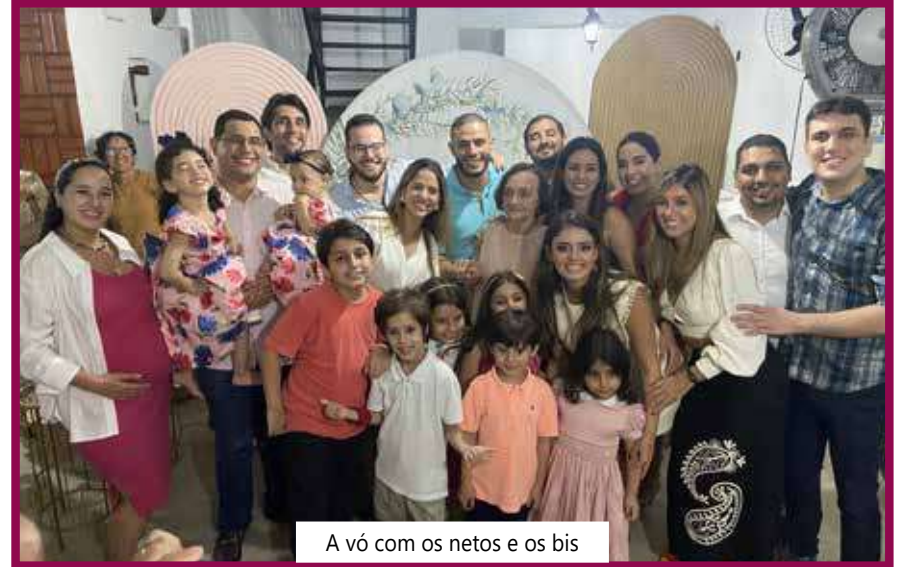
A vó com os netos e os bis