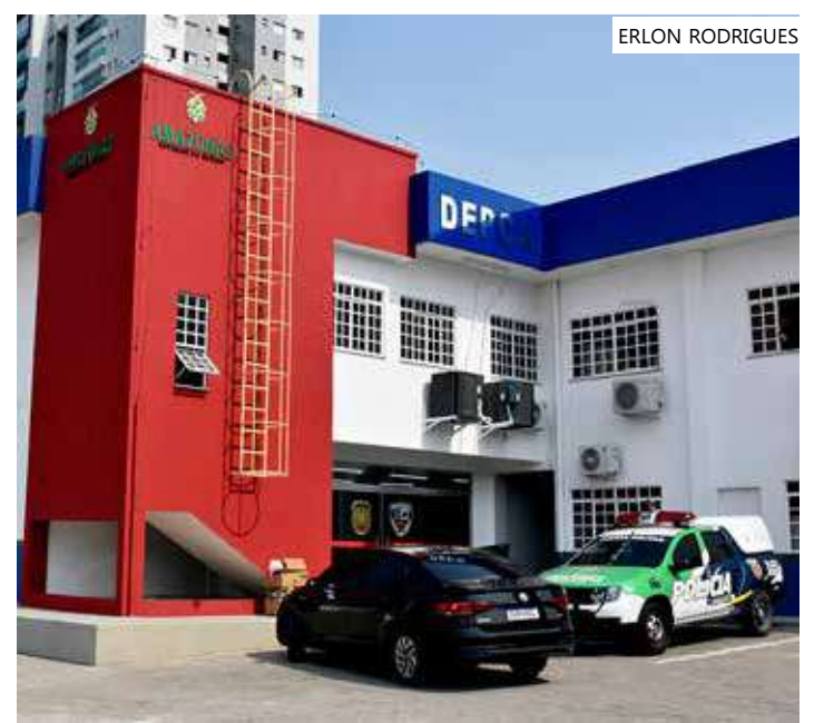
Policiais da Depca informaram que a criança estava sob os cuidados da tia

A vítima foi encaminhada ao Serviço de Acolhimento Institucional para Crianças e Adolescentes (Saica). Já a mulher foi levada à audiência de custódia, onde ficará à disposição da Justiça.