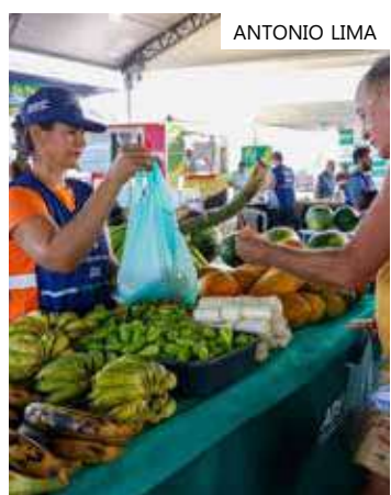
Edições ocorrem neste fim de semana

Aos domingos, as edições acontecem, das 6h às 12h, no Complexo Turístico da Praia da Ponta Negra, que fica localizado na avenida Coronel Teixeira, bairro Ponta Negra, zona oeste; e na Rodovia AM-010, quilômetro 29 - sentido Rio Preto da Eva.