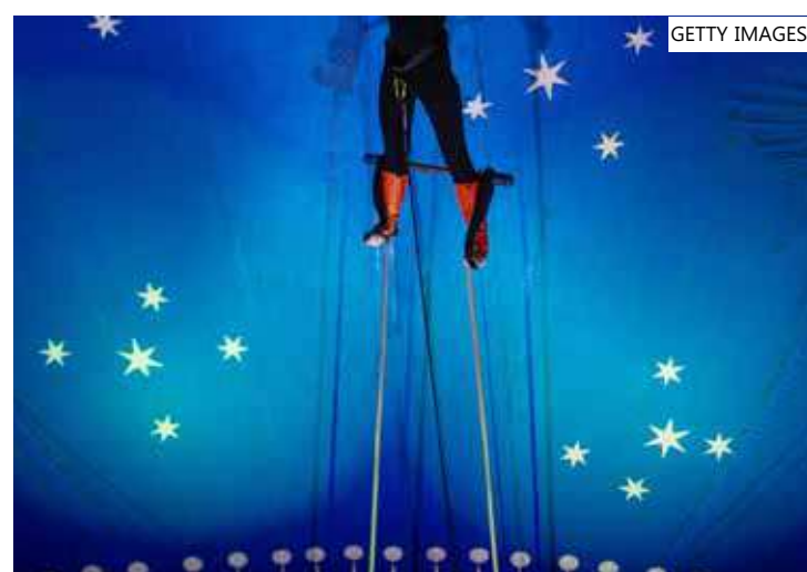
Após a queda, os dois trapezistas foram socorridos e encaminhados ao hospital

O Circo também afirmou que presta "toda a assistência" aos dois profissionais e aos seus familiares, que moram na Argentina. Ainda disse que as apresentações continuarão com os demais artistas e que o público que estava no espetáculo no momento do acidente poderá escolher entre um novo ingresso ou a devolução do valor.