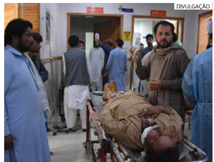
As autoridades locais indicaram, inicialmente, cerca de 30 mortos

O primeiro-ministro interino do Paquistão, Anwar-ul-Haq Kakar, condenou veementemente o atentado. Ele manifestou condolências às famílias dos que morreram na explosão, informou comunicado do seu gabinete.