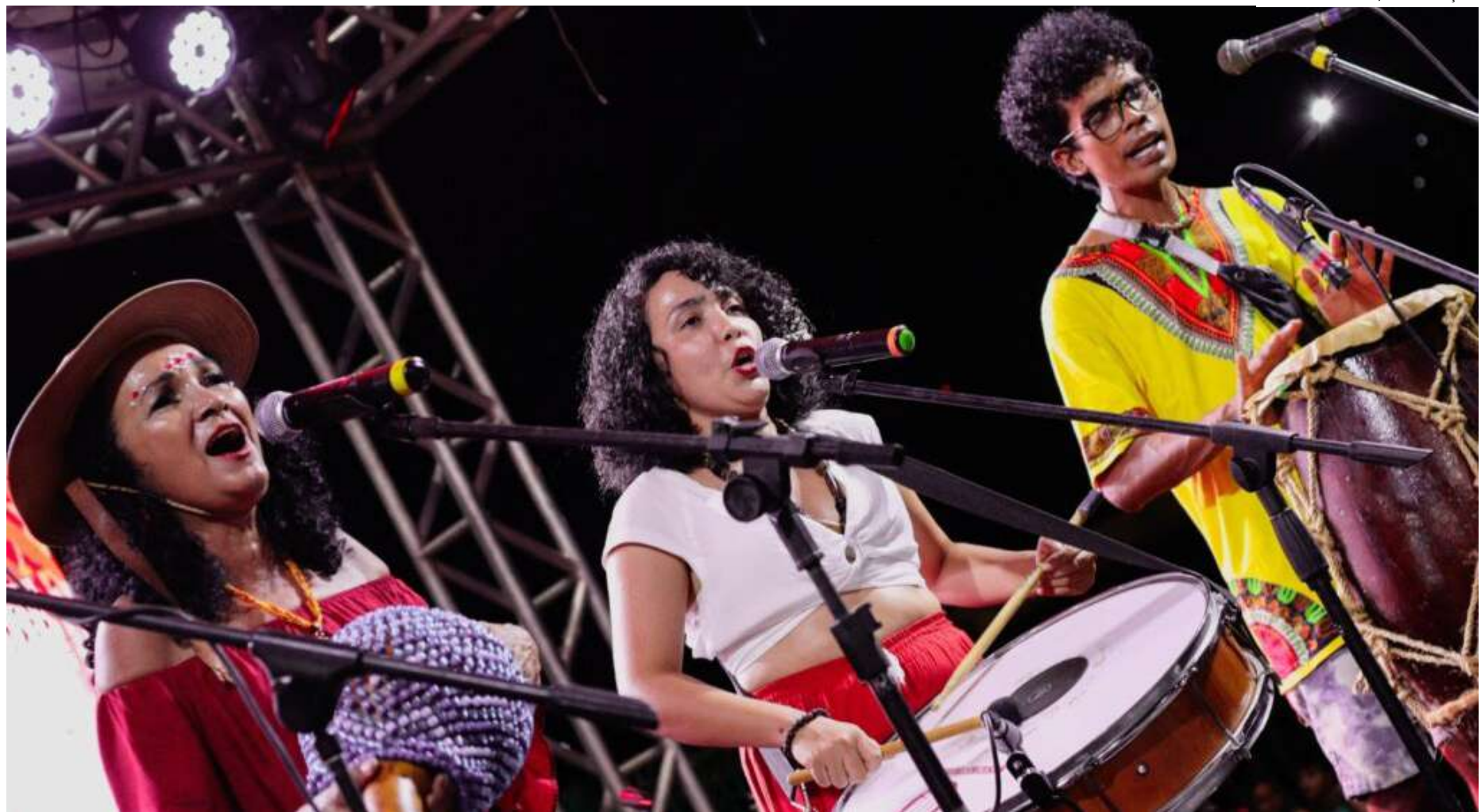
Cocada Baré protagoniza intervenção no domingo (1º/10)

A iniciativa anuncia a 17ª edição do FTA que terá atividades em espaços como Teatro da Instalação (R. Frei José dos Inocentes, s/n - Centro), Teatro Amazonas (Largo de São Sebastião - Centro), Tea-