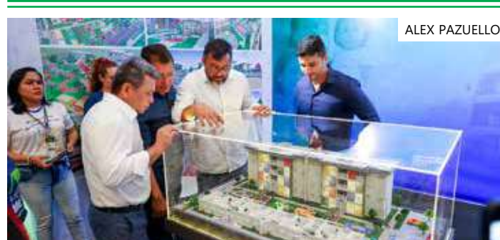
Programa integra a política habitacional do Governo do Estado

Decreto, Portarias e Editais estão publicados no site do programa.