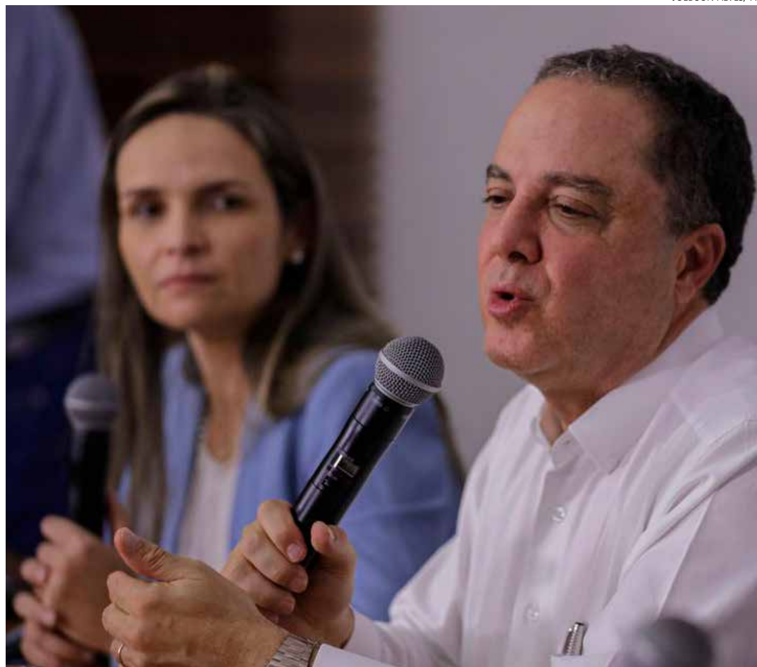
O médico Roberto Kalil Filho falou sobre os procedimentos feitos em Lula

A cirurgia foi realizada na unidade de Brasília do Hospital Sírio-Libanês e Lula foi submetido à anestesia geral, um procedimento padrão nesse tipo