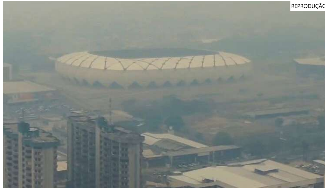
Imagem feita no dia 27 de setembro mostra Manaus coberta por fumaça

Manaus amanheceu sob uma intensa nuvem de fumaça na quinta-feira (28/09), alcançando o nível de "muito insalubre" no "Valores do Índice de Qualidade do Ar" (AQI), mapa mundial que indica a qualidade do ar em tempo real.