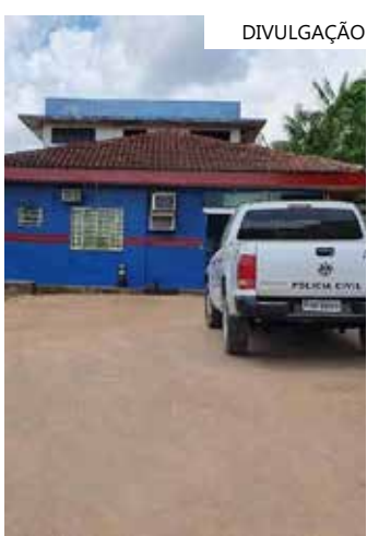
Prisão foi realizada por agentes da 63ª Delegacia Interativa de Polícia

De acordo com a Polícia Civil, Alcinete responderá por tentativa de homicídio e ficará à disposição da Justiça.