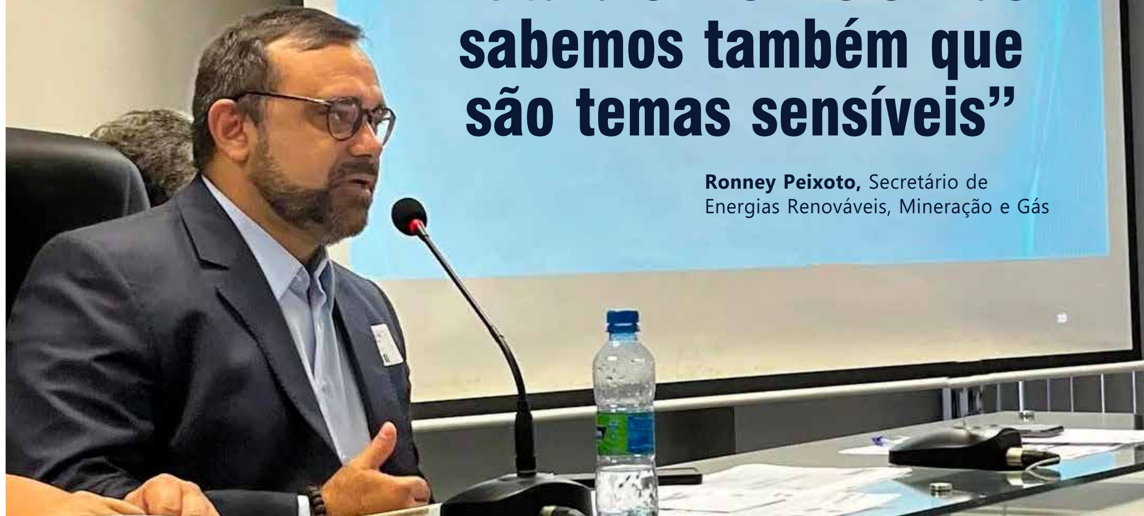
O secretário da Energias Renováveis, Mineração e Gás (Semig) falou com a reportagem do Vanguarda do Norte sobre os trabalhos da nova secretaria a qual ele é titular