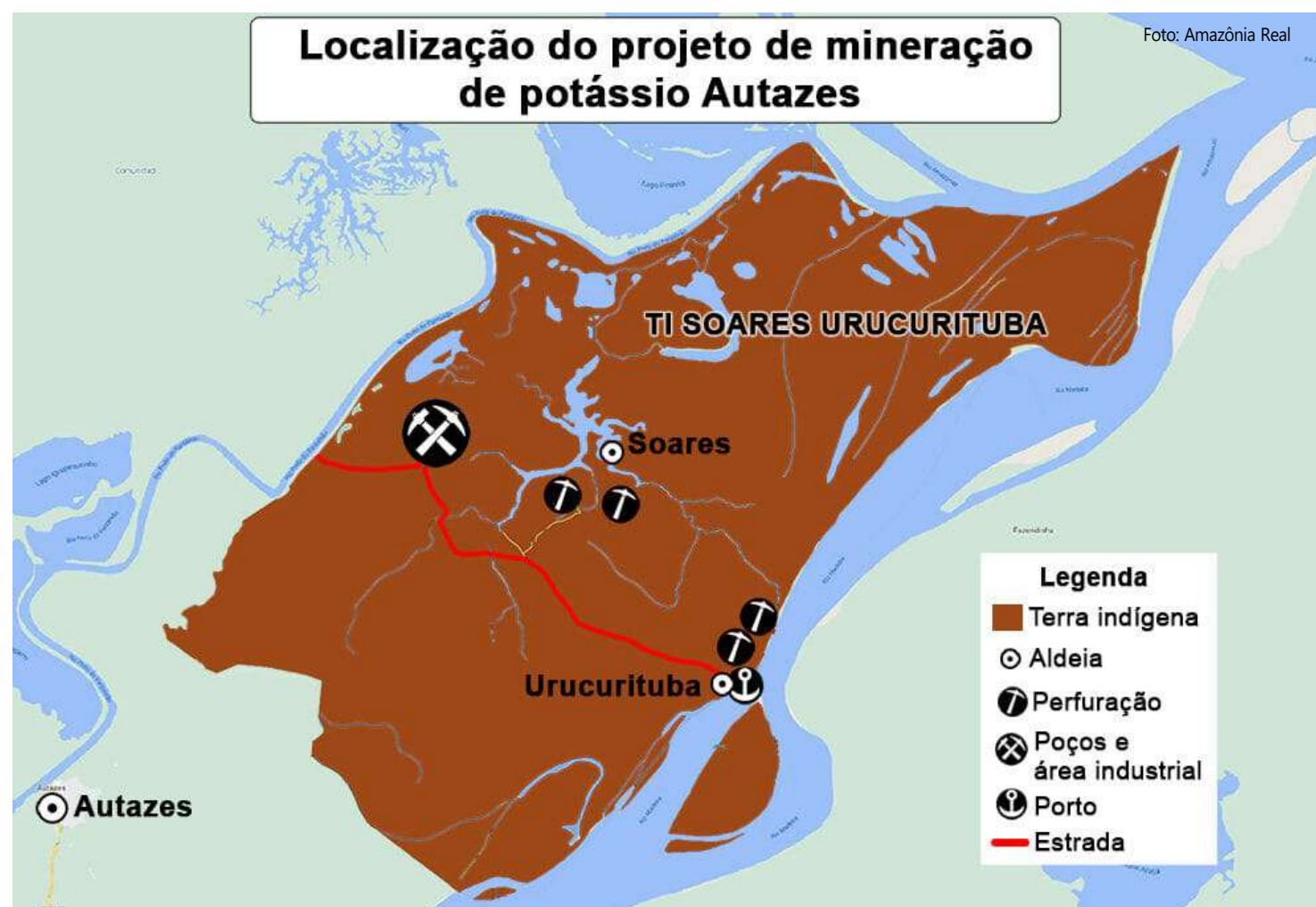
Gráfico mostra a região de Autazes que concentra potássio e território indígena que está sendo reivindicado