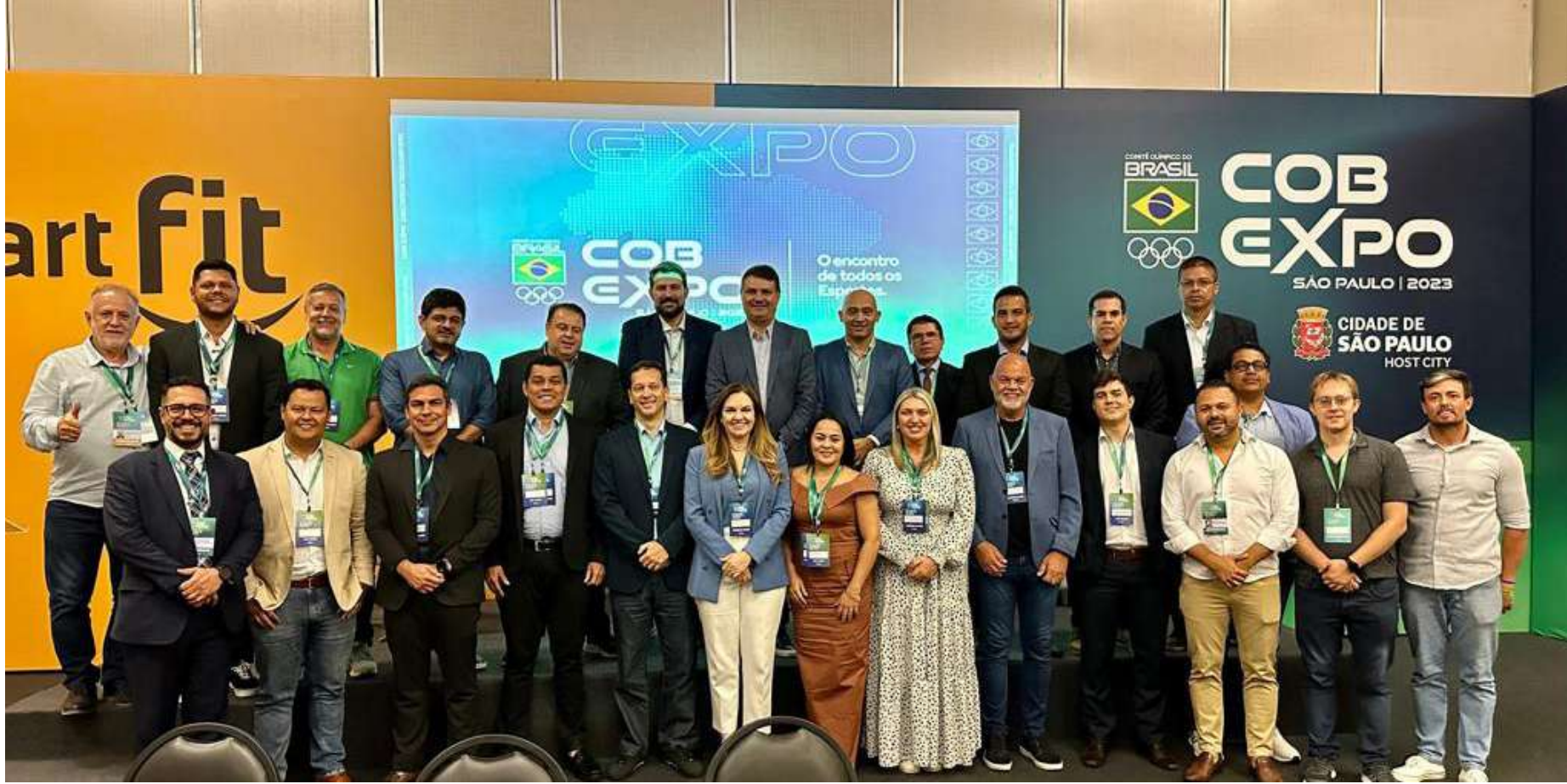
Secretários municipais de esporte presentes na I COB Expo

O objetivo do Fórum foi promover a troca de experiências, discutir desafios e buscar soluções