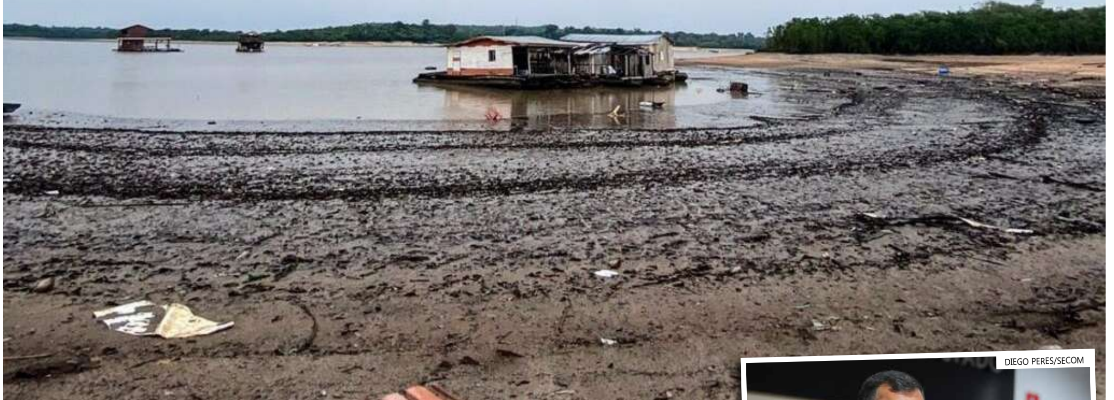
Governo afirma que efeitos da estiagem ultrapassam os limites e capacidades do Estado

Apoio do Governo Federal deve acontecer com envio da Força Nacional, além do PREVFOGO e da dragagem no Alto Solimões