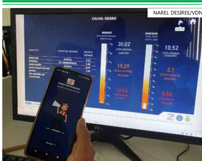
Aplicativo registra o nível dos rios no estado

As informações coletadas também serão disponibilizadas para a população através do site da Defesa Civil do Amazonas.