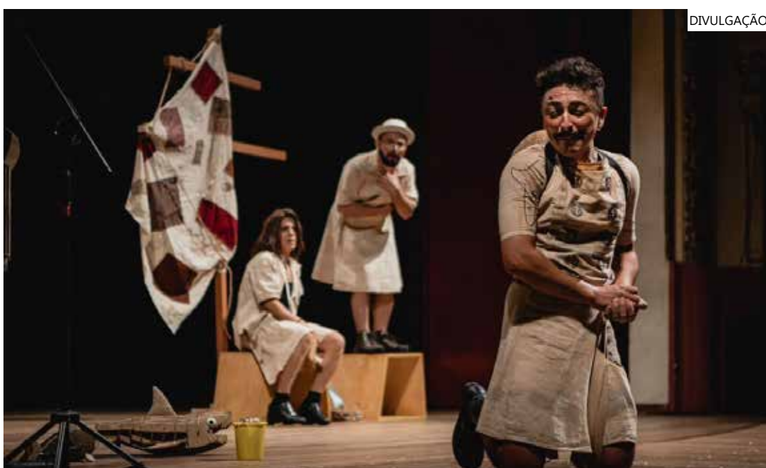
Festival de Teatro da Amazônia acontece de 7 a 15 de outubro

A Federação de Teatro do Amazonas (Fetam) divulgou os espetáculos selecionados para a 17ª edição do Festival de Teatro da Amazônia (FTA), que acontece de 7 a 15 de outubro. A lista de contemplados está disponível no site da federação ( https://fetam.com.br ).