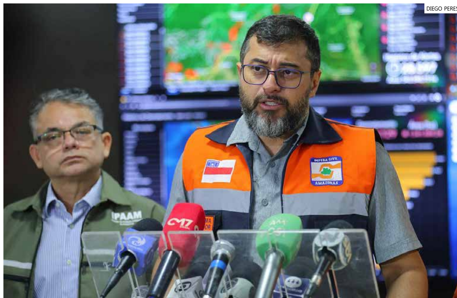
Governador do Amazonas também reforçou as medidas tomadas pelo Estado, que visam minimizar o impacto da estiagem

O governador Wilson Lima afirmou, nesta segunda-feira (2), que o Governo do Estado tem atuado com rigor diante da forte estiagem e, principalmente, no combate às queimadas ilegais, que já alcança R$ 17 milhões em multas nas regiões sul e metropolitana de Manaus, segundo o Instituto de Proteção Ambiental do Amazonas (Ipaam). A declaração foi feita durante visita ao Centro de Monitoramento Ambiental e Áreas Protegidas do órgão estadual.