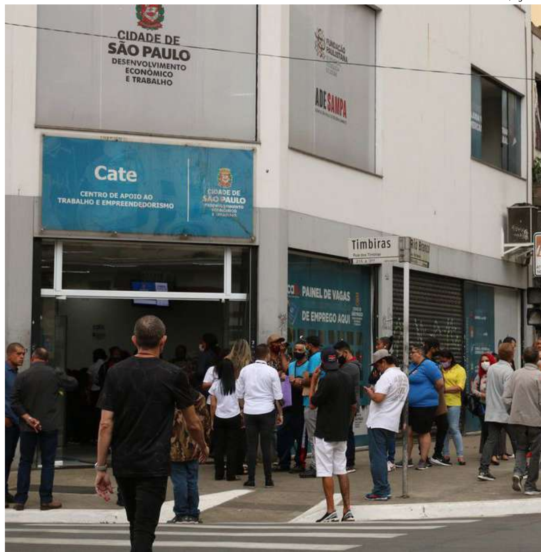
Os dados são do Novo Cadastro Geral de Empregados e Desempregados (Caged)

Os salários de admissão e desligamento chegaram a R$ 2.037,90 e R$ 2.121,90