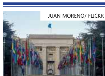
Conselho de Segurança da ONU é um dos mais importantes do órgão

Segundo o diplomata, outros temas serão abordados ao longo do mês na presidência brasileira do Conselho de Segurança: a possível missão de apoio às forças de segurança do Haiti; a manutenção da missão da ONU que supervisiona as negociações de paz na Colômbia; e, possivelmente, questões relativas à guerra entre Ucrânia e Rússia.