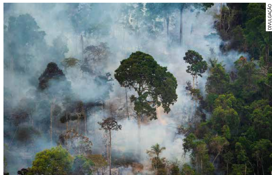
Em todo mês de setembro, foram detectados 6.991 focos de calor no Amazonas