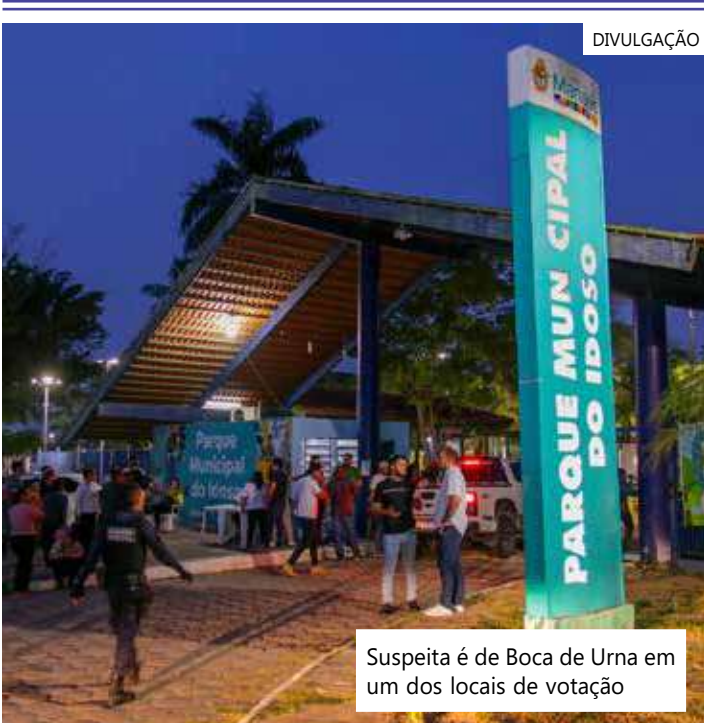
Suspeita de Boca de Urna em um dos locais de votação

"É essencial a cooperação entre essas instituições para garantir a eficácia da fiscalização do processo eleitoral, reforçando o compromisso do MPAM com a democracia e a transparência nas eleições do Conselho Tutelar", declarou.