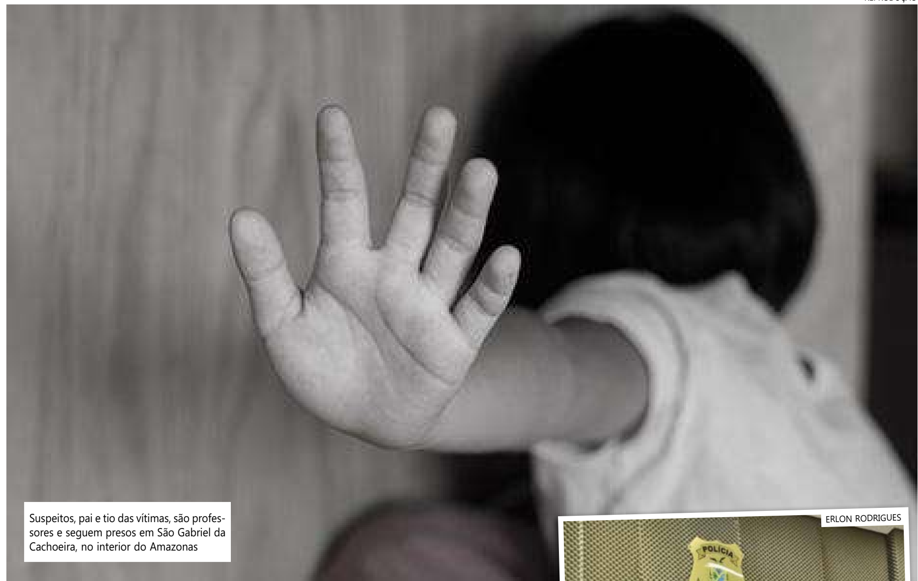
Suspeitos, pai e tio das vítimas, são professores e seguem presos em São Gabriel da Cachoeira, no interior do Amazonas

"Ao interrogar o pai, ele relatou que o filho tinha problemas de saúde e levava a uma espécie de curandeiro para fazer orações. Verificamos que na verdade não existia situação de rituais satânicos, mas que o pai se embriagava de uma forma muito elevada com o irmão e, naquele momento, passava a agredir fisicamente esta criança de 12 anos, privava de alimentação, de sono e as agressões culminaram na formação de um coágulo na cabeça do jovem", explica.