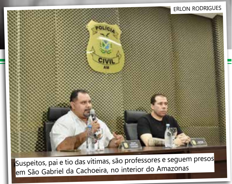
Suspeitos, pai e tio das vítimas, são professores e seguem presos em São Gabriel da Cachoeira, no interior do Amazonas

A partir da constatação dos crimes, os policiais prenderam os suspeitos, que não assumiram a autoria dos delitos. Ambos são