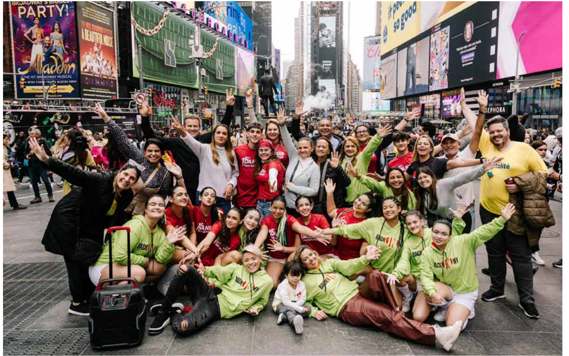
Companhia amazonense Backstage Studio de Dança posa na Times Square