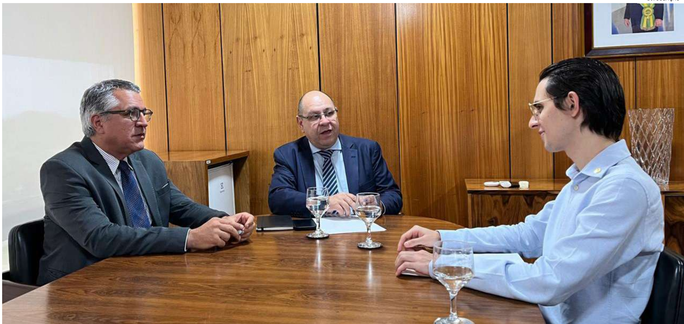
Amom tem alinhado conversas com o Ministério do Meio Ambiente, além de parlamentares de vários estados para conseguir ajuda no combate às queimadas

Região metropolitana de Manaus tem convivido com constantes fumaças