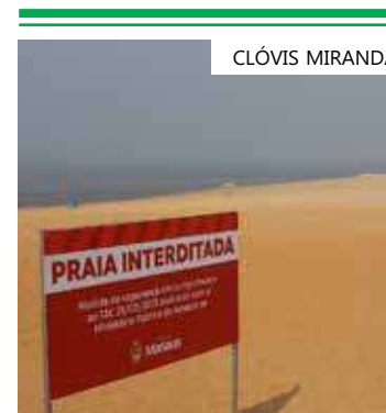
Interdição foi anunciada pelo prefeito na segunda-feira (2)

“Com a cota da água até 16 metros, nós temos uma delimitação de até 30 metros de segurança para o banho. Abaixo disso, essa cota diminui e o nível fica em 15 metros de segurança. Atendendo às recomendações, eu assino um decreto que será publicado ainda hoje, não permitindo o uso da praia para banhistas por 90 dias”, explica Almeida. Durante a interdição, o banho no rio fica proibido, e placas de orientação da interdição estão sendo instaladas para ampla informação aos frequentadores do espaço.