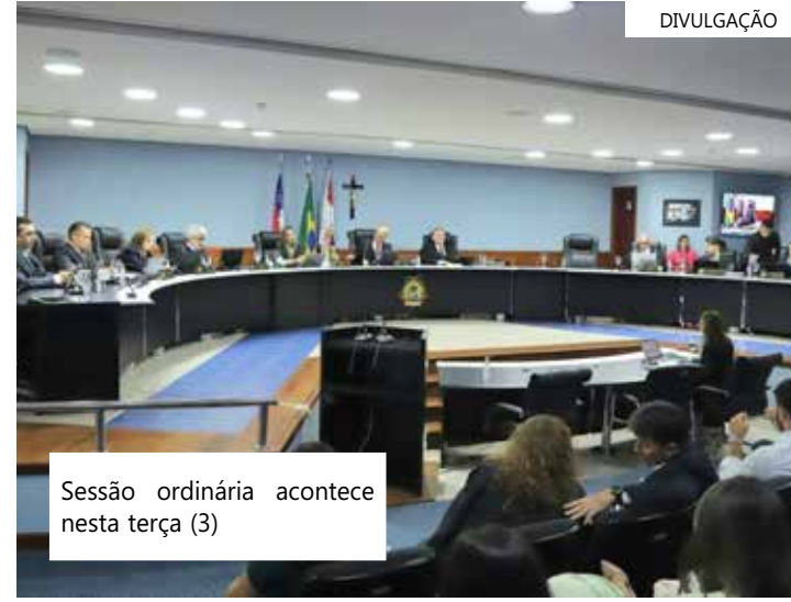
Sessão ordinária acontece nesta terça (3)