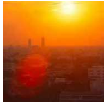
Previsão é do Instituto Nacional de Meteorologia