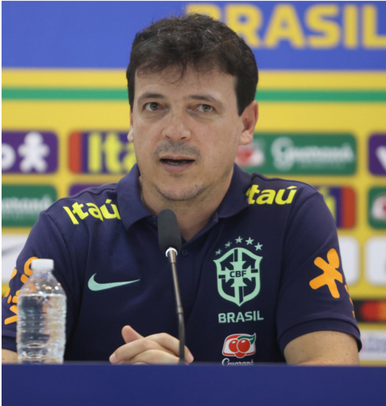
Diniz teve o primeiro tropeço no comando da Seleção

Na terça-feira (17), a Seleção Brasileira enfrenta o Uruguai, em Montevideu,