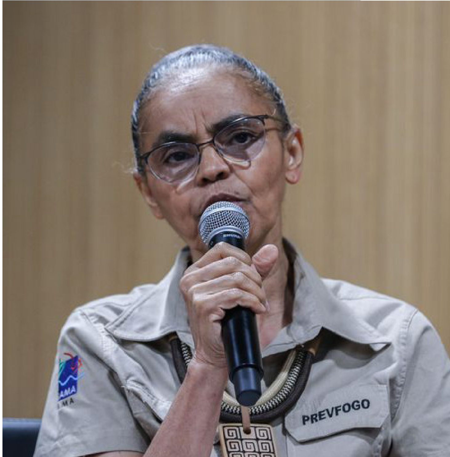
A ministra do Meio Ambiente Marina Silva falou sobre as medidas adotadas

Nesta 6ª feira, Marina também anunciou a doação de 200 kits de equi-