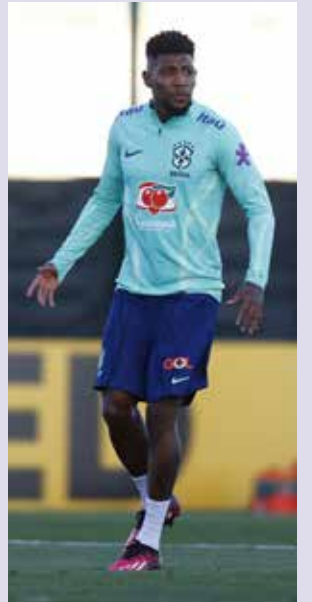
Novidade na lista de convocados do Brasil