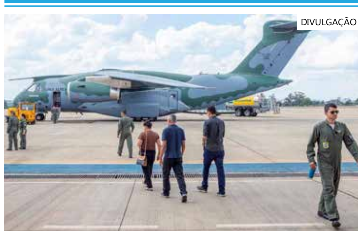
Brasileiros voltam para casa aliviados

A FAB também se prepara para fazer a primeira repatriação de brasileiros que estão na Faixa de Gaza. Uma aeronave VC-2 (Embraer 190) está pronta, no Aeroporto de Roma, aguardando sinal verde das autoridades egípcias para a operação.