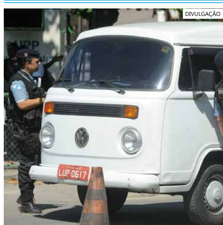
PM tenta combater criminosos e prender traficantes

Desde o início do ano, a Polícia Militar do Estado do Rio de Janeiro já apreendeu 4.702 armas entre eles, 397 fuzis, consideradas armas de guerra.