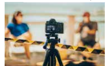
Cinema independente ganha destaque em Manaus