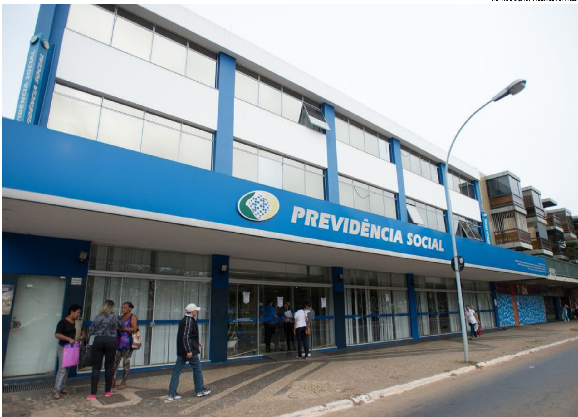
Redução de juros foi anunciada pelo CNPS

Com o novo teto, alguns bancos oficiais terão de reduzir as taxas para o consignado do INSS. Segundo os dados mais recentes do Banco Central, o Banco do Nordeste cobra 1,91% ao mês; o Banco da Amazônia