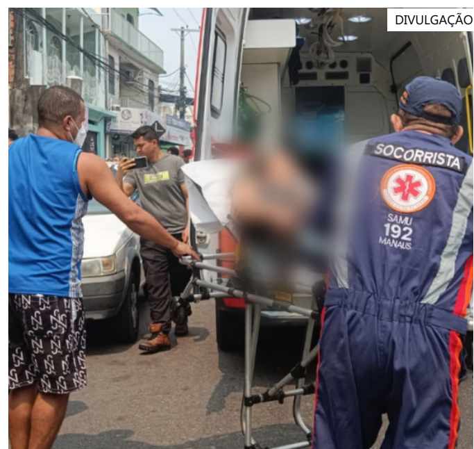
Os idosos foram socorridos pelo Samu e enviado a um centro médico

O corpo foi removido pelo Instituto Médico Legal (IML). A causa da morte será investigada.