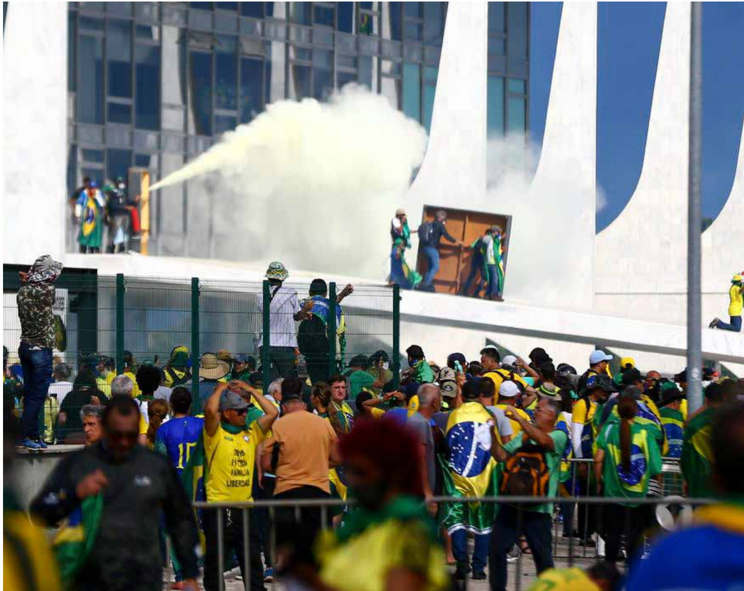
Ataques foram registrados no dia 8 de janeiro de 2023 em Brasília

Até agora, Moraes tinha votado por penas a partir de 12 anos. No entanto, nesta leva, o ministro propôs pena de três anos para dois réus, por considerar que eles tiveram menor grau de participação na depredação ao Planalto.