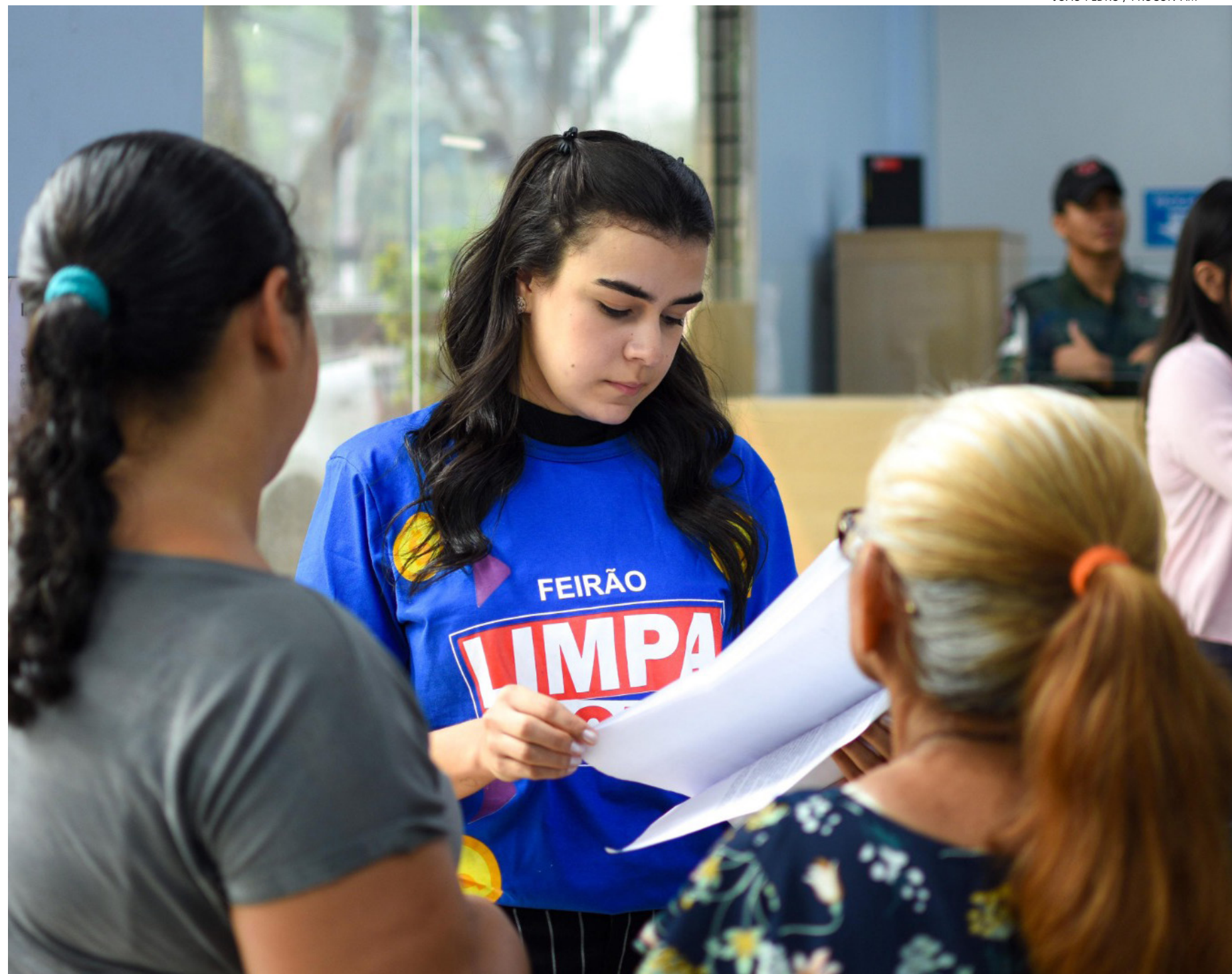
O atendimento começa nesta segunda-feira (16/10) e vai até o dia 20 de outubro, das 8h às 14h

"Essa edição será exclusiva para negociações de contas de energia elétrica junto a concessionária Amazonas Energia devido à grande procura na primeira edição e a busca constante dos consumidores amazonenses, que buscam o Procon-AM para tentar solucionar seus débitos junto a empresa. E será