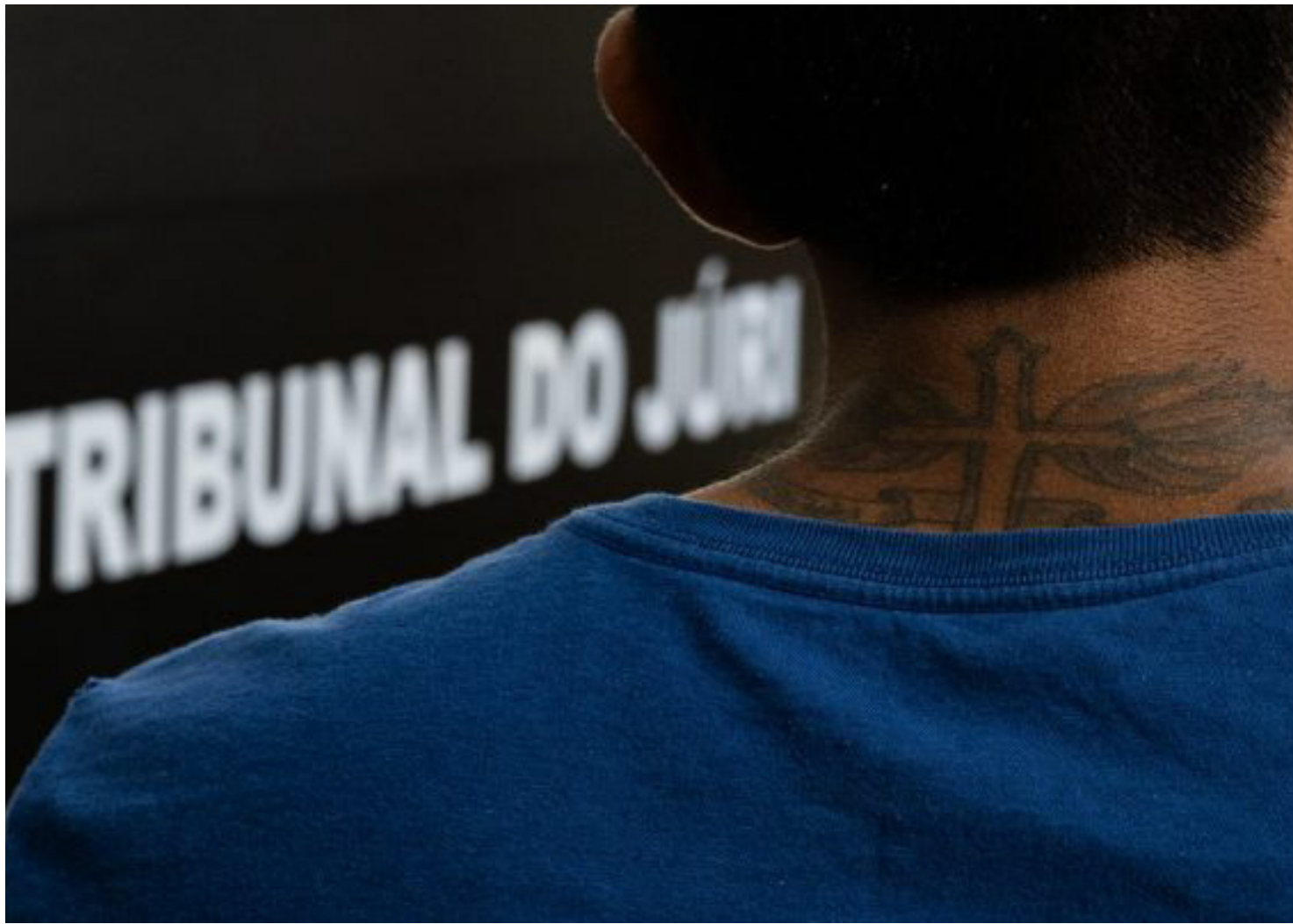
Tribunal aconteceu somente agora após dois anos do crime.