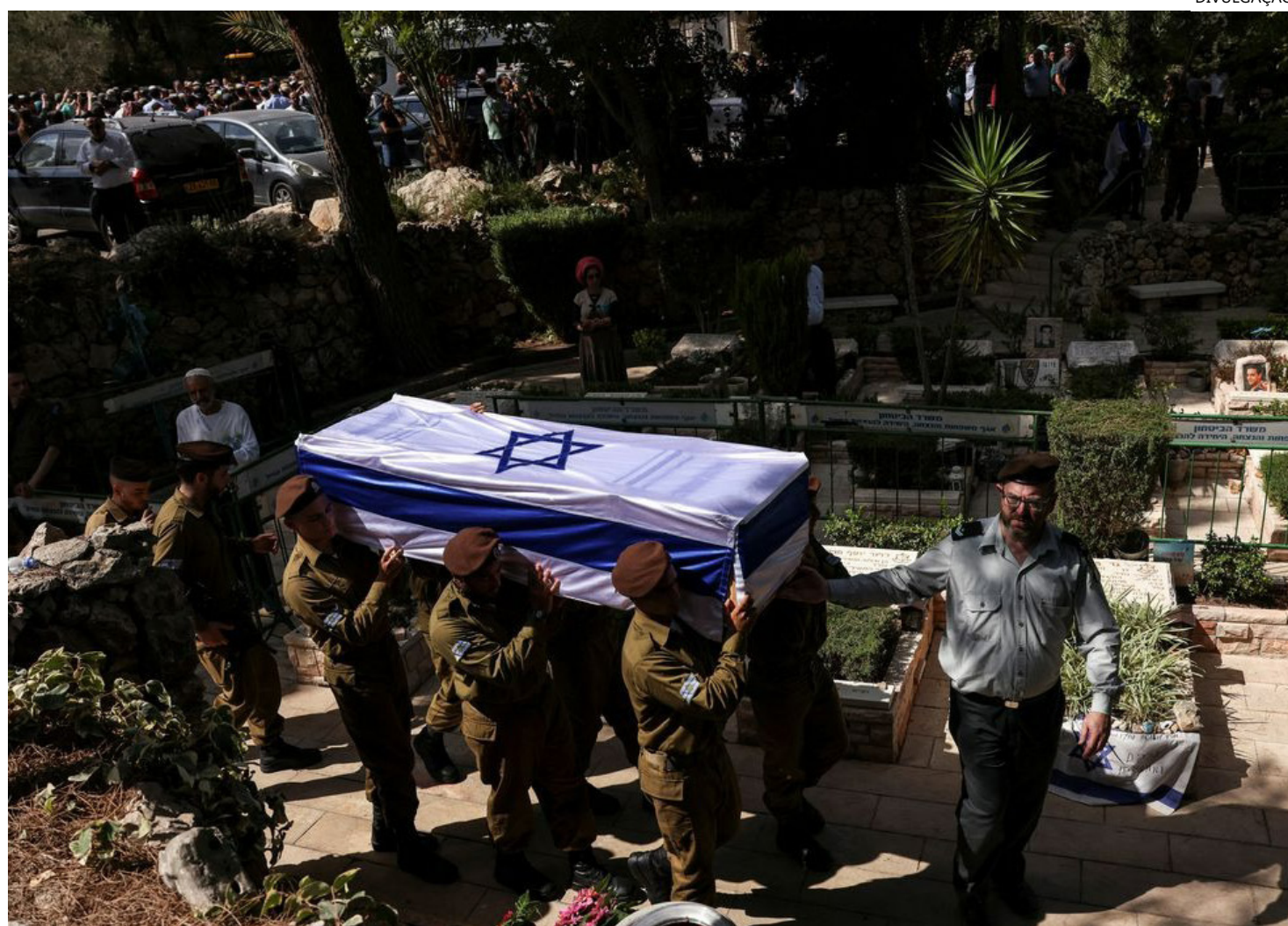
Governo brasileiro é cobrado para que se posicione na guerra

"O Conselho de Segurança mantém listas de indivíduos e entidades qualificadas como terroristas, contra os quais se aplicam sanções.