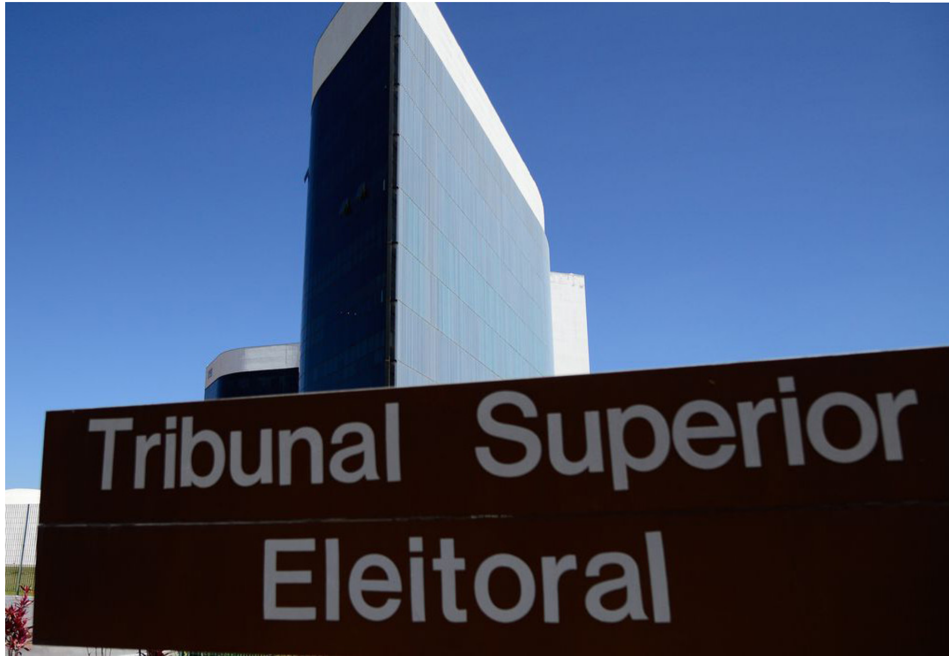
Inspeção é realizada pelo Tribunal Superior Eleitoral. Urnas inspecionadas serão usadas na eleições municipais de 2024

etapas mais importantes de auditoria do sistema eletrônico de votação. Neste ano, a iniciativa ocorre de 27 de novembro a 1º de dezembro. Ela é realizada desde 2009 e tem como público-alvo especialistas interessados em colaborar com a Justiça Eleitoral no aprimoramento da urna e dos sistemas eleitorais.