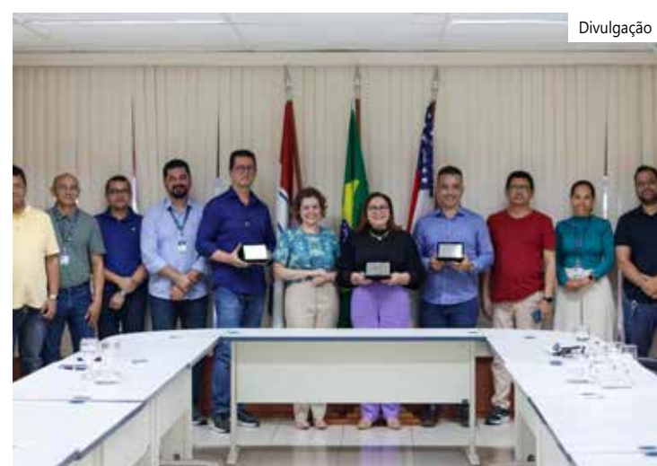
Desempenho relacionados às finanças e investimentos

O ISP- RPPS 2023 analisou dados relativos ao ano de 2022. De acordo com a publicação, nesta edição foi evidenciada uma melhora global no desempenho dos RPPS brasileiros, em comparação aos anos anteriores, assim como uma maior adesão às boas práticas de gestão dos institutos previdenciários.