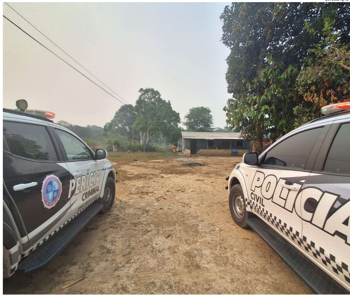
Força-tarefa ocorreu no município de Autazes (localizado a 113 quilômetros da capital amazonense)

No entanto, a Polícia Civil tem instaurado proce-