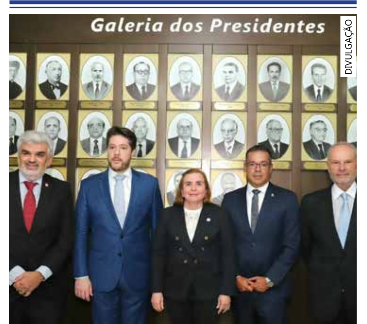
Nova diretoria que irá tomar posse no dia 1º de dezembro

com a extinção do Tribunal de Contas dos Municípios do Estado do Amazonas, também para todos os 62 municípios do estado, incluindo a capital Manaus. Tem como atual presidente o Conselheiro Érico Xavier Desterro e Silva.