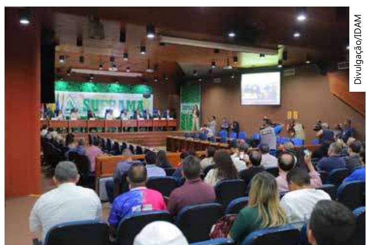
No evento, o Idam vai apresentar os empreendimentos das áreas do DAS

A feira do DAS conta com o apoio do Governo do Amazonas, por meio do Idam, da TV Encontro das Águas, das prefeituras de Manaus e Rio Preto da Eva e do Serviço Brasileiro de Apoio às Micro e Pequenas Empresas (Sebrae-AM).