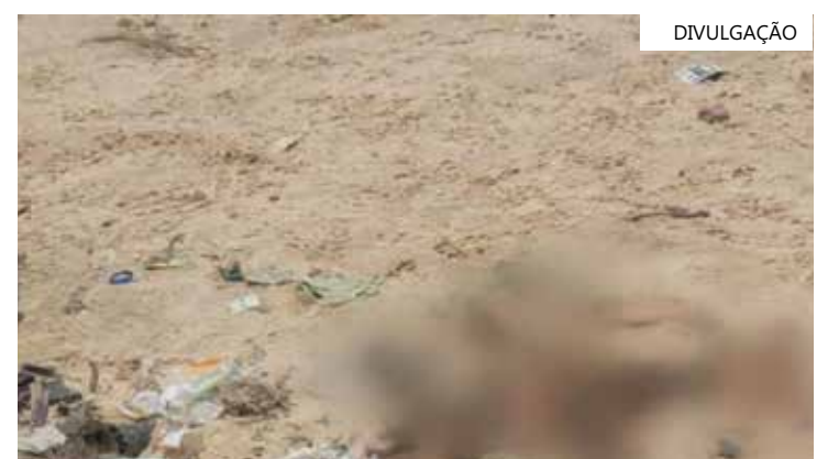
Além dos restos mortais espalhados pela areia, policiais encontraram uma arcada dentária no local

Após a constatação dos fatos, o Instituto Médico Legal (IML) foi acionado para fazer a remoção da ossada. A Polícia Civil do Amazonas (PC-AM) investiga o caso.