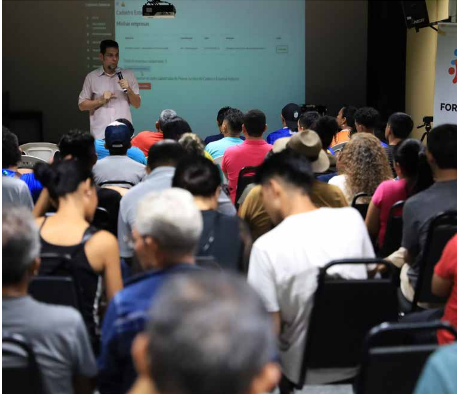
Oficina sobre o edital foi ministrada em Tefé, no interior do Amazonas

"Além do cadastro [Cadastro Estadual da Cultura], que é algo muito importante saber quantos nós somos, onde estamos e quais são as nossas atividades, é fundamental para direcionar as ações e as políticas públicas do Governo do Amazonas. A