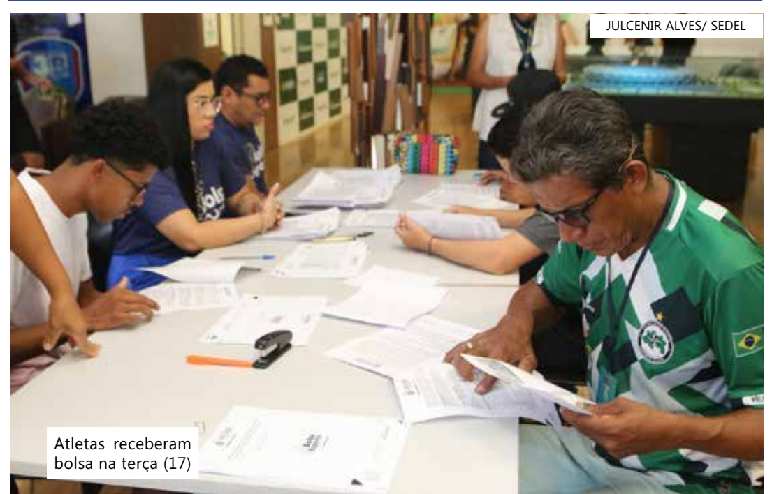
Atletas receberam bolsa na terça (17)