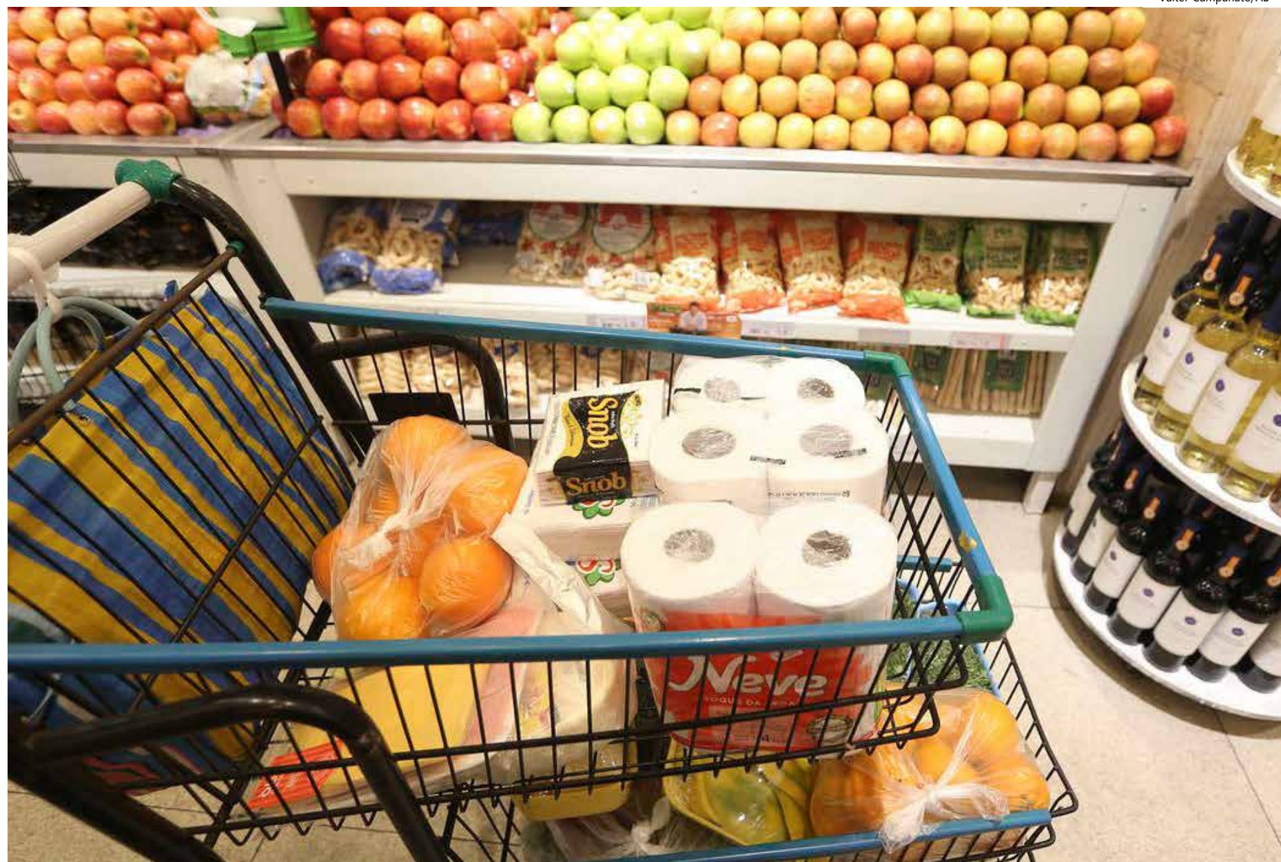
De acordo com o indicador do Ipea, é considerada renda muito baixa a família que recebe até R$ 2.015 por mês

Tanto na inflação acumulada de 12 meses quanto na setembro, o custo dos alimentos foi o item que