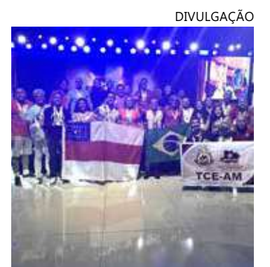
Delegação do TCE-AM em Cuiabá

Também foram premiados com bronze atletas do futebol society, futsal masculino, atletismo, corrida, natação, dominó, tênis feminino, tênis de mesa feminino, e vôlei de praia masculino.