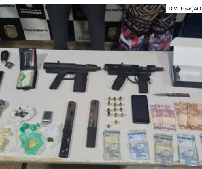
Também foram apreendidas drogas, balança de precisão e R$ 521 em espécie

A Polícia Militar orienta a população que, ao tomar conhecimento de ações criminosas, informe imediatamente por meio do disque-denúncia 181, ou do 190.