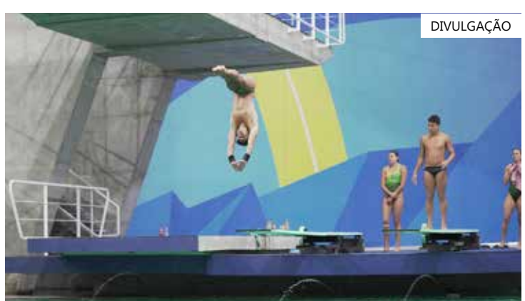
Equipe de natação treinando em Santiago, no Chile

Os jogos Pan-americanos estão com equipes bem representadas pelo Brasil. Agora é torcer pelos atletas e levar o país aos primeiros lugares da competição.