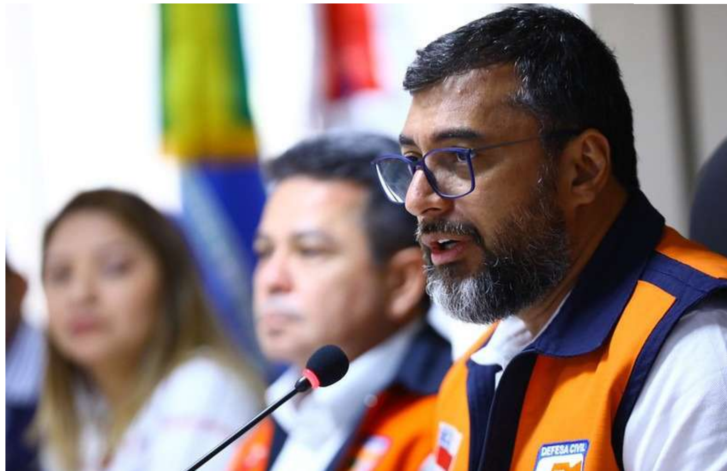
Na ocasião, Wilson Lima anunciou encontro com vice-presidente Alckmin, que ocorrerá nesta quarta-feira (18)

com o vice-presidente da República, Geraldo Alckmin, e amanhã nós vamos ter uma reunião em Brasília, juntamente com outros ministros que estão tratando dessa questão da estiagem aqui no estado do Amazonas, para apresentarmos um status de como é que o estado está hoje, das ações que já foram feitas, e aí o vice-presidente deve fazer alguns outros anúncios", informa Wilson Lima.