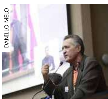
Organizações cobraram melhorias na via que é Federal