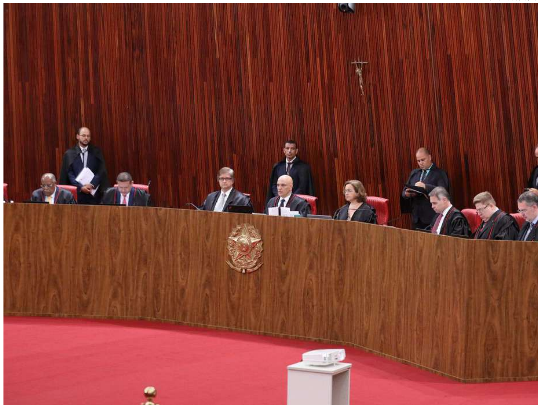
Tribunal fez julgamento do caso na noite de terça-feira (17), em Brasília

O entendimento pela absolvição também foi seguido pelos ministros Raul