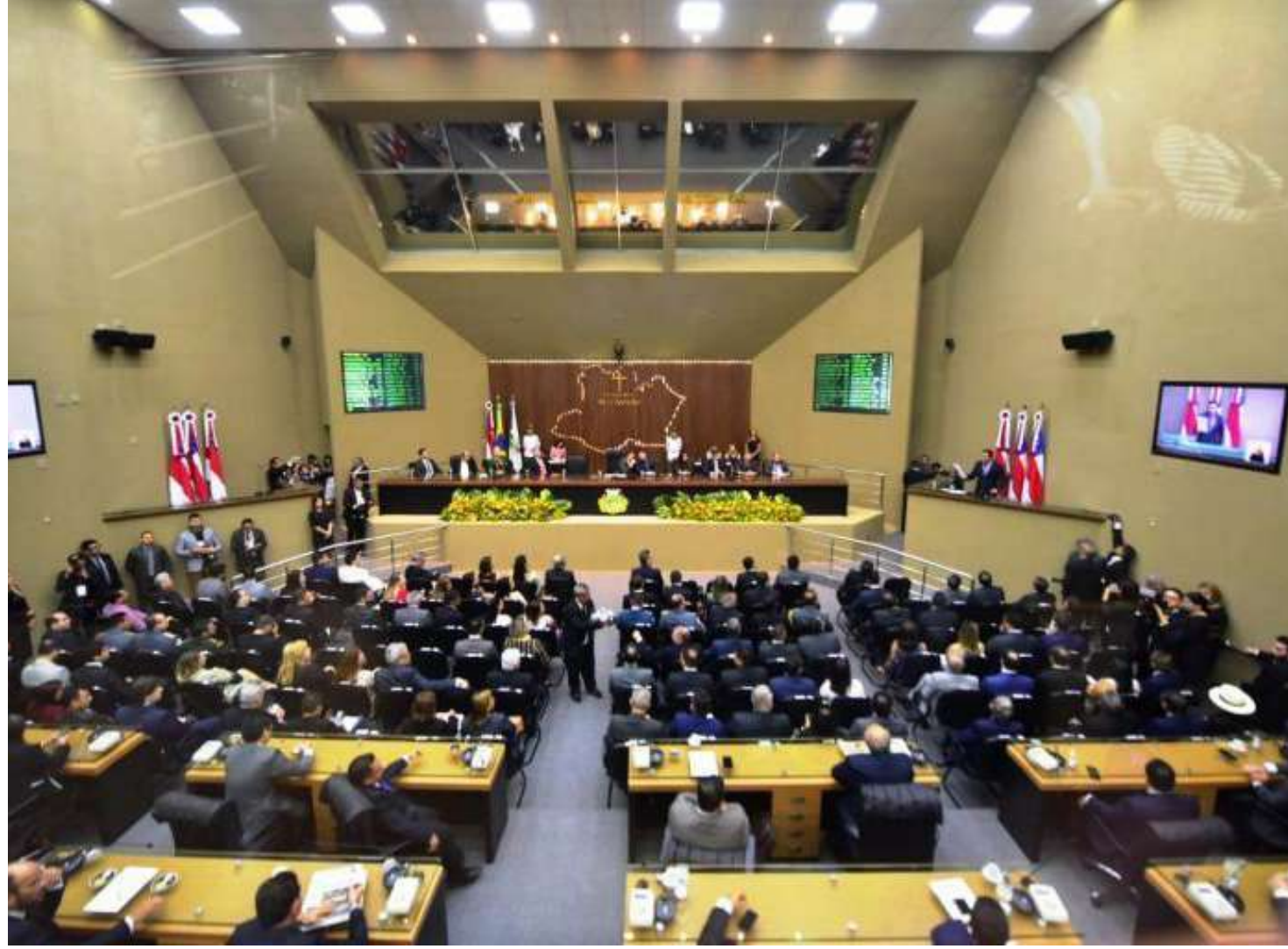
Deputados aprovaram pedido do Governo do Amazonas na terça-feira (17)

Destinado aos produtores rurais, micro e pequenos empresários e profissionais autônomos de baixa renda que sofrem os efeitos provocados pela estiagem de 2023, a remissão e renegociação de dívidas poderão ser concedidas após análise da Afeam. A medida per-