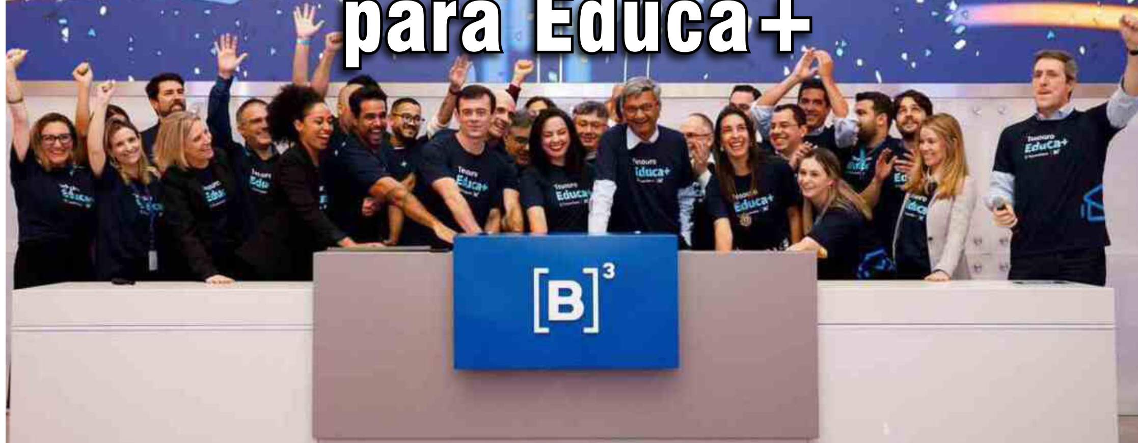
secretaria do Tesouro Nacional

O Tesouro Direto foi criado em janeiro de 2002 para popularizar esse tipo de aplicação