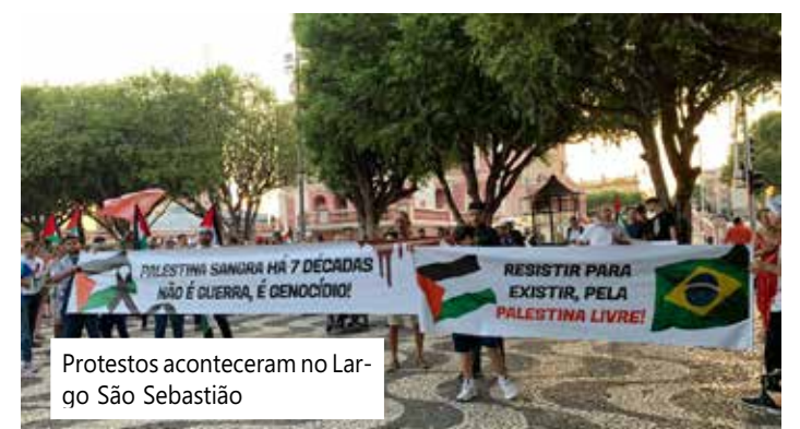
Protestos aconteceram no Largo São Sebastião

manifestação. Com cartazes exigindo o fim das mortes do povo palestino, adultos e crianças se uniram ao protesto. O evento teve como objetivo destacar o sofrimento contínuo do povo palestino ao longo das últimas sete décadas, devido à política de apartheid implementada por Israel, conforme denunciado por organizações de direitos humanos internacionais, como a Anistia Internacional e a Human Rights Watch.