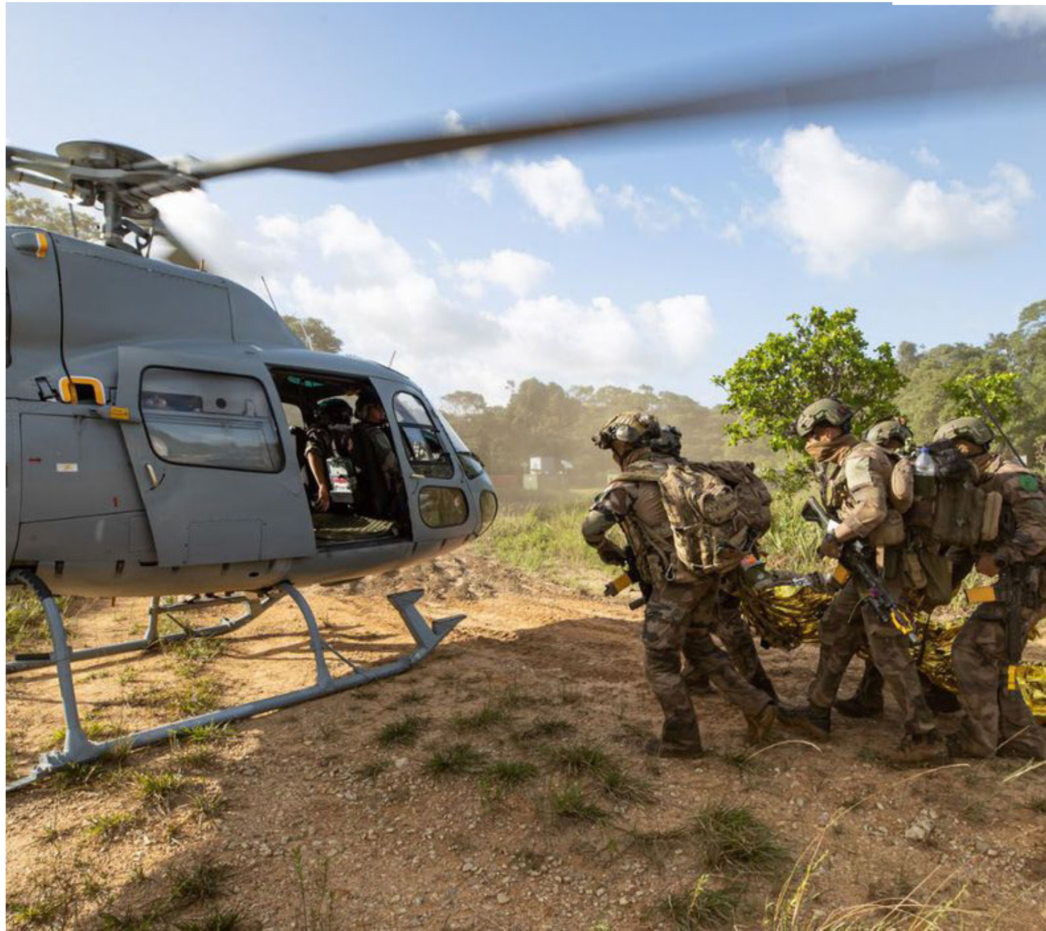
Exercícios internacionais mostram capacidade operacional e de colaboração do Exército Brasileiro

Em maio, uma comitiva de militares norte-americanos visitou o Comando Militar do Norte (CMN) para avaliar as condições estruturais e de suprimentos relacionados à saúde e alimentação desses. Na época, foram avaliados o 2º Batalhão de Infantaria de Selva e da 2ª Companhia de Suprimento do 8º Depósito de Suprimento, em Belém; a Companhia Especial de Fronteira de Clevelândia do Norte, no Oiapoque, e o 34º