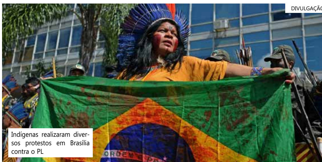
Indígenas realizaram diversos protestos em Brasília contra o PL

após o STF considerar o marco temporal inconstitucional. Antes do julgamento, as decisões da Justiça poderiam fixar que os indígenas somente teriam direito às terras que estavam em sua posse no dia 5 de outubro de 1988, data da promulgação da Constituição Federal, ou que estavam em disputa judicial na época.