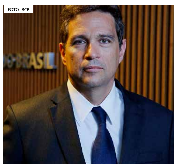
O presidente do BC ainda destacou que o mercado de trabalho continua aquecido no mundo

folga na mão de obra daqui para a frente, mas cada vez mais estão sendo questionadas", comentou Campos Neto.