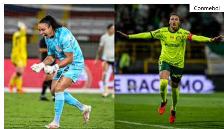
Corinthians e Palmeiras se enfrentam na final

No sábado (21), às 21h30 (horário de Brasília), Corinthians e Palmeiras se enfrentam para definir quem estará no topo da América.