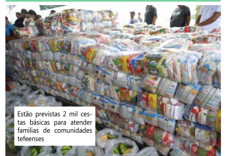
Estão previstas 2 mil cestas básicas para atender famílias de comunidades tefeenses

Comunidade São Jorge; Sítio Nova Inveja; São Pedro; Vila Nova; Nossa Senhora do Perpétuo Socorro; Santa Clara; Santa Cruz; Santa Maria; Santa Maria do Glória; Fazendinha; Cuanarú; Boará de Cima; Boará; Boarazinho; Luiz Crescente; Porto Praia; Santo Isidoro; Barreira de Baixo; Barreira do Meio; Betel; Barreira de Cima; Aldeia Vazouez; Jesus Me Deu; São Conrado 1 e 2; e comunidade Boa Vista.