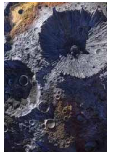
Arte divulgada pela Nasa mostra como seria o asteroide