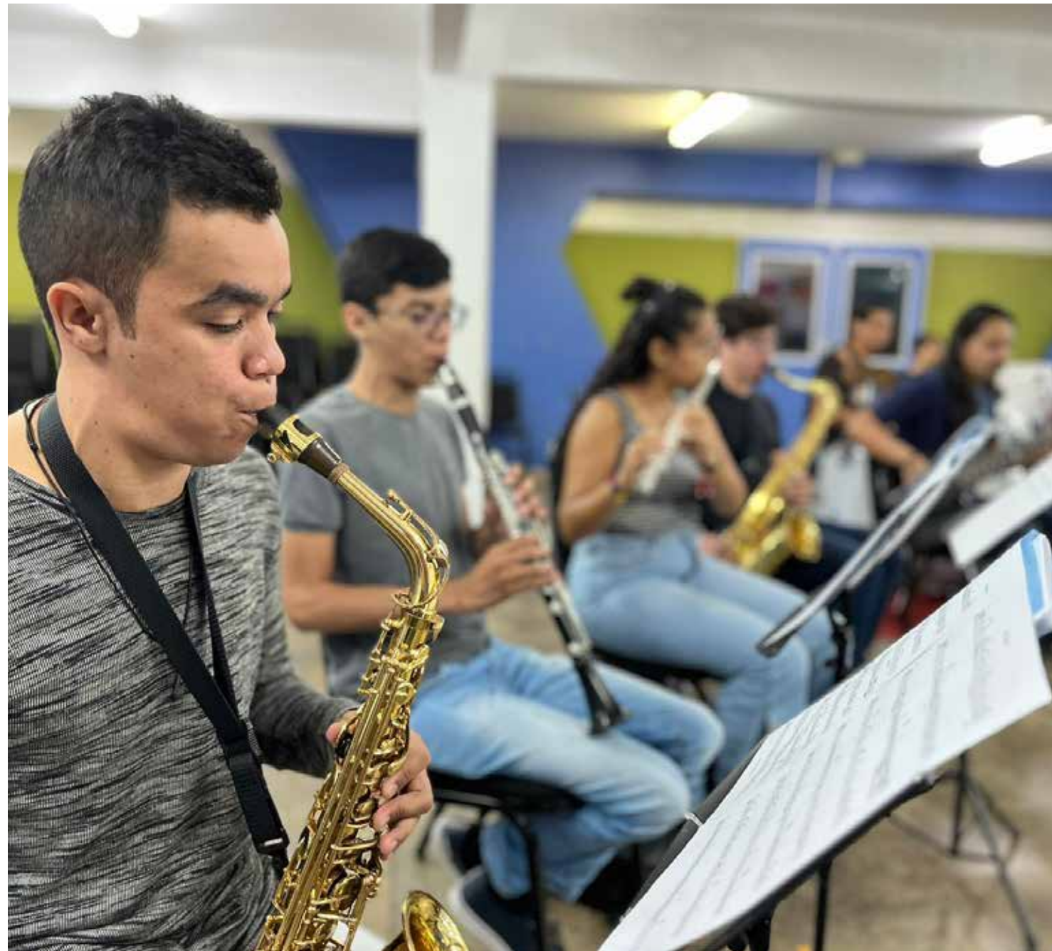
Apresentações são realizadas pelos alunos do Liceu de Artes e Ofícios Cláudio Santoro

“Nós estamos muito felizes e nos últimos preparativos. Estamos criando um espetáculo fantástico para a comunidade amazonense e também para os turistas. Esperamos muito que todos