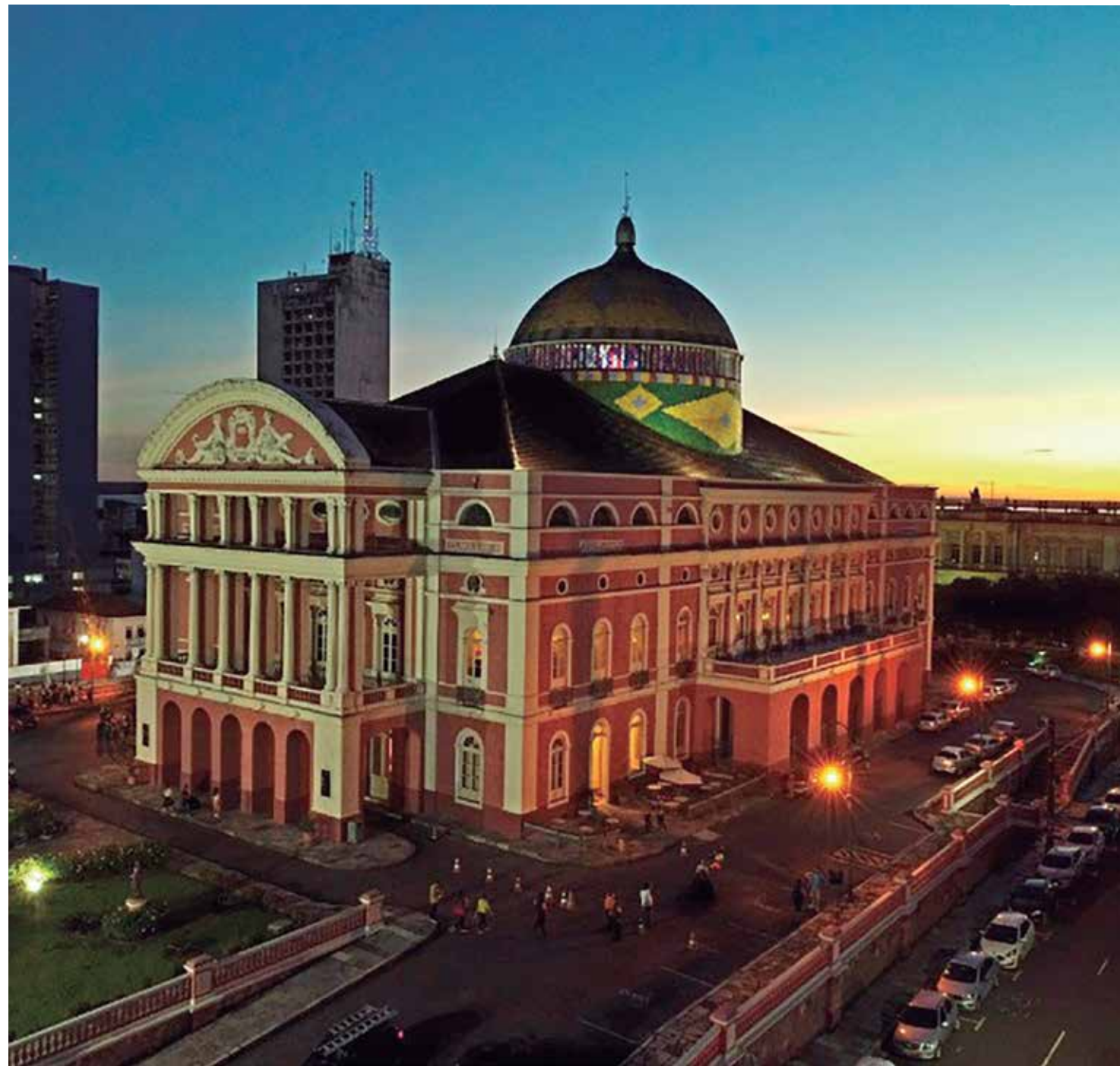
Manaus celebra 354 anos nesta terça-feira (24). Capital amazonense conta com programação variada durante a semana

No dia do aniversário de Manaus, às 9h desta terça-feira (24), os moradores da comunidade Água Branca 1, situada no KM 32 da rodovia AM-010, receberão dez qui-