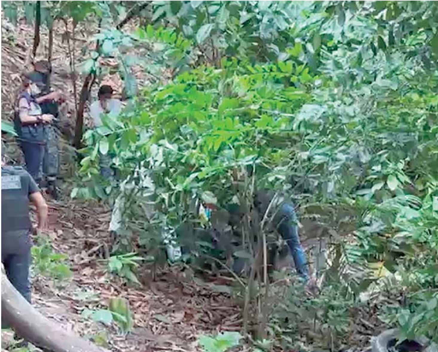
Polícia informou que a vítima estava enterrada em área de mata de difícil acesso

A equipe do Departamento de Polícia Técnica Científica (DPTC) e o Instituto Médico Legal (IML) foram acionados para realizar a perícia e fazer a remoção do corpo. A Delegacia Especializada em Homicídios e Sequestros (DEHS) está investigando o caso.