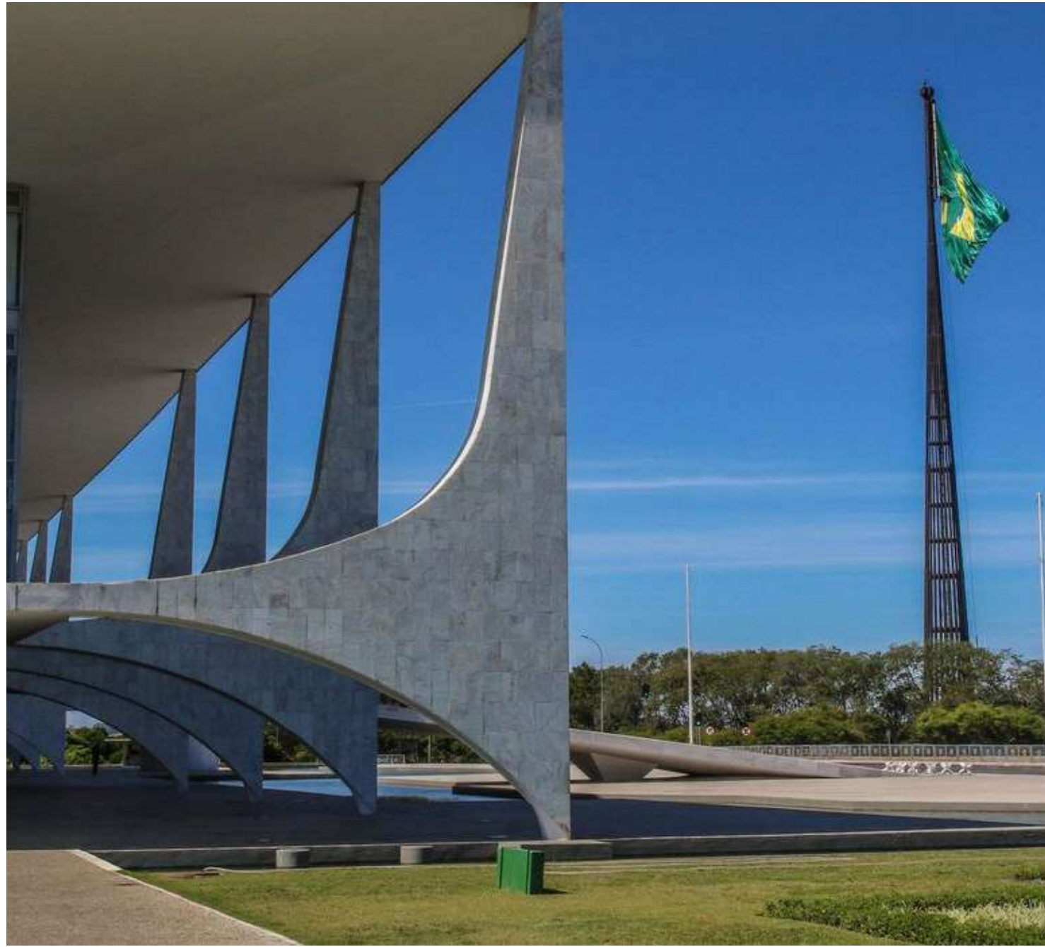
Os ataques já provocaram milhares de mortos, feridos e desabrigados nos dois territórios

De acordo com o Palácio do Planalto, Vladimir Putin comentou sobre a proposta brasileira no Conselho