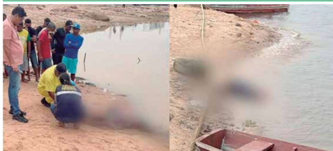
Corpos encontrados na área da Manaus Moderna

região. A Delegacia Especializada em Homicídios e Sequestros (DEHS) investiga os casos.