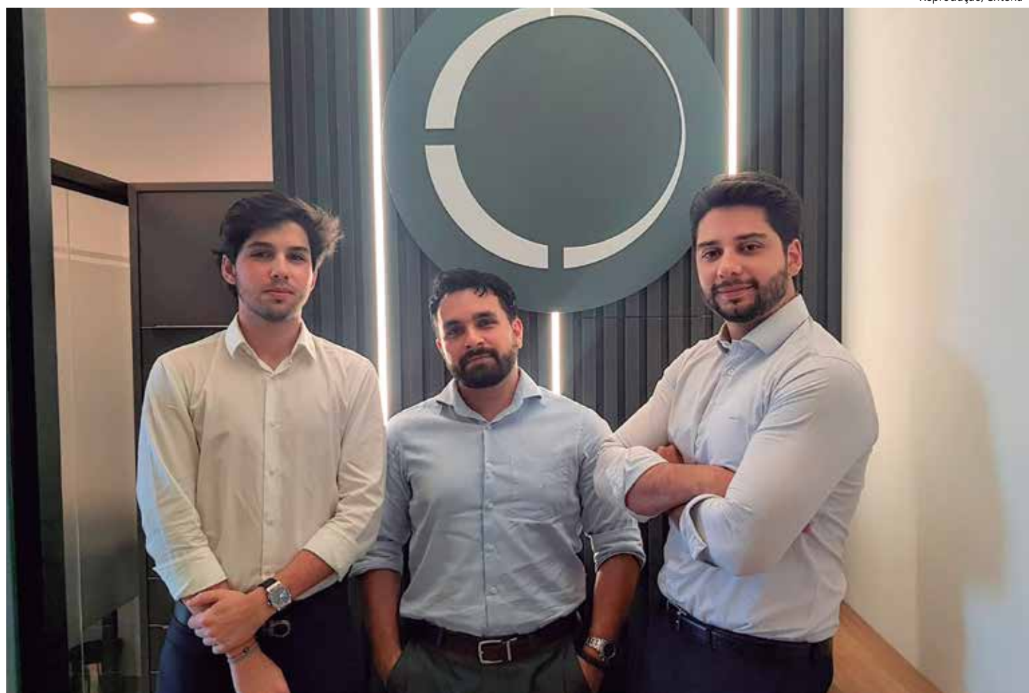
Criteria conta com Agentes Autônomos de Investimentos para atuação em Manaus

Além de assessorar clientes a Criteria oferece serviços de Crédito, Seguros, Câmbio e Fusões & Aquisições e atua com Renda Fixa, Fundos de Investimentos (como Cambial, de Ações, de Dívida Externa, entre outros), Fundos Imobiliários e Transferência de Recursos. Para quem busca começar a investir é importante, no entanto, ter os objetivos de vida muito bem alinhados a curto, médio e longo prazo, para estabelecer uma vida financeira mais saudável e rentável.