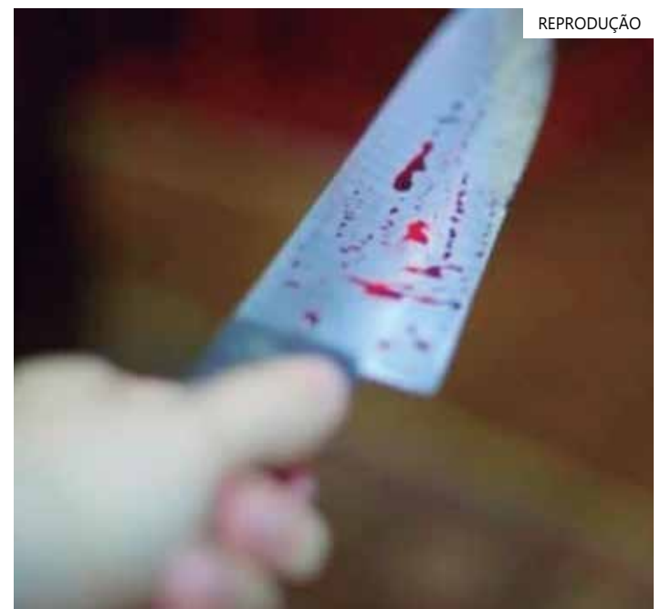
Caso aconteceu na zona norte da capital amazonense