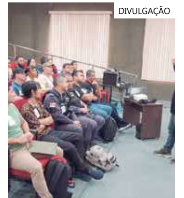
Curso será ministrado até sexta-feira (27)

"O objetivo do curso é capacitar os servidores de segurança pública a conduzir cães treinados em faro de narcóticos, busca e resgate, busca e captura e guarda e proteção. No final do curso haverá aula prática de busca de entorpecentes em ônibus e em embarcações", destaca Andrade.