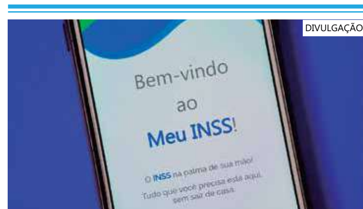
A redução foi aprovada pelo CNPS

R$ 2 bilhões a menos de crédito consignado na economia; uma queda anual de 27%", afirma ainda a nota. A Febraban e a ABBC (Associação Brasileira de Bancos) enviaram ofício -assinado na quinta (19)- ao ministro da Previdência, Carlos Lupi, afirmando que a criação de grupo de trabalho que discute os juros no país é acertada, mas que os estudos técnicos do setor financeiro não estão sendo considerados pela Previdência Social no GT.