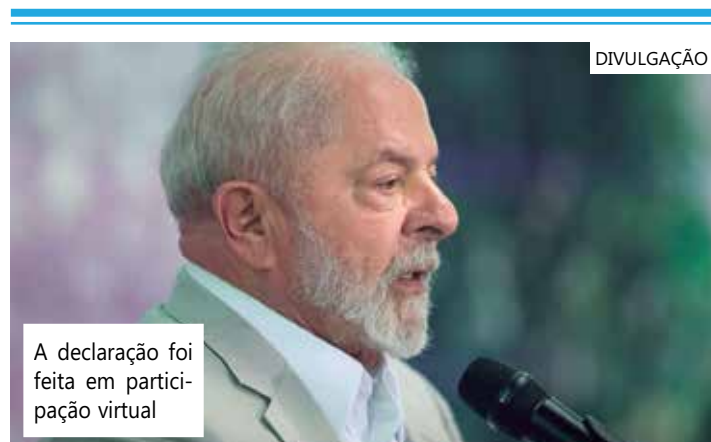
A declaração foi feita em participação virtual

O salário mínimo é a base de benefícios previdenciários e assistenciais. Seis em cada dez aposentados do INSS (Instituto Nacional do Seguro Social) recebem o piso, incluindo quem tem direito à aposentadoria, pensão ou auxílio. Além disso, o mínimo é o valor do BPC (Benefício de Prestação Continuada) pago a idosos carentes e pessoas com deficiência em situação de vulnerabilidade.