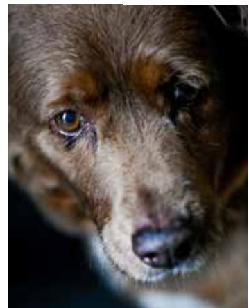
O patudo foi 'coroadado' pelo Guinness World Records