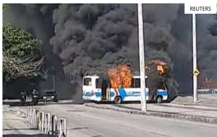
Há reflexos em pelo menos cinco bairros

de de hoje. Estão rodando apenas as linhas 22 (Jardim Oceânico x Alvorada); 13 (Mato Alto x Alvorada expresso) e 25 (Mato Alto x Alvorada parador). Um articulado da frota antiga foi incendiado. Houve tentativa de colocar fogo em um BRT da nova frota, mas o fogo foi apagado e o ônibus já está na garagem.