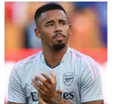
Gabriel Jesus é um atleta brasileiro que atua pelo Arsenal