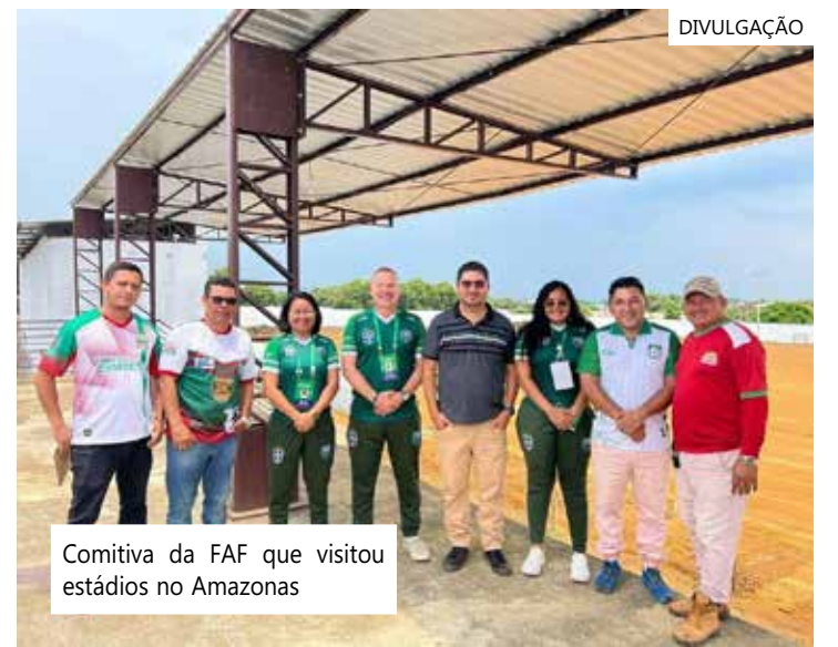
Comitiva da FAF que visitou estádios no Amazonas