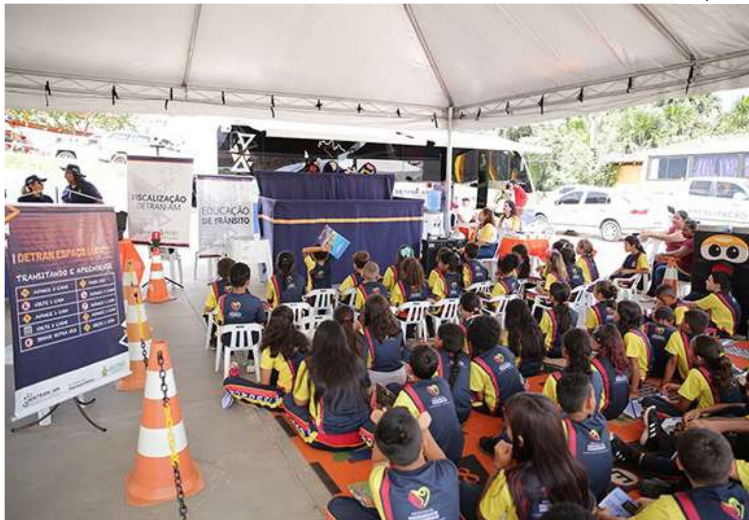
Na ocasião, serão oferecidos diversos serviços a população

O Detran Amazonas ofertará serviços relacionados a Carteira Nacional de Habilitação (CNH), onde será realizada renovação, mudança ou