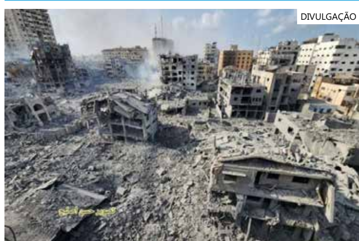
Completam 21 dias nesta sexta-feira dos bombardeios de Israel à Faixa de Gaza

Desde o início do conflito atual, mais de 1.400 israelenses foram mortos, a maioria no dia 7, e outras 200 pessoas foram feridas pelo Hamas, segundo o governo de Israel. Na Palestina, os mortos já somam mais de 7.300 pessoas, sendo 3.038 crianças, segundo dados do Ministério da Saúde de Gaza.