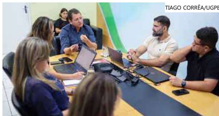
Reunião sobre o projeto modelo aconteceu na sede da Sedurb

Na próxima quarta-feira (1º), as equipes da Sedurb e da Sema estarão reunidas novamente para dar continuidade às tratativas do modelo a ser implantado.