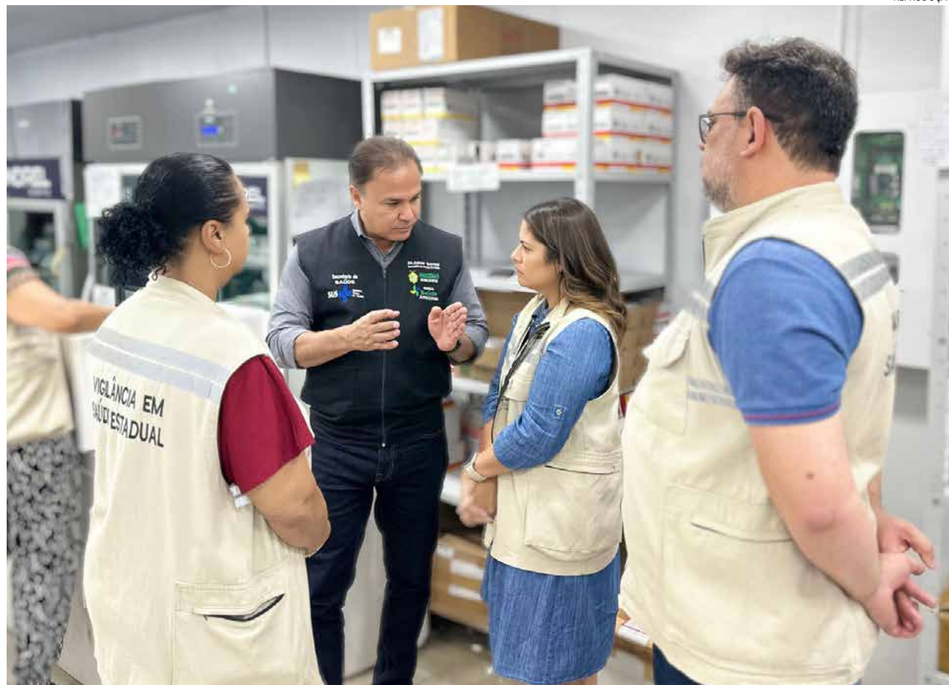
Vacinas foram armazenadas ainda na noite de sexta na Fundação de Vigilância em Saúde do Amazonas

Essa é mais uma oportunidade da população atualizar o esquema vacinal contra