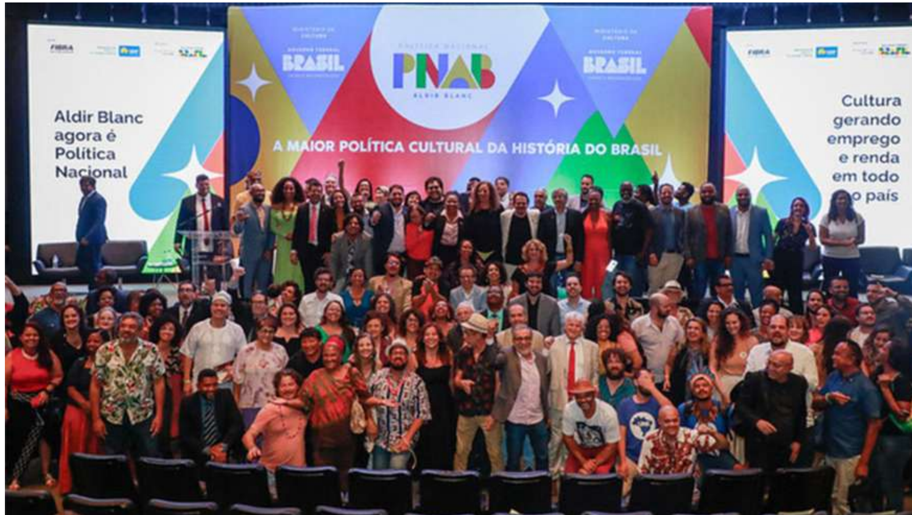
Artistas foram informados que terão R$ 3 bilhões ao ano por meio de editais

De acordo com o texto, para receber os recursos, os entes federativos e consórcios públicos intermunicipais precisarão cadastrar os planos de ação, com metas e ações,