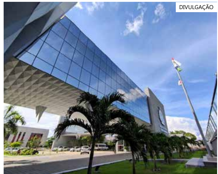
Objetivo do projeto é construir um cenário de combate à corrupção

Como parte desse projeto, foi criado um Canal de Denúncias, plataforma para relatar práticas irregulares, antiéticas, fraudes e qualquer forma de corrupção de forma anônima, com total confidencialidade.