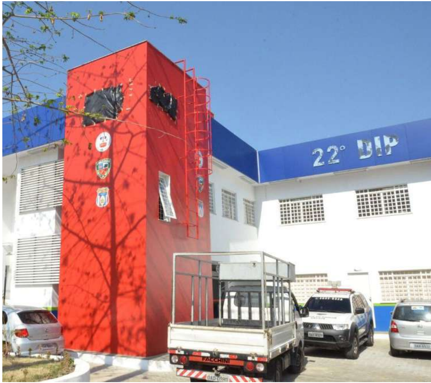
Suspeitos foram presos por agentes do 22º Distrito Integrado de Polícia (DIP)

“Tomamos conhecimento do roubo no momento em que o Boletim de Ocorrência (BO) foi formalizado e, de imediato, iniciamos as investigações e conseguimos identificar com quem estaria o veículo. Os três confessaram a ocorrência do crime, disseram que iriam enviá-lo para Boa Vista, no estado de Roraima, e acerca de mais detalhes, eles se