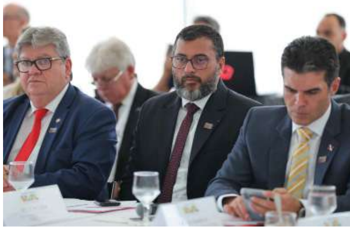
Governador do Amazonas, Wilson Lima participou, em Brasília da instalação do Conselho da Federação, realizado pelo presidente da República e foi empossado como suplente na cadeira de representante da Região Norte. "Essa iniciativa atende uma demanda nossa governadores e prefeitos, e tem como objetivo um enfrentamento conjunto dos problemas do país, como a seca histórica que o Amazonas enfrenta", disse Wilson Lima