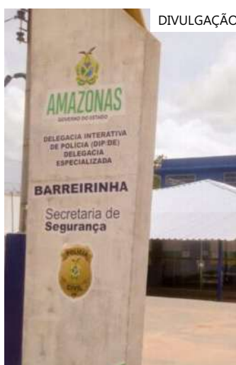
Suspeitos foram presos no município de Barreirinha

Todos foram conduzidos à 42ª DIP de Barreirinha e ficarão à disposição do Poder Judiciário.