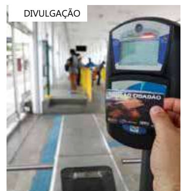
Renovação do cadastro deve ser feita no site do Sinetram

Após a atualização cadastral, o IMMU irá promover um treinamento com os responsáveis pelas escolas para orientá-los sobre como fazer o cadastro dos estudantes.