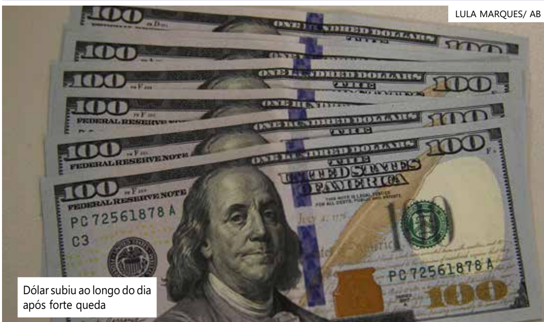
Dólar subiu ao longo do dia após forte queda

caiu para o menor nível em dois anos trouxe otimismo ao mercado global no início do dia. A inflação menor diminui as pressões para que o Federal Reserve (Fed, Banco Central norte-americano) aumente os juros básicos antes do fim do ano.