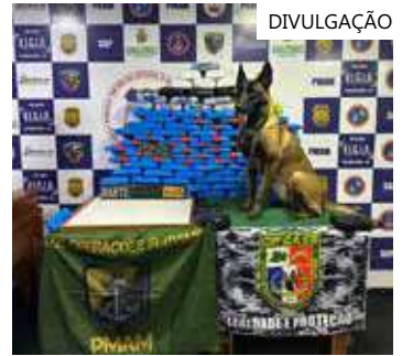
Droga foi encaminhada para a PC-AM, que investiga a origem

O material totaliza 10,8 quilos e 87 tabletes de pasta-base de cocaína, que pesaram 91,56 quilos. No total foram apreendidos 101 quilos de entorpecentes. Com a apreensão, a polícia estima ter causado danos de cerca de R$5.388.000 milhões ao crime. Toda a droga foi encaminhada para a Polícia Civil do Amazonas, que investiga a origem.