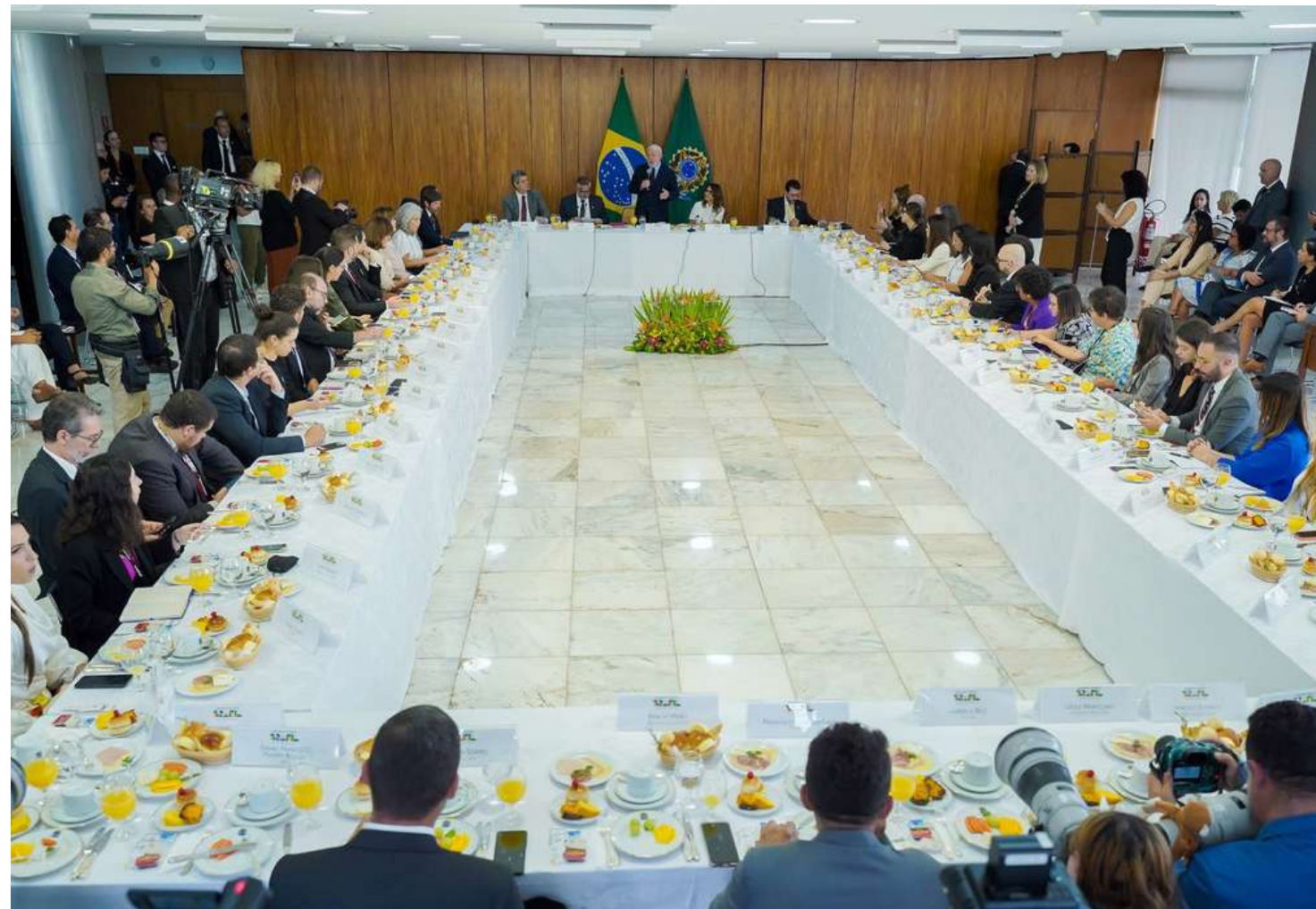
Fala foi durante um café com a imprensa na tarde de sexta (27)

Para Lula, faltou articulação em torno do nome. "Talvez tenha sido culpa minha por estar internado e não ter falado com nenhum senador sobre ele", disse. Nas últimas semanas, o presidente este-