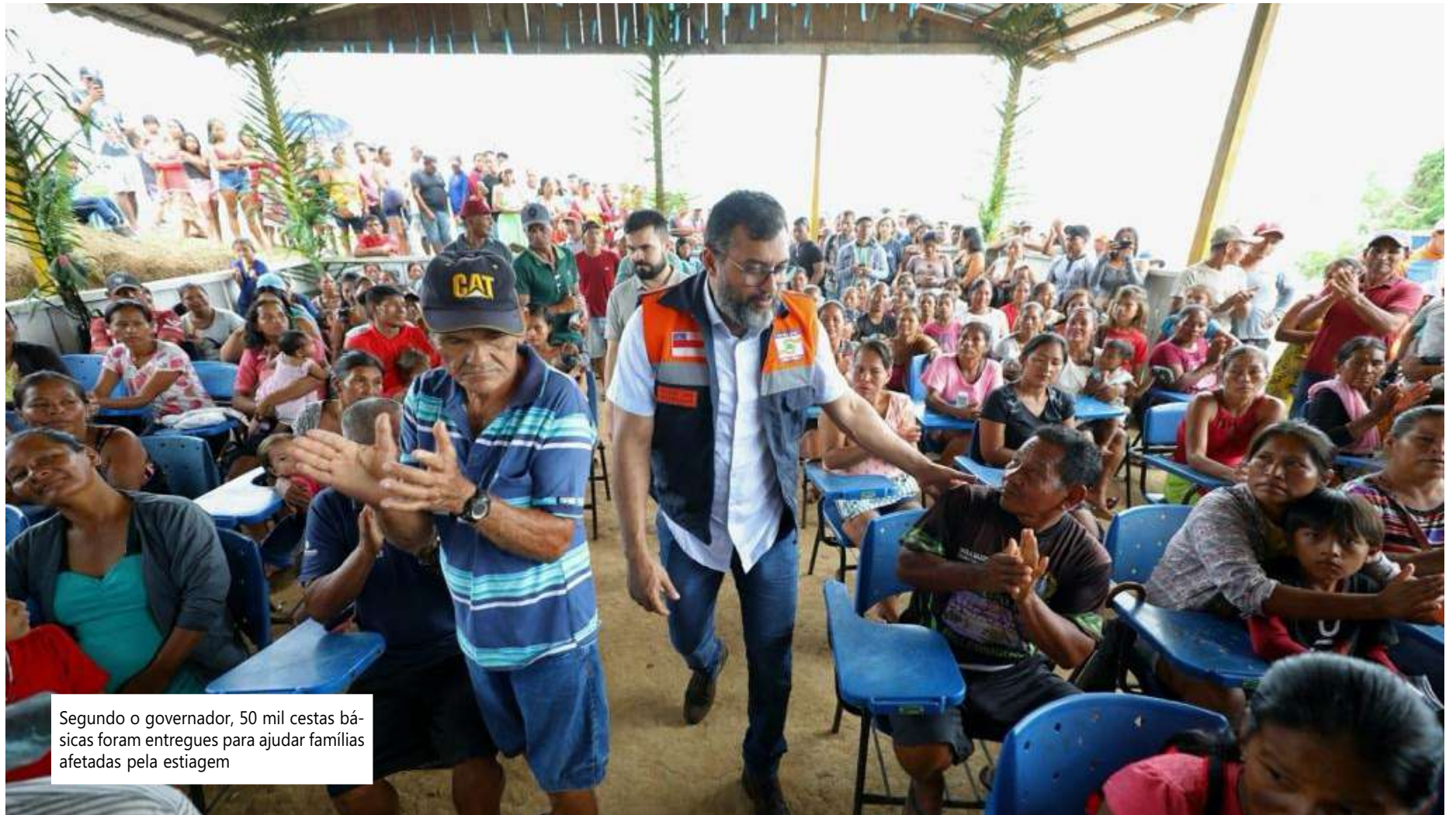
Segundo o governador, 50 mil cestas básicas foram entregues para ajudar famílias afetadas pela estiagem