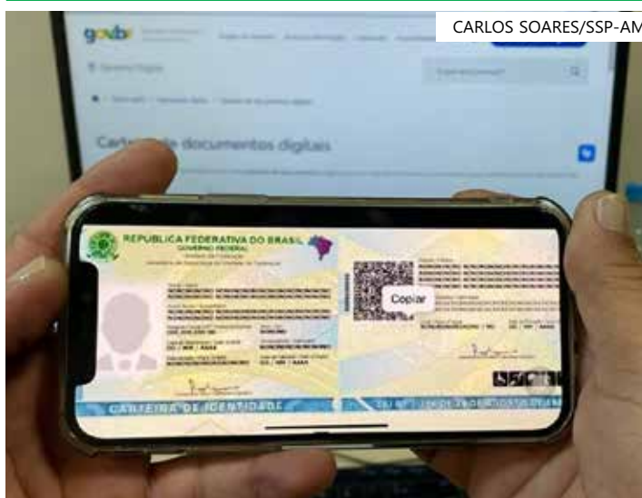
CIN Digital tem a mesma validade da CIN em formato físico

A CIN Digital oferece vantagens para os cidadãos e para o Sistema de Segurança Pública, tais como praticidade e agilidade, pois permite ao usuário ter a CIN na palma da mão a todo tempo; segurança, uma vez que utiliza recursos avançados como a criptografia, para proteção dos dados pessoais do cidadão; e possibilidade de compartilhamento, promovendo facilidade na hora de apresentar o documento, sem necessidade de fotocópia, podendo ser compartilhado diretamente do app ‘gov.br’.