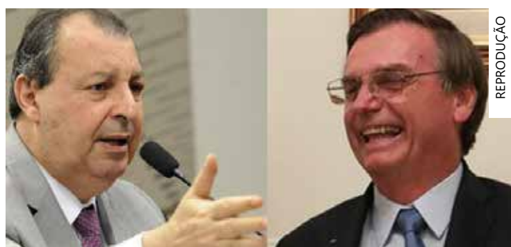
Omar moveu ação contra Bolsonaro em 2022 por falas contra ele

Na sexta-feira (27), a defesa de Bolsonaro apresentou um novo recurso para tentar reverter a decisão.