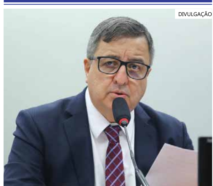
O deputado Danilo Forte (União-CE) é o relator do projeto na Câmara

Também durante as discussões dos dois projetos, deverá ser votado na Comissão de Orçamento o Plano Plurianual 2024-2027 (PLN 28/23), que faz o planejamento de médio prazo para os próximos quatro orçamentos anuais. O relator é o deputado Bohn Gass (PT-RS).