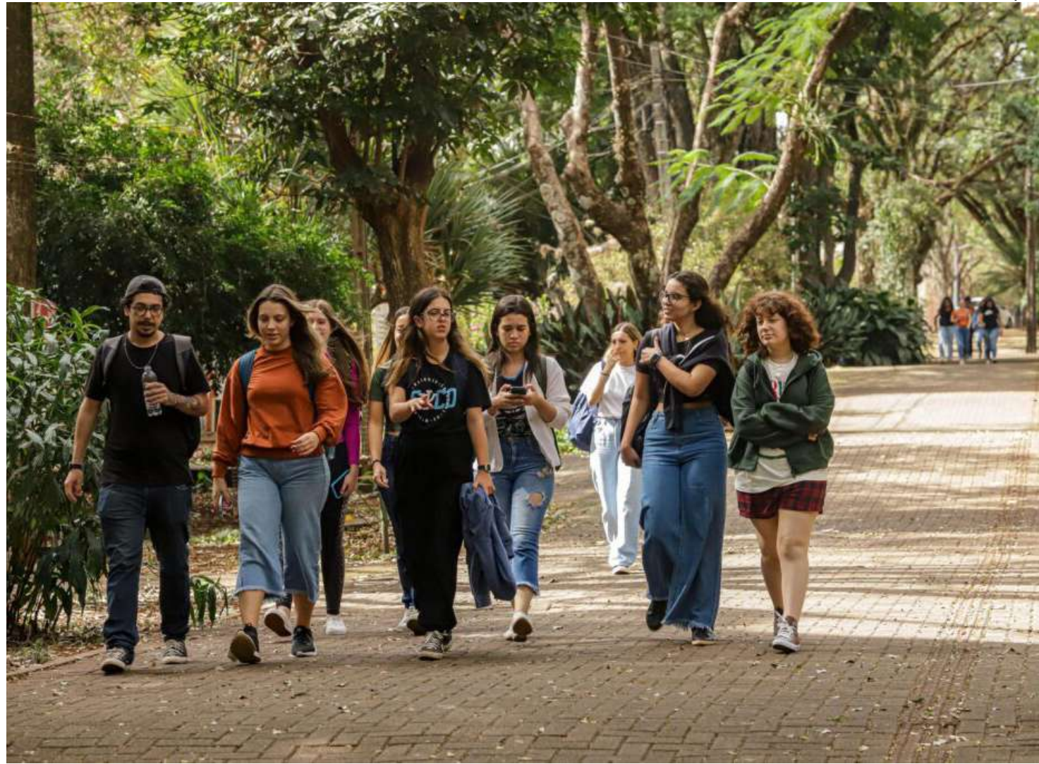
Brasil tem 6 milhões de mulheres a mais do que homens

O principal indicador usado pelo IBGE nessa categoria censitária é chamado "razão de sexo", que leva em consideração o número de homens em relação ao de mulheres. Se o número for menor do que 100, há mais mulheres. Se for maior do que 100, há mais homens. Se em 1980, havia 98,7 homens para cada 100 mulheres, em 2022 essa proporção passou a ser de 94,2 homens para cada 100 mulheres. Na divisão por regiões, a razão de sexo do Norte era 103,4 em 1980. No último Censo, em 2010, era 101,8. Agora,