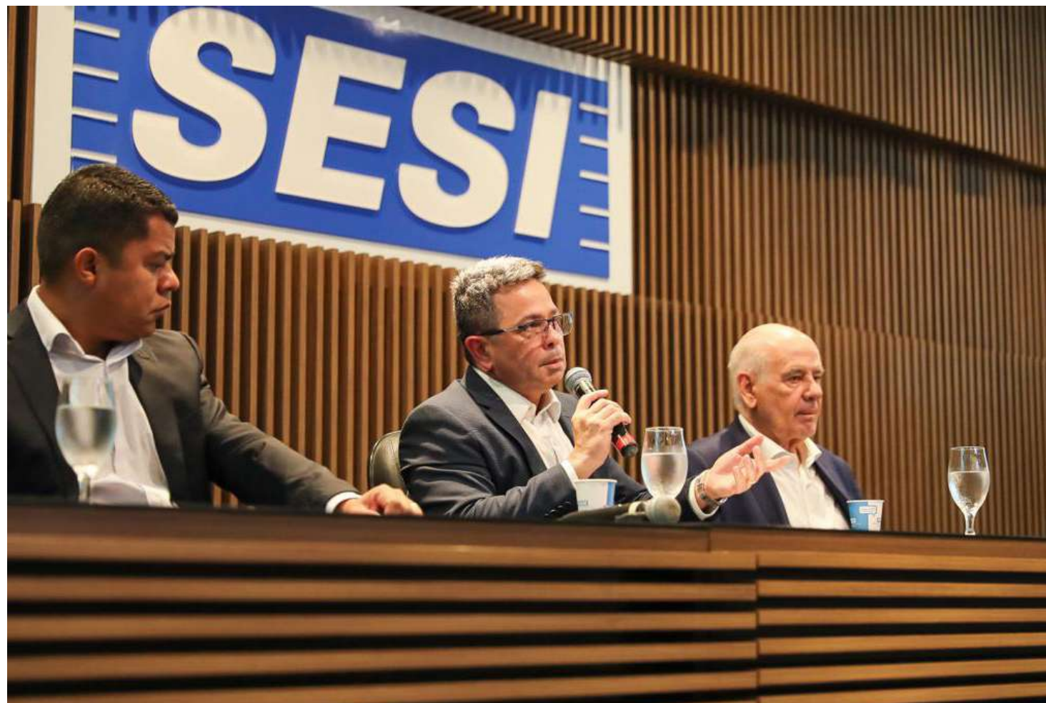
O vice-governador, Tadeu de Souza, fez um balanço dos trabalhos do Codam no decorrer do ano de 2023

cada pela aprovação de 35 projetos que contemplam os setores eletroeletrônico, termoplástico e de duas rodas do PIM. Do total, sete foram projeto de implantação, 22 de diversificação e oito de atualização. Além disso, os membros do Codam aprovaram outros 202 projetos que serão remanejados dentro da própria indústria.