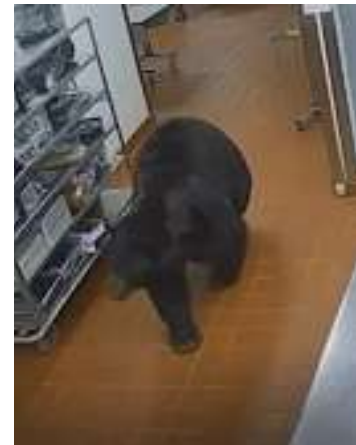
Caso aconteceu em um resort no Colorado