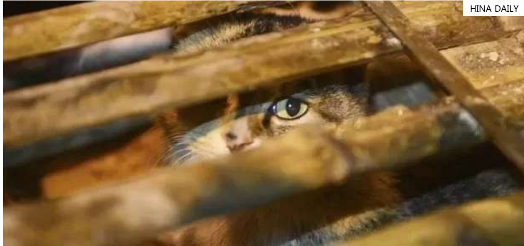
De acordo com o relatório da polícia local, os animais seriam abatidos e enviados para o sul do país