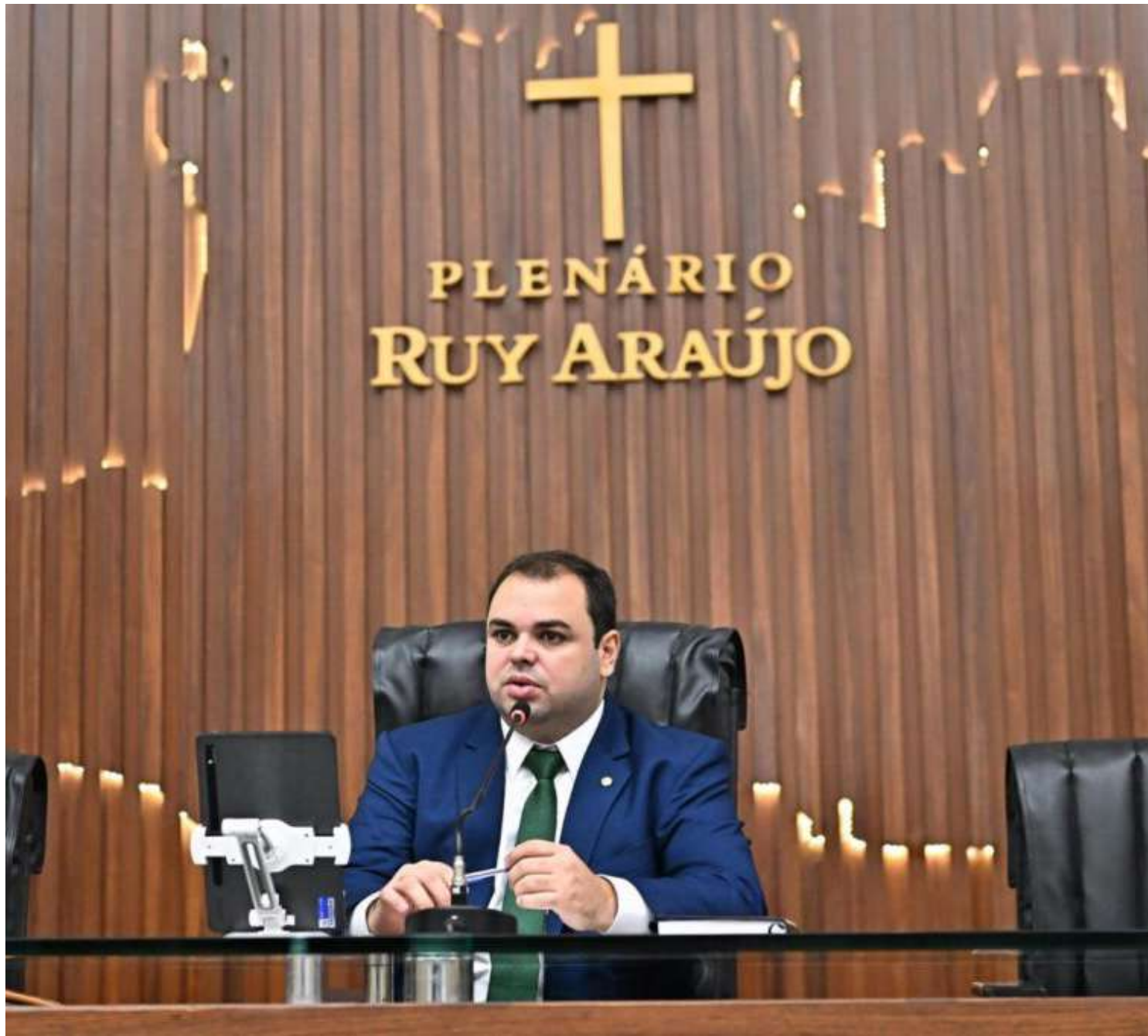
Roberto Cidade é um deputado estadual pelo Amazonas e preside a Assembleia Legislativa do estado

De acordo com a lei, a flexibilização ambiental compreende: a supressão de vegetação nativa secundária, em estágio inicial de regeneração; a supressão de exemplares arbóreos exóticos; a poda de árvores nativas cujos galhos invadam o acostamento ou a faixa de rolamento, encubram a sinalização ou ofereçam risco iminente à segurança; a estabilização