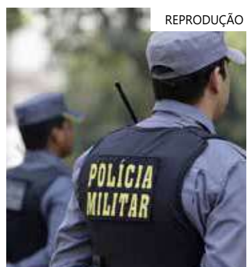
PL muda regimento de policias militares de todos os estados

Entre outros tópicos, o projeto fixa ainda como garantia o recebimento, pelo cônjuge ou dependente, da pensão do militar ativo, da reserva ou reformado correspondente ao posto ou patente que possuía, com valor proporcional ao tempo de serviço; e auxílio funeral por morte do cônjuge e do dependente.