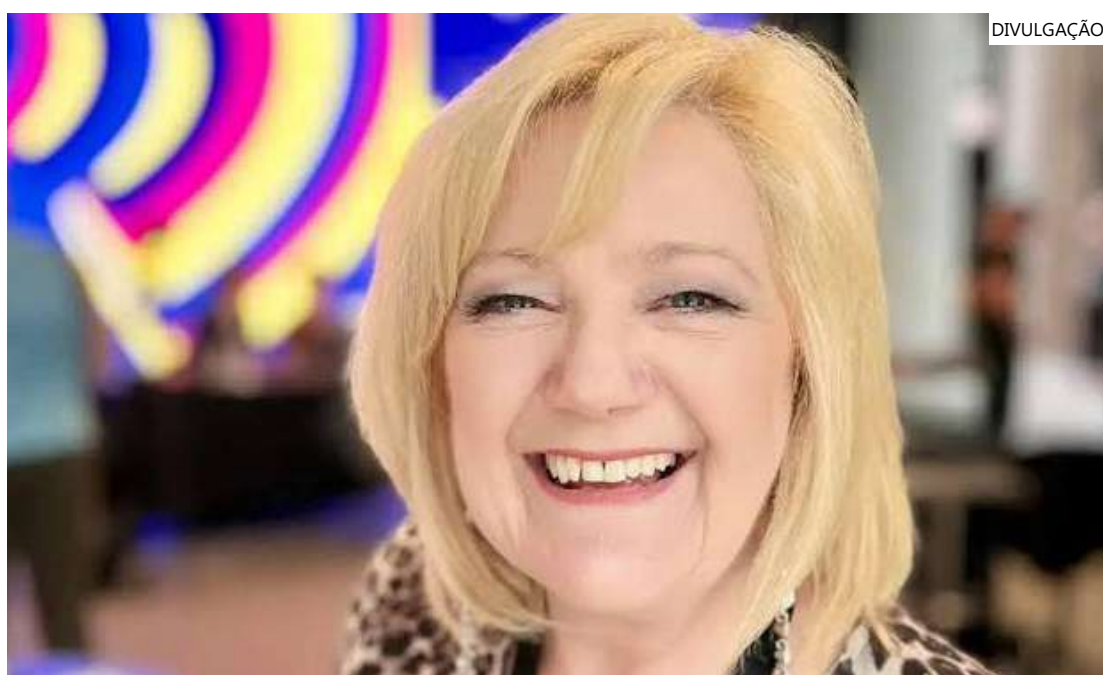
Nicky French será a atração internacional do Flash Back Day