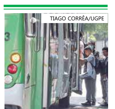
Convênio garante a gratuidade do transporte público para estudantes

Desde que passou a vigorar o Passe Livre Estudantil, o Governo já repassou ao município R$ 218,2 milhões, conforme balanço da UGPE. Foram repassados R$ 118,2 milhões no ano passado, com contrapartida municipal de R$ 36 milhões. Para este ano, serão R$ 120 milhões do Estado e contrapartida de R$ 36 milhões do Município.