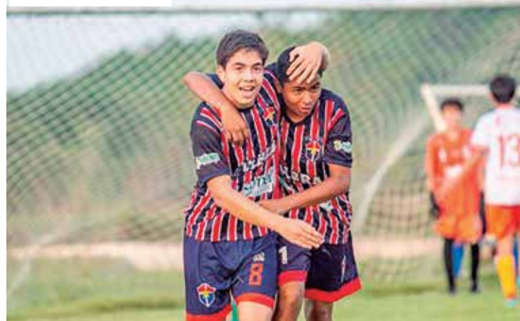
O time do Fast sub-14 venceu seu último jogo e se classificou