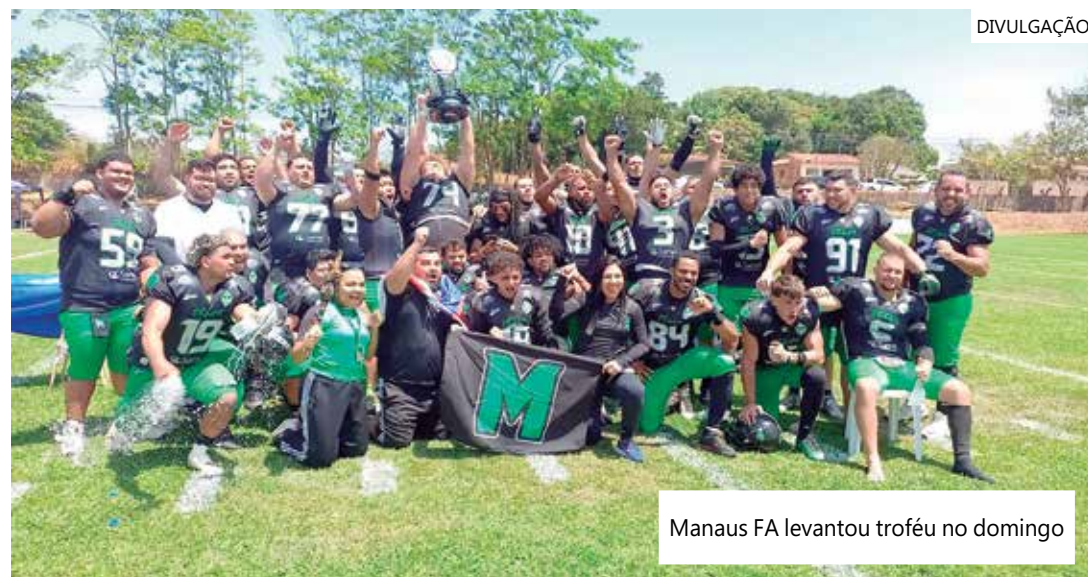
Manaus FA levantou troféu no domingo

regional, o time amazonense garantiu vaga no wildcard dos playoffs nacionais, onde enfrentará a equipe do Sorriso Hornets-MT, campeão da Conferência Centro-Oeste. A partida está marcada para acontecer dia 12 de novembro, às 14h, em Manaus, que pela primeira vez receberá um jogo de playoff nacional.