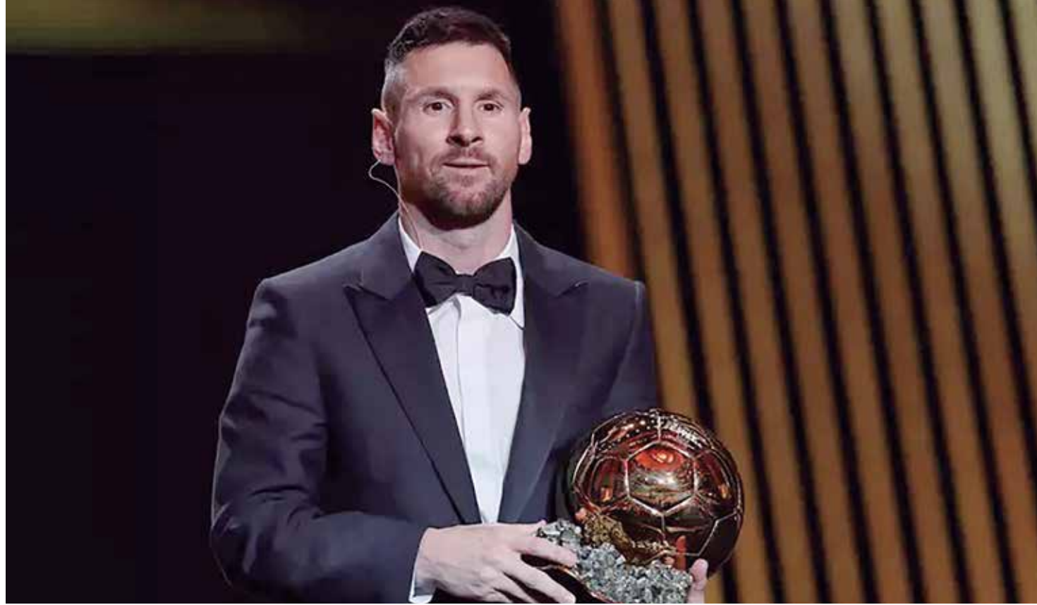
O argentino Lionel Messi subiu ao palco para receber a sua 8ª Bola de Ouro na carreira

O melhor do mundo também elogiou Mbappé e Haaland: "Esse prêmio com certeza será de vocês nos próximos anos. Vou desfrutar muito. Sei que o futebol vai continuar crescendo. Os