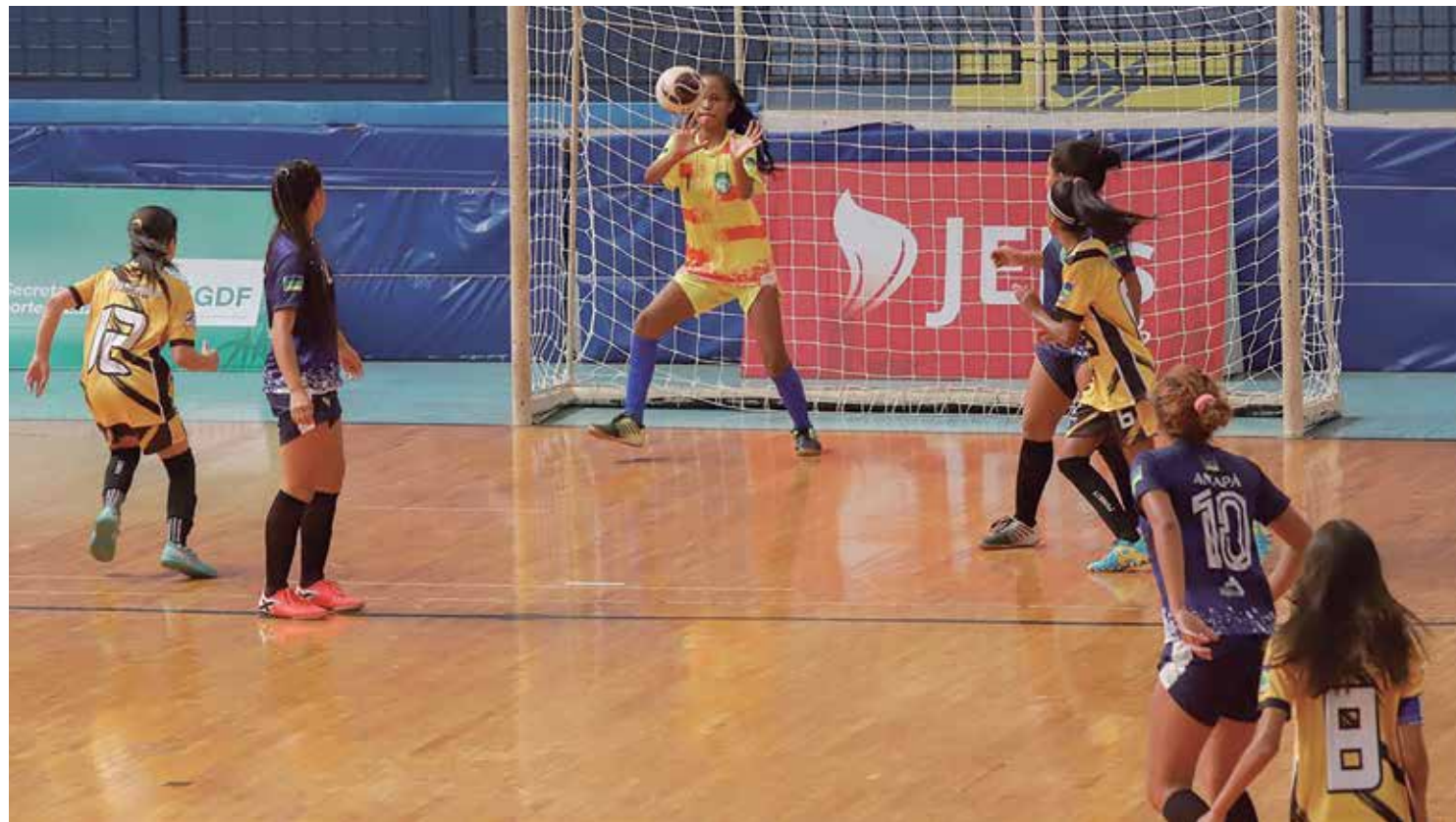
Entre as modalidades dos jogos escolares está o futsal

Desde sábado (28), as competições estão sendo realizadas em 19 espaços esportivos diferentes da capital federal. O assessor técnico da Confederação Brasileira de Desporto Escolar (CBDE), Victor Beltrão, explicou a escolha da cidade para sediar os jogos. "Brasília tem muitos lugares bons para conhecer, muitas quadras bacanas. Estamos presentes em vários clubes, com ambientes bem diferenciados. Em Brasília, temos a oportunidade de expandir as competições para mais locais e, assim, conhecer