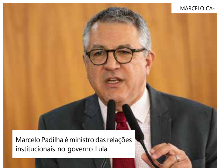
Marcelo Padilha é ministro das relações institucionais no governo Lula

Para 2023, a Lei de Diretrizes Orçamentárias (LDO) estabelece meta de déficit primário de R$ 231,5 bilhões para o Governo Central (Tesouro Nacional, Previdência Social e Banco Central). Segundo Padilha, o ambiente econômico e o início da trajetória decrescente da taxa básica de juros, a Selic, mostram que o déficit “não afeta o equilíbrio macroeconômico” do país.