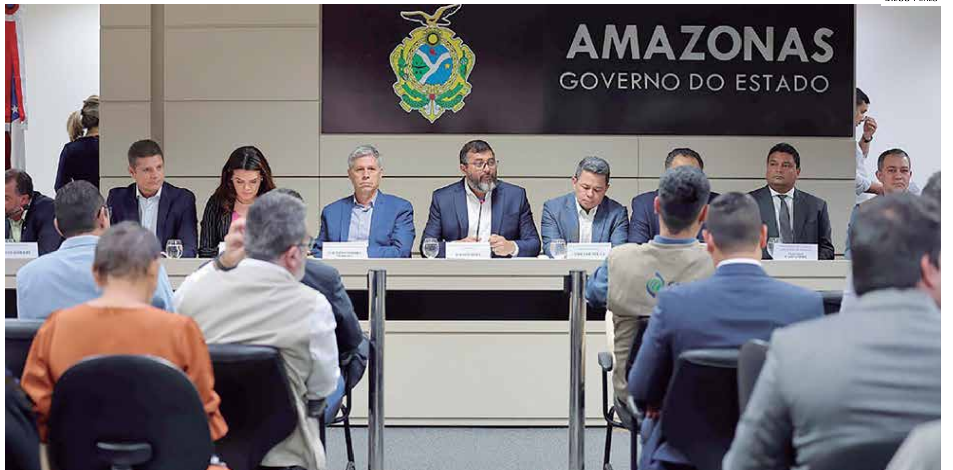
Governador se reuniu com o ministro Paulo Teixeira e equipe, que estão em Manaus para tratar de ações relacionadas ao enfrentamento da estiagem

"Tem um assunto que é muito caro para a Amazônia como um todo, que é