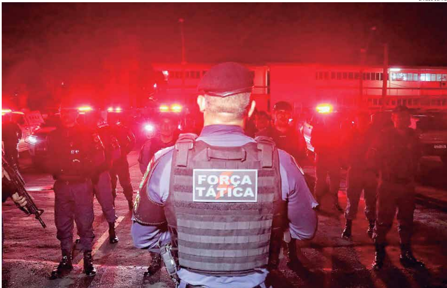
Ciops registrou a prisão de pessoas envolvidas em crimes de tráfico de drogas, roubo, tentativa de homicídio, dentre outros