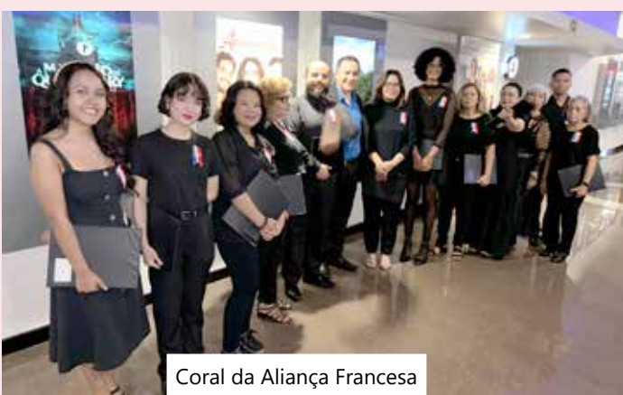
Coral da Aliança Francesa