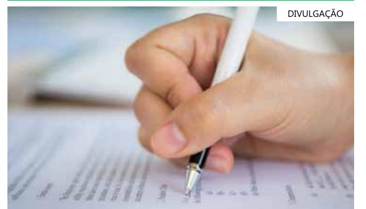
Edital visa à ampliação de atendimento dos programas permanentes da FDT

O último concurso público para a FDT foi realizado em 2012. Para tirar dúvidas, a FDT disponibiliza o número de WhatsApp (92) 98844-5651, de segunda a sexta, das 8h às 17h, e via e-mail (concurso.fdt@pmm.am.gov.br).