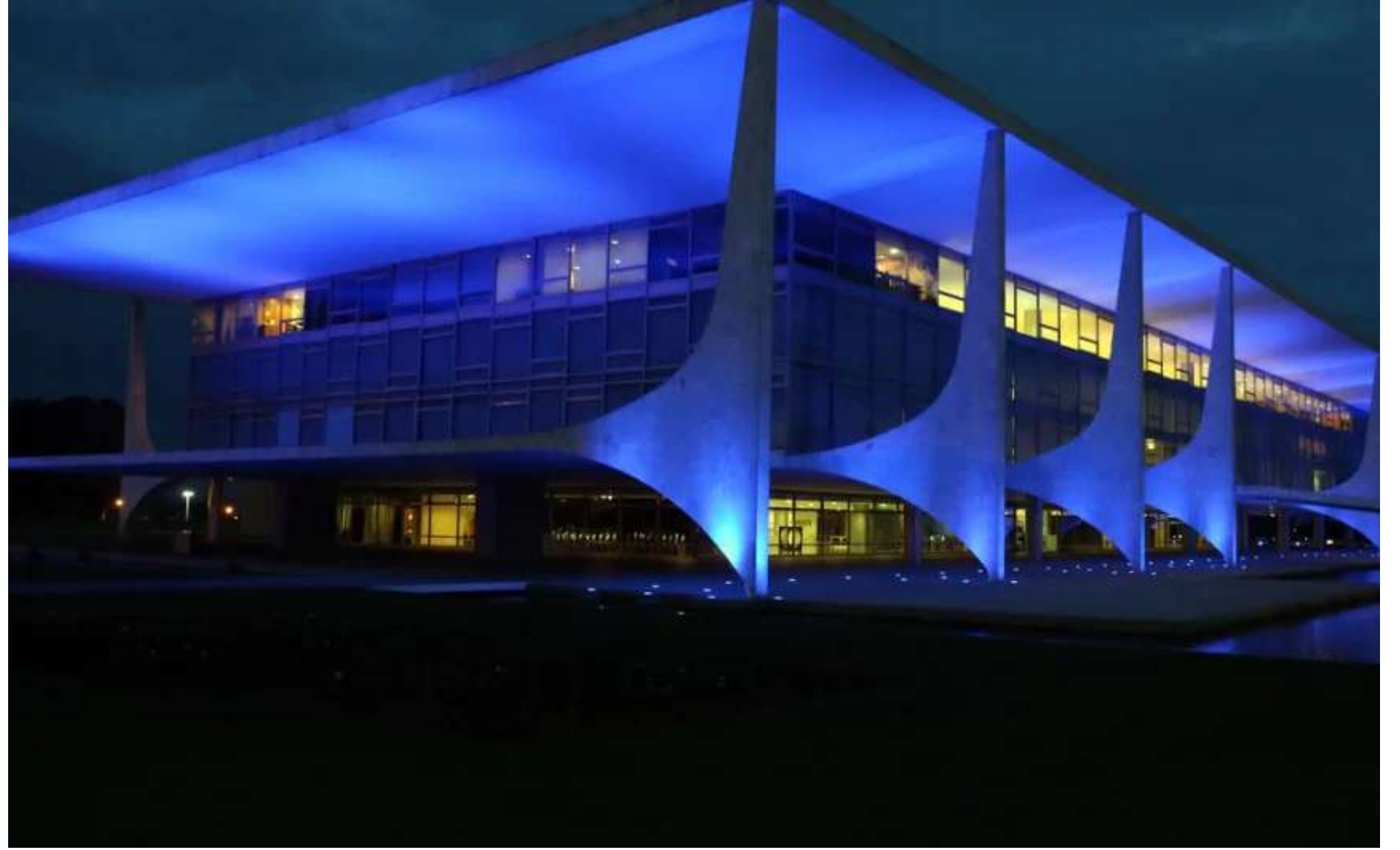
Campanha alerta para prevenção e informação contra doenças urológicas

"Vem trazer a mensagem de que, antes mesmo de surgirem os problemas de saúde, que sabidamente vão se tornando mais prevalentes com o passar da idade, ele se engaje nos cuidados gerais e preventivos, incluindo a saúde prostática, até para poder usufruir da vida como ele mesmo de-