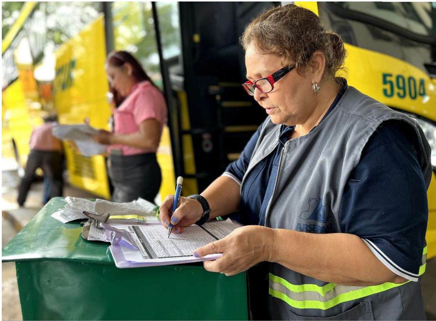
Arsepam projeta que um número superior a 18 mil pessoas utilize os serviços intermunicipais, no período de 2 a 5 de novembro