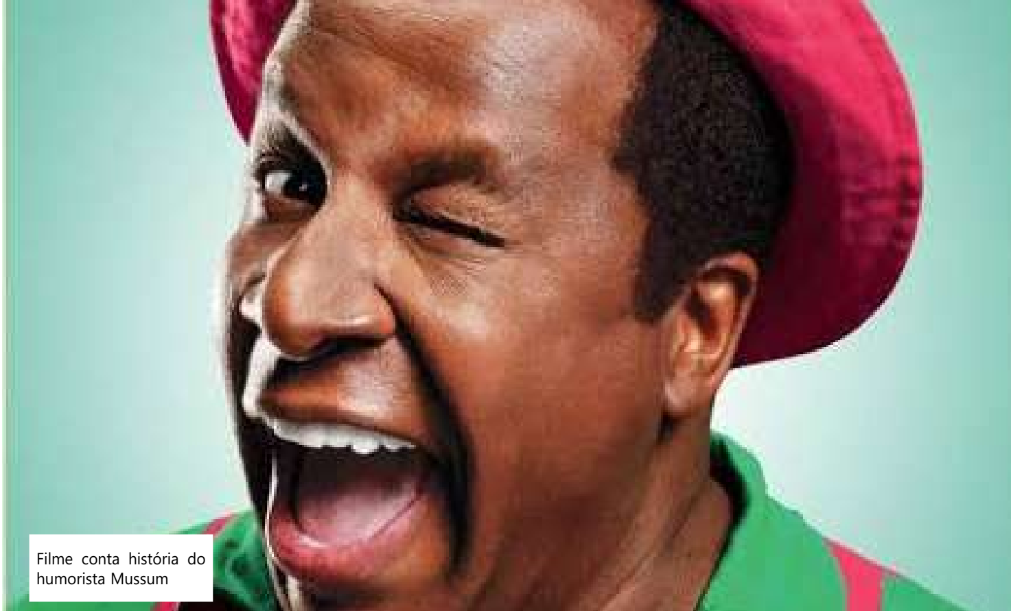
Filme conta história do humorista Mussum

Seja sozinho ou acompanhado, a experiência de ver um filme no cinema é sempre inesquecível. E o Cinépolis do Millennium Shopping contou com estreias imperdíveis na quinta-feira (2): Taylor Swift - The Eras Tour, Mussum - O Filmis, Não Abra!, e Nefarious (com sessões apenas segunda e terça). "Entre as vantagens da Cinépolis do Millennium Shopping estão o conforto e a comodidade que o consumidor possui em poder estacionar praticamente na porta do cinema", destacou a coordenadora de marketing do centro de compras, Elizandra Xavier. A produção nacional Mussum - O Filmis está entre os mais aguardados pelos cinéfilos e nostálgicos, isso porque traz a trajetória de Antônio Carlos Bernardes Gomes, o Mussum, de Os Trapalhões. O filme destaca a infância