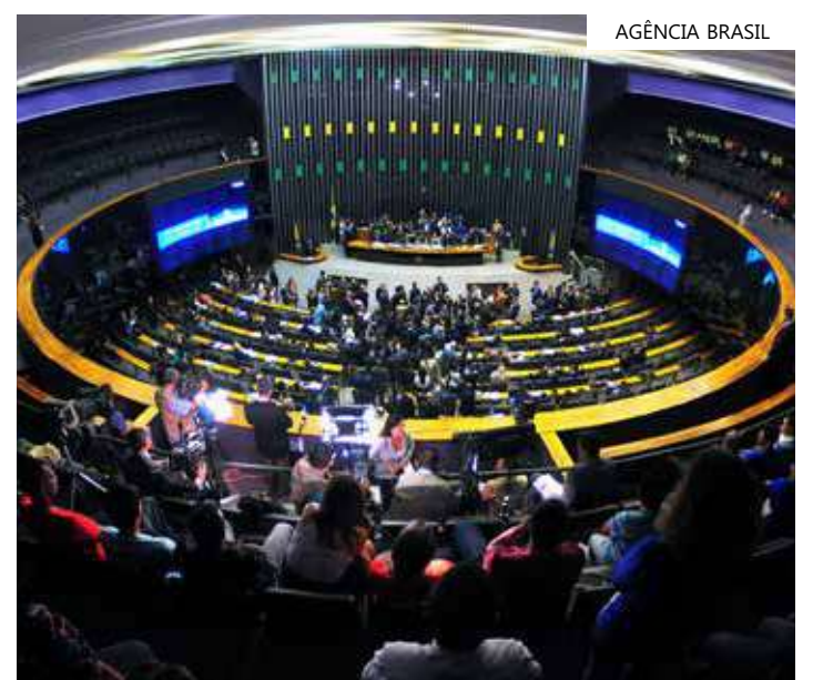
Bancada dá mais força política a alguns deputados federais

O relator acrescentou que a bancada não significará custo adicional para a Câmara, por não demandar cargos, salas ou assessoria.