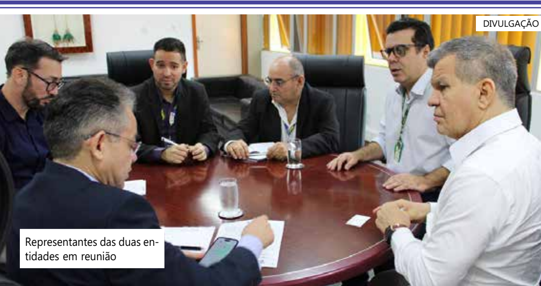
Representantes das duas entidades em reunião