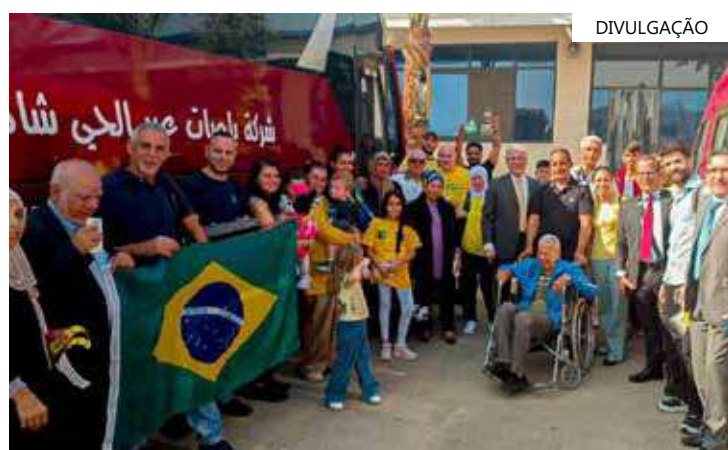
Eles serão repatriados no âmbito da Operação Voltando em Paz

Com isso, o total de brasileiros repatriados da região do conflito chega a 1.446. Foram oito voos patrocinados pelo governo brasileiro. Outro grupo, de 34 brasileiros e familiares, ainda aguarda para deixar a Faixa de Gaza. Eles estão no Sul do enclave, nas cidades de Khan Yunis e Rafah, próximos à fronteira com o Egito.