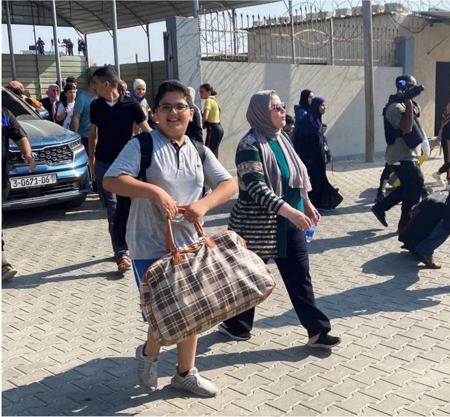
Cerca de 500 pessoas passaram pelo estreito de Rafah

Antes, um primeiro grupo de feridos atravessou a passagem em ambulâncias e foi examinado por equipes médicas egípcias que os encaminharam para diferentes hospitais, dependendo da gravidade do estado de saúde.