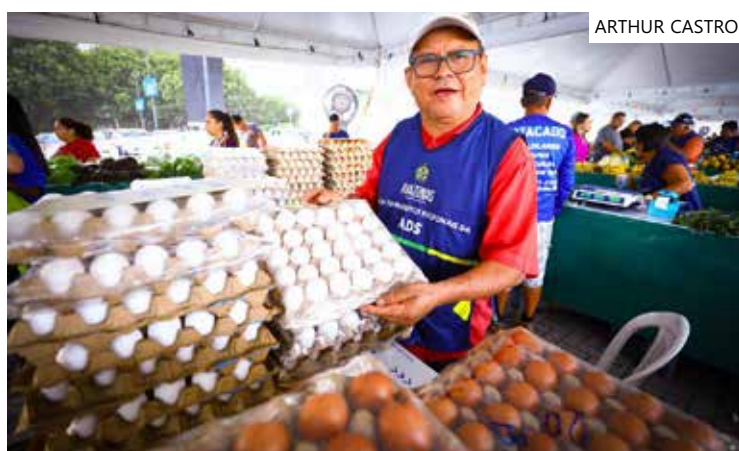
Feiras que acontecem na quinta e sexta serão suspensas esta semana

da Ponta Negra, bairro Ponta Negra; Rodovia AM-010, km 29 - sentido Rio Preto da Eva (domingo, das 6h às 12h).