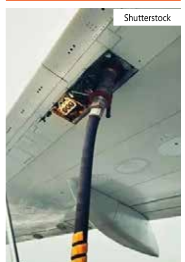
Preços do QAV são reajustados mensalmente

portam e comercializam os produtos para as empresas de transporte aéreo e outros consumidores finais nos aeroportos ou para os revendedores. Distribuidoras e revendedores são os responsáveis pelas instalações nos aeroportos e pelos serviços de abastecimento, destacou a empresa, ressaltando que o mercado brasileiro é aberto à livre concorrência.