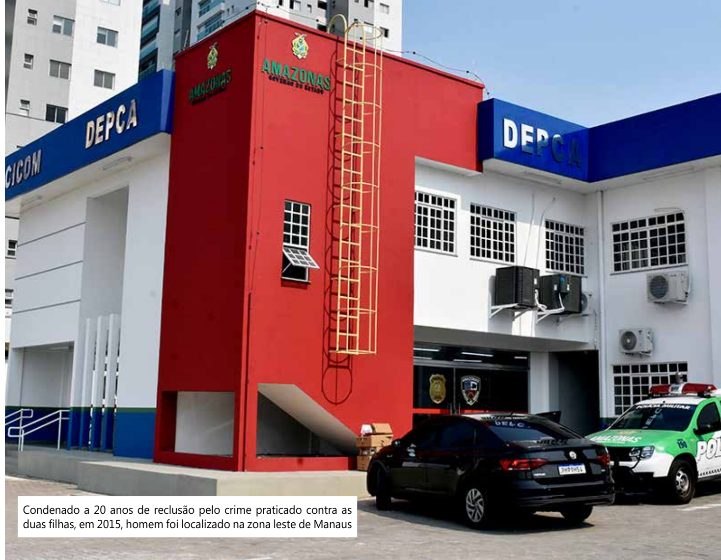
Condenado a 20 anos de reclusão pelo crime praticado contra as duas filhas, em 2015, homem foi localizado na zona leste de Manaus

“Após isso, elas passaram a ser vítimas dos abusos sexuais e maus-tratos, desde os seis e sete anos [de idade]. Elas eram agredidas fisicamente pelo pai que tinha temperamento agressivo. O homem batia nelas como forma de corretivo, ou quando elas recusavam o ato sexual”,