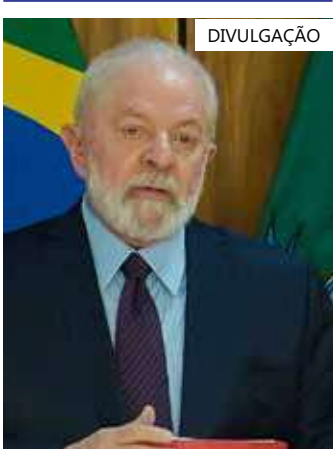
O presidente da República Luiz Inácio Lula da Silva

a Presidência, na priorização de obras, serão observados critérios como percentual de execução, ano de contratação, se a instituição atende comunidades rurais, indígenas ou quilombolas e também se o município sofreu desastres naturais nos últimos dez anos. Obras com irregularidades poderão ser incluídas no plano, desde que não haja prejuízo para a apuração de responsabilidades sobre as falhas.