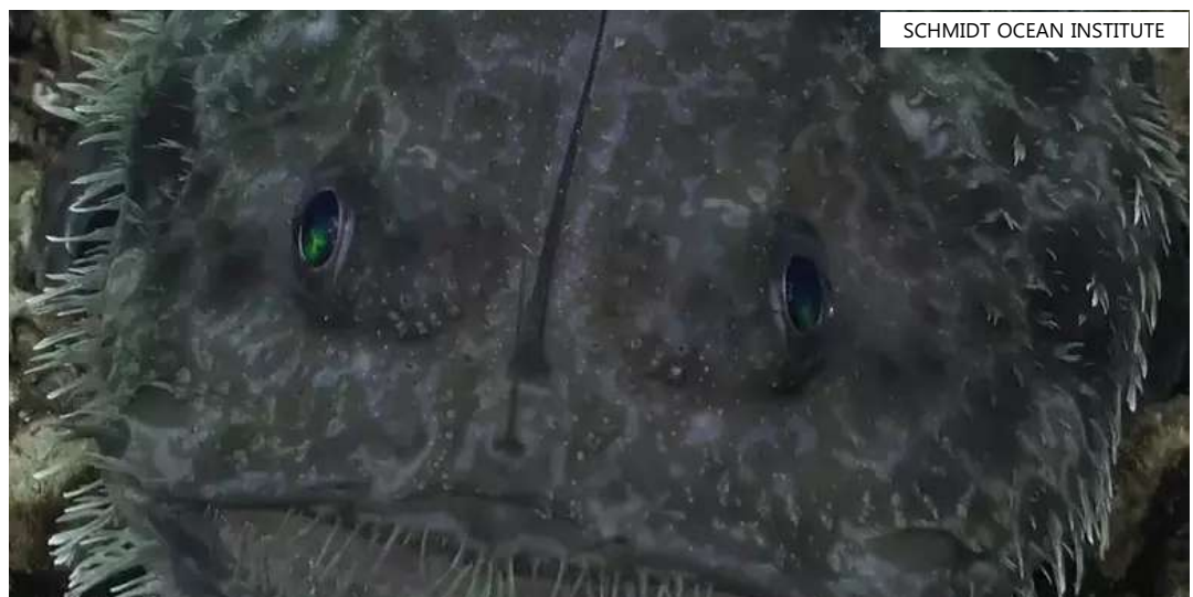
As fotos foram feitas durante uma expedição dirigida pelo Schmidt Ocean Institute

O nome "demônios do mar" foi dado pelos pescadores por causa de sua aparência monstruosa, segundo a Oceanscape Network .