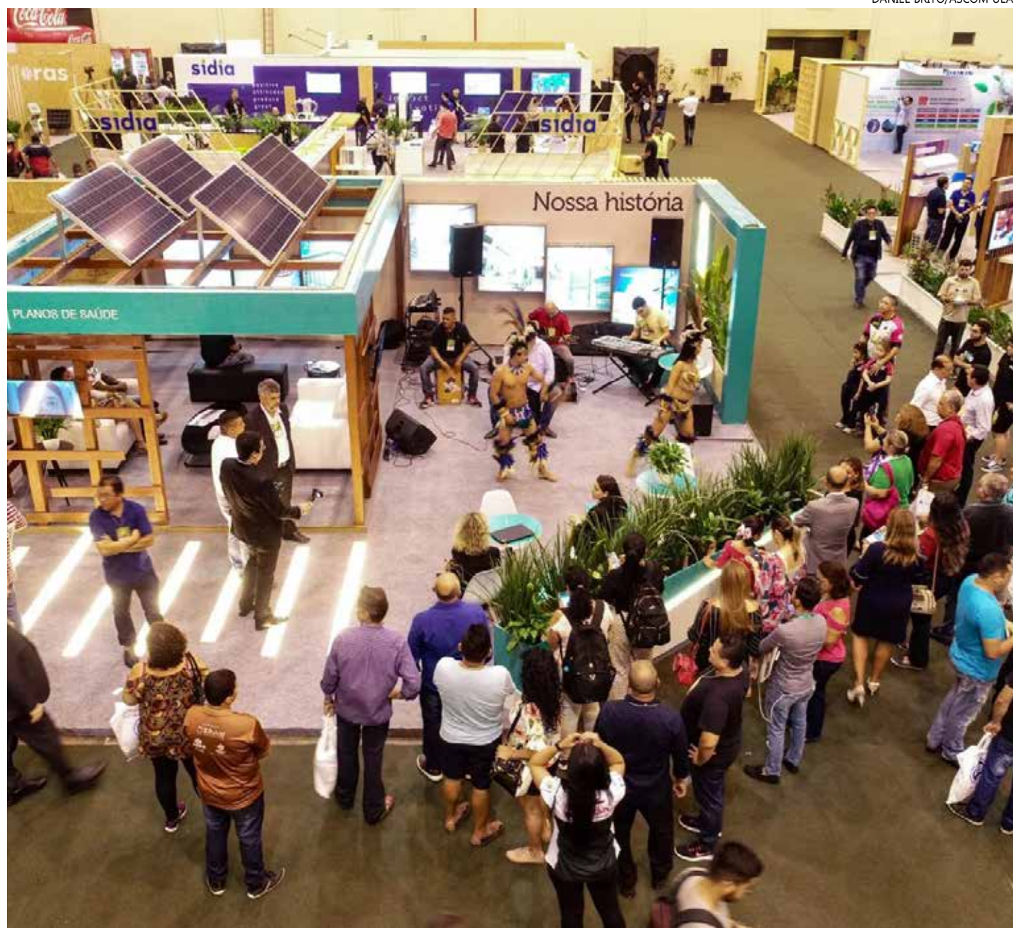
Evento será realizado entre os dias 7 e 9 de novembro, no Centro de Convenções Ulysses Guimarães, em Brasília

As pesquisas são desenvolvidas em diferentes unidades acadêmicas da UEA: Escola Superior de Tecnologia (EST), Escola Superior de Ciências Sociais (ESO),