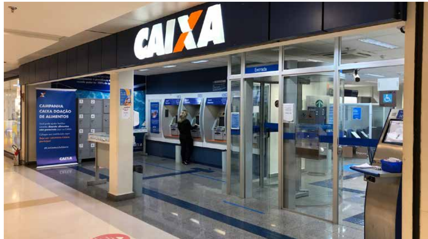
De acordo com a Fidalgo Leilões, a maioria dos imóveis foi retomados devido à inadimplência do financiamento e taxas condominiais

Os leilões extrajudiciais são organizados pela Fi-