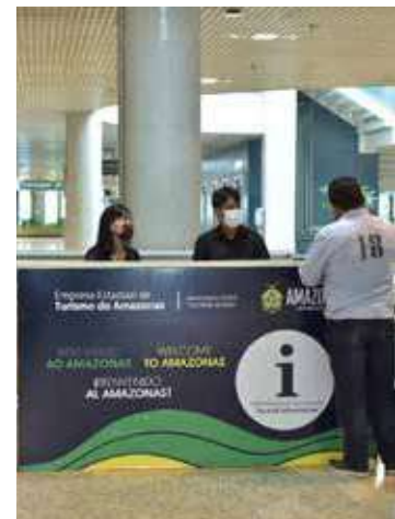
Vagas são para estágio com jornada de 6h diárias de trabalho