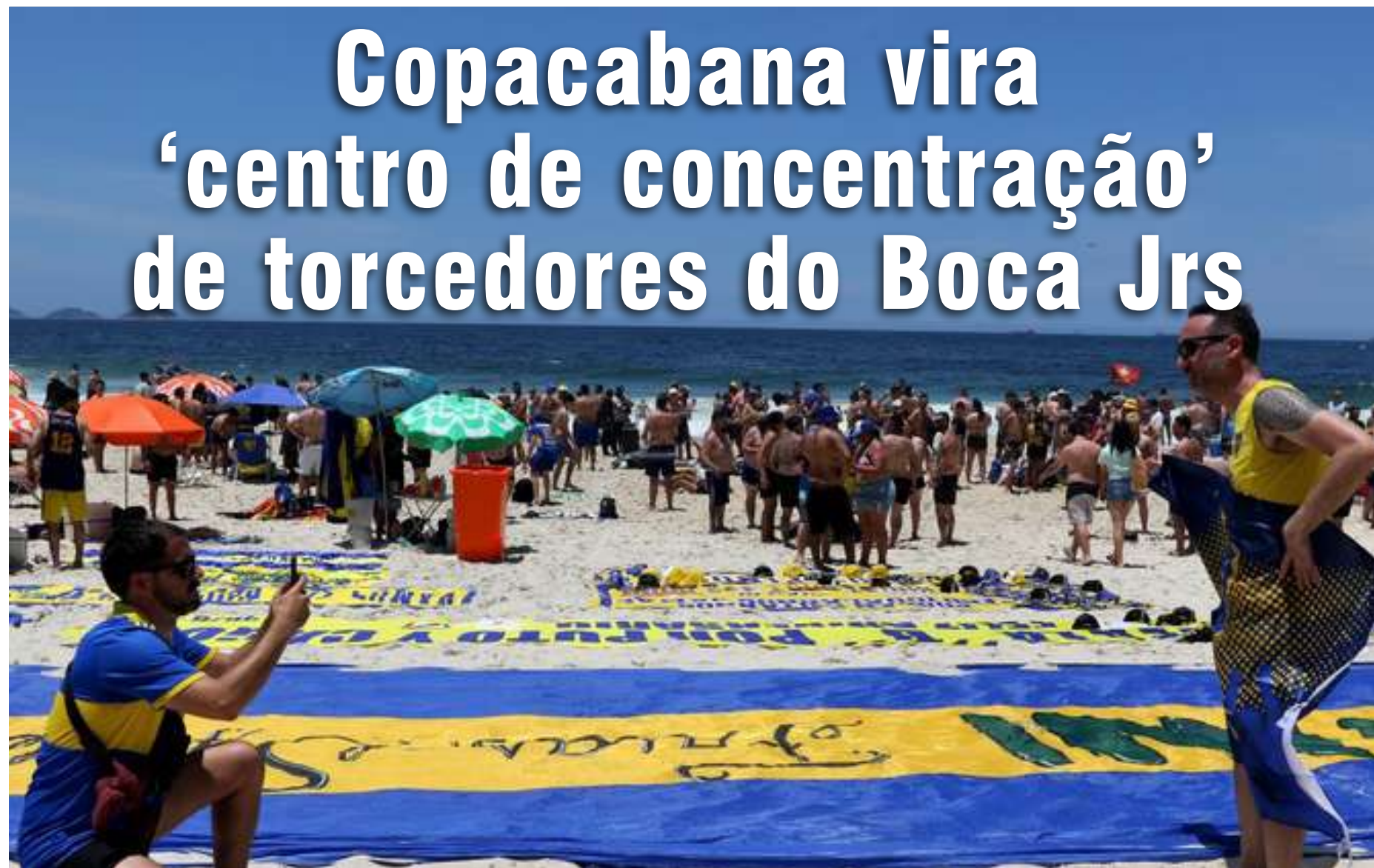
Momentos descontraídos acontecem na praia de Copacabana com torcedores do Boca Juniors

A temperatura elevada, com sol forte e céu limpo, reforçam a alegria de torcedores que, a todo momento, cantam músicas e o hino de seu clube de coração. O entusiasmo da torcida se espalhou por uma área