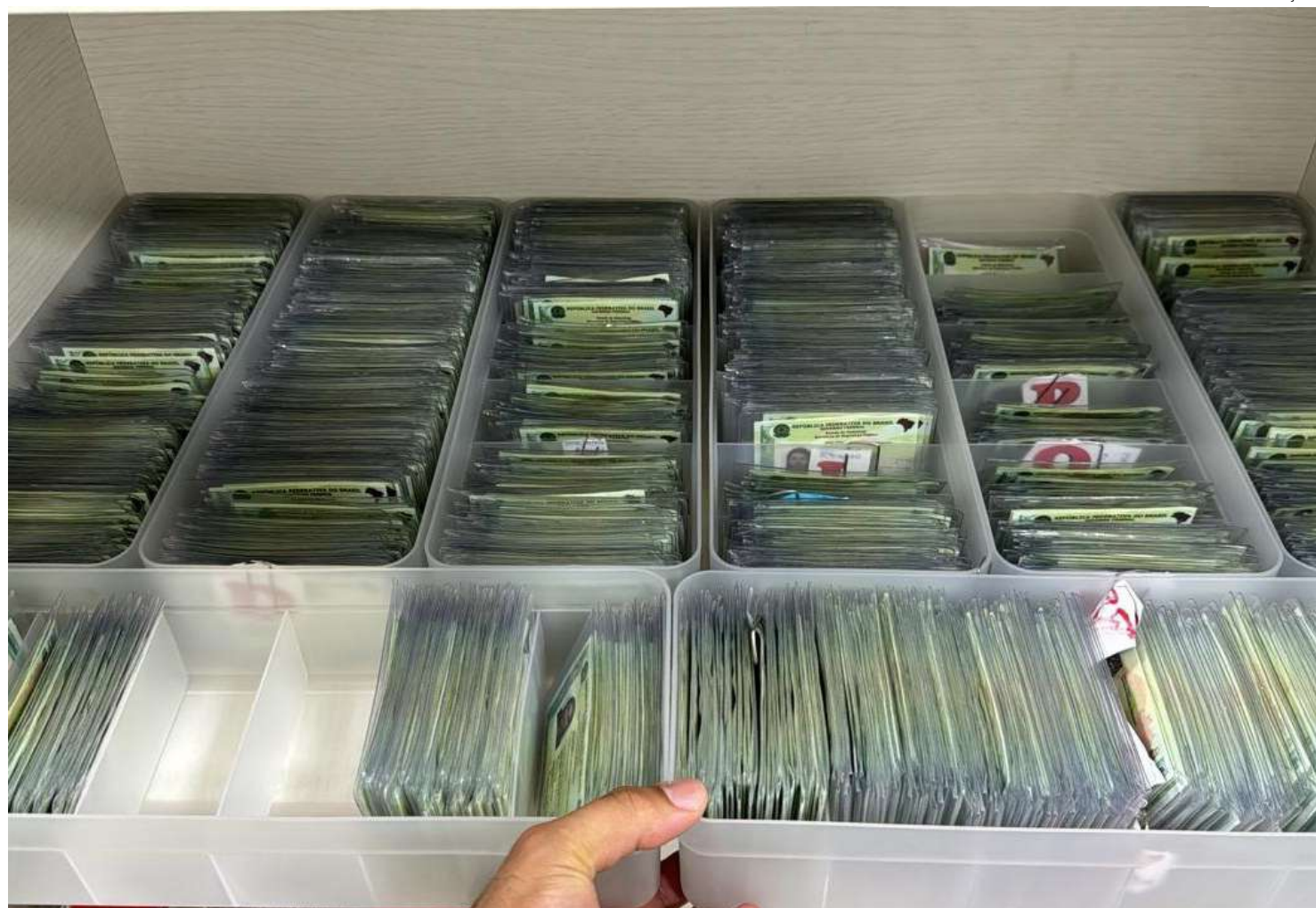
População precisa ficar atenta quanto aos agendamentos, que acontecerão de forma presencial

Após realizar o agendamento presencial em um dos três locais, o cidadão vai receber um protocolo de atendimento, vinculado ao CPF, indicando dia, horário e em qual dos PACs da capital deverá comparecer ao longo