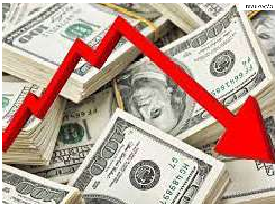
Mercado teve dia de euforia após dados fracos nos EUA

A divulgação de dados fracos da economia dos Estados Unidos fez o mercado financeiro ter um dia de euforia. O dólar fechou abaixo de R$ 4,90 pela primeira vez em mais de 40 dias. A bolsa de valores teve a maior alta diária em 6 meses.