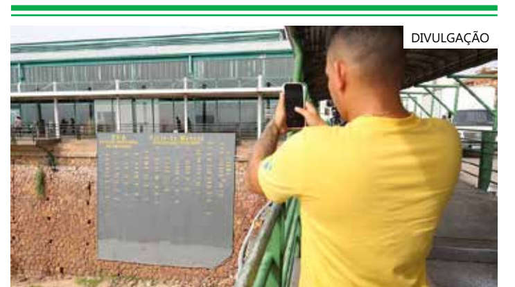
A pior seca da história atingiu a cota de 12,70 metros

As calhas são subdivisões das bacias hidrográficas compostas por um rio principal e seus afluentes. A bacia hidrográfica do Amazonas forma o maior sistema fluvial do planeta.