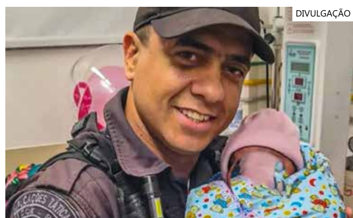
Policiais militares do 30º Batalhão do Rio de Janeiro salvaram uma bebê recém-nascida abandonada dentro de uma lixeira

uma criança recém-nascida, trazida pela ambulância do Corpo de Bombeiros e Polícia Militar, com relato de ter sido encontrada em lixeira, dentro de um saco plástico, no bairro de Araras. Cabe informar que, no momento, a criança encontra-se internada, estável e segue aos cuidados da equipe multiprofissional. O Conselho Tutelar está acompanhando o caso", informou ao jornal.