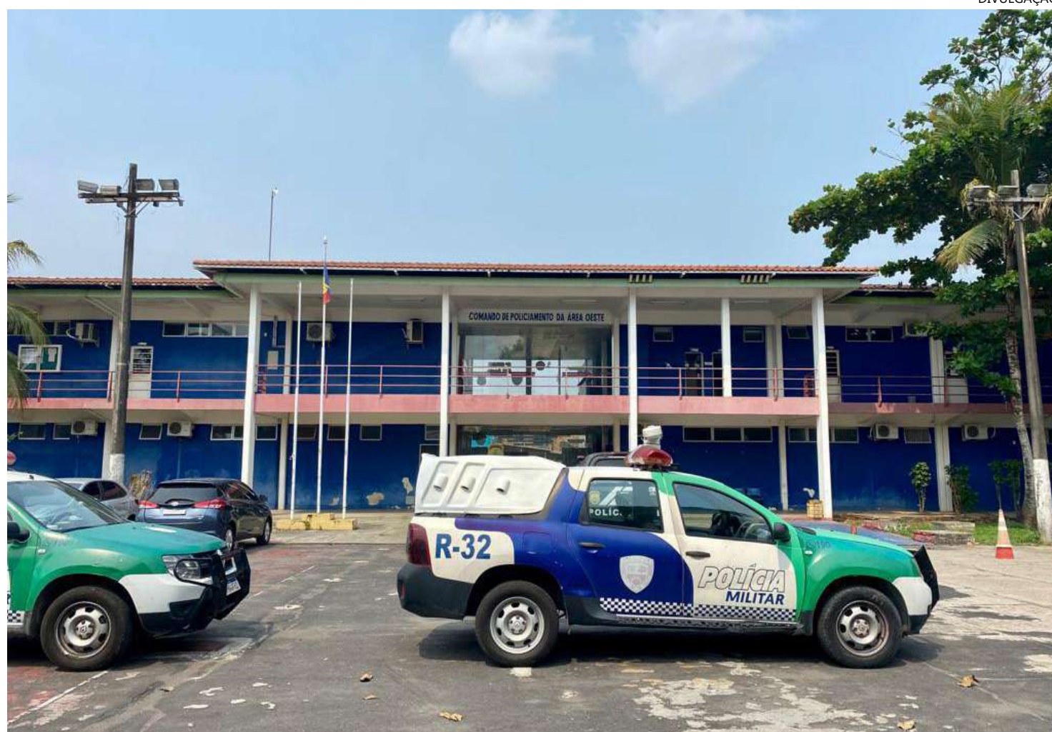
Equipes de saúde da Semsa vão atender os policiais militares nos Batalhões de Área

O primeiro a receber equipes de saúde distritais é o Batalhão Norte, na próxima quinta-feira (9), na sede do batalhão, localizada no bairro Cidade Nova. No dia 16 de novembro a ação será no Batalhão Oeste, no bairro