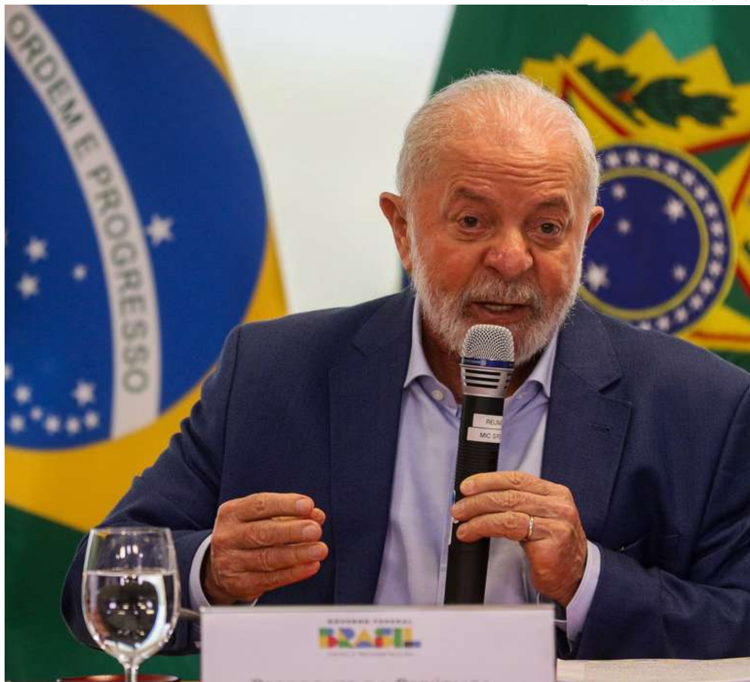
Lula convocou seus ministros para discutir metas na última sexta-feira (3)

A reunião conta com a participação do vice-Presidente da República, Geraldo Alckmin (MDIC); do ministro da Casa Civil, Rui Costa;