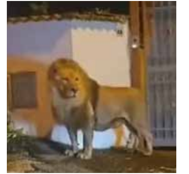
Os moradores da cidade foram alertados de que deveriam permanecer em casa