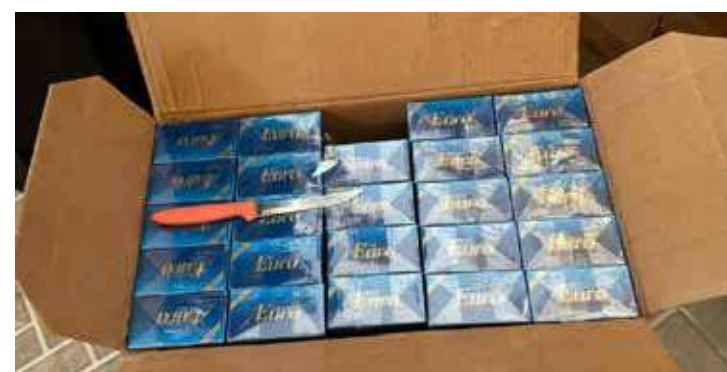
Operação Fragmentados, deflagrada pela Polícia Federal na segunda-feira (13), realizou buscas nas residências dos investigados

Ação tem como alvo um grupo suspeito de fraudar benefícios do estado, acarretando um prejuízo de R$ 4,8 milhões aos cofres públicos