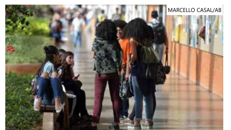
Mudanças foram sancionadas nesta segunda-feira pelo presidente Lula

bém reduziu o valor definido para o teto da renda familiar dos estudantes que buscam cota para ingresso no ensino superior por meio do perfil socioeconômico. Antes, o valor exigido era de um salário mínimo e meio, em média, por pessoa da família. Com a nova legislação, esse valor passa a ser de um salário mínimo, atualmente em R$ 1.320.