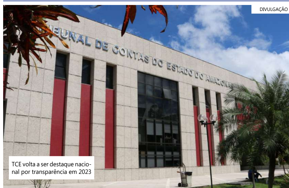
TCE volta a ser destaque nacional por transparência em 2023

Para obtenção do selo de transparência, a unidade gestora precisa atender critérios, que são divididos entre essenciais, obrigatórios e recomendados. O selo diamante é concedido para o órgão que alcançar 100% dos critérios essenciais e 95% do total.