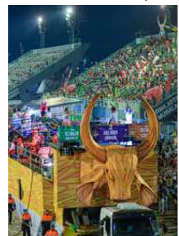
Festa existe desde 1996