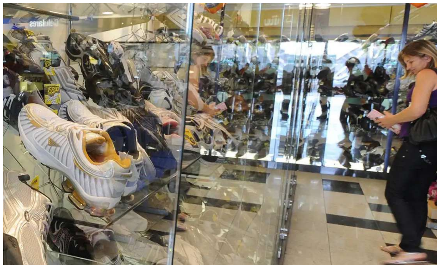
O segmento de vestuário que mais é beneficiado proporcionalmente pelo Natal

O segmento de hiper e supermercados é o que mais deve contratar temporários, abrindo 45,47 mil vagas, seguido por vestuário e calçado, com 25,17 mil; utilidades domésticas e eletroeletrônicos, com 15,98 mil; livrarias