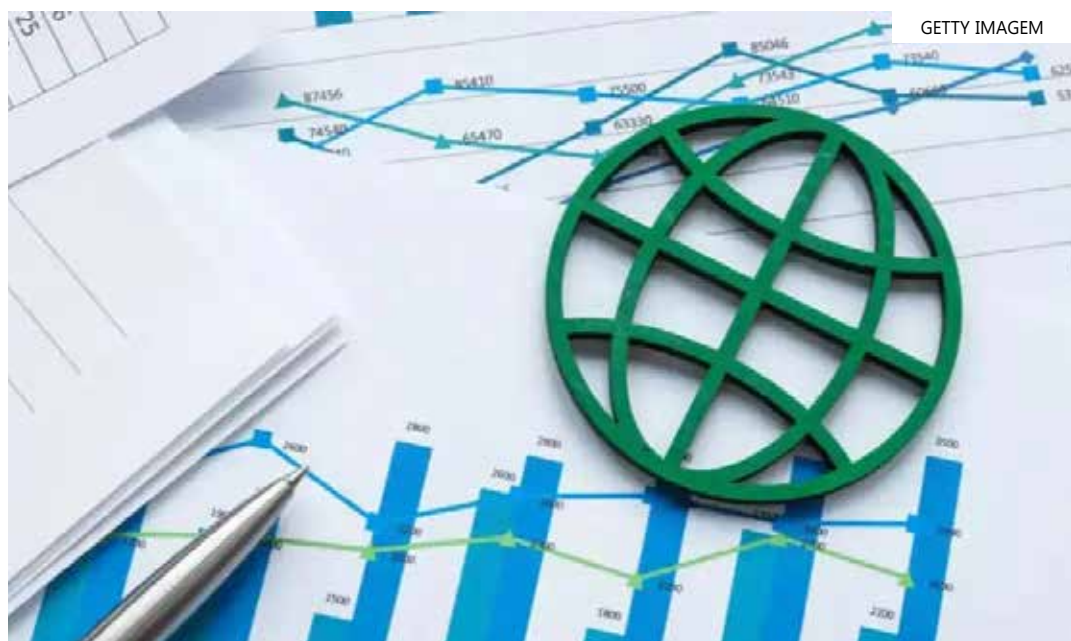
Os títulos emitidos terão duração de sete anos

na maioria dos casos, ao consumidor. Segundo a Abrasel, apenas 33% das empresas decidiram não reajustar os preços dos produtos que oferecem. Entre aqueles que realizaram ajustes no cardápio, 24% optaram por calcular os valores abaixo da inflação dos últimos 12 meses, ante 34% que ajustaram conforme a inflação e 8% que optaram por corrigir os valores acima da média.