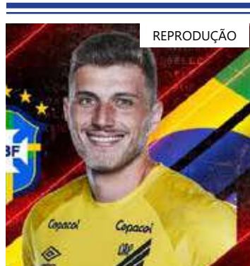
Arqueiro sofreu um trauma no pé esquerdo durante jogo do City

Os primeiros a se apresentar na concentração foram o atacante Vinicius Júnior e Rodrygo (ambos do Real Madrid); Bruno Guimarães (Newcastle); Pepê (Porto); Endrick e Raphael Veiga (Palmeiras); Nino e André (Fluminense); e Lucas Perri (Botafogo).