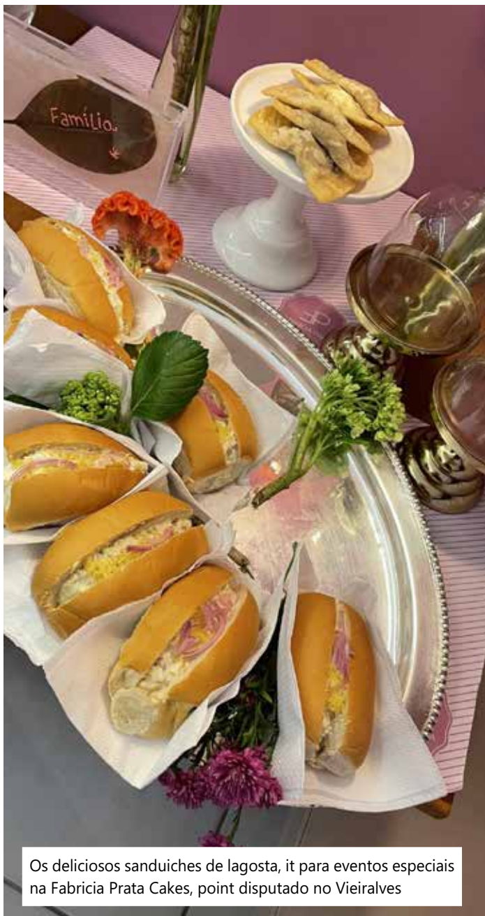
Os deliciosos sanduiches de lagosta, it para eventos especiais na Fabricia Prata Cakes, point disputado no Vieiralves

. Dessa disputa, quatro escolas do ensino fundamental 1 (1º ao 5º ano), da Secretaria Municipal de Educação (Semed), serão classificadas para apresentação na Expocreati, que acontece de 22 a 24 de novembro. O evento, organizado pela DDPM e Gerência de Tecnologias Educacionais (GTE), tem o objetivo de proporcionar aos estudantes, que participam do projeto do Clube de Linguagem e Programação e Robótica (Procurumim), oportunidade de treino para a competição.