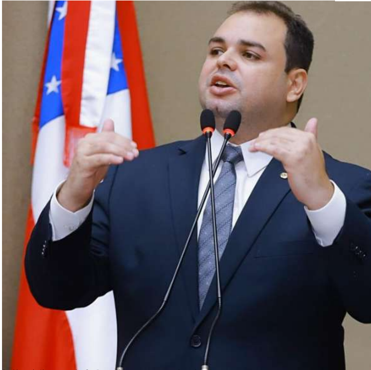
Presidente da Aleam comandou Sessão com destaque para as emendas parlamentares

"Anualmente estamos direcionando recursos financeiros à Associação do bairro do Itaúna e Itaúna 2, para os projetos Bairro