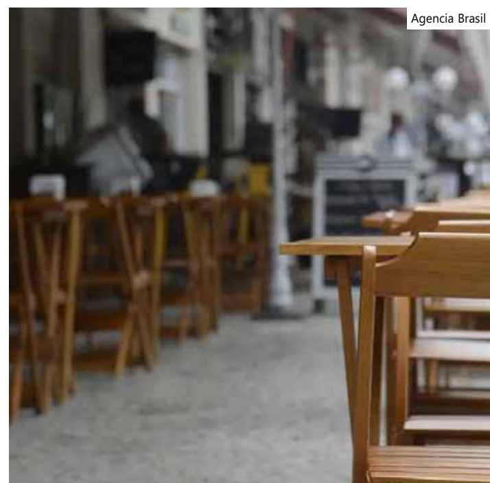
Estabelecimentos com dívidas em atraso somam 40%