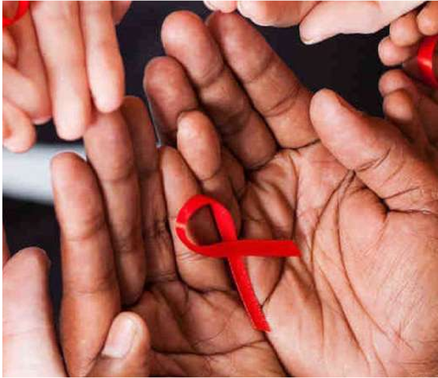
Kefi foi desenvolvida pela startup (empresa de tecnologia e inovação)

Dados mais recentes do Boletim Epidemiológico HIV/AIDS do Ministério da Saúde mostram que, em 2021, foram notificados 40.880 casos de HIV positivo no Brasil, sendo quase a metade (18.013) no grupo etário de 15 a 29 anos de idade. A notícia do diag-