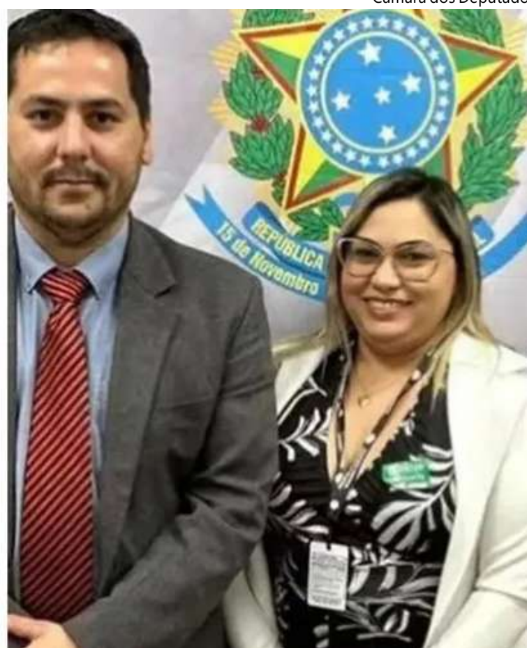
Câmara dos Deputados

quem ela encontrou. Além disso, o MJ não tinha como identificar a quem estava permitindo o acesso? Isso é muito sério, porque começamos a desconfiar do trabalho de inteligência no país", criticou o deputado.