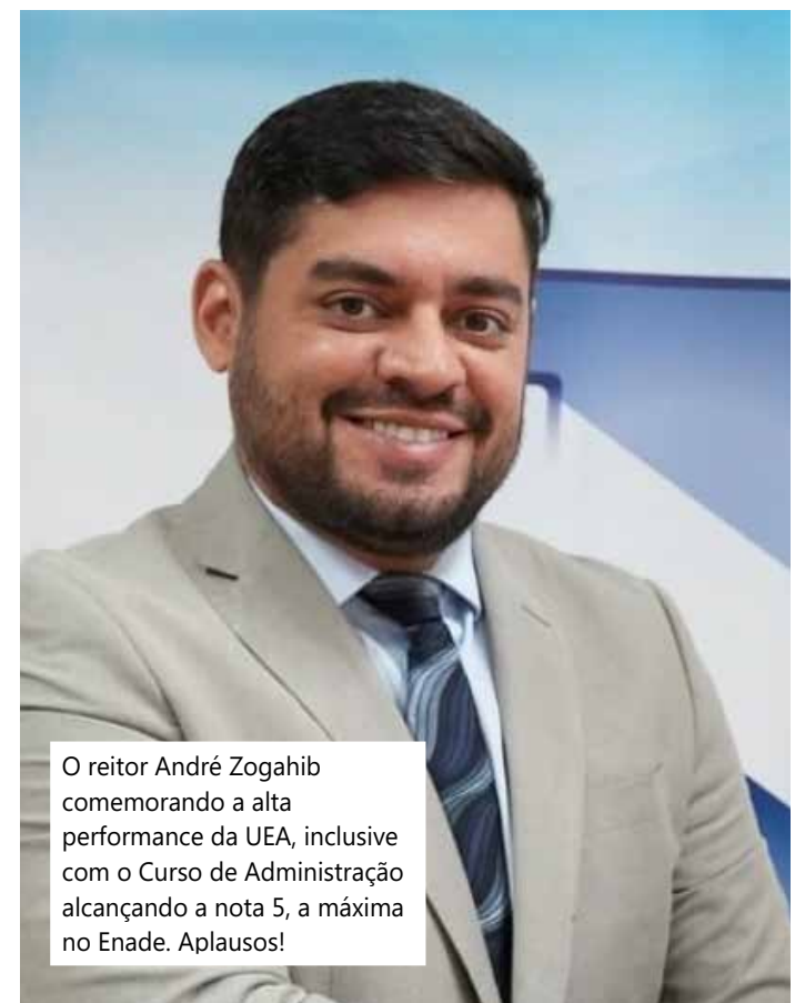
O reitor André Zogahib comemorando a alta performance da UEA, inclusive com o Curso de Administração alcançando a nota 5, a máxima no Enade. Aplausos!

. Solenidade que deverá ser prestigiadíssima por autoridades e nomes da sociedade de Manaus.