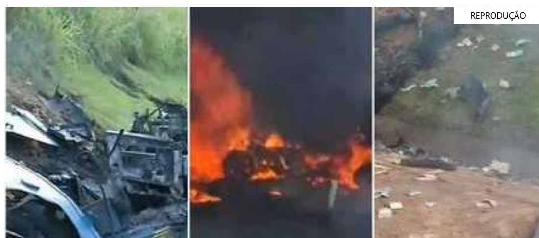
Veículo ficou totalmente destruído

A Polícia Militar ainda não divulgou nenhuma informação sobre feridos. Dois carros utilizados pelos suspeitos já foram encontrados em áreas rurais de Cosmópolis.