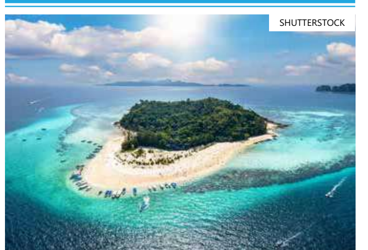
Espaço paradisíaco está próximo à fronteira com o Canadá