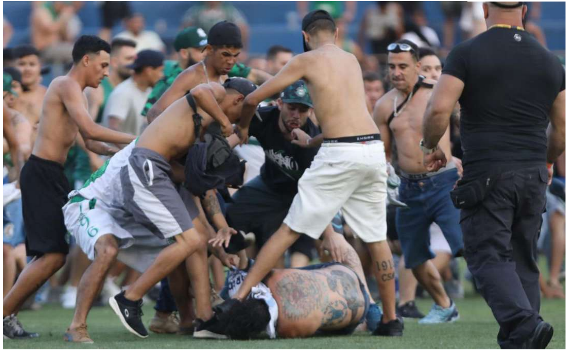
Torcedores de Coritiba e Cruzeiro invadem o campo durante a partida ocorrida no último sábado (11)

Se a liminar for acatada, Coritiba e Cruzeiro tendem a jogar o restante do Campeonato Brasileiro sem torcida, seja na con-