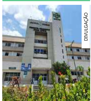
Governo mantém serviços no feriado

O Departamento Estadual de Trânsito (Detran-AM) irá retomar os serviços na quinta-feira (16). As fiscalizações de trânsito permanecem normalmente.