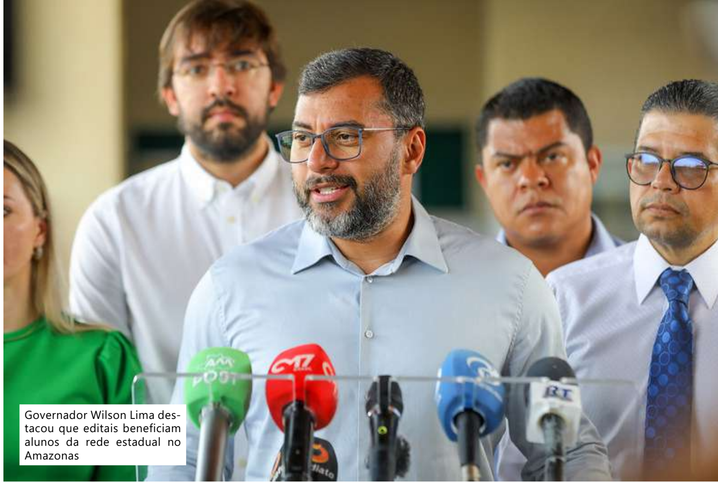
Governador Wilson Lima destacou que editais beneficiam alunos da rede estadual no Amazonas

Ambos os editais podem ser acessados no site da ADS (ou diretamente no link http://www.ads.am.gov.br/acesso-a-informacao ). Para esclarecer dúvidas sobre os editais, a