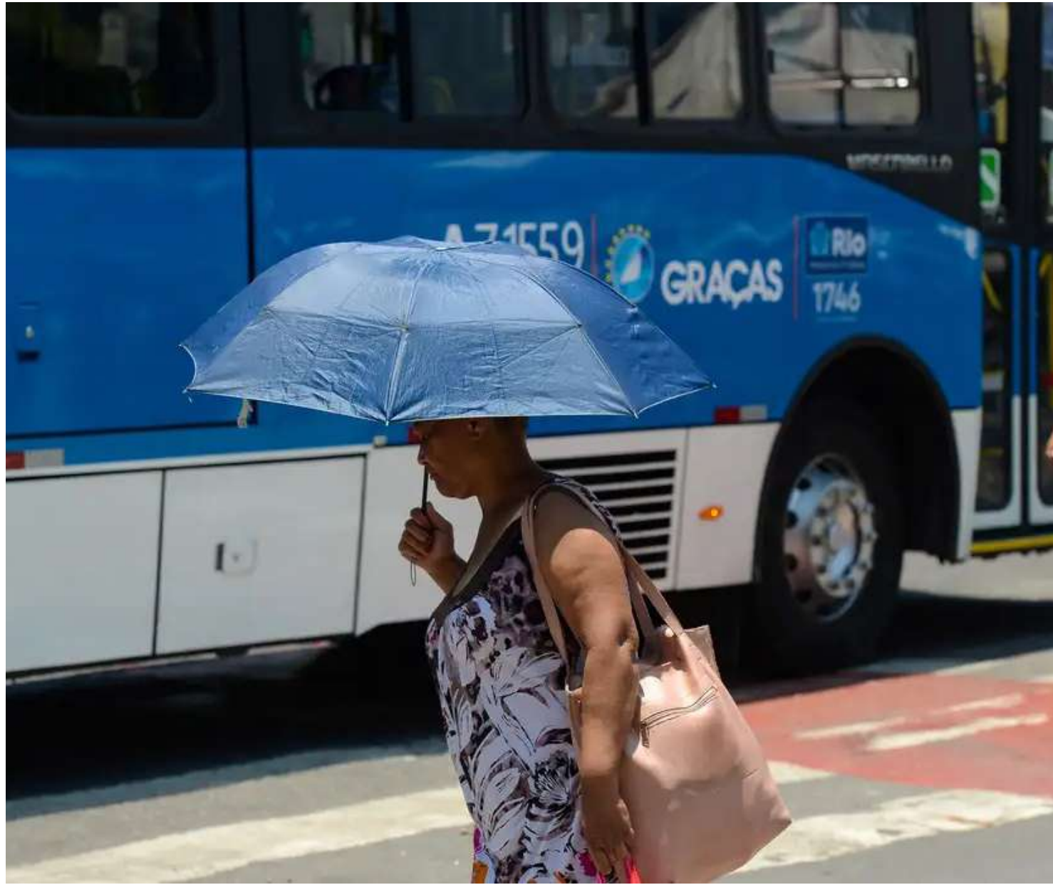
O segundo ponto é prestar atenção em relação à exposição ao Sol

"Se torna mais difícil buscar a hidratação, como aceitar a hidratação quando a gente a oferece", explicou o médico. Há idosos, por exemplo, que se negam