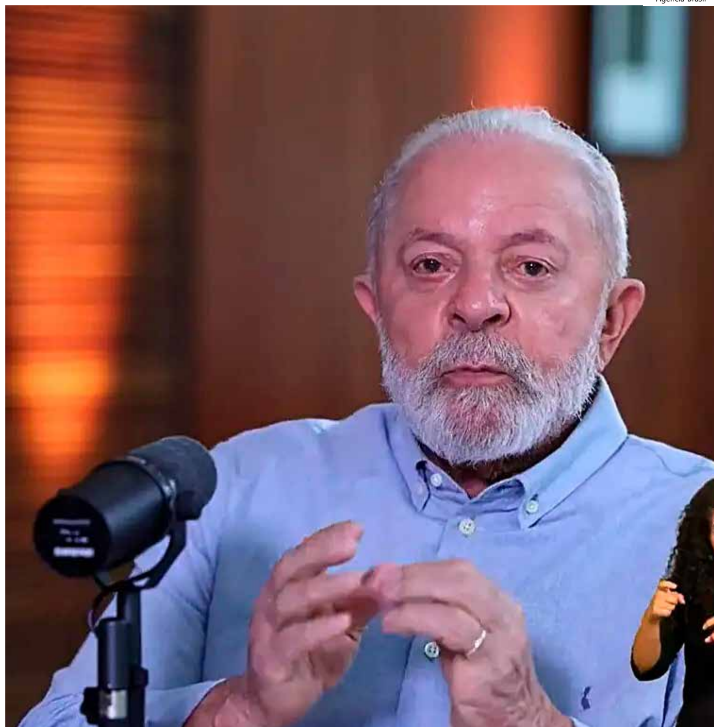
Atualmente, há 6 milhões e 800 mil alunos, de diferentes rendas familiares, cadastrados em escolas públicas de Ensino Médio

"O aluno entra no primeiro ano e vai receber todo mês um auxílio. No final do ano, concluindo o primeiro ano, ele recebe uma bolsa que vai ser depositada numa poupança, um compromisso. Aí, ele entra no segundo ano,