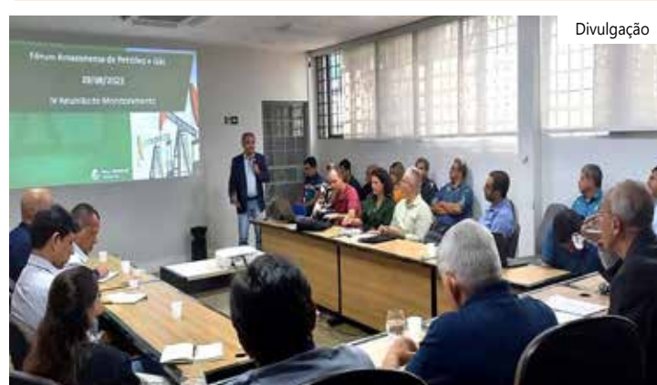
Um dos principais objetivos é ampliar a exploração do gás natural