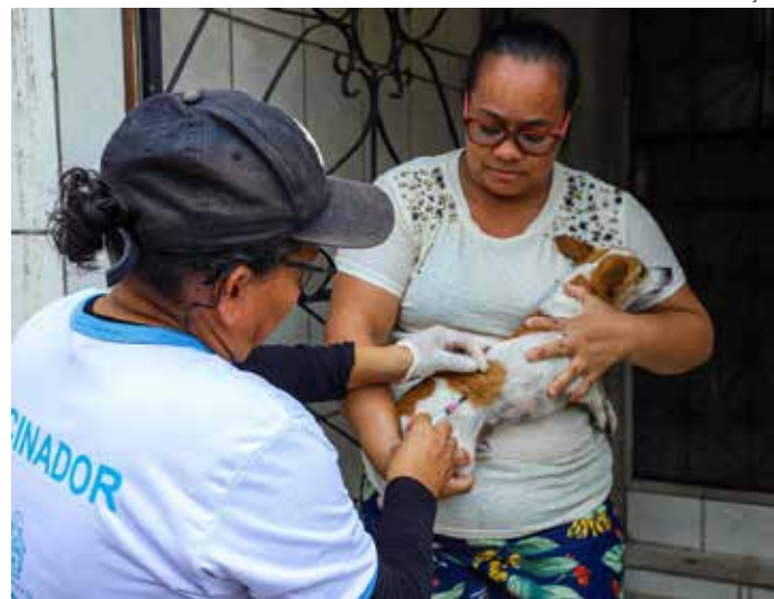
Agentes de saúde seguem com planejamento de imunização na capital

Coordenada pela Secretaria Municipal de Saúde (Semsa) e executada pelo Centro de Controle de Zoonoses (CCZ) Dr. Carlos Durand, a campanha também oferta o imunizante contra a raiva animal em pontos fixos, que funcionam nos Centros de Convivência da Família São José, na rua Barreirinha, nº 14, quadra 45, no bairro São José; no