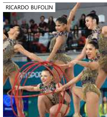
Governo Federal apoia o pleito