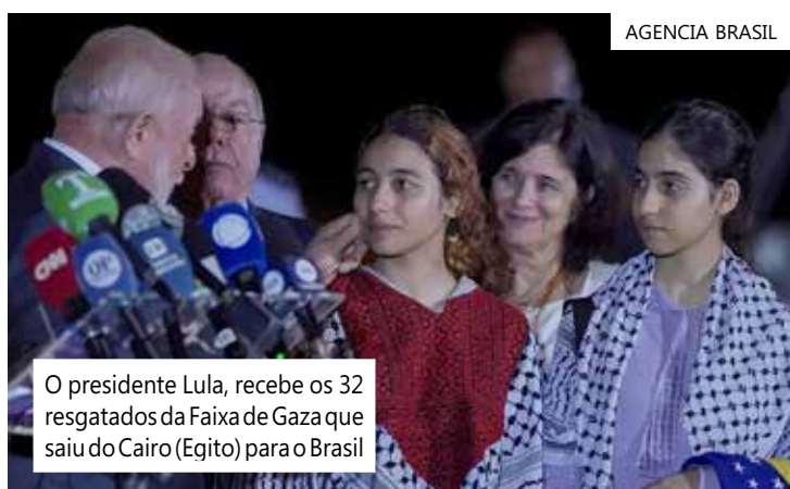
O presidente Lula, recebe os 32 resgatados da Faixa de Gaza que saiu do Cairo (Egito) para o Brasil

Por fim, quase um século depois, a casa ainda preserva muito de sua aparência original. Além disso, a beleza natural da área impressiona: há mais de 2 hectares de florestas, com trilhas para caminhada à margem do Big Lake, onde a ilha está situada.