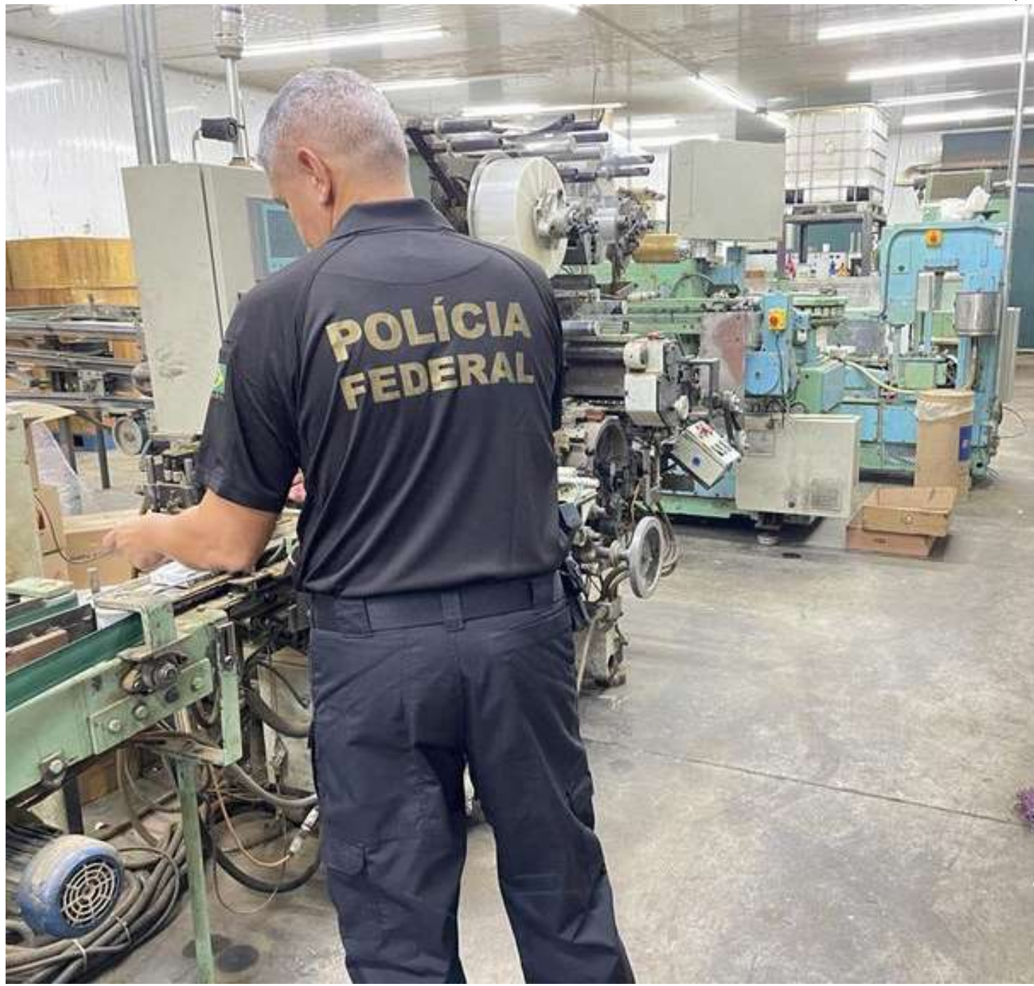
Operação combate organização criminosa nos estados do AM, PA, BA, MG e SP

Os presos responderão por um ou mais dos seguintes crimes: organização criminosa (pena de oito anos), contrabando de cigarros (cinco anos), descaminho de maquinário (quatro anos), tráfico