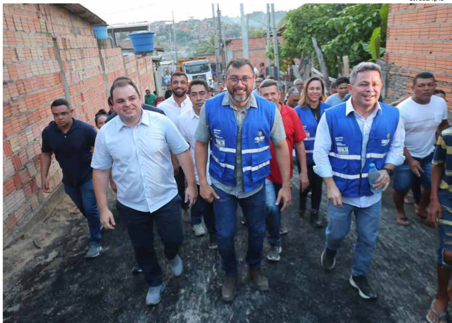
Chefe do Executivo estadual afirma que a urbanização dessas áreas significa levar dignidade e respeito aos moradores

Na ocasião, o governador também pontuou que o Governo do Amazonas já aplicou mais de R$ 2 bilhões em investimentos