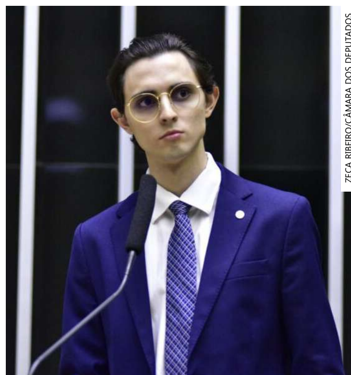
Deputado questiona envolvimento do ministério com lideranças de facções.